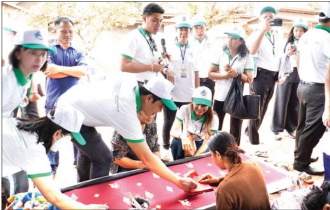
လာအိုနိုင်ငံ Xaythany ခရိုင် Don Iye ကျေးရွာ ချည်ထည်ပန်းထိုးလုပ်ငန်းသို့ သွားရောက်လေ့လာစဉ်။

စီမံကိန်းအကောင်အထည်ဖော်ဆောင်ရွက်မှု ကျေးလက်ဒေသ အခြေခံအိမ်ထောင်စုများ၏ အသက်မွေးဝမ်းကျောင်းမြှင့်တင်ရေး စီမံကိန်း (SEP)အား မြန်မာနိုင်ငံတွင် လက်တွေ့အကောင်