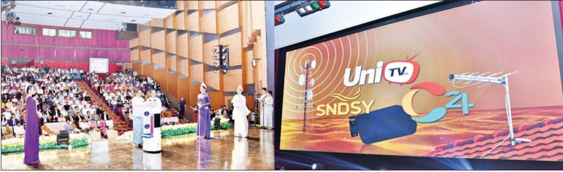
နိုင်ငံတော်ဝန်ကြီးချုပ် ဦးညိုစော MRTV DVB-T2 နှင့် MRTV DTH စနစ်တို့တွင် ပုဂ္ဂလိကရုပ်သံလိုင်း Channel အသစ် သုံးခုဖြစ်သည့် Uni TV HD Channel ၊ SNSDY Entertainment HD Channel နှင့် Channel 24 တို့ စတင်တိုးချဲ့ထုတ်လွှင့်မှုနှင့် ပုဂ္ဂလိက DTH ရုပ်သံဝန်ဆောင်မှုလုပ်ငန်းအသစ်ဖြစ်သည့် Softtech - DTH စနစ် စတင်ထုတ်လွှင့်မှုတို့အား စက်ခလုတ်နှိပ်၍ ဖွင့်လှစ်ပေးစဉ်။

နေပြည်တော် ဖေဖော်ဝါရီ ၁၅ မြန်မာ့အသံနှင့်ရုပ်မြင်သံကြား၏ နှစ်(၈၀) ပြည့် အထိမ်းအမှတ် အခမ်းအနားကို ယနေ့နံနက်ပိုင်းတွင် နေပြည်တော် တပ်ကုန်းမြို့ရှိ မြန်မာ့အသံနှင့် ရုပ်မြင်သံကြားရုံးချုပ်၌ ကျင်းပပြုလုပ်ရာ နိုင်ငံတော်ဝန်ကြီးချုပ် ဦးညိုစောနှင့် ဇနီးတက်ရောက်သည်။