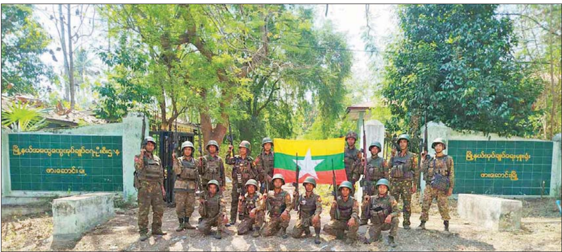
တပ်မတော်စစ်ကြောင်းများက အကြမ်းဖက်သောင်းကျန်းသူများ ယာယီစိုးမိုးထားသည့် ဖားဆောင်းမြို့အား ပြန်လည်တိုက်ခိုက်သိမ်းပိုက်ထားရှိမှုကို တွေ့ရစဉ်။

နေပြည်တော် ဖေဖော်ဝါရီ ၁၅ တပ်မတော်အနေဖြင့် နိုင်ငံတော်တည်ငြိမ်အေးချမ်းပြီး ဖွံ့ဖြိုးတိုးတက်စေရန်အတွက် အကြမ်းဖက်သောင်းကျန်းသူများ ယာယီစိုးမိုးထားပြီး အကြမ်းဖက်လုပ်ရပ်များ လုပ်ဆောင်လျက်ရှိသည့် ဒေသများ၌ အကြမ်းဖက်ချေမှုန်းမှုစစ်ဆင်ရေးများကို ဒေသခံပြည်သူများ၏ ပူးပေါင်းပါဝင်မှုနှင့် အတူ ကြိုးပမ်းဆောင်ရွက်ပြီး ပြန်လည်ထိန်းချုပ်လျက်ရှိရာ KNPP၊ KNDF အဖွဲ့များနှင့် PDF အမည်ခံ အကြမ်းဖက်သမားများ ယာယီစိုးမိုးထားသည့် ကယားပြည်နယ် ဖားဆောင်းမြို့ကိုလည်း ယနေ့ ဖေဖော်ဝါရီ ၁၅ ရက်တွင် တပ်မတော်က အပြည့်အဝပြန်လည်ထိန်းချုပ်ပြီး လိုအပ်သည့် နယ်မြေလုံခြုံရေးနှင့် နယ်မြေရှင်းလင်းရေးလုပ်ငန်းများ ဆက်လက်ဆောင်ရွက်လျက်ရှိကြောင်း သိရှိရသည်။