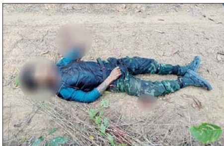
အကြမ်းဖက်သောင်းကျန်းသူများ၏ ရုပ်အလောင်းမှတ်တမ်းဓာတ်ပုံ။

စာမျက်နှာ ၁၈ မှ ဆေးခန်းများနှင့် လူနေအိမ်များအား အကာအကွယ်ပေးရန် တာဝန်ပေးထားသည့် ပစ်ခတ်တိုက်ခိုက်ခြင်း၊ ဒေသပြည်သူများ၊ နေအိမ်များနှင့် ဈေးဆိုင်ခန်းများအား ဖောက်ထွင်း၍ တန်ဖိုးကြီးပစ္စည်းများ၊ စားသောက်ကုန်နှင့် အသုံးအဆောင်ပစ္စည်းများကို အဓမ္မယူဆောင်ခြင်းများ၊ လူနေ/အိမ်အဆောက်အအုံများအကြား နှင့် အများပြည်သူ သွားလာအသုံးပြုသည့် ဆက်သွယ်ရေးလမ်းကြောင်းများပေါ်၌ မိုင်းထောင်ခြင်း၊ ဒေသပြည်သူများကို လူသားတိုင်းအဖြစ် အကာအကွယ်ရယူ၍ ပစ်ခတ်တိုက်ခိုက်ခြင်း၊ မီးရှို့ဖျက်ဆီးခြင်းများ လုပ်ဆောင်ခဲ့သဖြင့် လုံခြုံရေးတပ်ဖွဲ့ဝင်များက အကြမ်းဖက်သောင်းကျန်းသူများ ဖျက်ဆီးခဲ့သည့် အဆောက်အအုံများနှင့် လူနေအိမ်များကို ဒေသပြည်သူများနှင့် ပူးပေါင်း၍ အမြန်ဆုံး ပြန်လည်ပြုပြင်ခြင်း လုပ်ငန်းများ ဆောင်ရွက်ပေးသွားမည်ဖြစ်ကြောင်း သိရှိရပြီး တပ်မတော်စစ်ကြောင်းများ ယခုကဲ့သို့ တပ်မတော်စစ်ကြောင်းများက ဖားဆောင်းမြို့အား ပြန်လည်သိမ်းပိုက် ထိန်းချုပ်နိုင်ခဲ့သည့် အတွက် လှိုင်ကော် - ဒီးမော့ဆို - ဖရူဆို - တောလဲခဲ - ဖားဆောင်း ဆက်သွယ်ရေးလမ်းမကြီးအား မကြာမီအချိန်တွင် ပြန်လည်ဖွင့်လှစ်နိုင်