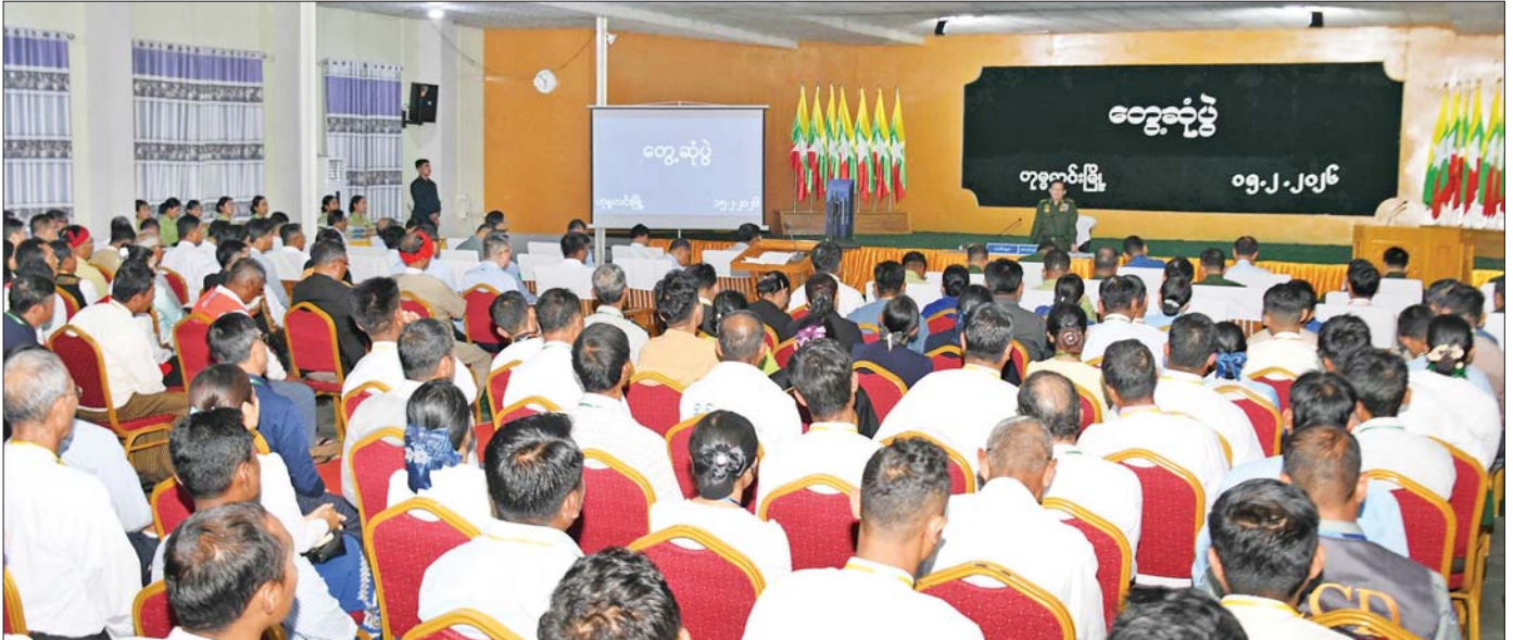
ပြည်ထောင်စုသမ္မတမြန်မာနိုင်ငံတော် ယာယီသမ္မတ နိုင်ငံတော်လုံခြုံရေးနှင့် အေးချမ်းသာယာရေးကော်မရှင်ဥက္ကဋ္ဌ ဗိုလ်ချုပ်မှူးကြီး မင်းအောင်လှိုင် စစ်ကိုင်းတိုင်းဒေသကြီး ဟုမ္မလင်းမြို့ရှိ ဌာနဆိုင်ရာ တာဝန်ရှိသူများနှင့် မြို့မိမြို့ဖများအား ဒေသဖွံ့ဖြိုးတိုးတက်ရေးဆိုင်ရာများ ဆွေးနွေးပြောကြားစဉ်။