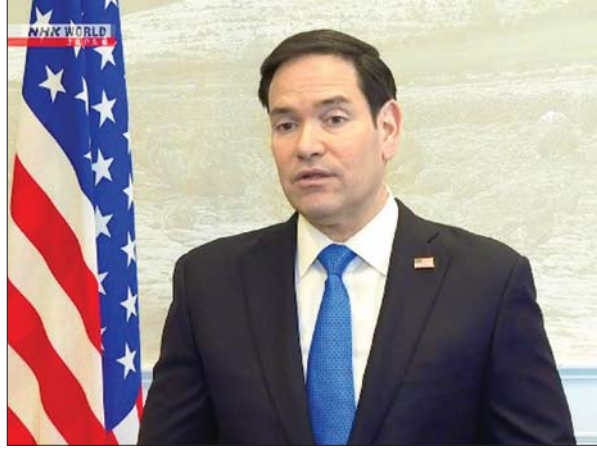
အမေရိကန်နိုင်ငံခြားရေးဝန်ကြီး မာကိုရူဘီယို။

နယူးယောက် ဖေဖော်ဝါရီ ၁၅ အမေရိကန်နှင့် ဥရောပသည် အတူတကွ ရှိကြသည်ဟု အလေးပေးပြောကြားခဲ့ပြီး မဟာမိတ်များအနေဖြင့် ၎င်းတို့၏ ကိုယ်ပိုင် ကာကွယ်ရေးစွမ်းရည်ကို မြှင့်တင်ရန် လိုအပ်သည်ဟု အမေရိကန်နိုင်ငံခြားရေး ဝန်ကြီး မာကိုရူဘီယို က ပြောကြားသည်။ ဖေဖော်ဝါရီ ၁၄ ရက်တွင် ပြုလုပ်သည့် မြူးနစ် လုံခြုံရေးညီလာခံ ဒုတိယနေ့တွင် အမေရိကန်နိုင်ငံခြားရေးဝန်ကြီးက အထက်ပါ အတိုင်း ပြောကြားခဲ့သည်။ မြူးနစ်လုံခြုံရေး ညီလာခံကို ကမ္ဘာ့ဆောင်းဆောင်များနှင့် အစိုးရအဖွဲ့ဝင်များ တက်ရောက်ခဲ့ကြသည်။ အမေရိကန်နှင့် ဥရောပတို့ကြား မကြာ သေးမီက သဘောထားကွဲလွဲမှုများ ဖြစ်ပေါ် လာစဉ်ယခုကဲ့သို့ မှတ်ချက်ပြုပြောကြားခြင်း ဖြစ်သည်။ ဥရောပနိုင်ငံများကို ရည်ညွှန်း ပြောကြားရာတွင် ၎င်းတို့၏ အနာဂတ်နှင့် အမေရိကန်၏ အနာဂတ်ကို အလေးအနက် ထား ဂရုစိုက်ကြောင်း အမေရိကန်နိုင်ငံခြား ရေးဝန်ကြီးက ပြောကြားသည်။ ကျွန်ုပ်တို့၏ မဟာမိတ်များ အားနည်း နေခြင်းကို မလိုလားသကဲ့သို့ မဟာမိတ်များ