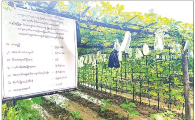
ဓနမြို့မြို့နယ် ရိုးကြီးကျေးရွာ စိုက်ပျိုးရေးလုပ်ငန်း။

ကမ္ဘောဒီးယားနိုင်ငံသို့ စီမံကိန်းတိုးတက်မှု အလုပ်ရုံဆွေးနွေးပွဲနှင့် လေ့လာရေးခရီးစဉ် သွားရောက်ခဲ့မှု ထိုင်းနိုင်ငံ လူထုဖွံ့ဖြိုးရေးဌာနက မဲခေါင်-လန်ချန်း ပူးပေါင်းဆောင်ရွက်မှု ထောက်ပံ့ရန်ပုံငွေဖြင့် မဲခေါင်-လန်ချန်းနိုင်ငံများအကြား အကောင်အထည်ဖော်ဆောင်ရွက်လျက်ရှိသော ဆင်းရဲမှုပပျောက်ရေးစီမံကိန်း (SEP)၏ လုပ်ငန်းဆောင်ရွက်မှု အခြေအနေအထားအပေါ် မျှဝေလေ့ယုံပိုင်းဝန်းဆွေးနွေးခြင်းဖြင့် အဖွဲ့ဝင်နိုင်ငံများအကြား ဘက်စုံ၊ ကဏ္ဍစုံ ပူးပေါင်းဆောင်ရွက်မှုများအား ပိုမိုအားကောင်းလာစေရန်နှင့် ကမ္ဘောဒီးယားနိုင်ငံတွင် ဆောင်ရွက်လျက်ရှိသည့် ဆင်းရဲမှုလျှော့ချရေးလုပ်ငန်းများအား လေ့လာနိုင်ရန် ထိုင်းနိုင်ငံမှ ဦးဆောင်၍ စီမံကိန်းတိုးတက်မှု အလုပ်ရုံဆွေးနွေးပွဲနှင့် လေ့လာရေးခရီးစဉ်အား ဆောင်ရွက်ခဲ့ရာ မြန်မာနိုင်ငံမှ စာရေးသူဦးဆောင်၍ ကိုယ်စားလှယ်အဖွဲ့ လေးဦးသည် ၁၅-၇-၂၀၂၄ ရက်နေ့မှ ၁၉-၇-၂၀၂၄ ရက်နေ့အထိ သွားရောက်ခဲ့ကြပါသည်။ အဆိုပါခရီးစဉ်အတွင်း ကမ္ဘောဒီးယားနိုင်ငံတွင် SEP စီမံကိန်းဆောင်ရွက်လျက်ရှိသည့် Dom ကျေးရွာနှင့် Preal ရွာတွင် အိမ်ထောင်စုများမှ အမှိုက်အမျိုးအစားများတွင် ပုလင်းခွံ၊ ပလတ်စတစ်ဘူးခွံ၊ သတ္တုပစ္စည်းနှင့် မီးဖိုချောင်သုံး စွန့်ပစ်အမှိုက်များဟူ၍ အမှိုက်အမျိုးအစား လေးမျိုးခွဲခြားကာ စနစ်တကျ စွန့်ပစ်ခြင်း၊ ရောင်းချခြင်း၊ စာမူကံနှာ ဘာ သို့