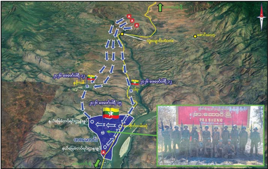
တပ်မတော်စစ်ကြောင်းများက အကြမ်းဖက်သောင်းကျန်းသူများ ယာယီစိုးမိုးထားသည့် ဖားဆောင်းမြို့အား ပြန်လည်ထိန်းချုပ်ရရှိစဉ်။

၂၀၂၅ ခုနှစ် ဩဂုတ် ၁၉ ရက်တွင် ပြန်လည်ထိန်းချုပ်နိုင်ခဲ့သည်။ ဒီမော့ဆိုမြို့မှ ဖရိုဖရဲဆုတ်ခွာထွက်ပြေးသွားသည့် အကြမ်းဖက်သောင်းကျန်းသူများ အနေဖြင့် ဖားဆောင်းမြို့အား ယာယီစိုးမိုးလျက် ဖားဆောင်းမြို့နယ်အတွင်း အဖျက်အမှောင် လုပ်ငန်းများ ဆောင်ရွက်လျက်ရှိပြီး အဆိုပါဒေသတစ်ခုလုံးအား အလုံးစုံထိန်းချုပ်နိုင်ရေးအတွက် အဆုံးအဖြတ်တိုက်ပွဲအဖြစ် နယ်မြေခံတပ်ရင်းဌာနချုပ်များအား ၂၀၂၅ ခုနှစ် ဇွန် ၂၆ ရက်နှင့် ၃၀ ရက်တွင် လည်းကောင်း၊ ဇူလိုင် ၅ ရက်နှင့် ၇ ရက်တွင်လည်းကောင်း၊ စုစုပေါင်း တိုက်ပွဲကြီး လေးကြိမ်ဖြင့် အင်အားအလုံးအရင်းဖြင့် ဝန်းရံပိတ်ဆို့ တိုက်ခိုက်ခဲ့သော်လည်း အရာရှိ စစ်သည် မိသားစုဝင်များ အနေဖြင့် မိမိတပ် ရန်သူလက်သို့ ကျရောက်မှု မရှိစေရေးအတွက် လေ့ရွက်ချင်းကျန် အလုံမလဲသည့် စိတ်ဓာတ်၊ တိုးတိုက်တိုက်ကျားကိုက်ကိုက်စိတ်ဓာတ်တို့ဖြင့် ရွပ်ရွပ်ချွံချွံ ပြန်လည်ခုခံတိုက်ခိုက်မှုကြောင့် အကြမ်းဖက်သောင်းကျန်းသူများ အနေဖြင့် အဆိုပါ တပ်ရင်းဌာနချုပ်အား တိုက်ခိုက်သိမ်းပိုက်နိုင်ခြင်းမရှိဘဲ ထိခိုက်ကျဆုံးမှုများစွာဖြင့် ဆုတ်ခွာထွက်ပြေးခဲ့ရပြီး ဖားဆောင်းမြို့ကိုသာ အဝေးမှလက်နက်ကြီးဖြင့် ဖမ်းခတ်၍ ယာယီစိုးမိုးထားခဲ့ပြီး အဓိကအမာခံအဖွဲ့များက တပ်မတော် စစ်ကူစစ်ကြောင်း အဓိကလာမည့် နေရာများ၌ အဆင့်ဆင့်ပိတ်ဆို့ခြင်း ဆောင်ရွက်ခဲ့သည်။ ဖြစ်စဉ်တွင် တိုက်ပွဲကြီး/ငယ် ရှစ်ကြိမ် ဖြစ်ပွားခဲ့ပြီး အကြမ်းဖက်သောင်းကျန်းသူများ ထံမှ အလောင်း ခြောက်လောင်း၊ လက်နက်မျိုးစုံ ၁၁ လက်တို့ကို သိမ်းဆည်းရမိခဲ့သည်။ တပ်မတော်စစ်ကြောင်းများအနေဖြင့် KNPPI၊ KNDF အဖွဲ့များနှင့် PDF အမည်ခံအကြမ်းဖက်သောင်းကျန်းသူများ ယာယီစိုးမိုးထားသည့် ဖားဆောင်းမြို့နှင့် ၎င်းဒေသတစ်ဝိုက်အား ပြန်လည်