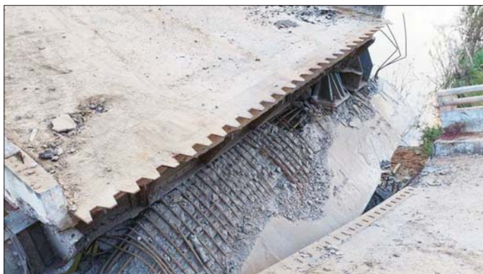
အကြမ်းဖက်သောင်းကျန်းသူများက မိုင်းထောင်ဖောက်ခွဲဖျက်ဆီးခဲ့သည့် ထူးချောင်းတံတား မှတ်တမ်းဓာတ်ပုံ။