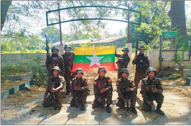
တပ်မတော်စစ်ကြောင်းများက အကြမ်းဖက်သောင်းကျန်းသူများ ယာယီစိုးမိုးထားသည့် ဖားဆောင်းမြို့အား ပြန်လည်တိုက်ခိုက်သိမ်းပိုက်ရရှိစဉ်။

ထိုသို့ ပြန်လည်တိုက်ခိုက်ထိန်းချုပ်ခဲ့ရာ အကြမ်းဖက်သောင်းကျန်းသူများနှင့် တိုက်ပွဲကြီး/ငယ် ၃၁ ကြိမ် ဖြစ်ပွားခဲ့ပြီး ရန်သူထံမှ လက်နက်မျိုးစုံ ၁၇ လက်၊ အကြမ်းဖက်သမား ရုပ်အလောင်းများနှင့် အကြမ်းဖက်လုပ်ငန်းများ လုပ်ဆောင်ရာတွင် အသုံးပြုသည့် ဖောက်ခွဲရေးဆက်စပ်ပစ္စည်းများ သိမ်းဆည်းရရှိခဲ့ပြီး လုံခြုံရေးတပ်ဖွဲ့ဝင် အချို့ နိုင်ငံတော်အတွက် မြင့်မြတ်စွာ အသက်ပေးလှူခဲ့ရပြီး အချို့ ထိခိုက်/ ဒဏ်ရာရရှိခဲ့ကြောင်း သိရသည်။