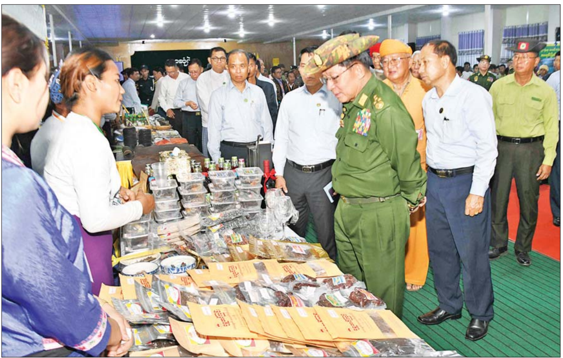
ပြည်ထောင်စုသမ္မတမြန်မာနိုင်ငံတော် ယာယီသမ္မတ နိုင်ငံတော်လုံခြုံရေးနှင့် အေးချမ်းသာယာရေးကော်မရှင်ဥက္ကဋ္ဌ ဗိုလ်ချုပ်မှူးကြီး မင်းအောင်လှိုင် ခင်းကျင်းပြသထားသည့် ဟုမ္မလင်းခရိုင်အတွင်းရှိ အသေးစား၊ အငယ်စားနှင့် အလတ်စားစီးပွားရေး (MSME) လုပ်ငန်းများမှထွက်ရှိသည့် ထုတ်ကုန်ပစ္စည်းများအား လှည့်လည်ကြည့်ရှုစဉ်။

နေပြည်တော် ဖေဖော်ဝါရီ ၁၅ ပြည်ထောင်စုသမ္မတ မြန်မာ နိုင်ငံတော် ယာယီသမ္မတ နိုင်ငံတော် လုံခြုံရေးနှင့် အေးချမ်းသာယာရေး ကော်မရှင်ဥက္ကဋ္ဌ ဗိုလ်ချုပ်မှူးကြီး မင်းအောင်လှိုင်သည် ယနေ့ မွန်းလွဲပိုင်းတွင် စစ်ကိုင်းတိုင်း ဒေသကြီး ဟုမ္မလင်းမြို့ရှိ ဌာန ဆိုင်ရာ တာဝန်ရှိသူများနှင့် မြို့မိ မြို့ဖများအား မြို့တော်ခန်းမ၌ တွေ့ဆုံ၍ ဒေသဖွံ့ဖြိုးတိုးတက် ရေးဆိုင်ရာများအား ဆွေးနွေး ပြောကြားသည်။ အဆိုပါ တွေ့ဆုံပွဲအခမ်းအနား သို့ ကော်မရှင်အတွင်းရေးမှူး ဗိုလ်ချုပ်ကြီး ရဲဝင်းဦး၊ ပြည် ထောင်စုဝန်ကြီးများ၊ စစ်ကိုင်း တိုင်းဒေသကြီး ဝန်ကြီးချုပ် ဦးမြတ်ကျော်၊ ကာကွယ်ရေးဦးစီး ချုပ်ရုံးမှ အဆင့်မြင့်တပ်မတော် အရာရှိကြီးများ၊ အနောက် မြောက်ပိုင်းတိုင်း စစ်ဌာနချုပ် တိုင်းမှူး၊ ဒုတိယဝန်ကြီးများ၊ ဟုမ္မလင်းမြို့ရှိ ခရိုင်၊ မြို့နယ်အဆင့် ဌာနဆိုင်ရာတာဝန်ရှိသူများ၊ မြို့မိ မြို့ဖများ၊ တိုင်းရင်းသားရိုးရာစာပေ နှင့် ယဉ်ကျေးမှုအဖွဲ့များ၊ ဒေသခံ ပြည်သူများ တက်ရောက်ကြသည်။ စာမျက်နှာ ၃ ကော်လံ ၁ ♦