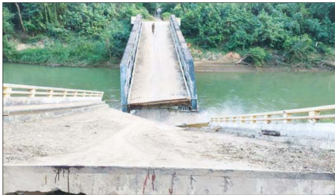
အကြမ်းဖက်သောင်းကျန်းသူများက မိုင်းထောင်ဖောက်ခွဲဖျက်ဆီးခဲ့သည့် ထူးချောင်းတံတား မှတ်တမ်းဓာတ်ပုံ။