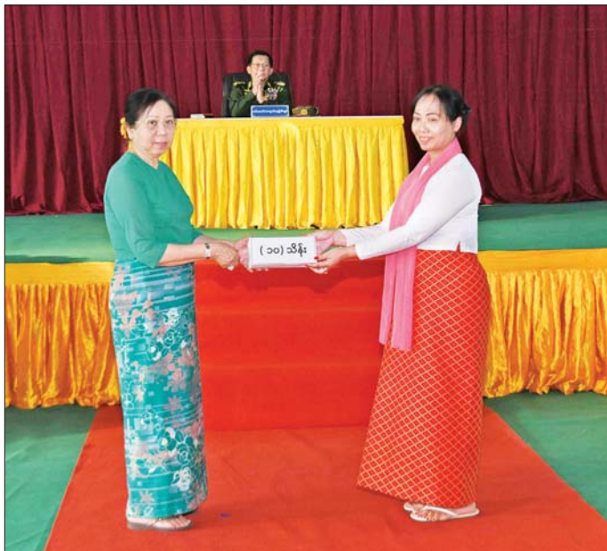
နိုင်ငံတော်လုံခြုံရေးနှင့် အေးချမ်းသာယာရေးကော်မရှင်ဥက္ကဋ္ဌ တပ်မတော်ကာကွယ်ရေးဦးစီးချုပ် ဗိုလ်ချုပ်မှူးကြီး မင်းအောင်လှိုင်၏ ဇနီး ဒေါ်ကြူကြူလှ တပ်နယ် မိခင်နှင့် ကလေးစောင့်ရှောက်ရေးအသင်းအတွက် ချီးမြှင့်ငွေများ ပေးအပ်စဉ်။

စာမျက်နှာ ၅ မှ လုပ်ငန်းများကို ဆောင်ရွက်ကြပြီး အဆိုပါလူဦးရေ၏ ၇၅ ရာခိုင်နှုန်းခန့်သည် ကျေးလက်ဒေသတွင် နေထိုင်ကြကြောင်း၊ ထို့ကြောင့် ကျေးလက်ကို အခြေခံသည့် စီးပွားရေးလုပ်ငန်းများတိုးတက်လာစေရေး မိမိတို့အနေဖြင့် စိုက်ပျိုးမွေးမြူရေးကုန်ထုတ်လုပ်ငန်းများကို အားပေးဆောင်ရွက်လျက်ရှိကြောင်း၊ ထိုသို့ ဆောင်ရွက်ရာတွင်လည်း ပညာတတ်လူသားအရင်းအမြစ်များလိုအပ်ခြင်းကြောင့် တစ်နိုင်လုံး၏ ပညာရေးကဏ္ဍမြှင့်တင်ရေးလုပ်ငန်းများကို ဆောင်ရွက်ပေးလျက်ရှိကြောင်း၊ မိမိတို့အနေဖြင့် စိုက်ပျိုးမွေးမြူရေးကုန်ထုတ်လုပ်ငန်းများကို တစ်နိုင်လုံးတိုးတက်အောင်ဆောင်ရွက်နိုင်ခြင်းဖြင့် နိုင်ငံ၏ GDP တိုးတက်မှုကို များစွာအထောက်အကူပြုစေနိုင်မည်ဖြစ်ကြောင်း၊ ကျေးလက်ဒေသများ ဖွံ့ဖြိုးတိုးတက်ရေးအတွက် စိုက်ပျိုးမွေးမြူရေးလုပ်ငန်းများကို စနစ်တကျဖြင့် ဆောင်ရွက်နိုင်ရန်လိုကြောင်း၊ အားလုံးက အမှန်တကယ်အလုပ်လုပ်ရန်နှင့် အလုပ်လုပ်နိုင်သည့် အခွင့်အလမ်းများကိုလည်း ဖန်တီးပေးရန်လိုကြောင်း၊ စိုက်ပျိုးရေးကုန်ထုတ်လုပ်ငန်းများကို အပြည့်အဝစိုက်ပျိုးထုတ်လုပ်နိုင်မည်ဆိုပါက ပြည်ပပို့ကုန်များ ပိုမိုရရှိလာမည်ဖြစ်ပြီး နိုင်ငံခြားဝင်ငွေများ တိုးတက်ရရှိလာမည်ဖြစ်ကြောင်း၊ ရောင်းကုန်ပစ္စည်းများ