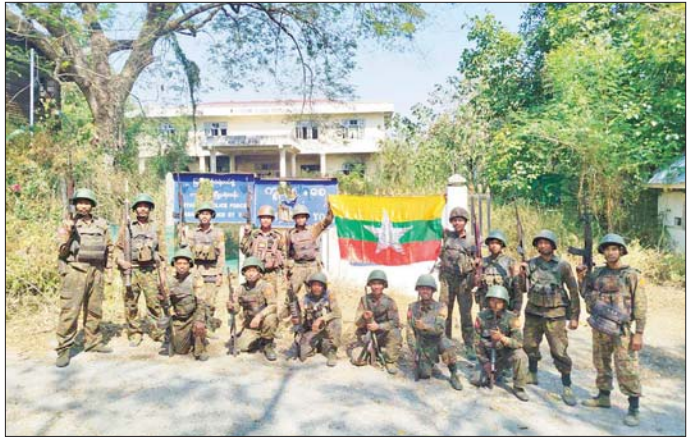
တပ်မတော်စစ်ကြောင်းများက အကြမ်းဖက်သောင်းကျန်းသူများ ယာယီစိုးမိုးထားသည့် ဖားဆောင်းမြို့အား ပြန်လည်တိုက်ခိုက်သိမ်းပိုက်ရရှိစဉ်။

အဆောက်အအုံများ၊ စာသင်ကျောင်းများ၊ ဌာနဆိုင်ရာ အဆောက်အအုံများ၊ ဆေးရုံ/စာမျက်နှာ ၁၉ သို့