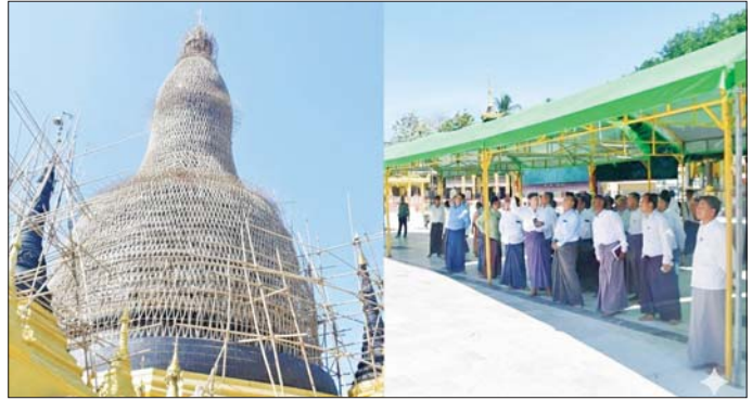
လျှင်ဒါန်းမြို့၌ သာသနိကအဆောက်အအုံများ လိုအပ်သည်များ မှာကြားခဲ့ကြောင်း သိရသည်။ တိုင်းဒေသကြီး(ပြန်/ဆက်)

တွဲဖက်အတွင်းရေးမှူးက စေတီတော်မြတ်ကြီးအတွင်းလိုက်အထိရှိ တည်ဆောက်ထားသော ဆွေးမြည်သံပေါင်များ စစ်ဆေးဆောင်ရွက်ထားရှိမှုနှင့် တာဝန်ရှိသူများ၊ ဂေါပကအဖွဲ့များက ဆောင်ရွက်ရမည့်လုပ်ငန်းရပ်များနှင့် စပ်လျဉ်း၍ ဆွေးနွေးတင်ပြကြရာ တိုင်းဒေသကြီးဝန်ကြီးချုပ်က ပေါင်းစပ်ဖြည့်ဆည်းဆောင်ရွက်ပေးသည်။ ယင်းနောက် ရွှေမော်စောစေတီတော်မြတ်ကြီးရင်ပြင်တော်ပေါ်၌ တပ်မတော် ကြည်း၊ ရေ၊ လေမိသားစုဝင်များ၏ အလှူတော်အဖြစ် နေပူခံကျောက်ပြားခင်းနေမှုနှင့် စေတနာရှင်ပြည်သူများ၏