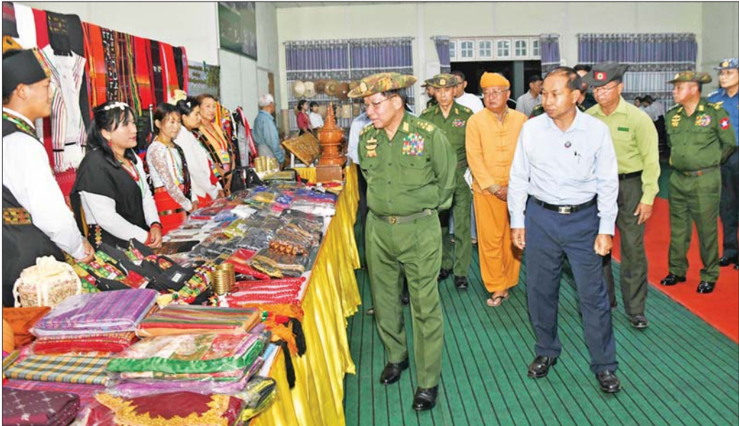
ပြည်ထောင်စုသမ္မတမြန်မာနိုင်ငံတော် ယာယီသမ္မတ နိုင်ငံတော်လုံခြုံရေးနှင့် အေးချမ်းသာယာရေးကော်မရှင်ဥက္ကဋ္ဌ ဗိုလ်ချုပ်မှူးကြီး မင်းအောင်လှိုင် ခင်းကျင်းပြသထားသည့် ဟုမ္မလင်းခရိုင်အတွင်းရှိ အသေးစား၊ အလတ်စားနှင့် အလတ်စားစီးပွားရေး (MSME) လုပ်ငန်းများမှထွက်ရှိသည့် ထုတ်ကုန်ပစ္စည်းများအား လှည့်လည်ကြည့်ရှုစဉ်။

ဒေသအတွင်း စားသောက်ကုန်များနှင့် လူသုံးကုန်များကို လုံလောက်စွာ ထုတ်လုပ်နိုင်မည်ဆိုပါက ဒေသတွင်း ကုန်ဈေးနှုန်းတည်ငြိမ်မှုကို အထောက်အကူပြုနိုင်မည်ဖြစ်သဖြင့် စိုက်ပျိုးမွေးမြူရေးကုန်ထုတ်လုပ်ငန်းများ တိုးတက်အောင် ဆောင်ရွက်သွားကြစေလိုကြောင်း၊ မွေးမြူရေးလုပ်ငန်းများအတွက် လိုအပ်သည့် တိရစ္ဆာန်အစားအစာများကိုလည်း