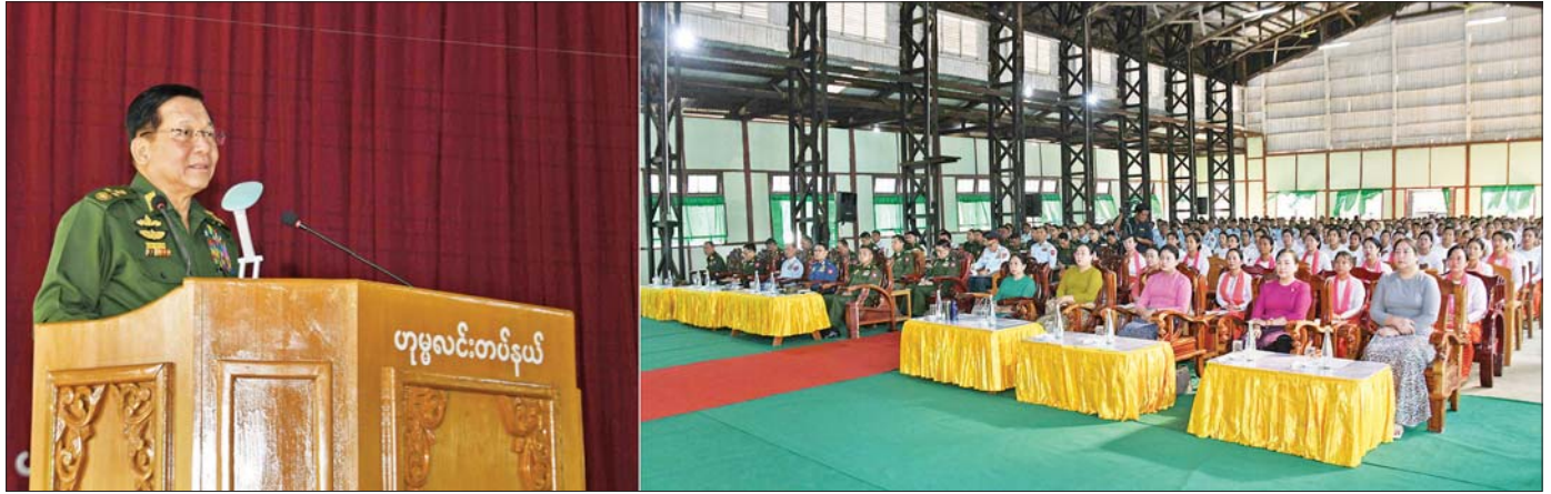
နိုင်ငံတော်လုံခြုံရေးနှင့် အေးချမ်းသာယာရေးကော်မရှင်ဥက္ကဋ္ဌ တပ်မတော်ကာကွယ်ရေးဦးစီးချုပ် ဗိုလ်ချုပ်မှူးကြီး မင်းအောင်လှိုင် ဟုမ္မလင်းတပ်နယ်ရှိ အရာရှိ၊ စစ်သည်၊ မိသားစုများအား တွေ့ဆုံအမှာစကား ပြောကြားစဉ်။