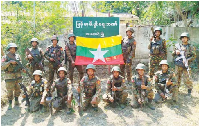
တပ်မတော်စစ်ကြောင်းများက အကြမ်းဖက်သောင်းကျန်းသူများ ယာယီစိုးမိုးထားသည့် ဖားဆောင်းမြို့အား ပြန်လည်တိုက်ခိုက်သိမ်းပိုက်ရရှိစဉ်။