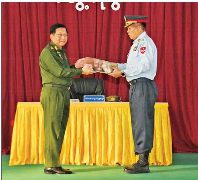
နိုင်ငံတော်လုံခြုံရေးနှင့် အေးချမ်းသာယာရေးကော်မရှင်ဥက္ကဋ္ဌ တပ်မတော်ကာကွယ်ရေးဦးစီးချုပ် ဗိုလ်ချုပ်မှူးကြီး မင်းအောင်လှိုင် တပ်နယ်မှ အရာရှိ စစ်သည် မိသားစုများအတွက် စားသောက်ဖွယ်ရာပစ္စည်းများ ပေးအပ်စဉ်။