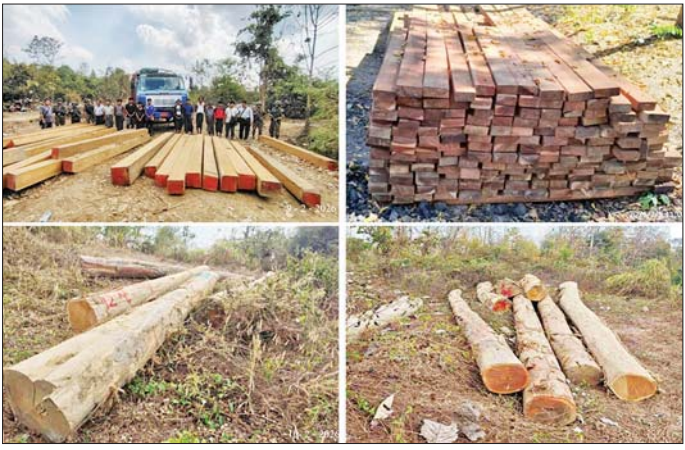
ဧရာဝတီတိုင်းဒေသကြီး၌ ဖမ်းဆီးရမိမှု။

နေပြည်တော် ဖေဖော်ဝါရီ ၁၅ - တရားမဝင်ကုန်သွယ်မှုတိုက်ဖျက်ရေး ဦးဆောင် ကော်မတီ၏ ကြီးကြပ်ကွပ်ကဲမှုဖြင့် တရားမဝင် ကုန်သွယ်မှုများကို ဥပဒေနှင့်အညီ ထိရောက်စွာ တားဆီးအရေးယူနိုင်ရေး ဆောင်ရွက်လျက်ရှိသည်။ သစ်တောဥပဒေအရ ဖမ်းဆီးအရေးယူ ထိုသို့ဆောင်ရွက်လျက်ရှိရာ ပဲခူးတိုင်းဒေသကြီး တရားမဝင်ကုန်သွယ်မှုတိုက်ဖျက်ရေး အထူးအဖွဲ့၏ စီမံခန့်ခွဲမှုဖြင့် တာဝန်ကျပူးပေါင်းအဖွဲ့ များက စစ်ဆေးမှုများဆောင်ရွက်ခဲ့ရာ ဖေဖော်ဝါရီ ၉ ရက် နှင့် ၁၀ ရက်တို့တွင် အုတ်တွင်းမြို့နယ်နှင့် သာယာဝတီမြို့နယ်တို့အတွင်း၌ တရားမဝင်ကျွန်းသစ် ၅၉ ဒဿမ ၆၄၅ တန်၊ အခြားသစ် ၈ ဒဿမ ၇၆၀ တန် စုစုပေါင်း ခန့်မှန်းတန်ဖိုးငွေကျပ် ၇၆၇၀၀၀၉၆ ကို ဖမ်းဆီးရမိခဲ့ပြီး သစ်တောဥပဒေနှင့်အညီ အရေးယူ ဆောင်ရွက်လျက်ရှိသည်။