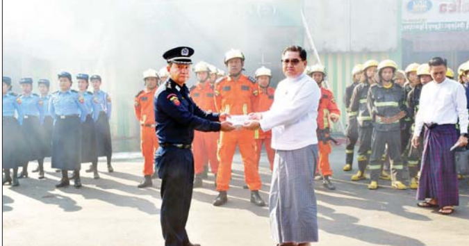
ပညာပေးရေးလုပ်ငန်းများ၊ သတိပြုလိုက်နာရမည့် အချက်များကို ရှင်းလင်းတင်ပြပြီး ပြည်နယ်ဝန်ကြီးချုပ်က မီးသတ်ဦးစီးဌာန တပ်ဖွဲ့ဝင်များ၏ လက်တွေ့စီးငြိမ်းသတ်ခြင်း၊ လက်တွေ့သရုပ်ပြသခြင်းများကို ကြည့်ရှုအားပေးကာ မီးသတ်တပ်ဖွဲ့ဝင်များအတွက် ငွေကျပ် ၁၅ သိန်းနှင့်

မြစ်ကြီးနား ဖေဖော်ဝါရီ ၁၅ မြစ်ကြီးနားမြို့ မြို့မဈေးအတွင်း မီးဘေးလုံခြုံရေးနှင့် ရှာဖွေကယ်ဆယ်ရေး သရုပ်ပြလေ့ကျင့်ခြင်းအခမ်းအနားကို ယနေ့ နံနက်ပိုင်းက စည်ပင်သာယာစွာ (၁) နှင့် (၂) ကြား၌ ကျင်းပရာ ကချင်ပြည်နယ်ဝန်ကြီးချုပ် ဦးခက်ထိန်နန်း၊ ပြည်နယ်ဝန်ကြီးများ၊ ဌာနဆိုင်ရာများ၊ ဈေးကော်မတီအဖွဲ့ဝင်များ၊ ဈေးသူ ဈေးသားများ တက်ရောက်ကြသည်။