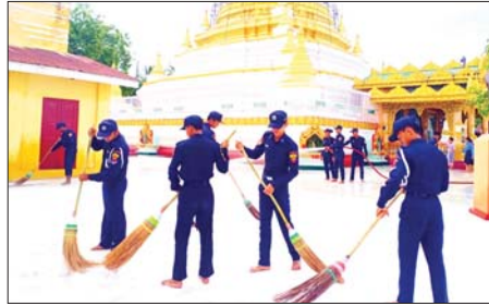
မြန်မာနိုင်ငံမီးသတ်တပ်ဖွဲ့နေ့ဂုဏ်ပြု သန့်ရှင်းရေးဆောင်ရွက်

ဝန်ကြီးချုပ်နှင့် တာဝန်ရှိသူများက ကြည့်ရှုအားပေးစကားပြောကြားသည်။ ထို့နောက် တိုင်းဒေသကြီးဝန်ကြီးချုပ်က အကြမ်းဖက်သမားများ၏ပစ်ခတ်မှုကြောင့် ပြင်းထန်စွာ ထိခိုက်ဒဏ်ရာရရှိသူများ၏ လိုအပ်ချက်များကို သက်ဆိုင်ရာတာဝန်ရှိသူများနှင့် ညှိနှိုင်းဆောင်ရွက်ပေးကာ ချီးမြှင့်ပေးပေးအပ်ခဲ့ကြောင်း သိရသည်။ တိုင်းဒေသကြီး(ပြန်/ဆက်)