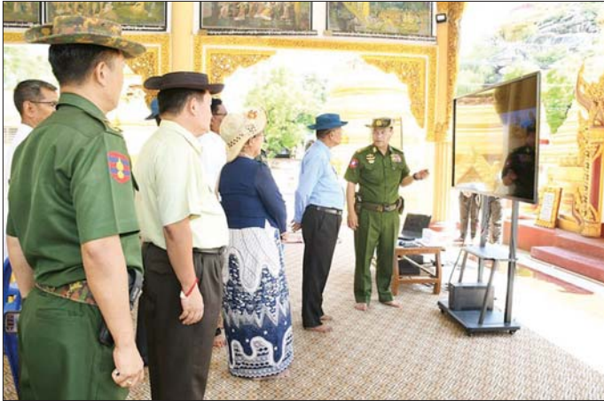
ပြည်ထောင်စုဝန်ကြီး ဦးတင်ဦးလွင်နှင့် ကာကွယ်ရေးဦးစီးချုပ်ရုံး(ကြည်း)မှ ဒုတိယဗိုလ်ချုပ်ကြီး မျိုးသန့်နိုင် တို့ ရွှေမှေ့ဌာဘုရားဓမ္မာရုံ၌ ကျောက်သေတ္တာစေတီနှင့် ပတ်သက်၍ ကျောက်သေတ္တာကြီးအား ဒရုန်းဖြင့် ရိုက်ကူးထားသော Video Clip များ ကြည့်ရှုစစ်ဆေးစဉ်။