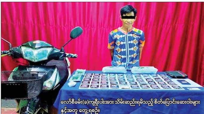
လော်စီခမ်း(ခ)ကျရိုးပါးအား သိမ်းဆည်းရမိသည့် စိတ်ပြောင်းဆေးဝါးများ နှင့်အတူ တွေ့ရစဉ်။

နေပြည်တော် မေ ၃ ရွာငံမြို့နယ်နှင့် အမရပူရမြို့နယ်တို့၌ ငွေကျပ် ၁၀၈ သိန်းတန်ဖိုး ရှိ ဘိန်းစိမ်းများနှင့် တာချီလိတ်မြို့နယ်၌ ငွေကျပ်သိန်း ၈၆၀ တန်ဖိုးရှိ စိတ်ပြောင်းဆေးဝါးများ ဖမ်းဆီးရမိခဲ့ကြောင်း မြန်မာနိုင်ငံ ရဲတပ်ဖွဲ့မှ သိရသည်။