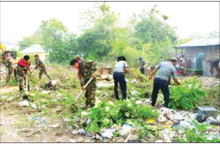
သောအမှိုက်များကို မြို့နယ်စည်ပင်သာယာရေးအဖွဲ့က အမှိုက်သိမ်းယာဉ်ဖြင့် စနစ်တကျစုန့်ပစ်ကြသည်။ ခရိုင်(ပြန်/ဆက်)

ရင်းလင်းသန့်ရှင်းရေးဆောင်ရွက်ရာတွင် ခရိုင်စီမံအုပ်ချုပ်ရေးအဖွဲ့ဥက္ကဋ္ဌ ဦးကောင်းစံလင်း ဦးဆောင်သည့် ဌာနဆိုင်ရာ တာဝန်ရှိသူများ၊ မြို့နယ်စည်ပင်သာယာရေးအဖွဲ့မှူးများ၊ နယ်မြေခံ တပ်ရင်းတပ်ဖွဲ့ဝင်များ၊ မြို့နယ်ရဲတပ်ဖွဲ့ဝင်များ၊ မြို့နယ်မီးဘတ်တပ်ဖွဲ့ဝင်များက စုပေါင်းအားဖြင့် ရင်းလင်းပေးခြင်းတို့ကို ဆောင်ရွက်ပေးပြီး ထွက်ရှိ