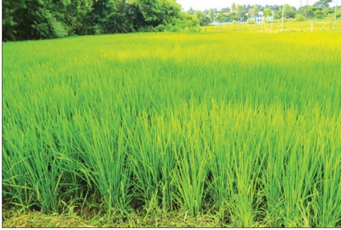
ကန့်ဘလူမြို့နယ်၌ စိုက်ပျိုးထားသော နွေစပါးစိုက်ခင်းကို တွေ့ရစဉ်။

ကန့်ဘလူ မေ ၃ စစ်ကိုင်းတိုင်းဒေသကြီး ကန့်ဘလူခရိုင်၌ ၂၀၂၄-၂၀၂၅ ခုနှစ် နွေစပါးစိုက်ပျိုးရာသီအတွင်း နွေစပါးဧက ၂၀၅၅၀ စိုက်ပျိုးရန် လျာထားဆောင်ရွက် ခဲ့ရာ ယခုအခါ ၂၂၅၂၆ ဧက စိုက်ပျိုးပြီးစီးကြောင်း ခရိုင်စိုက်ပျိုးရေးဦးစီးဌာနမှ သိရသည်။ ဒေသခံတောင်သူလယ်သမားများ နွေစပါးရာသီ စိုက်ပျိုးချိန်အထိ ထွန်ယက်စိုက်ပျိုးနိုင်ရန် ခရိုင် အတွင်းရှိ ကန့်ဘလူ၊ ကျွန်းလှမြို့နယ်တို့မှ ဆည်မြောင်းနှင့် ရေအသုံးချမှုစီမံခန့်ခွဲရေးဦးစီးဌာန များက ဆည်မြောင်းတာဝန်များ၊ ရေပေးမြောင်းများ၊ မြောင်းစစ်လမ်းများ၊ မြောင်းပေါင်များပြုပြင်ခြင်း၊ ရေဝေရေလဲစရိယာမှ စီးဆင်းသည့်ရေများ အပြည့်