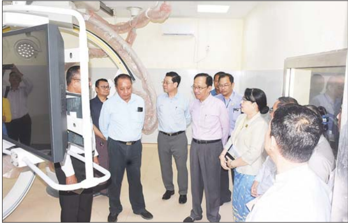
အန္တရာယ်နှင့် လူအများအစုလိုက် အပြုလိုက်ကုသမှု ဆောင်ရွက်ပေးနိုင်ရေးအတွက် Mass Casualty Management Plan များကို ဆေးရုံအလိုက်ရေးဆွဲထားရှိရန်လိုအပ်ပြီး ဓာတ်တိုက်လေ့ကျင့်မှု(Drill) ကိုလည်း ဆေးရုံအလိုက် သေချာစွာဆောင်ရွက်ထားကြရန်ဖြစ်ပါကြောင်း၊ ကုသရေးလုပ်ငန်းများကို ပိုမို တိုးတက်ကောင်းမွန်အောင် အားလုံးပူးပေါင်း ဆောင်ရွက်ပေးကြစေလိုပါကြောင်း မှာကြားသည်။ ထို့နောက် တက်ရောက်လာကြသူများက တင်ပြကြရာ ပြည်ထောင်စုဝန်ကြီးနှင့် ညွှန်ကြားရေးမှူးချုပ်များက လိုအပ်သည်များ ဖြည့်ဆည်းဆောင်ရွက်ပေးခဲ့ကြောင်း သိရသည်။ သတင်းစဉ်

ယင်းနောက် သွေးရောဂါအထူးကုဌာနတွင် ရိုးတွင်းခြင်ဆီ အစားထိုးကုသမှုဗဟိုရန် ဆေးရုံတက်ရောက်နေသည့် သွေးရောဂါရှင်လူနာနှစ်ဦးအား ကြည့်ရှုအားပေး၍ အာဟာရပြည့်အစားအစာများနှင့် ထောက်ပံ့ပေးမှုများ ပေးအပ်သည်။ ဆက်လက်၍ ရန်ကုန်ပြည်သူ့ဆေးရုံကြီး Training Center ၌ ရန်ကုန်မြို့ရှိ ဗဟိုအဆင့်ဆေးရုံများ၊ ခုတင်(၂၀၀)နှင့်အထက်ပြည်သူ့ဆေးရုံကြီးများမှ ဆေးရုံအုပ်ကြီးများနှင့် ပါမောက္ခအထူးကုဆရာဝန်ကြီးများနှင့်တွေ့ဆုံ၍ ပြည်ထောင်စုဝန်ကြီးက လူနာများစိုက်ထုတ်သုံးစွဲရသော ကုန်ကျစရိတ်လျော့နည်းစေရေးအတွက် ကျန်းမာရေးဝန်ကြီးဌာနအနေဖြင့် နိုင်ငံတော်ရန်ပုံငွေကိုအသုံးပြု၍ မရှိမဖြစ်လိုအပ်သော အရည်အသွေးကောင်းမွန်သည့် ဆေးနှင့် ဆေးပစ္စည်းများကို ဝယ်ယူထောက်ပံ့ပေးလျက်ရှိသည့်အတွက် အခြေခံမရှိမဖြစ်ဆေးဝါးများ၊ အရေးပေါ်ဆေးဝါးများ၊ ခွဲစိတ်ခန်းသုံးဆေးနှင့် ဆေးပစ္စည်းများ၊ ဓာတ်ခွဲခန်းသုံးဆေးပစ္စည်းများကို ပြတ်လပ်မှုမရှိစေရန် စနစ်တကျစီမံခန့်ခွဲပေးကြရန် လိုပါကြောင်း၊ အရေးပေါ်ကုသမှုများ၊ ခွဲစိတ်ကုသမှုများ၊ ဓာတ်ခွဲစစ်ဆေးမှုများအတွက် ငွေကြေးကုန်ကျမှုမရှိစေရေး စီမံဆောင်ရွက်ပေးရန်ဖြစ်ပါကြောင်း၊ သဘာဝဘေး