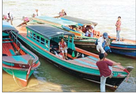
မေ ၂ ရက်က ကျော့သောင်းနယ်စပ်ဂိတ်မှ ရနောင်းမြို့သို့ သွားလာနေ သည့် မြန်မာနိုင်ငံသားများကို တွေ့ရစဉ်။