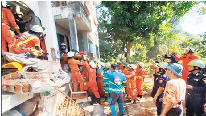
မြန်မာနိုင်ငံမီးသတ်တပ်ဖွဲ့ဝင်များ မန္တလေးငလျင်ကြီးကြောင့် ဇမ္ဗူဒီရီမြို့နယ် ဉာဏသိဒ္ဓိရပ်ကွက်အတွင်း ပိတ်မိနေသူများအား ကူညီကယ်ထုတ်ပေးစဉ်။ (၁-၄-၂၀၂၅)

သဘာဝဘေးအန္တရာယ်နှင့် မီးဘေးအန္တရာယ်ဖြစ်စဉ်တို့တွင် ရှာဖွေကယ်ဆယ်ရေးလုပ်ငန်းတို့၌