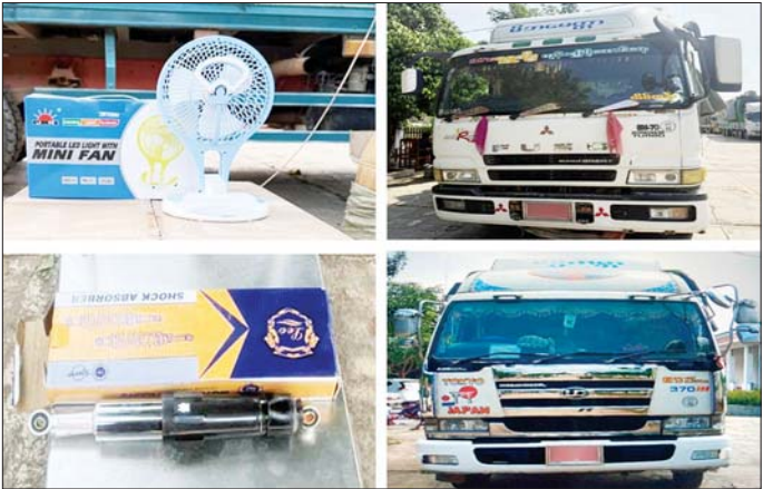
ရှမ်းပြည်နယ်၌ ဖမ်းဆီးရမိမှု။

သည့် Jinbei Mini Bus တစ်စီး၊ Toyota Hiace တစ်စီး (ခန့်မှန်းတန်ဖိုးငွေကျပ် ၇၄၀၀၀၀၀)ကို လည်းကောင်း၊ ထုံးဘို ၇ မိုင် ကတ္တာအနီး၌ မော်တော်ယာဉ်ငါးစီးပေါ်မှ တရားဝင်စာရွက်စာတမ်း အထောက်အထား တင်ပြနိုင်ခြင်းမရှိသည့် လုပ်ငန်းသုံးပစ္စည်း ၄၁ မျိုး (ခန့်မှန်းတန်ဖိုးငွေကျပ် ၃၃၇၄၁၃၃၀၀)နှင့် အဆိုပါပစ္စည်းများ တင်ဆောင် လာသည့် Mitsubishi Fuso Truck သုံးစီး၊ Nissan Diesel Truck တစ်စီး၊ Hino Truck တစ်စီး (ခန့်မှန်း တန်ဖိုးငွေကျပ် ၁၈၇၀၀၀၀၀)ကို လည်းကောင်း စုစုပေါင်း ခန့်မှန်းတန်ဖိုးငွေကျပ်၆၅၈၃၅၆၄၀၀ကို ဖမ်းဆီးရမိခဲ့ပြီး အကောက်ခွန်လုပ်ထုံးလုပ်နည်းများ နှင့်အညီ အရေးယူဆောင်ရွက်လျက်ရှိသည်။ ယင်းအပြင် ကရင်ပြည်နယ်တရားမဝင်ကုန်သွယ်မှု တိုက်ဖျက်ရေးအထူးအဖွဲ့၏စီမံခန့်ခွဲမှုဖြင့် တာဝန်ကျ ပူးပေါင်းအဖွဲ့က စစ်ဆေးမှုများဆောင်ရွက်ခဲ့ရာ မြဝတီ-ကော့ကရိတ် အာဂျလမ်းမကြီးဘေး ရပ်ကွက် (၄) ရှိ ကုန်လှောင်ရုံတစ်လုံးအတွင်းမှ တရားဝင် စာရွက်စာတမ်းအထောက်အထား တင်ပြနိုင်ခြင်း မရှိသည့် လုပ်ငန်းသုံးပစ္စည်းတစ်မျိုး (ခန့်မှန်းတန်ဖိုး ငွေကျပ်၁၃၅၀၀၀၀)ကို ဖမ်းဆီးရမိခဲ့ပြီး အကောက် ခွန် လုပ်ထုံးလုပ်နည်းများနှင့်အညီ အရေးယူ