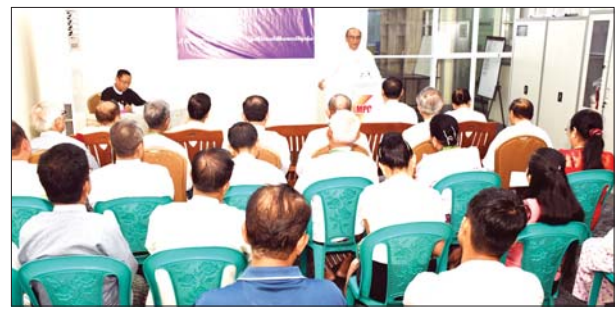
ပြောကြားကြသည်။ ထို့နောက် အခမ်းအနား တက်ရောက်လာ ကြသူများက ပြန်လည်ဆွေးနွေးကြပြီး တွဲဖက် အတွင်းရေးမှူး (၂) ဦးရဲမင်းစိုးက ကျေးဇူးတင် စကား ပြောကြားသည်။ အခမ်းအနားသို့ မြန်မာနိုင်ငံ သတင်း မီဒီယာကောင်စီဥက္ကဋ္ဌ ဒေါက်တာတင်ထွန်းဦး၊ ဒုတိယဥက္ကဋ္ဌများနှင့် ကောင်စီဝင်များ၊ မီဒီယာဖွံ့ဖြိုးတိုးတက်ရေးဦးစီးဌာန သတင်း မီဒီယာဌာနများမှ တာဝန်ရှိသူများနှင့် ဖိတ်ကြားထားသူများ တက်ရောက်ကြသည်။ အောင်မြင့်(ပြန်/ဆက်)

ရန်ကုန် မေ ၃ ကမ္ဘာ့သတင်းလွတ်လပ်ခွင့်နေ့(World Press Freedom Day) အခမ်းအနားကို ယနေ့နံနက် ၁၀ နာရီက ရန်ကုန်မြို့ကန်သည်လမ်းရှိ မြန်မာ နိုင်ငံသတင်းမီဒီယာကောင်စီရုံး၌ ကျင်းပ သည်။ အခမ်းအနားတွင် ပြန်ကြားရေးဝန်ကြီးဌာန ပြည်ထောင်စုဝန်ကြီးဇေယျကျော်ထင် စည်သူ ဦးမောင်မောင်အုန်းထံမှ ပေးပို့သည့် သံဝင်ကလာ ကို မြန်မာနိုင်ငံသတင်းမီဒီယာကောင်စီဥက္ကဋ္ဌ ဒေါက်တာ တင်ထွန်းဦးက ဖတ်ကြားပြီး အမှာ စကားပြောကြားသည်။ (ယာဝု) ဆက်လက်၍ မြန်မာနိုင်ငံ သတင်းမီဒီယာ ကောင်စီ ဒုတိယဥက္ကဋ္ဌ(၁) ဦးခင်မောင်ဇော် နှင့် ဒုတိယဥက္ကဋ္ဌ(၂) ဦးခင်မောင်ကျော်ဒင်တို့က သတင်းလွတ်လပ်ခွင့်နှင့် သက်ဆိုင်သော အကြောင်းအရာများကို ဆွေးနွေး အခမ်းအနားသို့ မြန်မာနိုင်ငံ သတင်း မီဒီယာကောင်စီဥက္ကဋ္ဌ ဒေါက်တာတင်ထွန်းဦး၊ ဒုတိယဥက္ကဋ္ဌများနှင့် ကောင်စီဝင်များ၊ မီဒီယာဖွံ့ဖြိုးတိုးတက်ရေးဦးစီးဌာန သတင်း မီဒီယာဌာနများမှ တာဝန်ရှိသူများနှင့် ဖိတ်ကြားထားသူများ တက်ရောက်ကြသည်။ အောင်မြင့်(ပြန်/ဆက်)