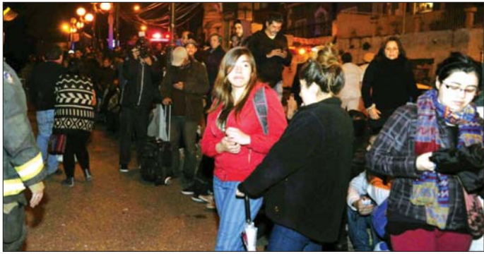
ငလျင်လှုပ်ခတ်ပြီးနောက် အထိတ်တလန့်ဖြစ်ပွားကာ လမ်းမပေါ်သို့ထွက်လာကြသည့် ပြည်သူများကို တွေ့ရစဉ်။

ဗဟိုပြု၍ လှုပ်ခတ်ခဲ့ခြင်း ဖြစ်သည်။ ယခုအချိန်တွင် ဘေးလွတ်ရာ ရွှေ့ပြောင်းမှုများ လုပ်ဆောင်ရန် မလိုအပ်တော့သော်လည်း မာဂဲလန်ဒေသရှိ ကမ်းခြေနှင့် ကမ်းရိုးတန်း ဒေသများတွင် ဆူနာမီအန္တရာယ် ရှိနေသေးကြောင်း အမျိုးသားသဘာဝဘေးအန္တရာယ် ကာကွယ်ရေးနှင့် တုံ့ပြန်ရေးအဖွဲ့ အကြီးအကဲ စီဘာရိုင်းယန်က ပြောသည်။ ၃၀ မှ ၉၀ စင်တီမီတာအထိ ရှိနိုင်သော လှိုင်းလုံးများ ဖြစ်ပေါ်နိုင်သေးသည့်အတွက် အကြံပြုသတိပေးချက်များ မရုပ်သိမ်းမီ အထိ ကမ်းခြေများ၊ ဖြစ်စေများ၊ ဆိပ်ခံများ၊ သင်္ဘောကျင်းများနှင့် အခြားကမ်းရိုးတန်း ဒေသများသို့ သွားလာခြင်းမှ ရှောင်ရှားကြရန် အာဏာပိုင်များက ဒေသခံများကို တိုက်တွန်းထားသည်။ ငလျင်ကြီး လှုပ်ခတ်မှုကြောင့် ထိခိုက်ဒဏ်ရာရရှိမှုနှင့် ပျက်စီးဆုံးရှုံးမှုများကို ထုတ်ပြန်ထားခြင်း မရှိသေးပေ။ ငလျင်ကြီးလှုပ်ခတ်ပြီးနောက် ပြင်းအား ၆ ဒသမ ၁ ရှိ ငလျင်အပါအဝင် နောက်ဆက်တွဲငလျင်ပေါင်း ၁၂ ခုကျော် လှုပ်ခတ်ခဲ့ကြောင်း သိရသည်။ ချိုလီနိုင်ငံသည် ပစ်ဖိတ် မီးကွင်း ဒေသတစ်လျှောက်တွင် တည်ရှိပြီး ငလျင်လှုပ်ခတ်မှု အလွန်များပြားသည့် နိုင်ငံများအနက် တစ်နိုင်ငံဖြစ်သည်။ ဆင်ယွာ