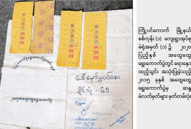
ကြိုပင်ကောက် မြို့နယ် စစ်ကုန်း (၁) ကျေးရွာအုပ်စု မဲရုံအမှတ် (၁) ၌ ၂၀၂၀ ပြည့်နှစ် အထွေထွေ ရွေးကောက်ပွဲတွင် ရောနှော ထည့်သွင်း အသုံးပြုခဲ့သည့် ၂၀၁၅ ခုနှစ် အထွေထွေ ရွေးကောက်ပွဲမှ ဆန္ဒ မဲလက်မှတ်များ မှတ်တမ်းဓာတ်ပုံ။