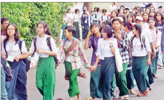
အခြေခံပညာအထက်တန်းကျောင်းနှင့် အမှတ်(၃) အခြေခံပညာအထက်တန်းကျောင်းသို့ သွားရောက်ပြီး တက္ကသိုလ်ဝင်စာမေးပွဲပြန်လည်ဖြေဆိုကြမည့် ကျောင်းသား ကျောင်းသူများအား ဘာသာရပ်ဆိုင်ရာ သင်ခန်းစာများကို အထူးသတိပြုစေရန်အတွက် စေတနာ့မေတ္တာများဖြင့် လာရောက် သင်ကြားပြသပေးနေခြင်းသည် အလွန်မွန်မြတ်သော ပညာဒါနကြီး တစ်ခုပင်ဖြစ်ပါကြောင်း၊ ဆရာ ဆရာမများ မိတ်ပြည်သူများ

နေပြည်တော် မေ ၃ ပညာရေးဝန်ကြီးဌာနပြည်ထောင်စုဝန်ကြီး ဒေါက်တာညွန့်ဖေသည် ဒုတိယဝန်ကြီး ဒေါက်တာဇော်မြင့်နှင့် ဦးနေမျိုးလှိုင်၊ ပညာရေးဝန်ကြီးဌာနရှိ ဦးစီးဌာနများမှ ညွှန်ကြားရေးမှူးချုပ်များ တက္ကသိုလ် ပါမောက္ခချုပ်များနှင့်အတူ ယနေ့ နံနက်ပိုင်းတွင် မန္တလေးတိုင်းဒေသကြီးရှိ အခြေခံပညာကျောင်းများသို့ သွားရောက်၍ ၂၀၂၅ ခုနှစ် တက္ကသိုလ်ဝင်စာမေးပွဲပြန်လည်ဖြေဆိုကြမည့် ကျောင်းသား ကျောင်းသူများ ဘာသာရပ်ဆိုင်ရာ သင်ခန်းစာများကို အေးချမ်းစွာအနီးကပ် သင်ယူနေမှုများအား လိုက်လံ ကြည့်ရှုအားပေး၍ လိုအပ်သည့် များ မှာကြားသည်။ ဦးစွာ ပြည်ထောင်စုဝန်ကြီးသည် ပြင်ဦးလွင်မြို့ အမှတ်(၂)