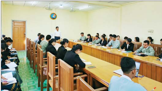
ပြောကြားသည်။ များမှ အရာထမ်း၊ အမှုထမ်းများ ဆွေးနွေးခဲ့ကြပြီး လိုအပ်သည်များ ယင်းနောက် ခရိုင်နှင့်မြို့နယ် နှင့် ဝန်ထမ်းရေးရာကိစ္စများ၊ မှာကြားခဲ့ကြောင်း သိရသည်။ ရွေးကောက်ပွဲကော်မရှင်အဖွဲ့ခွဲရုံး ရွေးကောက်ပွဲဆိုင်ရာကိစ္စရပ်များ သတင်းစဉ်

နေပြည်တော် မေ ၃ ရောက်ကြသည်။ မည်ဖြစ်ကြောင်း၊ မြန်မာပြည်ထောင်စု ရွေးကောက်ပွဲကော်မရှင်အဖွဲ့ဝင် ဦးခင်ဇော်က မြန်မာအီလက်ထရောနစ် မဲပေးစက် (MEVM) ကျွမ်းကျင်ပိုင်ဆိုင်မှု အသုံးပြုနိုင်ရေးနှင့် စပ်လျဉ်းပြီး သင်တန်းပို့ချခြင်း ဖြစ်ကြောင်း၊ သင်တန်းသားများ အနေဖြင့် သေချာစွာ လိုက်နာမှတ်သားပြီး ဆင့်ပွားသင်တန်းများ ပြန်လည် ပို့ချရာတွင် ရှင်းရှင်းလင်းလင်းနှင့် ထိရောက်စွာ ပို့ချဆောင်ရွက်နိုင်ရန် လိုကြောင်း၊ သို့မှသာ ရွေးကောက်ပွဲ ကာလလက်တွေ့အသုံးပြုဆောင်ရွက်ရာတွင် အခက်အခဲအများအပြား အလွင့်လင်မှုများ မရှိစေရန် ဆောင်ရွက်နိုင်ကြောင်း၊