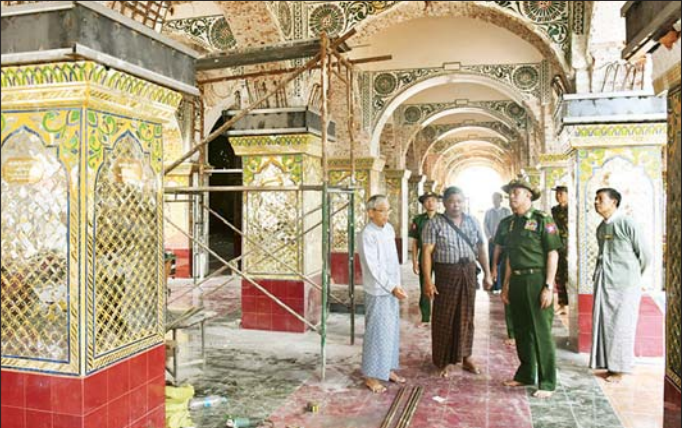
ကာကွယ်ရေးဦးစီးချုပ်ရုံး(ကြည်း)မှ ဒုတိယဗိုလ်ချုပ်ကြီး မျိုးမိုးအောင် မန္တလေးမြို့ မန္တလေးတောင်တော် ဆုတောင်းပြည့်ဘုရားရင်ပြင်တော်ရှိ ဂန္ဓကုဋ်တိုက်ပြုပြင်နေမှုကို ကြည့်ရှုစစ်ဆေးစဉ်။