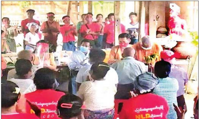
ပြည်ထောင်စုရေးကောက်ပွဲကော်မရှင်၏ အမိန့်ညွှန်ကြားချက် (၁/၂၀၁၄)နှင့် (၁၇၃/၂၀၂၀) တို့ကို ဖောက်ဖျက် ၍ ပျော်ဘွယ်မြို့နယ် ကျိရွာအုပ်စုတွင် ဘာသာရေး အဆောက်အအုံအား မဲဆွယ်စည်းရုံးရာ၌ အသုံးပြု ခြင်း၊ ဘာသာရေးကို အကြောင်းပြု၍ ထောက်ခံဆန္ဒမဲပေးရန် တရားမဲ့ပြုကျင့်မှု ကျူးလွန်ခြင်း မှတ်တမ်းပုံ။

ငွေမျက်နှာတစ်ခုတည်းကြောင့်သာ တိုင်းပြည် ပျက်စီးရေးစီမံကိန်းမှာ ပြည်သူ့ကြိုက်အနုပညာ ရှင်များ၊ ပရဟိတအသင်းများ၊ Influencer များ နှင့် မီဒီယာအသင်းအဖွဲ့များစွာက တက်တက်