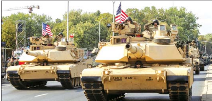
ပါရနပ်ဝဲလယ်ကော့ စစ်ပွဲအဆုံးသတ်မှု အထိမ်းအကြီးဆုံး စစ်ရေးပြအခမ်းအနားကို ၁၉၉၁ ခုနှစ် အမှတ်အနေဖြင့် အမေရိကန်နိုင်ငံ၏ မြို့တော်တွင် တွင် ကျင်းပခဲ့ကြောင်း သိရသည်။ ဆင်ယွာ

စစ်သည်တော် ၆၆၀၀ ခန့် ပါဝင်ဖွယ်ရှိကြောင်း အမေရိကန်တပ်မတော် ပြောရေးဆိုခွင့်ရှိသူ ဟဲသာဟော့က က ပြောသည်။ အမေရိကန် တပ်မတော်သည် နှစ် (၂၅၀) ပြည့် အထိမ်းအမှတ်အခမ်းအနားကို သီတင်းတစ်ပတ်ကြာ ကျင်းပသွားရန် စီစဉ်နေကြောင်း သိရသည်။ ထူးခြားသည်မှာ ဇွန် ၁၄ ရက်သည် အမေရိကန် သမ္မတ ဒေါ်နယ်ထရမ်၏ ၇၉ နှစ်မြောက် မွေးနေ့လည်းဖြစ်သည်။ ထရမ်သည် ၎င်း၏ ပထမဦးဆုံး တွင် ဝါရှင်တန်နီစီဗီဇ် စစ်ရေးပြအခမ်းအနားကျင်းပရန် စိတ်ကူးရှိခဲ့သော်လည်း ကုန်ကျစရိတ်များပြားမှုနှင့် စစ်သုံးယာဉ်များကြောင့် လမ်းများထိခိုက်ပျက်စီးနိုင်မှုအပေါ် စိုးရိမ်မှုများရှိသည့်အတွက် ယင်းအစီအစဉ် မအောင်မြင်ခဲ့ခြင်း ဖြစ်သည်။