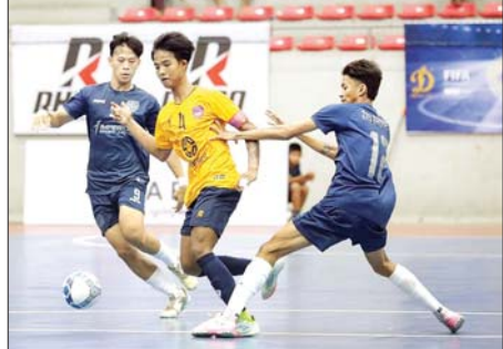
MHDT အသင်းနှင့် MIU အသင်း ယှဉ်ပြိုင်ပွဲစဉ်။

မန်စီးတီးက ဝုဗ်ကို နိုင်ပွဲရပြီး ချန်ပီယံလိဂ်ဝင်ခွင့်ရရှိရေး နီးကပ်လာ ပရီမီယာလိဂ်ပွဲစဉ် (၃၅) အဖြစ် မေ ၃ ရက် နံနက် ၁ နာရီခွဲက အီတလီဟက်ကွင်း၌ ယှဉ်ပြိုင်ကစားခဲ့သည့် မန်စီးတီးနှင့် ဝုဗ်အသင်းပွဲစဉ်တွင် မန်စီးတီးအသင်းက ဒီဘရိုင်း၏ တစ်လုံးတည်းသောသွင်းဂိုးဖြင့် အနိုင်ရရှိကာ လာမည့်နှစ် ချန်ပီယံလိဂ် ဝင်ခွင့်ရရှိရေး နီးကပ်လာပြီ ဖြစ်သည်။ ချန်ပီယံလိဂ်ဝင်ခွင့်ရရှိရေး ရမှတ်လိုအပ်ချက် ရှိနေသည့် မန်စီးတီးအသင်းသည် ပြိုင်ဘက်ဝုဗ်အသင်းကို စာမျက်နှာ ၂၁ ကော်လံ ၃