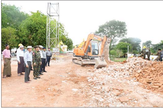
စစ်ကိုင်းတိုင်းဒေသကြီးဝန်ကြီးချုပ် ဦးမြတ်ကျော်နှင့် ကာကွယ်ရေးဦးစီးချုပ်ရုံး(ကြည်း)မှ ဒုတိယ ဗိုလ်ချုပ်ကြီး သက်ပုံတို့ စစ်ကိုင်းမြို့ ရတနာထွဋ်ခေါင်စေတီရှိ အပျက်အစီးများ ဖယ်ရှားရှင်းလင်း မှုကြည့်ရှုစဉ်။