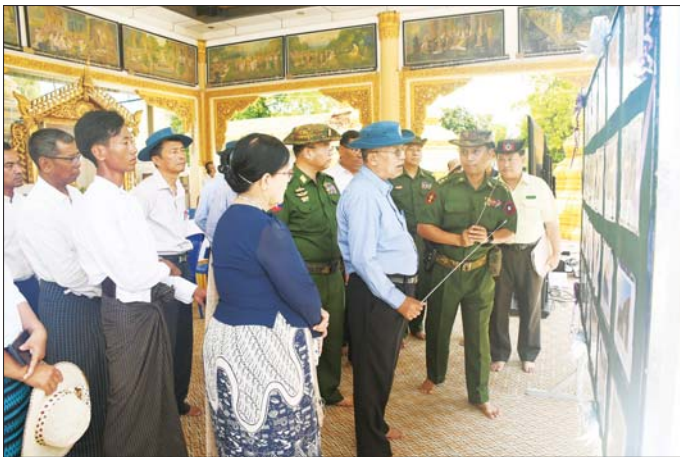
နှင့် တမုတ်ရွှေဂူကြီးဘုရား ဦးစွာ ပြည်ထောင်စုဝန်ကြီး ပျက်စီးခဲ့သော ရှေးဟောင်း အဆောက်အအုံများ၊ ကုန်းဘောင် အတွင်းရှိ ငလျင်ဒဏ်ကြောင့် ခေတ်လက်ရာ ရှေးဟောင်း

မန္တလေး မေ ၃ သာသနာရေးနှင့် ယဉ်ကျေးမှု ဝန်ကြီးဌာန ပြည်ထောင်စုဝန်ကြီး ဦးတင်ဦးလွင်သည် သာသနာရေး နှင့် ယဉ်ကျေးမှုဝန်ကြီးဌာန ဒုတိယဝန်ကြီး ဒေါ်နုမြစ်၊ မန္တလေး တိုင်းဒေသကြီး လူမှုရေးရာဝန်ကြီး ဦးအောင်ကျော်မိုး၊ သာသနာရေး နှင့် ယဉ်ကျေးမှုဝန်ကြီးဌာန အမြဲတမ်းအတွင်းဝန် ဦးမြင့်ဦး၊ ရှေးဟောင်းသုတေသနနှင့် အမျိုး သား ပြတိုက်ဦးစီးဌာနနှင့် သာသနာရေးဦးစီးဌာနမှ တာဝန် ရှိသူများနှင့်အတူ ယနေ့နံနက်ပိုင်း တွင် ငလျင်ဒဏ်ကြောင့် ထိခိုက် ပျက်စီးခဲ့သည့် မန္တလေးတိုင်း ဒေသကြီး ကျောက်ဆည်ခရိုင် ပလိပ်ဒေသ၊ မက္ခရာဒေသတို့ရှိ ရှေးဟောင်းအဆောက်အအုံများ