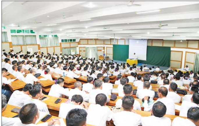
ရေးမှူးချုပ်များနှင့် ပါမောက္ခချုပ်များက သင်တန်း ကာလအတွင်း လိုက်နာဆောင်ရွက်ရမည့် အချက် များနှင့် စားသောက်နေထိုင်ရေးဆိုင်ရာ ကိစ္စရပ်များ ကို ဆွေးနွေးပြောကြားပြီး သင်တန်းသား သင်တန်း သူများနှင့် ရင်းနှီးခင်မင်စွာ နှုတ်ဆက်ကြကြောင်းနှင့် သင်တန်းသို့ ဆရာ ဆရာမ ၃၅၂ ဦး တက်ရောက်လျက် ရှိကြောင်း သိရသည်။

ကိုယ်တိုင် တတ်မြောက်ထားသည့် ပညာရပ်များကို မျှဝေသင်ကြားပို့ချရမည်ဖြစ်ကြောင်း၊ လေ့ကျင့် သင်ကြားပေးမည့် ဆရာ ဆရာမများ၏ အရည် အသွေးပြည့်ဝနေမှသာ သင်ရိုးမာတိကာပါ အကြောင်းအရာများသာမက လက်တွေ့သင်ကြား ရေးနှင့် ပြင်ပလုပ်ငန်းခွင်ကျွမ်းကျင်မှုအတွက်ပါ စာတွေ့နှင့် လက်တွေ့ ချိတ်ဆက်လေ့ကျင့်ပေးနိုင် မည်ဖြစ်ကြောင်း၊ သင်ကြားရေး ဆရာ ဆရာမအဖြစ် ပြောင်းလွှဲ တာဝန်ထမ်းဆောင်ကြရသူများအနေဖြင့် စိုက်ပျိုးရေး-မွေးမြူရေး ပညာပေးဝန်ထမ်းအဖြစ်မှ မတူညီသည့် သင်ကြားရေးနယ်ပယ်တွင် တာဝန်ယူ ရမည်ဖြစ်သည့်အတွက် သင်ကြားရေးနည်းစနစ်များ၊ ကြိုတင်ပြင်ဆင်လေ့လာလေ့ကျင့်ရမည့် သင်ခန်းစာ အကြောင်းအရာများ၊ အက်မြတ်အမှတ်ပေးစနစ်များ သည် ကျောင်းသား ကျောင်းသူများ၏ အနာဂတ် ပညာရေးလမ်းကြောင်းကို အဆုံးအဖြတ်ပေးရန် အရေးပါသည့် အရာများဖြစ်ကြောင်း ပြောကြား သည်။