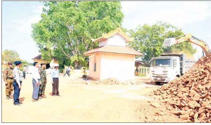
ကာကွယ်ရေးဦးစီးချုပ်ရုံး(ကြည်း)မှ ဒုတိယဗိုလ်ချုပ်ကြီး သက်ဝန် ပါရီရပ်ကွက် သီလရှင်စာသင်တိုက်နှင့် မရှိခဏစေတီတို့သို့ သွားရောက်ကာ စက်ယန္တရားကြီးများဖြင့် ရှင်းလင်းဖယ်ရှားနေမှုကို ကြည့်ရှုစစ်ဆေးစဉ်။

ယင်းနောက် ကျောက်ဆည်မြို့ မြို့တော်ခန်းမ၌ ကျင်းပပြုလုပ်သည့် Modular House များ လျှင်ဒဏ်ဒုက္ခပေးအပ်ပွဲနှင့် ကျောက်သေတ္တာစေတီ ပြုပြင်ထိန်းသိမ်းရေးအလှူငွေပေးအပ်ပွဲအခမ်းအနားသို့ တက်ရောက်၍ အလှူငွေများလက်ခံပေးပြီး အလှူပြုစုများ၊ မြို့မိမြို့ဖများအား Modular House များလျှင်ဒဏ်ဒုက္ခပေးမှုအပေါ် ကျေးဇူးတင်ရှိကြောင်း၊ ကျောက်သေတ္တာစေတီကြီးကိုလည်း ပြည်သူများအန္တရာယ်ကင်းရှင်းရေးအတွက် နိုင်ငံတော်အဆင့် ပြင်ဆင်မွမ်းမံနိုင်ရေး ဆောင်ရွက်လျက်ရှိကြောင်း၊ Modular House များကိုလည်း အမှန်တကယ် လိုအပ်လျက်ရှိသောနေရာများတွင် တွန်းအားပေး တည်ဆောက်ပေးလျက်ရှိကြောင်း၊ မကြာမီ မိုးတွင်းကာလရောက်ရှိတော့မည်ဖြစ်သဖြင့် ပြည်သူများ ဝန်ထမ်းများ လုံခြုံစွာနေထိုင်နိုင်ရေး ကြိုးစားဆောင်ရွက်လျက်ရှိကြောင်း ပြောကြားပြီး အလှူရှင်များအား ဂုဏ်ပြုမှတ်တမ်းလွှာများ ပေးအပ်ခဲ့ကြောင်း သတင်းရရှိသည်။