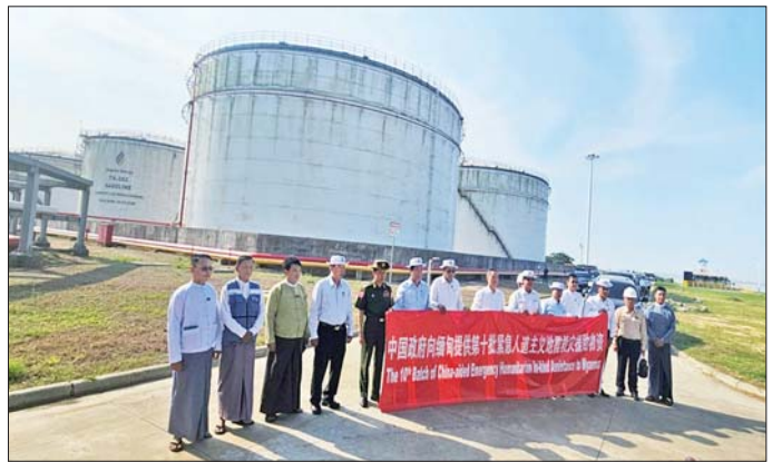
တရုတ်နိုင်ငံမှ လှူဒါန်းသည့် ဒီဇယ်ဆီ ၁၈,၀၀၀ တန် သီလဝါဆိပ်ကမ်းသို့ရောက်ရှိရာ လွှဲပြောင်းလက်ခံစဉ်။