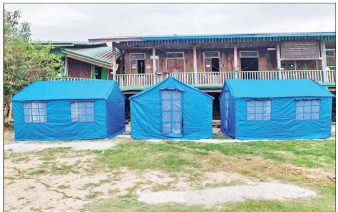
ရှမ်းပြည်နယ်အတွင်း နိုင်ငံတကာမှလှူဒါန်းသည့် မိုးကာတံများ စီစဉ်ဆောင်ရွက်ထားရှိစဉ်။