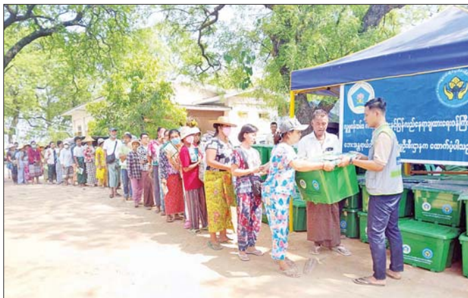
စစ်ကိုင်းတိုင်းဒေသကြီးအတွင်း နိုင်ငံတကာမှပေးအပ်သည့် အလှူပစ္စည်းများ ဖြန့်ခွဲပေးအပ်စဉ်။