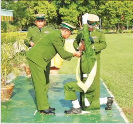
မန္တလေးတိုင်းဒေသကြီး နယ်မြေခံသင်တန်းကျောင်း စစ်ရေးပြကွင်း၌ ပြည်သူ့စစ်မှုထမ်းသင်တန်းအမှတ်စဉ် (၁၀) သင်တန်းဆင်းပွဲအခမ်းအနားတွင် ကျောင်းအုပ်ကြီးက ဆုချီးမြှင့်ပေးအပ်စဉ်။