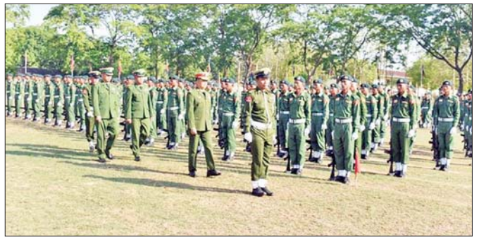
ရန်ကုန်တိုင်းဒေသကြီး နယ်မြေခံသင်တန်းကျောင်း၌ ပြည်သူ့စစ်မှုထမ်းသင်တန်းအမှတ်စဉ် (၁၀) သင်တန်းဆင်းပွဲ ကျင်းပစဉ်။