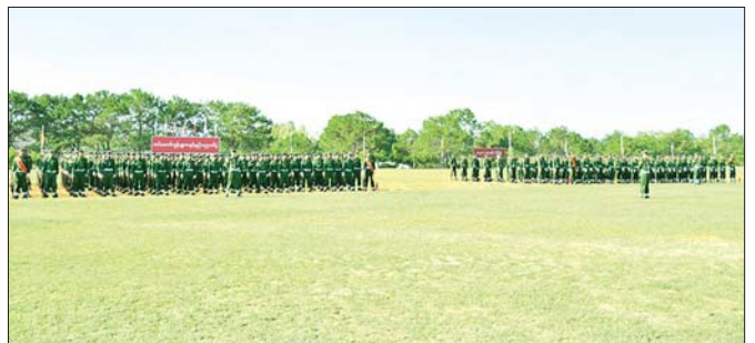
ပအိုဝ်းကိုယ်ပိုင်အုပ်ချုပ်ခွင့်ရဒေသ၌ ပြည်သူ့စစ်မှုထမ်းသင်တန်းအမှတ်စဉ်(၁၀) သင်တန်းဆင်းပွဲ ကျင်းပစဉ်။