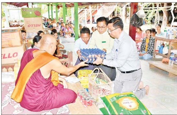
နေပြည်တော်ကောင်စီနယ်မြေ လျှင်ဘေးသင့်ပြည်သူများအား အလှူပစ္စည်းများ ဖြန့်ခွဲပေးအပ်စဉ်။