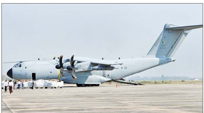
တရုတ်၊ အိန္ဒိယနှင့် မလေးရှားနိုင်ငံတို့မှ လူသားချင်းစာနာထောက်ထားမှုဆိုင်ရာ အကူအညီပစ္စည်းများ ဆိုက်ရောက်လာစဉ်။