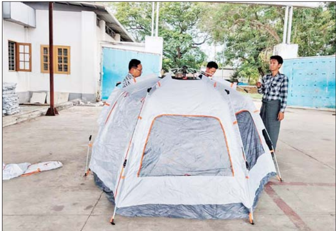
တရုတ်နိုင်ငံမှ ပေးပို့လှူဒါန်းသည့် လူသားချင်းစာနာထောက်ထားမှုဆိုင်ရာအကူအညီပစ္စည်း မိုးကာတဲများ ရောက်ရှိစဉ်။