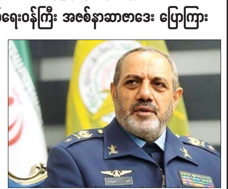
အီရန်ကာကွယ်ရေးဝန်ကြီး အစစ် နာဆာဇာဒေး။

တီဟီရန် မေ ၅ အမေရိကန် သို့မဟုတ် အစ္စရေး နိုင်ငံက အစ္စလာမစ်သမ္မတနိုင်ငံကို စတင်တိုက်ခိုက်ခဲ့မည်ဆိုပါက အီရန်နိုင်ငံအနေဖြင့် အမေရိကန်နှင့် အစ္စရေးတို့၏ စစ်အခြေစိုက်စခန်းများ၊ စစ်သည်တော်များကို တိုက်ခိုက်သွားမည်ဖြစ်ကြောင်း အီရန်ကာကွယ်ရေးဝန်ကြီး အစစ်နာဆာဇာဒေးက သတိပေးပြောကြားလိုက်သည်။