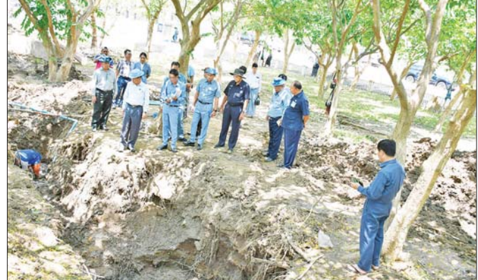
စက်ရုံ အမှတ်(၃) ရေသိုလှောင်ထားရှိမှုနှင့် ရေဖြန့်ဝေနေမှုအခြေအနေ၊ ဥက္ကဋ္ဌရသီရိမြို့နယ် သုခမိနီလမ်း၌ ကလိုရင်းခတ် သန့်စင်စားသည့် သောက်သုံးရေများ ရေသယ်ယာဉ်များဖြင့် ရေဖြည့်တင်းပြီး သယ်ယူပို့ဆောင်ဖြန့်ဝေနေမှု အခြေအနေများကို ကြည့်ရှုစစ်ဆေးသည်။ ယင်းနောက် နေပြည်တော်ကောင်စီဥက္ကဋ္ဌသည် ချောင်းမကြီးရေလှောင်တံခံသို့ သွားရောက်ပြီး တံခံပြုပြင်နေမှုများနှင့် တံခံမြေသားကြွေခိုင်းမှု စစ်ဆေးနေမှုအခြေအနေများ၊ မြေညီရိမြို့နယ်

နေပြည်တော် မေ ၅ နေပြည်တော်ကောင်စီဥက္ကဋ္ဌ ဦးသန်းထွန်းဦးသည် ယနေ့နေ့က ဥက္ကဋ္ဌရသီရိမြို့နယ် မြတ်လေးလမ်းနှင့် နေကြာလမ်းသို့ သွားရောက်၍ ငလျင်ဘေးကြောင့် ပျက်စီးခဲ့သည့် ရေပေးဝေရေး ပိုက်လိုင်းများကို ဝန်ထမ်းများ၊ ယန္တရားများဖြင့် တူးဖော်ပြင်ဆင် ဆောင်ရွက်နေမှုအခြေအနေများကို ကြည့်ရှုစစ်ဆေးပြီး လိုအပ်သည်များ ပေါင်းစပ်ညှိနှိုင်း ဆောင်ရွက်ပေးသည်။ ယနေ့နံနက်ပိုင်းတွင် နေပြည်တော်ကောင်စီဥက္ကဋ္ဌသည် ဥက္ကဋ္ဌရသီရိမြို့နယ် ရာဇသင်္ဂဟလမ်းအနီး ငလျင်ဘေးဒဏ်ကြောင့် ပျက်စီးခဲ့သည့် ပင်မရေပိုက်လိုင်းများ၊ ရေဖြန့်ဝေသည့် ပိုက်လိုင်းများ ပြန်လည်ပြုပြင်နေမှုနှင့် ရာဇသင်္ဂဟအိမ်ရာ(၁) ဝင်းအတွင်း ရေပိုက်လိုင်းများ ပြုပြင်နေမှုကို လှည့်လည်ကြည့်ရှုစစ်ဆေးသည်။ ထို့နောက် ငလျင်ဘေးကြောင့် ထိခိုက်ပျက်စီးခဲ့သော ရာဇသင်္ဂဟလမ်းကို စက်ယန္တရားများဖြင့် ပြန်လည်ပြုပြင်နေမှုနှင့် ဥက္ကဋ္ဌရသီရိမြို့နယ်ရှိ နေပြည်တော် စည်ပင်သာယာရေးကော်မတီ၊ ရေသန့်စင်