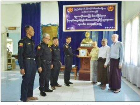
ဦးစီးဌာနမှ လူနာများအား နေ့လယ်စာ အာဟာရဒါနအလှူနှင့် ဆေးပဒေ သာပင်လျှင်အိမ်ခြင်းကို ယနေ့ နံနက်ပိုင်းက အဆိုပါ ကင်ဆာ ဖောင်ဒေးရှင်း၌ ပြုလုပ်သည်။

ပုသိမ်ကြီး မေ ၅ (၇၉) နှစ်မြောက် မြန်မာနိုင်ငံ မီးသတ်တပ်ဖွဲ့နေ့ အထိမ်းအမှတ် မန္တလေးတိုင်းဒေသကြီး ပုသိမ် ကြီးမြို့နယ်ရှိ ဦးလှထွန်းမေတ္တာ ရိပ်မွန် ကင်ဆာဖောင်ဒေးရှင်းသို့ တိုင်းဒေသကြီး မီးသတ်ဦးစီးဌာန မှ လူနာများအား နေ့လယ်စာ အာဟာရဒါနအလှူနှင့် ဆေးပဒေ သာပင်လျှင်အိမ်ခြင်းကို ယနေ့ နံနက်ပိုင်းက အဆိုပါ ကင်ဆာ ဖောင်ဒေးရှင်း၌ ပြုလုပ်သည်။