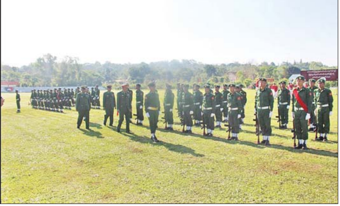
နိုင်ငံတော်ကာကွယ်ရေးနှင့် လုံခြုံရေးတာဝန်များကို စွမ်းစွမ်းတမံတာဝန်ထမ်းဆောင်ကြမည့် နိုင်ငံသား ကောင်းများ၏ ပြည်သူ့စစ်မှုထမ်းသင်တန်းအမှတ်စဉ်(၁၀) သင်တန်းဆင်းပွဲ ကျင်းပစဉ်။

ကျွန်တော် စည်းစနစ်တကျ နေထိုင်တတ် သွားတယ်လို့ ခံစားမိပါတယ်။ နိုင်ငံတော်ကာကွယ်ရေးတာဝန် ဆိုတာ အမျိုးသားတိုင်း ထမ်း ဆောင်ရမယ့် တာဝန်ဖြစ်လို့ နောက်ထပ် လာရောက်တက် ကြမယ့် ညီငယ်လေးတွေကို လာရောက်တက်ကြပါလို့ ဖိတ်ခေါ် ချင်ပါတယ်။ ထို့နောက် ညပိုင်းတွင် သင်တန်းကျောင်း အသီးသီး၌ ပြည်သူ့စစ်မှုထမ်း သင်တန်း အမှတ်စဉ် (၁၀) မှ နိုင်ငံသား ကောင်းစစ်သည်များကို သင်တန်း ဆင်း ဂုဏ်ပြုညစာစားပွဲများ ပြုလုပ်ခဲ့ကြကြောင်း သတင်းရရှိ သည်။ သတင်းစဉ်