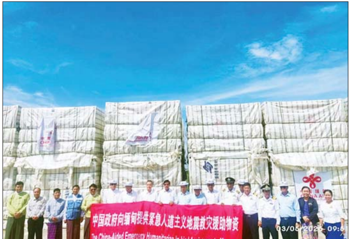
တရုတ်နိုင်ငံမှ လှူဒါန်းသည့် Prefabricated House များ ရန်ကုန်ဆိပ်ကမ်းတွင် လွှဲပြောင်း၊ လက်ခံမှု ဆောင်ရွက်စဉ်။

ငလျင်လှုပ်ခတ်ခဲ့သည့် ၂၈-၃-၂၀၂၅ ရက်နေ့မှ ယနေ့အထိ လှူဒါန်းပစ္စည်းများ ဖြန့်ခွဲပေးပို့မှု စုစု ပေါင်းမှာ မန္တလေးတိုင်းဒေသကြီးသို့ မော်တော်ယာဉ် ၅၆ စီး၊ စစ်ကိုင်းတိုင်းဒေသကြီးသို့ မော်တော်ယာဉ် ၂၈ စီး၊ ရှမ်းပြည်နယ်(တောင်ပိုင်း)သို့ မော်တော်ယာဉ် ၈ စီး ဖြစ်ပါသည်။ ဆက်လက်ထုတ်ပြန် နိုင်ငံတကာအလှူရှင်များမှ ၂၈-၄-၂၀၂၅ ရက်နေ့ မှ ၄-၅-၂၀၂၅ ရက်နေ့အထိ ရက်သတ္တပတ် ၁ ပတ် အတွင်း ပေးပို့လှူဒါန်းသည့်ပစ္စည်းများကို ပြည်ထောင်စု နယ်မြေ နေပြည်တော်နှင့် ရှမ်းပြည်နယ်(တောင်ပိုင်း) ရှိ ဘေးသင့်ပြည်သူများအတွက် ဖြန့်ခွဲပေးပို့ထားမှုကို ပူးတွဲပါဇယားများဖြင့် ဖော်ပြအပ်ပါသည်။ ထပ်မံ လှူဒါန်းလာသည့် ပစ္စည်းများရောက်ရှိမှုနှင့် ငလျင် ဘေးသင့်ပြည်သူများထံ အမြန်ဆုံးရောက်ရှိဖြန့်ခွဲမှု တို့ကို ၁ ပတ်လျှင် ၁ ကြိမ် ဆက်လက်ထုတ်ပြန်သွား မည်ဖြစ်ကြောင်း သတင်းထုတ်ပြန်အပ်ပါသည်။ သတင်းစဉ်