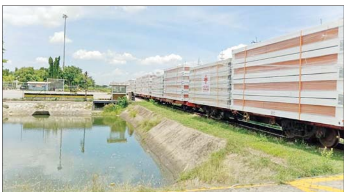
တရုတ်နိုင်ငံမှ လှူဒါန်းသည့် Prefabricated House များ ရန်ကုန်ဆိပ်ကမ်းမှ နေပြည်တော်သို့ မီးရထားဖြင့် သယ်ဆောင်စဉ်။