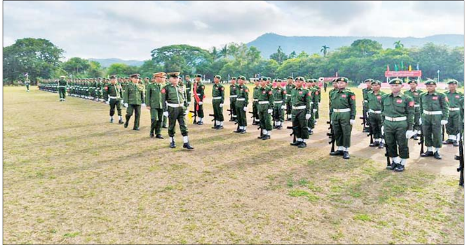
အရှေ့တောင်တိုင်းစစ်ဌာနချုပ် နယ်မြေခံသင်တန်းကျောင်း၌ ပြည်သူ့စစ်မှုထမ်းသင်တန်း အမှတ်စဉ်(၁၀) သင်တန်းဆင်းပွဲ ကျင်းပစဉ်။