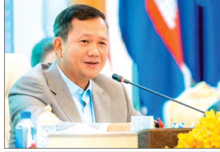
ကမ္ဘောဒီးယားဝန်ကြီးချုပ် ဟန့်မာနက်။

ဘဂ္ဂဒတ် မေ ၅ အီရတ်နိုင်ငံ ဘဂ္ဂဒတ်မြို့မြောက်ပိုင်း၌ မေ ၄ ရက်က တိုက်ပွဲဖြစ်ပွားသဖြင့် အိုင်အက်စ်စတီဗီသေဆုံးပြီး အီရတ်လုံခြုံရေးအဖွဲ့ဝင်တစ်ဦး ဒဏ်ရာရရှိခဲ့ကြောင်း လုံခြုံရေးသတင်းရင်းမြစ်တစ်ခုက ပြောကြားသည်။