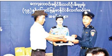
ကော့သောင်းခရိုင်မီးသတ်ဦးစီးမှူး (၇၉)နှစ်မြောက် မြန်မာနိုင်ငံမီးသတ်တပ်ဖွဲ့နေ့ အခမ်းအနား