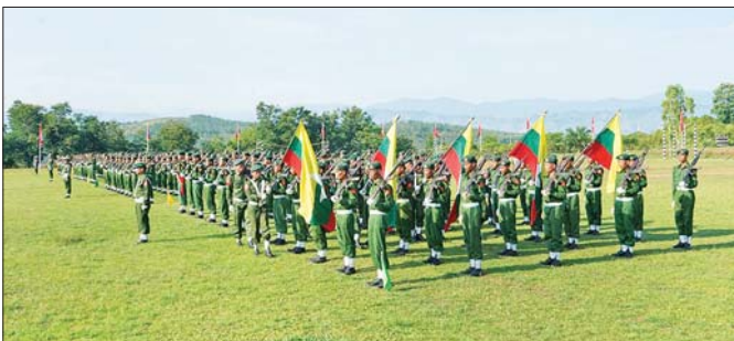
ရှမ်းပြည်နယ်(အရှေ့ပိုင်း) ကြိတ်ဒေသ တိုင်းစစ်ဌာနချုပ်နယ်မြေခံသင်တန်းကျောင်း၌ ပြည်သူ့စစ်မှုထမ်းသင်တန်း အမှတ်စဉ်(၁၀) သင်တန်းဆင်းပွဲ ကျင်းပစဉ်။