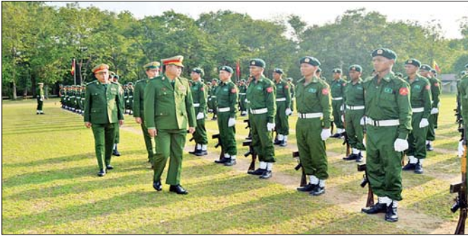
မိမိသဘောဆန္ဒအလျောက် ဆန္ဒပြုစာရင်းပေးသွင်းပြီး သင်တန်းတက်ရောက်ခဲ့ကြသည့် ပြည်သူ့စစ်မှုထမ်းသင်တန်း အမှတ်စဉ်(၁၀) သင်တန်းဆင်းပွဲ အခမ်းအနားတွင် ကျောင်းအုပ်ကြီးက သင်တန်းဆင်းတပ်ခွဲအား လိုက်လံစစ်ဆေးစဉ်။