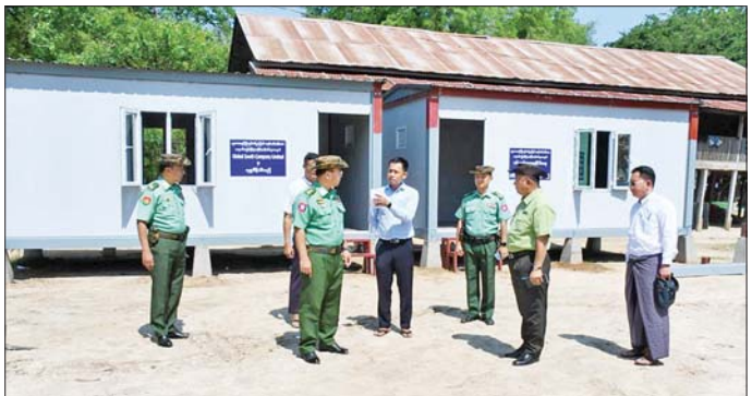
ကာကွယ်ရေးဦးစီးချုပ်ရုံး(ကြည်း)မှ ဒုတိယဗိုလ်ချုပ်ကြီး မျိုးသန့်နိုင် ကျောက်ဆည်မြို့ ခရိုင်အထွေထွေအုပ်ချုပ်ရေးမှူးရုံး၌ ဝန်ထမ်းများအတွက် ယာယီရုံးဖွင့်လှစ်ရန် Modular House များတည်ဆောက်ပြီးစီးမှုအခြေအနေနှင့် ပတ်ဝန်းကျင်ထိန်းသိမ်းရေးရုံး၌ Modular House များ ထပ်မံတည်ဆောက်နေမှုအခြေအနေများအား ကြည့်ရှုစစ်ဆေးစဉ်။

ထို့အတူ ကာကွယ်ရေးဦးစီးချုပ်ရုံး (ကြည်း)မှ ဒုတိယဗိုလ်ချုပ်ကြီး စိုးတင်နိုင်သည် တာဝန်ရှိသူများနှင့်အတူ မန္တလေးမြို့ ချမ်းအေးသာစံမြို့နယ်ရှိ ချမ်းသာရဆုတောင်းပြည့် မြတ်စွာဘုရား၊ မဟာအောင်မြေမြို့နယ်ရှိ ဝိဇ္ဇာလင်္ကာရကျောင်းတိုက်၊ အမရပူရမြို့နယ်ရှိ ရွှေကူကြီး ဆုတောင်းပြည့် မြတ်စွာဘုရား၊ အမှတ်(၁)အခြေခံပညာအထက်တန်းကျောင်း၊ ပလစ(၂) အခြေခံပညာနှင့်စက်မှုစိုက်ပျိုးမွေးမြူရေး အထက်တန်းကျောင်းတို့၌ ငလျင်ဒဏ်ကြောင့် ပြိုကျပျက်စီးခဲ့သည့် အပျက်အစီးများအား တပ်မတော်သားများ၊ မြန်မာနိုင်ငံရဲတပ်ဖွဲ့ဝင်များ၊ မီးသတ်တပ်ဖွဲ့ဝင်များ၊ ဌာနဆိုင်ရာဝန်ထမ်းများ၊ လူမှုကူညီရေးအသင်းအဖွဲ့များပူးပေါင်း၍ ကူညီကယ်ဆယ်ရေးလုပ်ငန်းများ အချိန်အဟန့်ဖြင့် ဆောင်ရွက်နေသည်များ၊ အပျက်အစီးများ ဖယ်ရှားရှင်းလင်းဆောင်ရွက်ပြီးစီးမှု အခြေအနေများ၊ ဘုရားစေတီပုထိုးများတွင် ရေမူပျက် ပြန်လည်ပြုပြင်တည်ဆောက်ရေးလုပ်ငန်းများ ဆောင်ရွက်နေမှု