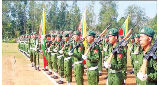
ရှမ်းပြည်နယ် (တောင်ပိုင်း) နယ်မြေခံသင်တန်းကျောင်း၌ ပြည်သူ့စစ်မှုထမ်းသင်တန်း အမှတ်စဉ်(၁၀) သင်တန်းဆင်းပွဲ ကျင်းပစဉ်။