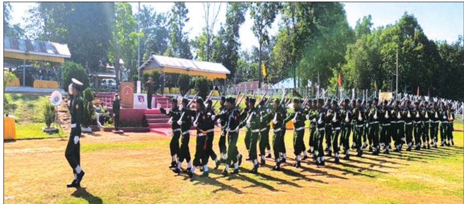
နိုင်ငံတော်ကာကွယ်ရေးနှင့် လုံခြုံရေးတာဝန်များကို စွမ်းစွမ်းတမံတာဝန်ထမ်းဆောင်ကြမည့် နိုင်ငံသားကောင်းများ၏ ပြည်သူ့စစ်မှုထမ်း သင်တန်းအမှတ်စဉ်(၁၀) သင်တန်းဆင်းပွဲ ကျင်းပစဉ်။

သင်တန်းဆင်းပွဲအခမ်းအနား များအပြီးတွင် သင်တန်းဆင်းပွဲ သို့ တက်ရောက်ကြသော နေပြည် တော်ကောင်စီဥက္ကဋ္ဌ တိုင်းဒေသ ကြီးနှင့် ပြည်နယ်ဝန်ကြီးချုပ်များ၊ တိုင်းမှူးများနှင့် တာဝန်ရှိသူ များက သင်တန်းကျောင်းခန်းမ များ၌ ပြည်သူ့စစ်မှုထမ်း သင်တန်းအမှတ်စဉ် (၁၀) မှ