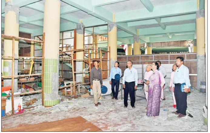
ရှိသည့် ဒီဇိုင်းကို ထည့်သွင်းစဉ်းစားတွက်ချက်၍ များထံ အလှူငွေများ ပေးအပ်ခဲ့ကြောင်း သိရသည်။ ပြုပြင်သွားရန် ဂေါပကအဖွဲ့ သတင်းစဉ်

မဟာမုနိဘုရားသို့ ရောက်ရှိကာ ငလျင်ဒဏ်ကြောင့် ပြုပျက်သွားသည့် အဆောက်အအုံများ ရှင်းလင်းရာတွင် သဲ၊ ခဲ ရှင်းလင်း၍ မုခ်များကြွေခိုင်းရေးလုပ်ငန်း ဆောင်ရွက်နေသည်များကို ကြည့်ရှုစစ်ဆေးပြီး လိုအပ်သည်များ မှာကြားကာ ဘုရားကြီးပြုပြင်မွမ်းမံရန်အတွက် ဂေါပကအဖွဲ့ထံ အလှူငွေများ ပေးအပ်သည်။ ယင်းနောက် ပြည်ကြီးတံခွန်မြို့နယ်ရှိ မြဝတီသီလရှင်စာသင်တိုက်ရှိ ငလျင်ဒဏ်သင့် အဆောက်အအုံများ၊ ချမ်းအေးသာစံမြို့နယ်၊ ၈၂ လမ်း၊ ၃၃၇၄ လမ်းကြားတွင် တည်ရှိသည့် မြို့မနတ်ခြင်းအသင်းတော်ဘုရားကျောင်း (မေရီဘုရားရှိခိုးကျောင်း)၊ ပင်းယဂူကြီးသုံးလုံး၊ သတ္တဌာနဝင် ရွှေစည်းခုံစေတီတော်ကြီး၊ ချမ်းမြသာစည်မြို့နယ် တမ္ပဝတီရပ်ကွက်ရှိ မဟာစန္ဒာမုနိစေတီတော်၊ ရှင်လွန်းမယ်ဘုရား၊ မြေစွန်းဝန်ဘုရား၊ သားတော်ရဘုရားများသို့ သွားရောက် ကြည့်ရှုစစ်ဆေးပြီး ထိခိုက်ပျက်စီးမှုများအား ထိန်းသိမ်းရေး ဆောင်ရွက်ရာတွင် နောင်ဖြစ်ပေါ်လာနိုင်သည့် သဘာဝဘေးအန္တရာယ်များပါ ဝင်နိုင်ရည်