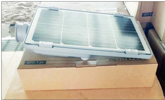
အိန္ဒိယနိုင်ငံနှင့် မလေးရှားနိုင်ငံတို့မှ ကူညီထောက်ပံ့ပစ္စည်းများ ရောက်ရှိလာစဉ်။