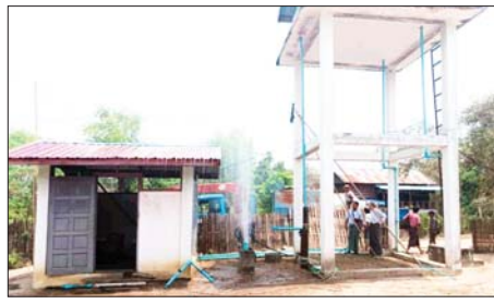
ကျေးရွာရှိရေကန်များအတွင်းကလို ရင်း ဆေးမှုနှင့် ဆက်စပ်ပြီး ရေသန့် ဆေးများ ဖြန့်ဝေခြင်းများကို

နေပြည်တော် မေ ၅ ရွာမကျေးရွာများ၌ ပုဂ္ဂလိက ပြည်ထောင်စုနယ်မြေ နေပြည် တော်လယ်ဝေးမြို့နယ်ကျေးလက် တွင်းတိမ် / တွင်းနက်များကို ဒေသဖွံ့ဖြိုးတိုးတက်ရေးဦးစီးဌာန က မန္တလေး ငလျင်ကြီးကြောင့် ထိခိုက်ပျက်စီးမှုများ ဖြစ်ပေါ်ခဲ့ရာ သည့် ရွာမကျေးရွာနေ ပြည်သူ များ၏ တောင်းဆိုချက်များကို သန့်ရှင်း သော သောက်ရေရရှိရေးအတွက် တွင်းဆေး၊ တွင်းမှတ် ခြင်းနှင့် ဆက်စပ်လုပ်ငန်းများ ဆောင်ရွက်ခြင်းဖြစ်ပြီး သောက်ရေသုံး ရေများ ဖူလုံ နေမှုနှင့် သုံးစွဲနေမှုအခြေအနေ များကို မြို့နယ်ကျေးလက်ဒေသ တွင်းမှတ် ဆောင်ရွက်ခြင်းနှင့် ဖွံ့ဖြိုးတိုးတက်ရေး ဦးစီးဌာနမှ ခေါ်ကျော့ကျော့ခိုင်နှင့် တာဝန်ရှိသူများ ပူးပေါင်းဆောင်ရွက်ခဲ့သည်။