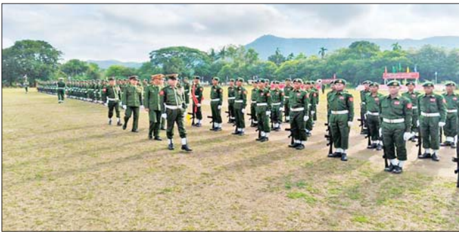
အရှေ့တောင်တိုင်းစစ်ဌာနချုပ် နယ်မြေခံသင်တန်းကျောင်း၌ ပြည်သူ့စစ်မှုထမ်းသင်တန်း အမှတ်စဉ်(၁၀) သင်တန်းဆင်းပွဲ ကျင်းပစဉ်။