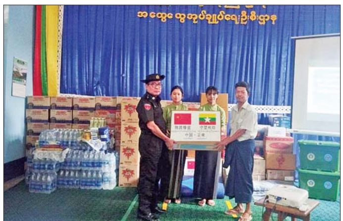
မန္တလေးတိုင်းဒေသကြီးအတွင်း နိုင်ငံတကာမှပေးအပ်သည့် အလှူပစ္စည်းများ ဖြန့်ခွဲပေးအပ်စဉ်။