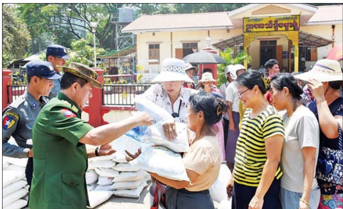
ရေးဆိုင်ရာလိုအပ်ချက်များကို ကူညီဖြည့်တင်းပေး နှင့် ညှိနှိုင်းပေါင်းစပ်ဆောင်ရွက်ပေးခဲ့ကြောင်း ရေးတို့နှင့်စပ်လျဉ်း၍ သက်ဆိုင်ရာ တာဝန်ရှိသူများ သတင်းရရှိသည်။

ထို့နောက် ပြည်ထောင်စုဝန်ကြီးနှင့် တာဝန်ရှိသူများက ပြည်ထောင်စုဝန်ကြီးဌာနအောက်ရှိ ပြည်ထောင်စုဝန်ကြီးရုံးနှင့် တပ်ဖွဲ့၊ ဦးစီးဌာနများမှ ငလျင်ဘေးသင့်အိမ်ထောင်စုတစ်စုချင်းစီအတွက် ဆန်၊ ဆီ၊ ဆား၊ ငါးသေတ္တာ၊ ရေသန့်၊ ဓာတ်ဆား၊ ကိတ်ခြောက်စသည် လှည့်ပေးပစ္စည်းများ၊ သွားတိုက်ဆေး၊ သွားတိုက်တံ၊ ဆပ်ပြာ စသည့် တစ်ကိုယ်ရေသုံးပစ္စည်းများကို ထောက်ပံ့ပေးအပ်သည်။ ထိုသို့တွေ့ဆုံအားပေးစဉ် ပြည်ထောင်စုဝန်ကြီးသည် ယာယီပြောင်းရွှေ့နေထိုင်မည့် နေရာများသို့ ဝန်ထမ်းများနှင့် မိသားစုဝင်များ၏ ပစ္စည်းများ ပြောင်းရွှေ့ရာတွင် စနစ်တကျဖြစ်စေရေး၊ ကူညီသယ်ယူပို့ဆောင်ပေးစေမှု၊ လုံခြုံမှုရှိစေရေး၊ သောက်ရေနှင့် သုံးရေရရှိရေး၊ ဆက်သွယ်မှုမပြတ်တောက်စေရေးနှင့် ယာယီပြောင်းရွှေ့နေထိုင်မည့် နေရာများတွင် နေထိုင်စားသောက်ရေးနှင့် ကျန်းမာရေးဆိုင်ရာလိုအပ်ချက်များကို ကူညီဖြည့်တင်းပေး နှင့် ညှိနှိုင်းပေါင်းစပ်ဆောင်ရွက်ပေးခဲ့ကြောင်း ရေးတို့နှင့်စပ်လျဉ်း၍ သက်ဆိုင်ရာ တာဝန်ရှိသူများ သတင်းရရှိသည်။