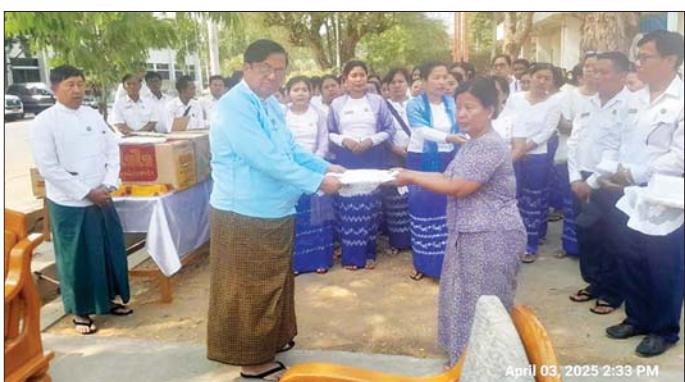
၂၈ သိန်း စုစုပေါင်းငွေကျပ် ၂၂၃ သိန်းနှင့် အသင့်စားခေါက်ဆွဲများ၊ ဆီများ၊ အာဟာရမုန့်များကို ထောက်ပံ့ပေးခဲ့ကြောင်း သတင်းရရှိသည်။

မှတ်တမ်းများနှင့်အတူ စနစ်တကျ မှတ်တမ်းတင်ထားရန်၊ အမျိုးသားသဘာဝဘေးအန္တရာယ်ဆိုင်ရာ စီမံခန့်ခွဲမှုကော်မတီမှ ထုတ်ပြန်သည့် သတင်းအချက်အလက်၊ အမိန့်၊ ညွှန်ကြားချက်များကို အမြဲမပြတ် လေ့လာဖတ်ရှု၍ လိုက်နာဆောင်ရွက်ရန်မှာကြားပြီး ဝန်ထမ်းများအား ရင်းရင်းနှီးနှီးတွေ့ဆုံ၍ အားပေးစကား ပြောကြားသည်။ ထို့နောက် ပြည်ထောင်စုဝန်ကြီးသည် အမှတ်(၂)စက်မှုသင်တန်းကျောင်း(မန္တလေး) တွင် တာဝန်ထမ်းဆောင်လျက်ရှိသည့် ဝန်ထမ်း ၅၆ ဦး၊ ဆပ်ပြာစက်ရုံ (မန္တလေး)မှ ဝန်ထမ်း ၄၃ ဦး၊ မန္တလေးတိုင်းဒေသကြီး စက်မှု