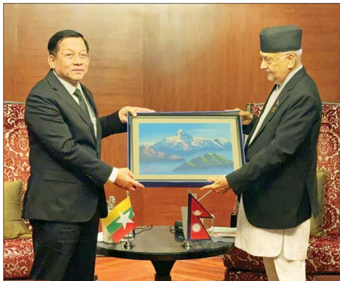
နိုင်ငံတော်စီမံအုပ်ချုပ်ရေးကောင်စီဥက္ကဋ္ဌ နိုင်ငံတော်ဝန်ကြီးချုပ် ဗိုလ်ချုပ်မှူးကြီးမင်းအောင်လှိုင်နှင့် နီပေါနိုင်ငံဝန်ကြီးချုပ် Rt. Hon. Mr. K P Sharma Oli တို့ အမှတ်တရလက်ဆောင်ပစ္စည်းများ အပြန်အလှန်ပေးအပ်စဉ်။