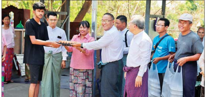
နေပြည်တော် ဧပြီ ၃ ဥပဒေရေးရာဝန်ကြီးဌာန ပြည်ထောင်စုဝန်ကြီးနှင့် ပြည်ထောင်စုရှေ့နေချုပ် ဒေါက်တာ သိတာဦး၊ ဒုတိယဝန်ကြီးနှင့် ဒုတိယရှေ့နေချုပ် ဒေါက်တာထိန်လင်းဦး၊ ညွှန်ကြားရေးမှူးချုပ်များ၊ ဒုတိယအမြဲတမ်းအတွင်းဝန်နှင့် တာဝန်ရှိသူများသည် ယနေ့နံနက်ပိုင်းက ရုံးအမှတ် ၂၅၊ ဥပဒေရေးရာဝန်ကြီးဌာန အဆောက်အအုံပြင်လုပ်ငန်းဆောင်ရွက်နေစဉ် တာဝန်ရှိသူများနှင့် တွေ့ဆုံအားပေးစကားပြောကြား၍ ထောက်ပံ့ပစ္စည်းများ ပေးအပ်သည်။

တွင် ယာယီရုံးခန်း ဖွင့်လှစ်ဆောင်ရွက်လျက်ရှိသည့် ယာယီရုံးခန်းကို ကြည့်ရှုစစ်ဆေးခဲ့သည်။ ထိုသို့ ကြည့်ရှုစစ်ဆေးရာတွင် ယာယီရုံးခန်း၌ ဝန်ကြီးဌာန၊ ဦးစီးဌာနအသီးသီး၏ ရုံးလုပ်ငန်းဆောင်ရွက်နေမှုများကို ကြည့်ရှုစစ်ဆေးပြီး တင်ပြချက်များအား ဖြည့်ဆည်း ဆောင်ရွက်ပေးခဲ့သည်။ ထို့နောက် ယာယီနေထိုင်သူများ နေထိုင်စားသောက်မှုအဆင်ပြေစေရန် အလှူဒါန်းများ မှလှူဒါန်းသော ထမင်း၊ ဟင်းများနှင့် အသုံးအဆောင်ပစ္စည်းများ