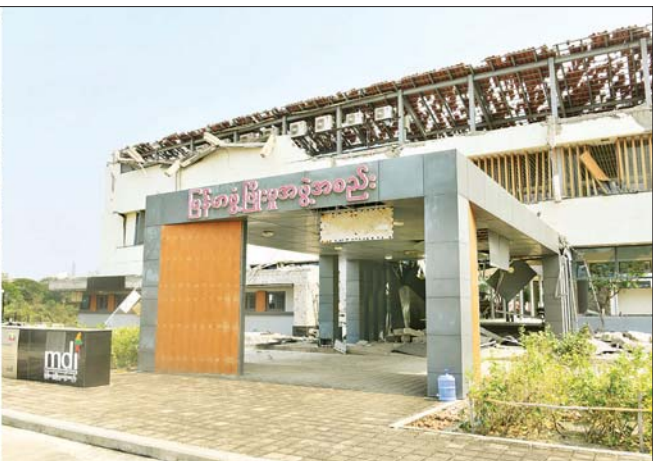
နိုင်ငံတော်စီမံအုပ်ချုပ်ရေးကောင်စီဒုတိယဥက္ကဋ္ဌ ဒုတိယဝန်ကြီးချုပ် ဒုတိယဗိုလ်ချုပ်မှူးကြီး စိုးဝင်း ဒက္ခိဏသီရိမြို့နယ် သံတမန်ဇုန် သဇင်လမ်းနှင့် မြစ်မလမ်းထောင့်ရှိ မြန်မာ့ဖွံ့ဖြိုးမှုအဖွဲ့အစည်းရုံး(MCI) အဆောက်အအုံ ငလျင်ဒဏ်ကြောင့် ထိခိုက်ပျက်စီးမှုကို ကြည့်ရှုစစ်ဆေးစဉ်။

ပြန်လည်ပြုပြင်ဆောင်ရွက် ထိုနောက် နိုင်ငံတော်စီမံအုပ်ချုပ်ရေးကောင်စီ ဒုတိယဥက္ကဋ္ဌ ဒုတိယဝန်ကြီးချုပ်နှင့် အဖွဲ့ဝင်များသည် နေပြည်တော် ကောင်စီနယ်မြေအတွင်းသို့ သောက်သုံးရေများ ဖြန့်ဝေပေးသည့် ဒက္ခိဏသီရိမြို့နယ်ရှိ ရန်အောင်မြင်တစ် ငလျင်ဒဏ်ကြောင့် တစ်ဖျားထိခိုက်ပျက်စီးမှု အခြေအနေများကို သွားရောက်ကြည့်ရှုစစ်ဆေးပြီး တာဝန်ရှိသူများ၏ ရှင်းလင်းတင်ပြချက်များအပေါ် သိရှိလိုသည်များ မေးမြန်းဆွေးနွေးပြီး လိုအပ်သည်များ လမ်းညွှန်မှာကြား