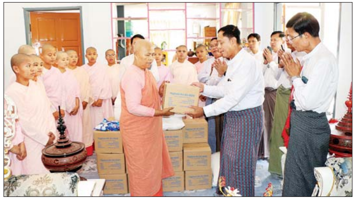
ပြီး ပြည်ထောင်စုဝန်ကြီးက ဝန်ထမ်းများ ရုံးလုပ်ငန်း ဆောင်ရွက်သွားရန် မှာကြားခဲ့ကြောင်း သတင်းများဆောင်ရွက်ရာတွင် ဘေးအန္တရာယ်ကင်းရှင်းစေ ရန်ကြိုးပမ်း ဆောင်ရွက်ခဲ့ကြောင်း သတင်းစဉ်

နှင့်အဖွဲ့သည် အသေးစား စက်မှုလက်မှုလုပ်ငန်းဦးစီးဌာန၏ ဆရာဒကာကျောင်းဖြစ်သော ဒဏ္ဍိဏသီရိမြို့နယ် မှန်တောကျောင်းတိုက်သို့ သွားရောက်ကာ ကျောင်းထိုင်ဆရာတော်အား ဖူးမြော်ကြည်ညို၍ ဆန်၊ ဆီနှင့် လျှာဖွယ် ပစ္စည်းများ ဆက်ကပ်လျှော့ဒါန်းပြီး ကျေးလက်ဒေသ ဖွံ့ဖြိုးတိုးတက်ရေးဦးစီးဌာနက ရွှေ့လျားရေးသန့်စင်ကားဖြင့် သပြေကုန်းရပ်ကွက် သပြေကုန်းဈေးရှိ ငလျင်ဘေးသင့် ပြည်သူများအား သောက်သုံးရေသန့် ဂါလန် ၁၆၀၀ ဖြန့်ဝေပေးနေမှုကို ကြည့်ရှုစစ်ဆေးသည်။ ဆက်လက်၍ ငလျင်ဘေးကြောင့် သမဝါယမနှင့် ကျေးလက်ဖွံ့ဖြိုးရေးဝန်ကြီးဌာန ပြည်ထောင်စုဝန်ကြီးရုံး၊ သမဝါယမဦးစီးဌာန၊ ကျေးလက်ဒေသဖွံ့ဖြိုးတိုးတက်ရေးဦးစီးဌာန၊ အသေးစားစက်မှုလက်မှုလုပ်ငန်းဦးစီးဌာန၊ ကျေးလက်လမ်းဖွံ့ဖြိုးရေးဦးစီးဌာနများ၏ ရုံးအဆောက်အအုံပျက်စီးမှုနှင့် ယာယီရုံးဖွင့်လှစ်ဆောင်ရွက်နေမှုကို ကြည့်ရှုစစ်ဆေး