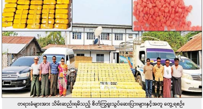
တရားခံများအား သိမ်းဆည်းရမိသည့် စိတ်ကြွရှားသွပ်ဆေးပြားများနှင့်အတူ တွေ့ရစဉ်။