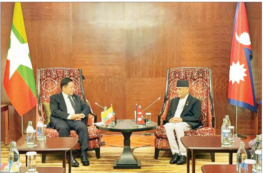
နိုင်ငံတော်စီမံအုပ်ချုပ်ရေးကောင်စီဥက္ကဋ္ဌ နိုင်ငံတော်ဝန်ကြီးချုပ် ဗိုလ်ချုပ်မှူးကြီးမင်းအောင်လှိုင်နှင့် နီပေါနိုင်ငံဝန်ကြီးချုပ် Rt. Hon. Mr. K P Sharma Oli တို့ တွေ့ဆုံဆွေးနွေးစဉ်။

နေပြည်တော် ဧပြီ ၃ ထိုင်းနိုင်ငံတွင် အိမ်ရှင်အဖြစ် လက်ခံကျင်းပမည့် BIMSTEC အစည်းအဝေးသို့ တက်ရောက်ရန်ရောက်ရှိ နေသော နိုင်ငံတော်စီမံအုပ်ချုပ်ရေးကောင်စီဥက္ကဋ္ဌ နိုင်ငံတော် ဝန်ကြီးချုပ် ဗိုလ်ချုပ်မှူးကြီး မင်းအောင်လှိုင် သည် နီပေါနိုင်ငံဝန်ကြီးချုပ် Rt. Hon. Mr. K P Sharma Oli နှင့် ယနေ့ဒေသစံတော် ချိန် ညနေပိုင်းတွင် ဗန်ကောက်မြို့ရှိ Shangri - La ဟိုတယ်၌ တွေ့ဆုံဆွေးနွေးသည်။ ထိုသို့တွေ့ဆုံဆွေးနွေးရာတွင် ဦးစွာ နီပေါနိုင်ငံ ဝန်ကြီးချုပ်က မကြာခင်က မြန်မာနိုင်ငံတွင် ပြင်းထန်စွာလျှင်လျှင်ခတ်ခဲ့မှုကြောင့် မိမိနှင့်အတူ နီပေါပြည်သူများက မြန်မာပြည်သူများနှင့်အတူ ထပ်တူဝမ်းနည်းရပါကြောင်း၊ မိမိတို့နိုင်ငံအနေဖြင့် လည်း ဆေးကုသရေးအဖွဲ့များအပါအဝင် ကူညီ ကယ်ဆယ်ရေးအဖွဲ့များကို စေလွှတ်ထားပြီးဖြစ်ပါ ကြောင်း၊ မိမိတို့နိုင်ငံ၌ ၂၀၁၅ ခုနှစ်အတွင်း လျင် လျင်ခတ်ခဲ့စဉ်ကလည်း သေဆုံးသူ ၉၀၀၀ ကျော်ခန့် ရှိပြီး ထိခိုက်သူ ၂၀၀၀ ကျော်ရှိခဲ့ပြီး လျင်လျင်ခတ် မှုကြောင့် ထိခိုက်ပျက်စီးမှုဖြစ်ပေါ်ခဲ့သည့် အဆောက် အအုံများ ပြန်လည်ထူထောင်ရေးအတွက်လည်း ဆောင်ရွက်ခဲ့ကြောင်း၊ မိမိတို့ နီပေါနိုင်ငံအနေဖြင့် မြန်မာနိုင်ငံနှင့် ချစ်ကြည်ရင်းနှီးသည့် နိုင်ငံဖြစ်ပြီး နှစ်နိုင်ငံအကြား ချစ်ကြည်ရင်းနှီးမှုနှင့် ပူးပေါင်း ဆောင်ရွက်မှုများကို ဆက်လက်တိုးမြှင့်ဆောင်ရွက် သွားမည်ဖြစ်ပါကြောင်းဖြင့် ပြောကြားသည်။ စာမျက်နှာ ၄ ကော်လံ ၁ ၀