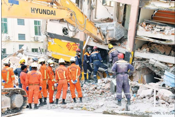
မန္တလေးမြို့တွင် ငလျင်ဒဏ်ခံရသည့် အဆောက်အအုံတစ်ခုကို ဖျက်ဆီးနေကြောင်း မြင်ရသည်။

ပေးသွားမည်ဖြစ်ပြီး တစ်ရက်လျှင် လာရောက်ကုသသူ ၂၀ မှ ၃၀ ရှိ ကြောင်း၊ မိမိတို့သည် အဆွေတော် တို့နှင့် အတူတူရှိနေပြီး လိုအပ် သည့်အကူအညီတိုင်းကို ကူညီရန် အသင့်ရှိနေပါကြောင်း ပြောကြား သည်။ ထို့နောက် ရုရှားမီးသတ် တပ်ဖွဲ့ ခေါင်းဆောင် ဗိုလ်မှူးကြီး Mr . Dmitry က မြန်မာနိုင်ငံကို လွန်ခဲ့သည့် ရက်အနည်းငယ်က စတင်ရောက်ရှိခဲ့ပါကြောင်း၊ ရုရှားပက်ဒရေးရှင်း နိုင်ငံ သမ္မတနှင့် ဝန်ကြီးတို့၏ စေလွှတ် မှုနှင့်အတူ ရုရှားကယ်ဆယ်ရေး အဖွဲ့ မြန်မာနိုင်ငံသို့ ရောက်ရှိပြီး အပတ်တလောတွင် မန္တလေးမြို့၌ နေရာများခွဲ၍ လိုအပ်သည့် ကယ်ဆယ်ရေး လုပ်ငန်းများကို ဆောင်ရွက်လျက် ရှိပါကြောင်း၊ လူအင်အား ၂၆၀ ဝန်းကျင်ဖြင့် အရေးကြီးလိုအပ်သည့် နေရာများ ကို ဦးစားပေးကူညီဆောင်ရွက် လျက်ရှိပြီး အချို့နေရာများတွင် ဆောင်ရွက်ပြီး ဖြစ်ပါကြောင်း၊ နိုင်ငံတကာ ကယ်ဆယ်ရေးအဖွဲ့ များနှင့်အတူ ပူးပေါင်းဆောင်ရွက် နေကြောင်းပြောကြားသည်။ မိတ်ဆွေတို့အနေဖြင့် စိတ်ရှည်ရှည် ထား၊ အားတင်းထား၊ ရုရှား ကယ်ဆယ်ရေး အဖွဲ့များက မြန်မာပြည်သူ ပြည်သားများ၏ မျှော်လင့်ချက်များကို ဖြည့်ဆည်း ပေးရန်အတွက် ရောက်ရှိနေခြင်း ဖြစ်ပါကြောင်း၊ အားလုံးအနာဂတ် မှာ ကောင်းမွန်သွားပါလိမ့်မည်၊ အားတင်းထားပါဟု အားပေး ပြောကြားသည်။