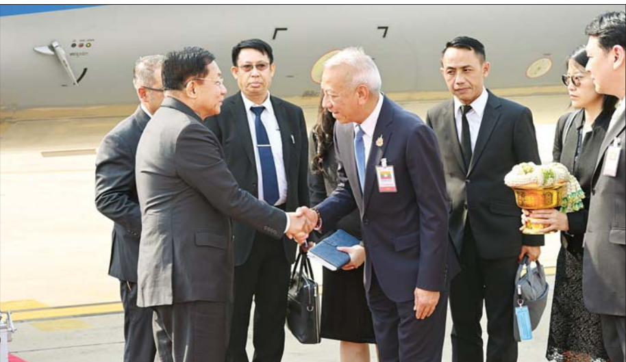
နိုင်ငံတော်စီမံအုပ်ချုပ်ရေးကောင်စီဥက္ကဋ္ဌ နိုင်ငံတော်ဝန်ကြီးချုပ် ဗိုလ်ချုပ်မှူးကြီး မင်းအောင်လှိုင် အား ထိုင်းနိုင်ငံ ဒွန်မောင်းလေဆိပ် (Wing- 6) ၌ ထိုင်းနိုင်ငံ အလုပ်သမားဝန်ကြီး H.E. Mr. Phiphat Ratchakitprakan နှင့် တာဝန်ရှိသူများက ကြိုဆိုနှုတ်ဆက်စဉ်။

တွင် ကြိုဆိုနှုတ်ဆက်ကြသည်။ တွေ့ဆုံဆွေးနွေး ခရီးစဉ်အတွင်း နိုင်ငံတော်စီမံအုပ်ချုပ်ရေးကောင်စီဥက္ကဋ္ဌ နိုင်ငံတော်ဝန်ကြီးချုပ်သည် ဆဋ္ဌမအကြိမ်မြောက် ဘင်းမိစတင်ထိပ်သီး အစည်းအဝေးသို့ တက်ရောက်ခြင်းနှင့် ခရီးစဉ်အတွင်း အစည်းအဝေးသို့ တက်ရောက်လာကြသည့် အစိုးရအဖွဲ့အကြီးအကဲများနှင့် တွေ့ဆုံဆွေးနွေး၍ မြန်မာနိုင်ငံတွင် ငလျင်သဘာဝဘေးဒဏ်ကြောင့် ဖြစ်ပေါ်ကြုံတွေ့နေရသည့် အခြေအနေများ၊ ကူညီကယ်ဆယ်ရေးနှင့် ပြန်လည်ထူထောင်ရေး လုပ်ငန်းများကို ထိရောက်စွာ ဆောင်ရွက်နိုင်ရန် နိုင်ငံတကာနှင့် ပူးပေါင်းဆောင်ရွက်နိုင်မည့် အခြေအနေများအား ဆွေးနွေးဆောင်ရွက်သွားမည်ဖြစ်ကြောင်း သတင်းရရှိသည်။ သတင်းစဉ်