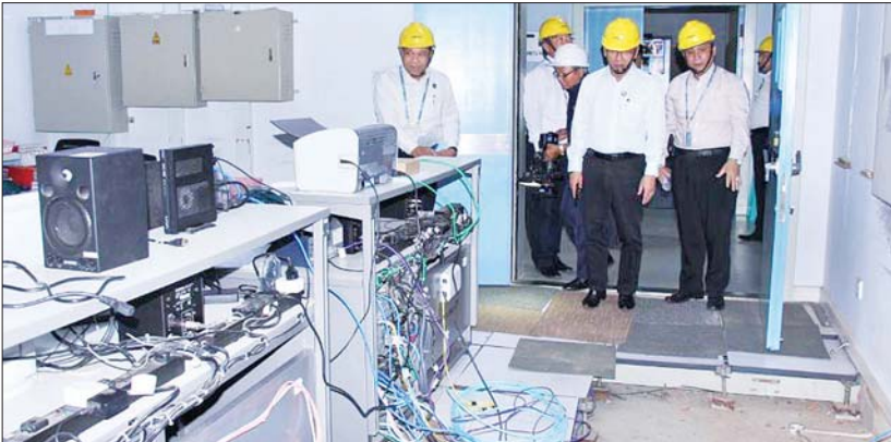
ပြည်ထောင်စုဝန်ကြီး ဦးမောင်မောင်အုန်း တပ်ကုန်းမြို့ရှိ မြန်မာ့အသံနှင့် ရုပ်မြင်သံကြား၌ မြေလျင်ဒဏ်ကြောင့် ထိခိုက်ပျက်စီးမှုနှင့် ဆောင်ရွက်ထားရှိမှုကို ကြည့်ရှုစစ်ဆေးစဉ်။

သတင်းထုတ်ပြန်နိုင်ရန်ဆောင်ရွက်ယင်းနောက် ပြည်ထောင်စုဝန်ကြီးက အမှတ်စဉ် ၂၈ ရက်က လူပိတ်ခတ်ခဲ့သော အင်အားပြင်း ငလျင်ဒဏ်ကြောင့် ထိခိုက်ပျက်စီးမှုများအား ကြည့်ရှုစစ်ဆေးနိုင်ရန် ဝန်ထမ်းများအား တွေ့ဆုံအားပေးလေ့လာရောက်ခြင်းဖြစ်ပါကြောင်း၊ အမျိုးသမီးဝန်ထမ်းတစ်ဦးသာ (မစိုးရိမ်ရ) ထိခိုက်ဒဏ်ရာရရှိခဲ့ပြီး အခြားထိခိုက်ဒဏ်ရာရမှု မရှိသည့်အတွက် ဝမ်းသာပါကြောင်း၊ ထုတ်လွှင့်မှုပိုင်းဆိုင်ရာများ ထိခိုက်ချက်လျှော့မရှိသည့်အပြင် ဝန်ထမ်းများက ထိခိုက်ဒဏ်ရာဆောင်ရွက်နိုင်မှုကြောင့် စဉ်ဆက်မပြတ် ထုတ်လွှင့်နိုင်မှုအပေါ်လည်း ချီးကျူးဂုဏ်ပြုအသိပေးပါကြောင်း၊ ငလျင်ဒဏ်သင့်ဒေသများအလိုက် ဖြစ်ပွားမှု ရှာဖွေကုညီမှုနှင့် ကယ်ဆယ်ရေးဆောင်ရွက်မှု၊ ရှင်းလင်းရေးနှင့် ပြန်လည်