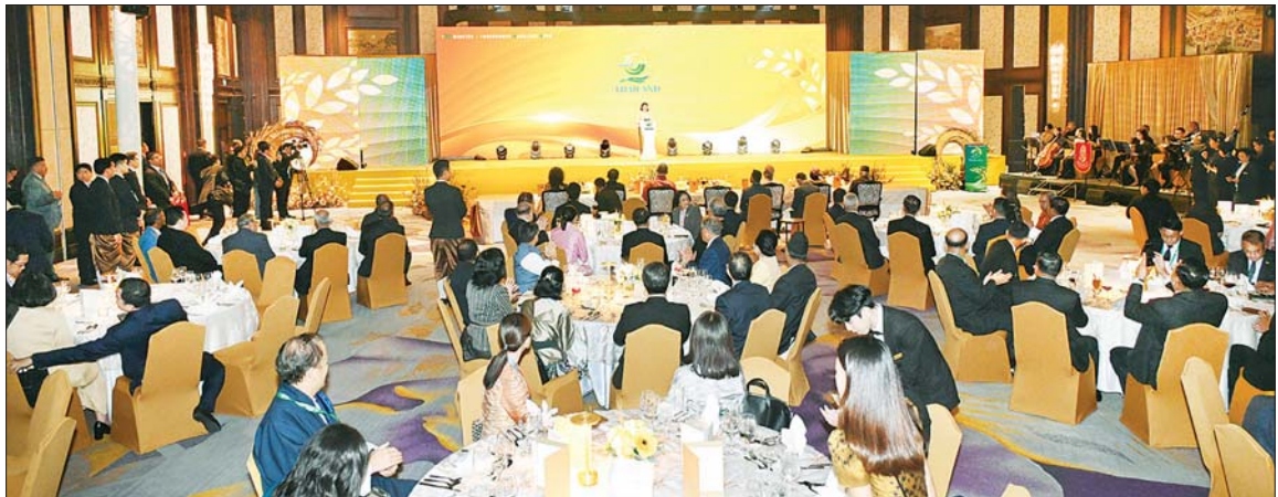
နိုင်ငံတော် စီမံအုပ်ချုပ်ရေးကောင်စီဥက္ကဋ္ဌ နိုင်ငံတော်ဝန်ကြီးချုပ် ဗိုလ်ချုပ်မှူးကြီးမင်းအောင်လှိုင်အား ဘင်းမိစတက် အလှည့်ကျဥက္ကဋ္ဌ ထိုင်းနိုင်ငံဝန်ကြီးချုပ် H.E. Ms. Paetongtarm Shinawatra ကြိုဆိုနှုတ်ဆက်စဉ်။