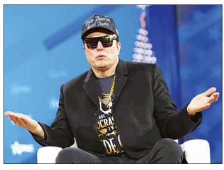
ဘီလျံနာသူဌေးကြီးဖြစ်သူ အီလွန်မက်စ်။

ဝါရှင်တန် ဧပြီ ၃ အမေရိကန်သမ္မတ ဒေါ်နယ်ထရမ်က အီလွန်မက်စ်သည် ၎င်း၏ အစိုးရရာထူးမှ နောက်ဆုတ်သွားဖွယ်ရှိသည်ဟု အတွင်းလူများကို ပြောထားကြောင်း အမေရိကန်သတင်းဝက်ဘ်ဆိုက်ဖြစ်သည့် ပိုလစ်တီကိုတွင် ဖော်ပြထားသည်။ ဘီလျံနာသူဌေးကြီးဖြစ်သူ အီလွန်မက်စ်သည် ဒီအိုဂျီအီးဟု ခေါ်ဝေါ်သည့် ဝန်ထမ်းလျှော့ချရေးနှင့် အသုံးစရိတ်လျှော့ချရေးဌာနကို ဦးဆောင်သူလည်းဖြစ်သည်။ အမေရိကန်သမ္မတ ထရမ်သည် အီလွန်မက်စ်နှင့် ဒီအိုဂျီအီးဌာန၏ လုပ်ဆောင်မှုများကို ကျေနပ်အားရ ဆဲဖြစ်ကြောင်း သို့သော်လည်း အီလွန်မက်စ်သည် ၎င်း၏စီးပွားရေး လုပ်ငန်းများဆီပြန်သွားရန် အချိန်ဖြစ်သည်ဟု မကြာသေးမီက နှစ်ဦးသားတွေ့ဆုံစဉ် ဆုံးဖြတ်ခဲ့ကြောင်း ဧပြီ ၂ ရက်ထုတ် သတင်းတွင် ဖော်ပြထားသည်။ ထရမ်အစိုးရအဖွဲ့ အပြင်ပိုင်းနှင့်အတွင်းပိုင်းရှိ လူများသည် အီလွန်မက်စ်၏ ခန့်မှန်းမရနိုင်သော လုပ်ဆောင်မှုများကို စိတ်ပျက်နေကြကြောင်း ပိုလစ်တီကိုတွင် ဖော်ပြထားသည်။ ယခုနှစ် ပထမလေးလအတွင်း အီလွန်မက်စ်၏ တက်စလာကားကုမ္ပဏီသည် အရောင်းပိုင်း၌ ၁၃ ရာခိုင်နှုန်းကျဆင်းခဲ့ကြောင်း သိရသည်။ အီလွန်မက်စ်၏ နိုင်ငံရေးကျင့် ပါဝင်တတ်သကဲ့သို့အတွက်