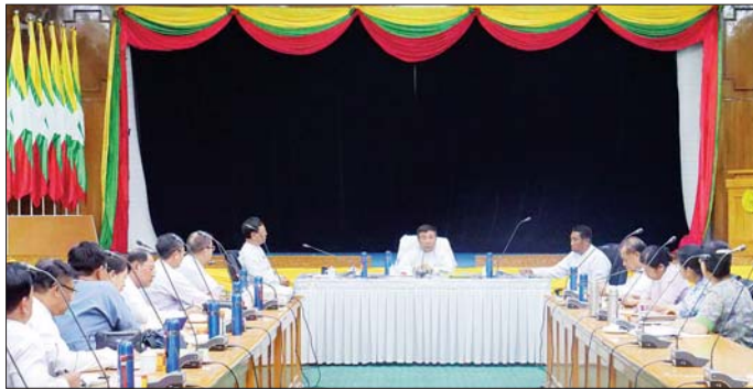
အလိုက် ပျက်စီးဆုံးရှုံးခဲ့သည့် နောက်ဆုံးအခြေအနေ များကို သတ်မှတ်ထားသည့် စာရင်းစာယင်းပုံစံဖြင့် စနစ်တကျကောက်ယူကြရမည် ဖြစ်ပါကြောင်း၊ ငလျင်ဘေးဒဏ်ဆိုင်ရာ ဝန်ထမ်းများနှင့် မိသားစု

နေပြည်တော် ဧပြီ ၃ ပညာရေးဝန်ကြီးဌာန၏ ငလျင်ဘေးဒဏ်ဆိုင်ရာ စီမံခန့်ခွဲမှုလုပ်ငန်းညှိနှိုင်းအစည်းအဝေးကို ယနေ့ နံနက်ပိုင်းတွင် နေပြည်တော် ပညာရေးဝန်ကြီးဌာန ရုံးအမှတ် ၁၃ ရှိ အစည်းအဝေးခန်းမ၌ ကျင်းပရာ ပညာရေးဝန်ကြီးဌာန ပြည်ထောင်စုဝန်ကြီး ဒေါက်တာညွန့်ဖေ၊ ဒုတိယဝန်ကြီး ဒေါက်တာ စော်မြင့်နှင့် ဦးနေမျိုးလှိုင်၊ ဦးစီးဌာနများမှ ညွှန်ကြားရေးမှူးချုပ်များ၊ ဒုတိယအမြဲတမ်းအတွင်းဝန်များ၊ ဒုတိယညွှန်ကြားရေးမှူးချုပ်များနှင့် တာဝန်ရှိသူများ တက်ရောက်ကြသည်။