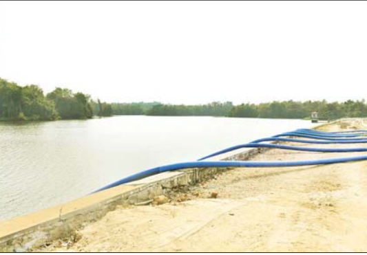
နိုင်ငံတော်စီမံအုပ်ချုပ်ရေးကောင်စီဒုတိယဥက္ကဋ္ဌ ဒုတိယဝန်ကြီးချုပ် ဒုတိယဗိုလ်ချုပ်မှူးကြီး စိုးဝင်း ဧမ္မာသီရိမြို့နယ်ရှိ ရေခန်းတစ် ငလျင်ဒဏ်ကြောင့် ထိခိုက်ပျက်စီးမှုအခြေအနေကို ကြည့်ရှုစစ်ဆေးစဉ်။

သည်။ အဆိုပါ ရန်အောင်မြင်တစ်သည် မြို့ရေပေးဝေရေးတစ်စိတ်တစ်ပိုင်း ပံ့ပိုးပေးနေသည့် မြေသားတစ် အမျိုးအစားဖြစ်ပြီး တစ်အမြင့် ၃၆ ပေ၊ တစ်အလျားပေ ၄၀၆၀၊ ရေဆင်းစရိယာမှာ ၁၁ စတုဂံရန်းမိုင်ရှိပြီး ကျန်းကျောတစ်၏ ကန်ရေအပြည့်အမှတ် Full Tank Level အထက်တွင် မြေသားပေ ၃ ပေမှာ မြေငလျင်ဒဏ်ကြောင့် မြေသားများကျိုးပြတ် ပြိုကျအက်ကွဲမှု (Failure) ဖြစ်ပေါ်လျက်ရှိသဖြင့် သက်ဆိုင်ရာမှ ယာယီရေတားတစ်အဖြစ် အဆိုပါ ရေတားတစ်၏ အောက်တွင် ကုန်းကျောတစ်အသစ် တစ်ခု တည်ဆောက်ကာ ဒုတိယ ကုန်းကျောတစ်နေရာတွင် တာထောက်၍ တာပြန်ဖွဲ့ခြင်း လုပ်ငန်းများအား ပြန်လည်ပြုပြင်