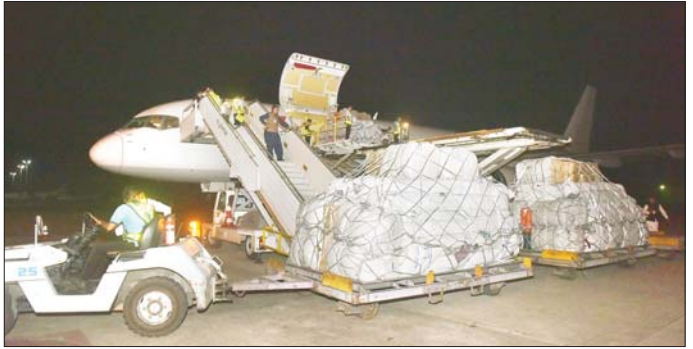
အဆိုပါ ရောက်ရှိလာသည့် ကယ်ဆယ်ရေး ပစ္စည်းများကို တပ်မတော်သားများ၊ ရန်ကုန်များက သက်ဆိုင်ရာမော်တော်မြို့တော် စည်ပင်သာယာရေးကော်မတီမှ ဝန်ထမ်းများ၊ ပြည်ပြီး ငလျင်ဒဏ်သင့်ဒေသများသို့ တွင်း ကုန်တင်ကုန်ချလုပ်သား ဖြန့်ဝေရန် နေပြည်တော်သို့ ဆက်လက်ပို့ဆောင်ပေးခဲ့ကြောင်း ဆက်လက်ပို့ဆောင်ပေးခဲ့ကြောင်း ဖြို့တော် စည်ပင်သာယာရေး ယာဉ်များပေါ်သို့ တင်ဆောင်ပေး သတင်းရရှိသည်။ သတင်းစဉ်

မင်္ဂလာဒုံလေတပ်စခန်းဌာနချုပ်မှ ဗိုလ်မှူးချုပ် စောဆန်းနိုင်နှင့် တပ်မတော် အရာရှိကြီးများ၊ မြန်မာနိုင်ငံဆိုင်ရာ ပါကစွတန်သံအမတ်ကြီး H.E. Mr. Imran Haider နှင့် သံရုံးတာဝန်ရှိသူများ၊ နိုင်ငံခြားရေးဝန်ကြီးဌာနနှင့် လူမှုဝန်ထမ်း၊ ကယ်ဆယ်ရေးနှင့် ပြန်လည်နေရာချထားရေးဝန်ကြီးဌာနတို့မှ တာဝန်ရှိသူများက ကြိုဆိုခွတ်ဆက်၍ လိုအပ်သည့်များ ပေါင်းစပ်ညှိနှိုင်းဆောင်ရွက်ပေးသည်။