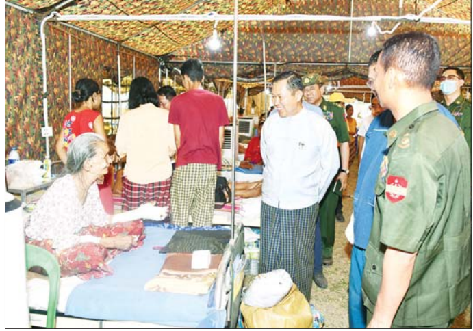
နိုင်ငံတော်စီမံအုပ်ချုပ်ရေးကောင်စီဒုတိယဥက္ကဋ္ဌ ဒုတိယဝန်ကြီးချုပ် ဒုတိယဗိုလ်ချုပ်မှူးကြီး စိုးဝင်း ပျဉ်းမနားမြို့ ပေါင်းလောင်းအားကစားကွင်း၌ ဖွင့်လှစ်ထားရှိသည့် ယာယီဆေးရုံ (ပေါင်းလောင်း)၌ ငလျင်ဒဏ်ကြောင့် ထိခိုက်ဒဏ်ရာရရှိသူများ တက်ရောက်ဆေးကုသမှုကို ကြည့်ရှုအားပေးစဉ်။

လည်း ငလျင်ဒဏ်ကြောင့် ထိခိုက်ပျက်စီးမှု အခြေအနေများကို သွားရောက် ကြည့်ရှုစစ်ဆေးပြီး တာဝန်ရှိသူများအား လိုအပ်သည်များ လမ်းညွှန်မှာကြားသည်။ အဆိုပါ ရေခန်းတစ်ခုသည် မြေသားတစ်အမျိုးအစားဖြစ်ပြီး တစ်အမြင့် ၃၆ ပေ၊ တစ်အလျားပေ ၁၀၆၀၊ ရေဆင်းစရိယာမှာ ၁၁ စတုဂံရန်းမိုင်ရှိပြီး တစ်အမြင့် အပိုင်းတွင် အက်ကြောင်းများ ဖြစ်ပေါ်ခြင်း၊ ရေထုတ်ပြွန်အနီး တစ်၏ အပြင်ဘက်အပိုင်းအချို့မှာ ငလျင်ဒဏ်ကြောင့် ကျိုးပြတ်အက်ကွဲမှုများ ဖြစ်ပေါ်ခဲ့သဖြင့် သက်ဆိုင်ရာ တာဝန်ရှိသူများက တစ်အတွင်းမှ ရေဖိအား လျော့နည်းစေရေး ၄ ပေခန့် ရေထုတ်လျှော့ချပြီး ပြုပြင်ရေးလုပ်ငန်းများအား အမြန်ဆုံး ဆောင်ရွက်လျက်ရှိ