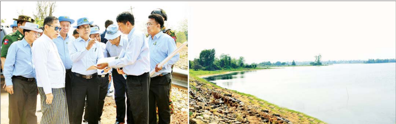
အမျိုးသားသဘာဝဘေးအန္တရာယ်ဆိုင်ရာ စီမံခန့်ခွဲမှုကော်မတီဥက္ကဋ္ဌ နိုင်ငံတော်စီမံအုပ်ချုပ်ရေးကောင်စီ ဒုတိယဥက္ကဋ္ဌ ဒုတိယဝန်ကြီးချုပ် ဒုတိယဗိုလ်ချုပ်မှူးကြီး စိုးဝင်း နေပြည်တော်ကောင်စီနယ်မြေ ဒက္ခိဏသိရိ မြို့နယ်ရှိ ရန်အောင်မြင်တစ် ငလျင်ဒဏ်ကြောင့် ထိခိုက်ပျက်စီးမှုဖြစ်ပေါ်ခဲ့သည့်အခြေအနေများ ကြည့်ရှုစစ်ဆေးစဉ်။