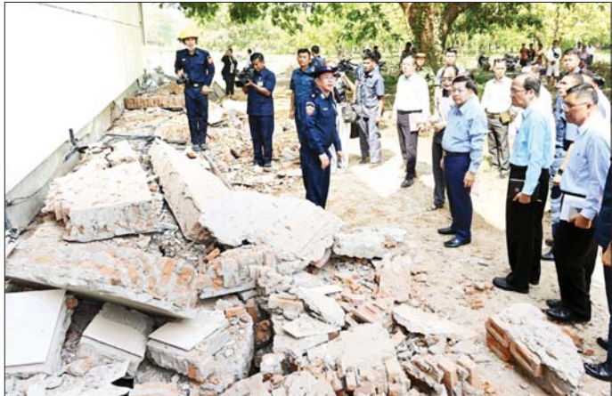
နိုင်ငံတော်စီမံအုပ်ချုပ်ရေးကောင်စီဥက္ကဋ္ဌ နိုင်ငံတော်ဝန်ကြီးချုပ် ဗိုလ်ချုပ်မှူးကြီးမင်းအောင်လှိုင် ဥတ္တရသီရိအထွေထွေရောဂါကုဆေးရုံကြီး ငလျင်ဘေးဒဏ်သင့်မှုကြောင့် ထိခိုက်ပျက်စီးခဲ့ရမှုအခြေအနေများနှင့် ကူညီကယ်ဆယ်ရေးလုပ်ငန်းများ ဆောင်ရွက်နေမှုကို ကြည့်ရှုစစ်ဆေးစဉ်။