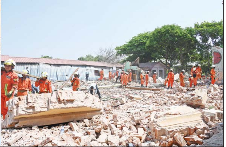
နိုင်ငံတော်စီမံအုပ်ချုပ်ရေးကောင်စီဥက္ကဋ္ဌ နိုင်ငံတော်ဝန်ကြီးချုပ် ဗိုလ်ချုပ်မှူးကြီးမင်းအောင်လှိုင် ပျဉ်းမနားမြို့ ခေမာသီဝံကျောင်းတိုက်အတွင်းရှိ မွှော့ရုံတော် ငလျင်ဘေးဒဏ်ကြောင့် ပြိုကျပျက်စီးခဲ့မှုအား ကူညီကယ်ဆယ်ရေးနှင့် အပျက်အစီးများ ဖယ်ရှားရှင်းလင်းခြင်းလုပ်ငန်းများ ဆောင်ရွက်ပေးနေမှုကို ကြည့်ရှုစစ်ဆေးစဉ်။