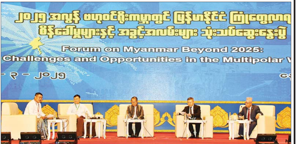
မတ် ၂၁ ရက်က နေပြည်တော် MICC-1 ၌ ကျင်းပသည့် "၂၀၂၅ အလွန် ဗဟုဝင်ရိုးကမ္ဘာတွင် မြန်မာနိုင်ငံ ကြုံတွေ့လာရမည့် စိန်ခေါ်မှုများနှင့် အခွင့်အလမ်းများ သုံးသပ်ဆွေးနွေးပွဲ" တွင် "ပြောင်းလဲနေသော ဗဟုဝင်ရိုးကမ္ဘာတွင် မြန်မာနှင့် အာရှ၏ အခန်းကဏ္ဍ" ခေါင်းစဉ်ဖြင့် ပြည်တွင်းပြည်ပ ပညာရှင်များက ထည့်သွင်းဆွေးနွေးစဉ်။

ဆိုလိုသည်မှာ အင်အားကြီးနိုင်ငံများ ပေါင်းစုဖွဲ့စည်းကာ ကမ္ဘာစီးပွားရေးတိုးတက်မှုအတွက် အရေးပါသည့်ကဏ္ဍမှ ပါဝင်နိုင်ရေး ရည်မှန်းချက်ဖြင့် ဖွဲ့စည်းထားသည့် ၁၀ နိုင်ငံပါ BRICS အဖွဲ့ကြီးသည် ဗဟုဝင်ရိုးကမ္ဘာအတွက် ထင်ရှားသည့်သာဓကတစ်ခုဖြစ်ပါသည်။ BRICS အဖွဲ့တွင် ကမ္ဘာ့လူဦးရေ အများဆုံးနိုင်ငံများဖြစ်သည့် တရုတ်နိုင်ငံ၊ အိန္ဒိယနိုင်ငံ၊ အင်ဒိုနီးရှားနိုင်ငံနှင့် ရုရှားနိုင်ငံ အပါအဝင် နိုင်ငံ ၁၀ နိုင်ငံ ပေါင်းစုထားပြီး ကမ္ဘာစီးပွားရေး တိုးတက်ရေးအတွက် ပေါင်းစုရပ်တည် ပါဝင်ဆောင်ရွက်နေသည့် အင်အားကြီးအဖွဲ့ ဖြစ်ပါသည်။ အမေရိကန်နိုင်ငံသမ္မတ Mr. Donald Trump က