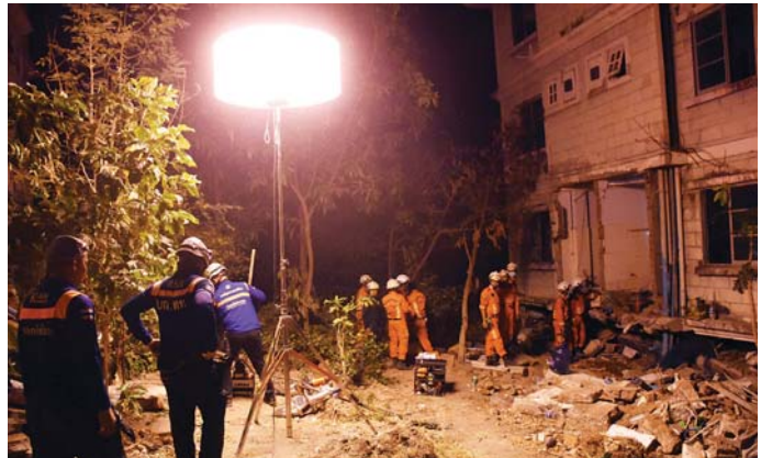
ထိုင်းနိုင်ငံမှ ကယ်ဆယ်ရေးအဖွဲ့နှင့် တရုတ်နိုင်ငံမှ ကယ်ဆယ်ရေးအဖွဲ့များ ဧမ္မာသီရိမြို့နယ် ဝန်ထမ်းအိမ်ရာအတွင်း ရှာဖွေကယ်ဆယ်ရေးလုပ်ငန်းများ ဆောင်ရွက်နေမှုကို တွေ့ရစဉ်။