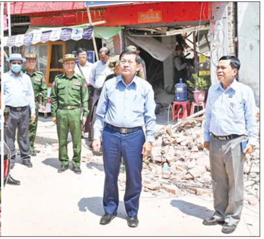
နိုင်ငံတော်စီမံအုပ်ချုပ်ရေးကောင်စီဥက္ကဋ္ဌ နိုင်ငံတော်ဝန်ကြီးချုပ် ဗိုလ်ချုပ်မှူးကြီးမင်းအောင်လှိုင် ပျဉ်းမနားမြို့အတွင်း ငလျင်ဘေးဒဏ်ကြောင့် ပြိုကျပျက်စီးနေသည့် အဆောက်အအုံများနှင့် အပျက်အစီးများအား ဖယ်ရှားရှင်းလင်းခြင်းလုပ်ငန်းများ ဆောင်ရွက်ပေးနေမှုများကို လိုက်လံကြည့်ရှုစစ်ဆေးစဉ်။

သက်ကြီး အမျိုးသမီးတစ်ဦးကို ယနေ့နံနက် ၄ နာရီခန့် (ငလျင်လှုပ်ခတ်ပြီး ၃၆ နာရီကျော်)၌ မြန်မာနိုင်ငံမှ ကူညီကယ်ဆယ်ရေးအဖွဲ့များနှင့်ပူးပေါင်း၍ အသက်ရှင်လျက် ကယ်ထုတ်ပေးနိုင်ခဲ့ကြောင်းနှင့် ကူညီကယ်ဆယ်ရေးလုပ်ငန်းများကို ဆက်လက်ပိုင်းဝန်း ဆောင်ရွက်ပေးလျက်ရှိကြောင်း သိရှိရသည်။ အားပေးစကားပြောကြားယင်းနောက် နိုင်ငံတော်စီမံအုပ်ချုပ်ရေးကောင်စီဥက္ကဋ္ဌ နိုင်ငံတော်ဝန်ကြီးချုပ်နှင့် အဖွဲ့ဝင်များသည် ပျဉ်းမနားမြို့ ခေမာသီဝံ