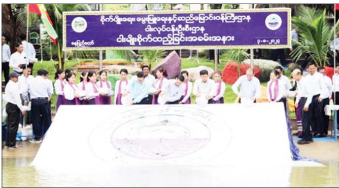
ပြည်ထောင်စုဝန်ကြီး ဦးမင်းနောင်နှင့် အဖွဲ့ဝင်များ နေပြည်တော်ကောင်စီနယ်မြေ ဇေယျာသီရိမြို့နယ် ကျည်တောင်ရွာ ပေါင်းလောင်းချောင်းအတွင်း ငါးမျိုးစိုက်ထည့်စဉ်။ (၃-၈-၂၀၂၄)

စိုက်ပျိုးရေး၊ မွေးမြူရေးနှင့် ဆည်မြောင်းဝန်ကြီးဌာန ငါးလုပ်ငန်းဦးစီးဌာနသည် ငါးသယ်စာတမျိုးကို ထိန်းသိမ်းခြင်းဖြင့် ငါးရိက္ခာဖူလုံစေရန် အစားအစာ ဘေးအန္တရာယ်ကင်းရှင်းစေရန်နှင့် စဉ်ဆက်မပြတ် ငါးလုပ်ငန်းဖွံ့ဖြိုးတိုးတက်စေရေးအတွက် ဥပဒေနှင့် အညီ ဆောင်ရွက်ရန်တို့ကို မူဝါဒချမှတ် ဆောင်ရွက် လျက်ရှိပါသည်။ မွှော်မှန်းချက်အနေဖြင့် ငါးလုပ်ငန်း ရေရှည်စဉ်ဆက်မပြတ် ဖွံ့ဖြိုးတိုးတက်စေပြီး ငါးရိက္ခာဖူလုံစေရန်၊ ငါးလုပ်ငန်းကိုအခြေခံ၍ ကျေးလက်နေပြည်သူများ၏ လူမှုစီးပွားဘဝမြှင့်တင်ပေး လာစေရန်နှင့် နိုင်ငံစီးပွားဖွံ့ဖြိုးတိုးတက်မှုကို အထောက်အကူဖြစ်စေရန် ဆောင်ရွက်လျက်ရှိပါ သည်။ ၎င်းအပြင် ရည်မှန်းချက်(၆)ရပ်၊ လုပ်ငန်းစဉ် (၂၅)ချက်ကို ရေးဆွဲချမှတ်ပြီး ငါးကဏ္ဍဖွံ့ဖြိုးရေး အတွက် လုပ်ငန်းများကို အောင်မြင်အောင် ဆောင်ရွက်လျက်ရှိပါသည်။