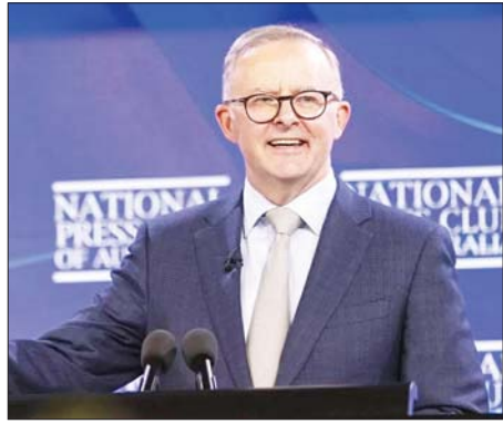
ဩစတြေးလျဝန်ကြီးချုပ် အန်တိုနီ အယ်ဘာနီးစ်။

ကင်ဘရာ မတ် ၃၀ ဩစတြေးလျဝန်ကြီးချုပ် အန်တိုနီ အယ်ဘာနီးစ်နှင့် ၎င်း၏အစိုးရ အဖွဲ့ လေဘာပါတီသည် မေလ တွင် ကျင်းပမည့် အထွေထွေ ရွေးကောက်ပွဲတွင် ဒုတိယ သက်တမ်းအတွက် အနိုင်ရဖွယ်ရှိ ကြောင်း မတ် ၃၀ ရက် နမူနာ စစ်တမ်းအရ သိရသည်။ လေဘာပါတီသည် မေ ၃ ရက် ရွေးကောက်ပွဲတွင် ပါလီမန်၏ အောက်လွှတ်တော်အတွင်း နေရာ ၁၅၀ အနက် ၇၅ နေရာဖြင့် အနိုင်ရ ဖွယ်ရှိကြောင်း သိရသည်။ ရွေးကောက်ပွဲမဲဆွယ်မှု၏ ဒုတိယ နေ့တွင် မဲဆန္ဒရှင် ၃၈၆၂၉၂ ဦး၏ စစ်တမ်းကို ထုတ်ပြန်ကြည့်ခဲ့ ပြီး အတိုက်အခံညွှန်ပေါင်းအဖွဲ့က အမတ်နေရာ ၆၀ ရရှိနိုင်ဖွယ်ရှိ ကြောင်း သိရသည်။