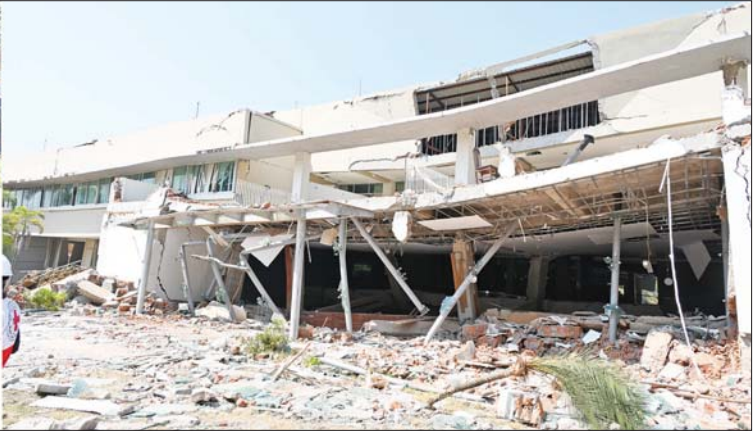
နိုင်ငံတော်စီမံအုပ်ချုပ်ရေးကောင်စီဥက္ကဋ္ဌ နိုင်ငံတော်ဝန်ကြီးချုပ် ဗိုလ်ချုပ်မှူးကြီးမင်းအောင်လှိုင်နှင့် အဖွဲ့ဝင်များ ဥတ္တရသီရိအထွေထွေရောဂါကုဆေးရုံကြီး ငလျင်ဘေးဒဏ်သင့်မှုကြောင့် ထိခိုက်ပျက်စီးခဲ့ရမှု အခြေအနေများကို ကြည့်ရှုစစ်ဆေးစဉ်။