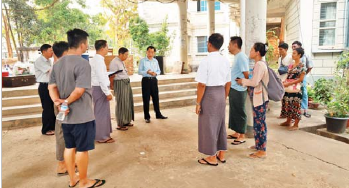
ပြည်ထောင်စု ဝန်ကြီးနှင့် အဖွဲ့သည် နေပြည်တော်ကောင်စီ နယ်မြေအတွင်းရှိ မြေငလျင်ဘေးဒဏ်ခံစားခဲ့ရသော စွမ်းအင်ဝန်ကြီးဌာနမှ လူပျို/အပျို ဆောင်

နေပြည်တော် မတ် ၃၀ စွမ်းအင်ဝန်ကြီးဌာန ပြည်ထောင်စုဝန်ကြီး ဦးကိုကိုလွင်သည် ဒုတိယဝန်ကြီး၊ ပြည်ထောင်စုဝန်ကြီးရုံး ညွှန်ကြားရေးမှူးချုပ်၊ ဝန်ကြီးဌာန ကြီးကြပ်မှုအောက်ရှိ ဦးစီးဌာန/လုပ်ငန်းများမှ ညွှန်ကြားရေးမှူးချုပ်များ၊ ဦးဆောင်ညွှန်ကြားရေးမှူးများနှင့် တာဝန်ရှိသူများနှင့်အတူ နေပြည်တော်ကောင်စီ နယ်မြေအတွင်းရှိ မြေငလျင်ဘေးဒဏ်ခံစားခဲ့ရသည့် စွမ်းအင်ဝန်ကြီးဌာနမှ ဝန်ထမ်းများနှင့် မိသားစုဝင်များအား သွားရောက်ကြည့်ရှု အားပေးခဲ့သည်။