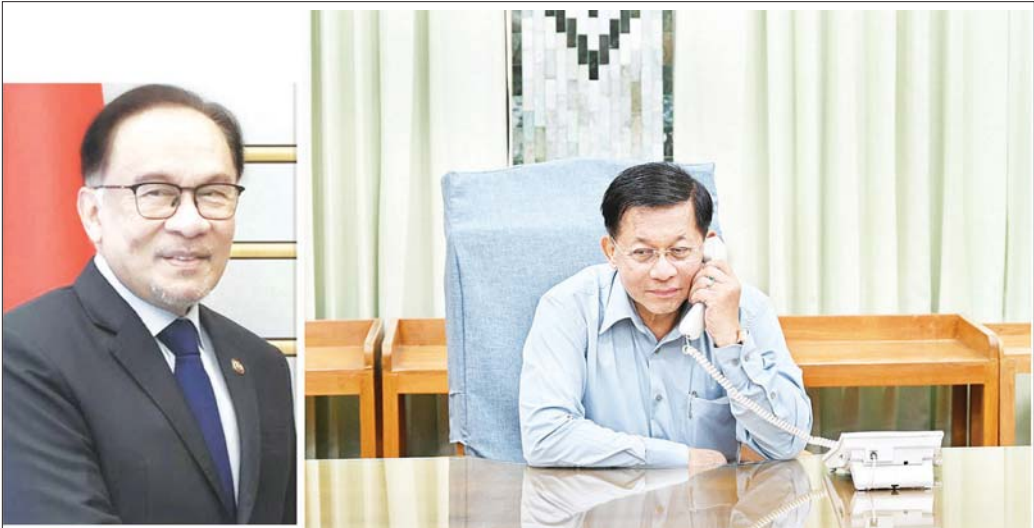
မြန်မာနိုင်ငံတွင် ပြင်းထန်စွာလျှော့လှုပ်ခတ်ခဲ့မှုနှင့်ပတ်သက်၍ နိုင်ငံတော်စီမံအုပ်ချုပ်ရေးကောင်စီဥက္ကဋ္ဌ နိုင်ငံတော်ဝန်ကြီးချုပ် ဗိုလ်ချုပ်မှူးကြီး မင်းအောင်လှိုင် အာဆီယံအလှည့်ကျဥက္ကဋ္ဌ မလေးရှားနိုင်ငံဝန်ကြီးချုပ် Dato' Seri Haji Anwar bin Ibrahim နှင့် ဖုန်းဖြင့် ဆက်သွယ်ပြောကြားစဉ်။

နေပြည်တော် မတ် ၃၀ မြန်မာနိုင်ငံ၌ မတ် ၂၈ ရက်တွင် ပြင်းထန်စွာ လျှော့လှုပ်ခတ်ခဲ့မှုကြောင့် မြန်မာနိုင်ငံအတွင်း ထိခိုက်ပျက်စီးမှုများ ဖြစ်ပေါ်ခဲ့မှုများနှင့် ပတ်သက်၍ အကူအညီပေးပေးအပ်နိုင်ရေး နိုင်ငံတော်စီမံအုပ်ချုပ်ရေးကောင်စီဥက္ကဋ္ဌ နိုင်ငံတော်ဝန်ကြီးချုပ် ဗိုလ်ချုပ်မှူးကြီး မင်းအောင်လှိုင်သည် ယနေ့ မွန်းလွဲပိုင်းတွင် အာဆီယံအလှည့်ကျဥက္ကဋ္ဌ မလေးရှားနိုင်ငံ ဝန်ကြီးချုပ် Dato' Seri Haji Anwar bin Ibrahim နှင့် ဖုန်းဖြင့် ဆက်သွယ်ပြောကြားသည်။