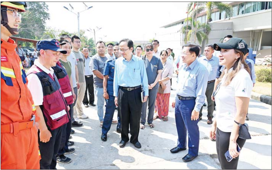
နိုင်ငံတော်စီမံအုပ်ချုပ်ရေးကောင်စီဥက္ကဋ္ဌ နိုင်ငံတော်ဝန်ကြီးချုပ် ဗိုလ်ချုပ်မှူးကြီးမင်းအောင်လှိုင် မြန်မာနိုင်ငံသို့ ပထမဆုံးရောက်ရှိလာသည့် တရုတ်နိုင်ငံ ယူနန်ပြည်နယ် ကယ်ဆယ်ရေးဆေးကုသမှုအဖွဲ့မှ အဖွဲ့ဝင်များအား ရင်းရင်းနှီးနှီးနှုတ်ဆက်၍ ကျေးဇူးတင်စကားပြောကြားစဉ်။

လိုက်လံကြည့်ရှုစစ်ဆေးသည်။ ရှင်းလင်းတင်ပြ ထို့နောက် နိုင်ငံတော်စီမံ အုပ်ချုပ်ရေးကောင်စီဥက္ကဋ္ဌ နိုင်ငံ တော်ဝန်ကြီးချုပ်နှင့် အဖွဲ့ဝင်များ သည် ဥတ္တရသီရိအထွေထွေ ရောဂါကုဆေးရုံကြီးသို့ ရောက်ရှိ ကြပြီး ငလျင်ဘေးဒဏ်သင့်မှု ကြောင့် ဆေးရုံထိခိုက်ပျက်စီးခဲ့ရ မှုအခြေအနေများကို ကြည့်ရှု စစ်ဆေးရာ ဆေးရုံအုပ်ကြီးနှင့် တာဝန်ရှိသူများက ထိခိုက်ပျက်စီး ခဲ့ရမှုအခြေအနေများကို လိုက်လံ ရှင်းလင်း တင်ပြကြသည်။ ရှင်းလင်းတင်ပြမှုများအပေါ် နိုင်ငံ တော်စီမံအုပ်ချုပ်ရေး ကောင်စီ ဥက္ကဋ္ဌ နိုင်ငံတော်ဝန်ကြီးချုပ်က ပြိုကျပျက်စီးခဲ့မှုကြောင့် ဆေးရုံ အတွင်း၌ ဝိတ်မိနေသူများအား အမြန်ဆုံး ပြန်လည်ဆွဲထုတ်နိုင် ရေးနှင့် အဆောက်အအုံထိခိုက် ပျက်စီးမှုအား အမြန်ဆုံးရှင်းလင်း စာမျက်နှာ ၅ သို့