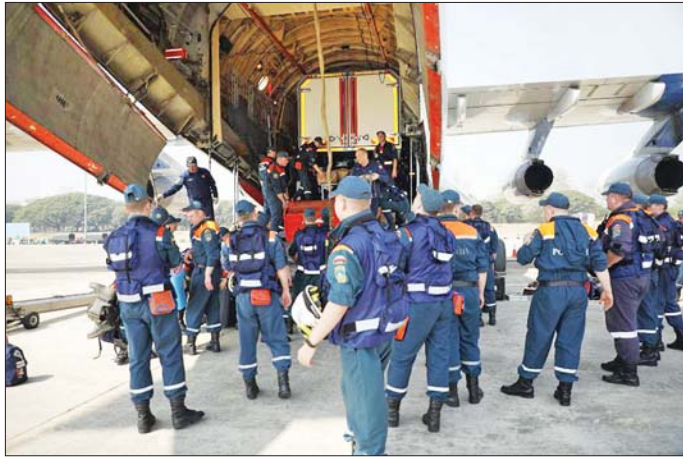
ထိုင်းနိုင်ငံမှ ကယ်ဆယ်ရေးတပ်ဖွဲ့ဝင်များ ရောက်ရှိလာမှုကို တွေ့ရစဉ်။