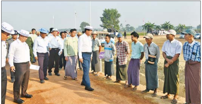
လိုအပ်ချက်များကို အတတ်နိုင်ဆုံး ညှိနှိုင်းဆောင်ရွက်ပေးခဲ့ကြောင်းနှင့် တောင်သူများ တစ်နှစ်လျှင် နှစ်သီး၊ သုံးသီး စသဖြင့် စိုက်ပျိုးနိုင်ပြီး လူမှုစီးပွားဘဝများ ပိုမိုဖွံ့ဖြိုးတိုးတက်လာစေရန် ရည်ရွယ်၍ စနစ်ကျလယ်ယာမြေများကို ဖော်ထုတ်ပေးခဲ့ကြောင်း သိရသည်။ ဆန်းကျော်ဦး (ပြန်/ဆက်)

ဦးစိုးသိန်းက အမှာစကားပြောကြားပြီး တိုင်းဒေသကြီး စက်မှုလယ်ယာဦးစီးဌာန စီမံကိန်းနှင့်ပတ်သက်၍ ရှင်းလင်းတင်ပြသည်။ ဆက်လက်၍ စက်မှုလယ်ယာမြေ ဖော်ထုတ်ရေးအဖွဲ့ (အောက်မြန်မာပြည်) သန့်လျင်မြို့တာဝန်ခံကဖော်ထုတ်ပြီး စနစ်ကျလယ်ယာမြေ ၃၃၀ ဒသမ ၇၉ ဧကကို တောင်သူ ၅၀ (ကိုယ်စား) တောင်သူနှစ်ဦးထံ လွှဲပြောင်းပေးအပ်ရာ တောင်သူတစ်ဦးက ကျေးဇူးတင်စကားပြောကြားသည်။ အဆိုပါ စနစ်ကျလယ်ယာမြေဖော်ထုတ်ရာတွင် တောင်သူ ၅၀ လုံး သဘောတူညီသဖြင့် ၂၀၂၄ ခုနှစ် ဒီဇင်ဘာ ၁ ရက်တွင် စီမံကိန်းလုပ်ငန်းများအား စတင်ခဲ့ပြီး လုပ်ငန်းများအကောင်အထည်ဖော်ဆောင်ရွက်ရာတွင် မြေစာရင်းဦးစီးဌာန၊ ဆည်မြောင်းနှင့် ရေအသုံးချမှုစီမံခန့်ခွဲရေးဦးစီးဌာန၊ စိုက်ပျိုးရေးဦးစီးဌာနများနှင့်ပူးပေါင်း၍ တောင်သူများ၏