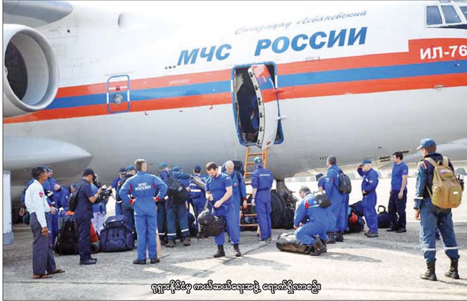
ရုရှားနိုင်ငံမှ စာမိတ်ဆေးရေးအဖွဲ့၊ ရောဂါဆေးစစ်ဖွဲ့

နေပြည်တော် မတ် ၃၀ နိုင်ငံတော်အစိုးရအနေဖြင့် ငလျင်ဒဏ်သင့်ဒေသများရှိ ပျက်စီးဆုံးရှုံးမှုများကို အလျင်အမြန်စုံစမ်းစစ်ဆေးပြီး အချိန်နှင့်တစ်ပြေးညီ ကူညီကယ်ဆယ်ရေးလုပ်ငန်းများ ဆောင်ရွက်လျက်ရှိသည့်အပြင် ပြည်ပမှ လူသားချင်းစာနာထောက်ထားမှုဆိုင်ရာ အကူအညီများကို လမ်းဖွင့်ပေးထားပြီးဖြစ်ရာ ယနေ့တွင် ငလျင်ဒဏ်သင့်ပြည်သူများအတွက် မလေးရှား၊ ထိုင်းနှင့် ရုရှားနိုင်ငံတို့မှ ကယ်ဆယ်ရေးအဖွဲ့များ၊ ဆရာဝန်များနှင့် သူနာပြုအေးအဖွဲ့များ၊ လူသားချင်းစာနာထောက်ထားမှုဆိုင်ရာ အကူအညီပစ္စည်းများ၊ ဆေးဝါးများသည် မြန်မာနိုင်ငံသို့ ထပ်မံရောက်ရှိကြသည်။ စာမျက်နှာ ၁၉ ကော်လံ ၁ ၀