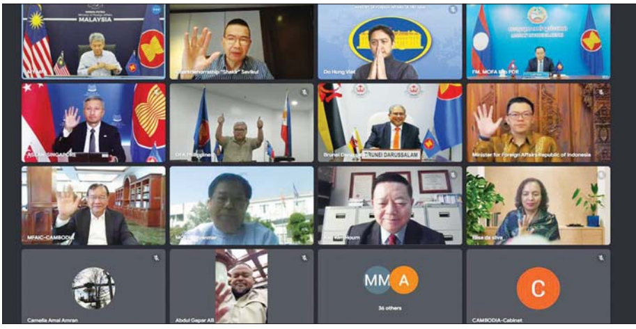
ဒုတိယဝန်ကြီးချုပ်နှင့် နိုင်ငံခြားရေးဝန်ကြီးဌာန ပြည်ထောင်စုဝန်ကြီး ဦးသန်းဆွေ အာဆီယံနိုင်ငံခြားရေးဝန်ကြီးများ အထူးအရေးပေါ်အစည်းအဝေး ပါဝင်တက်ရောက်စဉ်။

အဆိုပါ အစည်းအဝေးသည် မြန်မာနိုင်ငံနှင့် ထိုင်းနိုင်ငံတို့တွင် ပြင်းထန်သော ငလျင်ဖြစ်ပွားပြီး နောက်၌ ငလျင်ဘေးသင့်ရာဒေသများတွင် လူသားချင်းစာနာမှုအကူအညီများပေးအပ်ရေး၊ ကူညီကယ်ဆယ်ရေးနှင့် ပြန်လည်ထူထောင်ရေး လုပ်ငန်းများ ဆောင်ရွက်ရန်အတွက် လိုအပ်သည့် ပေါင်းစပ်ညှိနှိုင်းမှုများ ပြုလုပ်နိုင်ရန် ကျင်းပပြုလုပ်ခြင်းဖြစ်သည်။