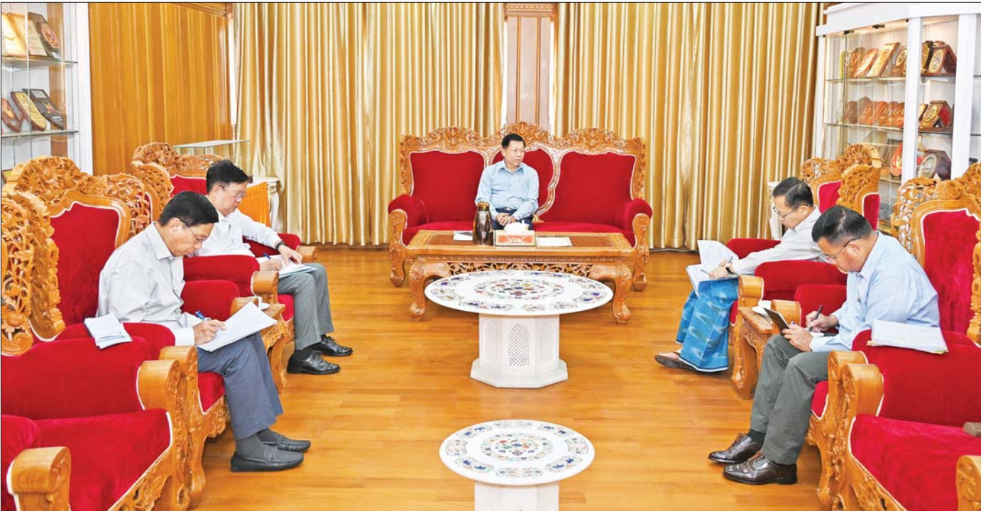
နိုင်ငံတော်စီမံအုပ်ချုပ်ရေးကောင်စီဥက္ကဋ္ဌ နိုင်ငံတော်ဝန်ကြီးချုပ် ဗိုလ်ချုပ်မှူးကြီးမင်းအောင်လှိုင် အလွန်အင်အားပြင်းထန်သည့် ငလျင်လှုပ်ခတ်ခဲ့မှုကြောင့် ငလျင်ဘေးဒဏ်သင့်ခဲ့ရသည့် ဒေသများ၌ ကူညီကယ်ဆယ်ရေး နှင့် ပြန်လည်ထူထောင်ရေးလုပ်ငန်းများ အမြန်ဆုံးဆောင်ရွက်သွားနိုင်ရေး အထူးအစည်းအဝေးတွင် လိုအပ်သည်များ လမ်းညွှန်မှာကြားစဉ်။