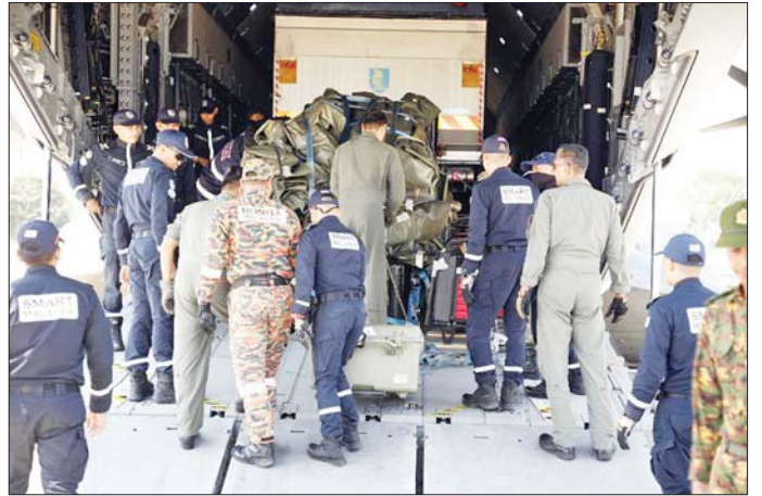
မလေးရှားနိုင်ငံမှ ကယ်ဆယ်ရေးတပ်ဖွဲ့ဝင်များ ရောက်ရှိလာမှုကို တွေ့ရစဉ်။

○ ကျောပိုးမှ ယနေ့နံနက်ပိုင်းတွင် နေပြည်တော်ရှိ တပ်မတော်လေဆိပ်သို့ မလေးရှားနိုင်ငံမှ ရှာဖွေ ကယ်ဆယ်ရေးအဖွဲ့၊ လူသားချင်းစာနာထောက်ထား မှုဆိုင်ရာ အကူအညီပစ္စည်းများနှင့်ဆေးဝါးများ၊ ထိုင်းနိုင်ငံမှ ရှာဖွေကယ်ဆယ်ရေးအဖွဲ့နှင့်အတူ ဆရာဝန်နှင့်သူနာပြုဆေးအဖွဲ့၊ ရှာဖွေ ကယ်ဆယ်ရေး ခွေးလေးကောင်၊ လူသားချင်းစာနာ ထောက်ထားမှုဆိုင်ရာ အကူအညီပစ္စည်းများ၊ ဆေးဝါးများရောက်ရှိကြသည်။ ယနေ့ရောက်ရှိသည့် ရှာဖွေကယ်ဆယ်ရေး