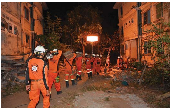
တရုတ်နိုင်ငံမှ ကယ်ဆယ်ရေးတပ်ဖွဲ့ဝင်များ ကယ်ဆယ်ရေးပစ္စည်းများသယ်ဆောင်လာမှုကို တွေ့ရစဉ်။

တွေကိုလည်း ကယ်လိုရသမျှ အချိန်မီကယ်ထုတ်ခဲ့ပါတယ်။ စီးသတ်တပ်ဖွဲ့ဝင်တွေနဲ့ ကြက်ခြေနီတပ်ဖွဲ့ဝင်တွေ ရောက်ရှိလာပြီး လူနာတွေ၊ ထိခိုက်ဒဏ်ရာရရှိတဲ့သူတွေနဲ့ ဆေးရုံမှာရှိတဲ့ အရေးကြီးတဲ့ အရေးကြီးပစ္စည်းတွေကို အချိန်နဲ့တစ်ပြေးညီ