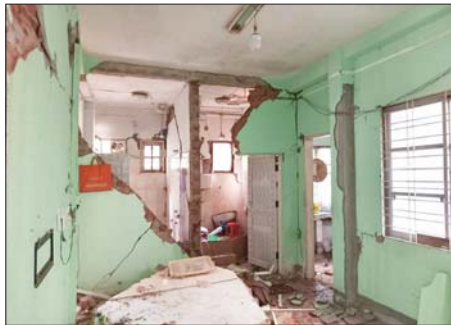
ငလျင်ဒဏ်ကြောင့် ဧက ၁၀၀၀ တိုက်အမှတ် ၁၃၂၇ ဝန်ထမ်းအိမ်ရာ ပြိုကျပျက်စီးမှုကို တွေ့ရစဉ်။

ရကြောင်း၊ သဘာဝဘေးသည် မရနိုင်သဖြင့် ကြောက်ရွံ့နေစရာ မလိုဘဲ အားတင်းရင့်ဆိုင်ရမည် ဖြစ်ကြောင်း၊ မိမိတို့ထက်အခြေအနေ ဆိုးရွားသော နေရာများတွင် ကယ်ဆယ်ရေး လုပ်ငန်းများ ဆောင်ရွက်လျက်ရှိကြောင်းနှင့် လက်ရှိ ဝန်ထမ်းအိမ်ရာများမှ မှာ ဆက်နေရန် အခက်အခဲများ ရှိနေသည်ကို တွေ့မြင်ရကြောင်း ပြောကြားပြီး ဝန်ထမ်းများ တင်ပြသည့် သုံးရေ ယာယီအိမ်သာ၊ တယ်လီဖုန်း အားသွင်းရန်ကိစ္စရပ် များနှင့်ပတ်သက်၍ ပြည့်ဆည်းဆောင်ရွက်ပေးသည်။ ဆက်လက်၍ ပြည်ထောင်စုဝန်ကြီးသည် တိုက်ပြိုကျမှု ပြင်းထန်ပြီး သေဆုံး၊ ဒဏ်ရာရရှိမှု များရှိခဲ့သည့် တိုက်အမှတ် ၁၃၀၇ ကို သွားရောက်ကြည့်ရှုပြီး ဝန်ထမ်းများအား တွေ့ဆုံ၍ အားပေးစကား ပြောကြားခဲ့သတင်းစဉ်။