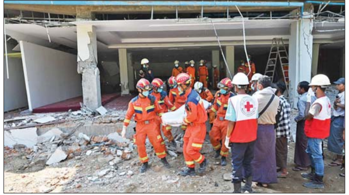
နေပြည်တော် ဥတ္တရသီရိဆေးရုံ၌ တရုတ်နိုင်ငံ ကယ်ဆယ်ရေးအဖွဲ့နှင့် မြန်မာနိုင်ငံ စီးသတ်တပ်ဖွဲ့မှ ကယ်ဆယ်ရေးတပ်ဖွဲ့ဝင်များ လူနာများအား ကူညီကယ်ထုတ်နေမှုကို တွေ့ရစဉ်။