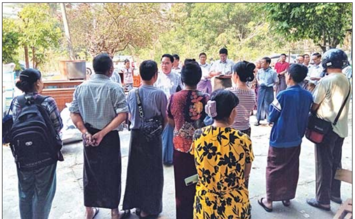
ပြည်ထောင်စုဝန်ကြီးဦးမောင်မောင်အုန်း ခရေအိမ်ရာဝန်ထမ်းများကို တွေ့ဆုံအားပေးစကားပြောကြားစဉ်။

နိုင်ငံတော်က ရွက်ဖျင်တံများ၊ ယာယီအိမ်သာများ ဖြန့်ခွဲပေးရန် စီစဉ်ဆောင်ရွက်လျက်ရှိကြောင်း၊ လက်ရှိတွင် ဝန်ထမ်းများအနေဖြင့် မိမိတို့ပိုင်ပစ္စည်းများ အနီး အရိပ်အာဝါသကောင်းသော နေရာတွင် နေရာယူထားကြခြင်း ဖြစ်သော်လည်း ယခုရက်အတွင်း အားကစားကွင်းကဲ့သို့ ကျယ်ပြန့်သောနေရာတွင် ယာယီတံများ ဆောက်လုပ်နေရာချထားပေးမည် ဖြစ်ကာ ဆေးဝါး၊ ရိက္ခာများလည်း ပြည့်ဆည်းပေးထားမည်ဟု သိရှိ