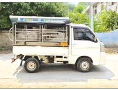
စစ်ကိုင်းတိုင်းဒေသကြီး၌ ဖမ်းဆီးရမိမှု။