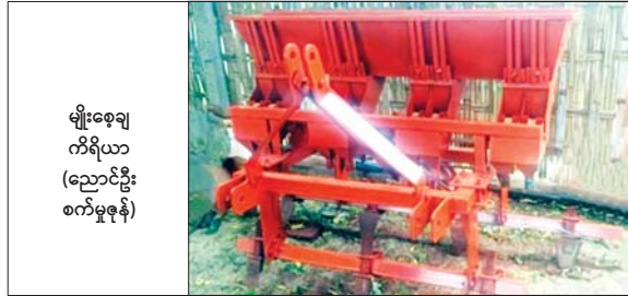
မျိုးစေ့ချကိရိယာ (ညောင်ဦးစက်မှုဇုန်)