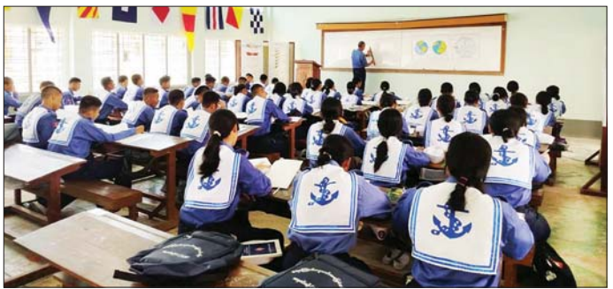
ရေကြောင်းလူငယ်များ ရေကြောင်းပညာဘာသာရပ်များ လေ့ကျင့်သင်ကြားစဉ်။

သည့် GPS သင်ခန်းစာ၊ နက္ခတ္တဗေဒသင်ခန်းစာ၊ ညွှန်းထောင့်နှင့် Compass သင်ခန်းစာများကို နေပြည်တော်ကောင်စီနယ်မြေရှိ နေပြည်တော်စခန်း တန်းခွဲ(၁)ရေကြောင်းလူငယ်စခန်းမှ သင်တန်းသား၊ သင်တန်းသူ ၉၅ ဦး၊ နေပြည်တော်စခန်းတန်းခွဲ(၂) ရေကြောင်းလူငယ်စခန်းမှ သင်တန်းသား၊ သင်တန်း သူ ၁၀၀၊ ရန်ကုန်တိုင်းဒေသကြီး ရန်ကုန်မြို့ရှိ အင်းယားရေကြောင်းလူငယ်စခန်းမှ သင်တန်းသား၊ သင်တန်းသူ ၁၀၀၊ ကိုကိုးကျွန်းမြို့ရှိ ရေကြောင်း လူငယ်စခန်းမှ သင်တန်းသား၊ သင်တန်းသူ ၃၀၊ ဧရာဝတီတိုင်းဒေသကြီး ဟိုင်းကြီးကျွန်းမြို့ရှိ ရေကြောင်းလူငယ်စခန်းမှ သင်တန်းသား၊ သင်တန်း သူ ၆၅ ဦး၊ မွန်ပြည်နယ်၊ မော်လမြိုင်မြို့ရှိ ရေကြောင်း လူငယ်စခန်းမှ သင်တန်းသား၊ သင်တန်းသူ ၆၀၊ တနင်္သာရီတိုင်းဒေသကြီး ဟိန်းဇဲဒေသရှိ ရေကြောင်း လူငယ်စခန်းမှ သင်တန်းသား၊ သင်တန်းသူ ၄၀၊ မြိတ်မြို့ရှိ ရေကြောင်း လူငယ်စခန်းမှ သင်တန်းသား၊ သင်တန်းသူ ၅၀၊ ကျွန်းစုမြို့ရှိ ရေကြောင်း လူငယ် စခန်းမှ သင်တန်းသား၊ သင်တန်းသူ ၅၀၊ ကရင်