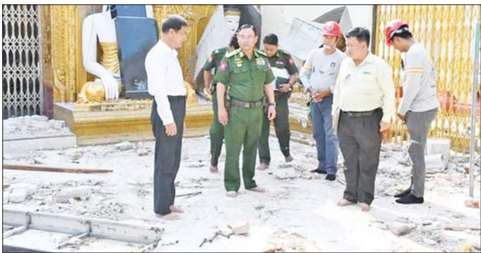
မန္တလေးတိုင်းဒေသကြီး ဝန်ကြီးချုပ် ဦးမျိုးအောင်နှင့် ကာကွယ်ရေးဦးစီးချုပ်ရုံး(ကြည်း)မှ ဒုတိယဗိုလ်ချုပ်ကြီး မျိုးသန့်နိုင် ကျောက်ဆည်မြို့၊ ရွှေမုဋ္ဌောစေတီတော်ကြီးရှိ အပျက်အစီးများအား ကြည့်ရှုစစ်ဆေးစဉ်။

နေပြည်တော် ဧပြီ ၂၅ မြန်မာနိုင်ငံတွင် လူပိုင်းစွာသော မန္တလေးငလျင်ကြီးကြောင့် လမ်းတံတား၊ အဆောက်အအုံများ ထိခိုက်ပျက်စီးခဲ့ရသည့် နေရာများ၌ ကူညီကယ်ဆယ်ရေးနှင့် ပြန်လည်ထူထောင်ရေးလုပ်ငန်းများကို တိုင်းစစ်ဌာနချုပ်အသီးသီးမှ တပ်မတော်သားများ၊ မြန်မာနိုင်ငံရဲတပ်ဖွဲ့ဝင်များ၊ မီးသတ်တပ်ဖွဲ့ဝင်များ၊ ပြည်ပနိုင်ငံများမှ ကူညီကယ်ဆယ်ရေးအဖွဲ့များ၊ ဌာနဆိုင်ရာဝန်ထမ်းများ၊ လူမှုကူညီရေးအသင်း / အဖွဲ့များနှင့် ဒေသခံပြည်သူများပူးပေါင်း၍ အချိန်နှင့်တစ်ပြေးညီ ကူညီဆောင်ရွက်ပေးလျက်ရှိသည်။