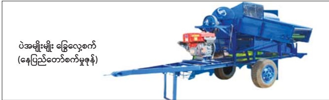
ပဲအမျိုးမျိုး ခြွေလှေ့စက် (နေပြည်တော်စက်မှုဇုန်)

သားဦးရေ ၃၈၆၆၅ ဦး သင်ကြားပို့ချနိုင်ခဲ့ပြီဖြစ်သည်။