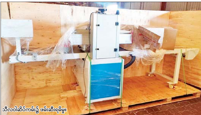
သီလဝါဆိပ်ကမ်း၌ ဖမ်းဆီးရမိမှု။

နေပြည်တော် ဧပြီ ၂၅ တရားမဝင်ကုန်သွယ်မှုတိုက်ဖျက်ရေး ဦးဆောင်ကော်မတီ၏ ကြီးကြပ်ကွပ်ကဲမှုဖြင့် တရားမဝင်ကုန်သွယ်မှုများကို ဥပဒေနှင့်အညီ ထိရောက်စွာ တားဆီးအရေးယူနိုင်ရေး ဆောင်ရွက်လျက်ရှိသည်။ ထိုသို့ဆောင်ရွက်လျက်ရှိရာ ဧပြီ ၂၃ ရက်က အကောက်ခွန်ဦးစီးဌာန၏ စီမံခန့်ခွဲမှုဖြင့် တာဝန်ကျပူးပေါင်းအဖွဲ့က စစ်ဆေးမှုများဆောင်ရွက်ခဲ့ရာ သီလဝါဆိပ်ကမ်း၌ ကုန်သွယ်ရေးလုံးပေါင်းမှ တရားဝင်စာရွက်စာတမ်း အထောက်အထား တင်ပြနိုင်ခြင်းမရှိသည့် လုပ်ငန်းသုံးပစ္စည်းနှစ်မျိုး၊ လူသုံးကုန်ပစ္စည်းနှစ်မျိုး စုစုပေါင်း ခန့်မှန်းတန်ဖိုးငွေကျပ် ၁၇၉၃၆၀၀၀ ကို ဖမ်းဆီးရမိခဲ့ပြီး အကောက်ခွန်လုပ်ထုံးလုပ်နည်းများနှင့်အညီ အရေးယူဆောင်ရွက်လျက်ရှိသည်။