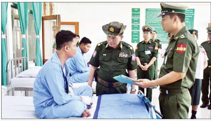
အရှေ့တောင်တိုင်းစစ်ဌာနချုပ် တိုင်းမှူး၊ ဗိုလ်ချုပ်ကျော်လင်းမောင် ဆေးရုံတက်ရောက်ကုသမှုခံယူလျက်ရှိသူများအား တစ်ဦးချင်းကြည့်ရှုအားပေးစဉ်။

နေပြည်တော် ဧပြီ ၂၅ - မင်္ဂလာဒုံမြို့နယ်ရှိ တပ်မတော် နေပြည်တော်ကောင်စီနယ်မြေ အစိုးရကုသရေး (ခုတင်-၅၀၀) နှင့် တပ်မတော် ဆေးရုံကြီး (ခုတင်-၁၀၀၀)၊ ကချင်ပြည်နယ်၊ မြစ်ကြီးနားမြို့ရှိ တပ်မတော်ဆေးရုံ၊ မွန်ပြည်နယ်၊ မော်လမြိုင်မြို့ရှိ တပ်မတော်ဆေးရုံ၊ ရန်ကုန်တိုင်းဒေသကြီး၊ ဝဲခူးတိုင်းဒေသကြီး၊ တောင်ငူမြို့ရှိ တပ်မတော်ဆေးရုံတို့၌ တက်ရောက် ကုသမှုခံယူလျက်ရှိသော အရာရှိ စစ်သည်၊ မိသားစုဝင်များ၊ မြန်မာနိုင်ငံ ရတပ်ဖွဲ့ဝင်များ၊ ပြည်သူ့စစ်(ဌာန)တပ်ဖွဲ့ဝင်များ၊ စစ်မှထမ်းဟောင်း အဖွဲ့ဝင်များနှင့် ဒေသခံပြည်သူများအား ယနေ့