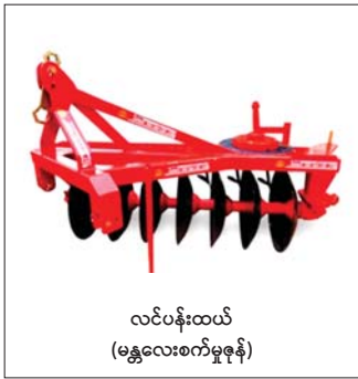
လင်ပန်းထယ် (မန္တလေးစက်မှုဇုန်)

တောင်သူများအနေဖြင့် လယ်ယာသုံးစက်ကိရိယာများကို ကျွမ်းကျင်စွာ ကိုင်တွယ်မောင်းနှင်ထိန်းသိမ်းနိုင်ရန်နှင့် စက်ကိရိယာများအား သက်တမ်းစေ့အသုံးပြုနိုင်ရေး ကျွမ်းကျင်လုပ်သားများ မွေးထုတ်ပေးနိုင်ရန် စက်မှုလယ်ယာဦးစီးဌာနက သင်တန်းကျောင်းများ၊ စက်ပြင်အလုပ်ရုံများနှင့် မြို့နယ်စက်မှုလယ်ယာစခန်းများတွင် လယ်ယာသုံးစက်ကိရိယာမောင်းနှင် ထိန်းသိမ်းမှုသင်တန်းများနှင့် လယ်ယာသုံးစက်ကိရိယာ ပြုပြင်ထိန်းသိမ်းမှုသင်တန်းများကို ဖွင့်လှစ်သင်ကြားပေးခဲ့ပါသည်။ ၂၀၁၁-၂၀၂၁ ဘဏ္ဍာရေးနှစ်မှစတင်၍ ယခုအချိန်အထိ သင်တန်း ၁၁၅ ကြိမ် ဖွင့်လှစ်ပြီး သင်တန်း