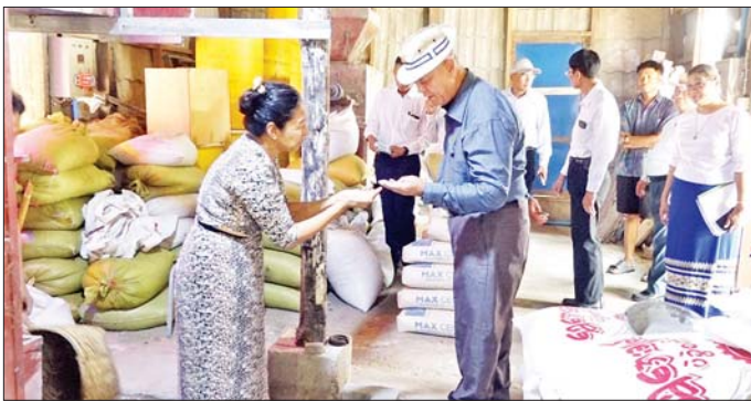
အဖွဲ့သည် ကွမ်းခြံပု ကျေးရွာရှိ အဂ္ဂဂေဟာပန်းပု လုပ်ငန်းသို့ရောက်ရှိပြီး ပန်းပု

နေပြည်တော် ဧပြီ ၂၅ အသက်မွေးဝမ်းကျောင်းလုပ်ငန်း များ ပြန်လည်ထူထောင်ရေး လုပ်ငန်းကော်မတီဝဏ္ဏ ညမ ဝါယမနှင့် ကျေးလက်ဖွံ့ဖြိုးရေး ဝန်ကြီးဌာန ပြည်ထောင်စုဝန်ကြီး ဦးလှမိုးသည် ဒုတိယဝန်ကြီး၊ အမြဲတမ်းအတွင်းဝန်၊ သက်ဆိုင်ရာ တာဝန်ရှိသူများနှင့်အတူ ယနေ့ နံနက်ပိုင်းတွင် မတ် ၂၈ ရက်က လုပ်ခတ်ခဲ့သည့် မန္တလေးလျှင် ကြီးကြောင့် အသေးစားစက်မှု လက်မှုလုပ်ငန်းများနှင့် ကုန် ထုတ်လုပ်ငန်းများ ပျက်စီးခဲ့မှု အခြေအနေကို ကွင်းဆင်းကြည့်ရှု စစ်ဆေးသည်။ ဒုတိယဝန်ကြီးနှင့် ဒုဗဟိုဝန်ကြီး၊ ဦးစွာ ပြည်ထောင်စုဝန်ကြီး၊ ဥက္ကဋ္ဌရသီရိမြို့နယ် အဖွဲ့သည် ကွမ်းခြံပု ကျေးရွာရှိ အဂ္ဂဂေဟာပန်းပု လုပ်ငန်းသို့ရောက်ရှိပြီး ပန်းပု