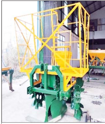
ကြိုစိုက်ကိရိယာ (ပြည်စက်မှုဇုန်)