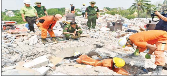
ကာကွယ်ရေးဦးစီးချုပ်ရုံး(ကြည်း)မှ ဒုတိယဗိုလ်ချုပ်ကြီး မျိုးမိုးအောင် မန္တလေးမြို့ အောင်မြေသာစံမြို့နယ်ရှိ Sky Villa အပျက်အစီးများ ဖယ်ရှားရှင်းလင်းနေမှုကြည့်ရှုစဉ်။

အလားတူ ကာကွယ်ရေးဦးစီးချုပ်ရုံး(ကြည်း)မှ ဒုတိယဗိုလ်ချုပ်ကြီး စိုးတင်နိုင်နှင့် တာဝန်ရှိသူများသည် မန္တလေးမြို့ အောင်မြေသာစံမြို့နယ်ရှိ အမှတ်(၂၀) အခြေခံပညာအထက်တန်းကျောင်း၊ ဘုရားနီဆုတောင်းပြည့်ဘုရား၊ အမ်ဘီကမယ်တော်ကျောင်း၊ ပြည်ကြီးတံခွန်မြို့နယ်ရှိ ထိပ်စုကြီးမြတ်စွာဘုရား၊ ချမ်းမြသာစည်မြို့နယ်ရှိ ဂရိတ်ဝေါ(လဲ)ဟိုတယ်၊ နန်းမြို့ရိုးနေရာများသို့ သွားရောက်၍ တပ်မတော်သားများ၊ မြန်မာနိုင်ငံ ရဲတပ်ဖွဲ့ဝင်များ၊ မီးသတ်တပ်ဖွဲ့ဝင်များ၊ ဌာနဆိုင်ရာဝန်ထမ်းများ၊ လူမှုကူညီရေးအသင်းအဖွဲ့များ ပူးပေါင်း၍ ကူညီကယ်ဆယ်ရေးလုပ်ငန်းများ အရှိန်အဟုန်မြှင့်ဆောင်ရွက်နေမှုများ၊ ဖယ်ရှားရှင်းလင်းဆောင်ရွက်ပြီးစီးမှုအခြေအနေများနှင့် ဘုရားတော်ပုထိုးများတွင် ရှေးမူပျက် ပြန်လည်ပြုပြင်တည်ဆောက်ရေးလုပ်ငန်းများ ဆောင်ရွက်နေမှုအခြေအနေများကို သွားရောက်ကြည့်ရှုပြီး လိုအပ်သည်များ ညှိနှိုင်းဆောင်ရွက်ပေးသည်။ ထို့ပြင် ကျောင်းထိုင်ဆရာတော်ကြီးများအား အလှူငွေနှင့် လှူဖွယ်ပစ္စည်းများ ဆက်ကပ်လှူဒါန်းပြီး သန့်ရှင်းရေးဆောင်ရွက်နေသည့်အဖွဲ့များအတွက် စားသောက်ဖွယ်ရာများ ပေးအပ်ကာ ပြန်လည်တည်ဆောက်ရေးလုပ်ငန်းများ ဆောင်ရွက်နိုင်ရေးအတွက် လိုအပ်သည်များ ပေါင်းစပ်ညှိနှိုင်းဆောင်ရွက်ပေးခဲ့ကြောင်း သတင်းရရှိသည်။ သတင်းစဉ်