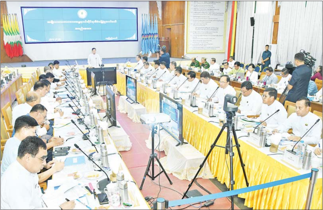
နိုင်ငံတော်စီမံအုပ်ချုပ်ရေးကောင်စီ ဒုတိယဥက္ကဋ္ဌ ဒုတိယဝန်ကြီးချုပ် ဒုတိယဗိုလ်ချုပ်မှူးကြီး စိုးဝင်း အမျိုးသားသဘာဝဘေးအန္တရာယ်ဆိုင်ရာစီမံခန့်ခွဲမှု ကော်မတီ(၃/၂၀၂၅)အစည်းအဝေးတွင် အမှာစကားပြောကြားစဉ်။

နေပြည်တော် ဧပြီ ၂၅ အမျိုးသား သဘာဝဘေးအန္တရာယ်ဆိုင်ရာ စီမံခန့်ခွဲမှုကော်မတီ (၃/၂၀၂၅) အစည်းအဝေးကို ယနေ့မနန်းလွဲပိုင်းတွင် နေပြည်တော်ရှိ လူမှုဝန်ထမ်း၊ ကယ်ဆယ်ရေးနှင့် ပြန်လည်နေရာချထားရေးဝန်ကြီးဌာန၌ ကျင်းပပြုလုပ်ရာ အမျိုးသားသဘာဝဘေးအန္တရာယ်ဆိုင်ရာ စီမံခန့်ခွဲမှုကော်မတီဥက္ကဋ္ဌ နိုင်ငံတော်စီမံအုပ်ချုပ်ရေးကောင်စီ ဒုတိယဥက္ကဋ္ဌ ဒုတိယဝန်ကြီးချုပ် ဒုတိယဗိုလ်ချုပ်မှူးကြီး စိုးဝင်း တက်ရောက်အမှာစကား ပြောကြားသည်။ တက်ရောက် အစည်းအဝေးသို့ အဆောက်အအုံများ ပြန်လည် ပြုပြင်အသုံးပြုရေးနှင့် အသစ်တည်ဆောက်ရေး ကြိုးကြပ်မှုကော်မတီဥက္ကဋ္ဌ၊ နိုင်ငံတော်စီမံအုပ်ချုပ်ရေးကောင်စီအဖွဲ့ဝင်၊ ကာကွယ်ရေးဝန်ကြီးဌာန ပြည်ထောင်စုဝန်ကြီး ဗိုလ်ချုပ်ကြီး မောင်မောင်အေး၊ ကော်မတီ ဒုတိယဥက္ကဋ္ဌများနှင့် ကော်မတီဝင် ပြည်ထောင်စုဝန်ကြီးများ၊ နေပြည်တော်ကောင်စီ ဥက္ကဋ္ဌ၊ ကာကွယ်ရေးဦးစီးချုပ်ရုံးမှ တပ်မတော်အရာရှိ ကြီးများ၊ ဒုတိယဝန်ကြီးများ၊ ဌာနဆိုင်ရာအကြီးအကဲ များနှင့် တာဝန်ရှိသူများတက်ရောက်ကြပြီး စစ်ကိုင်း တိုင်းဒေသကြီး၊ ပဲခူးတိုင်းဒေသကြီး၊ မကွေးတိုင်း ဒေသကြီး၊ မန္တလေးတိုင်းဒေသကြီးနှင့် ရှမ်းပြည်နယ် တို့မှ ဝန်ကြီးချုပ်များက ဗီဒီယိုကွန်ဖရင့်ဖြင့် တက်ရောက်ကြသည်။ စာမျက်နှာ ၃ ကော်လံ ၁ ❖