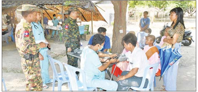
ကာကွယ်ရေးဦးစီးချုပ်ရုံး(ကြည်း)မှ ဒုတိယဗိုလ်ချုပ်ကြီး သက်ပုံ တပ်မတော်နယ်လှည့်ဆေးကုသရေးအဖွဲ့ဆေးကုသပေးနေမှုကို ကြည့်ရှုစဉ်။

ထို့နောက် ကျောက်ဆည်မြို့၊ အေးမြကြည်လင်ရပ်ကွက်တံစိုးလမ်းပေါ်ရှိ အန္တရာယ်ရှိအဆောက်အအုံအား ယန္တရားစက်ဖြင့် ရှင်းလင်းဆောင်ရွက်နေမှု