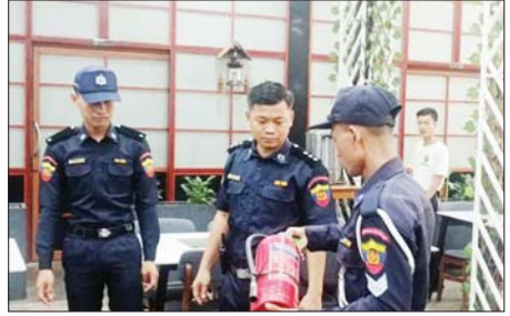
(၇၉)နှစ်မြောက် မြန်မာနိုင်ငံမီးသတ်တပ်ဖွဲ့နေ့ကို ကြိုဆိုဂုဏ်ပြုသောအားဖြင့် မင်္ဂလာတောင်ညွန့်မြို့နယ်၌ မီးဘေးကြိုတင်ကာကွယ်ရေး ဆောင်ရွက်

နေပြည်တော် ဧပြီ ၂၅ သယံဇာတနှင့် သဘာဝပတ်ဝန်းကျင်ထိန်းသိမ်းရေး ဝန်ကြီးဌာန၊ သစ်တောဦးစီးဌာနသည် တရားမဝင်သစ်နှင့် သစ်တောထွက်ပစ္စည်းများ ရှာဖွေဖော်ထုတ်ဖမ်းဆီးရေးအား ပြည်သူပူးပေါင်းပါဝင်မှုဖြင့် လူထုအခြေပြု စောင့်ကြပ်ကြည့်ရှုသတင်းပို့စနစ် (Community Monitoring and Reporting System-CMRS) အပါအဝင် နည်းလမ်းမျိုးစုံဖြင့် အကောင်အထည်ဖော်ဆောင်ရွက်လျက်ရှိရာ ဧပြီ ၇ ရက်မှ ၂၀ ရက်အထိ နေပြည်တော်၊ ပြည်နယ်နှင့် တိုင်းဒေသကြီး သစ်တောဦးစီးဌာနများမှ ပေးပို့လာသော စာရင်း ၄၁၀ ၅၅၇၄ တန်၊ သစ်မာ ၁၃ ဒသမ ၈၄၇၄ တန်၊ အခြား ၁၄၀ ဒသမ ၆၈၈၆ တန် စုစုပေါင်း ၁၉၆ ဒသမ ၀၉၃၄ တန်၊ ယာဉ်/ယန္တရား ၁၉ စီး၊ တရားမဲ့ ၂၉ ဦး ဖမ်းဆီးရမိခဲ့ကြောင်း မြန်မာနိုင်ငံ သစ်တောဦးစီးဌာနမှ သိရသည်။ သတင်းစဉ်