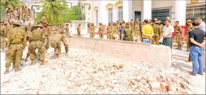
ကာကွယ်ရေးဦးစီးချုပ်ရုံး(ကြည်း)မှ ဒုတိယဗိုလ်ချုပ်ကြီး စိုးတင်နိုင် မန္တလေးမြို့ အောင်မြေသာစံမြို့နယ်ရှိ ဘုရားနီဆုတောင်းပြည့်ဘုရားအပျက်အစီးများ ဖယ်ရှားရှင်းလင်းနေမှု ကြည့်ရှုစစ်ဆေးစဉ်။