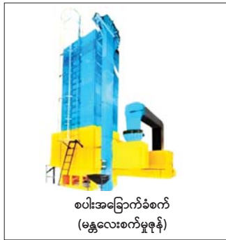
စပါးအခြောက်ခံစက် (မန္တလေးစက်မှုဇုန်)