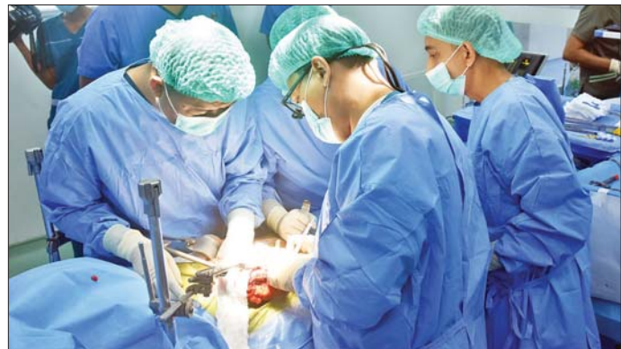
ခုနှစ်အတွင်း အသည်းအစားထိုးခွဲစိတ်ကုသမှုသုံးကြိမ်၊ လူနာကိုးဦး၊ ၂၀၂၄ ခုနှစ်အတွင်း အသည်းအစားထိုးခွဲစိတ်ကုသမှု သုံးကြိမ်၊

သည်။ အဆိုပါ အသည်းအစားထိုးခွဲစိတ်ကုသမှုကို တပ်မတော်မှ တာဝန်ရှိသူများက ကြည့်ရှုအားပေးကြပြီး ခွဲစိတ်ကုသမှုများကို ဧပြီ ၂၆ ရက်နှင့် ၂၇ ရက်တို့တွင် ဆက်လက်ဆောင်ရွက်သွားမည် ဖြစ်ကြောင်း သိရှိရသည်။ လူနာသုံးဦးဖြင့် ဆောင်ရွက်သွားမည့် တပ်မတော်တွင် ပထမအကြိမ် အသည်းအစားထိုးခွဲစိတ်ကုသမှုကို ၂၀၂၂ ခုနှစ် စက်တင်ဘာ ၂၇ ရက်နှင့် ၂၈ ရက်တို့တွင် အသည်းအစားထိုးလူနာ နှစ်ဦးဖြင့် အောင်မြင်စွာ ခွဲစိတ်ကုသဆောင်ရွက်နိုင်ခဲ့ပြီး အသည်းအစားထိုး ခွဲစိတ်ကုသမှုအား ဆက်လက်ဆောင်ရွက်ခဲ့ရာ ၂၀၂၃