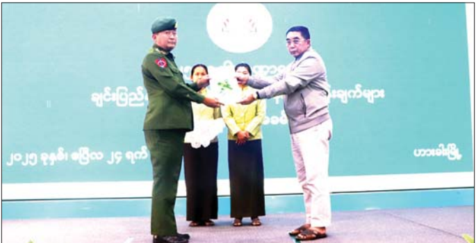
ငွေလုံးငွေရင်း ရန်ပုံငွေ၏ ၇၅ ဒသမ ၀၉ ရာခိုင်နှုန်း၊ သောက်သုံးရေနှင့် စိုက်ပျိုးရေးရရှိရေးအတွက် ၁၀ ဒသမ ၄၅ ရာခိုင်နှုန်းနှင့် မြို့ပြနှင့် ကျေးလက်စီးရီးရေးလုပ်ငန်းအတွက် ၅ ဒသမ ၄၁ ရာခိုင်နှုန်း လျာထားခဲ့ကြောင်း၊ ဒေသန္တရစီမံကိန်း ရည်မှန်းချက်များ

ဟားခါး ဧပြီ ၂၅ ၂၀၂၅-၂၀၂၆ ဘဏ္ဍာနှစ် ချင်းပြည်နယ်၏ ဒေသန္တရ စီမံကိန်းရည်မှန်းချက်များ တာဝန်ပေးအပ်ပွဲ အခမ်းအနားကို ဟားခါးမြို့ရှိ ချင်းပြည်နယ် အစိုးရအဖွဲ့ရုံး အစည်းအဝေးခန်းမ၌ ကျင်းပသည်။ ဦးစွာ ပြည်နယ်စီမံကိန်းကော်မရှင်ဥက္ကဋ္ဌ ပြည်နယ်ဝန်ကြီးချုပ် ဒေါက်တာဝန်ဆွန်းထွန်းက ချင်းပြည်နယ် သာယာဝပြောရေးနှင့် စားရေရိက္ခာ ဖူလုံရေးတို့အတွက် ပြည်သူ့လူမှုစီးပွားဘဝ ဖွံ့ဖြိုးတိုးတက်ရေးနှင့် ပြည်သူ့ကိုယ်ပိုင်ပြု၍ အားလုံး ပါဝင်နိုင်သော ရေရှည်ဖွံ့ဖြိုးတိုးတက်မှုရရှိစေရန် ရည်ရွယ်၍ ချင်းပြည်နယ်၏ ၂၀၂၅-၂၀၂၆ ဘဏ္ဍာနှစ် ဒေသန္တရစီမံကိန်းဥပဒေကို ရေးဆွဲခြင်းဖြစ်ပြီး ချင်းပြည်နယ်၏ ဂျီဒီပီတိုးတက်မှုကို ပုံမှန်ဈေးနှုန်းများအရ သုည ဒသမ ဝါးရာခိုင်နှုန်း တိုးတက်ရန် ရည်မှန်းထားကြောင်း၊ ယခုနှစ်တွင် ပြည်သူ့ကိုယ်ပိုင်အကျိုးရှိစေမည့် မြို့ပြလမ်း၊ ပြည်တောင်စုလမ်းနှင့် ပြည်နယ်လမ်းများဆောင်ရွက်ရန် ပြည်နယ်