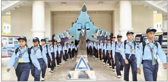
လေကြောင်းလူငယ်များ လေကြောင်းပညာဘာသာရပ်များနှင့် ပတ်သက်၍ လေ့လာစဉ်။

ပြည်နယ်၊ ဘားအံမြို့ရှိ ရေကြောင်း လူငယ်စခန်းမှ သင်တန်းသား၊ သင်တန်းသူ ၁၄၀ နှင့် ရှမ်းပြည်နယ် ကျိုင်းတုံမြို့ရှိ ရေကြောင်းလူငယ်စခန်းမှ သင်တန်း သား၊ သင်တန်းသူ ၆၀ တို့ကို သက်ဆိုင်ရာနယ်မြေ အသီးသီးမှ တာဝန်ရှိသူနည်းပြများက လေ့ကျင့် သင်ကြားပေးလျက်ရှိပြီး တပ်မတော်(ရေ)ရေကြောင်း လူငယ်သင်တန်းစခန်း ၁၁ ခု၌ သင်တန်းသား၊ သင်တန်းသူ စုစုပေါင်း ၈၀၀ တို့ကို လေ့ကျင့်သင်ကြား ပေးလျက်ရှိသည်။ အလားတူ တပ်မတော်(လေ)က အခြေခံ လေကြောင်းလူငယ်သင်တန်းအမှတ်စဉ် (၁/၂၀၂၅) နှင့် တန်းမြှင့်လေကြောင်းလူငယ် သင်တန်းအမှတ်စဉ် (၁/၂၀၂၅) သင်တန်းများကို ကာကွယ်ရေးဦးစီးချုပ်ရုံး (လေ)၏ ကြီးကြပ်ကွပ်ကဲမှုဖြင့် သင်တန်းစခန်း ၁၅ ခုတွင် စုစုပေါင်းသင်တန်းသား ၈၀၄ ဦးဖြင့် ဖွင့်လှစ်သင်ကြားလျက်ရှိရာ မိတ္ထီလာမြို့ရှိ မြန်မာ ပြည်မြောက်ပိုင်းသင်တန်းစခန်းမှ သင်တန်းသား ၅၀ နှင့် မိတ္ထီလာသင်တန်းစခန်းမှ သင်တန်းသား ၄၈ ဦး၊ မှော်ဘီမြို့ရှိ မြန်မာပြည်တောင်ပိုင်းသင်တန်း သတင်းစဉ်