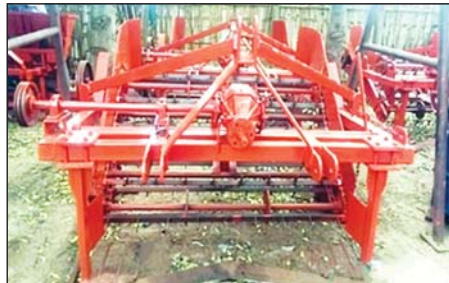
မြေပဲ/အာလူး တူးဖော်ကိရိယာ (ညောင်ဦးစက်မှုဇုန်)