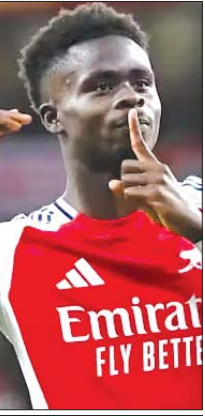
■ စောင့်ကြည့်ရမယ့် ကစားသမား ဆာကာ (၂၃ နှစ်) သွင်းဂိုး + ဂိုးဖန်တီးမှု = ၁၆ ကြိမ်