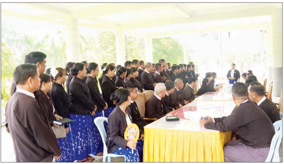
ဥပဒေရေးရာဝန်ကြီးဌာန ပြည်ထောင်စုဝန်ကြီးနှင့် ပြည်ထောင်စုရှေ့နေချုပ် ဒေါက်တာသီတာဦး နှစ်သစ်ကူးအခါသမယတွင် ပြည်ထောင်စု ရှေ့နေချုပ်ရုံး ဝန်ထမ်းများနှင့် တွေ့ဆုံအမှာစကားပြောကြားစဉ်။

မှု အဆင်ပြေစေရေးအတွက် မြို့နယ်၊ ရပ်ကွက်အလိုက် ယာယီ တည်းခိုရေးစခန်းများ စီစဉ် ဆောင်ရွက်ပေးထားသည်။ ကြုံကြိမ်ရင်ဆိုင်ကျော်လွှား ထို့အတူ ဝန်ထမ်းများ နေထိုင် စားသောက်မှု အဆင်ပြေစေရန် ယာယီ တည်းခိုရေးစခန်းများ တွင် စနစ်ကျသည့် သောက်သုံး ရေစနစ်၊ လျှပ်စစ်မီးစနစ်၊ ချက်ပြုတ် မှုစနစ်၊ မိလ္လာစနစ်နှင့် ကျန်းမာ ရေး ကြိုတင်ကာကွယ်မှုစနစ်တို့ ကို စီစဉ်ဆောင်ရွက်ပေးထားရာ ဝန်ထမ်းနှင့် ဝန်ထမ်းမိသားစုများ က အခက်အခဲများကို ကြုံကြိမ် ရင်ဆိုင်ကျော်လွှားလျက်ရှိသည်။ ထိုသို့ ဆောင်ရွက်ပေးခဲ့မှု ကြောင့် ယနေ့ မြန်မာနှစ်သစ်ကူး ရုံးပိတ်ရက်ကုန်ဆုံးသည့်နေ့တွင် နိုင်ငံဝန်ထမ်းများအားလုံးသည် မိမိနေထိုင်ရာ ယာယီတည်းခိုရေး စခန်းများ၊ နေထိုင်ရာနေရာများမှ ဌာနဆိုင်ရာကြိုပို့မော်တော်ယာဉ် များဖြင့် သက်ဆိုင်ရာရုံးဌာနများ သို့ စုံလင်စွာ တက်ရောက်လာကြ ပြီး သက်ဆိုင်ရာ ရုံးလုပ်ငန်း တာဝန်များကို လူသစ်၊ စိတ်သစ်၊ ခွန်အားသစ်များဖြင့် စတင် ဆောင်ရွက်လျက်ရှိကြသည်။