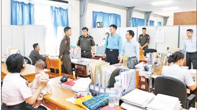
ပါရမီ မိုးကုတ်ရိပ်သာသို့သွားရောက်၍ ကျောင်းထိုင် ဆက်ကပ်လှူဒါန်းခဲ့ကြောင်း သတင်းရရှိသည်။ ဆရာတော်အားဖူးမြော်ကာ လှူဖွယ်ဝတ္ထုပစ္စည်းများ သတင်းစဉ်

ကို ကဏ္ဍအလိုက် သတ်မှတ်ချိန်အမျိုးမျိုး၊ ရုံးအဆောက်အအုံများ ပြန်လည်ပြုပြင်ပြီးစီးမှု၊ ယာယီရွှေ့ပြောင်းနေထိုင်ရာနေရာများ လုံခြုံရေး၊ သောက်သုံးရေနှင့် လျှပ်စစ်စီးရရှိရေး၊ မိလ္လာများ ကောင်းမွန်ရေး၊ ဝန်ထမ်းများ သတိမှတ်အင်အား အချိုးအစားအတိုင်း ရုံးပြန်လည်တက်ရောက်နိုင် ရေးနှင့် ရုံးခန်းများအလိုက် သန့်ရှင်းသပ်ရပ်စွာ လုပ်ငန်းများဆောင်ရွက်နိုင်ရေးအတွက် စီမံ ဆောင်ရွက်ပေးရေးနှင့် ယာယီရွှေ့ပြောင်းနေထိုင်ရာ နေရာများကို မိုးရာသီတွင် အဆင်ပြေစွာနေထိုင်နိုင် ရေး စီစဉ်ဆောင်ရွက်ပေးရေးတို့ကို မှာကြားပြီး တာဝန်ရှိသူများ၏ လုပ်ငန်းဆိုင်ရာ တင်ပြချက်များ အပေါ် လိုအပ်သည်များ ညှိနှိုင်းဖြည့်ဆည်း ဆောင်ရွက်ပေးသည်။ မွန်းလွဲပိုင်းတွင် ပြည်ထောင်စုဝန်ကြီးသည် တာဝန်ရှိသူများနှင့်အတူ ပုဗ္ဗသိရိမြို့နယ် မဟာဓမ္မ