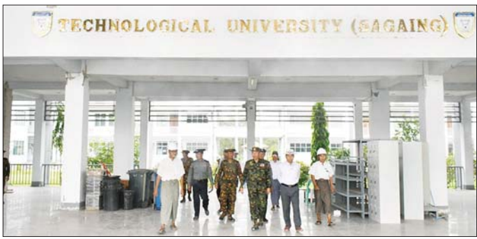
တိုင်းဒေသကြီးဝန်ကြီးချုပ် ဦးမြတ်ကျော်၊ ကာကွယ်ရေးဦးစီးချုပ်ရုံး (ကြည်း)မှ ဒုတိယဗိုလ်ချုပ်ကြီးသက်ဝဲ စစ်ကိုင်းမြို့ နည်းပညာတက္ကသိုလ် (စစ်ကိုင်း)သို့ သွားရောက်ကြည့်ရှုစစ်ဆေးစဉ်။

သောတပန်ရပ်ကွက် သံပုဏ္ဏာရာမကျောင်းတိုက် ကျောင်းပရိဝဏ်အတွင်း၌ ငလျင်ဒဏ်သင့် ရဟန်း၊ သံဃာ၊ သီလရှင်၊ ပြည်သူများအား တပ်မတော်နယ်လှည့်ဆေးကုသရေးအဖွဲ့က ဆေးကုသရေးလုပ်ငန်းများ ဆောင်ရွက်နေမှုများကိုလည်းကောင်း၊ ကြည့်ရှုအားပေး၍ လိုအပ်သည်များ ညှိနှိုင်းဆောင်ရွက်ပေးသည်။ အလားတူ ငလျင်ဒဏ်သင့် နေရာများရှိ ဆောင်ရွက်ရန်ကျန်အဆောက်အအုံ အပျက်အစီးများ စနစ်တကျစစ်ဆေး အဆင့်သတ်မှတ်ချက်အရောင်များ ခွဲခြား