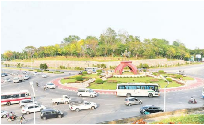
နေပြည်တော်ကောင်စီနယ်မြေအတွင်း ဝန်ကြီးဌာနအသီးသီးမှ ဝန်ထမ်းများ ရုံးတက်/ရုံးဆင်းချိန် မော်တော်ယာဉ်များ မောင်းနှင်သွားလာမှု။