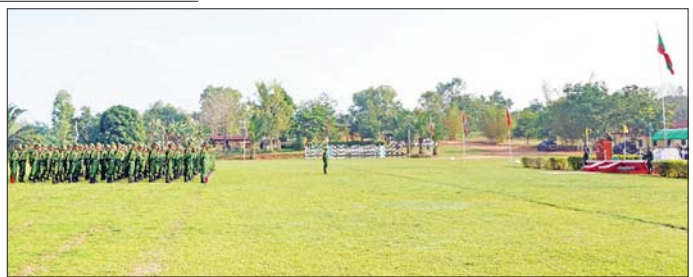
တိုင်းစစ်ဌာနချုပ်များ၌ ပြည်သူ့စစ်မှုထမ်းသင်တန်းအမှတ်စဉ်(၁၂)သင်တန်းဖွင့်ပွဲများ ကျင်းပစဉ်။