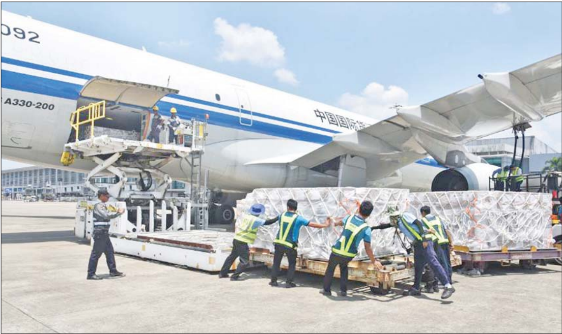
တရုတ်ပြည်သူ့သမ္မတနိုင်ငံမှ လူသားချင်းစာနာထောက်ထားမှုဆိုင်ရာ အကူအညီပစ္စည်းများ တင်ဆောင်လာသည့်လေယာဉ် ရန်ကုန်အပြည်ပြည်ဆိုင်ရာလေဆိပ်သို့ ရောက်ရှိလာမှုကို တွေ့ရစဉ်။