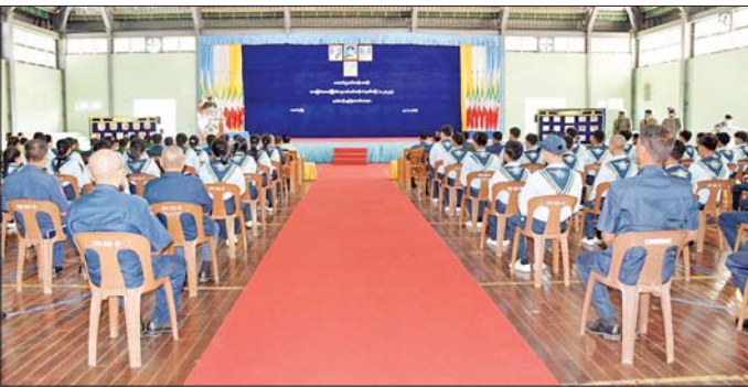
တောင်ပိုင်းတိုင်းစစ်ဌာနချုပ် တောင်ငူသင်တန်းစခန်း၌ အခြေခံလေကြောင်းလူငယ်သင်တန်းဖွင့်ပွဲ အခမ်းအနားကျင်းပစဉ်။