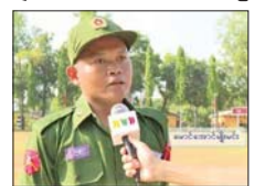
(၂) ပြည်သူ့စစ်မှုထမ်း သင်တန်းသားတစ်ဦး

(၂)နိုင်ငံသားတစ်ယောက်ဖြစ်လာတဲ့အတွက် ဒီနိုင်ငံကချမှတ်ထားတဲ့ဥပဒေကို လေးစားလိုက်နာဖို့ လည်းလိုအပ်တယ်။ အဲဒီအတွက် ကျွန်တော်က ပြည်သူ့စစ်မှုထမ်းဥပဒေထဲမှာ ကျွန်တော်လည်း အသက်အကန့်အသတ်ထဲမှာ ပါဝင်တဲ့ လူတစ်ယောက်ဖြစ်တဲ့အတွက် နိုင်ငံသားတာဝန်ကျေပွန်ဖို့အတွက် စစ်မှုထမ်းဝင်ရောက်လာခြင်း ဖြစ်ပါတယ်။ ရှေ့လျှောက်ပြီး သင်တန်းကာလပြီးသွားတဲ့ အခါမှာ ကိုယ်တာဝန်ထမ်းဆောင်ရမယ့် မိခင်တပ်ရင်းကို ရောက်တဲ့အခါမှာလည်း တပ်မတော်ကပေးအပ်တဲ့ တာဝန်တွေနဲ့ နိုင်ငံသားတစ်ယောက်ရဲ့ တာဝန်တွေကို ကျေပွန်အောင် ထမ်းဆောင်သွားဖို့ ဆုံးဖြတ်ချက်ချထားပါတယ်။ သတင်းစဉ်