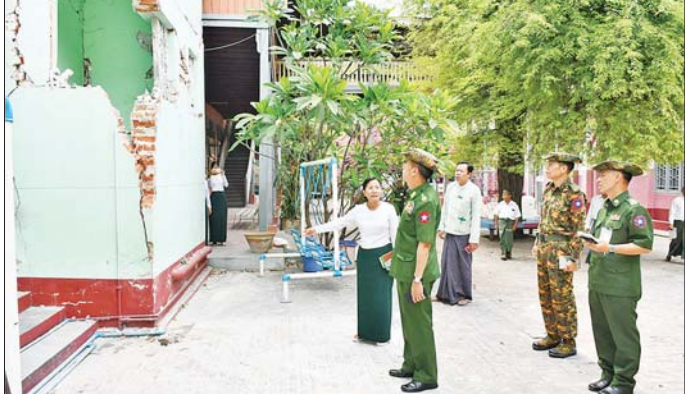
ကာကွယ်ရေးဦးစီးချုပ်ရုံး (ကြည်း)မှ ဒုတိယဗိုလ်ချုပ်ကြီး မျိုးမိုးအောင် မန္တလေးမြို့ အောင်မြေသာစံမြို့နယ်ရှိ အမှတ် (၁) အခြေခံပညာအထက်တန်းကျောင်းသို့ သွားရောက်၍ ငလျင်ဒဏ်သင့်၍ ပြိုကျပျက်စီးခဲ့သော အပျက်အစီးများအား ဖယ်ရှားရှင်းလင်းနေမှု သွားရောက်ကြည့်ရှုစစ်ဆေးစဉ်။