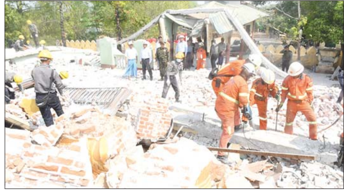
တိုင်းဒေသကြီးဝန်ကြီးချုပ်နှင့် ဒုတိယဗိုလ်ချုပ်ကြီး သက်ဝဲ မရှိခဏစေတီနှင့် ထူပါရုံရွှေကျောင်းတိုက်တို့တွင် အပျက်အစီးများအား ကူညီကယ်ဆယ်ရေးအဖွဲ့များ ရှင်းလင်းမှုကို ကြည့်ရှုစစ်ဆေးစဉ်။

ထိုသို့ ဆောင်ရွက်ပေးလျက်ရှိရာ ယနေ့နံနက်ပိုင်းတွင် စစ်ကိုင်းတိုင်းဒေသကြီး ဝန်ကြီးချုပ် ဦးမြတ်ကျော်၊ ကာကွယ်ရေးဦးစီးချုပ်ရုံး (ကြည်း)မှ ဒုတိယဗိုလ်ချုပ်ကြီး သက်ဝဲနှင့် တာဝန်ရှိသူများသည် စစ်ကိုင်းမြို့ သောတပန်ရပ်ကွက်ရှိ လေးကျွန်းမာရ်အောင်မြတ်စွာဘုရား၏ ဓမ္မာဂူတရောင်ခြည် လေးကျွန်းမာရ်အောင် မြတ်စွာဘုရားကြီး ပြန်လည်ပြုပြင်မွမ်းမံရန်အတွက် အပြည်ပြည်ဆိုင်ရာ ထေရဝါဒ ဗုဒ္ဓသာသနာပြု တက္ကသိုလ် ပါမောက္ခချုပ် ဆရာတော် အဂ္ဂမဟာ ပဏ္ဍိတ ဒေါက်တာ ဘဒ္ဒန္တဆောက်နွ အမျိုးပြုသော ဆရာတော်များထံမှ ဆုံးမဩဝါဒစကား ခံယူကြသည်။