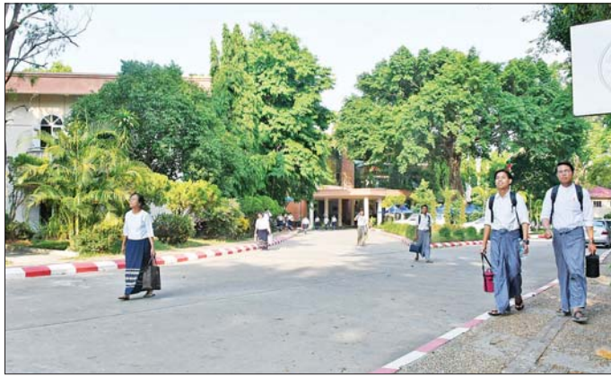
နေပြည်တော်ကောင်စီနယ်မြေအတွင်း ဝန်ကြီးဌာနရုံးများ ပြန်လည်ဖွင့်လှစ်၍ ရုံးသူရုံးသားများ ရုံးသို့ လာရောက်စဉ်။

စာမျက်နှာ ၆ မှ လုပ်ငန်းမပျက် ပြန်လည်လည်ပတ် နိုင်ငံတော် ဝန်ကြီးချုပ်က လည်း ယခုရက်မှစတင်၍ လုပ်ငန်း များ ပြန်လည်စတင်လည်ပတ် ရန် လမ်းညွှန်မှာကြားထားပြီး ဖြစ်ကြောင်း၊ သတင်းများထုတ်ပြန် ရေးနှင့်ပတ်သက်၍ အသေးစိတ်