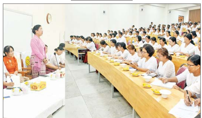
ပြည်ထောင်စုစာရင်းစစ်ချုပ် ဒေါက်တာခင်နိုင်ဦး နှစ်သစ်ကူးအခါသမယတွင် ဝန်ထမ်းများနှင့် တွေ့ဆုံ အမှာစကားပြောကြားစဉ်။