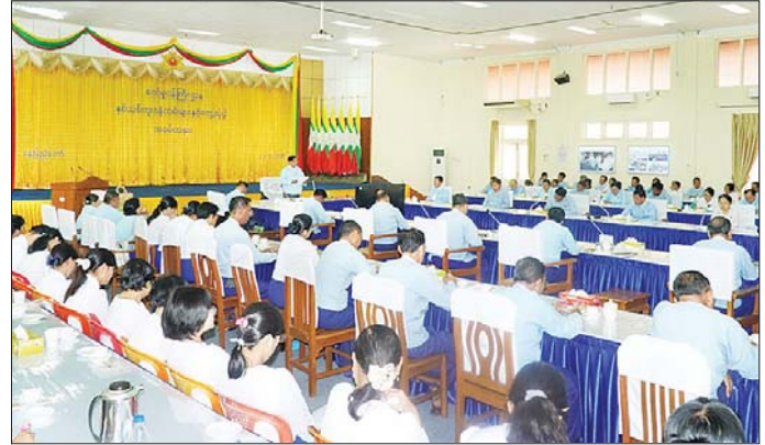
စက်မှုဝန်ကြီးဌာန ပြည်ထောင်စုဝန်ကြီး ဒေါက်တာချာလီသန်း နှစ်သစ်ကူးအခါသမယတွင် ဝန်ထမ်းများနှင့် တွေ့ဆုံအမှာစကားပြောကြားစဉ်။