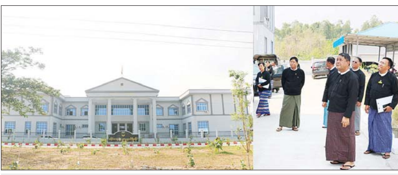
ပြည်ထောင်စုတရားသူကြီးချုပ် ဦးသာဌေး ပြည်ထောင်စုတရားလွှတ်တော်ချုပ်ရုံးထိုင်မည့် ဇေယျာသီရိခရိုင်တရားရုံးကို ကြည့်ရှုစစ်ဆေးစဉ်။

နေပြည်တော် ဧပြီ ၂၂ မတ် ၂၈ ရက်က လှုပ်ခတ်ခဲ့သော မန္တလေး ငလျင်ကြီးကြောင့် ပြည်ထောင်စု တရားလွှတ်တော်ချုပ် ပင်မအဆောက် အအုံ၌ ထိခိုက်ပျက်စီးဆုံးရှုံးမှုများ ကြီးမားစွာဖြစ်ပေါ်ခဲ့သဖြင့် ပြည်ထောင်စု တရားလွှတ်တော်ချုပ် တရားခွင်များကို ဇေယျာသီရိခရိုင် တရားရုံးသို့ ပြောင်းရွှေ့ ရုံးထိုင်မည့်ဖြစ်ရာ ပြည်ထောင်စု တရားသူကြီးချုပ် ဦးသာဌေးသည် ယနေ့နံနက်ပိုင်းတွင် ဇေယျာသီရိခရိုင် တရားရုံးသို့ရောက်ရှိပြီး ပြည်ထောင်စု တရားလွှတ်တော်ချုပ် တရားခွင်များ ဖြစ်သည့် စုံညီခုံရုံး၊ အထူးအယူခံခုံရုံး၊ အထူးခုံရုံး၊ ရာဇဝတ်ဆိုင်ရာနှင့် တရားမ ဆိုင်ရာ အယူခံ၊ ပြင်ဆင်မှုများအတွက် ရုံးထိုင်မည့်တရားခွင်များ ပြင်ဆင် ထားရှိမှုကို လှည့်လည်ကြည့်ရှုစစ်ဆေး သည်။ ထိုသို့စစ်ဆေးစဉ်အဖြစ်အတွင်းဝန် နှင့် တာဝန်ရှိသူများက စုံညီခုံရုံး၊ အထူး အယူခံခုံရုံး၊ အထူးခုံရုံးနှင့် အယူခံ၊ ပြင်ဆင်ခုံရုံးများအတွက် ရုံးထိုင်ရန် ပြင်ဆင်ဆောင်ရွက်ထားသည့် အခြေ