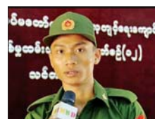
(၁) ပြည်သူ့စစ်မှုထမ်း သင်တန်းသားတစ်ဦး

နေကြရတယ်ဆိုတဲ့ ခေါင်းစဉ်အောက်မှာ ပိတ်မိနေတာ အများကြီးရှိပါတယ်။ အဲဒီအတွက် ကြောင့် တပ်ထဲရောက်လာတဲ့ အခါ စည်းမျဉ်းစည်းကမ်းတွေ၊ လူမှုဘဝနေထိုင်မှုနဲ့ ပတ်သက်တဲ့ အရာတွေ သင်ယူပြီးသားဖြစ်သွားမှာဖြစ်တဲ့အတွက် လုပ်ငန်းပိုင်းရော လူမှုဆက်ဆံရေးပါ အများကြီးအဆင်ပြေ တိုးတက်သွားလိမ့်မယ်လို့ ထင်ပါတယ်။ သင်တန်းကာလမှာ ကျွန်တော်တို့ ကြိုခွဲရတာတွေနဲ့ အပြင်မှာ ကြားနေရတဲ့ဟာတွေက ဆိုရယ်