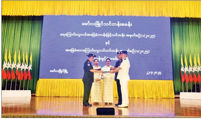
အရှေ့တောင်တိုင်းစစ်ဌာနချုပ်တိုင်းမှူး ရေကြောင်းလူငယ်နှင့် လေကြောင်းလူငယ် သင်တန်းသားများအတွက် ထောက်ပံ့ငွေများ ပေးအပ်စဉ်။