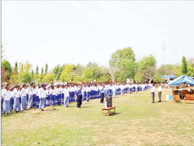
အလုပ်သမားဝန်ကြီးဌာန ပြည်ထောင်စုဝန်ကြီး ဦးချစ်ဆွေ နှစ်သစ်ကူးအခါသမယတွင် ရုံးလုပ်ငန်းစဉ်များ ပုံမှန်လည်ပတ်လုပ်ကိုင်နိုင်ရေး ဝန်ထမ်းများကို လမ်းညွှန်မှာကြားစဉ်။