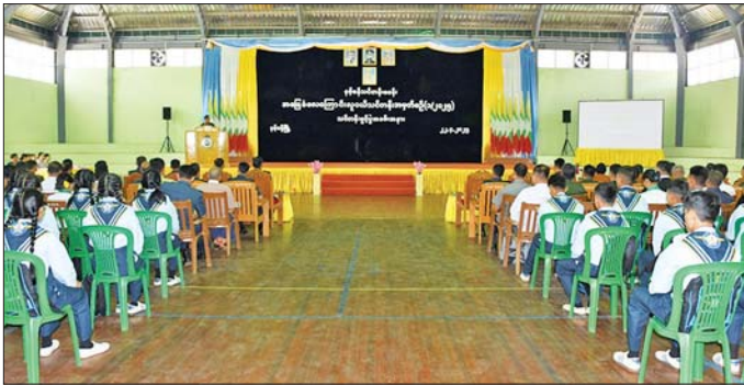
အရှေ့အလယ်ပိုင်းတိုင်းစစ်ဌာနချုပ် နမ့်စန်လေတပ်စခန်း၌ အခြေခံလေကြောင်းလူငယ်သင်တန်း ဖွင့်ပွဲအခမ်းအနားကျင်းပစဉ်။

စာမျက်နှာ ၁၁ မှ တိုင်းမှူးများ၊ ရေတပ်ကွပ်ကဲမှုဌာနချုပ်မှူးများ၊ ရေတပ်စခန်းဌာနချုပ်မှူးများနှင့် တာဝန်ရှိသူများ တက်ရောက်၍ ဖွင့်လှစ်ပေးကြသည်။ ရေကြောင်းလူငယ်အခြေခံသင်တန်းနှင့် တန်းမြင့် သင်တန်းများတွင် တပ်မတော်(ရေ)သမိုင်း၊ လွတ်လပ် ရေးကြိုးပမ်းမှုနှင့် တပ်မတော်သမိုင်းဘာသာရပ်၊ အခြေခံစစ်ရေးပြနှင့် အခြေခံရေတပ်သားဘာသာ ရပ်၊ ရေကြောင်းလမ်းညွှန် အခြေခံသဘောတရားများ၊ အသုံးချရေကြောင်းလမ်းညွှန်နှင့် နက္ခတ္တဗေဒဆိုင်ရာ များ၊ ဂျီပီအက်စ်အီအီအေ ရေကြောင်းသွားလာရေး ဆိုင်ရာများ၊ အခြေခံရေတပ်သားအချက်ပြ ဆက်သွယ် ရေးဆိုင်ရာ၊ အခြေခံရေကူးနှင့် လေ့လာရွက်တိုက် နည်းတို့ကို သင်ကြားပေးသွားမည်ဖြစ်ပြီး သင်တန်း စခန်း ၁၁ ခုမှ သင်တန်းသား၊ သင်တန်းသူများအား သင်တန်းစတုတ္ထပတ်၌ ရန်ကုန်မြို့တွင် စုစည်း၍ စခန်းပိုင်းစုံတွေ့ဆုံပွဲ၊ ဘာသာရပ်ဆိုင်ရာ စွမ်းရည် ပြိုင်ပွဲများလည်း ပြုလုပ်သွားမည်ဖြစ်သည်။ ထို့အပြင် လေ့လာရေးခရီးစဉ်များအဖြစ် နေပြည်တော်ကောင်စီနယ်မြေနှင့် ရန်ကုန်မြို့တို့ရှိ အထင်ကရနေရာများ၊ နျူကလီးယားနည်းပညာ သတင်းအချက်အလက်စင်တာ လေ့လာရေးနှင့် စစ်ရေယာဉ်လေ့လာရေးများအပြင် ရန်ကုန်မြစ်ဝသို့ ရေလမ်းကြောင်းလေ့လာရေးခရီးစဉ် ပို့ဆောင်ခြင်း များကိုလည်း ပြုလုပ်သွားမည်ဖြစ်ကြောင်း သိရှိ ရသည်။ အဆိုပါ ရေကြောင်းလူငယ်အခြေခံနှင့် တန်းမြင့် သင်တန်းအမှတ်စဉ် (၁/၂၀၂၅) ကို မေ ၂၃ ရက် အထိ ရက်သတ္တ ငါးပတ်ကြာ သင်ကြားပို့ချပေးသွား မည်ဖြစ်ကြောင်း သိရသည်။ ယင်းသင်တန်းများကို ၁၉၉၇ ခုနှစ်မှ စတင်၍ ဖွင့်လှစ်ခဲ့ခြင်းဖြစ်ပြီး ၂၀၂၄ ခုနှစ်အထိ ရေကြောင်းလူငယ်အခြေခံနှင့် တန်းမြင့် သင်တန်းသား သင်တန်းသူ စုစုပေါင်း ၅၅၅၀ တို့ အား ဖွင့်လှစ်သင်ကြားပေးနိုင်ခဲ့ပြီးဖြစ်ကြောင်း သိရ သည်။