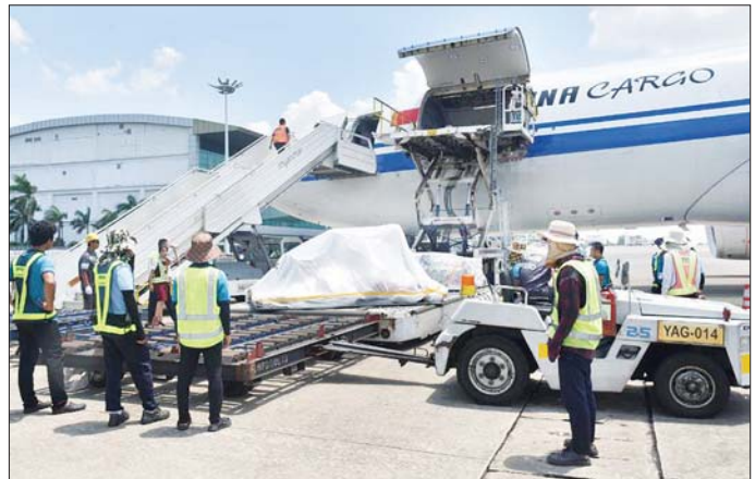
တရုတ်ပြည်သူ့သမ္မတနိုင်ငံမှ လူသားချင်းစာနာထောက်ထားမှုဆိုင်ရာ အကူအညီပစ္စည်းများ တင်ဆောင် လာသည့်လေယာဉ် ရန်ကုန်အပြည်ပြည်ဆိုင်ရာလေဆိပ်သို့ ရောက်ရှိလာမှုကို တွေ့ရစဉ်။

ထုတ်ပြန်လိုက်သည်။ ၅။ ယာယီပစ်ခတ်တိုက်ခိုက်မှု ထုတ်ပြန်ကြေညာထားသည့်ကာလအတွင်း တိုင်းရင်းသားလက်နက်ကိုင် အဖွဲ့များနှင့် အခြားလက်နက်ကိုင်အဖွဲ့များအနေဖြင့် အများပြည်သူ သွားလာအသုံးပြုလျက်ရှိသည့် ဆက်သွယ်ရေးလမ်းကြောင်းများအား နှောင့်ယှက်တိုက်ခိုက်ခြင်းနှင့် ထိခိုက်ပျက်စီးစေခြင်း၊ ပြည်သူ လူထု၏ အသက်အိုးအိမ်စည်းစိမ်ကို ထိခိုက်ပျက်စီးစေခြင်း၊ လုံခြုံရေးနှင့် တရားဥပဒေစိုးမိုးရေးတာဝန် ထမ်းဆောင်လျက်ရှိသည့် လုံခြုံရေးတပ်ဖွဲ့ဝင်များ၏ တပ်စခန်းများအား တိုက်ခိုက်ခြင်း၊ တပ်ဌာနချုပ် များကို နှောင့်ယှက်တိုက်ခိုက်ခြင်းများ၊ ငြိမ်းချမ်းရေးကို ထိခိုက်ပျက်စီးစေမည့် အင်အားစုဆောင်းခြင်း၊ ပြင်ဆင်စွဲခြင်း၊ နယ်မြေချဲ့ထွင်ခြင်းများကို မပြုရန်နှင့် ထိုကဲ့သို့ ဆောင်ရွက်လာပါက တပ်မတော်အနေဖြင့် ပြည်သူလူထုကို ကာကွယ်သောအားဖြင့် လိုအပ်သည့်အရေးယူ တုံ့ပြန်မှုများကို ဆောင်ရွက်သွားမည် ဖြစ်ကြောင်း အသိပေးထုတ်ပြန်အပ်ပါသည်။ တပ်မတော်ကာကွယ်ရေးဦးစီးချုပ်ရုံး