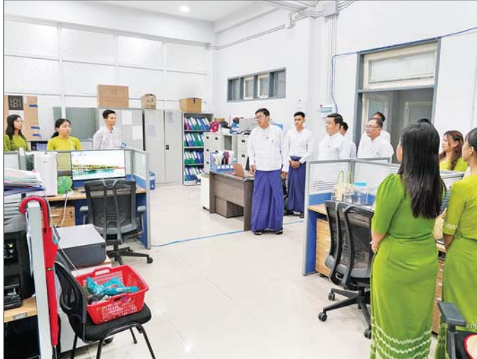
ဟိုတယ်နှင့် ခရီးသွားလာရေးဝန်ကြီးဌာန ပြည်ထောင်စုဝန်ကြီး ဦးကျော်စိုးဝင်း ဝန်ကြီးဌာနရှိ ဌာနအလိုက် ဝန်ထမ်းများ ရုံးလုပ်ငန်းပုံမှန်ဆောင်ရွက်မှုအခြေအနေများကို ကြည့်ရှုစစ်ဆေးစဉ်။