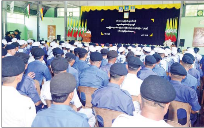
ဧရာဝတီရေတပ်စခန်းဌာနချုပ် ရေကြောင်းလူငယ်အခြေခံ၊ တန်းမြင့်သင်တန်းဖွင့်ပွဲအခမ်းအနားကျင်းပစဉ်။