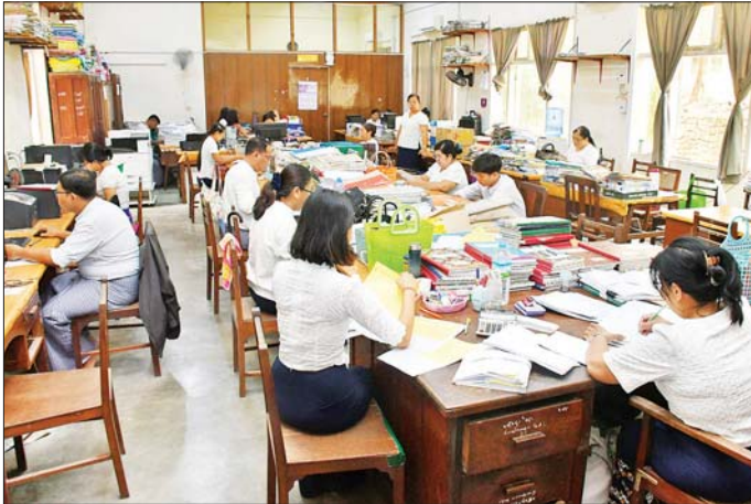
နေပြည်တော်ကောင်စီနယ်မြေ ဝန်ကြီးဌာနအသီးသီးတွင် ရုံးလုပ်ငန်းစဉ်များ ပုံမှန်လည်ပတ်လုပ်ကိုင်လျက်ရှိသည်ကို တွေ့ရစဉ်။