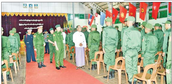
တိုင်းဒေသကြီးဝန်ကြီးချုပ်များနှင့် တိုင်းမှူးများက ပြည်သူ့စစ်မှုထမ်းသင်တန်းအမှတ်စဉ်(၁၂)သင်တန်းမှ သင်တန်းသားများအား ရင်းရင်းနှီးနှီး လိုက်လံနှုတ်ဆက်စဉ်။