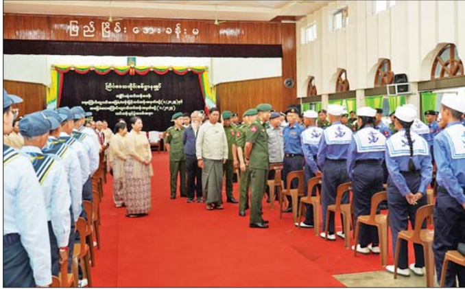
တိုက်ဒေသတိုင်းစစ်ဌာနချုပ် တိုင်းမှူးနှင့်တာဝန်ရှိသူများ လေကြောင်းလူငယ်အခြေခံ တန်းမြင့် သင်တန်းဖွင့်ပွဲအခမ်းအနားတွင် သင်တန်းသားများအား ရင်းရင်းနှီးနှီး နှုတ်ဆက်စဉ်။