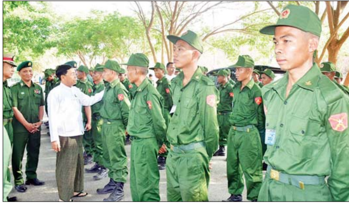
နေပြည်တော်ကောင်စီဥက္ကဋ္ဌ ဦးသန်းထွန်းဦး ပြည်သူ့စစ်မှုထမ်းသင်တန်းသားများအား ရင်းရင်းနှီးနှီးနှုတ်ဆက်စဉ်။

များကို ဂုဏ်ယူစွာထမ်းဆောင်ရန် သင်တန်း တက်ရောက်ကြမည့် သင်တန်းသားများ၏ စကားသံများကိုလည်း ယခုလိုပဲ ကြားသိရပါသည် -