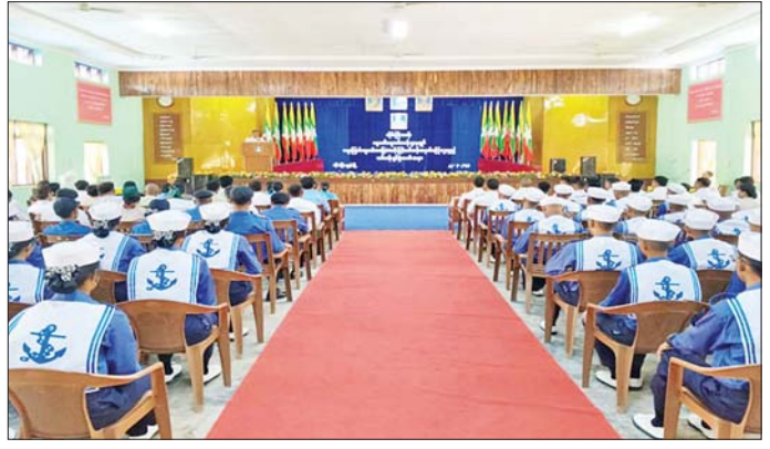
အနောက်တောင်တိုင်းစစ်ဌာနချုပ် ဟိုင်းကြီးကျွန်းမြို့ ပဗ္ဗဝတီရေတပ်စခန်းဌာနချုပ်၌ ရေကြောင်းလူငယ်အခြေခံ၊ တန်းမြင့်သင်တန်းဖွင့်ပွဲအခမ်းအနားကျင်းပစဉ်။