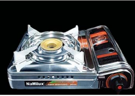
မွန်ပြည်နယ်၌ ဖမ်းဆီးရမိမှု။

နေပြည်တော် ဧပြီ ၂၂ တရားမဝင်ကုန်သွယ်မှုတိုက်ဖျက်ရေးဦးဆောင်ကော်မတီ၏ ကြီးကြပ်ကွပ်ကဲမှုဖြင့် တရားမဝင်ကုန်သွယ်မှုများကို ဥပဒေနှင့်အညီ ထိရောက်စွာ တားဆီးအရေးယူနိုင်ရေး ဆောင်ရွက်လျက်ရှိရာ ဧပြီ ၂၁ ရက်တွင် တနင်္သာရီတိုင်းဒေသကြီး တရားမဝင်ကုန်သွယ်မှုတိုက်ဖျက်ရေးအထူးအဖွဲ့၏ စီမံခန့်ခွဲမှုဖြင့် တာဝန်ကျပူးပေါင်းအဖွဲ့များက စစ်ဆေးမှုများဆောင်ရွက်ခဲ့ရာ ကော့သောင်းမြို့ ရွှေလာသီရိရပ်ကွက် ရွာမလမ်းအမှတ်(44A,45-1)ရှိ ဝိုင်းခေါင်၌ တရားဝင်စာရွက်စာတမ်းအထောက်အထား တင်ပြနိုင်ခြင်းမရှိသည့် လူသုံးကုန်ပစ္စည်းတစ်မျိုး (ခန့်မှန်း တန်ဖိုးငွေကျပ် ၄၈၅၅၀၀၀) ကိုလည်းကောင်း၊ ကော့သောင်းမြို့ အေးရိပ်ပြိမ်ရပ်ကွက် ရေခဲစက်လမ်းရှိ ကမ်းနားဝိုင်းခေါင်၌ တရားဝင်စာရွက်စာတမ်းအထောက်အထားတင်ပြနိုင်ခြင်းမရှိသည့် လုပ်ငန်းသုံးပစ္စည်းတစ်မျိုး (ခန့်မှန်းတန်ဖိုး ငွေကျပ် ၆၀၇၆၀၀၀)ကို လည်းကောင်း၊ စုစုပေါင်း ခန့်မှန်းတန်ဖိုးငွေကျပ် ၁၀၉၅၁၀၀၀ ကို ဖမ်းဆီးရမိခဲ့ပြီး အကောက်ခွန်လုပ်ထုံးလုပ်နည်းများနှင့်အညီ အရေးယူဆောင်ရွက်လျက် ရှိသည်။ ထို့အတူ မွန်ပြည်နယ်တရားမဝင်ကုန်သွယ်မှုတိုက်ဖျက်ရေးအထူးအဖွဲ့၏စီမံခန့်ခွဲမှုဖြင့် တာဝန်ကျပူးပေါင်းအဖွဲ့က စစ်ဆေးမှုများ