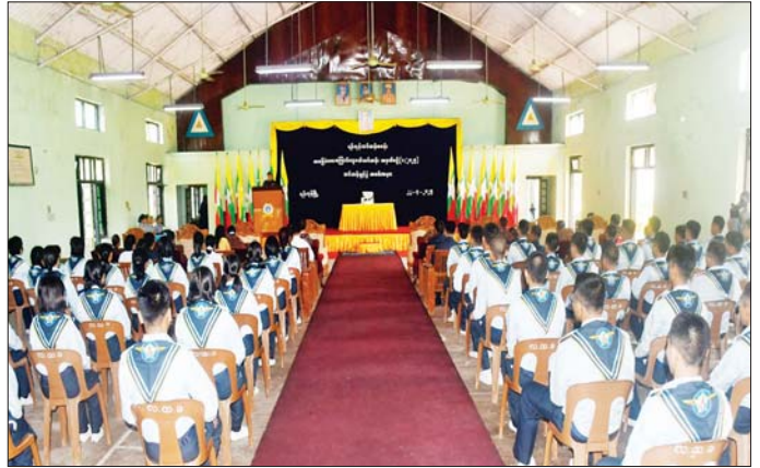
ရန်ကုန်သင်တန်းစခန်း၌ အခြေခံလေကြောင်းလူငယ်သင်တန်း(၁/၂၀၂၅) ဖွင့်ပွဲအခမ်းအနား ကျင်းပစဉ်။