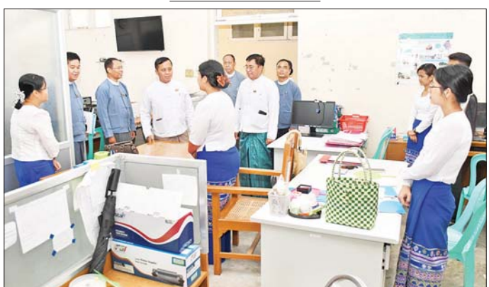
တိုင်းရင်းသားလူမျိုးများရေးရာဝန်ကြီးဌာန ပြည်ထောင်စုဝန်ကြီး ခွန်သန့်ဇော်ထူး ဝန်ကြီးဌာနရှိ ဝန်ထမ်း များ ရုံးလုပ်ငန်းပုံမှန်ဆောင်ရွက်မှုအခြေအနေများကို ကြည့်ရှုစစ်ဆေးစဉ်။