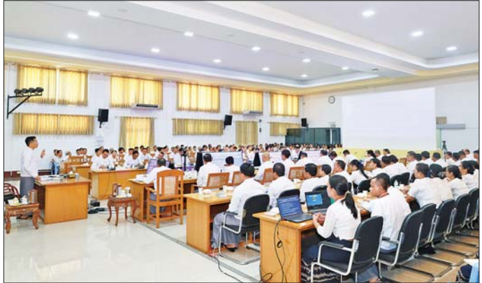
စွမ်းအင်ဝန်ကြီးဌာန ပြည်ထောင်စုဝန်ကြီး ဦးကိုကိုလွင် နှစ်သစ်ကူးအခါသမယတွင် ဝန်ထမ်းများနှင့် တွေ့ဆုံအမှာစကားပြောကြားစဉ်။

ဒဏ်ကြောင့် ပြိုကျပျက်စီးမှုများ ကို ကယ်ဆယ်ရေးလုပ်ငန်းများ ဆောင်ရွက်ပြီးဖြစ်ကာ ပြန်လည် ထူထောင်ရေးလုပ်ငန်းများ စတင် ပြီး အစိုးရယန္တရား ပုံမှန်လည်ပတ် မှ စတင်သည့် အချိန်ကာလလည်း ဖြစ်ကြောင်း။ စာမျက်နှာ ၇ သို့