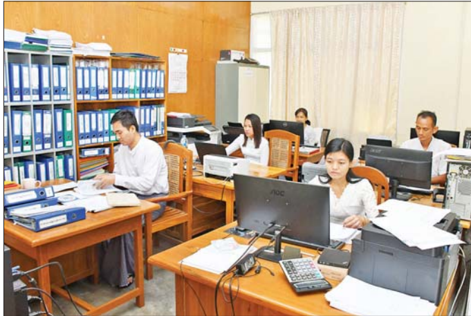
နေပြည်တော်ကောင်စီနယ်မြေအတွင်း ဝန်ကြီးဌာနရုံးများ ပြန်လည်ဖွင့်လှစ်၍ ရုံးသူရုံးသားများ ရုံးသို့ လာရောက်စဉ်။