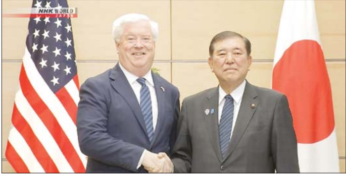
ဂျပန်နိုင်ငံဆိုင်ရာ အမေရိကန်သံအမတ်ကြီး ဂျော့ဂျီဂလက်စ်နှင့် ဂျပန်ဝန်ကြီးချုပ် အိရှိတာ ရှိဂရက။

ယုံကြည်ချက်တိုးတက်လာစေရန် အဆိုပါကိစ္စရပ်များကို သင့်တော်သလိုဆောင်ရွက်ပေးရန် အရေးကြီးကြောင်း ဂျပန်ဝန်ကြီးချုပ်က ပြောကြားခဲ့သည်။ နောက်ထပ်ကိစ္စရပ်တွေ မဖြစ်အောင်လည်း ဝန်ကြီးချုပ်က တိုက်တွန်းပြောကြားခဲ့သည်။ ဂလက်စ်က