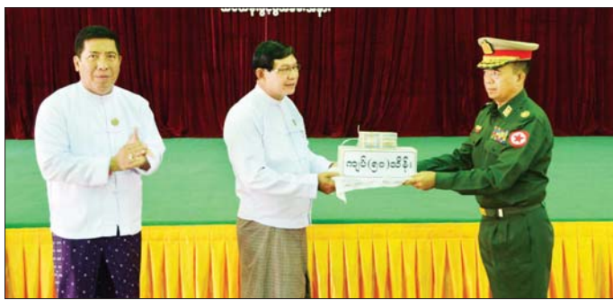
ရန်ကုန်တိုင်းဒေသကြီး ဝန်ကြီးချုပ် ဦးစိုးသိန်း ပြည်သူ့စစ်မှုထမ်းသင်တန်းသားများအတွက် ဂုဏ်ပြုချီးမြှင့်ငွေများ ပေးအပ်စဉ်။

ယနေ့တွင် ဖွင့်လှစ်လိုက်သည့် ပြည်သူ့စစ်မှုထမ်း သင်တန်းအမှတ်စဉ်(၁၂)မှ နိုင်ငံသားကောင်း လူငယ်များအဖြစ် နိုင်ငံတော်ကာကွယ်ရေးနှင့် လုံခြုံရေးတာဝန်