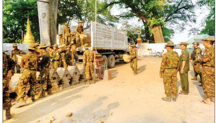
ကာကွယ်ရေးဦးစီးချုပ်ရုံး (ကြည်း)မှ ဒုတိယဗိုလ်ချုပ်ကြီး စိုးတင့်နိုင် အမရပူရမြို့နယ်ရှိ တောင်မင်းကြီးမြတ်စွာဘုရားအတွင်းရှိ နေရာများတွင် အပျက်အစီးများအား တပ်မတော်သားများ ပူးပေါင်း၍ အပျက်အစီးများ ဖယ်ရှားရှင်းလင်းပြီး သန့်ရှင်းရေးဆောင်ရွက်နေမှုအား သွားရောက်ကြည့်ရှုအားပေးစဉ်။