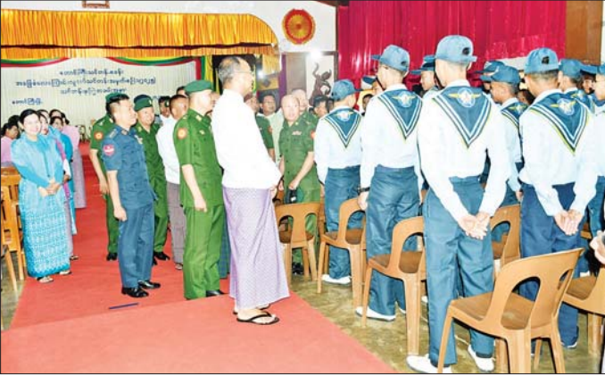
အရှေ့ပိုင်းတိုင်းစစ်ဌာနချုပ် အခြေခံလေကြောင်းလူငယ်သင်တန်း ဖွင့်ပွဲအခမ်းအနားတွင် ရှမ်းပြည်နယ် ဝန်ကြီးချုပ်နှင့် တိုင်းမှူးတို့က သင်တန်းသားများအား ရင်းရင်းနှီးနှီးနှုတ်ဆက်စဉ်။