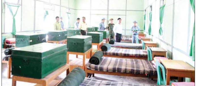
ပြည်နယ်ဝန်ကြီးချုပ် ဦးစောဦးတင် သင်တန်းသားအိပ်ဆောင်၌ ပြင်ဆင်ဆောင်ရွက်ထားမှုများကို ကြည့်ရှုစစ်ဆေးစဉ်။

တောင်ကြီး ဧပြီ ၂၀ ရှမ်းပြည်နယ် (တောင်ပိုင်း) တောင်ကြီးမြို့တွင် ရှမ်းပြည်နယ်အစိုးရအဖွဲ့က ကြီးပွားကျင်းပသည့် တောင်ကြီးမြို့၏ ကျက်သရေဆောင်ရွှေဘုန်းပွင့်စေတီတော်မြတ်ကြီး၌ နှစ်ဦးအသံမစ်မဟာပဋ္ဌာန်း ရွတ်ဖတ်ပူဇော်ပွဲ အောင်ပွဲအခမ်းအနားကို ယနေ့နံနက်ပိုင်းက ရွှေဘုန်းပွင့်စေတီတော် ဓမ္မာရုံ၌ ကျင်းပသည်။ ဦးစွာ ပြည်နယ်လူမှုရေးရာဝန်ကြီး ဦးမင်းမင်းလွင် အမှုပြုသော ဧည့်ပရိသတ်အပေါင်းတို့က နိုင်ငံတော်ဩဝါဒါစရိယ စွန်လွန်းဂူ ကမ္မဋ္ဌာန်းကျောင်းတိုက် ဦးစီးပဓာနနာယက အဂ္ဂမဟာပဏ္ဍိတ မဟာကမ္မဋ္ဌာနာစရိယ ဘဒ္ဒန္တအဂ္ဂဓမ္မာဘိဝံသ အရှင်သူမြတ်ထံမှ ငါးပါးသီလခံယူဆောင်တည်ကာ ဆရာတော်အရှင်သူမြတ်များ ရွတ်ပွားသရဇ္ဈာယ်ချီးမြှင့်တော်မူအပ်သော ပရိတ်တရားတော်များကို နာယူကြည့်ညိုကြသည်။ ထို့နောက် တောင်ကြီးမြို့ သိမ်တောင်ကျောင်းတိုက်မှ အရင်မာဏဝက ပဋ္ဌာန်းအောင်ဂါထာကို ရွတ်ဖတ်ပူဇော်ပြီး သံဃာတော်အရှင်သူမြတ်များအား ပြည်နယ်လူမှုရေးရာဝန်ကြီးနှင့် တာဝန်ရှိသူများက လှူဖွယ်ပစ္စည်းများ ဆက်ကပ်လှူဒါန်းကြသည်။ ယင်းနောက် တောင်ကြီးမြို့ နိုင်ငံတော်ဗဟိုသံဃာ့ဝန်ဆောင် ဘုရားကြီး အနောက်ကျောင်းတိုက် ဦးစီးပဓာနနာယက ဆရာတော် အဂ္ဂမဟာသဒ္ဓမ္မ စောတိကဓဇ ဂန္ထဝါစကပဏ္ဍိတ ဘဒ္ဒန္တသဇ္ဇနထံမှ လှူဒါန်းမှုအစုစုတို့အတွက် အနုမောဒနာတရား နာယူကြည့်ညိုပြီး ရေစက်သွန်းချ အမွှေးပေးခဲ့ကြောင်း သိရသည်။ ပြည်နယ် (ပြန်/ဆက်)