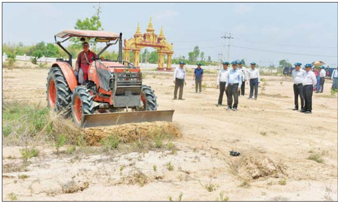
Basha တံဆောက်လုပ်မည့် မြေနေရာများအား ရေးဆွဲ၍ စနစ်တကျဆောင်ရွက်ရန် လမ်းညွှန်မှာကြားသည်။ ယင်းနောက် သာသနာရေးဦးစီးဌာနမှ ဝန်ထမ်းများ ယာယီရွှေ့ပြောင်းနေထိုင်နိုင်ရန်အတွက် Basha တံဆောက်လုပ်မည့် ဓနသိဒ္ဓိရပ်ကွက်ရှိ သဒ္ဓမ္မဝေပုလ္လပရိယတ္တိစာသင်တိုက် ပရိဝုဏ်အတွင်း၌ စက်ယန္တရားဖြင့် မြေညှိနေမှုများအား လည်းကောင်း (အပေါ်ပုံ)၊ ဒဂုံကွက်သိရိမြို့နယ်ရှိ မဟာပရဟိတပွားဖြိုးရေးဥယျာဉ်အတွင်း၌ သာသနာရေးဦးစီးဌာန ဝန်ထမ်းများ ယာယီရွှေ့ပြောင်းနေထိုင်နိုင်ရန်အတွက် Basha တံဆောက်လုပ်မည့်မြေနေရာအား ကြည့်ရှုစစ်ဆေးပြီး လျှပ်စစ်စီးရရှိမှုအခြေအနေ၊ ရေရရှိမှုအခြေအနေများကို ရှင်းလင်းတင်ပြရာ လိုအပ်သည်များ မှာကြားခဲ့ကြောင်း သတင်းစဉ်

သာသာဝဘေးအန္တရာယ်များမှာ မမျှော်လင့်သော်လည်း ကြုံတွေ့နေရမည်ဖြစ်ကြောင်း၊ မိမိတို့အားထားရမည့်အရာမှာ မိမိတို့ပြုမူဆောင်ရွက်သည့် ကုသိုလ်ကောင်းမှုမှတစ်ပါး အခြားမရှိနိုင်ပါကြောင်း၊ ကုသိုလ်ကောင်းမှု အမြဲပြုလုပ်ကြရန်နှင့် သာသာဝဘေးအန္တရာယ်ကို ကြိုကြိုခင်ခင်ကော်လွှားသွားကြရန်ဖြစ်ကြောင်း စသည်ဖြင့် အားပေးစကားပြောကြားသည်။ ထို့နောက် ယာယီ Basha တံများ အမြန်ဆုံးပြီးစီးအောင် ဆောင်ရွက်နေမှုအခြေအနေ၊ ဝန်ထမ်းမိသားစုများ ရွှေ့ပြောင်းပေးမည့် အခြေအနေတို့ကို ရှင်းလင်းပြောကြားသည်။ ထို့နောက် ပြည်ထောင်စုဝန်ကြီးနှင့်အဖွဲ့သည် သာသနာရေးနှင့် ယဉ်ကျေးမှုဝန်ကြီးဌာန ဝန်ကြီးမှူး ငလျင်ဒဏ်သင့်ဝန်ထမ်းများ ယာယီရွှေ့ပြောင်းနေထိုင်ရန် ရုံးအမှတ် ၃၁၊ သာသနာရေးနှင့် ယဉ်ကျေးမှုဝန်ကြီးဌာနပိုင် မြေနေရာတွင် Basha တံများ ဆောက်လုပ်နိုင်မည့် မြေနေရာအား အသေးစိတ် လိုက်လံကြည့်ရှုပြီး Basha တံဆောက်လုပ်နိုင်ရန် အတွက် မြေညှိရမည့် အခြေအနေများ၊ ရေ ဖိး၊ မိလ္လာဆောင်ရွက်ပေးမည့်အခြေအနေများ၊ Basha တံများ ဆောက်လုပ်ရာတွင် ဆောက်လုပ်မည့်ပတ်ဝန်းကျင်ရှိ အချိန်ရသစ်ပင်ကြီးများအား ခုတ်ထွင်ရှင်းလင်းခြင်းမပြုဘဲ ယာယီ Basha တံများ ဆောက်လုပ်ရန်၊