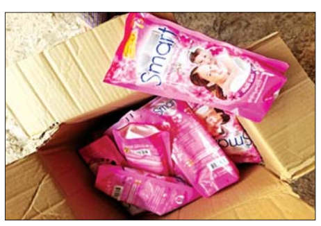
ဖရမ်းချောင်းအမြတ်စစ်ဆေးရေးစခန်း၌ ဖမ်းဆီးရမိမှု။

အထောက်အထားတင်ပြနိုင်ခြင်းမရှိသည့် လူသုံးကုန်ပစ္စည်းနှစ်မျိုး (ခန့်မှန်းတန်ဖိုးငွေကျပ် ၇၃၄၄၀၀)နှင့် အဆိုပါပစ္စည်းများ တင်ဆောင်လာသည့် Higer Bus တစ်စီး (ခန့်မှန်းတန်ဖိုးငွေကျပ် ၆၀၀၀၀၀၀) စုစုပေါင်း (ခန့်မှန်းတန်ဖိုး ငွေကျပ် ၆၃၄၄၀၀)ကို ဖမ်းဆီးရမိခဲ့ပြီး အကောက်ခွန်လုပ်ထုံးလုပ်နည်းများနှင့်အညီ အရေးယူဆောင်ရွက်လျက်ရှိသည်။ ဧပြီ ၁၈ ရက်နှင့် ၂၁ ရက်တို့တွင် ဖမ်းဆီးရမိမှုစုစုပေါင်းမှာ အမှတ် ၁၁ မှ (ခန့်မှန်းတန်ဖိုး ငွေကျပ် ၇၄၆၄၄၆၈)ကို ဖမ်းဆီးရမိခဲ့သည်။ တရားမဝင်တင်သွင်းမှုများကြောင့် နိုင်ငံ၏ စဉ်ဆက်မပြတ် ဖွံ့ဖြိုးတိုးတက်ရေးပန်းတိုင်များကို အောင်မြင်အောင် ဆောင်ရွက်ရာတွင် သိသာစွာ ထိခိုက်နစ်နာမှုများ ဖြစ်ပေါ်စေနိုင်သကဲ့သို့ ရင်းနှီးမြှုပ်နှံမှု ကဏ္ဍမှရရှိသည့် အခွန်အခများ၊ တရားဝင်အလုပ်အကိုင်အခွင့်အလမ်းများနှင့် ပြည်သူတို့၏ အသက်အိုးအိမ်စည်းစိမ်များအပေါ် ထိခိုက်နစ်နာမှုများလည်း ဖြစ်ပေါ်စေနိုင်ပါသည်။ သို့ဖြစ်ပါ၍ တရားမဝင် ကုန်သွယ်မှုများ လျော့နည်းပပျောက်စေရေး သက်ဆိုင်ရာတာဝန်ရှိသူများက ယခုထက်