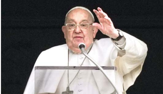
ပုံးကြွခြင်းခံရသည့် ဟိုရိုရီးမားနှင့် နာဂါဆာကီမြို့ သည်။ ထို့အပြင် ပုပ်ရဟန်းမင်းကြီးသည် ဂါဇာ များတွင် ၎င်း၏ မိန့်ခွန်းများအတွင်း နျူကလီးယား ကမ်းမြောင်ဒေသ ငြိမ်းချမ်းရေးအတွက်လည်း လက်နက်များကို ဖျက်သိမ်းရန် တောင်းဆိုခဲ့သူဖြစ် တောင်းဆိုခဲ့သူ ဖြစ်သည်။ အင်န်အိတ်ချ်ကေ

သိရသည်။ သို့သော်လည်း ကွယ်လွန်ခြင်း၏ အကြောင်းရင်းကို ဖော်ပြထားခြင်းမရှိပေ။ ပုပ်ရဟန်းမင်းကြီးသည် မကြာသေးမီနှစ်များ အတွင်း ဆေးရုံသို့မကြာခဏ တက်ရောက်ခဲ့ရ ကြောင်း၊ ဖေဖော်ဝါရီ ၁၄ ရက်မှစ၍ အဆုတ်ပြန် ရောင်မှုကို အီတလီနိုင်ငံ ရောမမြို့ရှိ ဆေးရုံတစ်ရုံ၌ တစ်လကျော်ကြာ ဆေးဝါးကုသမှုခံယူခဲ့ရကြောင်း သိရသည်။ ၎င်းသည် ၂၀၁၉ ခုနှစ်တွင် ဂျပန်နိုင်ငံသို့ လာရောက်လည်ပတ်ခဲ့ကြောင်းနှင့် ထိုကဲ့သို့ လာရောက်လည်ပတ်မှုမှာ နှစ်ပေါင်း ၃၈ နှစ်အတွင်း ပထမဆုံးအကြိမ် လာရောက်လည်ပတ်သည့် ပုပ်ရဟန်းမင်းကြီးဖြစ်ကြောင်း သိရသည်။ ရိုမန်ကက်သလစ် ခရစ်ယာန်အသင်းတော်၏ အကြီးအကဲဖြစ်သူ ပုပ်ရဟန်းမင်းကြီးသည် အကျဉ်း