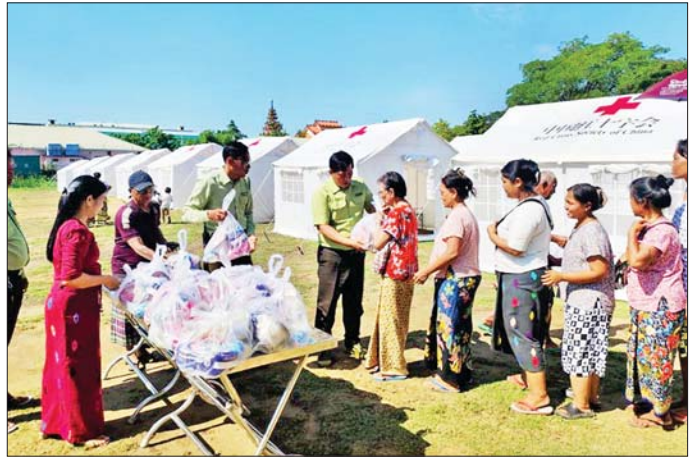
မန္တလေးတိုင်းဒေသကြီးအတွင်းရှိ ငလျင်ဘေးသင့်ပြည်သူများအတွက် နိုင်ငံတကာမှပေးအပ်သည့် လူသားချင်းစာနာထောက်ထားမှုဆိုင်ရာ အကူအညီပစ္စည်းများ ပြန်လည်ဖြန့်ဝေလှူဒါန်းစဉ်။