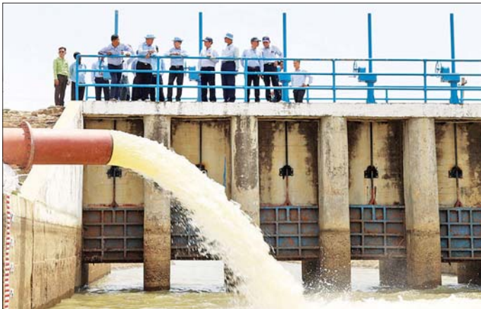
နောင်နေ့ခွဲရသော ဆင်သေရေလှည့်ဆည် (ဒဟတ်ကုန်းဆည်)အား လိုအပ်သော ပြုပြင်မွမ်းမံခြင်းလုပ်ငန်းများ ဆောင်ရွက်စဉ် ကာလအတွင်း စိုက်ပျိုးပြီးဖြစ်သည့် နွေသီးနံ့များ ထိခိုက်ပျက်စီးမှုမရှိစေရေးအတွက် အချိန်မီ စိုက်ပျိုးရေးပေးဝေနိုင်ရန် လက်ဝဲမြောင်းမကြီးသို့ အနိမ့်တင်ရောင်စက်အသုံးပြု၍ ယနေ့နံနက်ပိုင်းမှစတင်ကာ ရေများ စတင်ပို့လွှတ်လျက်ရှိရာ ပြည်ထောင်စုဝန်ကြီး ဦးမင်းနေနှင့် ဒုတိယဝန်ကြီး ဦးဗိုလ်ဗိုလ်ကျော်တို့က ကွင်းဆင်းကြည့်ရှု စစ်ဆေးကြပြီး တာဝန်ရှိသူများအား ရေသောက်စနစ်အတွင်းရှိ လျှာထားဧရိယာအားလုံးသို့ စိုက်ပျိုးရေး အမြန်ဆုံး ရောက်ရှိစေရေး၊ ယာယီမြေသားတစ်ကြိမ်တောင်တင်းမှုရှိစေရေး ကြပ်မတ်ဆောင်ရွက်ရန်နှင့် သီးနှံ

နေပြည်တော် ဧပြီ ၂၀ နေပြည်တော် ကောင်စီနယ်မြေ၏ သီးနှံစိုက်ပျိုးထုတ်လုပ်မှု လျော့ကျခြင်းမရှိစေရန်နှင့် မန္တလေးငလျင်ကြီးကြောင့် ထိခိုက်ခဲ့သည့် ဆည်ရေသောက် လယ်များသို့ အချိန်တိုအတွင်း စိုက်ပျိုးရေးပေးဝေနိုင်ရေးအတွက် စိုက်ပျိုးရေး၊ မွေးမြူရေးနှင့် ဆည်မြောင်းဝန်ကြီးဌာနက ကြိုးပမ်းအကောင်အထည်ဖော် ဆောင်ရွက်လျက်ရှိရာ ယနေ့တွင် ဆင်သေဆည်ရေသောက်စနစ်ရှိ လက်ဝဲမြောင်းမှ နွေသီးနံ့များအတွက် စိုက်ပျိုးရေးပြန်လည်ပေးဝေနိုင်ရန် ပင်မမြောင်းအတွင်းသို့ ရေစတင်ထည့်သွင်းနိုင်ပြီဖြစ်ကြောင်း သိရသည်။ မန္တလေး ငလျင်ကြီးကြောင့် ကျိုးပေါက် ပျက်စီးခဲ့ရပြီး ရေသောက်စနစ်အတွင်းရှိ စိုက်ပျိုးပြီးစေ့စပါးနှင့် နွေသီးနံ့များအတွက် စိုက်ပျိုးရေးပေးဝေမှု