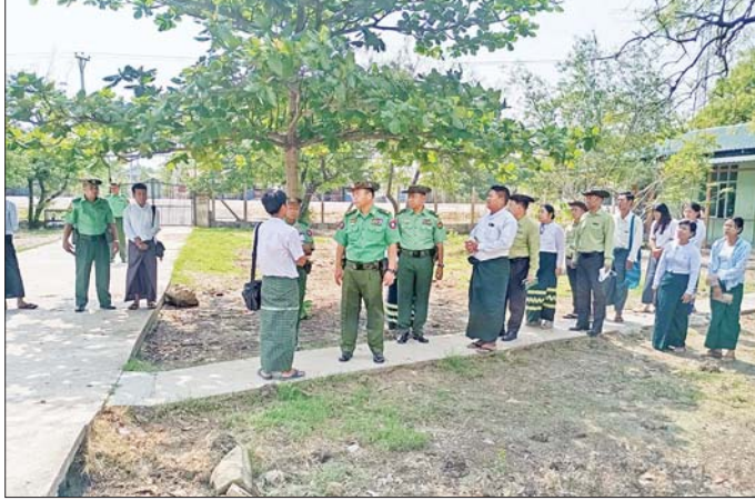
ကာကွယ်ရေးဦးစီးချုပ်ရုံး(ကြည်း)မှ ဒုတိယဗိုလ်ချုပ်ကြီး မျိုးသန့်နိုင် ကုမ္ပဏီမြို့နယ် အခြေခံပညာ အထက်တန်းကျောင်း (လမ်းခွ) ကို ကြည့်ရှုစစ်ဆေးစဉ်။