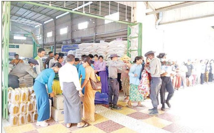
စစ်ကိုင်းတိုင်းဒေသကြီးအတွင်းရှိ ငလျင်ဘေးသင့်ပြည်သူများအတွက် နိုင်ငံတကာမှပေးအပ်သည့် လူသားချင်းစာနာထောက်ထားမှုဆိုင်ရာ အကူအညီပစ္စည်းများ ပြန်လည်ဖြန့်ဝေလှူဒါန်းစဉ်။