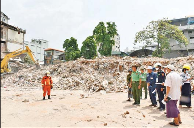
ကာကွယ်ရေးဦးစီးချုပ်ရုံး(ကြည်း)မှ ဒုတိယဗိုလ်ချုပ်ကြီး မျိုးမိုးအောင် မန္တလေးမြို့ ချမ်းအေးသာစံမြို့နယ်ရှိ တိုင်းသမဝါယမဦးစီးမှူးရုံး အပျက်အစီးများ ဖယ်ရှားရှင်းလင်းနေမှုကို ကြည့်ရှုစစ်ဆေးစဉ်။

ပေါင်းစပ်ညှိနှိုင်းဆောင်ရွက်ပေးခဲ့သည်။ ဆက်လက်၍ မြစ်သားမြို့နယ် ကုမ္ပဏီမြို့ရှိ ရွှေတံသာ စေတီ၌ ပြိုကျပျက်စီးခဲ့သော ဘုရားစေတီများ၊ သာသနိကအဆောက်အအုံများအား သွားရောက် ကြည့်ရှုပြီး ပြန်လည်ပြုပြင်မွမ်းမံမည့်အစီအမံများ ကို တာဝန်ရှိသူများနှင့် ပေါင်းစပ်ညှိနှိုင်း ဆောင်ရွက်ပေးခဲ့ကြောင်း သတင်းရရှိသည်။ သတင်းစဉ်