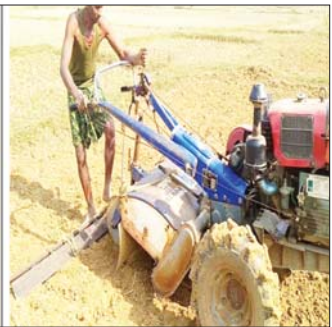
ပုံ - ၂ မြေလျင်ကြောင့် မြေမညီခြင်းကို ပြန်ညှိပေးခြင်း။