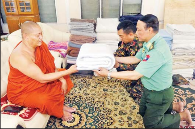
ကာကွယ်ရေးဦးစီးချုပ်ရုံး(ကြည်း)မှ ဒုတိယဗိုလ်ချုပ်ကြီး စိုးတင်နိုင် မန္တလေးမြို့ အမရပူရမြို့နယ် ဆင်ဖြူမယ်ကျောင်းတိုက် ဦးစီးပဓာနနာယကရာဇာတော်အား လှူဖွယ်ပစ္စည်းများ ဆက်ကပ်လှူဒါန်းစဉ်။