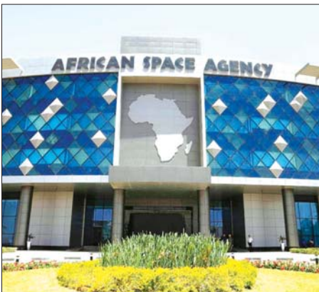
နှင့် တိုးတက်မှုများ၏ လမ်းပြ အလင်းရောင် တစ်ခုသဖွယ်ဖြစ် လာမည်ဟုလည်း ၎င်းက ဆက် ပြောသည်။ အာဖရိကသမဂ္ဂက လိုအပ် သည့် နိုင်ငံရေးနှင့် နည်းပညာ

ပြုနိုင်ရေးအတွက် ပူးပေါင်းဆောင် ရွက်မှု မြှင့်တင်ခြင်း၊ အတွေ့ အကြုံနှင့် ကျွမ်းကျင်မှုများ ဖလှယ်ခြင်းနှင့် စွမ်းဆောင်ရည် များ တည်ဆောက်ခြင်းများ အပြင် နိုင်ငံတကာဖိုရမ်များတွင် အာဖရိက၏ ရပ်တည်ချက်ကို တစ်သားတည်း ဖြစ်အောင် လုပ်ဆောင်ပေးနိုင်မည် ဖြစ် ကြောင်း ၎င်းက အလေးပေးပြော ကြားသည်။ အီဂျစ်အကာသအေဂျင်စီ၏ အမှုဆောင်အရာရှိချုပ် ရာရာစ် ဆက်ဒီက အေအက်ဖ်အက်စအေ ဖွင့်ပွဲအခမ်းအနားတွင် အာဖရိက တိုက်၏သမိုင်းတွင်အရေးပါသည့် မှတ်တိုင်တစ်ခုဖြစ်ကြောင်း ပြော သည်။ ထို့အပြင် အေအက်ဖ် အက်စအေသည် အာဖရိကနိုင်ငံ များအားလုံးအတွက် တီထွင် ဖန်တီးမှု ပူးပေါင်းဆောင်ရွက်မှု