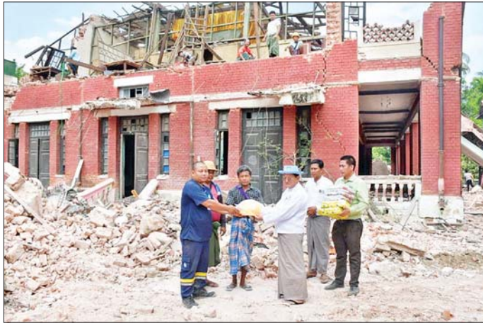
နေပြည်တော်ကောင်စီနယ်မြေအတွင်းရှိ ငလျင်ဘေးသင့်ပြည်သူများအတွက် နိုင်ငံတကာမှပေးအပ်သည့် လူသားချင်းစာနာထောက်ထားမှုဆိုင်ရာ အကူအညီပစ္စည်းများ ပြန်လည်ဖြန့်ဝေလှူဒါန်းစဉ်။

ပစ္စည်းများနှင့် ဆေးရုံသုံးပစ္စည်းများကို ကျန်းမာရေးဝန်ကြီးဌာနသို့ လွှဲပြောင်းပေးအပ်ကာ ဒဏ်ရာရရှိသည့် ပြည်သူများအား ကုသရာတွင် အသုံးပြုသည်။ နိုင်ငံတကာ အလှူရှင်များ၏ သင့်ပြည်သူများထံ အမြန်ဆုံး လှူဒါန်းပစ္စည်းများကို ပြည်ထောင်စုနယ်မြေ၊ နေပြည်တော်၊ မန္တလေးတိုင်းဒေသကြီး၊ စစ်ကိုင်းတိုင်းဒေသကြီး၊ ရှမ်းပြည်နယ် (တောင်ပိုင်း)ရှိ ဘေးသင့်ပြည်သူများအတွက် ဖြန့်ခွဲပေးပို့လျက်ရှိသည်။ နိုင်ငံတကာအလှူရှင်များက ထပ်မံလှူဒါန်းလာသည့် ပစ္စည်းများရောက်ရှိမှုနှင့် ငလျင်ဘေးသင့်ပြည်သူများထံ အမြန်ဆုံး လှူဒါန်းဖြန့်ခွဲမှုတို့ကို တစ်ပတ်လျှင်တစ်ကြိမ် ဆက်လက်ထုတ်ပြန်သွားမည် ဖြစ်ကြောင်း သတင်းထုတ်ပြန်အပ်ပါသည်။ သတင်းစဉ်