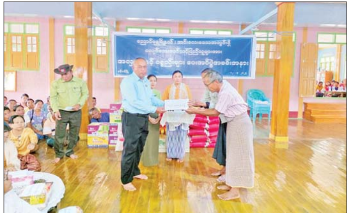
ရှမ်းပြည်နယ် အင်းလေးဒေသရှိ ငလျင်ဘေးသင့်ပြည်သူများအတွက် နိုင်ငံတကာမှပေးအပ်သည့် လူသားချင်းစာနာထောက်ထားမှုဆိုင်ရာ အကူအညီပစ္စည်းများ ပြန်လည်ဖြန့်ဝေလှူဒါန်းစဉ်။ (၁၂-၄-၂၀၂၅)