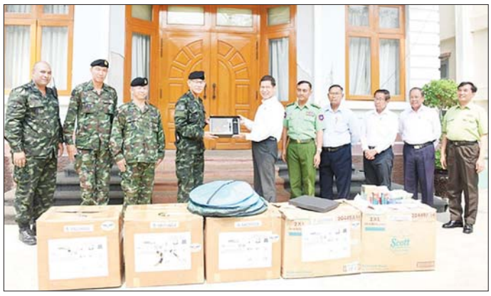
လျင်ဒဏ်သင့်ပြည်သူများအတွက် ထိုင်းနိုင်ငံမှ လူသားချင်းစာနာထောက်ထားမှုဆိုင်ရာ အကူအညီပစ္စည်းများ လာရောက်လှူဒါန်း

မန္တလေး ဧပြီ ၂၁ မတ် ၂၈ ရက်က မြန်မာနိုင်ငံ ပြည်တွင်း မန္တလေးမြို့အနီးကို ဗဟိုပြုလုပ်ခတ်ခဲ့သော အင်အား ပြင်း မန္တလေးငလျင်ကြီးကြောင့် ငလျင်ဘေးဒဏ်သင့်ပြည်သူများ အတွက် ပြည်တွင်း၊ ပြည်ပ စေတနာရှင်ပြည်သူများက အလှူ ငွေများနှင့် လူသားချင်း စာနာ ထောက်ထားမှုဆိုင်ရာ အကူအညီ ပစ္စည်းများ လှူဒါန်းလျက်ရှိ သည်။ ထိုသို့ လှူဒါန်းမှုအနေဖြင့် မြန်မာပြည်သူများအတွက် ထိုင်း ပြည်သူများ၏ အားဖြည့်မှု၊ ထိုင်း နိုင်ငံမှ လှူဒါန်းသည့် လူသားချင်း စာနာထောက်ထားမှုဆိုင်ရာ အကူ အညီပစ္စည်းများကို ထိုင်းနိုင်ငံ Royal Thai Air Force မှ တာဝန်ရှိ သူများက ယနေ့နံနက်ပိုင်းတွင် သတင်းစဉ်