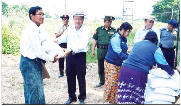
တိုင်းဒေသကြီးဝန်ကြီးချုပ် ဦးတင်မောင်ဝင်း တောင်သူများထံ ပိုက်ဆံလျှော်မျိုးစေ့များ ပေးအပ်စဉ်။