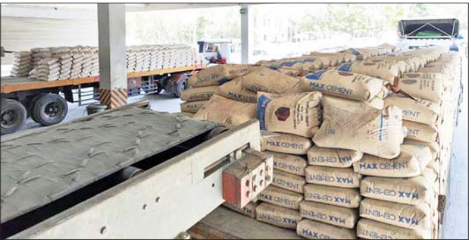
စာမျက်နှာ ၉ သို့