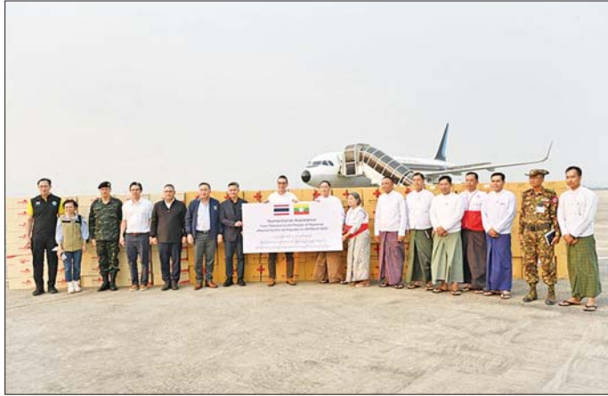
တိုင်းနိုင်ငံမှပေးပို့သည့် လူသားချင်းစာနာထောက်ထားမှုဆိုင်ရာ အကူအညီပစ္စည်းများ ကြိုဆိုလက်ခံစဉ်။