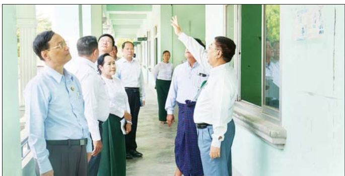
မှာကြားကာ သက်ဆိုင်ရာ တာဝန်ရှိသူများအား ပေါင်းစပ်ညှိနှိုင်း ဖြည့်ဆည်းဆောင်ရွက်ပေးခဲ့ကြောင်း အဆင့်အလိုက် ဆောင်ရွက်ရမည့် လုပ်ငန်းစဉ် သိရသည်။ များကို ရှင်းလင်းပြောကြား၍ လိုအပ်သည်များ သတင်းစဉ်

ပြောင်းရွှေ့နေထိုင်သည့်အခါ လျှပ်စစ်မီးရရှိရေး၊ သောက်ရေသုံးရေများ ရရှိရေးဆောင်ရွက်ကြရန် တာဝန်ရှိသူများကိုမှာကြား၍ လိုအပ်သည်များ ဖြည့်ဆည်းဆောင်ရွက်ပေးသည်။ ထိုမှတစ်ဆင့် ပြည်ထောင်စုဝန်ကြီးသည် ဒက္ခိဏ သီရိမြို့နယ် အမှတ် (၁၈) အခြေခံပညာ အထက်တန်း ကျောင်းသို့ သွားရောက်၍ ငလျင်ဘေးဒဏ်ကြောင့် ပျက်စီးမှုအခြေအနေများကို လိုက်လံကြည့်ရှု စစ်ဆေးကာ ပျက်စီးမှုများကို ကျောင်းဖွင့်အစီ ပြီးစီးအောင် ပြင်ဆင်ရေး စီစဉ်ဆောင်ရွက်ပေးပြီး ဆရာ ဆရာမများအနေဖြင့် မိုးကြိုကာလတွင် ဖြစ်ပေါ်လာနိုင်သည့် မိုးလေထုဖြစ်စဉ်များနှင့် ပတ်သက်၍ အထူးဂရုပြု နေထိုင်ကြရန်နှင့်သင်္ကြန် ရုံးပိတ်ရက် ကာလပြီးစီး၍ ရုံးများ ပြန်လည် ဖွင့်လှစ်ချိန်တွင် ရုံးလုပ်ငန်းများ ပုံမှန်လည်ပတ် နိုင်အောင် ဆောင်ရွက်ကြရမည်ဖြစ်ကြောင်း