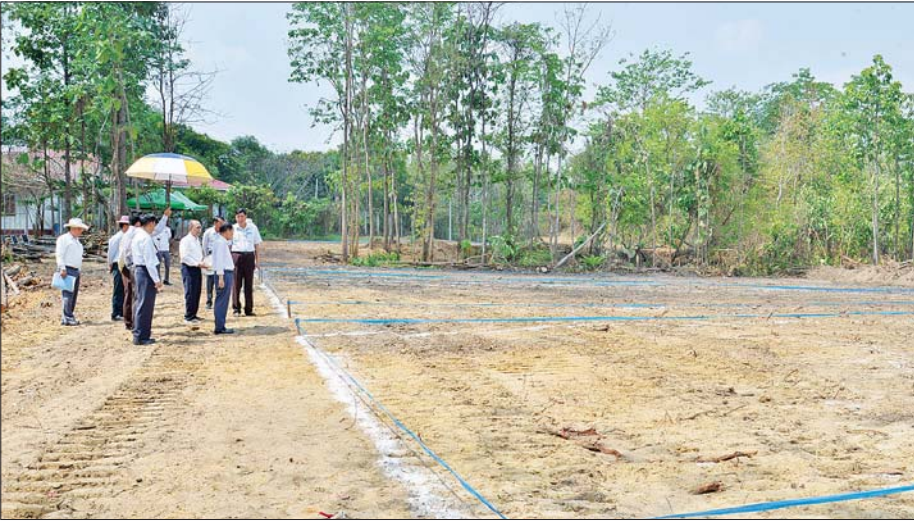
ပြည်ထောင်စုရွေးကောက်ပွဲကော်မရှင်ဥက္ကဋ္ဌ ဦးကိုကို၊ ဒုတိယဥက္ကဋ္ဌ ဦးသန်းစိုးနှင့် အဖွဲ့ဝင်များ ငလျင်ဒဏ်သင့်ဝန်ထမ်းမိသားစုများ ယာယီနေထိုင်ရန် ယာယီဘာရှာအဆောက်အအုံများ ဆောက်လုပ်နိုင်ရေး ပြင်ဆင်ဆောင်ရွက်နေမှုအခြေအနေများကို ကြည့်ရှုစစ်ဆေးစဉ်။

နေပြည်တော် ဧပြီ ၂၁ ပြည်ထောင်စုရွေးကောက်ပွဲကော်မရှင်ဥက္ကဋ္ဌ ဦးကိုကို၊ ဒုတိယဥက္ကဋ္ဌ ဦးသန်းစိုးတို့သည် ယနေ့နံနက် ၉ နာရီခွဲတွင် ပြည်ထောင်စုရွေးကောက်ပွဲကော်မရှင်ရုံးအနီး ထိန်းသိမ်းဧရိယာ၌ ငလျင်ဒဏ်သင့်ဝန်ထမ်းအိမ်ထောင်သည် ၁၀၈ ဦးနှင့် ယင်းတို့၏ မိသားစုဝင် ၁၅၂ ဦး၊ လူပျို/အပျို ၇၂ ဦး စုစုပေါင်းဝန်ထမ်း ၁၈၀ တို့ ယာယီနေထိုင်ရန် ယာယီဘာရှာအဆောက်အအုံများ ဆောက်လုပ်နိုင်ရေး ပြင်ဆင်ဆောင်ရွက်နေမှုအခြေအနေများကို ကြည့်ရှုစစ်ဆေးသည်။