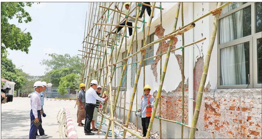
နိုင်ငံတော်စီမံအုပ်ချုပ်ရေးကောင်စီအဖွဲ့ဝင် ဒုတိယဝန်ကြီးချုပ်နှင့် နိုင်ငံတော်ဝန်ကြီးချုပ်ရုံး ပြည်ထောင်စုဝန်ကြီး လျှပ်စစ်နှင့် စွမ်းအင်ဖွံ့ဖြိုးရေး ကော်မရှင်ဥက္ကဋ္ဌ ဗိုလ်ချုပ်ကြီး တင်အောင်စန်း မြေငလျင်လှုပ်ခတ်မှုကြောင့် ထိခိုက်ပျက်စီးခဲ့သည့် နိုင်ငံတော်စီမံအုပ်ချုပ်ရေးကောင်စီရုံး အဆောက်အအုံပြန်လည်ပြုပြင်ဆောင်ရွက်နေမှုကို ကြည့်ရှုစစ်ဆေးစဉ်။

နေပြည်တော် ဧပြီ ၂၁ နိုင်ငံတော် စီမံအုပ်ချုပ်ရေး ကောင်စီအဖွဲ့ဝင် ဒုတိယဝန်ကြီး ချုပ်နှင့် နိုင်ငံတော်ဝန်ကြီးချုပ်ရုံး ပြည်ထောင်စုဝန်ကြီး လျှပ်စစ်နှင့် စွမ်းအင်ဖွံ့ဖြိုးရေး ကော်မရှင် ဥက္ကဋ္ဌ ဗိုလ်ချုပ်ကြီး တင်အောင်စန်း နှင့် အဖွဲ့ဝင်များသည် ၂၀၂၅ ခုနှစ် မတ် ၂၈ ရက်က အင်အားပြင်း မြေငလျင် လှုပ်ခတ်မှုကြောင့် ထိခိုက်ပျက်စီးခဲ့သည့် နိုင်ငံတော် စီမံအုပ်ချုပ်ရေး ကောင်စီရုံး အဆောက်အအုံ ပြန်လည်ပြုပြင် ဆောင်ရွက်နေမှုများ၊ မြေငလျင် ဘေးဒဏ်ခံစားခဲ့ရသည့် နေပြည် တော်ကောင်စီနယ်မြေအတွင်းရှိ လျှပ်စစ်စွမ်းအား ဝန်ကြီးဌာန၊ စွမ်းအင်ဝန်ကြီးဌာနနှင့် နိုင်ငံ တော်ဝန်ကြီးချုပ်ရုံး၊ ပြည်ထောင်စု ဝန်ကြီးရုံးတို့မှ ဝန်ထမ်းမိသားစု များအတွက် ယာယီပြောင်းရွှေ့ နေရာချထားပေးမှု အခြေအနေ များအား ၂၀၂၅ ခုနှစ် ဧပြီ ၂၁ ရက် ညနေပိုင်းတွင် လိုက်လံကြည့်ရှု စစ်ဆေးခဲ့သည်။ ရှေးဦးစွာ ဒုတိယဝန်ကြီးချုပ် ဗိုလ်ချုပ်ကြီးတင်အောင်စန်းသည် တာဝန်ရှိသူများနှင့်အတူ အင်အား ပြင်း မြေငလျင်လှုပ်ခတ်မှုကြောင့် ထိခိုက်ပျက်စီးခဲ့သည့် နိုင်ငံတော် စီမံအုပ်ချုပ်ရေး ကောင်စီရုံး အဆောက်အအုံ ပြန်လည်ပြုပြင် ဆောင်ရွက်နေမှုများကို ကြည့်ရှု စစ်ဆေးရာ တာဝန်ရှိသူများက အဆောက်အအုံ ထိခိုက်ပျက်စီးခဲ့မှု အခြေအနေများ၊ ပြန်လည်ပြုပြင် ဆောင်ရွက်မည့် အခြေအနေ များ ရှင်းလင်းတင်ပြမှုအပေါ် ဒုတိယဝန်ကြီးချုပ်က ငလျင်ဒဏ် သင့်အဆောက်အအုံများ ပြုပြင်