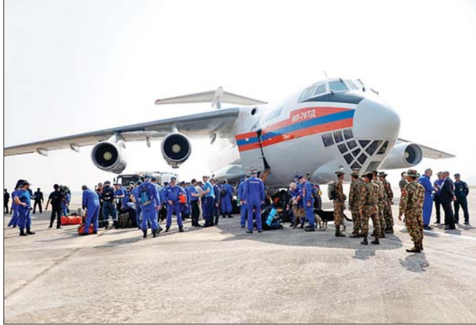
ရုရှားဖက်ဒရေးရှင်းနိုင်ငံမှ ကူညီထောက်ပံ့သည့် လူသားချင်းစာနာထောက်ထားမှုဆိုင်ရာ အကူအညီပစ္စည်းများ မတ် ၃၀ ရက်က ရောက်ရှိလာစဉ်။