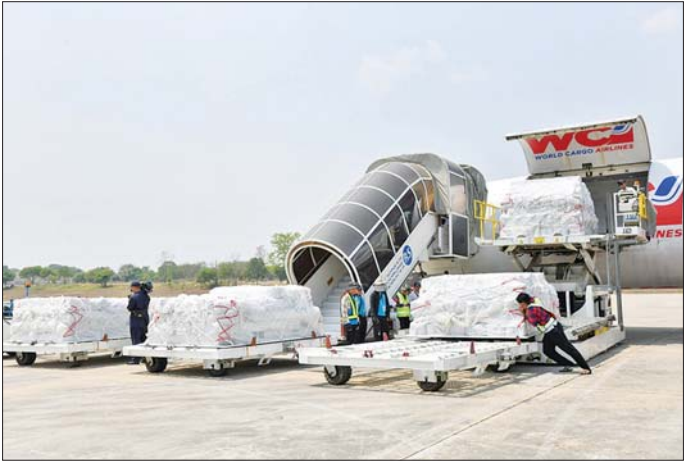
တရုတ်ပြည်သူ့သမ္မတနိုင်ငံမှ ကူညီထောက်ပံ့သည့် လူသားချင်းစာနာထောက်ထားမှုဆိုင်ရာ အကူအညီပစ္စည်းများ ဧပြီ ၃ ရက်က ရောက်ရှိလာစဉ်။

နေပြည်တော် ဧပြီ ၂၀ မတ် ၂၈ ရက်တွင် လှုပ်ခတ်ခဲ့သည့် မန္တလေးမြေငလျင်ကြီးကြောင့် နေပြည်တော်ကောင်စီ နယ်မြေ၊ စစ်ကိုင်းတိုင်းဒေသကြီး၊ မန္တလေးတိုင်းဒေသကြီး၊ မကွေးတိုင်းဒေသကြီး၊ ရှမ်းပြည်နယ်နှင့် ပဲခူးတိုင်းဒေသကြီးတို့တွင် ပျက်စီးဆုံးရှုံးမှုများ ဖြစ်ပေါ်ခဲ့ရာ နိုင်ငံတော်အစိုးရအနေဖြင့် အလွင်အမြန် စုံစမ်းစစ်ဆေးခြင်း၊ ကူညီကယ်ဆယ်ရေး လုပ်ငန်းများကို အချိန်နှင့်တစ်ပြေးညီ ဆောင်ရွက်ခြင်းနှင့် ပြည်ပမှ လူသားချင်းစာနာထောက်ထားမှုဆိုင်ရာ အကူအညီများကို ဖိတ်ခေါ်လမ်းဖွင့်ပေးခြင်းများ ဆောင်ရွက်ခဲ့သည်။ ငလျင်ဒဏ်သင့်ပြည်သူများထံ နိုင်ငံတကာမှ ကူညီ