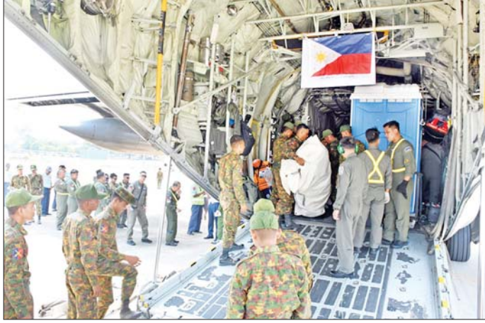
AHA Center မှ ကူညီထောက်ပံ့သည့် လူသားချင်းစာနာထောက်ထားမှုဆိုင်ရာ အကူအညီပစ္စည်းများ ဧပြီ ၂ ရက်က ရောက်ရှိလာစဉ်။

အထိ ငလျင်ဘေးဒဏ် သင့်ပြည်သူများအတွက် အိန္ဒိယနိုင်ငံ AHA Center ၊ တရုတ်ပြည်သူ့ သမ္မတနိုင်ငံ၊ ဗီယက်နမ်နိုင်ငံ၊ ဘင်္ဂလားဒေ့ရှ်နိုင်ငံ၊ ထိုင်းနိုင်ငံ၊ အင်ဒိုနီးရှားနိုင်ငံ၊ ပါကစ္စတန်နိုင်ငံ၊ ရုရှားဖက်ဒရေးရှင်းနိုင်ငံ၊ ဘယ်လားရစ်နိုင်ငံ၊ လာအိုနိုင်ငံ၊ အင်ဒိုနီးရှားနိုင်ငံ၊ Red Cross Society၊ နီပေါနိုင်ငံ၊ ဘရူနိုင်းနိုင်ငံနှင့်မလေးရှားနိုင်ငံတို့မှ ပေးပို့လှူဒါန်းသည့် စာမျက်နှာ ၇ သို့