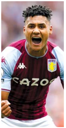
■ စောင့်ကြည့်ရမယ့် ကစားသမား ဝတ်ကင်စ် (၂၉ နှစ်) သွင်းဂိုး + ဂိုးဖန်တီးမှု = ၂၂ ကြိမ်

ပရီမီယာလိဂ်ပွဲစဉ် (၃၄) မန်စီးတီး - အက်စ်တွန်ဗီလာ ၂၃-၄-၂၀၂၅