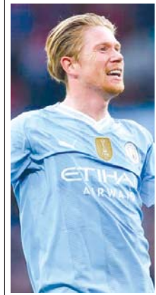
■ စောင့်ကြည့်ရမယ့် ကစားသမား ဒီဘရိုင်း (၃၃ နှစ်) သွင်းဂိုး + ဂိုးဖန်တီးမှု = ၁၀ ကြိမ်

ဧပြီ ၂၃ ရက် နံနက်ပိုင်းမှာ ပရီမီယာလိဂ်ပွဲစဉ် (၃၄) အဖြစ် မန်စီးတီးနဲ့ အက်စ်တွန်ဗီလာအသင်းပွဲစဉ် ဆက်လက်ယှဉ်ပြိုင်ကစားသွားမှာ ဖြစ်ပါတယ်။ ချန်ပီယံလိဂ်ဝင်ခွင့်မျှော်လင့်ချက်အတွက် အရေးပါတဲ့ပွဲစဉ်ဖြစ်တာကြောင့် ဘယ်အသင်းက နိုင်ပွဲရယူသွားမလဲ စောင့်ကြည့်ရမှာ ဖြစ်ပါတယ်။