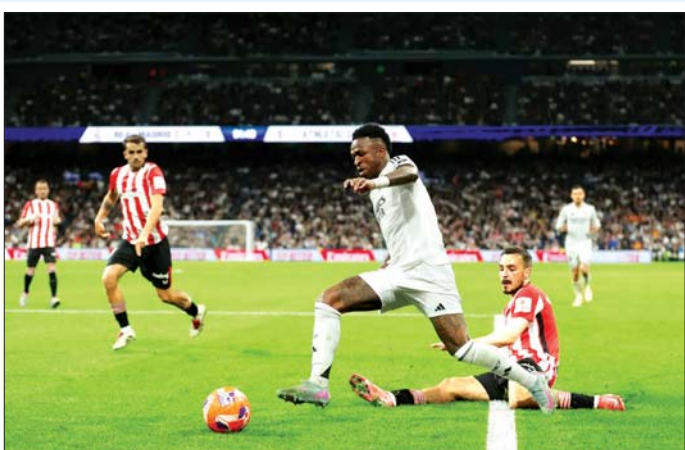
ရီးရဲမက်ဒရစ်အသင်း တောင်ပံတိုက်စစ်ကစားသမား ပင်နီစီးယပ်စ်၏ ထိုးဖောက်တိုက်စစ်ဆင်မှုကို ဘီလ်ဘာအို ကစားသမား ဖြတ်ထုတ်ဟန်တားစဉ်။

ဧပြီ ၂၁ ရက် နံနက် ၁ နာရီခွဲက ဘာနေဗျူးကွင်း၌ ယှဉ်ပြိုင်ကစားခဲ့သည့် ရီးရဲမက်ဒရစ်နှင့် ဘီလ်ဘာအိုအသင်း ပွဲစဉ်တွင် ရီးရဲမက်ဒရစ်အသင်းက ပွဲကစားချိန်ပြည့်ခါနီးတွင် ရရှိခဲ့သော ပယ်လ်ဟာဒီ၏ တစ်လုံးတည်းသော သွင်းဂိုးဖြင့် နိုင်ပွဲရရှိခဲ့သည်။ အဆိုပါ ပွဲစဉ်မှာ စပိန်လာလီဂါပွဲစဉ် (၃၂) ကို ယှဉ်ပြိုင်ကစားခြင်းဖြစ်ပြီး ပရိသတ် ၇၀၀၀ ကျော် လာရောက်ကြည့်ရှုခဲ့သည်။ ရီးရဲမက်ဒရစ်အသင်းသည် ယခုပွဲစဉ် နိုင်ပွဲရရှိခဲ့သည့်အတွက် ဦးဆောင်သူ ဘာစီလိုနာအသင်းနှင့် ရမှတ် ကွာဟမှု လျော့ချနိုင်ခဲ့ပြီး ဖလားဆွတ်ခူးရေး မျှော်လင့်ချက် ဆက်လက်ရှင်သန်ခဲ့သည်။ ရီးရဲမက်ဒရစ်အသင်းသည် အဓိကတိုက်စစ်ကစားသမား အမ်ဘာပေ အနီကတ်ကြောင့် ပွဲပယ်ဖြစ်ဒဏ်ချမှတ်ခံထားရသော်လည်း အားထားရသည့် ကစားသမား အစုအလင်ဖြင့် ဘီလ်ဘာအိုအသင်းကို ရင်ဆိုင်လာခဲ့သည်။ စာမျက်နှာ ၂၃ ကော်လံ ၁