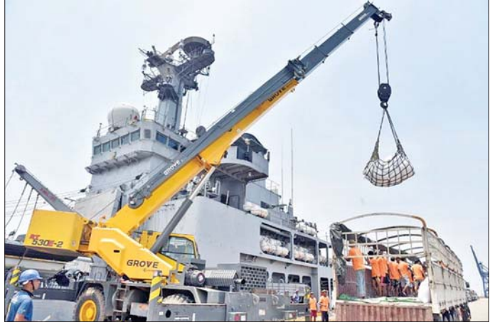
အိန္ဒိယနိုင်ငံမှ ကူညီထောက်ပံ့သည့် လူသားချင်းစာနာထောက်ထားမှုဆိုင်ရာ အကူအညီပစ္စည်းများ ရန်ကုန် သီလဝါဆိပ်ကမ်းသို့ ဆိုက်ရောက်လာစဉ်။