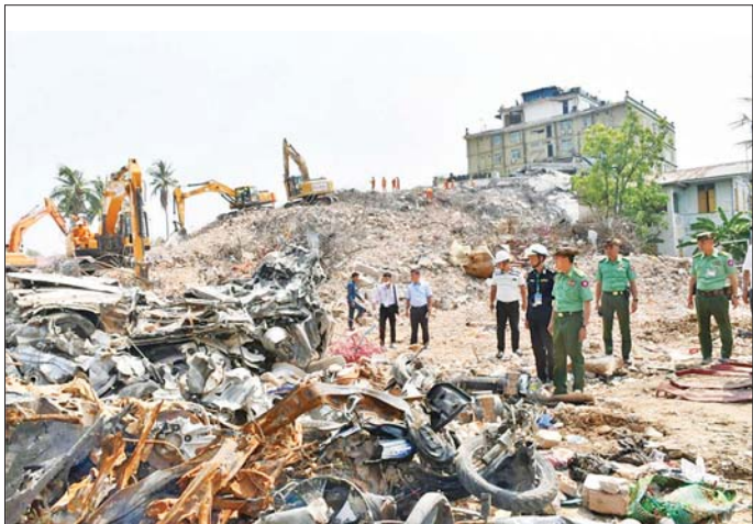
ကာကွယ်ရေးဦးစီးချုပ်ရုံး(ကြည်း)မှ ဒုတိယဗိုလ်ချုပ်ကြီး မျိုးမိုးအောင် မန္တလေးမြို့ အောင်မြေသာစံမြို့နယ်ရှိ Sky Villa အပျက်အစီးများ ဖယ်ရှားရှင်းလင်းနေမှုကို ကြည့်ရှုစဉ်။