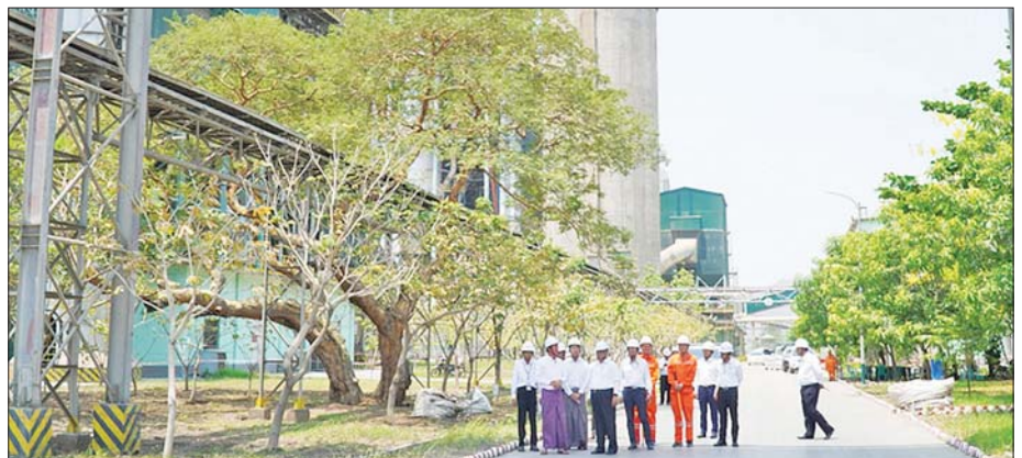
ပြည်ထောင်စုဝန်ကြီး ဒေါက်တာချာလီသန်း ကြံ့ခိုင်စက်ရုံအား ကြည့်ရှုစစ်ဆေးစဉ်။

နေပြည်တော် ဧပြီ ၂၁ - စက်မှုဝန်ကြီးဌာန ပြည်ထောင်စုဝန်ကြီး ဒေါက်တာချာလီသန်းသည် ယနေ့ နံနက်ပိုင်းတွင် ကျောက်ဆည် စက်မှုနယ်မြေရှိ သံတောမြစ်ကမ်းတစ်လျှောက်ရှိ ကြံ့ခိုင်စက်ရုံအစည်းအဝေးခန်းမ၌ စက်ရုံတာဝန်ခံက ငလျင်လုပ်ခတ်မှုကြောင့် ပျက်စီးခဲ့မှုအခြေအနေ၊ စက်ရုံပြန်လည်လည်ပတ်နိုင်ရေးအတွက် စစ်ဆေးပုံပြင်မှုများ ဆောင်ရွက်နေမှုတို့ကို ရှင်းလင်းတင်ပြရာ ပြည်ထောင်စုဝန်ကြီးက အဆိုပါ ထိခိုက်ပျက်စီးမှုများအား ပြန်လည်ထူထောင်ရေးလုပ်ငန်းများ ဆောင်ရွက်ရန်အတွက် ဆောက်လုပ်ရေးလုပ်ငန်းသုံးပစ္စည်းများ များစွာလိုအပ်လျက်ရှိကြောင်း၊ နိုင်ငံတော်စီမံအုပ်ချုပ်ရေးကောင်စီ ဥက္ကဋ္ဌ နိုင်ငံတော် ဝန်ကြီးချုပ်က ပြည်တွင်းရှိ ဘိလပ်မြေစက်ရုံများ၊ သံသံမဏိ စက်ရုံများ၊ အမိုး၊ အမိုးပြားစက်ရုံများ၊ အထပ်သားစက်ရုံများ၊ အုတ်စက်ရုံများ စက်ရုံစွမ်းအားပြည့် ပြန်လည်လည်ပတ်နိုင်ရေးအတွက် လိုအပ်ချက်များကို ကူညီဖြည့်ဆည်းပံ့ပိုးဆောင်ရွက်ပေးရန် လမ်းညွှန်မှုပြုထားကြောင်း၊ ထို့ကြောင့် စက်ရုံ၏ ထိခိုက်ပျက်စီးမှုများနှင့် စစ်ဆေးပုံပြင်ခြင်းလုပ်ငန်းများ ဆောင်ရွက်လျက်ရှိသည်။