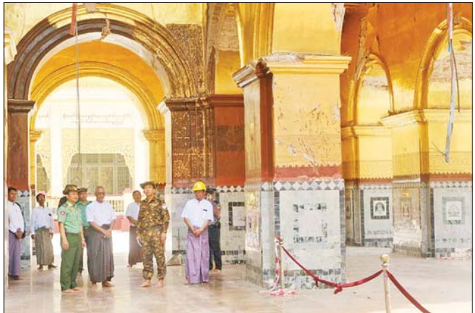
ကာကွယ်ရေးဦးစီးချုပ်ရုံး(ကြည်း)မှ ဒုတိယဗိုလ်ချုပ်ကြီး စိုးတင်နိုင် မန္တလေးမြို့ မဟာမုနိဘုရားကြီးသို့ သွားရောက်၍ အပျက်အစီးများဖယ်ရှားရှင်းလင်းပြီး ပြန်လည်ပြုပြင်တည်ဆောက်ရေးလုပ်ငန်းများ ဆောင်ရွက်နေမှုများကို ကြည့်ရှုစစ်ဆေးစဉ်။