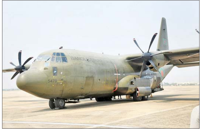
ဘင်္ဂလားဒေ့ရှ်နိုင်ငံမှပေးပို့သည့် လူသားချင်းစာနာထောက်ထားမှုဆိုင်ရာ အကူအညီပစ္စည်းများ တင်ဆောင်သည့် လေယာဉ်ဆိုက်ရောက်စဉ်။

စာမျက်နှာ ၆ မှ ပစ္စည်းများကို ငလျင်ဘေးသင့်ဒေသများသို့ အချိန်မဆိုင်းဘဲ ဆက်လက်ဖြန့်ခွဲ ဆောင်ရွက်လျက်ရှိသည်။ နိုင်ငံတကာက ကူညီထောက်ပံ့သည့် ပစ္စည်းများမှာ မိုးကာဘဲ၊ တာပေါလင်၊ Hygiene Kit၊ Kitchen Set၊ မီးစက်၊ Sleeping Bags၊ စားသောက်ကုန်ပစ္စည်း၊ လှသုံးကုန်ပစ္စည်း၊ အိမ်သုံးကုန်ပစ္စည်း၊ လျှပ်စစ်ပစ္စည်း၊ ဆေးနှင့် ဆေးဝါးပစ္စည်း၊ ခွဲစိတ်ခန်းသုံးပစ္စည်း တို့ဖြစ်သည်။ ပစ္စည်းများကို ပြည်ထောင်စုနယ်မြေ နေပြည်တော်အတွင်း နေပြည်တော်ကောင်စီ၏ အစီအစဉ်ဖြင့်လည်းကောင်း၊ နေပြည်တော်ရှိ ဝန်ထမ်းမိသားစုများကို သက်ဆိုင်ရာ ဝန်ကြီးဌာနများ၏ အစီအစဉ်ဖြင့် လည်းကောင်း၊ ရန်ကုန်နှင့် နေပြည်တော်တို့မှ တစ်ဆင့် မန္တလေးတိုင်းဒေသကြီးသို့ မော်တော်ယာဉ် ၅၂ စီးဖြင့် ပေးပို့ခဲ့သည့် လှူဒါန်းပစ္စည်းများနှင့် မန္တလေး(တံတားဦး) အပြည်ပြည်ဆိုင်ရာ လေဆိပ်သို့ ရောက်ရှိသည့် ပစ္စည်းများကို မန္တလေးတိုင်းဒေသကြီး အစိုးရအဖွဲ့၏ အစီအစဉ်ဖြင့် လည်းကောင်း၊ စစ်ကိုင်းတိုင်းဒေသကြီးသို့ မော်တော်ယာဉ် ၂၃ စီးဖြင့် ပေးပို့ထားသည့် လှူဒါန်းပစ္စည်းများကို စစ်ကိုင်းတိုင်းဒေသကြီးအစိုးရအဖွဲ့၏ အစီအစဉ်ဖြင့် လည်းကောင်း၊ ရှမ်းပြည်နယ် (တောင်ပိုင်း)သို့ မော်တော်ယာဉ် ခုနစ်စီးဖြင့် ပေးပို့ခဲ့သည့် လှူဒါန်းပစ္စည်းများကို ရှမ်းပြည်နယ်အစိုးရအဖွဲ့၏ အစီအစဉ်ဖြင့် လည်းကောင်း၊ ခွဲဝေထောက်ပံ့ဆောင်ရွက်လျက်ရှိသည်။ လှူဒါန်းရရှိသည့် ပစ္စည်းများအနက် ဆေးနှင့် ဆေးပစ္စည်းများ၊ ခွဲစိတ်ခန်းသုံး