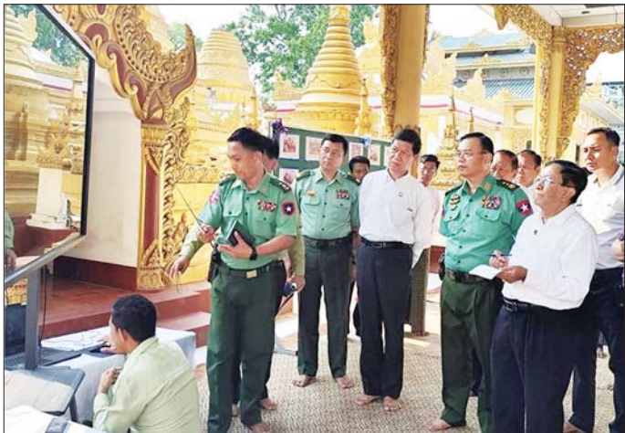
မန္တလေးတိုင်းဒေသကြီးဝန်ကြီးချုပ် ဦးမျိုးအောင်နှင့် ကာကွယ်ရေးဦးစီးချုပ်ရုံး(ကြည်း)မှ ဒုတိယဗိုလ်ချုပ်ကြီး မျိုးသန့်နိုင် ကျောက်သေတ္တာကြီး မူလအခြေအနေမှ တိမ်းစောင်းသွားမှုအခြေအနေ၊ လက်ရှိ တည်ရှိနေမှုအခြေအနေများကို ဒရုန်းဖြင့် ရိုက်ကူးထားသော Video Clip များ၊ မှတ်တမ်းဓာတ်ပုံများကို အသေးစိတ်ကြည့်ရှုစစ်ဆေးစဉ်။

လည်းကောင်း သွားရောက်၍ ကျောင်းတိုက်ဆရာတော်များအား ဖွဲ့ခြေကာ အပျက်အစီးများ ဖယ်ရှားရှင်းလင်းနေမှုကို ကြည့်ရှုစစ်ဆေးပြီး တာဝန်ရှိသူ