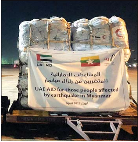
ယူအေအီးနိုင်ငံမှ ကူညီထောက်ပံ့သည့် လူသားချင်း စာနာထောက်ထားမှုဆိုင်ရာ အကူအညီပစ္စည်းများ ဧပြီ ၁၀ ရက်က ရောက်ရှိလာစဉ်။