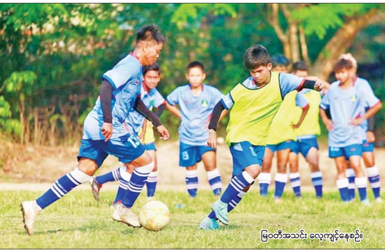
မြဝတီအသင်း လေ့ကျင့်နေစဉ်။

ရန်ကုန် ဧပြီ ၂၁ ၂၀၂၅-၂၀၂၆ ရာသီ မြန်မာအမျိုးသမီးလိဂ်ပြိုင်ပွဲ ပွဲစဉ် (၁) ကို ဧပြီ ၂၂၊ ၂၃ ရက်တွင် စတင်ကျင်းပမည်ဖြစ်ပြီး အသင်းစုစုပေါင်း ကိုးသင်း ပါဝင်ယှဉ်ပြိုင်မည်ဖြစ်သည်။ ယင်းပြိုင်ပွဲကို ဧပြီ ၃ ရက်တွင် စတင်ကျင်းပရန် စီစဉ်ထားသော်လည်း မတ် ၂၈ ရက်က ဖြစ်ပေါ်ခဲ့သည့် မန္တလေးငလျင်ကြောင့် ရွှေ့ဆိုင်းခဲ့ခြင်းဖြစ်သည်။ ယခုရာသီ မြန်မာအမျိုးသမီးလိဂ်ပြိုင်ပွဲတွင် အသင်းစုစုပေါင်း ကိုးသင်းဖြင့် ကျင်းပမည်ဖြစ်ပြီး အသင်းသစ်အဖြစ် ရန်ကုန်ရှိငယ်အသင်း ပါဝင်ယှဉ်ပြိုင်မည် ဖြစ်သည်။ စာမျက်နှာ ၂၃ ကော်လံ ၁