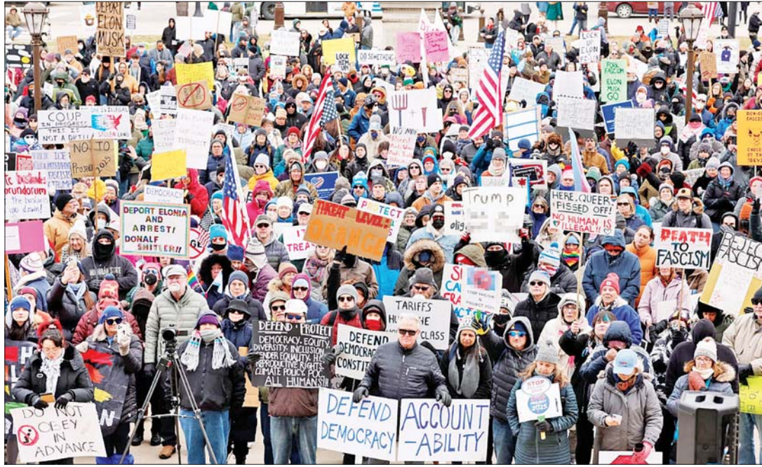
၂၀၂၅ ခုနှစ် ဧပြီ ၁၉ ရက်က အမေရိကန်ပြည်ထောင်စု ဝါရှင်တန်ဒီစီမြို့ရှိ အိမ်ဖြူတော် အပြင်ဘက်၌ တွေ့ရသည့် ဆန္ဒပြသူများ။

ဆန္ဒပြသူများသည် ဒီမိုကရေစီစနစ်အားနည်းလာမှုနှင့် ဖွဲ့စည်းပုံအခြေခံဥပဒေဆိုင်ရာ အကျပ်အတည်းတို့ကို အထူးစိုးရိမ်နေကြသည်။ "တရားစီရင်ရေးလုပ်ထုံးလုပ်နည်း"၊ "ဖွဲ့စည်းပုံအခြေခံဥပဒေဆိုင်ရာ အကျပ်အတည်း"နှင့် "ဒီမိုကရေစီကို ပြန်လည်ထူထောင်ရန်" စသည့် အဓိကစကားလုံးများပါရှိသော ဆိုင်းဘုတ်များစွာက အမေရိကန်ပြည်သူများ၏ ဒီမိုကရေစီနှင့် ဥပဒေစိုးမိုးရေး အခြေအနေဆိုင်ရာ နက်ရှိုင်းသော စိုးရိမ်မှုများကို ထင်ဟပ်နေသည်။ ထရမ် သမ္မတ ရာထူးရရှိလာပြီး သုံးလခန့်အကြာ ၎င်း၏အစိုးရအဖွဲ့ မူဝါဒများကို ဆန့်ကျင်ကန့်ကွက်မှုများသည် အမေရိကန်တစ်ဝန်းတွင် မကြာခဏဖြစ်ပွားခဲ့သည်။ ဧပြီ ၅ ရက်ကစ၍ နိုင်ငံတစ်ဝန်း ဆန္ဒပြပွဲပေါင်း ၁၀၀၀ ကျော် ဖြစ်ပွားခဲ့ပြီး ပြည်နယ် ၅၀ လုံး ပါဝင်ခဲ့သည်။