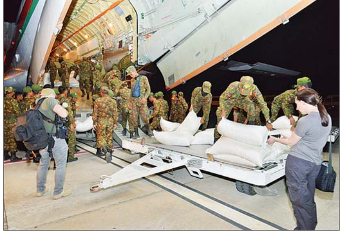
ဘယ်လားရစ်နိုင်ငံမှ ကူညီထောက်ပံ့သည့် လူသားချင်းစာနာထောက်ထားမှုဆိုင်ရာ အကူအညီပစ္စည်းများ ဧပြီ ၇ ရက်က ရောက်ရှိလာစဉ်။

ထောက်ပံ့သည့် လူသားချင်းစာနာထောက်ထားမှုဆိုင်ရာ အကူအညီပစ္စည်းများ၊ ဆေးဝါးများသည် မတ် ၂၉ ရက် ညပိုင်းမှ စတင်၍ ရန်ကုန်အပြည်ပြည်ဆိုင်ရာလေဆိပ်၊ နေပြည်တော်အပြည်ပြည်ဆိုင်ရာလေဆိပ်၊ မန္တလေးအပြည်ပြည်ဆိုင်ရာလေဆိပ်နှင့် ရန်ကုန်သီလဝါဆိပ်ကမ်းတို့သို့ ရောက်ရှိလာခဲ့သည်။ မတ် ၃၀ ရက်မှ ဧပြီ ၂၀ ရက်