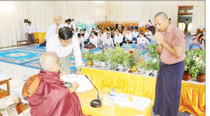
အမြဲတမ်းအတွင်းဝန်နှင့် တာဝန်ရှိသူများက ခဲ့ကြောင်း သိရသည်။ ငါးမြစ်ချင်းကောင်ရေ ၃၀၀၀ ကို ဘေးမဲ့လွတ်ပေး သတင်းစဉ်

အမြဲတမ်းအတွင်းဝန်နှင့် တာဝန်ရှိသူများက ခဲ့ကြောင်း သိရသည်။ ငါးမြစ်ချင်းကောင်ရေ ၃၀၀၀ ကို ဘေးမဲ့လွတ်ပေး