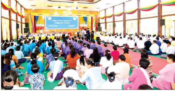
ကန်တော့ပွဲကျင်းပရေး တာဝန်ခံ ထံမှ သိရသည်။

ဒါနကုသိုလ်ပြုကြသည်။ ဆက်လက်၍ ရှမ်းပြည်နယ် အစိုးရအဖွဲ့က ကြီးမှူးကျင်းပ သည့် သက်ကြီးပူဇော်ပွဲ အခမ်း အနားကို နံနက် ၁၀ နာရီတွင် တောင်ကြီးမြို့၊ မြို့တော်ခန်းမ၌ ကျင်းပရာ ရှမ်းပြည်နယ် ဝန်ကြီး ချုပ် ဦးအောင်အောင်နှင့် ဇနီး၊ ပြည်နယ်၊ ခရိုင်၊ မြို့နယ်အဆင့် ဌာနဆိုင်ရာများ၊ အသက် (၈၅) နှစ်အထက် ကန်တော့ခံ အဘိုး အဘွားများ တက်ရောက်ကြပြီး အဘိုးအဘွားများအား ကန်တော့ ချီးမြှင့် ကန်တော့ကြသည်။