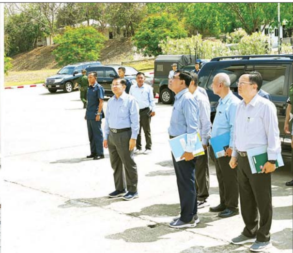
နိုင်ငံတော်စီမံအုပ်ချုပ်ရေးကောင်စီဥက္ကဋ္ဌ နိုင်ငံတော်ဝန်ကြီးချုပ် ဗိုလ်ချုပ်မှူးကြီး မင်းအောင်လှိုင် မန္တလေးလျှင်ကြောင့် ထိခိုက်ပျက်စီးမှုများဖြစ်ပေါ်ခဲ့သည့် ပြည်ထောင်စုတရားလွှတ်တော်ချုပ်ရုံး အဆောက်အအုံအား ကြည့်ရှုစစ်ဆေးစဉ်။

နိုင်ငံတော်စီမံအုပ်ချုပ်ရေးကောင်စီဥက္ကဋ္ဌ နိုင်ငံတော်ဝန်ကြီးချုပ် ဗိုလ်ချုပ်မှူးကြီး မင်းအောင်လှိုင် လျှင်အော်ကြောင့် ထိခိုက်ပျက်စီးမှုများဖြစ်ပေါ်ခဲ့သည့် ဝန်ကြီးရုံးအဆောက်အအုံများအား လိုက်လံကြည့်ရှုစစ်ဆေး ရုံးအဆောက်အအုံများအတွင်းရှိအရေးကြီးသည့် စာရွက်စာတမ်းများ၊ စက်ပစ္စည်းကိရိယာများနှင့် ရွှေ့ပြောင်း၍ရနိုင်သည့် ပစ္စည်းများကို အမြန်ဆုံးရွှေ့ပြောင်းသွားရန်လို