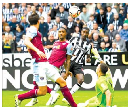
ယခင်တွေ့ဆုံမှုတွင် နယူးကာဆယ်တိုက်စစ်ကစားသမား အီဆတ် ဗီလာဘက်သို့ ရိုးသွင်းယူရန် ကြိုးပမ်းစဉ်။