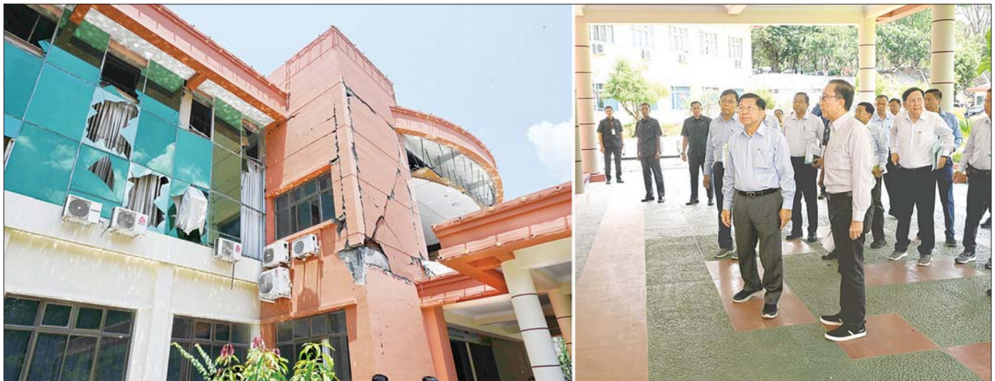
နိုင်ငံတော်စီမံအုပ်ချုပ်ရေးကောင်စီဥက္ကဋ္ဌ နိုင်ငံတော်ဝန်ကြီးချုပ် ဗိုလ်ချုပ်မှူးကြီး မင်းအောင်လှိုင် မန္တလေးငလျင်ကြီးကြောင့် ထိခိုက်ပျက်စီးမှုများဖြစ်ပေါ်ခဲ့သည့် စီမံကိန်းနှင့်ဘဏ္ဍာရေးဝန်ကြီးဌာန ရုံးအဆောက် အအုံအား ကြည့်ရှုစစ်ဆေးစဉ်။

ကျေးဇူးတင်စွာ လိုက်လံကြည့်ရှု ထိခိုက်ပျက်စီးမှုများ ဖြစ်ပေါ်ခဲ့ အုပ်ချုပ်ရေးကောင်စီ ဥက္ကဋ္ဌ သည့် ပြည်ထောင်စုတရားလွှတ် နိုင်ငံတော်ဝန်ကြီးချုပ်နှင့် အဖွဲ့ဝင် အလုပ်သမားဝန်ကြီးဌာန ရုံး အဆောက်အအုံ၊ ဥပဒေရေးရာ ဝန်ကြီးဌာနရှိ မြေကာနံရံပြိုကျ တော်ချုပ်ရုံး အဆောက်အအုံ၊ ပျက်စီးခဲ့မှုစီမံကိန်းနှင့်ဘဏ္ဍာရေး ဝန်ကြီးဌာန ရုံးအဆောက်အအုံ၊ ဖြစ်ပေါ်ခဲ့ ရာထူးဝန်အဖွဲ့ ဝန်ကြီးဌာန ရုံးအဆောက်အအုံ၊ နိုင်ငံခြားရေး ဝန်ကြီးဌာနရုံးအဆောက်အအုံနှင့် ဝန်ထမ်းများအား ယာယီနေထိုင် နိုင်ငံရေး စီစဉ်ဆောင်ရွက်ပေး ထားမှု အခြေအနေများအား စာမျက်နှာ ၄ သို့