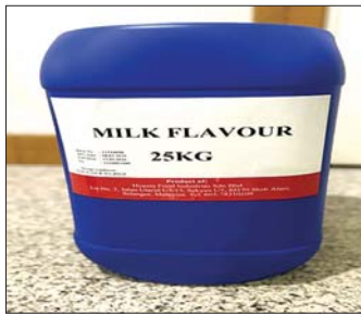
ရန်ကုန်အပြည်ပြည်ဆိုင်ရာလေဆိပ်၌ ဖမ်းဆီးရမိမှု။

နေပြည်တော် ဧပြီ ၁၈ တရားမဝင်ကုန်သွယ်မှုတိုက်ဖျက်ရေး ဦးဆောင် ကော်မတီ၏ ကြီးကြပ်ကွပ်ကဲမှုဖြင့် တရားမဝင် ကုန်သွယ်မှုများကို ဥပဒေနှင့်အညီ ထိရောက်စွာ တားဆီးရေးလှုပ်ရှားမှုများ ဆောင်ရွက်လျက်ရှိရာ အကောက်ခွန်ဦးစီးဌာန၏ စီမံခန့်ခွဲမှုဖြင့် တာဝန်ကျ ပူးပေါင်းအဖွဲ့များက စစ်ဆေးမှုများဆောင်ရွက်ခဲ့ရာ ဧပြီ ၁၄ ရက်တွင် ရန်ကုန်အပြည်ပြည်ဆိုင်ရာ လေဆိပ်၌ မလေးရှားနိုင်ငံမှ မြန်မာနိုင်ငံသို့ လေယာဉ်ခရီးစဉ်အမှတ် 8M-504/SF-3581 ဖြင့် လိုက်ပါလာသော မြန်မာနိုင်ငံသားခရီးသည်တစ်ဦး ၏ ဝန်စည်များအတွင်းမှ တရားဝင်စာရွက်စာတမ်း အထောက်အထား တင်ပြနိုင်ခြင်းမရှိသည့် စားသောက်ကုန်ပစ္စည်းတစ်မျိုး (ခန့်မှန်းတန်ဖိုး ငွေကျပ် ၂၈၀၀၀၀၀)ကိုလည်းကောင်း၊ ဧပြီ ၁၇ ရက် တွင် ရန်ကုန်အပြည်ပြည်ဆိုင်ရာလေဆိပ်၌ ထိုင်းနိုင်ငံမှ မြန်မာနိုင်ငံသို့ လေယာဉ်ခရီးစဉ်အမှတ် 8M-504/SF-3581 ဖြင့် လိုက်ပါလာသော မြန်မာနိုင်ငံ