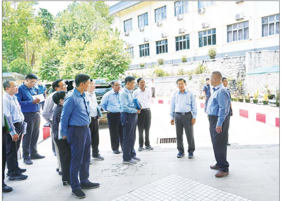
နိုင်ငံတော်စီမံအုပ်ချုပ်ရေးကောင်စီဥက္ကဋ္ဌ နိုင်ငံတော်ဝန်ကြီးချုပ် ဗိုလ်ချုပ်မှူးကြီး မင်းအောင်လှိုင် မန္တလေးငလျင်ကြီးကြောင့် ထိခိုက်ပျက်စီးမှု များဖြစ်ပေါ်ခဲ့သည့် ပြည်ထောင်စုရာထူးဝန်အဖွဲ့ ရုံးအဆောက်အအုံအား ကြည့်ရှုစစ်ဆေးပြီး လိုအပ်သည်များ မှာကြားစဉ်။

□ အဆောက်အအုံများအား တစ်လုံးတည်း ကြီးမားစွာတည်ဆောက်ခြင်းထက် အကန့်လိုက်၊ အလုံးလိုက်ခွဲ၍ တည်ဆောက်မည် ဆိုပါက ငလျင်ဒဏ်ကို ပိုမိုခံနိုင်မည်ဖြစ်။ အဆောက်အအုံများ စတင်ဆောက်လုပ်စဉ် ကတည်းက ရေရှည်ခိုင်ခံ့စေရန်အတွက် လိုအပ်သည့် ရေလှိုင်း၊ မီးလှိုင်းများကို လည်း စနစ်တကျ ထည့်သွင်းတွက်ချက် တည်ဆောက်သွားရန်လို၊ ဝန်ထမ်းမိသားစု များအတွက် ယာယီနေထိုင်မည့် နေရာ များကို ဆောက်လုပ်ရာတွင်လည်း စနစ် တကျဖြင့် တည်ဆောက်ပေးသွားရန်နှင့် နိုင်ငံတော်မှ စီစဉ်ဆောင်ရွက်ပေးသွား မည်ဖြစ်