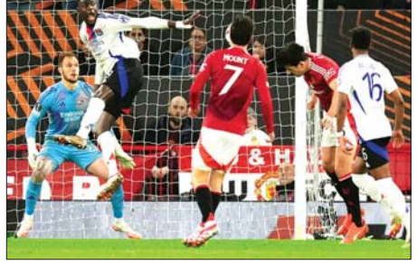
မန်ယူစစ်ကစားသမား မက်ဂျိုင်ယား လိုင်ယွန်အသင်းဘက် ခေါင်းတိုက် ဂိုးသွင်းယူစဉ်။

များကို တိုလစ်ဆို၊ တက်လီယာ ဖီဂို၊ ချာကီနှင့် လာကာဇက်တို့က သွင်းယူပေးခဲ့သည်။ အခြားပွဲစဉ် ရလဒ်များတွင် ဘီလီဘာအိုက ရိုနီးဂျားကို နှစ်ဂိုး- ဂိုးမရှိ၊ စပါးက ဖရန့်ဖတ်ကို တစ်ဂိုး-ဂိုးမရှိ၊ လာဇီယိုက ဘိုဒို ဂလင်ကို သုံးဂိုး-တစ်ဂိုးဖြင့် အသီးသီး နိုင်ပွဲကိုယ်စီရရှိခဲ့ကြ သည်။ ယူရိုပါလိဂ် ဒုတိယအကျော့ ပွဲစဉ်များ ယှဉ်ပြိုင်ကစားအပြီး တွင် နှစ်ကျော့ပေါင်းရလဒ်ဖြင့် နောက်တစ်ဆင့်ကို မန်ယူအသင်း နှင့်အတူ ဘီလီဘာအို၊ စပါး၊ ဘိုဒိုဂလင်နှင့် ယှဉ်ပြိုင်ကစားရ မည်ဖြစ်သည်။ ယူရိုပါလိဂ် ဆီမီး ဖိုင်နယ်ပွဲစဉ်များကို လာမည့် ဖေလတွင် နှစ်ကျော့စုစုဖြင့် ယှဉ်ပြိုင် ကစားအားမည်ဖြစ် သည်။ အောင်ဇော်