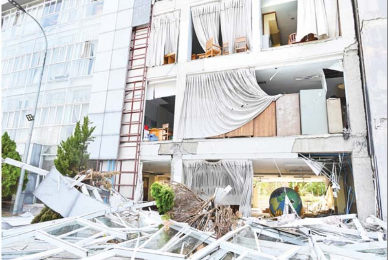
နိုင်ငံတော်စီမံအုပ်ချုပ်ရေးကောင်စီဥက္ကဋ္ဌ နိုင်ငံတော်ဝန်ကြီးချုပ် ဗိုလ်ချုပ်မှူးကြီး မင်းအောင်လှိုင် မန္တလေးငလျင်ကြီးကြောင့် ထိခိုက်ပျက်စီးမှုများဖြစ်ပေါ်ခဲ့သည့် နိုင်ငံခြားရေးဝန်ကြီးဌာနရုံးအဆောက်အအုံအား ကြည့်ရှုစစ်ဆေးစဉ်။

စာမျက်နှာ ၃ မှ လိုက်လံကြည့်ရှု စစ်ဆေးရာ ပြည်ထောင်စုအဆင့်ပုဂ္ဂိုလ်များနှင့် ပြည်ထောင်စု ဝန်ကြီးများက ငလျင်ဒဏ်ကြောင့် အဆောက်အအုံများ ထိခိုက်ပျက်စီးခဲ့မှု အခြေအနေများ၊ ယာယီရုံးများ ဖွင့်လှစ်၍ ရုံးလုပ်ငန်းများဆောင်ရွက်လျက်ရှိမှု အခြေအနေများ၊ ဝန်ထမ်းမိသားစုများ ယာယီနေထိုင်နိုင်ရေး ဆောင်ရွက်ပေးထားမှု အခြေအနေများအား အသီးသီး ရှင်းလင်းတင်ပြ ကြသည်။