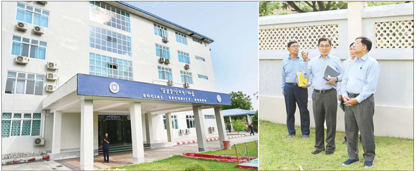
နိုင်ငံတော်စီမံအုပ်ချုပ်ရေးကောင်စီဥက္ကဋ္ဌ နိုင်ငံတော်ဝန်ကြီးချုပ် ဗိုလ်ချုပ်မှူးကြီး မင်းအောင်လှိုင် မန္တလေးငလျင်ကြီးကြောင့် ထိခိုက်ပျက်စီးမှုများဖြစ်ပေါ်ခဲ့သည့် လူမှုဖူလုံရေးအဖွဲ့ရုံးအဆောက်အအုံအား ကြည့်ရှုစစ်ဆေးစဉ်။

စာမျက်နှာ ၄ မှ ပညာရှင်များ၊ ဆောက်လုပ်ရေး ပြန်လည် တည်ဆောက်ရေး ပညာရှင်များ၏ အကြံဉာဏ် လုပ်ငန်းများ ဆောင်ရွက်ရာတွင် များ ရယူတည်ဆောက်သွားရန် ရေရှည်ခိုင်ခံ့မှုရှိစေရန်နှင့် ငလျင် ဒဏ်ခံနိုင်သည့် အဆောက်အအုံ များအား တစ်လုံးတည်း ကြီးမား များ ဖြစ်စေရေးအတွက် ငလျင် စွာ တည်ဆောက်ခြင်းထက် အကန့်လိုက်၊ အလုံးလိုက်ခွဲ၍ တည်ဆောက်မည်ဆိုပါက ငလျင် ဒဏ်ကို ပိုမိုခံနိုင်မည်ဖြစ်ကြောင်း၊ အဆောက်အအုံများ စတင် ဆောက်လုပ်စဉ် ကတည်းက ရေရှည်ခိုင်ခံ့ စေရန်အတွက် လိုအပ်သည့်ရေလှိုင်း၊ မီးလှိုင်းများ ကိုလည်း စနစ်တကျထည့်သွင်း တွက်ချက် တည်ဆောက်သွားရန် လိုကြောင်း၊ ဝန်ထမ်းမိသားစုများ အတွက် ယာယီနေထိုင်မည့်နေရာ များကို ဆောက်လုပ်ရာတွင်လည်း စနစ်တကျဖြင့်တည်ဆောက်ပေး သွားရန်နှင့် နိုင်ငံတော်မှ စီစဉ် ဆောင်ရွက်ပေးသွားမည် ဖြစ် ကြောင်း၊ သောက်ရေ သုံးရေများ လုံလောက်စွာရရှိရေး စီစဉ်ဆောင် ရွက်ပေးရန်နှင့် ဝန်ထမ်းများ၏ စားရေးအဆင်ပြေစေရေးအတွက် လည်း နိုင်ငံတော်မှစီစဉ်ဆောင်ရွက် ပေးထားကြောင်းနှင့် အခြား လိုအပ်သည်များကို လမ်းညွှန် မှာကြားခဲ့ကြောင်း သတင်းရရှိ သတင်းစဉ်