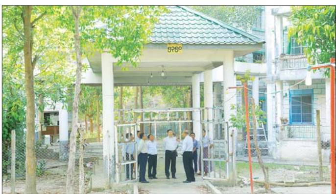
ယိုယွင်းသွားသည့် နေပြည်တော် မြေထဲရှိမြို့နယ် ဝဏ္ဏသိဒ္ဓိ ရပ်ကွက်အတွင်းရှိ တိုက်အမှတ် ၃၃၉၉ ကို လည်းကောင်း၊ ငလျင်ဒဏ်ကြောင့် ဝန်ထမ်းအိမ်ရာများ ကွဲအက်

နေပြည်တော် ဧပြီ ၁၈ အားကစားနှင့် လူငယ်ရေးရာ ဝန်ကြီးဌာန ပြည်ထောင်စုဝန်ကြီး Jeng Phang နော်တောင်သည် ဒုတိယဝန်ကြီးများ၊ တာဝန်ရှိသူ များနှင့်အတူ ယာယီဝန်ထမ်း အိမ်ရာ ဘာရာတည်ဆောက်ရေး ကိစ္စရပ်များနှင့် ပတ်သက်၍ ယနေ့နံနက်က ရုံးအမှတ် (၃၁) ၌ ညှိနှိုင်းဆွေးနွေးသည်။ ထို့နောက် အားကစား နှင့် လူငယ်ရေးရာဝန်ကြီးဌာန ပြည်ထောင်စုဝန်ကြီး Jeng Phang နော်တောင်၊ ဒုတိယ ဝန်ကြီးများနှင့် တာဝန်ရှိသူများ သည် မတ် ၂၈ ရက်က လှုပ်ခတ် ခဲ့သည့် ငလျင်ဒဏ်ကြောင့် ဝန်ထမ်းအိမ်ရာများ ပျက်စီး