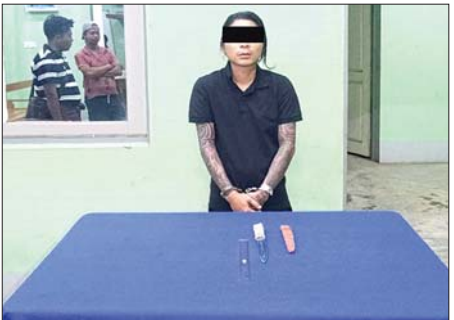
ပျဉ်းမနားမြို့နယ်၌ လွယ်အိတ်အတွင်း စားဦးချွန်ဆောင်ယူလာသူ အမျိုးသား တစ်ဦးအား ဖမ်းဆီးရမိမှု။

တိမ်အသင့်အတင့်မှ တိမ်ထူထပ်နေ နေပြည်တော် ဧပြီ ၁၈ ဘင်္ဂလားပင်လယ်အော်အခြေအနေမှာ ကပ္ပလီပင်လယ်ပြင်နှင့် ဘင်္ဂလားပင်လယ်အော်တောင်ပိုင်း တို့တွင် တိမ်အသင့်အတင့်မှ တိမ်ထူထပ်နေပြီး ကျန်ဘင်္ဂလားပင်လယ်အော်တွင် တိမ်အနည်းငယ် ဖြစ်ထွန်းနေသည်။ မိုး/လေ