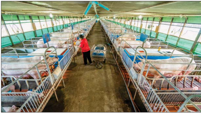
ဝက်မွေးမြူရေးခြံတစ်ခုကို တွေ့ရစဉ်။

နိုင်ငံတော်စီမံအုပ်ချုပ်ရေးကောင်စီ ဦးတည်ချက်(၉)ရပ်ပါ စီးပွားရေးဦးတည်ချက်(၃)ရပ်၏ ပထမဦးတည်ချက်ဖြစ်သည့် “တိုင်းပြည်သာယာဝပြောရေးနှင့် စားရေရိက္ခာဖူလုံရေးတို့အတွက်