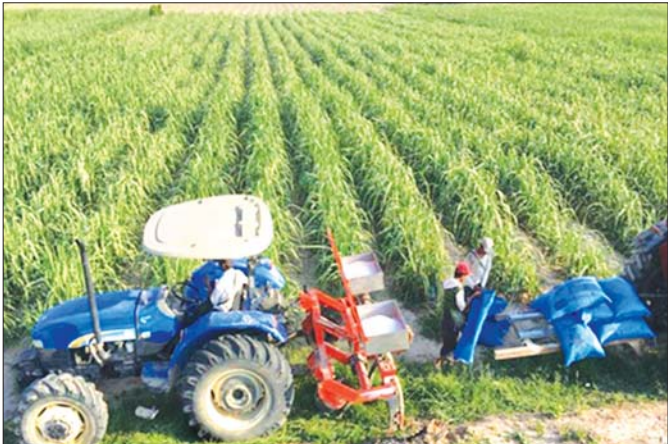
ကြီးသီးပန်းစိုက်ခင်း

မြန်မာနိုင်ငံသည် ရေမြေသာသာအရ ကြီးသီးပန်း ဖြစ်ထွန်းမှုအနေအထားရှိခြင်း၊ လူသားအရင်း အမြစ်အရလုပ်ခစရိတ်သက်သာခြင်း၊ ကြံစိုက်ပျိုး၊ သကြားထုတ်လုပ်မှုဆိုင်ရာနည်းပညာကျွမ်းကျင် သူများ အထိုက်အလျောက်ရှိခြင်းနှင့် သကြား လိုအပ်ချက်ရှိနေသည့် အိမ်နီးချင်းနိုင်ငံများသို့ တင်ပို့ ရောင်းချနိုင်သည့် ဈေးကွက်အလားအလာ ရှိခြင်းတို့ကြောင့် တိုင်းဒေသကြီး၊ ပြည်နယ် ၁၃ ခုတွင် နှစ်စဉ် ဧက လေးသိန်းကျော်စိုက်ပျိုးလျက် ရှိပြီး အထွက်နှုန်းအနေဖြင့် ပျမ်းမျှ ၂၇ တန်ခန့် ထွက်ရှိသဖြင့် နိုင်ငံတော်ကသတ်မှတ်ထားသည့် ကြီးသီးပန်းပင်အထွက်နှုန်းဖြစ်သော တစ်ဧက တန် ၃၀ ရရှိရေး နှိုးစပ်နေပြီဖြစ်ရာ ပန်းတိုင်အပြည့် အဝ ရရှိရေး ကြိုးပမ်း၍ ဦးတည်ဆောင်ရွက်ရမည် ဖြစ်ပါသည်။