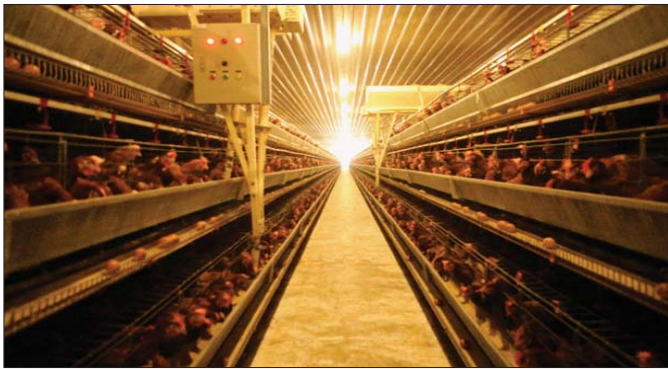
ကြက်မွေးမြူရေးခြံတစ်ခုကို တွေ့ရစဉ်။

လိုက်နာဆောင်ရွက်မှုရှိ မရှိကို ဌာနက သတ်မှတ်ထားသော စိစစ်ရေးအချက်အလက်များဖြင့် စိစစ်ပြီး လိုက်နာဆောင်ရွက်ပါက အသိအမှတ်ပြုလက်မှတ်ထုတ်ပေးခြင်း ဖြစ်ပါသည်။