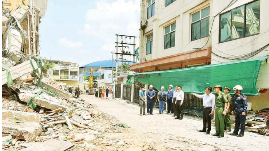
နိုင်ငံတော်စီမံအုပ်ချုပ်ရေးကောင်စီအဖွဲ့ဝင်များဖြစ်ကြသည့် ဗိုလ်ချုပ်ကြီး မောင်မောင်အေးနှင့် ဗိုလ်ချုပ်ကြီး ညိုစော Golden City Hotel အပျက်အစီးများ ဖယ်ရှားရှင်းလင်းနေမှုကို ကြည့်ရှုစစ်ဆေးစဉ်။

သတ်မှတ်ကာ စနစ်တကျ ဆောင်ရွက်ပေးသွားမည် ဖြစ်ကြောင်း ပြောကြားပြီး အပျက်အစီးများ ဖယ်ရှားရှင်းလင်းရေးနှင့် ပြန်လည်ပြုပြင် တည်ဆောက်ရေးလုပ်ငန်းများအတွက် လိုအပ်သည်များ ဖြည့်ဆည်းဆောင်ရွက်ပေးသည်။ လှည့်လည်ကြည့်ရှုစစ်ဆေးသင်းနောက် ချမ်းမြသာစည်မြို့နယ်ရှိ တပ်မတော်စည်သူတံစက်ရုံသို့ သွားရောက်၍ ငလျင်ဒဏ်ကြောင့် ထိခိုက်ပျက်စီးမှုများအား လှည့်လည်ကြည့်ရှုစစ်ဆေးပြီး တာဝန်ရှိသူများအား စက်ရုံပြန်လည် တည်ဆောက်ရေးလုပ်ငန်းများနှင့် ပတ်သက်၍ အသေးစိတ် မှာကြားသည်။ ထို့နောက် စက်ရုံရှိ ဝန်ထမ်းများနှင့် မိသားစုများအား တွေ့ဆုံ၍ အားပေးစကား ပြောကြားပြီး သောက်သုံးရေ ဖူလုံစွာရရှိရေး၊ နေထိုင်စားသောက်မှု အဆင်ပြေစေရေးတို့နှင့် ပတ်သက်၍ လိုအပ်ချက်များအား ဖြည့်ဆည်းဆောင်ရွက်ပေးရေးတို့အတွက် တာဝန်ရှိသူများကို မှာကြားကာ လိုအပ်သည်များ ဖြည့်ဆည်းဆောင်ရွက်ပေးသည်။ ထို့နောက် ချမ်းအေးသာစံမြို့နယ်ရှိ Golden City Hotel နေရာ၌ အပျက်အစီးများ ဖယ်ရှားရှင်းလင်းနေမှုအား လည်းကောင်း၊ ချမ်းအေးသာစံမြို့နယ်ရှိ အမှတ် (၄) ရေစစ်ကန်၌ ရေပေးဝေရေးလုပ်ငန်း ဆောင်ရွက်နေမှုများအား လည်းကောင်း၊ Sky Villa နေရာတွင် အဆောက်အအုံအပျက်အစီးများ ဖယ်ရှားရှင်းလင်းနေမှုများအား လည်းကောင်း သွားရောက်ကြည့်ရှုစစ်ဆေးပြီး လိုအပ်သည်များကို တာဝန်ရှိသူများနှင့် ညှိနှိုင်းပေါင်းစပ် ဆောင်ရွက်ပေးသည်။ ၎င်းနောက် မန္တလေးမြို့နန်းမြို့ရိုးရှိ ငလျင်ဒဏ်ကြောင့်