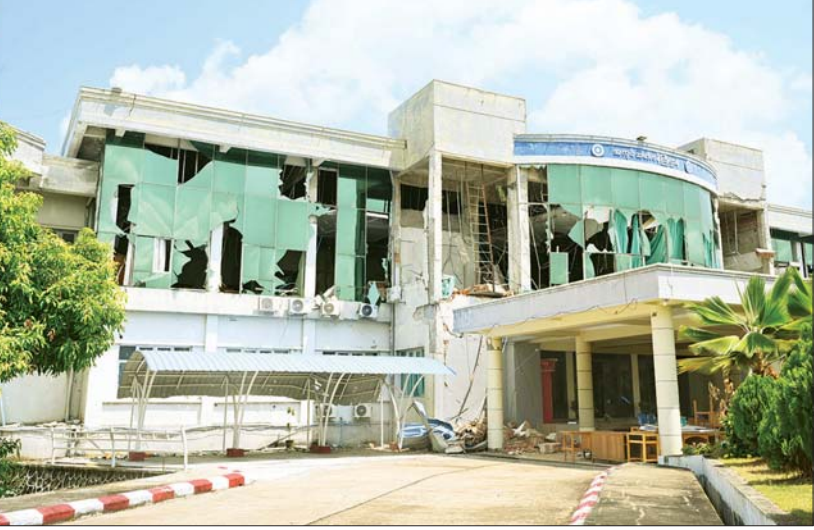
နိုင်ငံတော်စီမံအုပ်ချုပ်ရေးကောင်စီဥက္ကဋ္ဌ နိုင်ငံတော်ဝန်ကြီးချုပ် ဗိုလ်ချုပ်မှူးကြီး မင်းအောင်လှိုင် မန္တလေးငလျင်ကြီးကြောင့် ထိခိုက်ပျက်စီးမှုများဖြစ်ပေါ်ခဲ့သည့် အလုပ်သမားဝန်ကြီးဌာနရုံးအဆောက်အအုံအား ကြည့်ရှုစစ်ဆေးစဉ်။