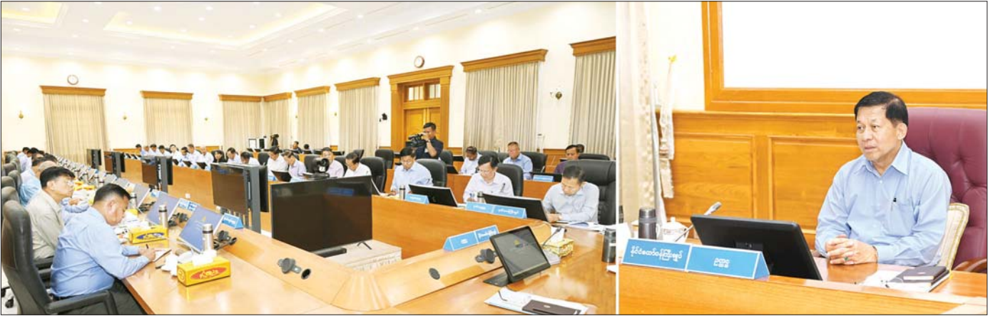
နိုင်ငံတော်စီမံအုပ်ချုပ်ရေးကောင်စီဥက္ကဋ္ဌ နိုင်ငံတော်ဝန်ကြီးချုပ် ဗိုလ်ချုပ်မှူးကြီး မင်းအောင်လှိုင် ပြည်ထောင်စုအစိုးရအဖွဲ့ လုပ်ငန်းညှိနှိုင်းအစည်းအဝေးတွင် အမှာစကားပြောကြားစဉ်။