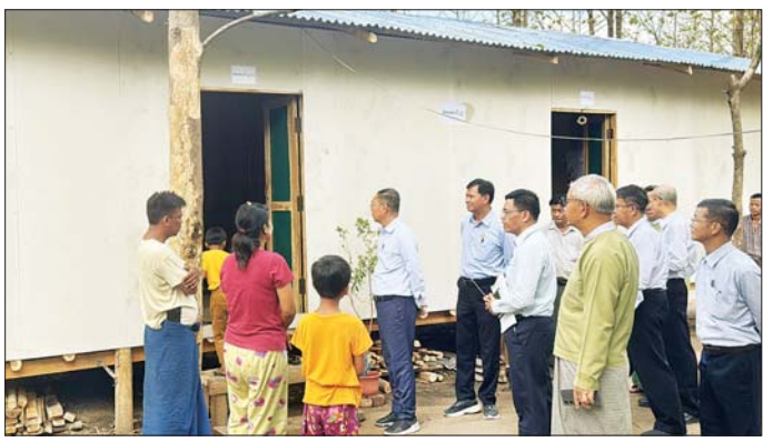
တည်ဆောက်နေမှုအခြေအနေကို ကြည့်ရှုစစ်ဆေး ဆောင်ရွက်ပေးခဲ့သည်။ ပြီး ဝန်ထမ်းများ၏ လိုအပ်သည်များ ပေါင်းစပ်

အဆောက်အအုံများ မေလမကုန်မီ အချိန်မီပြီးစီးရေး အတွက် အရှိန်အဟုန်ဖြင့် ဆောင်ရွက်သွားရန်နှင့် ဝန်ထမ်းမိသားစုများ ရွှေ့ပြောင်းနေထိုင်ရေး စနစ် တကျ စီစဉ်ဆောင်ရွက်သွားရန် မှာကြားသည်။ ဆက်လက်၍ ပြည်ထောင်စုဝန်ကြီးနှင့်အဖွဲ့ သည် ဆောက်လုပ်ပြီးစီးသော နေအိမ်များတွင် ဝန်ထမ်းမိသားစုများ ရွှေ့ပြောင်းနေထိုင်နေမှု အခြေ အနေနှင့် ဝန်ထမ်းအိမ်ရာများမှ ယာယီနေရာ ရွှေ့ပြောင်းထားသော ဝန်ထမ်းမိသားစုများအား တွေ့ဆုံလိုအပ်သည်များ ပေါင်းစပ်ဆောင်ရွက်ပေး ကာ ကားပါကင်ဝင်းရှိ အဆောက်အအုံခွဲ ယာယီ ရုံးခန်းဖွင့်လှစ်၍ ရုံးလုပ်ငန်းများ ဆောင်ရွက်နေမှု အခြေအနေကို ကြည့်ရှုစစ်ဆေးသည်။ ယင်းနောက် ပြည်ထောင်စုဝန်ကြီးသည် ရုံး အမှတ် (၂၈) ပြည်ထောင်စုဝန်ကြီးရုံးဝင်းအတွင်း ဝန်ထမ်းမိသားစုများနေထိုင်ရန် အဆောက်အအုံများ