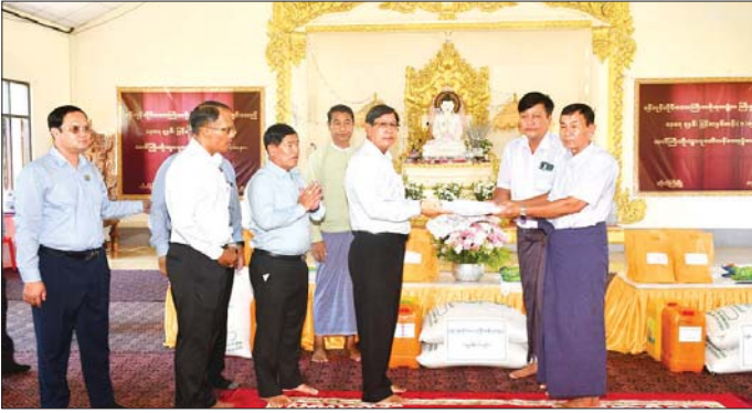
ရန်ကုန်တိုင်းဒေသကြီးဝန်ကြီးချုပ် မှော်ဘီမြို့နယ်နှင့် တိုက်ကြီးမြို့နယ်တို့ရှိ ဘိုးဘွားရိပ်သာများအား အလှူငွေနှင့်ပစ္စည်းများ လှူဒါန်း

ရန်ကုန် ဧပြီ ၁၈ ရန်ကုန်တိုင်းဒေသကြီးဝန်ကြီးချုပ် ဦးစိုးသိန်းနှင့် ဇနီး၊ ရန်ကုန်တိုင်းဒေသကြီးအစိုးရအဖွဲ့ဝင်များနှင့် ဇနီးများ၊ အမျိုးသမီးရေးရာအဖွဲ့ဝင်များ၊ မိခင်နှင့် ကလေးစောင့်ရှောက်မှုကြီးကြပ်ရေး အဖွဲ့ဝင်များနှင့် တာဝန်ရှိသူများသည် ယနေ့နံနက်ပိုင်းက မှော်ဘီမြို့နယ်နှင့် တိုက်ကြီးမြို့နယ်တို့ရှိ ဘိုးဘွားရိပ်သာများအား သွားရောက်ကြည့်ရှုအားပေးကာ အလှူငွေနှင့် ပစ္စည်းများ ပေးအပ်လှူဒါန်းကြသည်။