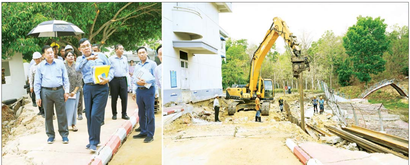
နိုင်ငံတော်စီမံအုပ်ချုပ်ရေးကောင်စီဥက္ကဋ္ဌ နိုင်ငံတော်ဝန်ကြီးချုပ် ဗိုလ်ချုပ်မှူးကြီး မင်းအောင်လှိုင် မန္တလေးငလျင်ကြီးကြောင့် ထိခိုက်ပျက်စီးမှုများဖြစ်ပေါ်ခဲ့သည့် ဥပဒေရေးရာဝန်ကြီးဌာနရှိ မြေကာနံရံပြိုကျမှုအား ကြည့်ရှုစစ်ဆေးစဉ်။

( ၃-၉-၂၀၂၄ ရက်နေ့တွင် နိုင်ငံတော်စီမံအုပ်ချုပ်ရေးကောင်စီဥက္ကဋ္ဌ နိုင်ငံတော်ဝန်ကြီးချုပ် ဗိုလ်ချုပ်မှူးကြီး မင်းအောင်လှိုင် ရှမ်းပြည်နယ်အစိုးရအဖွဲ့ဝင်များ၊ ပြည်နယ်နှင့် ခရိုင်အဆင့်ဌာနဆိုင်ရာတာဝန်ရှိသူများအား ပြောကြားသည့် အမှာစကားမှ ကောက်နုတ်ချက် )