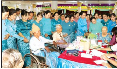
များအား ကန်တော့ပစ္စည်းများနှင့်အတူ ကန်တော့ခဲ့ကြသည်။ ယင်းနောက် ကန်တော့သံသက်ကြီးဘိုးဘွားများအား တိုင်းဒေသကြီး ပြည်သူ့ကျန်းမာရေးဦးစီးဌာနမှ ကျန်းမာရေးစောင့်ရှောက်မှုများ ပြုလုပ်ပေးခဲ့ကြောင်း သိရသည်။

ထို့နောက် ဗုဒ္ဓအသံဓမ္မဗိမာန်တော်ကြီးတွင် ကျင်းပသည့် သက်ကြီးပူဇော်ပွဲအခမ်းအနားသို့တက်ရောက်ပြီး ကန်တော့သံ သက်ကြီးဘိုးဘွားများအား ကျန်းမာရေးစောင့်ရှောက်မှုများ ပြုလုပ်ပေးခဲ့ကြောင်း သိရသည်။