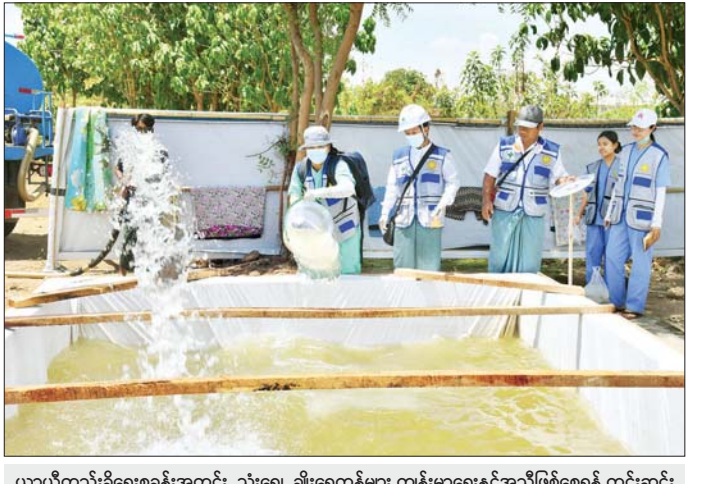
ယာယီတည်းခိုရေးစခန်းအတွင်း သုံးရေ ချိုးရေကန်များ ကျန်းမာရေးနှင့်အညီဖြစ်စေရန် ကွင်းဆင်းဆောင်ရွက်စဉ်။