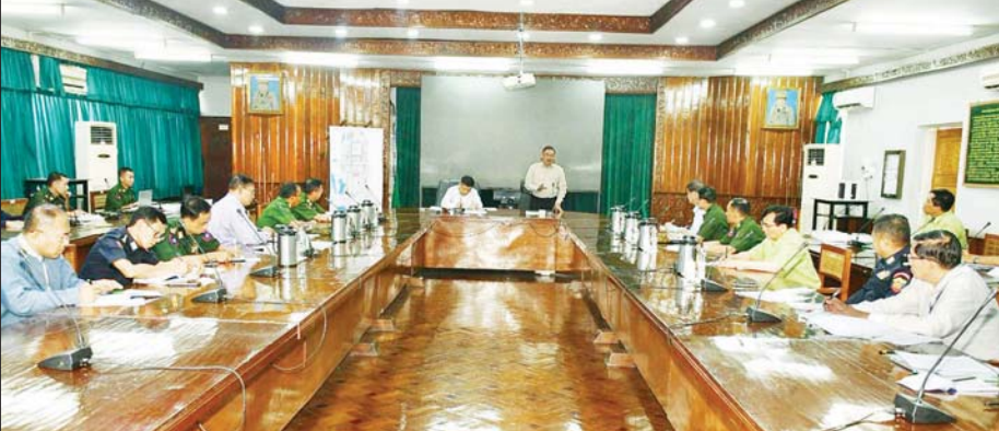
ငလျင်ဒဏ်သင့်နေရာများရှိ အဆောက်အအုံအပျက်အစီးများ ဖယ်ရှားရှင်းလင်းရေးနှင့် ပြန်လည်တည်ဆောက်ရေးလုပ်ငန်းများ စနစ်တကျ ဆောင်ရွက်နိုင်ရေးလုပ်ငန်းညှိနှိုင်းအစည်းအဝေးကျင်းပစဉ်။

ပြုပြင် ဆောင်ရွက်ရာတွင်လည်း Standard Operating Procedure (SOP)အရ ငလျင်ဒဏ်ခံနိုင်အောင် စနစ်တကျ ဆောင်ရွက်သွားရမည် ဖြစ်ကြောင်း၊ နောင်အဆောက်အအုံအသစ်များ ဆောက်လုပ်ရာတွင် နိုင်ငံတော်ပိုင်အဆောက်အအုံများ၊ ပုဂ္ဂလိကပိုင်အဆောက်အအုံများ၊ အလှူရှင်များမှ ဆောက်လုပ် လှူဒါန်းသည့် အဆောက်အအုံများ စသည်ဖြင့် မည်သည့် အဆောက်အအုံများ ဆောက်လုပ်သည်ဖြစ်စေ ရန်(ံ) တာဝန်ကေး ၈ အထိ ငလျင်ဒဏ်ခံနိုင်သည့် Standard Operating Procedure(SOP)များအတိုင်း လိုက်နာ ဆောင်ရွက်သွားရန် လိုကြောင်း၊ အဆောက်အအုံများ ပြင်ဆင်ခြင်းနှင့် အသစ်တည်ဆောက်ခြင်း စသည့်လုပ်ငန်းများကို လုပ်ထုံးလုပ်နည်းများနှင့်အညီ အမြန်ဆုံး စတင်ဆောင်ရွက်သွားရန်လိုအပ်ကြောင်း၊ အစိုးရရုံးလုပ်ငန်းပိုင်းဆိုင်ရာများအနေဖြင့်လည်း ရုံးလုပ်ငန်းများ ပုံမှန်လည်ပတ်နိုင်အောင် ယာယီရှင်းခန်းများ ဖွင့်လှစ်၍ စနစ်တကျ ဆောင်ရွက်သွားရန် မှာကြားသည်။ ထို့နောက် နိုင်ငံတော်စီမံအုပ်ချုပ်ရေးကောင်စီ အဖွဲ့ဝင် ဗိုလ်ချုပ်ကြီး မောင်မောင်အေးနှင့် ဗိုလ်ချုပ်ကြီး ညိုစောတို့သည် အဖွဲ့ဝင်များနှင့်အတူ မန္တလေးမြို့မြို့ပတ်လမ်းနေရာသို့ သွားရောက်၍ ငလျင်ဒဏ်ကြောင့် ပျက်စီးခဲ့သည့် လမ်းပိုင်းနေရာအား ပြန်လည်ပြုပြင်နေမှု အခြေအနေများကို ကြည့်ရှုစစ်ဆေးပြီး လိုအပ်သည်များ ဖြည့်ဆည်းတကျ ဆောင်ရွက်သွားမည်ဖြစ်ကြောင်း၊ သတင်းရရှိသည်။