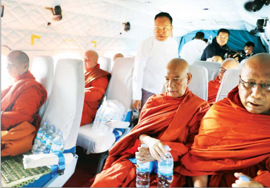
ပြည်ထောင်စုနယ်မြေ နေပြည်တော်ဝေဟင်၌ ရဟတ်ယာဉ်ဖြင့် ဆရာတော်ကြီးများက အန္တရာယ်ကင်းပရိတ်တရားတော်များ လှည့်လည်ရွတ်ဖတ်စဉ်။