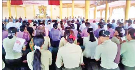
ရာရောက် သွားရောက်ကန်တော့၍ ၉၁ သိန်းကျော်တန်ဖိုးရှိ ဆေးဝါး၊ အာဟာရမုန့်၊ ဖြည့်စွက်အစားအစာများနှင့် အလှူငွေများ လှူဒါန်းကြရာ ဘိုးဘွားများက ဝမ်းမြောက် ဝမ်းသာစွာဖြင့် နှစ်သစ်ကောင်းချီးမင်္ဂလာ ပြည့်စုံစေရန် ဆုပေးစကားများ ချီးမြှောက်ခဲ့ကြောင်း သတင်းရရှိသည်။ သတင်းစဉ်

နေပြည်တော် ဧပြီ ၁၇ မြန်မာသက္ကရာဇ် ၁၃၈၇ ခုနှစ် မြန်မာနှစ်ဆန်း တစ်ရက်နေ့တွင် စစ်ကိုင်းတိုင်းဒေသကြီး တွင် ကန်ဘလူမြို့နယ်ရှိ ရပ်ကွက် ၅ ရပ်ကွက်မှ အသက် ၈၅ နှစ်နှင့်အထက် သက်ကြီးဘိုးဘွားများအား ပူဇော်ကန်တော့ခြင်းကို ယနေ့နံနက်ပိုင်းတွင် ကန်ဘလူမြို့ မဟာရွှေစည်ဘုရား ဗိမ္မာန်တော်၌ ပြုလုပ်ရာ အနောက်မြောက်တိုင်း စစ်ဌာနချုပ်မှ တာဝန်ရှိသူများ၊ ဌာနဆိုင်ရာ တာဝန်ရှိသူများ၊ မြို့မိမြို့ဖများ၊ အလှူရှင်များနှင့် ဘိုးဘွားများ တက်ရောက်ကြသည်။