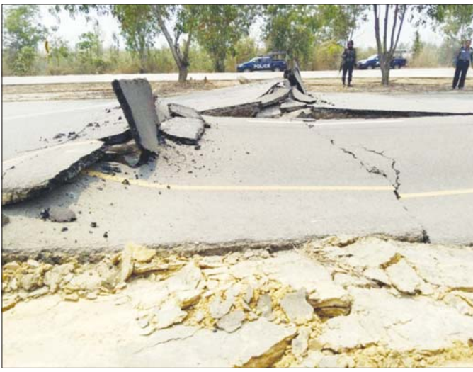
မတ် ၂၈ ရက်က လှုပ်ခတ်ခဲ့သည့် မန္တလေးမြေငလျင်ကြီးကြောင့် နေပြည်တော်၌ ပျက်စီးသွားသည့် လမ်းပိုင်း တစ်နေရာ။

ငလျင်သည် ကုန်းပေါ်တွင် မနေထိုင်သော တိရစ္ဆာန်များ (ဥပမာ - ဝေလငါးများ) အပေါ်တွင်ပါ သက်ရောက်မှုရှိပါသည်။ ငလျင်မှ ထွက်ပေါ်လာသော ရေအောက်အသံများသည် ကမ္ဘာပေါ်တွင် အကျယ်ဆုံး အသံများထဲမှ တစ်ခုဖြစ်သောကြောင့် ဝေလငါးများ တွင် အကြားအာရုံဆိုင်ရာ ပြဿနာများ၊ နေရပ် ပြောင်းရွှေ့ခြင်းနှင့် အပြုအမူပြောင်းလဲမှုများ ဖြစ်ပေါ်စေနိုင်ပါသည်။ ဝေလငါးများသည် အသံဖြင့် ဆက်သွယ်ခြင်း၊ သားကောင်ရှာဖွေခြင်းနှင့် လမ်းကြောင်းရှာခြင်းတို့အတွက် အကြားအာရုံကို မှီခိုအားထားရသောကြောင့် ဤအချက်သည် ၎င်းတို့ အတွက် ကြီးမားသော ခြိမ်းခြောက်မှုတစ်ရပ်ဖြစ် သည်။