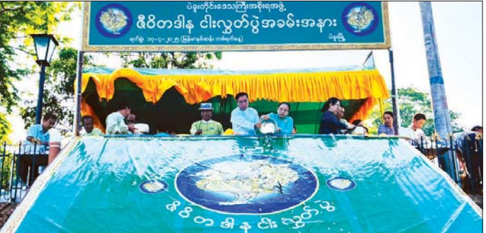
ယင်းနောက် တိုင်းဒေသကြီးဝန်ကြီးချုပ်နှင့်ဇနီး အမျိုး ပြုသော တက်ရောက်လာကြသူများက အဘိုးအဘွား များအား ကန်တော့ကြပြီး အလှူငွေနှင့် ကန်တော့ခံ ပစ္စည်းများကို ပေးအပ်သည်။ ယနေ့အခမ်းအနားတွင် ပဲခူးတိုင်းဒေသကြီး အစိုးရအဖွဲ့မှဦးဆောင်၍ ပဲခူးမြို့ပေါ် ရပ်ကွက်နှင့် သပြေကန်ဘိုးဘွားရိပ်သာမှ အဘိုးအဘွား ၆၀ အား ပူဇော်ကန်တော့ကြခြင်းဖြစ်ပြီး ကျန်းမာရေးစစ်ဆေး ပေးခြင်းများလည်း ဆောင်ရွက်ပေးခဲ့ကြောင်း သိရ သည်။ တိုင်းဒေသကြီး(ပြန်/ဆက်)

ပူဇော်ကန်တော့ခြင်း အခမ်းအနားကျင်းပရာ တိုင်း ဒေသကြီး ဝန်ကြီးချုပ် ဦးမျိုးဆွေဝင်းက နှစ်ဟောင်း မှ နှစ်သစ်ကို ကူးပြောင်းသည့် မြန်မာနှစ်ဆန်း တစ်ရက် နေ့သည် မြန်မာ့ယဉ်ကျေးမှုနယ်ပယ်တွင် မင်္ဂလာ ရှိပြီး လန်းဆန်းသစ်လွင်သည့် နေ့ထူးနေ့မြတ်ဖြစ်ကာ ယခုလိုနေ့ထူးနေ့ထူးမြတ်တွင် "ဂါရဝေါ နိပါတောစ" ဆိုသည့် မင်္ဂလာတရားတော်နှင့်အညီ ရိုသေသင့် ရိုသေထိုက်သူများ၊ ပူဇော်သင့် ပူဇော်ထိုက်သူများကို ပူဇော်ကန်တော့ရခြင်းဖြစ်ကြောင်း၊ နှစ်ဟောင်းမှ နှစ်သစ်သို့ ကူးပြောင်းသည့် နှစ်သစ်မင်္ဂလာ အခါ သမယတွင် သက်ကြီးဝါကြီး ဘိုးဘွားများနှင့်တကွ တိုင်းဒေသကြီးအတွင်းရှိ ပြည်သူများအားလုံး စိတ်သစ် လူသစ်၊ ခွန်အားသစ်များဖြင့် နိုင်ငံတော်နှင့် ဘာသာ၊ သာသနာအကျိုး၊ ပြည်သူ့အကျိုး၊ ဒေသ အကျိုးပြုလုပ်ငန်းများကို ဆတတ်ထမ်းစိုး ကြီးပွား တိုးတက်အောင် ထမ်းရွက်နိုင်ကြစေလိုကြောင်း မေတ္တာပို့ နှုတ်ခွန်းဆက်စကား ပြောကြားသည်။