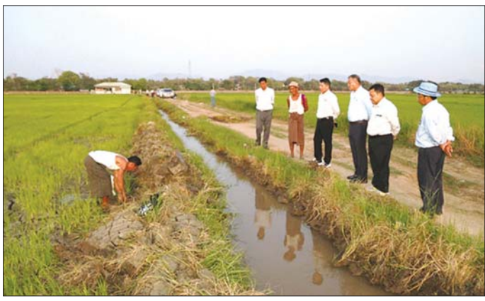
တာဝန်ရှိသူများနှင့်အတူ ယနေ့ညနေပိုင်းတွင် ဆင်သေရေလွှဲဆည် လက်ယာမြောင်းမကြီးမှ ရေများ လက်တံမြောင်းများတစ်လျှောက် စီးဝင်လာမှု၊ နွေစပါးစိုက်ခင်းများသို့ ရေစတင်ရောက်ရှိမှုအခြေအနေများကို ကွင်းဆင်းကြည့်ရှုစစ်ဆေးကြပြီး တောင်သူတစ်ဦးချင်း၏ လုပ်ငန်းခွင်တွင် လိုအပ်သည်များ မေးမြန်းဆောင်ရွက်ပေးခဲ့သည်။

မှာ ၅၅ ရာခိုင်နှုန်း ပြီးစီးပြီဖြစ်ကြောင်း၊ ဧပြီ ၂၃ ရက်တွင် လက်တံမြောင်းမကြီးနှင့် လက်တံမြောင်းများသို့ ရေပေးသွင်းနိုင်မည်ဖြစ်ကြောင်းသိရသည်။ ပြည်ထောင်စုဝန်ကြီး ဦးမင်းနောင်သည် ဒုတိယဝန်ကြီး ဦးစိုလ်ဗိုလ်ကျော်၊ တာဝန်ရှိသူများနှင့်အတူ ယနေ့ညနေပိုင်းတွင် ဆင်သေရေလွှဲဆည် လက်ယာမြောင်းမကြီးမှ ရေများ လက်တံမြောင်းများတစ်လျှောက် စီးဝင်လာမှု၊ နွေစပါးစိုက်ခင်းများသို့ ရေစတင်ရောက်ရှိမှုအခြေအနေများကို ကွင်းဆင်းကြည့်ရှုစစ်ဆေးကြပြီး တောင်သူတစ်ဦးချင်း၏ လုပ်ငန်းခွင်တွင် လိုအပ်သည်များ မေးမြန်းဆောင်ရွက်ပေးခဲ့သည်။ နံနက်ပိုင်းတွင်လည်း ဒုတိယဝန်ကြီး ဦးစိုလ်ဗိုလ်ကျော်သည် ဆင်သေရေလျှော်တံခံ၏ ရေဆင်းစနစ်ယာမှ ရေများကို ရေသွယ်မြောင်းတူးဖော်၍ လက်ယာမြောင်းမကြီးသို့ ရေပို့လွှတ်နေမှု၊ စက်ယန္တရားများဖြင့် ဆင်သေရေလွှဲဆည် (ဒဟတ်ကုန်းဆည်) ပြုပြင်ခြင်းလုပ်ငန်းဆောင်ရွက်နေမှုနှင့် လက်တံမြောင်းမကြီးသို့ ရေပေးသွင်းနိုင်ရေး စီမံဆောင်ရွက်နေမှု၊ လက်ယာမြောင်းမကြီးတစ်လျှောက် ရေစတင်ဝင်ရောက်နေမှုတို့ကို ကွင်းဆင်းကြည့်ရှုစစ်ဆေးသည်။