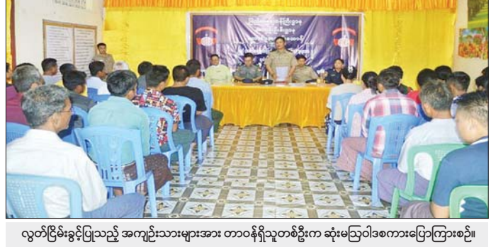
လွတ်ငြိမ်းခွင့်ပြုသည့် အကျဉ်းသားများအား တာဝန်ရှိသူတစ်ဦးက ဆုံးမဩဝါဒစကားပြောကြားစဉ်။

သက်ဆိုင်ရာ ဒေသရုံးခရိုင်/မြို့နယ်အုပ်ချုပ်ရေးမှူးများ၊ ခရိုင်/မြို့နယ်ရဲတပ်ဖွဲ့မှူးများ၊ သတင်းရဲတပ်ဖွဲ့၊ အထူးစစ်စစ်ဆေးရေးဦးစီးဌာနနှင့် လူဝင်မှုကြီးကြပ်ရေးနှင့်ပြည်သူ့အင်အားဆိုင်ရာရုံးတို့ ပါဝင်သောအဖွဲ့ဖြင့် ဆုံးမဩဝါဒစကားပြောကြား၍ ထောင်လွတ်လက်မှတ်ပေးပို့ခဲ့ကြောင်း သိရသည်။ လွတ်မြောက်သွားသူ ၄၉၀၆ ဦးအနက် ကချင်ပြည်နယ်မှ ၉၃ ဦး၊ ကယားပြည်နယ်မှ ကိုးဦး၊ ကရင်ပြည်နယ်မှ ၈၅ ဦး၊ စစ်ကိုင်း