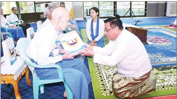
ဗိမာန်တော်ကြီး၌ ဆက်လက်ကျင်းပရာ တိုင်းဒေသ ကြီး ဝန်ကြီးချုပ်က အဘိုးအဘွားများအား ပူဇော် ကန်တော့ရခြင်းအကြောင်း အမှာစကားပြောကြား ပြီး ဖိတ်ကြားထားသော ဧည့်သည်တော်များက အဘိုးအဘွား ၃၅ ဦးအား ပူဇော်ကန်တော့ကြ သည်။(အပေါ်ပုံ)