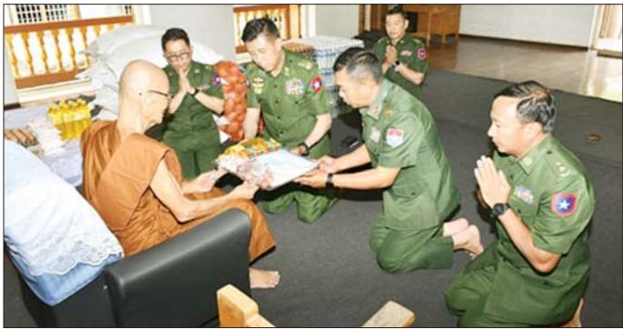
လှူဒါန်းကြသည်။ ထို့နောက်အဆို ကို အပျက်အစီးများ ဖယ်ရှား ဆောင်ရွက်နိုင်ရေး လိုအပ်သည်များ ပါ ကျောင်းတိုက်များရှိ ငလျင်ဒဏ် ရှင်းလင်းနေမှုများနှင့် ပြန်လည် ညှိနှိုင်းဆောင်ရွက်ပေးခဲ့ကြောင်း တည်ဆောက်ရေး လုပ်ငန်းများ သတင်းရရှိသည်။ သတင်းစဉ်

ထိုသို့ ဆောင်ရွက်ပေးလျက် ဖူးမြော်ကာ လှူဖွယ်ပစ္စည်းများ ဆက်ကပ် လှူဒါန်းကြသည်။ ချုပ်ရုံး(ကြည်း)မှ ဒုတိယဗိုလ်ချုပ်ကြီး ဖိုးတင်နိုင်နှင့် တာဝန်ရှိသူများသည် မန္တလေးမြို့ ချမ်းမြသာစည် ခြံနယ်ရှိ ငါးစို့ကျောင်းတိုက်နှင့် ပြည်ကြီးတံခွန်မြို့နယ်ရှိ မဟာချမ်းမြေအောင် ကျောင်းတိုက်များသို့ သွားရောက်၍ ကျောင်းတိုက်ဆရာတော်များအား ဖူးမြော်ကာ လှူဖွယ်ပစ္စည်းများ ဆက်ကပ်