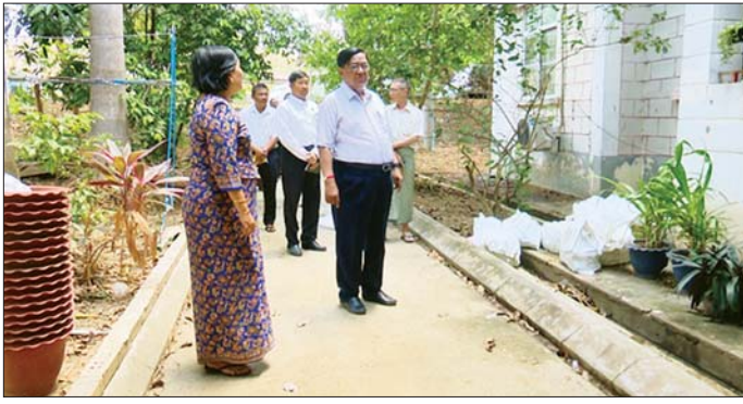
အစည်းအဝေး၌ နေပြည်တော်ရှိ ဝန်ထမ်းများ အမှိုးအကားအောက်တွင် ထားရှိနိုင်ရေးအတွက် ယာယီတံခံများ ထပ်မံဆောက်လုပ်နိုင်ရေး၊ ဝန်ကြီးဌာန

နေပြည်တော် ဧပြီ ၁၇ စက်မှုဝန်ကြီးဌာနမှ ဝန်ထမ်းများအား နေရာချထားရေး ညှိနှိုင်းအစည်းအဝေးကို ယနေ့ နံနက်ပိုင်းတွင် ခြံအမှတ် အေ-၅ ဌာနကွင်းပရာ ပြည်ထောင်စုဝန်ကြီးဒေါက်တာချာလီသန်း၊ ဒုတိယဝန်ကြီး ဦးရင်မောင်ညွန့်၊ ညွှန်ကြားရေးမှူးချုပ်များ၊ ဦးဆောင်ညွှန်ကြားရေးမှူးများ၊ အထွေထွေမန်နေဂျာများနှင့် တာဝန်ရှိသူများ တက်ရောက်ကြသည်။ အစည်းအဝေး၌ နေပြည်တော်ရှိ ဝန်ထမ်းများ အမှိုးအကားအောက်တွင် ထားရှိနိုင်ရေးအတွက် ယာယီတံခံများ ထပ်မံဆောက်လုပ်နိုင်ရေး၊ ဝန်ကြီးဌာန