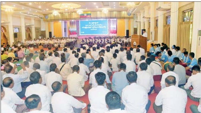
ပြုလုပ်နိုင်ကြပါစေကြောင်း ဆုတောင်းစကား ပြောကြားသည်။ ယင်းနောက် ရခိုင်ပြည်နယ်ဝန်ကြီးချုပ်နှင့်ဇနီးတို့က ဦးဆောင်ပြီး သက်ကြီးအဘိုး၊ အဘွားများအား လက်အုပ်ချိမ်း ဦးချပူဇော်ကန်တော့ကြပြီး ပြည်နယ်ဝန်ကြီးချုပ်နှင့်ဇနီး၊ ပြည်နယ်အစိုးရအဖွဲ့များက သက်ကြီးအဘိုး၊ အဘွားများအား မင်္ဂလာရေစင်ဖြင့် ဖက်ဖျန်းပူဇော်ကြသည်။

စစ်တွေ ဧပြီ ၁၇ (၆၁) ကြိမ်မြောက် စစ်တွေမြို့လုံးကျွတ် ရခိုင်ရိုးရာ သက်ကြီးပူဇော်ပွဲအခမ်းအနားကို ရခိုင်-မြန်မာ သက္ကရာဇ် ၁၃၈၇ ခုနှစ် မြန်မာနှစ်ဆန်းတစ်ရက် ယနေ့နံနက်ပိုင်းက စစ်တွေမြို့ ဦးဥက္ကဋ္ဌမခန်းမ၌ ကျင်းပသည်။ ဦးစွာ စစ်တွေမြို့ မြို့လုံးကျွတ်သက်ကြီးပူဇော်ပွဲအခမ်းအနားကို ရခိုင်ရိုးရာမင်္ဂလာစည်တော်တီး၍ ဖွင့်လှစ်ပြီး မြို့လုံးကျွတ်သက်ကြီးပူဇော်ပွဲကျင်းပ ရေးကော်မတီဝင် ဦးအောင်ကိုကိုက ဧကပိုင်ရတုဖြင့် ရွတ်ဆိုပူဇော်သည်။ ထို့နောက် ရခိုင်ပြည်နယ်ဝန်ကြီးချုပ် ဦးထိန်လင်းက နှစ်ဆန်းတစ်ရက်၏ အစောဆုံးနံနက်ချိန်ခါတွင် အပူဇော်ခံသက်ကြီးဘိုးဘွားများကို ပူဇော်ပွဲပြုလုပ်ပြီး ပူဇော်ခွင့်ရ၍ များစွာဝမ်းသာ ကြည်နူးရကြောင်း၊ သက်ကြီးပူဇော်ပွဲကျင်းပရေး ကော်မတီအနေဖြင့် လည်း ယနေ့(၆၁)နှစ်မြောက် သက်ကြီးပူဇော်ပွဲမှ သည့် နောင်အစဉ်အလာမပျက် နှစ်စဉ်နှစ်တိုင်း