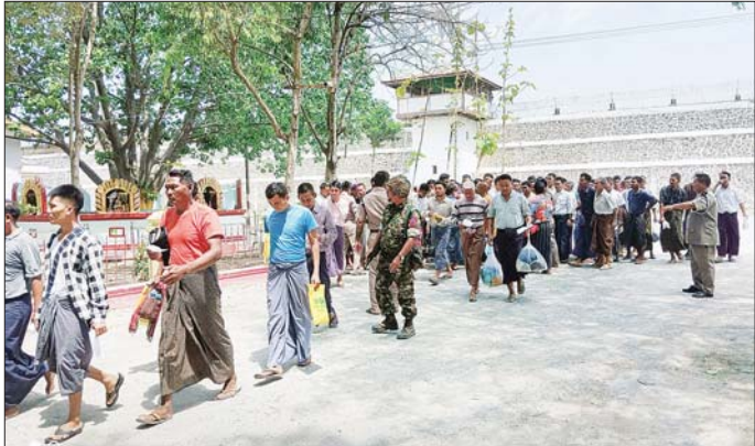
မန္တလေးဗဟိုအကျဉ်းထောင်မှ ပြစ်ဒဏ်လွတ်ငြိမ်းခွင့်ဖြင့် လွတ်မြောက်လာသည့် အကျဉ်းသားများကို

ယနေ့တွင် တိုင်းဒေသကြီးနှင့် ပြည်နယ်အသီးသီးရှိ အကျဉ်းထောင်၊ အချုပ်ထောင်၊ စခန်းအသီးသီးမှ အကျဉ်းကျခံနေကြသော အကျဉ်းသား အကျဉ်းသူ ၄၈၉၃ ဦးနှင့် နိုင်ငံခြားသား အကျဉ်းသား အကျဉ်းသူ ၁၃ ဦး တို့ကို ရာဇဝတ်ကျင့်ထုံးဥပဒေပုဒ်မ ၄၀၁ ပုဒ်မခွဲ (၁) အရ “နောက်တစ်ကြိမ် ပြစ်မှုထပ်မံကျူးလွန်ပါက ၎င်းပြစ်ဒဏ်အပြင် ယခုကျခံရန်ကျန်ရှိသော ပြစ်ဒဏ်များကိုပါ ဆက်လက်ကျခံပါမည်” ဟူသော စည်းကမ်းသတ်မှတ်ချက်ဖြင့် ယင်းတို့ကျခံရန် ကျန်ရှိသော ပြစ်ဒဏ်များအပေါ် လျှော့ပေါ့၍ စာမျက်နှာ ၁၄ ကော်လံ ၁ ♦