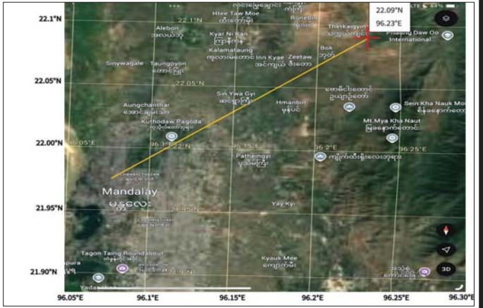
မိုးလေဝသနှင့်ဇလဗေဒဌာနကြားမှ ဦးစီးဌာနမှ သတင်းထုတ်ပြန်ထားသော မန္တလေးငလျင်ဗဟိုချက်ပြပုံ

၂၀၂၅ ခုနှစ် မတ် ၂၈ ရက်တွင် လှုပ်ခတ်ခဲ့သော ငလျင်ဗဟိုချက်အား မိုးလေဝသနှင့်ဇလဗေဒဌာနကြားမှ ဦးစီးဌာနသည် နော်ဝေနိုင်ငံမှ ရေးဆွဲထားသော SeisAn Software ဖြင့် တွက်ချက်ထားပုံ