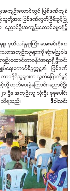
ညောင်ဦးအကျဉ်းထောင်တွင် ပြစ်ဒဏ်လွတ်ငြိမ်းခွင့်ရ အကျဉ်းသားအကျဉ်းသူများကို ဆုံးမဩဝါဒစကားပြောကြားစဉ်။

ညောင်ဦး ဧပြီ ၁၇ မန္တလေးတိုင်းဒေသကြီး ညောင်ဦးအကျဉ်းထောင်တွင် ပြစ်ဒဏ်ကျခံလျက်ရှိသည့် အကျဉ်းသား အကျဉ်းသူတို့အား ပြစ်ဒဏ်လွတ်ငြိမ်းခွင့်ပြုခြင်းကို ယနေ့ နံနက် ၁၁ နာရီက ညောင်ဦးအကျဉ်းထောင်ဓမ္မာရုံ၌ ပြုလုပ်သည်။ ဦးစွာ ညောင်ဦးခရိုင်ရဲတပ်ဖွဲ့မှူး ဒုတိယရဲမှူးကြီး အေးမင်းစိုးက အပြစ်ဒဏ်လွတ်ငြိမ်းခွင့်ရ အကျဉ်းသားအကျဉ်းသူများကို ဆုံးမဩဝါဒစကားပြောကြားပြီး ညောင်ဦး အကျဉ်းထောင်တာဝန်ခံအရာရှိ ဦးဝင်းဇော်မင်းက နိုင်ငံတော်စီမံအုပ်ချုပ်ရေးကောင်စီဥက္ကဋ္ဌ၏ ပြစ်ဒဏ်လွတ်ငြိမ်းခွင့်အမိန့်ဖတ်ကြားကာ တာဝန်ရှိသူများက လွတ်မြောက်ခွင့်ရရှိသူများကို ခရီးစရိတ်နှင့်စားခွင့်တို့ ထုတ်ပေးခဲ့ကြောင်း၊ ညောင်ဦးအကျဉ်းထောင်မှ အကျဉ်းသား ၂၁ ဦး၊ အကျဉ်းသူ သုံးဦး စုစုပေါင်း ၂၄ ဦး လွတ်ငြိမ်းခွင့်ပြုခဲ့ကြောင်း သိရသည်။ ဒီပါလင်း