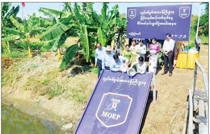
မိုးခိုမိသားစုများအား နေရာချထား တာဝန်ရှိသူများကို ကြည့်ရှု၍ ကြောင်း သတင်းရရှိသည်။ မှုအခြေအနေတို့ကို လှည့်လည် လိုအပ်သည်များ မှာကြားခဲ့ သတင်းစဉ်

နေပြည်တော် ဧပြီ ၁၇ လျှပ်စစ်စွမ်းအား ဝန်ကြီးဌာန မြန်မာနှစ်ဆန်း တစ်ရက်နေ့ ဇီဝိတဒါန ငါးလွှတ်ခြင်း၊ ငှက်လွှတ်ခြင်းနှင့် စတုဒိသာကျွေးမွေးခြင်းအခမ်းအနားကို ယနေ့ နံနက်ပိုင်းတွင် နေပြည်တော်ကောင်စီ နယ်မြေ ဥက္ကဋ္ဌရသီရိမြို့နယ်ရှိ လျှပ်စစ်စွမ်းအား ဝန်ကြီးဌာန နေပြည်တော် ဗဟိုသင်တန်းကျောင်း၌ ကျင်းပသည်။ ဦးစွာ ပြည်ထောင်စုဝန်ကြီး ဦးညွှန်ထွန်းနှင့် ဇနီး၊ ဒုတိယဝန်ကြီး ဦးအေးကျော်နှင့် ဇနီး၊ ပြည်ထောင်စုဝန်ကြီးရုံး၊ ဦးစီးဌာနနှင့် လုပ်ငန်းများမှ ညွှန်ကြားရေးမှူးချုပ်များ၊ ဦးဆောင်ညွှန်ကြားရေးမှူးများနှင့် ၎င်းတို့၏ ဇနီးများ၊ အရာထမ်း၊ အမှုထမ်းများက မြန်မာနှစ်ဆန်းတစ်ရက်နေ့ ဇီဝိတဒါနအဖြစ် ငါးမြစ်ချင်း ငါးသားပေါက်များနှင့် ငှက်များအား ကုသိုလ်မင်္ဂလာပြု၍ စုပေါင်းဘေးမဲ့လွတ်ခဲ့ကြသည်။ ထို့နောက် ပြည်ထောင်စုဝန်ကြီးနှင့် ဇနီး၊ ဒုတိယဝန်ကြီးနှင့် ဇနီးနှင့် တာဝန်ရှိသူများသည် နေပြည်တော် ဗဟိုသင်တန်းကျောင်းစားရိပ်သာ၌ ပြည်ထောင်စုဝန်ကြီး ဦးညွှန်ထွန်းနှင့် ဇနီး မိသားစုတို့က မြန်မာနှစ်ဆန်းတစ်ရက်နေ့ စတုဒိသာအဖြစ် လှူဒါန်းသည့် ရွှေရောင်အေးနှင့် နံနက်စာ၊ အလှူရှင်များက လာရောက်လှူဒါန်းသည့် ငါးပိကြော်ဘူးနှင့် ချဉ်ပေါင်ရွက်