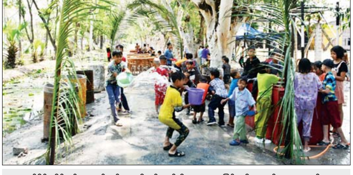
အလယ်ပိုင်းတိုင်းစစ်ဌာနချုပ်တွင် အရာရှိ စစ်သည်၊ မိသားစုများ မြန်မာ့ရိုးရာယဉ်ကျေးမှု အစဉ်အလာနှင့်အညီ မြန်မာ့ရိုးရာအတောသင်္ကြန်ကို ဆင်နွှဲစဉ်။