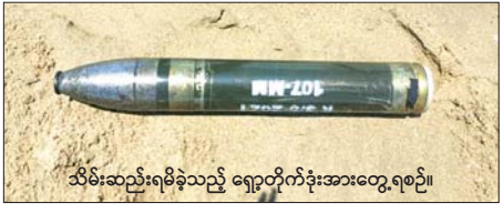
သိမ်းဆည်းရမိခဲ့သည့် ရှော့တိုက်ခွဲအား တွေ့ရစဉ်။

နေပြည်တော် ဧပြီ ၁၆ PDF အမည်ခံ အကြမ်းဖက်သမားများသည် မြန်မာ့ရိုးရာယဉ်ကျေးမှု မဟာသင်္ကြန်ပွဲတော်အား အေးချမ်းပျော်ရွှင်စွာ ဆင်နွှဲနေသည်ကို မနာလိုမရွံ့ဆိတ် ဖြစ်ခြင်းနှင့် ပြည်သူများ တည်ငြိမ်အေးချမ်းမှု ပျက်ပြား၍ အထိတ်တလန့်ဖြစ်စေရန် ရန်ရွယ်၍ လူနေ မြို့၊ ရွာ၊ ရပ်ကွက်များအတွင်းသို့ ရှော့တိုက်ခွဲပစ်ခတ်ရန် တပ်ဆင်ထားမှုများကို လုပ်ဆောင်လျက်ရှိသည်။ ထိုသို့လုပ်ဆောင်လျက်ရှိရာ စစ်ကိုင်းတိုင်းဒေသကြီး မုံရွာမြို့