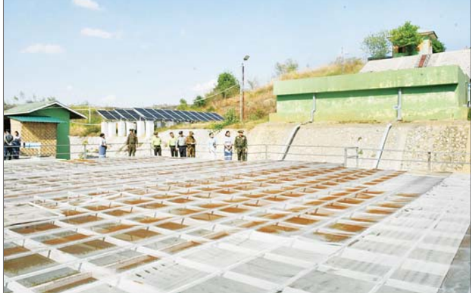
ကာကွယ်ရေးဦးစီးချုပ်ရုံး(ကြည်း)မှ ဒုတိယဗိုလ်ချုပ်ကြီး သက်ပုံနှင့် တာဝန်ရှိသူများ စစ်ကိုင်းမြို့ ရေပေးရေးဆောင်ရွက်နေမှုများကို ကွင်းဆင်းစစ်ဆေးစဉ်။

များ ပေါင်းစပ်ညှိနှိုင်းဆောင်ရွက်ပေးသည်။ ဆက်လက်၍ ဒုတိယဗိုလ်ချုပ်ကြီးနှင့် တာဝန်ရှိသူများသည် စစ်ကိုင်းမြို့၊ ပိုးတန်းရပ်ကွက်၊ တကောင်းရပ်ကွက်နှင့် ပတ္တမြားရပ်ကွက်တို့ရှိ မြို့ရေပေးဝေရေးစက်ရုံများနှင့် မြစ်ရေတင်စက်တို့အား လည်းကောင်း၊ မင်းလမ်းရပ်ကွက်၊ ဧရာဝတီရပ်ကွက်၊ ပတ္တမြားရပ်ကွက်တို့ရှိ လျှပ်စစ်ဓာတ်အား ဖြန့်ဖြူး