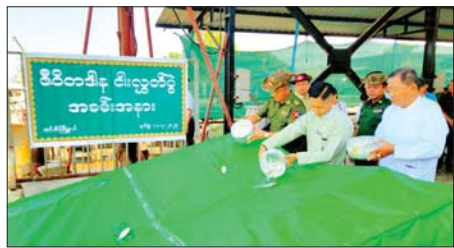
လွန်မြို့နယ်၌ သစ်စိမ်းမြေဩဇာ မျိုးစေ့ပေးအပ်ပွဲနှင့် စုပေါင်းကြပွဲပြုလုပ်

ရန်ကုန် ဧပြီ ၁၆ ရန်ကုန်တိုင်းဒေသကြီး အင်းစိန်မြို့နယ်အတွင်း သဘာဝဘေးအန္တရာယ်များကင်းရှင်းစေရန်ရည်ရွယ်၍ ဇီဝိတဒါနငါးလွှတ်ပွဲအခမ်းအနားကို ဧပြီ ၁၁ ရက်က ကြို့ကုန်းအနောက်ရပ်ကွက် ငါးလုပ်ငန်းဦးစီးဌာန ဆိပ်ကမ်းသစ်ဆိပ်ကမ်း အမှတ်(၄)ရှိ မျိုးသီဟပြည့်စုံကုန်တင်ကုန်ချဆိပ်ကမ်း၌ ပြုလုပ်သည်။