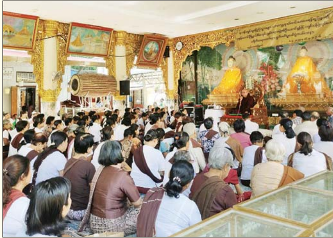
ရန်ကုန်တိုင်းဒေသကြီး ပုဇွန်တောင်မြို့နယ်ရှိ သမိုင်းဝင် ရွှေဘုန်းပွင့်စေတီတော်မြတ်ကြီး ပရိဝုဏ်၌ မဟာသင်္ကြန်အတက်နေ့တွင် ဥပုသ်သီလဆောက်တည်သူများအား တွေ့ရစဉ်။ ဟန်စုယဉ်