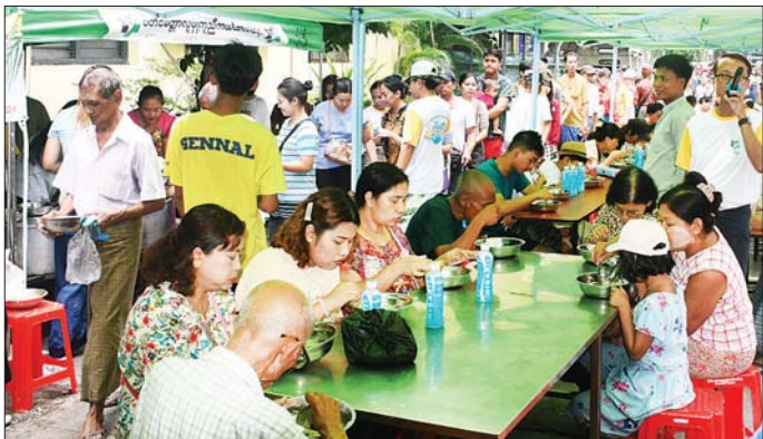
မဟာသင်္ကြန်အတက်နေ့တွင် ပုဇွန်တောင်မြို့နယ် ဗိုလ်ချုပ်လမ်းနှင့် (၅၁)လမ်းထောင် ပီတိမေတ္တာလူမှုကူညီကယ်ဆယ်ရေးအသင်းနှင့် ခုနစ်ရက်သားသမီးအလှူရှင်များက စတုဒါနကျွေးမွေးလှူဒါန်းစဉ်။