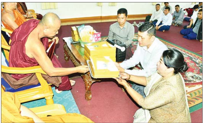
အရှေ့ပိုင်းတိုင်းစစ်ဌာနချုပ် တိုင်းမှူး၊ ဗိုလ်ချုပ် ဇော်မင်းလတ်နှင့် တာဝန်ရှိသူများက မင်္ဂလာဂီတပညာစာသင်တိုက်ရှိ ဆရာတော်သံဃာတော်များအား လှူဖွယ်ပစ္စည်းများ ဆက်ကပ်လှူဒါန်းစဉ်။

ထိုသို့ မြန်မာ့ရိုးရာ နှစ်သစ်ကူးအတောသင်္ကြန် ကျင်းပချိန်တွင် ပါဝင်ဆင်နွှဲကြသူများကို မြန်မာ့သတင်းစဉ်