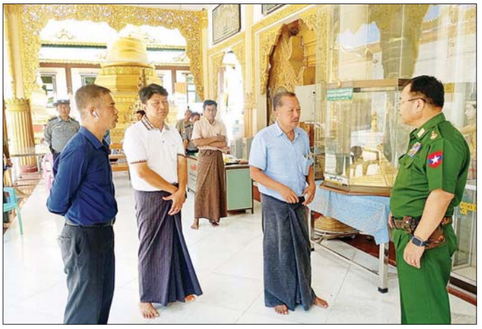
ကာကွယ်ရေးဦးစီးချုပ်ရုံး(ကြည်း)မှ ဒုတိယဗိုလ်ချုပ်ကြီး မျိုးသန့်နိုင် ကျောက်သေတ္တာကြီး ကြံ့ခိုင်တည်မြဲစေရေးအတွက် ဆောင်ရွက်သည့် နည်းပညာအစီအမံများ၊ လုပ်ဆောင်ရမည့် လုပ်ငန်းစဉ်များအား တာဝန်ရှိသူများ၊ ဂေါ်ကအဖွဲ့ဝင်များ၊ မြို့မိမြို့ဖများနှင့် ညှိနှိုင်းဆွေးနွေးစဉ်။

ရေးလုပ်ငန်းများအားလည်းကောင်း သွားရောက် ညှိနှိုင်းဆောင်ရွက်ပေးသည်။ ကြည့်ရှုစစ်ဆေးပြီး လိုအပ်သည်များကို တာဝန်ရှိသူများနှင့် ပေါင်းစပ်ညှိနှိုင်း ဆောင်ရွက်ပေးသည်။ ထို့နောက် ရွှေသာလျောင်းတောင်ပေါ်ရှိကျောက်သေတ္တာစေတီ အခြေအနေကို ဒရုန်းဖြင့် ပတ်ပတ်လည် ရိုက်ကူးကြည့်ရှု၍ အသေးစိတ် အခြေအနေများအား မှတ်တမ်းတင်ခဲ့ပြီး ကျောက်သေတ္တာကြီး ကြံ့ခိုင်တည်မြဲစေရေးအတွက် ဆောင်ရွက်သည့် နည်းပညာအစီအမံများ၊ လုပ်ဆောင်ရမည့် လုပ်ငန်းစဉ်များအား တာဝန်ရှိသူများ၊ ဂေါ်ကအဖွဲ့ဝင်များ၊ မြို့မိမြို့ဖများနှင့် ညှိနှိုင်းဆွေးနွေးခဲ့ပြီး လိုအပ်သည်များ ပေါင်းစပ်ညှိနှိုင်း ဆောင်ရွက်ပေးခဲ့ကြောင်း သတင်းရရှိသည်။ သတင်းစဉ်