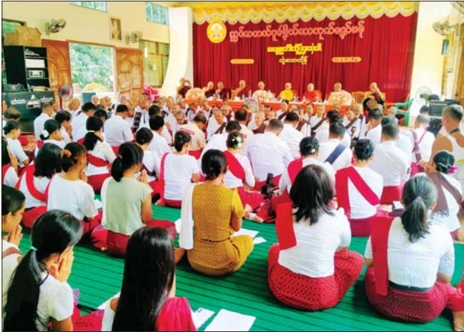
မွန်ပြည်နယ် ပေါင်မြို့နယ်၌ မဟာသင်္ကြန်အတက်နေ့တွင် အကြိမ် (၄၀)မြောက် သက်ကြီးပူဇော်ကန်တော့ပွဲ ကျင်းပပြုလုပ်စဉ်။ မွန်မလေး(ပြန်/ဆက်)