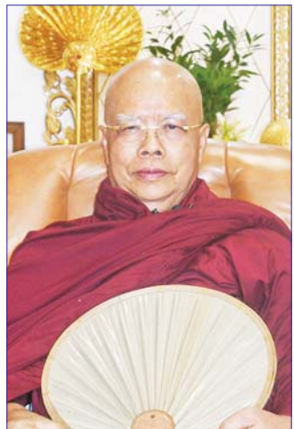
ကောင်းတွေက စိတ်ထားကောင်း လုပ်ရပ်ကောင်း တော့ အကျိုးပေးတွေလည်း ကောင်းတာပေါ့။ အကျိုးပေးက မိမိတစ်ယောက်တည်း ကောင်းကျိုး ချမ်းသာရရှိမကပဲ ဆွေမျိုးသားချင်းအကျိုး၊ ကိုယ့်ရုပ်ကိုယ်ရုံ ကိုယ့်မြို့ ကိုယ့်နိုင်ငံ ကိုယ့်သာသနာ အကျိုးတွေ ရရှိတော့တာပေါ့။ ကိုယ့်ပတ်ဝန်းကျင် ကိုယ့်လောကကြီးတစ်ခုလုံးကို ကိုယ်က စိတ်ဓာတ် ကောင်းနဲ့ ဒီစကားကြီးသုံးခွန်းကို အားရပါးရ ကြွေးကြော်ဆောင်ရွက်နေရင်း အားလုံးအတွက် ကောင်းကျိုးဆောင်ရွက်နိုင်မှာ ဖြစ်ပါတယ်။ နှစ်သစ်ကူးအခါမှာ စွမ်းနိုင်သမျှ မိမိအကျိုး အများ အကျိုးသယ်ပိုးကြဖို့အတွက် စကားလက်ဆောင် တရားလက်ဆောင် နှစ်သစ်ကူး လက်ဆောင် ပေးပါ တယ်။ အားလုံး အားလုံးက စိတ်ဓာတ်ကောင်းတွေ ကိုယ်စိတ်ကိုင်ရှိကြပြီး မိမိအကျိုး အများအကျိုး သယ်ပိုးနိုင်တဲ့ သူတော်ကောင်းတွေ ဖြစ်ကြပါစေ ကုန်သတည်း။

သူတော်ကောင်းဆိုရင် သူတော်ကောင်းတွေ မလုပ်သင့် မလုပ်ထိုက်တာ မလုပ်ဘူး၊ ငါ့နဲ့ မဆိုင် တာမလုပ်ဘူး။ လုပ်သင့်လုပ်ထိုက်တာကိုပဲ လုပ်မယ် လို့ တွေးပျော်တော့တာပဲ။ ငါ သူတော်ကောင်းနဲ့ မဆိုင်တာ အကျိုးမရှိတာမလုပ်ဘူး။ အကျိုးရှိတဲ့ အလုပ်ပဲလုပ်မယ်။ သူတော်ကောင်းတွေက ငါ့ကိုယ် ငါသူတော်ကောင်းလို့ သိမှတ်ထားရင် သူတော် ကောင်းတစ်ယောက်ရဲ့ မလုပ်သင့် မလုပ်ထိုက်တာ မလုပ်နဲ့၊ လုပ်သင့်လုပ်ထိုက်တာလုပ်။ ကိုယ့်ကိုယ် ကိုယ် သူတော်ကောင်းလို့ သတိမှတ်ရင် ဘယ်သူ့ အပေါ်မှာမှ မေတ္တာမပျက်ဘူး။ စိတ်မဆိုးဘူး။ ဘယ်သူ့ကိုမှ မနိမ့်ချဘူး။ ကရုဏာထားတယ်။ မနာလုံမဖြစ်ဘူး။ မုဒိတာပေါ့။ ဘယ်သူ့အပေါ်မှ မျက်ကွယ်မပြုဘူး။ တတ်နိုင်သမျှ စွမ်းနိုင်သမျှ ကူညီတယ်။ အကျိုးပေးဆိုတာက စိတ်ပေါ့မူတည် တာပဲ။ သူတော်ကောင်းက ကိုယ့်ကိုယ်ကိုယ်သူတော် ကောင်းဆိုတာသိသွားပြီး သူတော်ကောင်း မလုပ် သင့်မလုပ်ထိုက်တာ မလုပ်ဘူး။ လုပ်သင့်လုပ်ထိုက် တာလုပ်မယ်ဆိုတာ သိတဲ့အသိစိတ်နဲ့ လုပ်ဖြစ်တာ ကြီးပွားတိုးတက် အောင်မြင်တော့တာပေါ့။ သူတော်