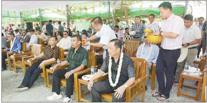
တိုင်းဒေသကြီးနှင့် ပြည်နယ်များမှ ဝန်ကြီးချုပ်များ၊ တိုင်းစစ်ဌာနချုပ်များအလိုက် တိုင်းမှူးများ မြန်မာ့ရိုးရာအစဉ်အလာများနှင့်အညီ သပြေခက်များဖြင့် အတောသင်္ကြန်ရေကို ပက်ဖျန်းပေးစဉ်။