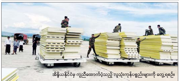
အိန္ဒိယနိုင်ငံမှ ကူညီထောက်ပံ့သည့် လူသုံးကုန်ပစ္စည်းများကို တွေ့ရစဉ်။

အနေများကို ကြည့်ရှုစစ်ဆေး အား အတတ်နိုင်ဆုံး ပြည့်ဆည်းပြီး(အပေါ်ပို)တာဝန်ရှိသူများအား ဆောင်ရွက်ပေးရေး၊ လုပ်ငန်းများကို ဆောလျင်စွာ ပြီးစီးအောင် ဆောင်ရွက်ကြရေး၊ တာဝန်ရှိသူများအား မှာကြားခဲ့ကြောင်း သတင်းရရှိသည်။ သတင်းစဉ်