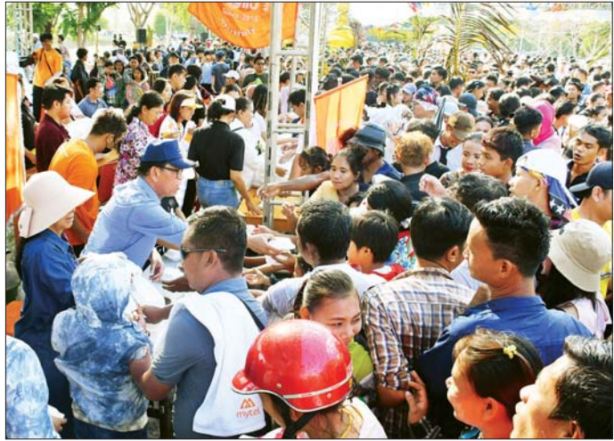
ပြန်ကြားရေးဝန်ကြီးဌာန ပြည်ထောင်စုဝန်ကြီး ဦးမောင်မောင်အုန်းနှင့် ဇနီး မိသားစုက စတုဒိသာမုန့်မျိုးစုံ လှူဒါန်းကြစဉ်။

နှင့် မင်္ဂလာရပ်ရှင်ရုံအုပ်စုတို့မှ အလှူရှင်များကလည်း စတုဒိသာ မုန့်မျိုးစုံတို့ကို နေ့ရက်အလိုက် ပါဝင်လှူဒါန်းခဲ့ကြသည့်အတွက် နေပြည်တော်အေးသင်္ကြန်ပွဲတော် သို့ ပါဝင်ဆင်နွှဲခဲ့ကြသည့် ပြည်သူ အားလုံးအတွက် လုံလောက်သည့် အပြင် ပိုလျှံစွာသုံးဆောင်နိုင်ခဲ့ကြ ကြောင်း သိရသည်။ ထိုသို့ မြန်မာ့ရိုးရာယဉ်ကျေး မှု အစဉ်အလာများနှင့်အညီ ယဉ်ကျေးသိမ်မွေ့စွာ ကျင်းပ လျက်ရှိသည့် ယခုနှစ် အေးသင်္ကြန် ကာလအတွင်း နေပြည်တော် ကောင်စီနယ်မြေ အတွင်းရှိ ပြည်သူများသည် တစ်ဦးနှင့် တစ်ဦး ညီရင်းအစ်ကို မောင်ရင်း နှစ်မာယွမ်း ရေပက်ဖျန်းကစားခဲ့ ကြပြီး နှစ်ဟောင်းမှ တွေ့ဆုံ