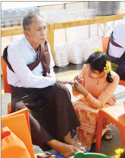
ပြည်ထောင်စုနယ်မြေ နေပြည်တော်၌ သက်ကြီးအဘိုးတစ်ဦးအား လက်သည်းညှပ်ပေးခြင်း ကုသိုလ်ပြု ဆောင်ရွက်ပေးနေစဉ်။