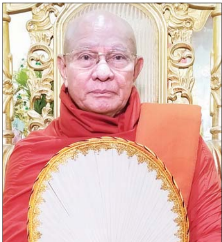
တွေက ဆက်နေတယ်။ ခန္ဓာကိုယ်ထဲမှာလောဘ၊ ဒေါသ၊ မောဟ၊ မာန၊ ဒိဋ္ဌိဆိုတဲ့ ကိလေသာမီးတွေက စက္ကန့်မလပ် လူသားတွေရဲ့ အတွင်း ဓာတ်တွေမှာ လောင်ကျွမ်းနေတယ်။ အတွင်းမှာရှိတဲ့ ဓာတ်ကြီး လေးပါး ကိလေသာမီးတွေ လောင်ကျွမ်းမှုကြောင့် အတွင်းဓာတ်တွေ

လူ့ရယ်လို့ဖြစ်လာရင် မိမိရဲ့ခန္ဓာကိုယ်ထဲ ပထဝီ၊ တေဇော၊ ဝါရော၊ အာဘောဆိုတဲ့ ဓာတ်တွေ တည်ဆောက်ထားတယ်။ အဲဒီဓာတ် တွေပျက်စီးရင် ဒုက္ခရောက်ကြတယ်။ အတွင်းဓာတ်နဲ့ အပြင်ဓာတ်