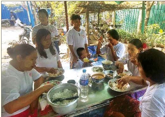
မန္တလေးတိုင်းဒေသကြီး ကျောက်ဆည်မြို့၌ မဟာသင်္ကြန်အတက်နေ့တွင် နှစ်သစ်ကူးစတုဒိသာကျွေးမွေးကုသိုလ်ပြုဆောင်ရွက်နေမှုကို တွေ့ရစဉ်။