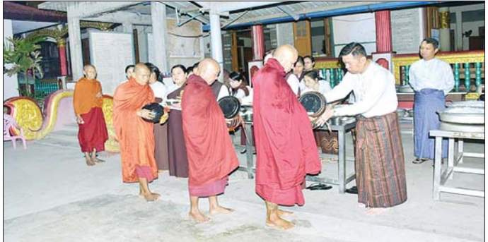
တောင်ပိုင်းတိုင်းစစ်ဌာနချုပ် တိုင်းမှူး၊ ဗိုလ်ချုပ် ကြည်သိုက်နှင့် တပ်ရင်း၊ တပ်ဖွဲ့၊ များများနှင့် မိသားစုဝင်များက အရှေ့ဆွမ်း ဆက်ကပ်လောင်းလှူကြစဉ်။