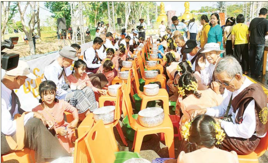
မဟာသင်္ကြန်အတက်နေ့တွင် ပြည်ထောင်စုနယ်မြေ နေပြည်တော်၌ သက်ကြီးဘိုးဘွားများအား မြေသည်း လက်သည်း ညှပ်ပေးခြင်း ကုသိုလ်ပြုဆောင်ရွက်ပေးနေစဉ်။ သတင်းစဉ်