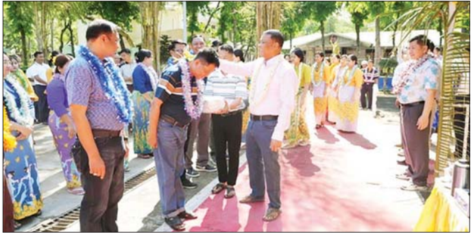
အနောက်မြောက်တိုင်းစစ်ဌာနချုပ်၏ နှစ်သစ်ကူးမြန်မာ့ရိုးရာ မဟာသင်္ကြန် အတက်နေ့၌ မြန်မာ့ရိုးရာအစဉ်အလာနှင့်အညီ တိုင်းမှူး၊ ဗိုလ်မှူးချုပ် မျိုးမင်းထွေးနှင့်အဖွဲ့ဝင်များက ရေလောင်းနေစဉ်။