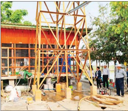
ထိုနေ့က ပြည်နယ်ဦးစီးမှူးက ကျေးရွာများရှိ တာဝန်ရှိသူ များနှင့် တွေ့ဆုံကာ ငလျင်လှုပ်မှုကြောင့် ထိခိုက်ပျက်စီးမှုများ ဖြစ်ပေါ် ခဲ့သည့် အခြေအနေများကို ကြည့်ရှုစစ်ဆေး၍ ပြန်လည်ထူထောင်ရေး လုပ်ငန်းများ ဆောင်ရွက်ပေးရန်နှင့် ဆက်လက်ဆောင်ရွက်ရမည့် အစီအစဉ်များ၊ နည်းလမ်းများကို ဆွေးနွေးညှိနှိုင်း ဖွဲ့စည်းခဲ့သည်။ မောင်ခိုင်

ညောင်ရွှေ ဧပြီ ၁၆ ရှမ်းပြည်နယ်(တောင်ပိုင်း) ညောင်ရွှေမြို့နယ် ကျေးလက်ဒေသဖွံ့ဖြိုး တိုးတက်ရေးဦးစီးဌာနမှ မြို့နယ်အတွင်း မန္တလေးမြေငလျင်ကြီးလှုပ် မှုကြောင့် ထိခိုက်ပျက်စီးမှုများဖြစ်ပေါ်ခဲ့ရသည့် ညောင်ရွှေမြို့နယ် အတွင်းရှိ ကျေးရွာ ၁၈ ရွာ၌ သန့်ရှင်းသော သောက်သုံးရေများ ဖူလုံစွာ ရရှိစေရန်အတွက် စက်ရေတွင်းတူးဖော်ခြင်း၊ ရေသန့်စင်စက်အသစ် တပ်ဆင်ခြင်း၊ ပြုပြင်ခြင်း၊ ရေပိုက်သွယ်တန်းခြင်းလုပ်ငန်းနှင့် ရေတိုင်ကီ ထောက်ပံ့ခြင်းလုပ်ငန်းများ ဆောင်ရွက်ပြီးစီးမှုအခြေအနေ များကို ဧပြီ ၁၁ ရက်က ပြည်နယ်ဦးစီးမှူးနှင့် တာဝန်ရှိသူများက ကွင်းဆင်းစစ်ဆေးခဲ့သည်။