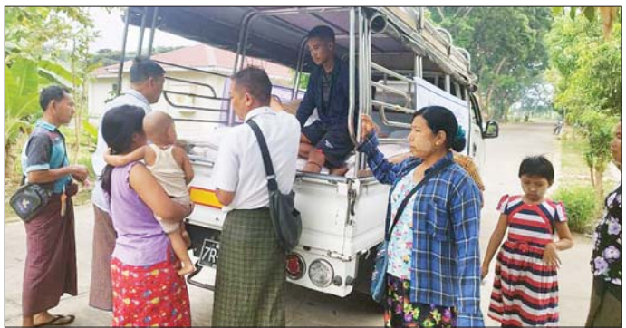
လေးစီးဖြင့် ရောင်းချပေးလျက်ရှိရာ ယနေ့အထိ ဆန် ၂၄ ပြည်ဆုံ (ရွှေပင်လှ) ၂၃၄ အိတ်၊ စားအုန်းဆီ ဝိဿာ ၃၀၈၀၀ ၊ ကြက်ဥအလုံး ၄၃၆၀ ၊ ကြက်သွန်နီ ဝိဿာ ၄၅၀ ၊ အသားတူ ၁၅ ဝိဿာတို့ကို သက်သာသောဈေးနှုန်းများဖြင့် ရောင်းချပေးခဲ့ပြီး ရေသန့်များကိုလည်း အခမဲ့ဖြန့်ဝေပေးခဲ့ကြောင်းနှင့် နေ့စဉ် ဆက်လက်ရောင်းချပေးမည်ဖြစ်ကြောင်း သတင်းရရှိသည်။

အိမ်ရာ၊ နေသိဒ္ဓိရပ်ကွက်အိမ်ရာ၊ ဗလသိဒ္ဓိရပ်ကွက်အိမ်ရာ၊ ဥက္ကဋ္ဌရည်ကွက်အိမ်ရာ၊ သုခသိဒ္ဓိရပ်ကွက်အိမ်ရာ၊ ဝဏ္ဏသိဒ္ဓိရပ်ကွက်အိမ်ရာ၊ ပညာရေးဝန်ထမ်းအိမ်ရာ၊ နေပြည်တော်ကောင်စီ ဝန်ထမ်းအိမ်ရာရှိ ဝန်ထမ်းများအား ဆန်ခြောက်ပြည်ဆုံ (မနေ့သုခ-Export Quality) ၈၈၆၅ အိတ်၊ ဆန်ငါးပြည်ဆုံ (ဖျာပုံပေါ်ဆန်) အိတ် ၁၉၈၀ ၊ ဆီ ဝိဿာ ၂၁၂၉၀ ၊ ဆား ၅၀ ကျပ်သားပါအိတ် ၁၇၀၀၊ ဆား ၂၅ ကျပ်သားပါအိတ် ၃၈၂၀ အိတ်၊ ငါးပိ ၂၀ ကျပ်သားပါအိတ် ၄၆၂၀၊ ခေါက်ဆွဲခြောက်အထုပ်များကို ရောင်းချပေးခဲ့ကြောင်းနှင့် နေ့စဉ်ဆက်လက်ရောင်းချပေးမည်ဖြစ်သည်။ အလားတူ မန္တလေးမြို့တွင် ဈေးကားလေးစီးဖြင့် လှည့်လည်ရောင်းချပေးလျက်ရှိရာ ယနေ့အထိ ဆန် ၂၄ ပြည်ဆုံ (မနေ့သုခ) ၄၂၄ အိတ်၊ စားအုန်းဆီ ဝိဿာ ၃၀၈၀၀၊ ခေါက်ဆွဲခြောက်အထုပ်များကို ရောင်းချပေးခဲ့ကြောင်းနှင့် စစ်ကိုင်းမြို့တွင် ဈေးကား