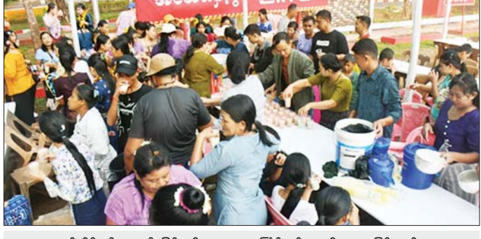
အရှေ့တောင်တိုင်းစစ်ဌာနချုပ် မြန်မာ့ရိုးရာအတောသင်္ကြန်တွင် စတုဒိသာများဖြင့် ဧည့်ခံကျွေးမွေးနေစဉ်။