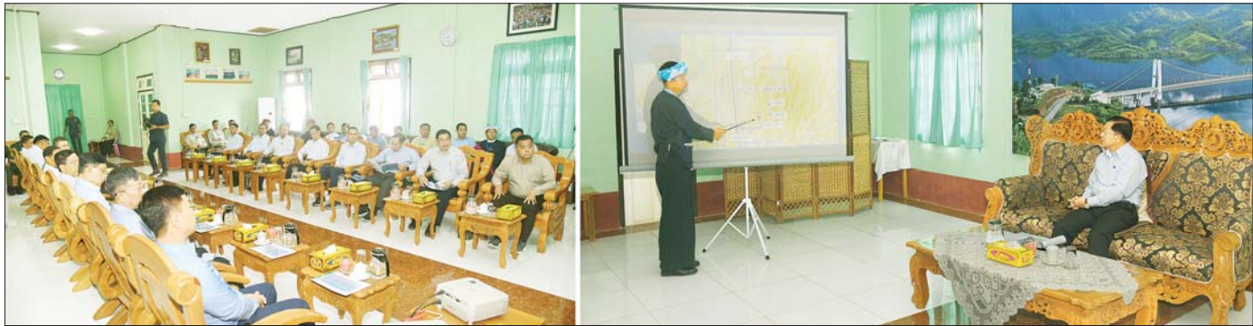
နိုင်ငံတော်စီမံအုပ်ချုပ်ရေးကောင်စီဥက္ကဋ္ဌ နိုင်ငံတော်ဝန်ကြီးချုပ် ဗိုလ်ချုပ်မှူးကြီး မင်းအောင်လှိုင် အား ပအိုဝ်းကိုယ်ပိုင်အုပ်ချုပ်ခွင့်ရဒေသ စီမံအုပ်ချုပ်ရေးအဖွဲ့ဥက္ကဋ္ဌ ဦးစွန်ရဲထွေးက ငလျင်ဒဏ်ကြောင့် ထိခိုက် ပျက်စီးမှုအခြေအနေများကို ရှင်းလင်းတင်ပြစဉ်။

( ၃-၉-၂၀၂၄ ရက်နေ့တွင် နိုင်ငံတော်စီမံအုပ်ချုပ်ရေးကောင်စီဥက္ကဋ္ဌ နိုင်ငံတော်ဝန်ကြီးချုပ် ဗိုလ်ချုပ်မှူးကြီး မင်းအောင်လှိုင် ရှမ်းပြည်နယ်အစိုးရအဖွဲ့ဝင်များ၊ ပြည်နယ်နှင့် ခရိုင်အဆင့်ဌာနဆိုင်ရာတာဝန်ရှိသူများအား ပြောကြားသည့် အမှာစကားမှ ကောက်နုတ်ချက် )