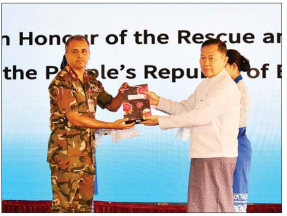
အမျိုးသားသဘာဝဘေးအန္တရာယ်ဆိုင်ရာ စီမံခန့်ခွဲမှုကော်မတီဥက္ကဋ္ဌ နိုင်ငံတော်စီမံအုပ်ချုပ်ရေးကောင်စီ ဒုတိယဥက္ကဋ္ဌ ဒုတိယဝန်ကြီးချုပ် ဒုတိယဗိုလ်ချုပ်မှူးကြီး စိုးဝင်း၊ ဘင်္ဂလားဒေ့ရှ်နိုင်ငံ ရှာဖွေကယ်ဆယ်ရေးနှင့် အရေးပေါ်ကျန်းမာရေးစောင့်ရှောက်မှုအဖွဲ့တို့အား ဂုဏ်ပြုမှတ်တမ်းလွှာများနှင့် အမှတ်တရ လက်ဆောင်များ ပေးအပ်စဉ်။

စီမံအုပ်ချုပ်ရေးကောင်စီ ဒုတိယ ဥက္ကဋ္ဌ ဒုတိယဝန်ကြီးချုပ် ဒုတိယ ဗိုလ်ချုပ်မှူးကြီး စိုးဝင်းနှင့် တက်ရောက်လာကြသူများသည် ၂၀၂၅ ခုနှစ် မတ် ၂၈ ရက်တွင် အလွန်ပြင်းထန်သည့် ငလျင် လှုပ်ခတ်ခဲ့မှုကြောင့် အသက် ဆုံးရှုံးခဲ့မှုများနှင့် ပျက်စီးဆုံးရှုံးမှု များအတွက် စာနာနားလည်မှုနှင့် အတူ ထပ်တူဝမ်းနည်းကြေကွဲခြင်း အထိမ်းအမှတ်အဖြစ် တစ်မိနစ် ငြိမ်သက်စွာ ရပ်တန့်၍ ဦးညွတ် ဂါရဝပြုကြသည်။ ဂုဏ်ပြုအမှာစကားပြောကြား ထို့နောက် အမျိုးသားသဘာဝ ဘေးအန္တရာယ်ဆိုင်ရာ စီမံခန့်ခွဲမှု ကော်မတီဥက္ကဋ္ဌ နိုင်ငံတော်စီမံ အုပ်ချုပ်ရေးကောင်စီ ဒုတိယဥက္ကဋ္ဌ ဒုတိယဝန်ကြီးချုပ် ကျေးဇူးတင် ဂုဏ်ပြုအမှာစကား ပြောကြားရာ တွင် မိမိတို့နိုင်ငံတွင် ၂၀၂၅ ခုနှစ် မတ် ၂၈ ရက်တွင် လှုပ်ခတ်ခဲ့သည့် ၇ ဒသမ ၇ ရှိ အင်အားပြင်းငလျင် လှုပ်ခတ်ခဲ့မှုကြောင့် အသက် ဆုံးရှုံးမှုများနှင့် ပျက်စီးဆုံးရှုံးမှု များ များစွာဖြစ်ပေါ်ခဲ့ကြောင်း၊ ထိုသို့ မြေငလျင်လှုပ်ခတ်ခြင်း၏ နောက်ဆက်တွဲအဖြစ် ယနေ့အချိန် အထိ ၁၀၂၂၆ လှုပ်ခတ်ခဲ့ပြီး