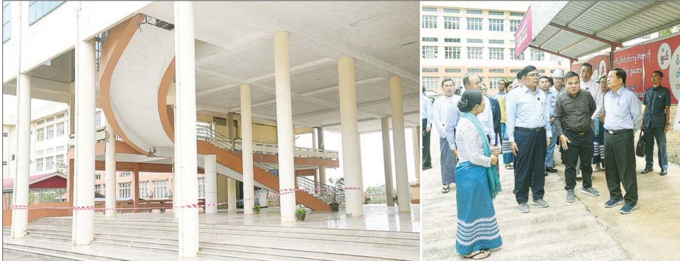
နိုင်ငံတော်စီမံအုပ်ချုပ်ရေးကောင်စီဥက္ကဋ္ဌ နိုင်ငံတော်ဝန်ကြီးချုပ် ဗိုလ်ချုပ်မှူးကြီးမင်းအောင်လှိုင် ငလျင်ဘေးဒဏ်ကြောင့် ကွန်ပျူတာတက္ကသိုလ်(တောင်ကြီး) ပင်မသုံးထပ်စာသင်ဆောင် ထိခိုက်ပျက်စီးမှုအခြေအနေကို ကြည့်ရှုစစ်ဆေးစဉ်။

နိုင်ငံတော်စီမံအုပ်ချုပ်ရေးကောင်စီဥက္ကဋ္ဌ နိုင်ငံတော်ဝန်ကြီးချုပ် ဗိုလ်ချုပ်မှူးကြီးမင်းအောင်လှိုင် ရှမ်းပြည်နယ်(တောင်ပိုင်း)နှင့် ပအိုဝ်းကိုယ်ပိုင်အုပ်ချုပ်ခွင့်ရဒေသတို့ရှိ ပြည်နယ်၊ ခရိုင်၊ မြို့နယ်အဆင့် ဌာနဆိုင်ရာဝန်ထမ်းများနှင့်တွေ့ဆုံ၊ ငလျင်သဘာဝဘေးဒဏ်ဆိုင်ရာများနှင့် ဒေသဖွံ့ဖြိုးတိုးတက်ရေးဆိုင်ရာများအား ဆွေးနွေးမှာကြား၊ ထိခိုက်ပျက်စီးမှုများကြည့်ရှုစစ်ဆေး