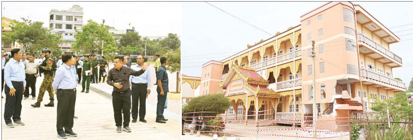
နိုင်ငံတော်စီမံအုပ်ချုပ်ရေးကောင်စီဥက္ကဋ္ဌ နိုင်ငံတော်ဝန်ကြီးချုပ် ဗိုလ်ချုပ်မှူးကြီးမင်းအောင်လှိုင် အောင်ချမ်းသာစာသင်တိုက်အတွင်းရှိ ငလျင်ဒဏ်ကြောင့် ထိခိုက်ပျက်စီးခဲ့သည့် သာသနာ့တက္ကသိုလ်ကျောင်းအား ကြည့်ရှုစစ်ဆေးစဉ်။