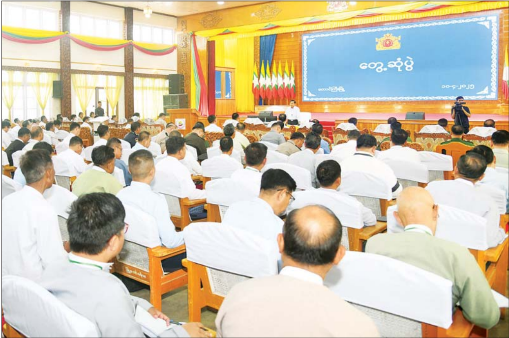
နိုင်ငံတော်စီမံအုပ်ချုပ်ရေးကောင်စီဥက္ကဋ္ဌ နိုင်ငံတော်ဝန်ကြီးချုပ် ဗိုလ်ချုပ်မှူးကြီးမင်းအောင်လှိုင် ရှမ်းပြည်နယ်(တောင်ပိုင်း) တောင်ကြီးမြို့၌ ပြည်နယ်၊ ခရိုင်၊ မြို့နယ်အဆင့် ဌာနဆိုင်ရာဝန်ထမ်းများအား ငလျင်သဘာဝဘေးဒဏ်ဆိုင်ရာများနှင့် ဒေသဖွံ့ဖြိုးရေးဆိုင်ရာများ ဆွေးနွေးပြောကြားစဉ်။

ထိခိုက်ပျက်စီးခဲ့ရမှုများနှင့် သဘာဝဘေးဒဏ် တုံ့ပြန်ဆောင်ရွက်နိုင်မည့်အခြေအနေများ ထို့နောက် နိုင်ငံတော်စီမံအုပ်ချုပ်ရေးကောင်စီ ဥက္ကဋ္ဌ နိုင်ငံတော်ဝန်ကြီးချုပ်က ငလျင်သဘာဝ ဘေးဒဏ်ဆိုင်ရာများ၊ ဒေသဖွံ့ဖြိုးရေးဆိုင်ရာများ နှင့်ပတ်သက်၍ ဆွေးနွေးပြောကြားရာတွင် မန္တလေး ငလျင်ကြီးလှုပ်ခတ်ခဲ့စဉ် ရှမ်းပြည်နယ်(တောင်ပိုင်း) နှင့် ပအိုဝ်းကိုယ်ပိုင်အုပ်ချုပ်ခွင့်ရဒေသတို့၌ ထိခိုက်ပျက်စီးခဲ့ရမှုများအား ကြည့်ရှုစစ်ဆေးရန်နှင့် ပြန်လည်ထူထောင်ရေးလုပ်ငန်းများ ဆောင်ရွက်ရာ တွင် လိုအပ်သည်များ မှာကြားနိုင်ရေးအတွက် လာရောက်ခဲ့ခြင်းဖြစ်ကြောင်း၊ အဆိုပါငလျင်ကြီး လှုပ်ခတ်ခဲ့မှုကြောင့် မန္တလေးတိုင်းဒေသကြီး၊ စစ်ကိုင်းတိုင်းဒေသကြီး၊ ပဲခူးတိုင်းဒေသကြီးနှင့် ရှမ်းပြည်နယ်တို့တွင် ထိခိုက်မှုများဖြစ်ပေါ်ခဲ့ကြောင်း၊ ယနေ့ နံနက်ပိုင်းအထိ ထိခိုက်သဆုံးခဲ့ရသူ ၃၆၄၉ ဦး၊ ဒဏ်ရာရရှိခဲ့ရသူ ၅၀၀၈ ဦးနှင့် ပျောက်ဆုံးနေသူ ၁၄၅ ဦးရှိသည်ဟု သိရှိရကြောင်း၊ ငလျင်ဘေးဒဏ် ကြောင့်သေဆုံးခဲ့ရသူများအား တစ်ဦးလျှင် ၁၀ သိန်း ကျပ်စီ ထောက်ပံ့ပေးသွားမည်ဖြစ်ကြောင်း၊ အခြား ထိခိုက်ပျက်စီးမှုများအနေဖြင့် နေအိမ် စုစုပေါင်း