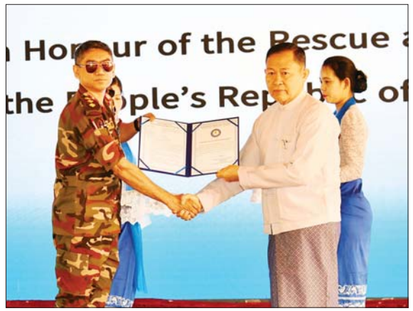
အမျိုးသားသဘာဝဘေးအန္တရာယ်ဆိုင်ရာ စီမံခန့်ခွဲမှုကော်မတီဥက္ကဋ္ဌ နိုင်ငံတော်စီမံအုပ်ချုပ်ရေးကောင်စီ ဒုတိယဥက္ကဋ္ဌ ဒုတိယဝန်ကြီးချုပ် ဒုတိယဗိုလ်ချုပ်မှူးကြီး စိုးဝင်း၊ ဘင်္ဂလားဒေ့ရှ်နိုင်ငံ ရှာဖွေကယ်ဆယ်ရေးနှင့် အရေးပေါ်ကျန်းမာရေးစောင့်ရှောက်မှုအဖွဲ့တို့အား ဂုဏ်ပြုမှတ်တမ်းလွှာများနှင့် အမှတ်တရ လက်ဆောင်များ ပေးအပ်စဉ်။