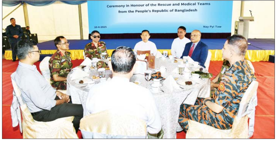
အမျိုးသားသဘာဝဘေးအန္တရာယ်ဆိုင်ရာ စီမံခန့်ခွဲမှုကော်မတီဥက္ကဋ္ဌ နိုင်ငံတော်စီမံအုပ်ချုပ်ရေးကောင်စီ ဒုတိယဥက္ကဋ္ဌ ဒုတိယဝန်ကြီးချုပ် ဒုတိယဗိုလ်ချုပ်မှူးကြီး စိုးဝင်း၊ ဘင်္ဂလားဒေ့ရှ်နိုင်ငံ ရှာဖွေကယ်ဆယ်ရေးနှင့် အရေးပေါ်ကျန်းမာရေးစောင့်ရှောက်မှုအဖွဲ့အား စားသောက် ဖွယ်ရာများဖြင့် တည်ခင်းဧည့်ခံစဉ်။

ဖြစ်ကြောင်း။ ထိုသို့ မြေငလျင်လှုပ်ခတ်မှု များကြောင့် နိုင်ငံတစ်ဝန်းတွင် လူနေအိမ်စုပေါင်းခြောက်သောင်း ကျော်၊ ဘုန်းတော်ကြီးကျောင်းနှင့် သီလရှင်ကျောင်း ၃၅၁၄ ကျောင်း၊ စာသင် ကျောင်း ၂၆၆၅ ကျောင်း၊ ဌာနဆိုင်ရာရုံး/ အဆောက်အအုံ ၃၆၇၈ လုံး၊ ပျက်စီးဆုံးရှုံးခဲ့ကြောင်း၊ ထို့ပြင် တံဘားပေါင်း ၁၅၅ စင်း၊ ဘုရားစေတီ ၅၆၂၀ ဆူ ထိခိုက် ပျက်စီးဆုံးရှုံးခဲ့ကြောင်း၊ ယနေ့ နံနက်ပိုင်းအထိ သေဆုံးသူ ဦးရေ ၃၆၄၉ ဦး၊ ဒဏ်ရာရရှိသူဦးရေ ၅၁၀၈ ဦးနှင့် ပျောက်ဆုံးသူဦးရေ ၁၄၅ ဦးရှိခဲ့ကြောင်း၊ ၂၀၂၅ ခုနှစ် မတ် ၂၈ ရက်မှ ဧပြီ ၉ ရက်အထိ မြန်မာနိုင်ငံမှ ရှာဖွေကယ်ဆယ်ရေးအဖွဲ့ဝင်များနှင့် နိုင်ငံတကာက အရေးပေါ် ရှာဖွေကယ်ဆယ်ရေး