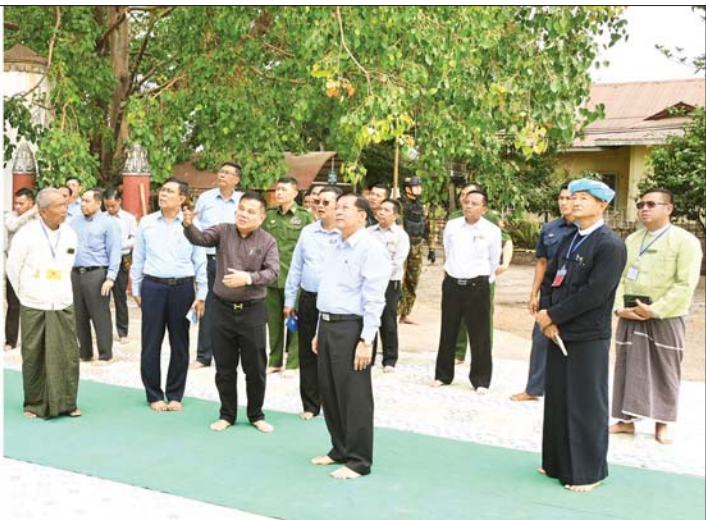
နိုင်ငံတော်စီမံအုပ်ချုပ်ရေးကောင်စီဥက္ကဋ္ဌ နိုင်ငံတော်ဝန်ကြီးချုပ် ဗိုလ်ချုပ်မှူးကြီးမင်းအောင်လှိုင် ဟိုပိုးဖြူကျက်သရေဆောင် သီရိမင်္ဂလာရွှေချမ်းသာမွေတော်ဘုရားကြီး ငလျင်ဒဏ်ကြောင့် ထိခိုက်ပျက်စီးမှု အခြေအနေကို ကြည့်ရှုစစ်ဆေးစဉ်။