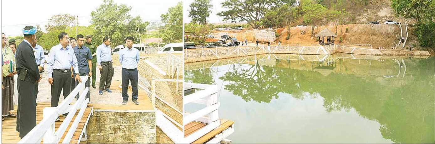
နိုင်ငံတော်စီမံအုပ်ချုပ်ရေးကောင်စီဥက္ကဋ္ဌ နိုင်ငံတော်ဝန်ကြီးချုပ် ဗိုလ်ချုပ်မှူးကြီး မင်းအောင်လှိုင် ဟိုပုံးမြို့ရှိ ဟိုပုံးရေထွက်ကြီး၌ ရေထွက်နှင့်ရေကန် ပြုပြင်ထိန်းသိမ်းထားရှိမှုအခြေအနေများကို ကြည့်ရှုစစ်ဆေးစဉ်။

ခြောက်သောင်းကျော် ပျက်စီးဆုံးရှုံးခြင်း၊ စာသင် ကျောင်းပေါင်း ၂၃၆၆ ကျောင်း ပျက်စီးဆုံးရှုံးခြင်း၊ ဘုရား စေတီပေါင်း ၅၆၂၀ ပျက်စီးဆုံးရှုံးခြင်းနှင့် ဆေးရုံ ဆေးခန်း ၂၉၁ ခု ပျက်စီးဆုံးရှုံးခြင်းများဖြစ်ပေါ်ခဲ့