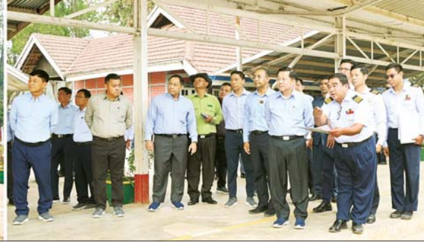
နိုင်ငံတော်စီမံအုပ်ချုပ်ရေးကောင်စီဥက္ကဋ္ဌ နိုင်ငံတော်ဝန်ကြီးချုပ် ဗိုလ်ချုပ်မှူးကြီးမင်းအောင်လှိုင် ကလေးဘူတောအတွင်း လှည့်လည်ကြည့်ရှုစစ်ဆေးစဉ်။