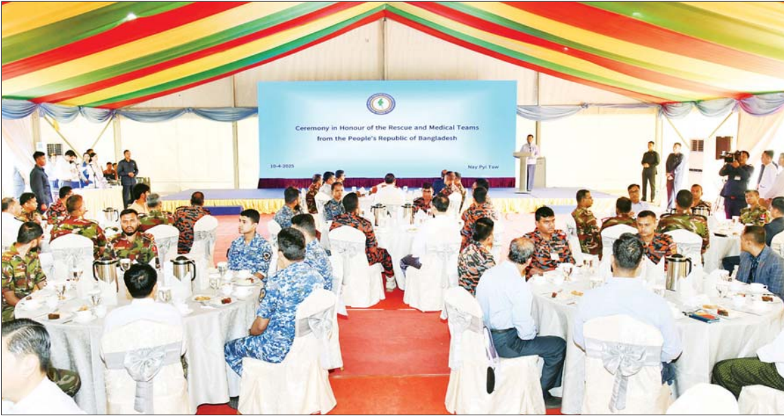
အမျိုးသားသဘာဝဘေးအန္တရာယ်ဆိုင်ရာ စီမံခန့်ခွဲမှုကော်မတီဥက္ကဋ္ဌ နိုင်ငံတော်စီမံအုပ်ချုပ်ရေးကောင်စီ ဒုတိယဥက္ကဋ္ဌ ဒုတိယဝန်ကြီးချုပ် ဒုတိယဗိုလ်ချုပ်မှူးကြီး စိုးဝင်း ဘင်္ဂလားဒေ့ရှ်နိုင်ငံ ရှာဗ္ဗေကယ်ဆယ်ရေးနှင့် အရေးပေါ်ကျန်းမာရေးစောင့်ရှောက်မှုအဖွဲ့အား ဂုဏ်ပြုနှုတ်ဆက်ခြင်းအခမ်းအနားတွင် ကျေးဇူးတင်ဂုဏ်ပြုအမှာစကား ပြောကြားစဉ်။

နေပြည်တော် ဧပြီ ၁၀ မတ် ၂၈ ရက်တွင် ဖြစ်ပွားခဲ့သည့် ပြင်းထန်လျင်မြန်စွာ နောက်ဆက်တွဲလျင်မြန်စွာ ပျက်စီးဆုံးရှုံးမှုများဖြစ်ပေါ်ခဲ့သည့် မြန်မာနိုင်ငံသို့ အရေးပေါ်ကူညီကယ်ဆယ်ရေး လုပ်ငန်းများ လာရောက် လုပ်ဆောင်ခဲ့ပြီး ကယ်ဆယ်ရေး လုပ်ငန်းစဉ်များ ပြီးမြောက်သဖြင့် ဘင်္ဂလားဒေ့ရှ်နိုင်ငံသို့ ပြန်လည်ထွက်ခွာမည့် ဘင်္ဂလားဒေ့ရှ်နိုင်ငံ ရှာဗ္ဗေကယ်ဆယ်ရေးနှင့် အရေးပေါ်ကျန်းမာရေးစောင့်ရှောက်မှုအဖွဲ့အား ဂုဏ်ပြုနှုတ်ဆက်ခြင်းအခမ်းအနားကို ယနေ့ နံနက်ပိုင်းတွင် နေပြည်တော်ရှိ တပေါင်းတွင်း၌ ကျင်းပပြုလုပ်ရာ အမျိုးသားသဘာဝဘေးအန္တရာယ်ဆိုင်ရာ စီမံခန့်ခွဲမှုကော်မတီဥက္ကဋ္ဌ နိုင်ငံတော်စီမံအုပ်ချုပ်ရေးကောင်စီ ဒုတိယဥက္ကဋ္ဌ ဒုတိယဝန်ကြီးချုပ် ဒုတိယဗိုလ်ချုပ်မှူးကြီး စိုးဝင်း တက်ရောက်၍ ကျေးဇူးတင်ဂုဏ်ပြုအမှာစကား ပြောကြားသည်။