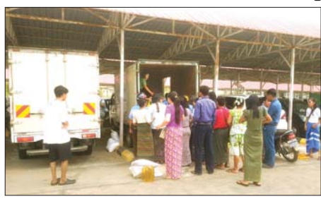
ဘူတန်ဘုရင်နိုင်ငံ ဆေးဘက်ဆိုင်ရာအရေးပေါ်ကယ်ဆယ်ရေး အဖွဲ့ ရေသန့်စင်စက်နှင့် တစ်ကိုယ်ရေသုံးပစ္စည်းများ လျှင်မြန်

အလားတူ မန္တလေးမြို့တွင် ဈေးကားလေးစီးဖြင့် လှည့်လည် ရောင်းချပေးလျက်ရှိရာ ယနေ့အထိ ဆန် ၂၄ ပြည်ဆုံ (မနေသုခ) ၃၂၅ အိတ်၊ စားအုန်းဆီ ပိသာ ၂၄၂၀၀ ၊ ခေါက်ဆွဲခြောက်ထုပ်များကို ရောင်းချပေးခဲ့ကြောင်းနှင့် စစ်ကိုင်းမြို့တွင် ဈေးကားလေးစီးဖြင့် ရောင်းချပေးလျက်ရှိရာ ယနေ့အထိ ဆန် ၂၄ ပြည်ဆုံ (ရွှေဝါထွန်း) ၂၀၆ အိတ်၊ စားအုန်းဆီ ၃၃၃ ပိသာ၊ ကြက်ဥအလုံး ၄၃၆၀ ၊ ကြက်သွန်နီ ပိသာ ၄၅၀ ၊ အသားတူ ၁၅ ပိသာတို့ကို သက်သာသော ဈေးနှုန်းများဖြင့် ရောင်းချပေးခဲ့ပြီး ရေသန့်များကိုလည်း အခမဲ့ဖြန့်ဝေပေးခဲ့ကြောင်း နှင့် နေ့စဉ်ဆက်လက်ရောင်းချပေးမည်ဖြစ်ကြောင်း သတင်းရရှိသည်။