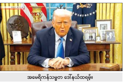
အမေရိကန်သမ္မတ ဒေါ်နယ်ထရမ်။

ဒေါ်နယ်ထရမ်က ၎င်းအနေဖြင့် အများကြီးမတောင်းဆိုကြောင်း အီရန်တွင် နျူကလီးယား လက်နက်ပိုင်ဆိုင်ရန် မဖြစ်နိုင်ကြောင်း ပြောကြားခဲ့သည်။ အီရန်နိုင်ငံ နျူကလီးယား လက်နက်ပိုင်ဆိုင်သွားမည်ကိုပိတ်ဆို့ရန်အတွက် တပ်ဖွဲ့အင်အား အသုံးပြုသွားနိုင်သည်ဟု ရည်ညွှန်းပြောဆိုခဲ့ခြင်းဖြစ်သည်။ အီရန်အပေါ် စစ်ရေးအရအရေးယူမှု စတင်ခဲ့ပါက အစွဲအမူအထိ အဓိကကျသောအခန်းကဏ္ဍမှ ပါဝင်နိုင်ခြေရှိသည်ဟု ထရမ်က ဆက်လက်ပြောကြားခဲ့သည်။