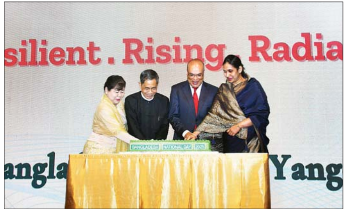
မြို့တော်ဝန် ဦးစိုးဝင်းဌေးနှင့် ဇနီး၊ နိုင်ငံခြားသံရုံးများ လှယ်များနှင့် ဖိတ်ကြားထားသူများ တက်ရောက်ကြ မှု သံအမတ်ကြီးများ၊ သံရုံးယာယီတာဝန်ခံများ၊ ကြောင်း သတင်းရရှိသည်။ စစ်သံမှူးများ၊ ကုလသမဂ္ဂဆိုင်ရာ ဌာနကိုယ်စား

အဆိုပါဧည့်ခံပွဲသို့ လူဝင်မှုကြီးကြပ်ရေးနှင့် ပြည်သူ့အင်အားဝန်ကြီးဌာန ပြည်ထောင်စုဝန်ကြီး ဦးမြင့်ကြိုင်နှင့် ဇနီး၊ ရန်ကုန်တိုင်းဒေသကြီးဝန်ကြီးချုပ် ဦးစိုးသိန်းနှင့် ဇနီး၊ နိုင်ငံခြားရေးဝန်ကြီးဌာန ဒုတိယဝန်ကြီး ဦးကိုကိုကျော်နှင့် ဇနီး၊ စီးပွားရေးနှင့် ကူးသန်းရောင်းဝယ်ရေးဝန်ကြီးဌာန ဒုတိယဝန်ကြီး ဦးကျော်ရွှေထွန်းနှင့် ဇနီး၊ မြန်မာနိုင်ငံတော်ဗဟိုဘဏ် ဒုတိယဥက္ကဋ္ဌ ဒေါက်တာ လင်းအောင်၊ ရန်ကုန်