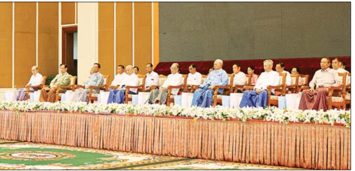
နိုင်ငံတော်စီမံအုပ်ချုပ်ရေးကောင်စီဥက္ကဋ္ဌ တပ်မတော်ကာကွယ်ရေးဦးစီးချုပ် ဗိုလ်ချုပ်မှူးကြီး မင်းအောင်လှိုင်၊ ဇနီး ဒေါ်ကြူကြူလှနှင့် အဖွဲ့ဝင်များ နှစ်(၈၀)ပြည့် တပ်မတော်နေ့စစ်ရေးပြအခမ်းအနားသို့ ပါဝင် တက်ရောက်ကြမည့် တပ်မတော်တွင် တာဝန်ထမ်းဆောင်ခဲ့ကြသော အငြိမ်းစားတပ်မတော်အရာရှိကြီးများအား ဂါရဝပြုကန်တော့စဉ်။