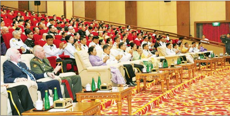
နိုင်ငံတော်စီမံအုပ်ချုပ်ရေးကောင်စီဥက္ကဋ္ဌ တပ်မတော်ကာကွယ်ရေးဦးစီးချုပ် ဗိုလ်ချုပ်မှူးကြီးမင်းအောင်လှိုင်၊ ဇနီး ဒေါ်ကြူကြူလှနှင့်အဖွဲ့ဝင်များ စစ်သည်စစ်သမီးများ၏ "ပန်းသုံးပွင့်၏ အဘိဓမ္မာ" ပြဇာတ် တင်ဆက် ဖျော်ဖြေမှုကို ကြည့်ရှုအားပေးစဉ်။