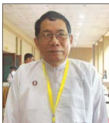
ဒေါက်တာအေးမောင်