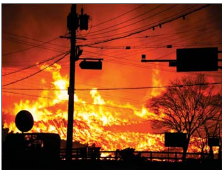
ရွှေပြောင်းရန် ကြိုးပမ်းစဉ် မတ် ၂၆ ရက် မွန်းလွှဲပိုင်းက မီးလောင်မှုအတွင်း ပါဝင်သွား ဧရာဝတီတစ်စင်း ပျက်ကုန်ခဲ့ ရာလေယာဉ်မှူးတစ်ဦး သေဆုံးခဲ့

ဆိုးလ် မတ် ၂၆ တောင်ကိုရီးယားနိုင်ငံ၌ လွန်ခဲ့သည့်သီတင်းပတ်မှ စတင်လောင်ခဲ့သည့် တောမီးလောင်မှုများကြောင့် သေဆုံးသူဦးရေမှာ မီးသတ်သမားများ အပါအဝင် ၂၄ ဦးအထိ ရှိလာပြီဖြစ်ကြောင်း သိရသည်။ နိုင်ငံ အရှေ့တောင်ပိုင်း အစိတ်အပိုင်းများတွင် တောမီးဆက်လက် လောင်လျက်ရှိပြီး ခြောက်သွေ့သည့် ရာသီဥတုနှင့် လေပြင်းများကြောင့် တောမီးလောင်မှုကို ပိုမိုဆိုးရွားစေသည်။ လူအချို့ လမ်းမပေါ်တွင် သေဆုံးနေသည့်ကို တွေ့ခဲ့ရပြီး ၎င်းတို့မှာ ဘေးလွတ်ရာသို့ များတွင် ဖော်ပြသည်။