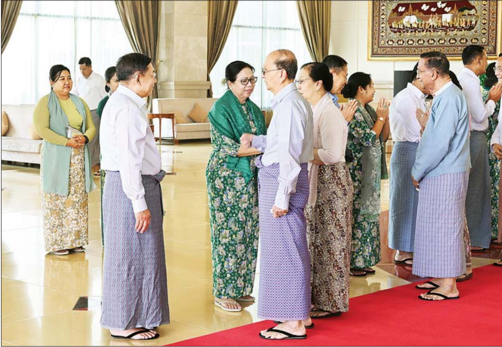
နိုင်ငံတော်စီမံအုပ်ချုပ်ရေးကောင်စီဥက္ကဋ္ဌ တပ်မတော်ကာကွယ်ရေးဦးစီးချုပ် ဗိုလ်ချုပ်မှူးကြီးမင်းအောင်လှိုင်နှင့် ဇနီး ဒေါ်ကြူကြူလှ အခမ်းအနားတက်ရောက် လာကြသည့် အငြိမ်းစားတပ်မတော်အရာရှိကြီးများနှင့် ဇနီးများအား ရင်းရင်းနှီးနှီးနှုတ်ဆက်စဉ်။

တပ်မတော်အနေဖြင့် ဖွဲ့စည်းပုံအခြေခံဥပဒေ (၂၀၀၈ ခုနှစ်) နှင့်အညီ နိုင်ငံတော်တာဝန်များကို ထမ်းဆောင်နေရခြင်းဖြစ်ပြီး ယခုနှစ်ကုန်ကာလတွင် လွတ်လပ်၍တရားမျှတသည့် ပါတီစုံဒီမိုကရေစီ အထွေထွေရွေးကောက်ပွဲတစ်ရပ်ကို ကျင်းပပြုလုပ် ၍ အနိုင်ရရှိသည့်ပါတီအား နိုင်ငံတော်၏တာဝန်များ ကို စနစ်တကျ မြန်လည်လွှဲပြောင်းပေးသွားမည် ဖြစ်ပါကြောင်း၊ တပ်မတော်အနေဖြင့် ပါတီစုံ ဒီမို ကရေစီစနစ်ခိုင်မာစေရေး၊ တိုင်းရင်းသားအချင်းချင်း စည်းလုံးညီညွတ်မှုမပြိုကွဲရေး၊ ပြည်ထောင်စုကြီး မပြိုကွဲရေးအတွက်ဥပဒေနှင့်အညီသာ ထိန်းသိမ်း ထိန်းသိမ်းခြင်းဖြင့် ဆောင်ရွက်နေခြင်းဖြစ်ပါကြောင်း။