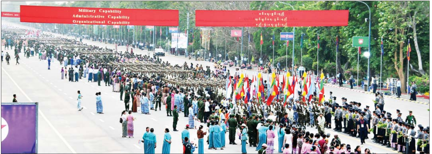
(၇၉)နှစ်မြောက် တစ်မတော်နေ့ စစ်ရေးပြအခမ်းအနားတွင် စစ်ရေးပြစစ်ကြောင်းကြီးများ ချီတက်ရာလမ်းတစ်လျှောက်၌ မိဘပြည်သူများ သောင်းသောင်းမြဲမြဲကြည့်ဆိုကြစဉ်။