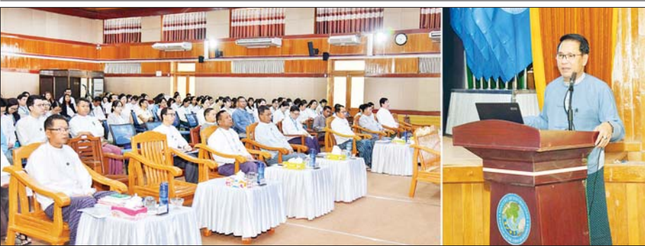
ပြည်ထောင်စုဝန်ကြီး ဦးမောင်မောင်အုန်း ဥပဒေအသိပညာပြန့်ပွားရေးဆွေးနွေးပွဲတွင် အမှာစကားပြောကြားစဉ်။

တိုးတက်ရေးကဏ္ဍနှင့်စပ်လျဉ်း၍ သုံးရက်တာ ဆွေးနွေးပွဲရလဒ်များကိုလည်းကောင်း ရှင်းလင်းတင်ပြပြီး မှတ်တမ်းတင်သည်။ ထို့နောက် စကားဝိုင်းဆွေးနွေးပွဲအဖွဲ့(၁)ကိုယ်စား ပစ်ခတ်တိုက်ခိုက်မှုရပ်စဲရေးဆိုင်ရာ ပူးတွဲစောင့်ကြည့်ရေးကော်မတီ(ကရင်ပြည်နယ်) ဒုတိယဥက္ကဋ္ဌ (၂)နန်းစောနှင့် အဖွဲ့(၂)ကိုယ်စား ကရင်အမျိုးသားအစည်းအရုံး / ကရင်အမျိုးသားလွတ်မြောက်ရေးတပ်မတော်- ငြိမ်းချမ်းရေးကောင်စီ (KNU/KNLA-PC) ဒုတိယဥက္ကဋ္ဌ ခေါက်တောနေကပေါ်ထူးတို့က ကျေးဇူးတင်စကားများ ပြောကြားသည်။ ယင်းနောက် အမျိုးသားစည်းလုံးညီညွတ်ရေးနှင့် ငြိမ်းချမ်းရေးဖော်ဆောင်မှုညွှန်ကြားရေးကော်မတီဥက္ကဋ္ဌ ဒုတိယဗိုလ်ချုပ်ကြီး ရာပြည့်က နိဂုံးချုပ်အမှာစကားပြောကြားရာတွင် သုံးရက်တာ ငြိမ်းချမ်းရေးစကားဝိုင်းမှ ရရှိခဲ့သည့် သုံးသပ်ဖော်ထုတ်ချက်များနှင့် အကြံပြုချက်များသည် မြန်မာနိုင်ငံ၏ နိုင်ငံရေးဖြစ်စဉ်အတွက် အတိုင်းအတာတစ်ခုအထိ အထောက်အပံ့ဖြစ်စေမည်ဟု ယုံကြည်ကြောင်း၊ ရရှိခဲ့သည့် သုံးသပ်ဖော်ထုတ်ချက်များနှင့် အကြံပြုချက်များအား လက်တွေ့ပြန်လည် အသုံးချနိုင်ရန် ဆက်လက်ကြိုးပမ်းလုပ်ဆောင်သွားမည်ဖြစ်ကြောင်းနှင့် NSPNC အနေဖြင့် ငြိမ်းချမ်းရေးစကားဝိုင်းများအား အခါအခါလျှော့စွာ ကျင်းပနိုင်ရေး ကြိုးစားဆောင်ရွက်မည်ဖြစ်ကြောင်း ပြောကြားသည်။ (အပေါ်ပိုင်း) သတင်းစဉ်