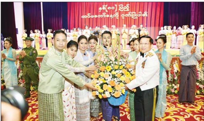
နိုင်ငံတော်စီမံအုပ်ချုပ်ရေးကောင်စီဥက္ကဋ္ဌ တပ်မတော်ကာကွယ်ရေးဦးစီးချုပ် ဗိုလ်ချုပ်မှူးကြီး မင်းအောင်လှိုင် နှင့် ဇနီး ဒေါ်ကြူကြူလှ စစ်သည်၊ စစ်သမီးများအား အမှတ်တရဂုဏ်ပြုပန်းခြင်း ပေးအပ်စဉ်။

ထို့နောက် နိုင်ငံတော်စီမံအုပ်ချုပ်ရေးကောင်စီ ဥက္ကဋ္ဌ တပ်မတော်ကာကွယ်ရေးဦးစီးချုပ် ဗိုလ်ချုပ် မှူးကြီး မင်းအောင်လှိုင်နှင့် ဇနီး ဒေါ်ကြူကြူလှ တို့သည် နှစ်(၈၀)ပြည့် တပ်မတော်နေ့အထိမ်းအမှတ် အကြိုဂုဏ်ပြုညစာစားပွဲသို့ တက်ရောက်လာကြ သည့် ရုရှားဖက်ဒရေရှင်းနိုင်ငံ ဒုတိယကာကွယ်ရေး ဝန်ကြီး Colonel General Alexander Vasilyevich Fominနှင့် အဖွဲ့ဝင်များ၊ နိုင်ငံတော်စီမံအုပ်ချုပ်ရေး ကောင်စီဒုတိယဥက္ကဋ္ဌ ဒုတိယတပ်မတော်ကာကွယ် ရေးဦးစီးချုပ် ကာကွယ်ရေးဦးစီးချုပ်(ကြည်း) ဒုတိယ ဗိုလ်ချုပ်မှူးကြီး စိုးဝင်းနှင့် ဇနီးဒေါ်သန်းသန်းနွယ်၊ ညိုနှိုင်းကွဲကဲရေးမှူး (ကြည်း) ရေ(လေ) ဗိုလ်ချုပ်ကြီး ကျော်စွာလင်းနှင့်ဇနီး၊ ကာကွယ်ရေးဦးစီးချုပ်(ရေ) ဗိုလ်ချုပ်ကြီး ထိန်ဝင်းနှင့်ဇနီး၊ ကာကွယ်ရေးဦးစီးချုပ် (လေ) ဗိုလ်ချုပ်ကြီး ထွန်းအောင်နှင့်ဇနီး၊ ကောင်စီ အတွင်းရေးမှူးနှင့်ဇနီး၊ တွဲဖက်အတွင်းရေးမှူးနှင့်ဇနီး၊ ကောင်စီဝင်များနှင့်ဇနီးများ၊ ပြည်ထောင်စုအဆင့် ပုဂ္ဂိုလ်များ၊ ပြည်ထောင်စုဝန်ကြီးများနှင့်ဇနီးများ၊ ကာကွယ်ရေးဦးစီးချုပ်ရုံးမှ အဆင့်မြင့်တပ်မတော် အရာရှိကြီးများနှင့် ဇနီးများ၊ ရဲဘော်သုံးကျိပ်ဝင် မိသားစုဝင်များ၊ အငြိမ်းစားတပ်မတော်ကာကွယ်ရေး ဦးစီးချုပ်များ၏ မိသားစုဝင်များ၊ အငြိမ်းစား တပ်မတော် (ကြည်း၊ ရေ(လေ) အရာရှိကြီးများ၊ လွတ်လပ်ရေးခေတ်ကွန်းဝင် ပထမဆင့်၊ ဒုတိယ