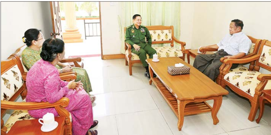
နိုင်ငံတော်စီမံအုပ်ချုပ်ရေးကောင်စီဥက္ကဋ္ဌ တပ်မတော်ကာကွယ်ရေးဦးစီးချုပ် ဗိုလ်ချုပ်မှူးကြီး မင်းအောင်လှိုင်နှင့်ဇနီး ဒေါ်ကြာကြာလှ နှစ်(၈၀)ပြည့် တပ်မတော်နေ့အခမ်းအနားသို့ တက်ရောက်ကြမည့် အငြိမ်းစားတပ်မတော်အရာရှိကြီးများနှင့်ဇနီးများအား သွားရောက်တွေ့ဆုံ ဂါရဝပြုနှုတ်ဆက်စဉ်။

စာမျက်နှာ ၆ မှ တက်ရောက် ချီးမြှင့်ပေးသည့် အတွက် ကျေးဇူးတင်ရှိမှုနှင့် နိုင်ငံတော် တည်ငြိမ်အေးချမ်း ရေးအတွက် တပ်မတော်အနေဖြင့် အလေးထား ဆောင်ရွက်လျက်ရှိမှု၊ နိုင်ငံတော်စီမံအုပ်ချုပ်ရေးကောင်စီ အနေဖြင့် နိုင်ငံတော်ဘက်စုံဖွံ့ဖြိုး တိုးတက်ရေးအတွက် ဆောင်ရွက် လျက်ရှိမှု၊ တစ်မျိုးသားလုံး ပညာ ရည်မြင့်မားရေးအတွက် ပညာရေး ကို အားပေးမြှင့်တင်ဆောင်ရွက် လျက်ရှိမှု၊ ကျောင်းပညာရေးအပြင် ကျောင်းပြင်ပ ပညာရေးနှင့် စာကြည့်တိုက် လုပ်ငန်းများကို လည်းအားပေးမြှင့်တင်ဆောင်ရွက် လျက်ရှိမှုတို့နှင့် ပတ်သက်၍ ဆွေးနွေးပြောကြားခဲ့ရာ အငြိမ်း စား တပ်မတော်အရာရှိကြီးများက ယခုကဲ့သို့ တပ်မတော်နေ့ စစ်ရေး ပြု အခမ်းအနားသို့ တက်ရောက်ရ သည့်အတွက် ဂုဏ်ယူဝမ်းမြောက် ရမှု၊ နိုင်ငံတော်စီမံအုပ်ချုပ်ရေး ကောင်စီဥက္ကဋ္ဌ တပ်မတော် ကာကွယ်ရေးဦးစီးချုပ်အနေဖြင့် စီမံခန့်ခွဲမှုများကို ဘက်ပေါင်းစုံ မှ လစ်ဟင်းမှုမရှိစေရေး ကြိုးပမ်း ဆောင်ရွက်နေမှုများကို အားပေး အသိအမှတ်ပြုလျက်ရှိမှု၊ နိုင်ငံ တော် အကျိုးကို ဆတတ်ထမ်းပိုး သယ်ပိုးနိုင်စေရေး၊ တည်ငြိမ် အေးချမ်းပြီး ဘက်စုံဖွံ့ဖြိုးတိုးတက် စေရေးတို့အတွက် ဆုမွန်ကောင်း တောင်းလျက်ရှိမှုနှင့် အခြား ဩဝါဒစကားများကို ပြန်လည် ပြောကြားခဲ့ကြောင်း သတင်း ရရှိသည်။