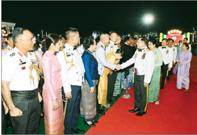
နိုင်ငံတော်စီမံအုပ်ချုပ်ရေးကောင်စီဥက္ကဋ္ဌ တပ်မတော်ကာကွယ်ရေးဦးစီးချုပ် ဗိုလ်ချုပ်မှူးကြီး မင်းအောင်လှိုင် နှင့် ဇနီး ဒေါ်ကြူကြူလှ နိုင်ငံခြားစစ်သံရုံးများမှ စစ်သံမှူးများနှင့် တာဝန်ရှိသူများအား ရင်းရင်းနှီးနှီး နှုတ်ဆက်စဉ်။