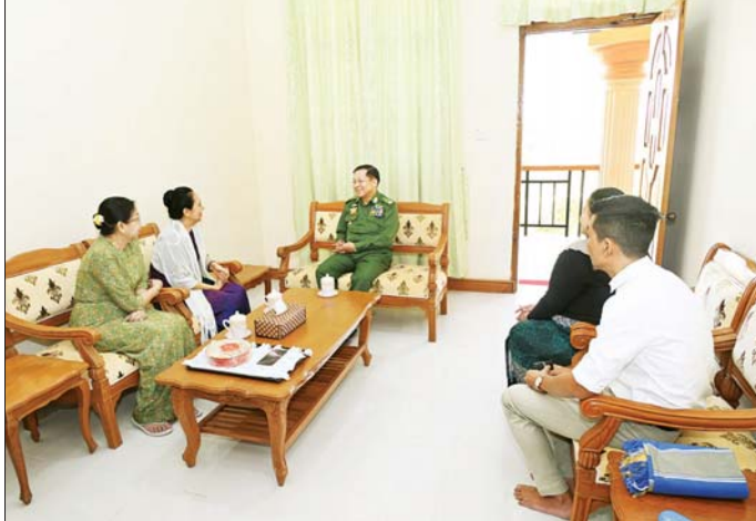
နိုင်ငံတော်စီမံအုပ်ချုပ်ရေးကောင်စီဥက္ကဋ္ဌ တပ်မတော်ကာကွယ်ရေးဦးစီးချုပ် ဗိုလ်ချုပ်မှူးကြီး မင်းအောင်လှိုင်နှင့်ဇနီး ဒေါ်ကြူကြူလှ နှစ်(၈၀)ပြည့် တပ်မတော်နေ့အခမ်းအနားသို့ တက်ရောက်ကြမည့် အငြိမ်းစားတပ်မတော်အရာရှိကြီးများနှင့်ဇနီးများအား သွားရောက်တွေ့ဆုံ ဂါရဝပြုနှုတ်ဆက်စဉ်။