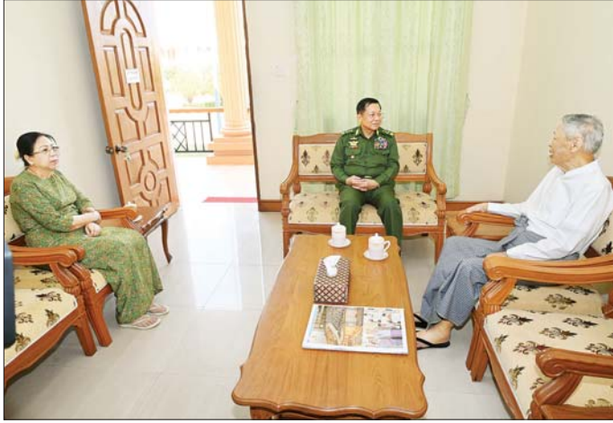
နိုင်ငံတော်စီမံအုပ်ချုပ်ရေးကောင်စီဥက္ကဋ္ဌ တပ်မတော်ကာကွယ်ရေးဦးစီးချုပ် ဗိုလ်ချုပ်မှူးကြီး မင်းအောင်လှိုင်နှင့်ဇနီး ဒေါ်ကြူကြူလှ နှစ်(၈၀)ပြည့် တပ်မတော်နေ့အခမ်းအနားသို့ တက်ရောက်ကြမည့် အငြိမ်းစားတပ်မတော်အရာရှိကြီးများနှင့်ဇနီးများအား သွားရောက်တွေ့ဆုံ ဂါရဝပြုနှုတ်ဆက်စဉ်။