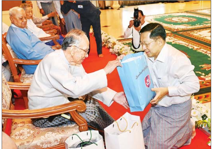
နိုင်ငံတော်စီမံအုပ်ချုပ်ရေးကောင်စီဥက္ကဋ္ဌ တပ်မတော်ကာကွယ်ရေးဦးစီးချုပ် ဗိုလ်ချုပ်မှူးကြီး မင်းအောင်လှိုင် အငြိမ်းစားတပ်မတော်အရာရှိကြီးများအား ဂါရဝပြုလက်ဆောင်ပစ္စည်း ရိုသေစွာ ဂါရဝပြုပေးအပ်စဉ်။

ဂါရဝပြုကန်တော့ အဆိုပါ ဂါရဝပြုကန်တော့သည့် အခမ်းအနားသို့ အငြိမ်းစားတပ်မတော်အရာရှိကြီး ၁၅ ဦးနှင့် ဇနီး ခြောက်ဦးတို့ကန်တော့တက်ရောက်ကြပြီး နိုင်ငံတော် စီမံအုပ်ချုပ်ရေးကောင်စီဥက္ကဋ္ဌ တပ်မတော်ကာကွယ် ရေးဦးစီးချုပ် ဗိုလ်ချုပ်မှူးကြီး မင်းအောင်လှိုင်နှင့် ဇနီး ဒေါ်ကြူကြူလှ တို့ဦးဆောင်၍ နိုင်ငံတော်စီမံ အုပ်ချုပ်ရေးကောင်စီဒုတိယဥက္ကဋ္ဌ ဒုတိယတပ်မတော် ကာကွယ်ရေးဦးစီးချုပ် ကာကွယ်ရေးဦးစီးချုပ် (ကြည်း) ဒုတိယဗိုလ်ချုပ်မှူးကြီး စိုးဝင်းနှင့် ဇနီး ဒေါ်သန်းသန်းနွယ်၊ ညိုနှိုင်းကွပ်ကဲရေးမှူး (ကြည်း၊ ရေ၊ လေ) ဗိုလ်ချုပ်ကြီး တွေ့ရွာလင်းနှင့်ဇနီး၊ ကာကွယ်ရေးဦးစီးချုပ်ရုံး (ကြည်း၊ ရေ၊ လေ) မှ တပ်မတော်အရာရှိကြီးများနှင့် ဇနီးများ တက်ရောက် ဂါရဝပြုကန်တော့ကြသည်။