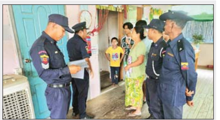
ကလေးဝမြို့ပေါ်ရှိ ကာရာအိုကေလုပ်ငန်း၊ စားသောက်ဆိုင်နှင့် တည်းခိုခန်းတို့တွင် မီးဘေးကာကွယ်ရေးအတွက် မီးချိတ်၊ မီးကပ်၊ လှေကား၊ ရေသေ၊ မီးသတ်ဆေးဘူးများထားရှိမှု၊ မီးဘေးကာကွယ် ထားရှိမှုနှင့် မီးကို သတ်မှတ်အချိန်အတွင်း သတိပြုသုံးစွဲခြင်း မရှိ တို့ကို မတ် ၂၆ ရက်က မြို့နယ်မီးသတ်ဦးစီးမှူး ဦးမျိုးသိမ်ဦးဆောင် သော ပူးပေါင်းအဖွဲ့ ကွင်းဆင်းစစ်ဆေးစဉ်။ မြို့နယ်(ပြန်/ ဆက်)