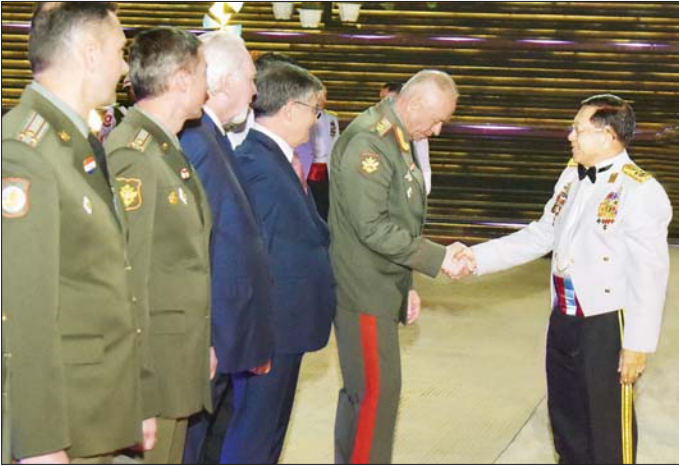
နိုင်ငံတော်စီမံအုပ်ချုပ်ရေးကောင်စီဥက္ကဋ္ဌ တပ်မတော်ကာကွယ်ရေးဦးစီးချုပ် ဗိုလ်ချုပ်မှူးကြီး မင်းအောင်လှိုင် နှင့် ဇနီး ဒေါ်ကြူကြူလှ ရုရှားဖက်ဒရေရှင်းနိုင်ငံ ဒုတိယကာကွယ်ရေးဝန်ကြီး Colonel General Alexander Vasilyevich Fominနှင့် အဖွဲ့ဝင်များအား ရင်းရင်းနှီးနှီး နှုတ်ဆက်စဉ်။