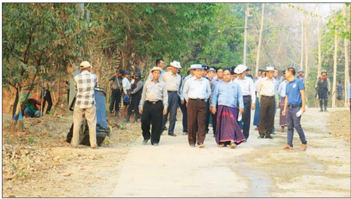
ထို့နောက် ပြည်နယ်ဝန်ကြီးချုပ်၊ ပြည်နယ် တရားလွှတ်တော်တရားသူကြီးချုပ်၊ ပြည်နယ် အစိုးရအဖွဲ့ဝင်များ၊ ဌာနဆိုင်ရာများနှင့် တက်ရောက်လာသူများက အပြည်ပြည်ဆိုင်ရာသစ်တောများနေ့ အထိမ်းအမှတ်စီဒီယိုကို အတူတကွ ကြည့်ရှုခဲ့ကြပြီး ကြောင်း သိရသည်။

ရှိသူများသည် တည်ဆောက်ဆဲဖြစ်သော သာသနာ့ဝေစည်ဓမ္မဓိမာန်တော်ကြီး ၆၀ ရာခိုင်နှုန်းခန့် ပြီးစီးမှုအခြေအနေများကို လိုက်လံကြည့်ရှုစစ်ဆေးပြီး ရေ၊ မီး၊ မိလ္လာ ပြည့်စုံလုံလောက်မှုရှိစေရေး၊ အစိုးရဓမ္မာစရိယစာမေးပွဲနှင့် ပါဠိပထမပြန်စာမေးပွဲအောင်မြင်စွာကျင်းပနိုင်ရေး တာဝန်ရှိသူများအား မှာကြားသည်။ အလားတူ ၂၀၂၅ ခုနှစ် အပြည်ပြည်ဆိုင်ရာ သစ်တောများနေ့ အထိမ်းအမှတ်အခမ်းအနားကို FORESTS AND FOODS သစ်တောများနှင့် စားရေးရိက္ခာများဆောင်ပုဒ်ဖြင့် ယမန်နေ့ မွန်းလွဲ ၂ နာရီက ဘားအံမြို့ ဇွဲကပင်ခန်းမ၌ကျင်းပရာ ဦးစွာ ပြည်နယ်ဝန်ကြီးချုပ်က ဒေသခံပြည်သူများအား သစ်တောများ၏ စားရေးရိက္ခာဖူလုံစေခြင်း၊ ဂေဟစနစ်ဝန်ဆောင်မှုများ ပံ့ပိုးပေးနိုင်ခြင်း၊ လူမှုစီးပွားဘဝ ဖွံ့ဖြိုးတိုးတက်စေခြင်းတို့အတွက် အရေးပါပုံကို သိမြင်နားလည်လက်ခံပြီး သစ်တောစီမံအုပ်ချုပ်ရေးလုပ်ငန်းများတွင် စိတ်အားထက်သန်စွာ ပူးပေါင်းပါဝင်စေရန် တိုက်တွန်းပြောကြားသည်။