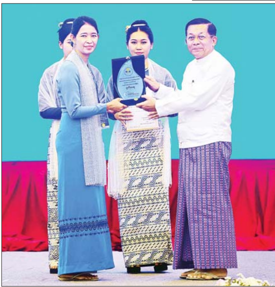
နိုင်ငံတော်စီမံအုပ်ချုပ်ရေးကောင်စီဥက္ကဋ္ဌ နိုင်ငံတော်ဝန်ကြီးချုပ် ဗိုလ်ချုပ်မှူးကြီးမင်းအောင်လှိုင် ကမ္ဘာ့ရေနေ့ ၂၀၂၅ အထိမ်းအမှတ် အလွတ်တန်းအဆင့် ဆောင်းပါးပြိုင်ပွဲတွင် ဒုတိယဆုရရှိခဲ့သူအား ဆုပေးအပ်ချီးမြှင့်စဉ်။

ဦးစွာ အမျိုးသားအဆင့် ရေအရင်းအမြစ် ကော်မတီဥက္ကဋ္ဌ နိုင်ငံတော် စီမံအုပ်ချုပ်ရေး ကောင်စီဥက္ကဋ္ဌ နိုင်ငံတော်ဝန်ကြီးချုပ်က အဖွင့်အမှာစကား ပြောကြားရာတွင် ရေသယံဇာတသည် မိမိတို့သက်ရှိအားလုံး၏ အရေးကြီးသည့် သဘာဝအရင်းအမြစ်တစ်ခု ဖြစ်သည့်အပြင် စိုက်ပျိုးရေး၊ မွေးမြူရေးအပါအဝင် အသက်မွေး ဝမ်းကျောင်းနှင့် အသက်ရှင် နေထိုင်ရေးအတွက် အလွန်အရေးကြီးသည့် အခြေခံ လိုအပ်ချက်တစ်ခုလည်း ဖြစ်ကြောင်း၊ လုံခြုံဘေးကင်းသန့်ရှင်းသည့်ရေသည် မိမိတို့လူသားများ၏ ကျန်းမာရေးကို အထောက်အကူပြုရုံသာမက သဘာဝပတ်ဝန်းကျင်ကိုလည်း ကောင်းကျိုးပြုကြောင်း၊ ထို့ကြောင့် လူတိုင်းလူတိုင်း ကျန်းမာသန့်စွမ်းစေရေး သန့်ရှင်းဘေးကင်းသည့် ရေရရှိရန် အစဉ်လိုအပ်လျက်ရှိကြောင်း။