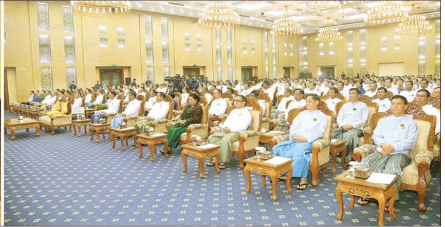
နိုင်ငံတော်စီမံအုပ်ချုပ်ရေးကောင်စီဥက္ကဋ္ဌ နိုင်ငံတော်ဝန်ကြီးချုပ် ဗိုလ်ချုပ်မှူးကြီးမင်းအောင်လှိုင် ကမ္ဘာ့ရေနေ့ ၂၀၂၅ အခမ်းအနားတွင် အမှာစကားပြောကြားစဉ်။