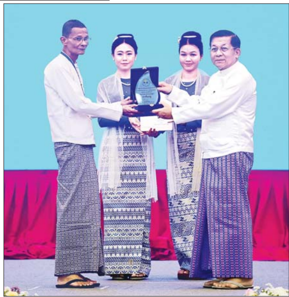
နိုင်ငံတော်စီမံအုပ်ချုပ်ရေးကောင်စီဥက္ကဋ္ဌ နိုင်ငံတော်ဝန်ကြီးချုပ် ဗိုလ်ချုပ်မှူးကြီးမင်းအောင်လှိုင် ကမ္ဘာ့ရေနေ့ ၂၀၂၅ အထိမ်းအမှတ် အလွတ်တန်းအဆင့် ဆောင်းပါးပြိုင်ပွဲတွင် တတိယဆုရရှိခဲ့သူအား ဆုပေးအပ်ချီးမြှင့်စဉ်။

ကမ္ဘာ့ရေနေ့အဖြစ်သတ်မှတ် ကမ္ဘာပေါ်ရှိ နိုင်ငံများတွင် ရေကောင်းရေသန့်၏အရေးကြီးပုံများကို အသိပညာပေးရန်၊ ရေအရင်းအမြစ်များကို ရေရှည်စနစ်တကျ အသုံးပြုနိုင်ရေး စီမံခန့်ခွဲမှုများကို အားပေးရန်၊ ကမ္ဘာ့လူဦးရေ၏ သိသာသည့်အချိုးနှင့် အရေအတွက်တစ်ခု သည် သန့်ရှင်းသောရေမရရှိသည့် ဒေသများတွင် နေထိုင်နေကြရပြီး ရေအခက်အခဲများနှင့် ကြုံတွေ့နေရမှုများကို သတိပြုမိစေရန်၊ ရေအခက်အခဲများနှင့်