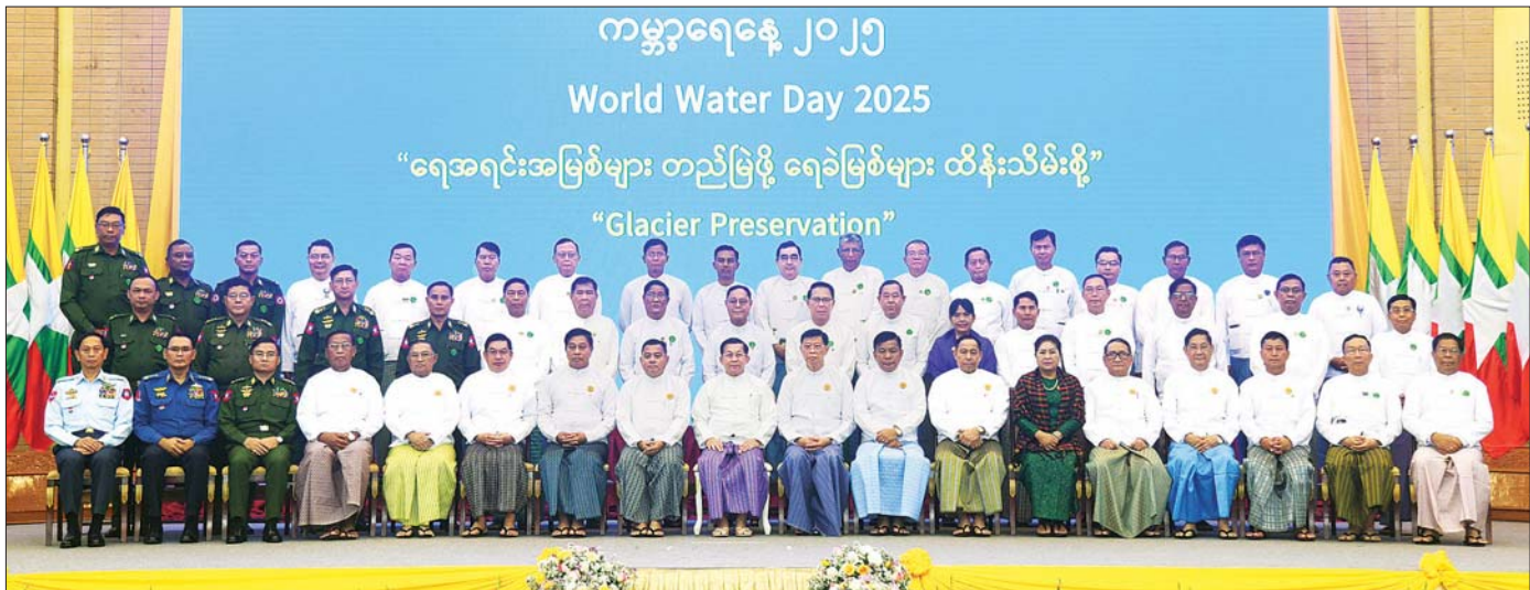
နိုင်ငံတော်စီမံအုပ်ချုပ်ရေးကောင်စီဥက္ကဋ္ဌ နိုင်ငံတော်ဝန်ကြီးချုပ် ဝိုလ်ချုပ်မှူးကြီးမင်းအောင်လှိုင်နှင့် အခမ်းအနားတက်ရောက်လာကြသူများ စုပေါင်းမှတ်တမ်းတင်ဓာတ်ပုံရိုက်စဉ်။

စာမျက်နှာ ၃ မှ ရေခဲမြစ်များသည် နွေရာသီတွင် စုစည်းဖြစ်ပေါ်သည့် ရေခဲမြစ်များဖြစ်ကြပြီး ဧရာဝတီမြစ်ရေကို တစ်စိတ်တစ်ပိုင်းအနေဖြင့် ဖြည့်တင်းပေးလျက်ရှိကြောင်း။