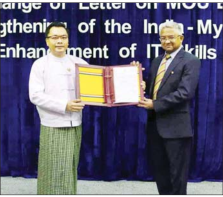
Big Data သင်တန်းများ စတင် ဖွင့်လှစ်နိုင်ခဲ့ပြီး ထွန်းသစ်စ စဉ် ၂၇ အထိ ဖွင့်လှစ်နိုင်ခဲ့ပြီး သင်တန်းဆင်း IT ပညာရှင် ၂၈၇၃ ဦးအထိ မွေးထုတ်နိုင်ခဲ့ကာ အလုပ်အကိုင်ရရှိမှု ၉၈ ရာခိုင်နှုန်း ရှိကြောင်း သိရသည်။

စွမ်းရည်များ မြှင့်တင်ခြင်းတို့တွင် ပူးပေါင်းဆောင်ရွက်မှုများကို ပိုမို မြှင့်တင်နိုင်ပြီး ဒေသတွင်း ဒစ်ဂျစ် တယ်ရပ်ဝန်း တည်ထောင်မှုနှင့် စဉ်ဆက်မပြတ် ဖွံ့ဖြိုးတိုးတက်မှု အတွက် အထောက်အကူပြုမည် ဟု ယုံကြည်မျှော်လင့်ပါကြောင်း ပြောကြားသည်။ ထို့နောက် မြန်မာနိုင်ငံဆိုင်ရာ အိန္ဒိယနိုင်ငံ သံအမတ်ကြီး H.E. Mr. Abhay Thakur က အမှာ စကားပြောကြားပြီး ဒုတိယဝန်ကြီး နှင့် အိန္ဒိယနိုင်ငံ သံအမတ်ကြီး တို့သည် MoU သက်တမ်းတိုးမြှင့် စာများကို အပြန်အလှန်လဲလှယ် ခြကြသည်။ အဆိုပါ MoU ကို ၂၀၀၇ ခုနှစ် တွင် စတင်ရေးထိုးခဲ့ပြီး ယခု သက်တမ်းတိုးမှုသည် ပဉ္စမ အကြိမ်သက်တမ်းတိုးခြင်းဖြစ်ကာ India- Myanmar Center for Enhancement of IT Skills (IMCEITS) သင်တန်းစင်တာကို သုတေသနနှင့် တီထွင်ဆန်းသစ်မှု ဦးစီးဌာနရှိ သတင်းအချက်အလက် နှင့် ဆက်သွယ်ရေးနည်းပညာ သုတေသနဌာနနှင့် အိန္ဒိယနိုင်ငံရှိ Center for Development of Advanced Computing (C-DAC) တို့ဆက်လက်ပူးပေါင်းဆောင်ရွက် သွားမည်ဖြစ်သည်။ ယင်းသင်တန်း စင်တာမှ ၂၀၂၁ ခုနှစ်တွင် AI နှင့်