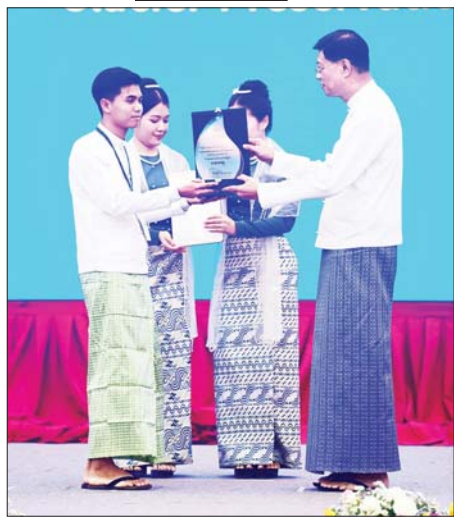
ဒုတိယဝန်ကြီးချုပ်၊ ပို့ဆောင်ရေးနှင့် ဆက်သွယ်ရေးဝန်ကြီးဌာန ပြည်ထောင်စုဝန်ကြီး ဝိုလ်ချုပ်ကြီးမြထွန်းဦး ကမ္ဘာ့ရေနေ့ ၂၀၂၅ အထိမ်းအမှတ် ဝါသနာရှင်အဆင့် ဆောင်းပါးပြိုင်ပွဲတွင် ပထမဆု ရရှိခဲ့သူအား ဆုပေးအပ်ချီးမြှင့်စဉ်။

သည့်အထိ ရေစီးနှုန်းတိုင်းတာရန်နှင့် ရေလမ်းကြောင်းအခြေအနေအပါအဝင် ရေအရင်းအမြစ်ပမာဏကို စူးစမ်းလေ့လာဆောင်ရွက်နိုင်ရေးအတွက် ရေအားအရင်းအမြစ်စူးစမ်းလေ့လာရေးအဖွဲ့ကို ၂၀၂၂ ခုနှစ် မတ်လ ၇ ရက်တွင် ဖွဲ့စည်းပေးခဲ့ကြောင်း၊ ယင်းအဖွဲ့သည်လည်း လုပ်ငန်းတာဝန်များ အကောင်အထည်ဖော်ဆောင်ရွက်လျက်ရှိပြီး ရေအားအရင်းအမြစ်စူးစမ်းလေ့လာရေး လုပ်ငန်းများ၏ တိုးတက်မှုအခြေအနေကို ပြည်ထောင်စု အစိုးရအဖွဲ့ထံ အစီရင်ခံ တင်ပြလျက်ရှိကြောင်း၊ လက်ရှိ အနေအထားတွင် ဧရာဝတီမြစ်၊ ချင်းတွင်းမြစ်တို့သည် လူတို့၏လုပ်ဆောင်ချက်ကြောင့် သောင်ပိုမှုများ များပြားလာပြီး ရေကြောင်းသွားလာရေးတွင် ကန့်သတ်ချက်များ များလာကြောင်း၊ ထို့ကြောင့် မြစ်ကြောင်းများ ထိန်းသိမ်းရေးသည် အရေးကြီးသည့် အခြေအနေရှိနေပြီး ဆောလျင်စွာ ဖြေရှင်းရန်လိုကြောင်း၊ အဓိကမြစ်များနှင့် ယင်းမြစ်များအတွင်း စီးဝင်သည့် မြစ်၊ ချောင်းများ ဘေးပတ်တွင် သဘာဝပတ်ဝန်းကျင် ထိခိုက်စေသည့်လုပ်ငန်းများကို ဒေသဆိုင်ရာ အစိုးရ၊ အုပ်ချုပ်ရေးအဖွဲ့များ၊ ကြပ်မတ်ရန်လိုကြောင်း၊ အဆိုပါမြစ်များသည် ကူးသန်းသွားလာမှုတွင် အဓိကကျခြင်း