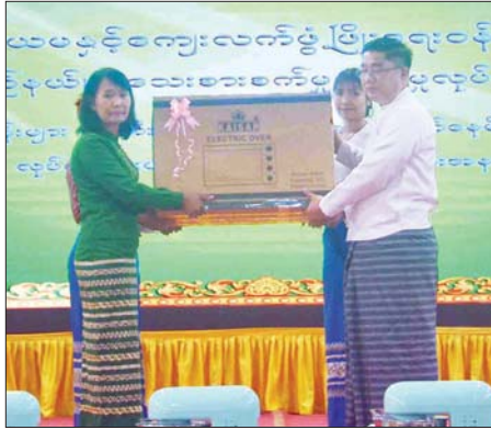
အသုံးပြု၍ မိမိတို့ သင်ယူတတ် မြောက်ခဲ့သည့် အတတ်ပညာဖြင့် ဈေးကွက်အတွင်းရှိ ကုန်ပစ္စည်း များနှင့် တန်းတူရောင်းချနိုင်ရန် အရည်အသွေးကောင်းမွန်တိုးတက်

လွိုင်ကော် မတ် ၂၂ ဦးစွာ ပြည်နယ်ဝန်ကြီးချုပ် ကယားပြည်နယ်အသေးစားစက်မှု လက်မှုလုပ်ငန်းဦးစီးဌာနမှ ၂၀၂၄-၂၀၂၅ ဘဏ္ဍာနှစ်အတွင်း အသေးစားကုန်ထုတ်လုပ်ငန်းများ ဖန်တီးပေးနိုင်ရေးနှင့် ကျေးလက် နေထိုင်မှုအဆင့်မြှင့်တင်ရေး စီမံကိန်း ဖြင့် ဖွင့်လှစ်ပြီးစီးခဲ့သည့် သင်တန်း များတွင် ထူးချွန်သင်တန်းသားများ အား လုပ်ငန်းသုံးပစ္စည်းများ ပေးအပ်ချီးမြှင့်ပွဲကို ယနေ့နေ့နံနက် က မြို့နယ်ခန်းမ၌ ကျင်းပရာ ပြည်နယ်ဝန်ကြီးချုပ် ဦးဇော်မျိုး တင်၊ ဒေသကွပ်ကဲရေးမှူး၊ ပြည်နယ် တရားသူကြီးချုပ်၊ ပြည်နယ် အစိုးရအဖွဲ့ဝင်များ၊ ပြည်နယ် / ခရိုင် / မြို့နယ်အဆင့် ဌာနဆိုင်ရာများနှင့် သင်တန်းသူ များ တက်ရောက်ကြသည်။