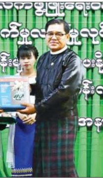
ချုပ်က ၂၀၂၄-၂၀၂၅ ဘဏ္ဍာနှစ်အတွင်း ဆောင်ရွက်လျက်ရှိသည့် အခြေခံနှင့် မွမ်းမံသင်တန်းများ