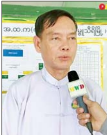
စာမျက်နှာ ၁၀ မှ