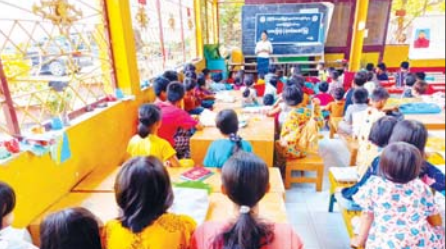
စွာ အသုံးပြုကြရေး၊ ကျောင်းစာကို ကြိုးစားကြရမည့်အပြင် ဗဟုသုတ တိုးပွားရေးအတွက် ပြင်ပစာပေများကိုပါ လေ့လာဖတ်ရှုကြရေးတို့ကို ဟောပြောဆွေးနွေးသည်။ ခရိုင် (ပြန်/ဆက်)

သထုံ မတ် ၂၂ မွန်ပြည်နယ်သထုံမြို့နယ်၌ ကျောင်းသားကျောင်းသူများ စာဖတ်ရိုက် မြှင့်တင်ရေး ဗလင်းတန်ဖွဲ့ပြီးရေးအတွက် ယမန်နေ့က သထုံမြို့ သိမ်ကုန်းရပ်ကွက်ရှိ ကြေးသွန်းရပ်ပွားတော်မြတ်ကြီးအတွင်း ဖွင့်လှစ် သင်ကြားပေးနေသည့် အခြေခံဗုဒ္ဓဘာသာယဉ်ကျေးမှုသင်တန်း၌ နယ်လှည့်စာကြည့်တိုက်ဖွင့်လှစ်ပြီး အသိပညာပေးဟောပြောခြင်း၊ နံရံကပ်စာစောင်ပြသခြင်းလုပ်ငန်းများကို ပြန်ကြားရေးနှင့် ပြည်သူ ဆက်ဆံရေးဦးစီးဌာနမှ ဝန်ထမ်းများက သွားရောက်ဆောင်ရွက်သည်။ ဦးစွာ ဓမ္မအလင်းတန်း ဗုဒ္ဓစာပြေပြန့်ပွားရေးအသင်းမှ အခြေခံ ဗုဒ္ဓဘာသာယဉ်ကျေးမှုသင်တန်း နည်းပြဆရာမတစ်ဦးက အမှာစကား ပြောကြားပြီး ခရိုင်ပြန်ကြားရေးနှင့် ပြည်သူ့ဆက်ဆံရေးဦးစီးဌာနမှ ဝန်ထမ်းများက ကျောင်းသား ကျောင်းသူများ အားလုပ်ချိန်ကို အကျိုးရှိ