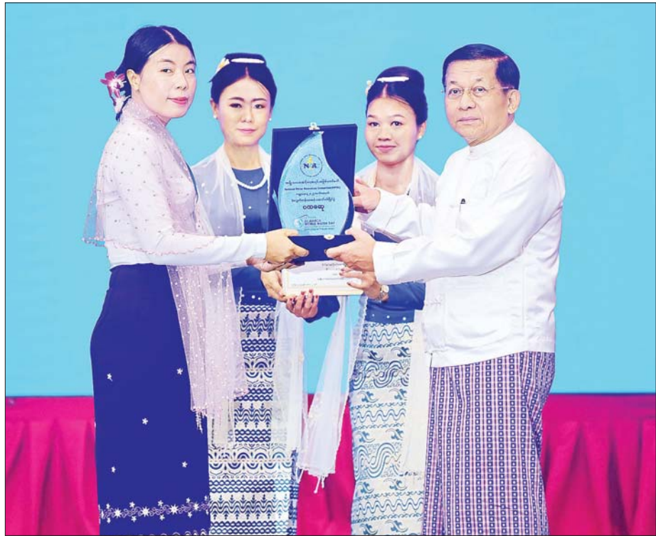
နိုင်ငံတော်စီမံအုပ်ချုပ်ရေးကောင်စီဥက္ကဋ္ဌ နိုင်ငံတော်ဝန်ကြီးချုပ် ဗိုလ်ချုပ်မှူးကြီး မင်းအောင်လှိုင် ကမ္ဘာ့ရေနေ့ ၂၀၂၅ အခမ်းအမှတ် အလွတ်တန်းအဆင့် ဆောင်းပါးပြိုင်ပွဲတွင် ပထမဆုရရှိခဲ့သူအား ဆုပေးအပ်ချီးမြှင့်စဉ်။

မိမိတို့၏ လက်ရှိနှင့်အနာဂတ် မျိုးဆက်သစ်များအတွက် နိုင်ငံ၏ရေအရင်းအမြစ်များကို ရေရှည်တည်တံ့ပြီး စနစ်တကျ၊ မျှမျှတတ အကျိုးရှိစွာ ရေရှည်အသုံးပြုသွားနိုင်ရေး ရေဆိုင်ရာစီမံခန့်ခွဲမှု ကဏ္ဍများတွင် မိမိတို့ပြည်သူများအားလုံး အတူတကွ ပူးပေါင်းဆောင်ရွက်ပေးကြရန်လို