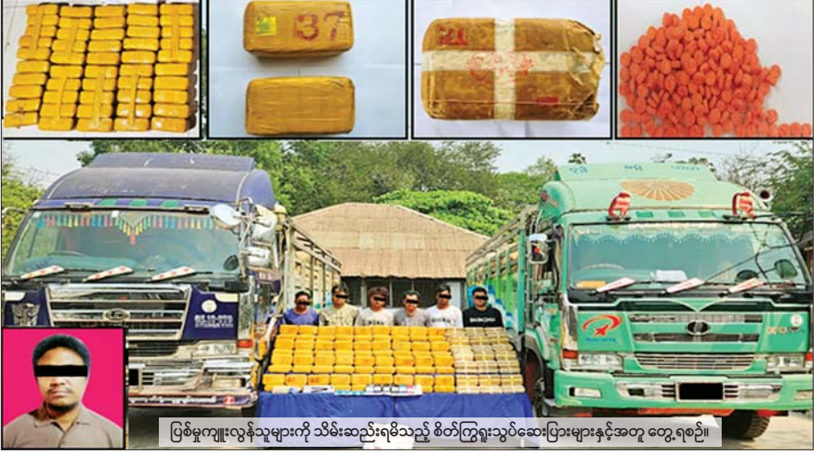
ပြစ်မှုကျူးလွန်သူများကို သိမ်းဆည်းရမိသည့် စိတ်ကြွေးသွပ်ဆေးပြားများနှင့်အတူ တွေ့ရစဉ်။