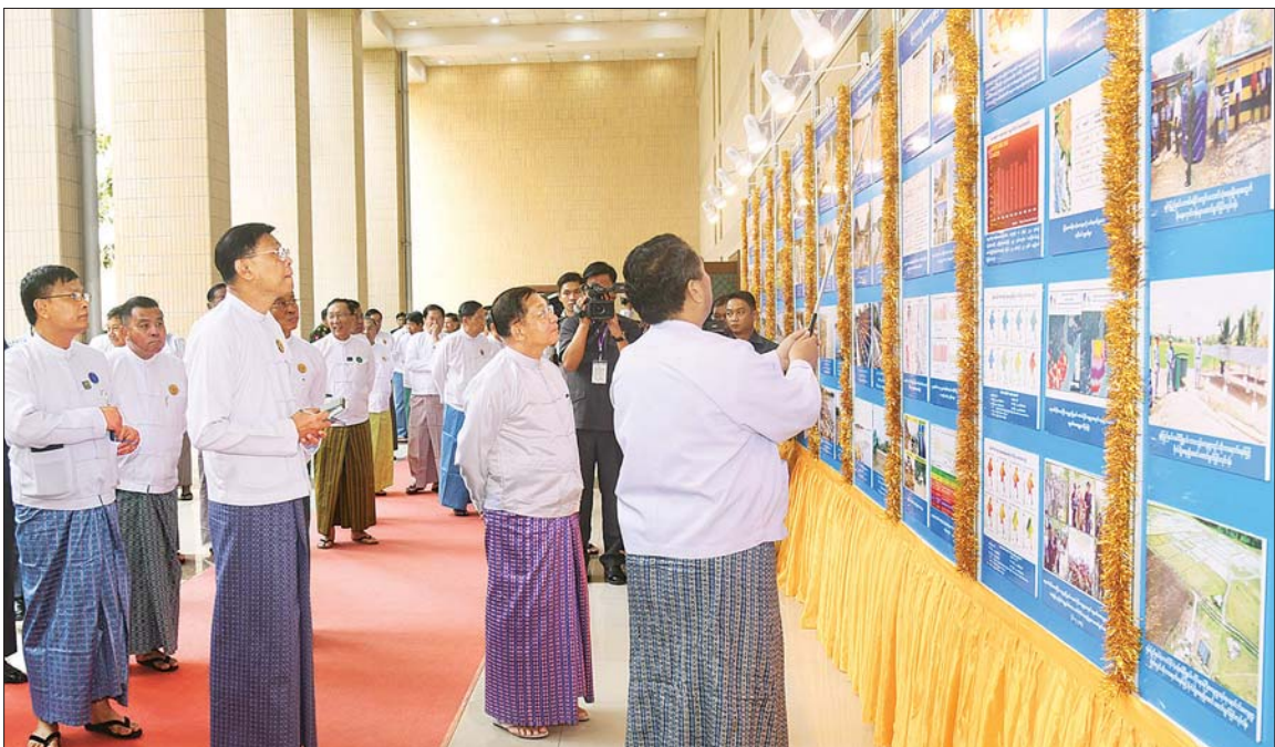
နိုင်ငံတော်စီမံအုပ်ချုပ်ရေးကောင်စီဥက္ကဋ္ဌ နိုင်ငံတော်ဝန်ကြီးချုပ် ဗိုလ်ချုပ်မှူးကြီး မင်းအောင်လှိုင် ကမ္ဘာ့ရေနေ့ ၂၀၂၅ အထိမ်းအမှတ် ဓာတ်ပုံပြခန်းများအား စိတ်ပါဝင်စားစွာ လှည့်လည်ကြည့်ရှုစဉ်။

စာမျက်နှာ ၄ မှ စီမံဆောင်ရွက်ကြရန်၊ တက္ကသိုလ် များ၊ သုတေသနစင်တာများက လည်း ရေကဏ္ဍကို မြှင့်တင်ပေးနိုင် ရေးလေ့လာမှုများ၊ အသိပညာပေး မှုများ ဆက်လက်ဆောင်ရွက်ပေး ကြရန်၊ မိမိတို့နိုင်ငံ အနာဂတ်ရေးမှ လိုစေရေး ရေကဏ္ဍကို မြှင့်တင်ရန် ရေစီမံခန့်ခွဲမှု နည်းပညာများဖြင့် ကြိုးစားမြှင့်တင်ကြရန်၊ နိုင်ငံ ၏ ရေချိုအရင်းအမြစ်များကို အထောက်အပံ့ပေးနိုင်သည့် တည်ရှိ ပြီးရေခဲတောင်များ၊ ရေခဲမြစ်များ ရေရှည်တည်မြဲစေရေး မိမိတို့ တတ်နိုင်သည့်နေရာများမှ ပါဝင် ထိန်းသိမ်းဆောင်ရွက်ပေးကြရန်၊ မိမိတို့၏လက်ရှိနှင့် အနာဂတ် မျိုးဆက်သစ်များအတွက် နိုင်ငံ၏ ရေအရင်းအမြစ်များကို ရေရှည် တည်တံ့ပြီးစနစ်တကျ မျှမျှတတ အကျိုးရှိစွာ ရေရှည်အသုံးပြုသွား နိုင်ရေး ရေဆိုင်ရာစီမံခန့်ခွဲမှု ကဏ္ဍများတွင် မိမိတို့ ပြည်သူများ အားလုံး အတူတကွ ပူးပေါင်း ဆောင်ရွက်ပေးကြရန် တိုက်တွန်း ပြောကြားလိုကြောင်း ပြောကြား သည်။