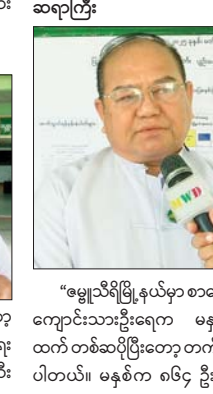
စာမျက်နှာ ၁၂ မှ