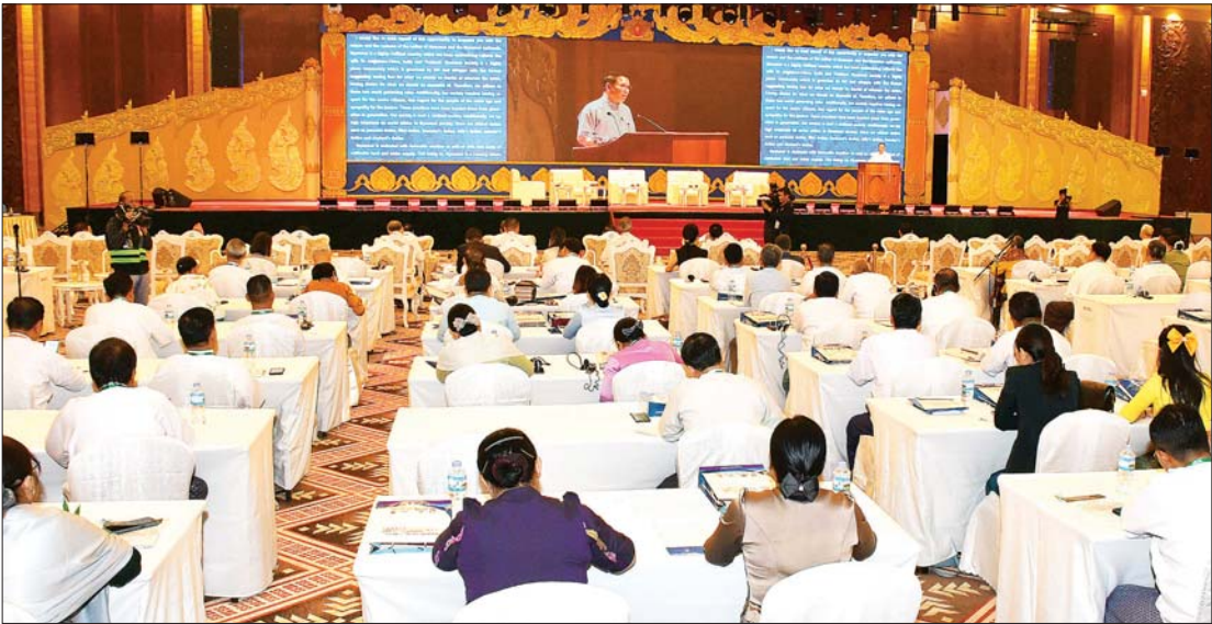
ပြည်ထောင်စုဝန်ကြီး ဦးမောင်မောင်အုန်း ၂၀၂၅အလွန် ဗဟုဝင်ရိုးကမ္ဘာတွင် မြန်မာနိုင်ငံကြုံတွေ့လာရမည့် စိန်ခေါ်မှုများနှင့် အခွင့်အလမ်းများ သုံးသပ်ဆွေးနွေးပွဲတွင် အမှာစကားပြောကြားစဉ်။

သည် နိုဂိုးချပ်ချိန်ရောက်လာပြီဖြစ်သည့် အတွက် နိုဂိုးချပ်သူများခဲ့ရခြင်း ဖြစ်ပါကြောင်း၊ အဟောင်းနေရာတွင် အသစ်များ အစားထိုးခြင်းအတိုင်း ဧကဝင်ရိုးကမ္ဘာ့အထိုင်နေရာတွင် ဗဟုဝင်ရိုး ကမ္ဘာ့အထိုင်သည် အစားထိုးဝင်ရောက်လာခဲ့ပြီ ဖြစ်ပါကြောင်း၊ အပြောင်းအလဲနှင့်အတူ လိုက်ပါမပြောင်းလဲနိုင်ပါက မွေးမှိန်ကွယ်ပျောက်သွားရသည်ဆိုသည့် ကမ္ဘာ့နိယာမအတိုင်း မိမိတို့ ဖွံ့ဖြိုးဆဲနိုင်ငံလေးများသည် ကမ္ဘာ့ရေစီးကြောင်းနှင့်အတူ လိုက်ပါပြောင်းလဲရန် မဖြစ်မနေကြိုးစားရန်ကန်ကြရမည်ဖြစ်ပါကြောင်း၊ ယခုလည်း ဧကဝင်ရိုး ကမ္ဘာ့အထိုင်နေရာတွင် အစားထိုးဝင်ရောက်လာသည့် ဗဟုဝင်ရိုး ကမ္ဘာ့အထိုင်နှင့်အတူ လိုက်ပါပြောင်းလဲရန် ကြိုးစားကြရမည်ဖြစ်ပါကြောင်း၊ မည်သို့ပင်ဖြစ်ဖြစ် မြန်မာနိုင်ငံကဲ့သို့ နိုင်ငံငယ်လေးများအနေဖြင့် ဧကဝင်ရိုးကမ္ဘာ့အထိုင်တွင် ရွေးချယ်စရာမရှိသည့် အခြေအနေမှ လွတ်မြောက်ပြီး ဗဟုဝင်ရိုးကမ္ဘာ့အထိုင်တွင် ရွေးချယ်စရာများ ပိုမိုများပြားလာသည့်အတွက် အကောင်းဘက်ကို ဦးတည်လာမည်ဟု ယုံကြည်ပါကြောင်း ပြောကြားသည်။ ဖွံ့ဖြိုးတိုးတက်လာမှုနှင့်အတူ ဗဟုဝင်ရိုးကမ္ဘာ့အထိုင်လည်း စတင်ထွက်ပေါ်လာထို့နောက် University of Fudan၊ China Academy မှ Professor Mr.Zhang Wei က ဗဟုဝင်ရိုးကမ္ဘာ့အထိုင် စီးပွားရေးပိုက်ဆံမှုများ၊ ဒုံးကျည်လက်နက်ပိုင်ဆိုင်မှုများနှင့် ခွဲခြားဆက်ဆံမှုများကို စံနှုန်းအဖြစ် သတ်မှတ်ထားခြင်းမရှိသည့်အတွက် တစ်စိတ်စွန်းမှပါဒနှင့် ဆန့်ကျင်ဘက်ဖြစ်နေပါကြောင်း၊ တရုတ်၊ ရုရှား