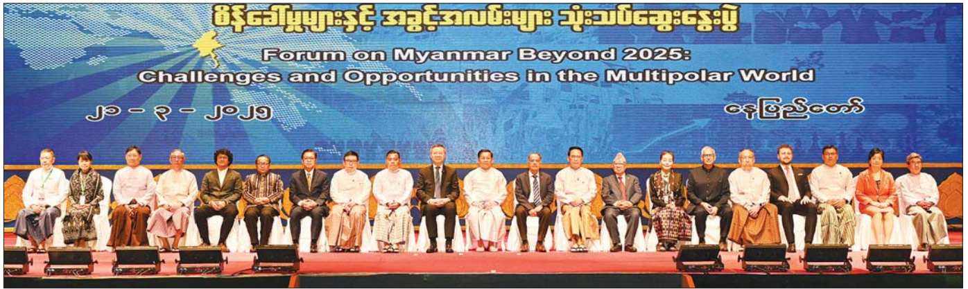
နိုင်ငံတော်စီမံအုပ်ချုပ်ရေးကောင်စီဥက္ကဋ္ဌ နိုင်ငံတော်ဝန်ကြီးချုပ် ဗိုလ်ချုပ်မှူးကြီး မင်းအောင်လှိုင်နှင့် အခမ်းအနားတက်ရောက်လာကြသူများ စုပေါင်းမှတ်တမ်းတင်ဓာတ်ပုံရိုက်စဉ်။

စာတိုက်နာ ၄ မှု ဆက်လက်၍ နိုင်ငံတော်စီမံအုပ်ချုပ်ရေးကောင်စီဥက္ကဋ္ဌ နိုင်ငံတော်ဝန်ကြီးချုပ်က ၂၀၂၅ အလွန်ဗဟုဝင်ရိုးကမ္ဘာတွင် မြန်မာနိုင်ငံကြံ့ခိုင်ရေးအတွက် စိန်ခေါ်မှုများနှင့် အခွင့်အလမ်းများ သုံးသပ်ဆွေးနွေးပွဲတွင် ပြည်ပကျော်ကြားမှုအဖြစ် ဆက်လက်ဆွေးနွေးပြောကြားရာတွင် မိမိတို့နိုင်ငံသည် တောင်နှင့်မြောက်ရပ်ကွက်များသည် နိုင်ငံတစ်ခုဖြစ်ကြောင်း၊ နိုင်ငံအတွင်း ရေချိုမြစ်ချောင်းများ ပေါများသည့်အပြင် အမျိုးအစားစုံလင်သည့် ရာသီဥတု၊ တောတောင်သဘာဝများ၊ သီးပင်စားပင်များ အမျိုးမျိုးသော သဘာဝသယံဇာတများ ပေါကြွယ်ဝပြီး ယင်းတို့သည် မိမိတို့နိုင်ငံ၏ အခွင့်အလမ်းနှင့် အားသာချက်များပင်ဖြစ်ကြောင်း၊ နိုင်ငံ၏ပင်လယ်ကမ်းရိုးတန်းအရှည်မှာ မိုင်ပေါင်း ၃၁၀၀ ကျော်ရှိပြီး ရေနက်ဆိပ်ကမ်းများနှင့် စီးပွားရေးဇုန်များကို ဆောင်ရွက်လျက်ရှိကြောင်း၊ မိမိတို့နိုင်ငံသည် ပင်လယ်ရေကြောင်းကုန်သွယ်ရေးနှင့် ပတ်သက်၍ ပထဝီဝင်အနေအထားအရ အချက်အချာကျသည့် နေရာတွင်တည်ရှိကြောင်း။