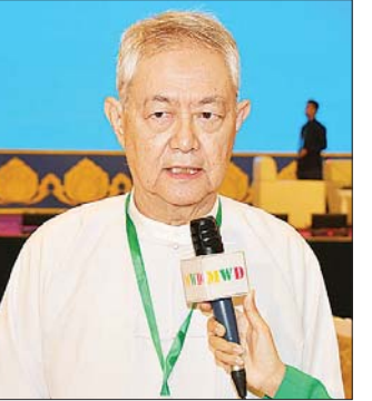
ဦးသန့်ကျော်

စာမျက်နှာ ၉ မှ နိုင်ငံတော်ဝန်ကြီးချုပ် ပြောသွားတာလည်း ရှိပါတယ်။ ကမ္ဘာကြီးမှာ ဘယ်လိုပြောင်းလဲ နေသလဲ၊ Global မှာရော၊ နောက်ပြီး ဒေသတွင်းအာဆီယံနဲ့ အာရှဒေသတွေမှာ ဘယ်လိုအပြောင်းအလဲတွေ ရှိနေသလဲ။ အဲဒီလိုပြောင်းလဲနေတဲ့ ပြောင်းလဲမှုတွေအရ မြန်မာနိုင်ငံက ဘာတွေလုပ်သင့် သလဲ။ ကျွန်မတို့ကလည်း ကမ္ဘာထဲမှာ ပါနေတာကို။ ဂလိုဘယ်တစ်ခု ဒေသတွင်းတစ်ခုနဲ့ ပြည်တွင်းတစ်ခုဆိုပြီး ကျွန်မက သုံးပိုင်းဆွေးနွေးခဲ့ပါတယ်။