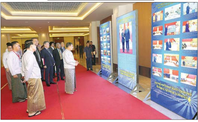
နိုင်ငံတော်စီမံအုပ်ချုပ်ရေးကောင်စီဥက္ကဋ္ဌ နိုင်ငံတော်ဝန်ကြီးချုပ် ဗိုလ်ချုပ်မှူးကြီး မင်းအောင်လှိုင် ခင်းကျင်းပြသထားသည့် မှတ်တမ်းဓာတ်ပုံများအား ကြည့်ရှုစဉ်။

မိမိတို့နိုင်ငံသည် လွတ်လပ်ရေးရပြီးကတည်းက ပြည်တွင်းလက်နက်ကိုင်ပဋိပက္ခများနှင့် ရင်ဆိုင်ခဲ့ရကြောင်း၊ မြန်မာနိုင်ငံသည် သင့်တော်သော ရာသီဥတု၊ များပြားလှသည့်စိုက်ပျိုးမြေ၊ သဘာဝသယံဇာတပေါများမှုများကြောင့် ရှေ့သမိုင်းအစဉ်ဆက်ကတည်းက အင်အားအသင့်အတင့်ရှိသည့် လူမျိုးစုများ၊ အင်အားနည်းသည့် လူမျိုးစုများ၏ ပြောင်းရွှေ့နေထိုင်ရာ၊ အခြေချနေထိုင်ရာ နယ်မြေဖြစ်ခဲ့သဖြင့် တိုင်းရင်းသားပေါင်းစုံ၊ လူမျိုးပေါင်းစုံစုစည်းနေထိုင်ရာ အမိမြေ၊ အမိနိုင်ငံတော်ဖြစ်ခဲ့ကြောင်း၊ ကိုလိုနီခေတ်၏ သွေးခွဲအုပ်ချုပ်မှုစနစ်အရ စုစည်းနေထိုင်ခဲ့သည့် တိုင်းရင်းသားများ၏ ညီညွတ်မှုသည် ပြိုကွဲခဲ့ရကြောင်း၊ ထိုသို့သွေးခွဲအုပ်ချုပ်မှုအဖြစ်များ၏နောက်တွင် လက်နက်ကိုင်ပဋိပက္ခများကို နယ်ချဲ့ကိုလိုနီများနှင့် အပေါင်းအပါများကပင် ဆက်လက်အားပေးထောက်ပံ့ခဲ့ကြောင်း၊ ထို့အပြင်