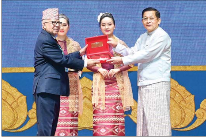
နိုင်ငံတော်စီမံအုပ်ချုပ်ရေးကောင်စီဥက္ကဋ္ဌ နိုင်ငံတော်ဝန်ကြီးချုပ် ဗိုလ်ချုပ်မှူးကြီး မင်းအောင်လှိုင် ပြည်ပမှ လာရောက်ဆွေးနွေးကြသည့် ပညာရှင်များအား အထိမ်းအမှတ်တံဆိပ်များ ပေးအပ်စဉ်။