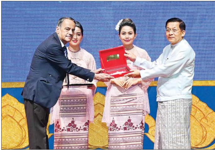
နိုင်ငံတော်စီမံအုပ်ချုပ်ရေးကောင်စီဥက္ကဋ္ဌ နိုင်ငံတော်ဝန်ကြီးချုပ် ဗိုလ်ချုပ်မှူးကြီး မင်းအောင်လှိုင် ပြည်ပမှ လာရောက်ဆွေးနွေးကြသည့် ပညာရှင်များအား အထိမ်းအမှတ်တံဆိပ်များ ပေးအပ်စဉ်။