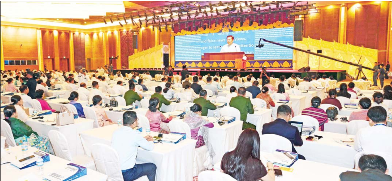
နိုင်ငံတော်စီမံအုပ်ချုပ်ရေးကောင်စီဥက္ကဋ္ဌ နိုင်ငံတော်ဝန်ကြီးချုပ် ဗိုလ်ချုပ်မှူးကြီး မင်းအောင်လှိုင် ၂၀၂၅ အလွန် ဗဟုဝင်ရိုးကမ္ဘာတွင် မြန်မာနိုင်ငံကြုံတွေ့လာရမည့် စိန်ခေါ်မှုများနှင့် အခွင့်အလမ်းများ သုံးသပ် ဆွေးနွေးပွဲ ဖွင့်ပွဲအခမ်းအနားတွင် အမှာစကားပြောကြားစဉ်။