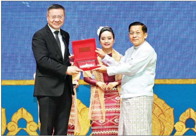
နိုင်ငံတော်စီမံအုပ်ချုပ်ရေးကောင်စီဥက္ကဋ္ဌ နိုင်ငံတော်ဝန်ကြီးချုပ် ဗိုလ်ချုပ်မှူးကြီး မင်းအောင်လှိုင် ပြည်ပမှ လာရောက်ဆွေးနွေးကြသည့် ပညာရှင်များအား အထိမ်းအမှတ်တံဆိပ်များ ပေးအပ်စဉ်။

( ၃-၉-၂၀၂၄ ရက်နေ့တွင် နိုင်ငံတော်စီမံအုပ်ချုပ်ရေးကောင်စီဥက္ကဋ္ဌ နိုင်ငံတော်ဝန်ကြီးချုပ် ဗိုလ်ချုပ်မှူးကြီး မင်းအောင်လှိုင် ရှမ်းပြည်နယ်အစိုးရအဖွဲ့ဝင်များ၊ ပြည်နယ်နှင့် ခရိုင်အဆင့်ဌာနဆိုင်ရာတာဝန်ရှိသူများအား ပြောကြားသည့် အမှာစကားမှ ကောက်နုတ်ချက် )