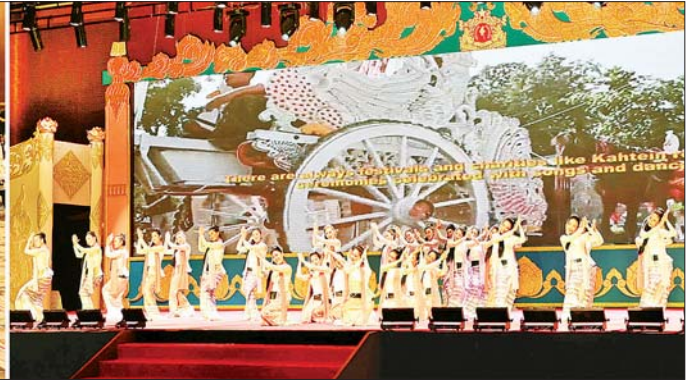
နိုင်ငံတော်စီမံအုပ်ချုပ်ရေးကောင်စီဥက္ကဋ္ဌ နိုင်ငံတော်ဝန်ကြီးချုပ် ဗိုလ်ချုပ်မှူးကြီး မင်းအောင်လှိုင်နှင့် အခမ်းအနားတက်ရောက်လာကြသူများ အနုပညာဦးစီးဌာနမှ အနုပညာရှင်များ၏ သီဆိုဂြုဟေဇာတီပြဇာတ်ဆက်မှုကို ကြည့်ရှုအားပေးကြစဉ်။

စာမျက်နှာ ၃ မှ ထိန်းညှိလာစေကြောင်း၊ တစ်နည်းအားဖြင့် မည်သည့် နိုင်ငံ တစ်နိုင်ငံတည်းကမှ ကမ္ဘာလုံးဆိုင်ရာ ရလဒ် တစ်ခုကို ၎င်းကိုယ်ပိုင်ဖန်တီး၍ မရနိုင်တော့သည်ကို အားလုံးက သိမြင်နေကြပြီဖြစ်ကြောင်း၊ ယနေ့ အချိန်တွင် နိုင်ငံတကာပြဿနာများကို ပိုမိုစုပေါင်း ပါဝင်သည့် နိုင်ငံစုံအဖွဲ့အစည်းများ၏ ပူးပေါင်း ကြိုးပမ်းအားထုတ်မှုများမှတစ်ဆင့် ဖြေရှင်းလာနေ ကြသည်ကို တွေ့ရမည်ဖြစ်ကြောင်း၊ တစ်ဖက်တွင် လည်း ဩဇာပါဝင်မှုရှိနေကြသည့် နိုင်ငံများ သည် ပြဿနာရပ်များကို ဖြေရှင်းနိုင်ရန်ထက် အပြိုင် အဆိုင် ဩဇာလွှမ်းမိုးရန် ကြိုးပမ်းလာနေကြသည်ကို လည်း တွေ့နေကြရကြောင်း။