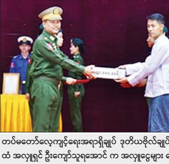
တပ်မတော်လေ့ကျင့်ရေးအရာရှိချုပ် ဒုတိယဗိုလ်ချုပ်ကြီး ထိန်ဝင်းထံ အလှူရှင် ဦးကျော်သူရအောင် က အလှူငွေများ ပေးအပ်စဉ်။

ထို့နောက် အလှူရှင်များကိုယ်စား အလှူရှင်တစ်ဦးက လှူဒါန်းခြင်းနှင့် ပတ်သက်၍ ရှင်းလင်းပြောကြားပြီး တပ်မတော်နေ့ကျင်းပရေး ဦးစီးကော်မတီဥက္ကဋ္ဌ တပ်မတော်လေ့ကျင့်ရေးအရာရှိချုပ် ဒုတိယဗိုလ်ချုပ်ကြီး ထိန်ဝင်းက ကျေးဇူးတင်စကားပြန်လည်ပြောကြားသည်။ ဂုဏ်ပြုအလှူငွေပေးအပ်လှူဒါန်းပွဲအပြီးတွင် ညွှန်ကြားကွပ်ကဲရေးမှူး(ကြည်း၊ ရေလေ) ဗိုလ်ချုပ်ကြီး ကျော်စွာလင်း၊ တပ်မတော်နေ့ကျင်းပရေးဦးစီးကော်မတီဥက္ကဋ္ဌနှင့် အဖွဲ့ဝင်များသည် စစ်ရေးပြစစ်ကြောင်းများမှ အရာရှိ စစ်သည်များ၏ စားရိပ်သာနှင့် စားချက်ဆောင်များကို လှည့်ကော်းကူးစစ်ဆေးနိုင်ဆောင်ရွက်မည်ဟု ဆိုကြားရသည်။ အခမ်းအနား အပြီးတွင် ညွှန်ကြားကွပ်ကဲရေးမှူး(ကြည်း၊ ရေလေ)ဗိုလ်ချုပ်ကြီး ကျော်စွာလင်း၊ တပ်မတော်နေ့ကျင်းပရေးဦးစီးကော်မတီဥက္ကဋ္ဌနှင့် အဖွဲ့ဝင်များသည် စစ်ရေးပြစစ်ကြောင်းများမှ အရာရှိ စစ်သည်များ၏ စားရိပ်သာနှင့် စားချက်ဆောင်များကို လှည့်ကော်းကူးစစ်ဆေးနိုင်ဆောင်ရွက်မည်ဟု ဆိုကြားရသည်။