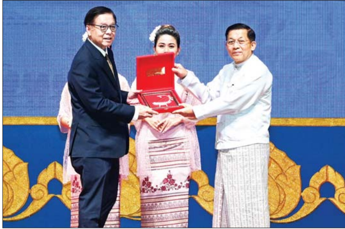
နိုင်ငံတော်စီမံအုပ်ချုပ်ရေးကောင်စီဥက္ကဋ္ဌ နိုင်ငံတော်ဝန်ကြီးချုပ် ဗိုလ်ချုပ်မှူးကြီး မင်းအောင်လှိုင် ပြည်ပမှ လာရောက်ဆွေးနွေးကြသည့် ပညာရှင်များအား အထိမ်းအမှတ်တံဆိပ်များ ပေးအပ်စဉ်။

၂ ရှေ့ဖိုးမှ အဆိုပါ အခမ်းအနားသို့ ကောင်စီတွဲဖက်အတွင်း ရှေးမှူး ဗိုလ်ချုပ်ကြီး ရဲဝင်းဦး၊ ကောင်စီအဖွဲ့ဝင်များ၊ ပြည်ထောင်စုဝန်ကြီးများနှင့် ပြည်ထောင်စုအဆင့် ပုဂ္ဂိုလ်များ၊ မြန်မာနိုင်ငံဆိုင်ရာ နိုင်ငံခြားသံရုံးများမှ သံအမတ်ကြီးများနှင့် တာဝန်ရှိသူများ၊ နေပြည်တော် ကောင်စီဥက္ကဋ္ဌ၊ ကာကွယ်ရေးဦးစီးချုပ်မှူးမှ အဆင့် မြင့်တပ်မတော်အရာရှိကြီးများ၊ ဒုတိယဝန်ကြီးများ၊ နိုင်ငံတကာမှ ပထဝီနိုင်ငံရေးနှင့် ပထဝီစီးပွားရေး ဆိုင်ရာ ကျွမ်းကျင်ပညာရှင်များ၊ နိုင်ငံရေးပါတီများ မှ တာဝန်ရှိသူများ၊ ပြည်တွင်းပြည်ပ ပညာရှင်များ၊ ဝန်ကြီးဌာနများမှ တာဝန်ရှိသူများ၊ စစ်ဘက်နှင့် နယ်ဘက်တာဝန်ရှိသူများမှ နိုင်ငံတကာဆက်ဆံရေး ဌာနများရှိ ဆရာ၊ ဆရာမများနှင့် လေ့လာသူသံ သူများ တက်ရောက်ကြသည်။ ဦးစွာ ပြည်ပပညာရှင်များအား တစ်ဦးချင်း