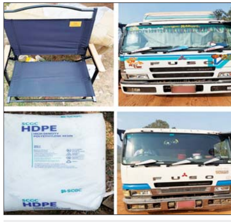
ကရင်ပြည်နယ်၌ ဖမ်းဆီးရမိမှု။

ထို့အတူ ပဲခူးတိုင်းဒေသကြီး တရားမဝင်ကုန်သွယ်မှုတိုက်ဖျက်ရေးအထူးအဖွဲ့၏ စီမံခန့်ခွဲမှုဖြင့် တာဝန်ကျပူးပေါင်းအဖွဲ့များက စစ်ဆေးမှုများဆောင်ရွက်ခဲ့ရာ ပဲခူးခရိုင်အတွင်း၌ တရားမဝင်ကုန်သွင်း ၅ ဒသမ ၀၁၁ တန်၊ အခြားသစ် ၃ ဒသမ ၆၇၅ တန် စုစုပေါင်း ခန့်မှန်းတန်ဖိုးငွေကျပ် ၆၉၀၉၃၈၄ ကို ဖမ်းဆီးရမိခဲ့ပြီး သစ်တောဥပဒေနှင့်အညီ ဖမ်းဆီးအရေးယူဆောင်ရွက်လျက်ရှိသည်။ ထို့အတူ မန္တလေးတိုင်းဒေသကြီး တရားမဝင်ကုန်သွယ်မှုတိုက်ဖျက်ရေးအထူးအဖွဲ့၏ စီမံခန့်ခွဲမှုဖြင့် တာဝန်ကျပူးပေါင်းအဖွဲ့များက စစ်ဆေးမှုများ ဆောင်ရွက်ခဲ့ရာ ပျော်ဘွယ်မြို့နယ်၊ အမရပူရမြို့နယ်၊ သာစည်မြို့နယ်၊ ဝမ်းတွင်းမြို့နယ်နှင့် အောင်မြေသာစံမြို့နယ်တို့၌ တရားမဝင်စီးသွေး ၃၇ ဒသမ ၇၈၆ တန်နှင့် Toyota Townace မော်တော်ယာဉ်တစ်စီး ခန့်မှန်းတန်ဖိုးငွေကျပ် ၂၅၈၇၄၃၂ ကိုလည်းကောင်း၊ ရမည်းသင်းမြို့နယ်၊ ပျော်ဘွယ်မြို့နယ်နှင့် သာစည်မြို့နယ်တို့၌ တရားမဝင်အခြားသစ် ၁ ဒသမ ၂၅၇ တန် (ခန့်မှန်းတန်ဖိုးငွေကျပ်