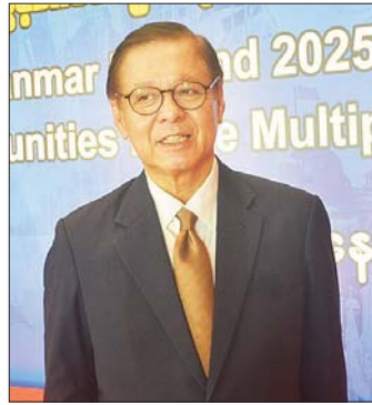
Mr. Sihasak Phuangketkeow