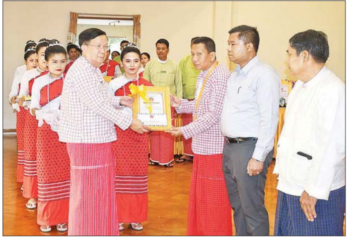
နိုင်ငံတော်စီမံအုပ်ချုပ်ရေးကောင်စီ အတွင်းရေးမှူး၊ ဗိုလ်ချုပ်ကြီးအောင်လင်းဒွေး (၅၁)နှစ်မြောက် မွန်ပြည်နယ်နေ့အထိမ်းအမှတ် ပြည်နယ်ဂုဏ်ထူးဆောင်ဆု ပေးအပ်ချီးမြှင့်စဉ်။

အခမ်းအနားသို့ တက်ရောက်ကြသည်။ အခမ်းအနားတွင် ပြည်နယ်ဝန်ကြီးချုပ် ဦးအောင်ကြည်သိန်းက ဂုဏ်ပြုစကားပြောကြားသည်။ ဆုများပေးအပ်ချီးမြှင့်ထိုနေ့က နိုင်ငံတော်စီမံအုပ်ချုပ်ရေးကောင်စီ အတွင်းရေးမှူး၊ ဗိုလ်ချုပ်ကြီးအောင်လင်းဒွေးနှင့် ကောင်စီအဖွဲ့ဝင်များက ပြည်နယ်ဂုဏ်ထူးဆောင် ထူးချွန်ဆုများဖြစ်ကြသည့် စီးပွားရေးထူးချွန်မှု၊ ဂုဏ်ထူးဆောင်ဆု၊ စိုက်ပျိုးရေးထူးချွန်မှု၊ ဂုဏ်ထူးဆောင်ဆု၊ မွေးမြူရေးထူးချွန်မှု၊ ဂုဏ်ထူးဆောင်ဆု၊ စက်မှုလက်မှုထူးချွန်မှု၊ ဂုဏ်ထူးဆောင်ဆု၊ စီမံခန့်ခွဲရေးထူးချွန်မှု၊ ဂုဏ်ထူးဆောင်ဆု၊ ဝန်ဆောင်မှုထူးချွန်မှု၊ ဂုဏ်ထူးဆောင်ဆုနှင့် လူမှုရေးထူးချွန်မှု၊ ဂုဏ်ထူးဆောင်ဆု ရရှိသူများကို ဆုများပေးအပ်ချီးမြှင့်ပြီး ဆုရရှိသူများနှင့်အတူ မှတ်တမ်းတင်ဓာတ်ပုံရိုက်ကြသည်။