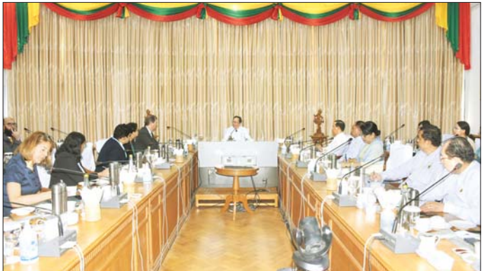
ဝန်ကြီး၊ ညွှန်ကြားရေးမှူးချုပ်များ၊ မြန်မာနိုင်ငံ များ၊ တာဝန်ရှိသူများ တက်ရောက်ကြကြောင်း ဆိုင်ရာ WHO ရုံးနှင့် UNICEF ရုံးများမှ ကိုယ်စားလှယ် သတင်းရရှိသည်။ သတင်းစဉ်

တွေ့ဆုံစဉ် ကျန်းမာရေးဝန်ကြီးဌာနအနေဖြင့် ၂၀၂၄ ခုနှစ်အတွင်း မြန်မာနိုင်ငံတစ်ဝန်း ကလေးငယ်များအား ကာကွယ်ဆေးထိုးလုပ်ငန်းများ ဆောင်ရွက်ရာတွင် ကာကွယ်ဆေးလွှမ်းခြုံမှုရာခိုင်နှုန်း ၇၅ ရာခိုင်နှုန်းကျော် အောင်မြင်မှုရရှိခဲ့ပြီး ကူးစက်ရောဂါများ ကပ်ရောဂါအသွင်ပြစ်ပွားမှုမရှိအောင် ဆောင်ရွက်နိုင်ခဲ့မှု၊ ဝေးလံခက်ခဲသောဒေသများရှိ ကလေးငယ်များနှင့် အကြောင်းအမျိုးမျိုးကြောင့် ကာကွယ်ဆေးမရရှိသည့် ကလေးငယ်များအား အပိုလိုက်ကာကွယ်ဆေးထိုးလုပ်ငန်း၊ ထပ်ဆောင်းကာကွယ်ဆေးထိုးလုပ်ငန်းနှင့် တုံ့ပြန်ကာကွယ်ဆေးထိုးလုပ်ငန်း အစရှိသည့်တို့ဖြင့် အောင်မြင်စွာ အကောင်အထည်ဆွေးနွေးပွဲသို့ ကျန်းမာရေးဝန်ကြီးဌာန ဒုတိယ