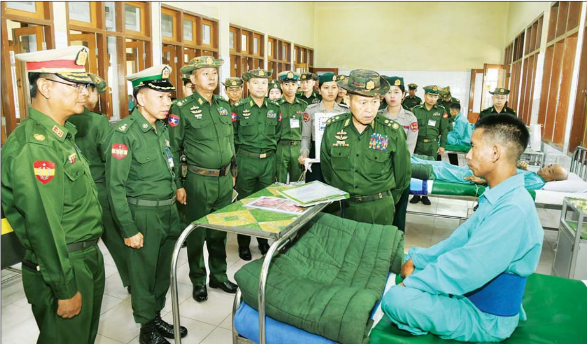
နိုင်ငံတော်စီမံအုပ်ချုပ်ရေးကောင်စီ ဒုတိယဥက္ကဋ္ဌ ဒုတိယတပ်မတော်ကာကွယ်ရေးဦးစီးချုပ် ကာကွယ်ရေးဦးစီးချုပ်(ကြည်း) ဒုတိယဗိုလ်ချုပ်မှူးကြီးစိုးဝင်း ရှမ်းပြည်နယ် (တောင်ပိုင်း) အောင်ပန်းမြို့ရှိ တပ်မတော်ဆေးရုံ၌ တက်ရောက်ကုသမှုခံယူလျက်ရှိသည့် တပ်ဖွဲ့ဝင်များအား အားပေးစကား ပြောကြားစဉ်။

နေပြည်တော် မတ် ၁၉ နိုင်ငံတော် စီမံအုပ်ချုပ်ရေး ကောင်စီ ဒုတိယဥက္ကဋ္ဌ ဒုတိယ တပ်မတော်ကာကွယ်ရေးဦးစီးချုပ် ကာကွယ်ရေးဦးစီးချုပ် (ကြည်း) ဒုတိယဗိုလ်ချုပ်မှူးကြီး စိုးဝင်း သည် ရှမ်းပြည်နယ် ဝန်ကြီးချုပ် ဦးအောင်အောင်၊ ကာကွယ်ရေး ဦးစီးချုပ်ရုံးမှ တပ်မတော်အရာရှိ ကြီးများ၊ အရှေ့ပိုင်းတိုင်းစစ်ဌာန ချုပ် တိုင်းမှူးနှင့် တာဝန်ရှိသူများ လိုက်ပါလျက် ယနေ့ နံနက်ပိုင်း တွင် ရှမ်းပြည်နယ် (တောင်ပိုင်း) အောင်ပန်းမြို့ရှိ တပ်မတော် ဆေးရုံ၌ တက်ရောက်ကုသမှု ခံယူလျက်ရှိသည့်အရာရှိ စစ်သည် များနှင့် ပြည်သူ့စစ်(ဌာန) တပ်ဖွဲ့ ဝင်များအား သွားရောက်ကြည့်ရှု အားပေးစကား ပြောကြားသည်။ ဦးစွာ နိုင်ငံတော်စီမံအုပ်ချုပ် ရေးကောင်စီဒုတိယဥက္ကဋ္ဌ ဒုတိယ တပ်မတော်ကာကွယ်ရေးဦးစီးချုပ် ကာကွယ်ရေးဦးစီးချုပ် (ကြည်း) နှင့်အဖွဲ့ဝင်များသည် အောင်ပန်း မြို့ရှိ စာမျက်နှာ ၃ ကော်လံ ၁