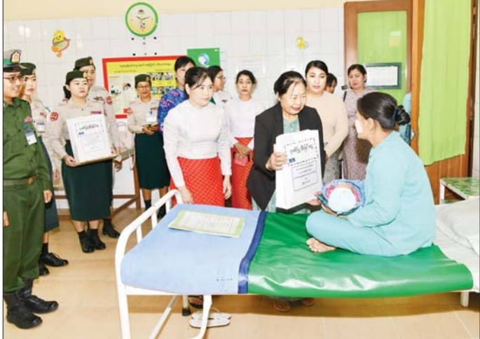
နိုင်ငံတော်စီမံအုပ်ချုပ်ရေးကောင်စီ ဒုတိယဥက္ကဋ္ဌ ဒုတိယတပ်မတော်ကာကွယ်ရေးဦးစီးချုပ် ကာကွယ်ရေး ဦးစီးချုပ် (ကြည်း) ဒုတိယဗိုလ်ချုပ်မှူးကြီးစိုးဝင်း၏ ဇနီး ဒေါ်သန်းသန်းနှင့် အမျိုးသမီးနှင့် ကလေးကုသ ဆောင်၌ ဆေးကုသလျက်ရှိသည့် အမျိုးသမီးတစ်ဦးအား စားသောက်ဖွယ်ရာများ ပေးအပ်စဉ်။