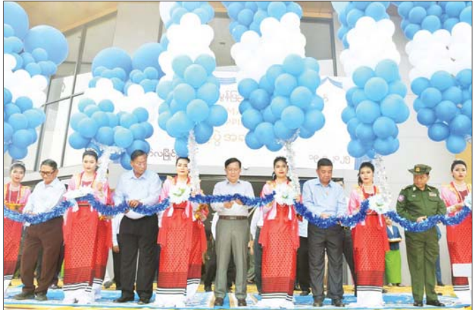
နိုင်ငံတော်စီမံအုပ်ချုပ်ရေးကောင်စီ အတွင်းရေးမှူး၊ ဗိုလ်ချုပ်ကြီးအောင်လင်းဒွေးနှင့် အဖွဲ့ဝင်များ မွန်ပြည်နယ်နေ့အထိမ်းအမှတ် မြိုင်ရတနာငါးထပ်ရွေးကို ဖဲကြီးပြတ် ဖွင့်လှစ်ပေးစဉ်။