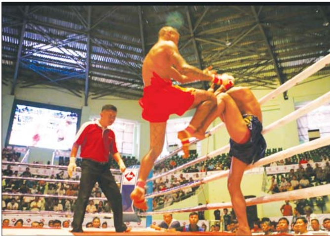
ရိုးရာလက်ဝှေ့ကစားသမား နှစ်ဦး ယှဉ်ပြိုင်ထိုးသတ်နေမှုကို တွေ့ရစဉ်။