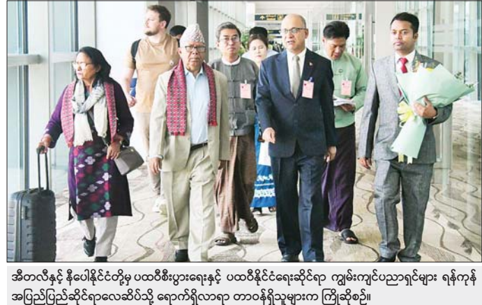
အီတလီနှင့် နိုပေါနိုင်ငံတို့မှ ပထဝီစီးပွားရေးနှင့် ပထဝီနိုင်ငံရေးဆိုင်ရာ ကျွမ်းကျင်ပညာရှင်များ ရန်ကုန်အပြည်ပြည်ဆိုင်ရာလေဆိပ်သို့ ရောက်ရှိလာရာ တာဝန်ရှိသူများက ကြိုဆိုစဉ်။

ဖော်ညွှန်းရေးအဖွဲ့ (Myanmar Narrative Think Tank) တို့မှ တာဝန်ရှိသူများက ရန်ကုန်အပြည်ပြည်ဆိုင်ရာလေဆိပ်၌ ကြိုဆိုကြသည်။ ညနေပိုင်းတွင် အဆိုပါအဖွဲ့သည် ရွှေတိဂုံစေတီတော်မြတ်ကြီးသို့ သွားရောက်ဖူးမြော်လေ့လာကြသည်။ “၂၀၂၅ အလွန် ဗဟုဝင်ရိုးကမ္ဘာတွင် မြန်မာနိုင်ငံကြုံတွေ့လာရမည့် စိန်ခေါ်မှုများနှင့် အခွင့်အလမ်းများ” သုံးသပ်ဆွေးနွေးပွဲကို မတ် ၂၀ ရက်တွင် နေပြည်တော်ရှိ မြန်မာအပြည်ပြည်ဆိုင်ရာ ကွန်ပဏီလီမိတက် (MICC-1) ၌ ကျင်းပသွားမည်ဖြစ်ပြီး တရုတ်၊ ရုရှား၊ အိန္ဒိယ၊ ဂျပန်၊ ထိုင်း၊ အီတလီ၊ နိုပေါနိုင်ငံတို့မှ ပထဝီစီးပွားရေးနှင့် ပထဝီနိုင်ငံရေးဆိုင်ရာ ကျွမ်းကျင်ပညာရှင်များနှင့် ပြည်တွင်းမှ ပညာရှင်များ ပါဝင်ဆွေးနွေးကြမည်ဖြစ်ကြောင်း သိရသည်။ သတင်းစဉ်