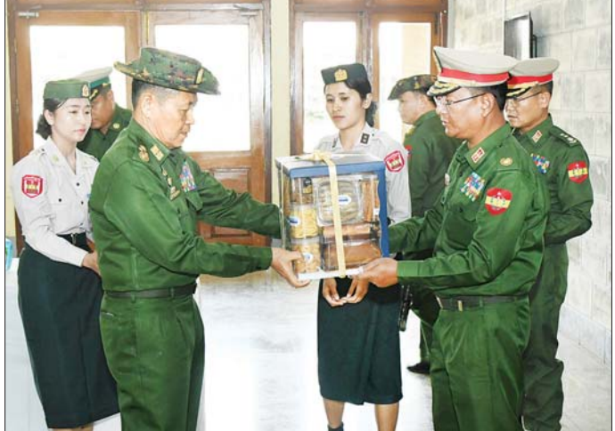
နိုင်ငံတော်စီမံအုပ်ချုပ်ရေးကောင်စီ ဒုတိယဥက္ကဋ္ဌ ဒုတိယတပ်မတော်ကာကွယ်ရေးဦးစီးချုပ် ကာကွယ်ရေး ဦးစီးချုပ် (ကြည်း) ဒုတိယဗိုလ်ချုပ်မှူးကြီးစိုးဝင်း ဆေးရုံတွင် တာဝန်ထမ်းဆောင်လျက်ရှိသည့် ကျန်းမာ ရေး ဝန်ထမ်းများအတွက် လက်ဆောင်ပစ္စည်းများ ပေးအပ်စဉ်။

များ ပေးအပ်သည်။ ထို့နောက် နိုင်ငံတော်စီမံ အုပ်ချုပ်ရေးကောင်စီ ဒုတိယ ဥက္ကဋ္ဌ ဒုတိယတပ်မတော်ကာကွယ် ရေးဦးစီးချုပ် ကာကွယ်ရေးဦးစီး ချုပ် (ကြည်း)သည် ဆေးရုံတွင် တာဝန် ထမ်းဆောင်လျက်ရှိသည့် ငွေများကို ပေးအပ်ရာ တာဝန်ရှိသူ များက လက်ခံရယူခဲ့ကြကြောင်း သတင်းရရှိသည်။ သတင်းစဉ်