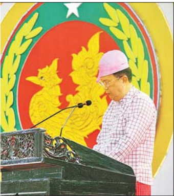
နိုင်ငံတော်စီမံအုပ်ချုပ်ရေးကောင်စီ အတွင်းရေးမှူး၊ ဗိုလ်ချုပ်ကြီးအောင်လင်းဒွေး နိုင်ငံတော်စီမံအုပ်ချုပ်ရေးကောင်စီဥက္ကဋ္ဌ နိုင်ငံတော်ဝန်ကြီးချုပ် ဗိုလ်ချုပ်မှူးကြီး သတိုးမဟာသရေစည်သူ သတိုးသိရီသုဓမ္မ မင်းအောင်လှိုင်ထံမှ ပေးပို့သည့် ၂၀၂၅ ခုနှစ် (၅၁)နှစ်မြောက် မွန်ပြည်နယ်နေ့အထိမ်းအမှတ် သဝဏ်လွှာဖတ်ကြားစဉ်။

အား အလေးပြုကြသည်။ သဝဏ်လွှာဖတ်ကြား ထိုနေ့က နိုင်ငံတော်စီမံအုပ်ချုပ်ရေးကောင်စီ ဥက္ကဋ္ဌ