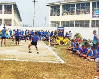
အဖွဲ့၏ ခရီးစဉ်အတွင်း စစ်ဆေး ကလည်းကောင်း ညှဉ်းပန်း နှိပ်စက်မှု ရှိ မရှိ တို့ကို မေးမြန်းခဲ့ ကို သင့်လျော်သကဲ့သို့ ဆောင်ရွက် ပေးနိုင်ရေးအတွက် သက်ဆိုင်ရာ ဌာနသို့ ကော်မရှင်ဥပဒေနှင့်အညီ ရဖွယ် စာအုပ်စာပေများကို အကြံပြု ပေးပို့သွားမည်ဖြစ် ကောင်း သိရပါသည်။ သတင်းစဉ်

ထို့အတူ သီးခြားလွတ်လပ်စွာ တွေ့ဆုံခွင့် တောင်းခံသူ အကျဉ်း သား အကျဉ်းသူ၊ အချုပ်သား အချုပ်သူ စုစုပေါင်း ၃၁ ဦးကို သီးခြားတွေ့ဆုံပြီး ယင်းတို့၏ တင်ပြချက်များကို မေးမြန်း မှတ်တမ်းတင်သည်။ ထို့နောက် ထောင်ဝင်စာ လာရောက်တွေ့ဆုံ သော မိသားစုဝင်များကို ရင်းရင်း နီးနီး တွေ့ဆုံကာ ၎င်းတို့တွင်