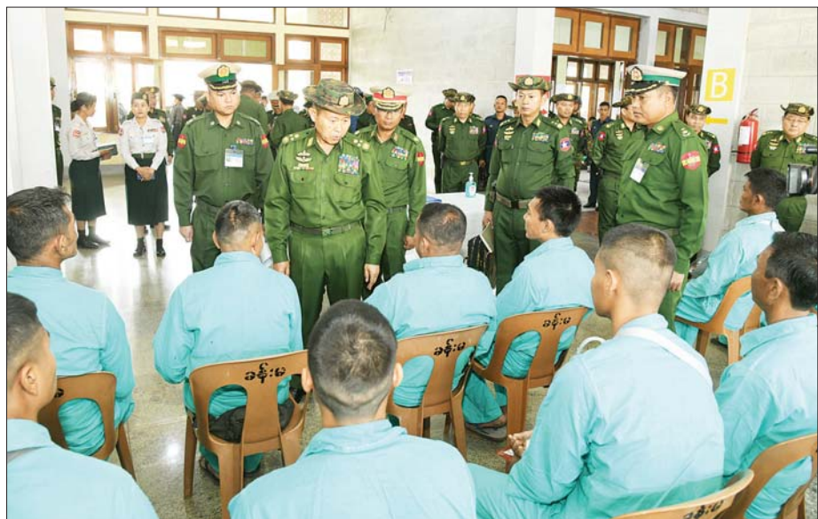
နိုင်ငံတော်စီမံအုပ်ချုပ်ရေးကောင်စီ ဒုတိယဥက္ကဋ္ဌ ဒုတိယတပ်မတော်ကာကွယ်ရေးဦးစီးချုပ် ကာကွယ်ရေးဦးစီးချုပ် (ကြည်း) ဒုတိယ ဗိုလ်ချုပ်မှူးကြီးစိုးဝင်း နိုင်ငံတော်ကာကွယ်ရေးနှင့် လုံခြုံရေးတာဝန်များကို ထမ်းဆောင်စဉ် ထိခိုက်ဒဏ်ရာရရှိခဲ့ကြသည့် အရာရှိ၊ စစ်သည် များနှင့် ပြည်သူစစ်(ဌာနေ)တပ်ဖွဲ့ဝင်များ၏ ကျန်းမာရေးတိုးတက်ကောင်းမွန်လာမှုအခြေအနေများကို မေးမြန်းစဉ်။

အုပ်ချုပ်ရေးကောင်စီ ဒုတိယ ဥက္ကဋ္ဌ ဒုတိယတပ်မတော်ကာကွယ် ရေးဦးစီးချုပ် ကာကွယ်ရေးဦးစီး ချုပ် (ကြည်း)နှင့် အဖွဲ့ဝင်များသည် ဆေးရုံတက်ရောက်ကုသမှု ခံယူ လျက်ရှိသည့် နိုင်ငံတော်ကာကွယ် ရေးနှင့် လုံခြုံရေးတာဝန်များကို ထမ်းဆောင်စဉ် ထိခိုက်ဒဏ်ရာ ရရှိခဲ့ကြသည့် အရာရှိ၊ စစ်သည် များနှင့် ပြည်သူစစ်(ဌာနေ)တပ်ဖွဲ့ ဝင်များ၏ ကျန်းမာရေး တိုးတက် ကောင်းမွန်လာမှုအခြေအနေများ ကို တစ်ဦးချင်း ရင်းရင်းနှီးနှီး မေးမြန်းအားပေးစကား ပြောကြား ကာ စားသောက်ဖွယ်ရာများ ပေးအပ်သည်။ အားပေးစကား ပြောကြား အလားတူ နိုင်ငံတော်စီမံ အုပ်ချုပ်ရေးကောင်စီ ဒုတိယဥက္ကဋ္ဌ ဒုတိယ တပ်မတော်ကာကွယ်ရေး ဦးစီးချုပ် ကာကွယ်ရေးဦးစီးချုပ် (ကြည်း)၏ ဇနီး ဒေါ်သန်းသန်း နွယ်နှင့် အဖွဲ့ဝင်များသည် အမျိုး သမီးနှင့် ကလေးကုသဆောင်သို့ သွားရောက်၍ ဆေးရုံတက်ရောက် ကုသလျက်ရှိသည့် လူနာများအား လိုက်လံကြည့်ရှု အားပေးစကား ပြောကြားပြီး စားသောက်ဖွယ်ရာ