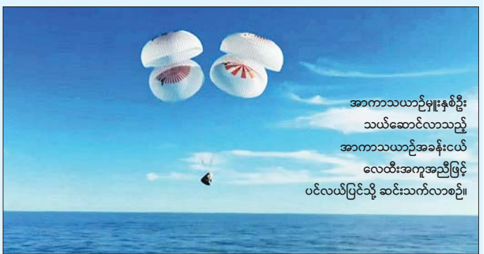
စဉ် နာရီပေါင်း ၉၀၀ကျော်ကြာ သူတေသနပြုလုပ် ပေါင်း ၅၀ ကျော်ပြုလုပ်ခဲ့သည်ဟု နာဆာမှ ခြုံငုံသိပြုနည်းကျ စမ်းသပ်မှုပေါင်းနှင့် သရုပ်ပြမှု ပြောကြားခဲ့သည်။ ဆင်ဟွာ

အစောပိုင်းက အပြည်ပြည်ဆိုင်ရာအာကာသစခန်းမှ ထွက်ခွာလာပြီး ကမ္ဘာမြေသို့ ပြန်လည်ရောက်ရှိရန် ၁၇ နာရီခန့်ကြာ ခရီးနှင့်ခဲ့ရသည်။ ဟီလီယံယိုစီမိုနှင့် တွန်းကန်မှုဆိုင်ရာပြဿနာများအပါအဝင် ဘိုးအင်း၏ စတားလိုင်းနာ အာကာသယာဉ်၏နည်းပညာ ပိုင်းဆိုင်ရာပြဿနာများကြောင့် ဆူနီဝီလီယံနှင့် ဘတ်ချ် ဝေလ်မိုးတို့နှစ်ဦးသည် ပြီးခဲ့သည့်နှစ် ဇွန်လ ကတည်းက အာကာသတွင် သောင်တင်နေခြင်းဖြစ် သည်။ အာကာသယာဉ်မှူး နှစ်ဦးမှာ ကနဦးတွင် အာကာသထဲ၌ ရှစ်ရက်ကြာနေထိုင်ရန် စီစဉ်ထားခဲ့ သော်လည်း အပြည်ပြည်ဆိုင်ရာအာကာသစခန်းတွင် တိုးလကျော်ကြာ သောင်တင်နေခဲ့ခြင်း ဖြစ်သည်။ Crew-9 မှ အာကာသယာဉ်မှူးများသည် ကမ္ဘာ ပတ်လမ်းကြောင်းပေါ်ရှိ ဓာတ်ခွဲခန်းအတွင်းနေထိုင်