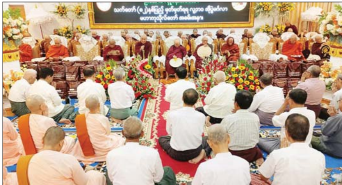
ဆရာတော်များအား ဧည့်ပရိသတ်များက လှူဖွယ် အစုစုတို့အတွက် ရေစက်သွန်းလောင်း အမျှပေးပေး ပစ္စည်းများဆက်ကပ်လှူဒါန်းကြပြီး ယောဆရာတော် ခွဲကြသည်။ ကြီးထံမှ အနုမောဒနာတရားနာယူကာ လှူဒါန်းမှု သတင်းစဉ်