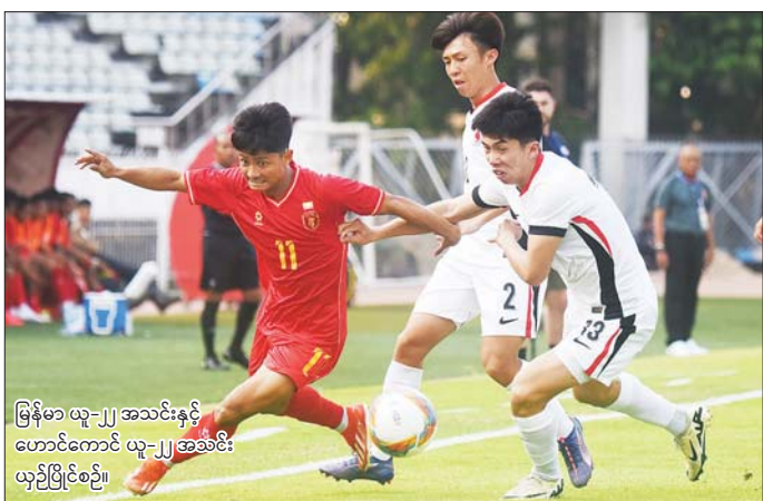
မြန်မာ ယူ-၂၂ အသင်းနှင့် ဟောင်ကောင် ယူ-၂၂ အသင်း ယှဉ်ပြိုင်စဉ်။

ရန်ကုန် မတ် ၁၉ နိုင်ငံတကာ ပြိုင်ပွဲများအတွက် လေ့ကျင့်ပြင်ဆင်နေသည့် မြန်မာ ယူ-၂၂ အသင်းနှင့် ဟောင်ကောင် ယူ-၂၂ အသင်းတို့၏ ခြေစမ်းပွဲ ပထမပွဲကို ရန်ကုန်မြို့ရှိ သုဝဏ္ဏ ကွင်း၌ ယနေ့ကျင်းပရာ ဝိုးမရှိ သရေကျခဲ့သည်။ ဂျပန်နည်းပြ ကိုင်တွယ်နေ သည့် မြန်မာ ယူ-၂၂ အသင်း ၏ ပထမဆုံး နိုင်ငံတကာ ခြေစမ်းပွဲမှာ သရေကျခဲ့သလို ကစားကွက်၊ နည်းဗျူဟာနှင့် တစ်ဦးချင်းစွမ်းဆောင်ရည်မှာလည်း စာမျက်နှာ ၁၃ ကော်လံ ၁ ❖