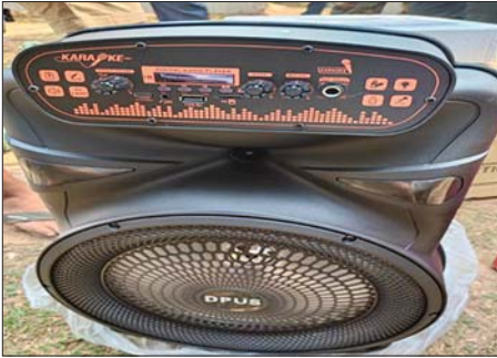
ကရင်ပြည်နယ်၌ ဖမ်းဆီးရမိမှု။

မတ် ၁၇ ရက်တွင် ကရင်ပြည်နယ် တရားမဝင်ကုန်သွယ်မှု တိုက်ဖျက်ရေးအထူးအဖွဲ့၏ စီမံခန့်ခွဲမှုဖြင့် တာဝန်ကျပူးပေါင်းအဖွဲ့က စစ်ဆေးမှုများဆောင်ရွက်ခဲ့ရာ ဘားအံမြို့နယ် ဘားအံစက်မှုဇုန်အနီး၌ မော်တော်ယာဉ် ၂၈ စီးပေါ်မှ တရားဝင်စာရွက်စာတမ်း အထောက်အထား တင်ပြနိုင်ခြင်းမရှိသည့် လုပ်ငန်းသုံးပစ္စည်း ၅၀၊ လူသုံးကုန်ပစ္စည်း ၁၂ မျိုး၊ စားသောက်ကုန်ပစ္စည်း သုံးမျိုး (ခန့်မှန်းတန်ဖိုး ငွေကျပ် ၇၂၇၃၆၄၆၀)နှင့် အဆိုပါ ပစ္စည်းများတင်ဆောင်လာသည့် Hino Truck တစ်စီး၊ Nissan Diesel Tractor Head ခုနစ်စီး၊ Chenglong Tractor Head ခြောက်စီး၊ Mitsubishi Fuso Tractor Head သုံးစီး၊ Howo Sinotruk Tractor Head နှစ်စီး၊ Dong Feng Tractor Head တစ်စီး၊ Man Tractor Head တစ်စီး၊ Hino Tractor Head တစ်စီး၊ Samsung Tractor Head တစ်စီး၊ Scania Tractor Head တစ်စီး၊ Hyundai Tractor Head တစ်စီး၊ Young Man Tractor Head တစ်စီး၊ Foton Auman Tractor Head တစ်စီး၊ Hino Profia Tractor Head တစ်စီးနှင့် နောက်တွဲယာဉ် ၂၇ တွဲ (ခန့်မှန်းတန်ဖိုးငွေကျပ် ၂၆၁၅၀၀၀၀၀) စုစုပေါင်း ခန့်မှန်းတန်ဖိုးငွေကျပ် ၃၃၄၂၄၆၄၆၀ ကို ဖမ်းဆီးရမိခဲ့ပြီး အကောက်ခွန်လုပ်ထုံးလုပ်နည်းများနှင့်အညီ အရေးယူ ဆောင်ရွက်လျက်ရှိသည်။