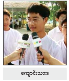
ကျောင်းသား။