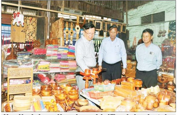
နိုင်ငံတော်စီမံအုပ်ချုပ်ရေးကောင်စီ အတွင်းရေးမှူး၊ ဗိုလ်ချုပ်ကြီးအောင်လင်းဒွေးနှင့် အဖွဲ့ဝင်များ ချောင်းဆုံမြို့နယ် ရွာလွတ်ကျေးရွာ၌ အိမ်တွင်းစက်မှုလက်မှုပစ္စည်း အရောင်းဆိုင်များနှင့် MSME ဒေသထွက်အရောင်းဆိုင်များ ဖွင့်လှစ်ရောင်းချနေမှုကို ကြည့်ရှုအားပေးစဉ်။