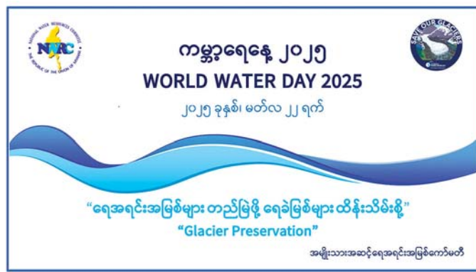
ကမ္ဘာပေါ်ရှိရေ အမျိုးသားအဆင့်ရေအရင်းအမြစ်ကော်မတီ

၂၀၂၅ ခုနှစ် ကမ္ဘာ့ရေနေ့ဆောင်ပုဒ် ၂၀၂၅ ခုနှစ်အတွက် ကမ္ဘာ့ရေနေ့ဆောင်ပုဒ် (Theme) မှာ “ရေအရင်းအမြစ်များ တည်မြဲစွာ ရေခဲမြစ်များထိန်းသိမ်းစို့” (Glacier Conservation) ဖြစ်ပါသည်။ ရေအရင်းအမြစ် ထိန်းသိမ်းမှုအတွက် အများစုသတ်မှတ်ထားမိခဲ့ကြသော ရေခဲမြစ်များအား အထူးသတိပြု အာရုံစိုက်မိစေသောကြောင့် အလွန် ထူးခြားပါသည်။ ကုလသမဂ္ဂ၏ UNESCO World Water Development Programme မှ ကမ္ဘာ့ရေနေ့ အတွက် ကမ္ဘာ့ရေဖွံ့ဖြိုးတိုးတက်မှုအစီရင်ခံစာ (World Water Development Report) အား နှစ်စဉ်ထုတ်ပြန်ပါသည်။ ထိုအစီရင်ခံစာပါ အကြောင်းအရာများပေါ်မှတစ်ဆင့် ကမ္ဘာ့ရေနေ့၏ ဆောင်ပုဒ်(Theme) အား UN-Water မှ ရွေးချယ် သတ်မှတ်ခြင်းဖြစ်ပါသည်။ထို့ပြင် ၂၀၂၅ ခုနှစ်အား နိုင်ငံတကာရေခဲမြစ်များထိန်းသိမ်းရေး စတင် မိတ်ဆက်သည့်နှစ်အဖြစ် သတ်မှတ်၍ မတ်လ ၂၀ ရက်နေ့အား ကမ္ဘာ့ရေခဲမြစ်များနေ့ (World day for Glaciers) အဖြစ် သတ်မှတ်သွားမည်ဖြစ်ပါသည်။