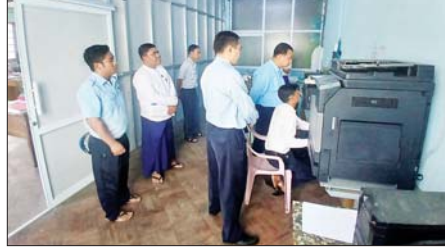
ကောက်ခံရရှိရေး၊ မိတာယူနစ်ဖတ်ချက်များမှန်ကန်စေရေး၊ ဓာတ်အားခကောက်ခံရရှိငွေများအား လေလွင့်ဆုံးရှုံးမှုများမဖြစ်စေရေးအတွက် တာဝန်ရှိသူများအား လေလွင့်ဆုံးရှုံးမှုများနှင့်အညီ ဆောင်ရွက်ရန် တာဝန်ရှိသူများက စီစဉ်ကြပ်မတ်ဆောင်ရွက်ရေးတို့ကို မှာကြားခဲ့ကြောင်း သိရသည်။

ထိုသို့စစ်ဆေးရာတွင် ဓာတ်အားဖြန့်ဖြူးထားမှု၊ အိမ်ရာများတွင် Check မိတာများတပ်ဆင်ထားမှု၊ ဓာတ်အားပျောက်ဆုံးမှု၊ ဓာတ်အားခကြွေးကျန်အခြေအနေများကို ကြည့်ရှုစစ်ဆေးကာ မိတာယူနစ်များအား စနစ်တကျမှန်ကန်စွာဖတ်ရှု၍ မှတ်တမ်းရေးသွင်းရေး၊ မိတာချွတ်ယွင်းမှုများတွေ့ရှိပါက သတ်မှတ်ထားသည့် လျှပ်စစ်ပုံစံတွင် စနစ်တကျရေးသွင်း၍ တာဝန်ရှိသူအဆင့်ဆင့်ထံ စနစ်တကျ တင်ပြရေး၊ တရားမဝင်ဓာတ်အားသုံးစွဲမှုများကို စစ်ဆေးဖော်ထုတ် အရေးယူရေး၊ စီးပွားရေးလုပ်ငန်းများ သတ်မှတ်နှုန်းထားအတိုင်း