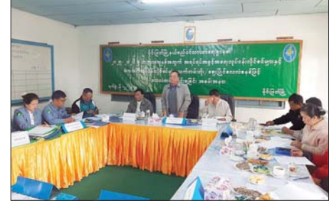
ဟိုနား ဝက်သားသတ်လုပ်ငန်း၊ လုပ်ငန်းရှင်များက ဝယ်ယူခဲ့ကြောင်း သိရသည်။ အဲဒါသားသတ် လုပ်ငန်းများကို ဈေးပြိုင်စနစ်ဖြင့် ရောင်းချခဲ့ပြီး သန်းထွန်းအေး (မိုင်းဖြတ်)

သာယာရေးဌာန၏ ၂၀၂၅-၂၀၂၆ ဘဏ္ဍာနှစ်အတွက် အရပ်ရပ်အခွင့်အရေးလုပ်ငန်းလိုင်စင် ခုနှစ်ခုအက် သက်တမ်းတိုး မြို့ဝင်ဘီးခွန်ကောက်(၁)၊ ဈေးပြိုင်စနစ်ဖြင့် မြို့ဝင်ဘီးခွန်ကောက်(၂)၊ အပေါင်ဆိုင်လုပ်ငန်း၊ စက်ဘီး၊ ဆိုင်ကယ်အပ်နှံဂိတ်၊ မြို့မဈေးကောက်လုပ်ငန်း၊ လမ်းဘေးဈေးကောက်လုပ်ငန်း၊ ကျွဲနွားပွဲဈေးကောက်လုပ်ငန်းလိုင်စင်များကိုလည်းကောင်း၊ သားသတ်လုပ်ငန်း လိုင်စင်ငါးခုဖြစ်သည့် မြို့မဝက်(၁)၊ မြို့မဝက်(၂)၊