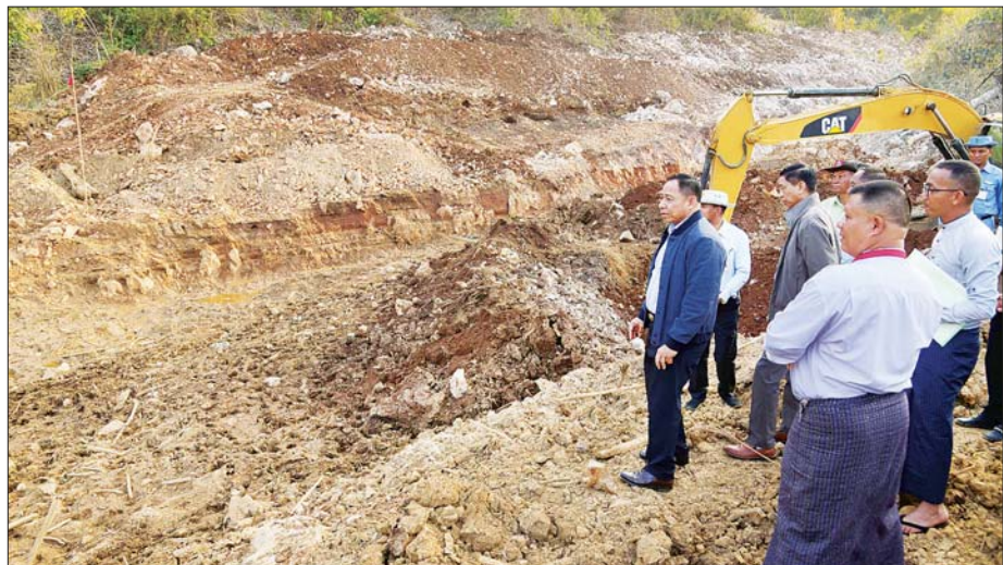
ယင်းနောက် ကလေးမြို့နယ် ရွှေမင်းဖုန်းကျေးရွာတွင် သဘာဝဘေးဒဏ်ကြောင့် လျှိုအတွင်း ရေထွက်ပေါက်မရှိဘဲ ထူးပေါက်

ဆောင်ရွက်နေမှု၊ ရာဂီမုန့်တိုင်းကြောင့် ပျက်စီးသွားသော ရေအေးကန် ရေပေးဝေရေး ပိုက်လိုင်းများ ပြင်ဆင်ဆောင်ရွက်ခဲ့မှု၊ ရေအေးကန် သွားလမ်းနှင့် တစ်ချဉ်းကပ်လမ်းပြင်ဆင်ဆောင်ရွက်မှု၊ ရာဂီမုန့်တိုင်းဒဏ်ကြောင့် ကလေးမြို့ပျက်စီးမှုများနှင့် ပြန်လည်ထူထောင်ရေး ဆောင်ရွက်ထားရှိမှု မှတ်တမ်းများ စာတင်ပုံများကို ကြည့်ရှုကြသည်။ ထို့နောက် နိုင်ငံတော်စီမံအုပ်ချုပ်ရေးကောင်စီအဖွဲ့ဝင်နှင့် ပြည်ထောင်စုဝန်ကြီး၊ နိုင်ငံတော်စီမံအုပ်ချုပ်ရေးကောင်စီအဖွဲ့ဝင်များ၊ ပြည်ထောင်စုဝန်ကြီးများ၊ ပြည်နယ်ဝန်ကြီးချုပ်နှင့် တာဝန်ရှိသူများသည် ကလေးခရိုင်အထွေထွေအုပ်ချုပ်ရေးဦးစီးဌာန အစည်းအဝေးခန်းမ၌ ခရိုင်အဆင့် တာဝန်ရှိသူများနှင့်တွေ့ဆုံ၍ လိုအပ်သည်များ မှာကြားသည်။