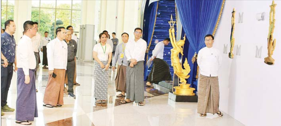
ချီးမြှင့်ပွဲအခမ်းအနား အဝင်မုခ်ဦး၊ Photo Booth | Interview Booth၊ ဂုဏ်ပြုခံလျှောက်လမ်း (Red Carpet) နေရာများ၊ ၁၉၅၂ ခုနှစ်မှ ၂၀၂၄ ခုနှစ်အထိ မြန်မာ့ရုပ်ရှင်ထူးချွန်ဆု ရရှိခဲ့ကြသူများ၏ မှတ်တမ်းဓာတ်ပုံများနှင့် ၂၀၂၄ ခုနှစ်အတွင်း ရိုတင်ပြသခဲ့သည့် ရုပ်ရှင်ဓာတ်ကား အမည်များ ပြသထားရှိမှု၊ အခမ်းအနားကျင်းပမည့် ကျောက်စိမ်းခန်းမ၌ အကယ်ဒမီ ဆုပေးပွဲစင်မြင့်ပြင်ဆင်ထားရှိမှု၊ အသံစနစ်နှင့် မီးစနစ်များ တပ်ဆင်ပြီးစီးမှု၊ Stage LED Screen နှင့် LED

နေပြည်တော် ဖေဖော်ဝါရီ ၆ ၂၀၂၄ ခုနှစ်အတွက် မြန်မာ့ရုပ်ရှင် ထူးချွန်ဆုချီးမြှင့်ပွဲအခမ်းအနားကို ဖေဖော်ဝါရီ ၉ ရက်တွင် နေပြည်တော်ရှိ မြန်မာအပြည်ပြည်ဆိုင်ရာကုန်စင်းရင်းဗဟိုဌာန - ၁ ၌ အခမ်းနားထည်ဝါစွာ ကျင်းပသွားမည်ဖြစ်ရာ မြန်မာ့ရုပ်ရှင်ထူးချွန်ဆုချီးမြှင့်ပွဲအခမ်းအနား ကျင်းပရေးဦးစီးကော်မတီဥက္ကဋ္ဌ ပြန်ကြားရေးဝန်ကြီးဌာန ပြည်ထောင်စုဝန်ကြီး ဦးမောင်မောင်အုန်းသည် တာဝန်ရှိသူများနှင့်အတူ ယနေ့ညနေပိုင်းတွင် အခမ်းအနားအောင်မြင်စွာ ကျင်းပနိုင်ရေး ကြိုတင်ပြင်ဆင် ဆောင်ရွက်နေမှုများကို ကြည့်ရှုစစ်ဆေးသည်။ (အပေါ်ယာပုံ)