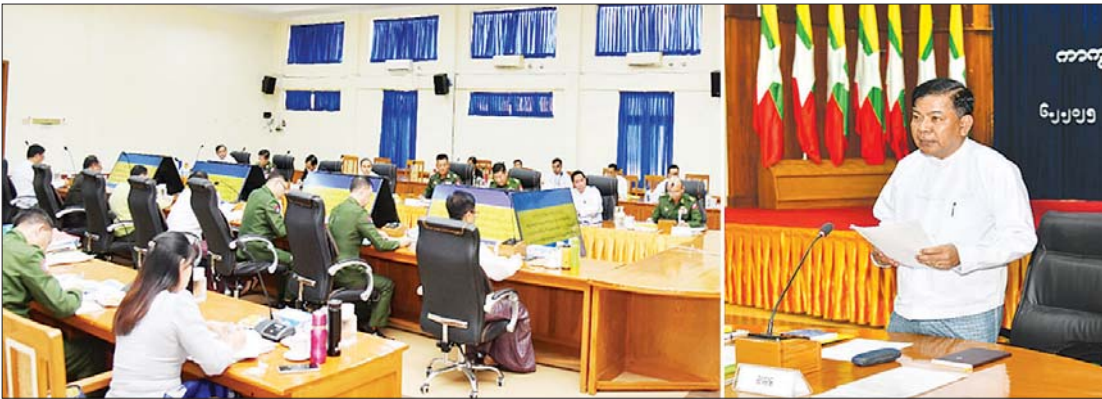
နိုင်ငံတော်စီမံအုပ်ချုပ်ရေးကောင်စီအဖွဲ့ဝင်၊ ဒုတိယဝန်ကြီးချုပ်နှင့် ကာကွယ်ရေးဝန်ကြီးဌာန ပြည်ထောင်စုဝန်ကြီး ဗိုလ်ချုပ်ကြီး မောင်မောင်အေး အရွယ်မရောက်သေးသူ ကလေးသူငယ်များအား စစ်မှုထမ်းခြင်းမှ ကာကွယ်တားဆီးထိန်းသိမ်းရေးကော်မတီအစည်းအဝေး(၁/၂၀၂၅)တွင် အမှာစကားပြောကြားစဉ်။

နေပြည်တော် ဖေဖော်ဝါရီ ၆ အရွယ်မရောက်သေးသူ ကလေးသူငယ်များအား စစ်မှုထမ်းခြင်းမှ ကာကွယ်တားဆီးထိန်းသိမ်းရေးကော်မတီအစည်းအဝေး(၁/၂၀၂၅)ကို ယနေ့နံနက် ၉ နာရီတွင် ကာကွယ်ရေးဝန်ကြီးဌာန ပြည်ထောင်စုဝန်ကြီးရုံး အစည်းအဝေးခန်းမ၌ ကျင်းပရာ အရွယ်မရောက်သေးသူ ကလေးသူငယ်များအား စစ်မှုထမ်းခြင်းမှ ကာကွယ်တားဆီးထိန်းသိမ်းရေးကော်မတီ ဥက္ကဋ္ဌ နိုင်ငံတော် စီမံအုပ်ချုပ်ရေးကောင်စီအဖွဲ့ဝင်၊ ဒုတိယဝန်ကြီးချုပ်နှင့် ကာကွယ်ရေးဝန်ကြီးဌာန ပြည်ထောင်စုဝန်ကြီး ဗိုလ်ချုပ်ကြီး မောင်မောင်အေး တက်ရောက်အမှာစကား ပြောကြားသည်။