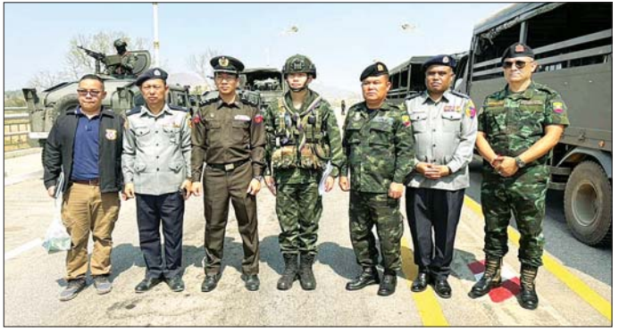
မြန်မာနိုင်ငံအတွင်းသို့ အထောက်အထားမဲ့ဝင်ရောက်လာသူများအား လုပ်ထုံးလုပ်နည်းများနှင့်အညီ လွှဲပြောင်းပေးအပ်လျက်ရှိမှုကို တွေ့မြင်ရစဉ်။