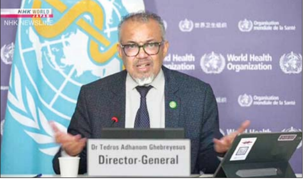
Dr. Tedros Adhanom Ghebreyesus, Director-General