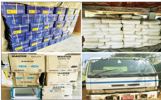
ကရင်ပြည်နယ်၌ ဖမ်းဆီးရမိမှု။

နေပြည်တော် ဖေဖော်ဝါရီ ၁၃ တရားမဝင်ကုန်သွယ်မှုတိုက်ဖျက်ရေး ဦးဆောင်ကော်မတီ၏ ကြီးကြပ်ကွပ်ကဲမှုဖြင့် တရားမဝင်ကုန်သွယ်မှုများကို ဥပဒေနှင့်အညီ ထိရောက်စွာ တားဆီးအရေးယူနိုင်ရေး ဆောင်ရွက်လျက်ရှိသည်။ ဖေဖော်ဝါရီ ၁၁ ရက်တွင် အကောက်ခွန်ဦးစီးဌာန၏ စီမံခန့်ခွဲမှုဖြင့် တာဝန်ကျပူးပေါင်းအဖွဲ့များက စစ်ဆေးမှုများ ဆောင်ရွက်ခဲ့ရာ အေးရှားဝေါလ်ကုန်သေတ္တာစစ်ဆေးရေးစခန်း၌ ကုန်သေတ္တာ ခုနစ်လုံးအတွင်းမှ တရားဝင်စာရွက်စာတမ်းအထောက်အထားတင်ပြနိုင်ခြင်းမရှိသည့် လုပ်ငန်းသုံးပစ္စည်းသုံးမျိုး စုစုပေါင်းခန့်မှန်းတန်ဖိုးငွေကျပ် ၂၇၃၀၀၀၀ ကို ဖမ်းဆီးရမိခဲ့ပြီး အကောက်ခွန်လုပ်ထုံးလုပ်နည်းများနှင့်အညီ အရေးယူဆောင်ရွက်လျက်ရှိသည်။