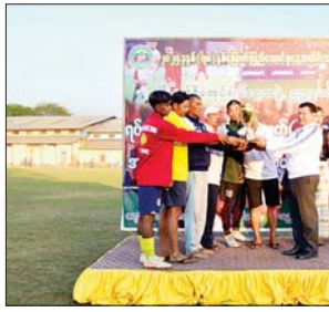
မြို့နယ်(ပြန်/ဆက်)

ထို့နောက် ဆုချီးမြှင့်ပွဲကိုကျင်းပရာ (၇၈)နှစ်မြောက် ပြည်ထောင်စုနေ့ အထိမ်းအမှတ် မြို့နယ်စီမံအုပ်ချုပ်ရေးအဖွဲ့ ဥက္ကဋ္ဌဖလား ရပ်ကွက်၊ ကျေးရွာအုပ်စုပေါင်းစုံ အသက်(၂၃) နှစ်အောက် အမျိုးသားဘောလုံးပြိုင်ပွဲတွင် ပွဲစဉ်တစ်လျှောက် ဂိုး၊ နောက်တန်း၊ အလယ်တန်း၊ ရှေ့တန်းနှင့် အကောင်းဆုံးဘောလုံးသမားဆု ရရှိကြသူများအား ဆုတံဆိပ်နှင့် ငွေသားဆုများကို မြို့နယ်စီမံအုပ်ချုပ်ရေးအဖွဲ့ဥက္ကဋ္ဌ နှင့်အဖွဲ့ဝင်များ တိုင်းဒေသကြီးဘောလုံးအဖွဲ့ချုပ် ဒုတိယဥက္ကဋ္ဌနှင့် တာဝန်ရှိသူများက လည်းကောင်း၊ ပူးတွဲပထမဆုရရှိသူ မြို့မဇုန်အသင်းနှင့် ဆားမလောက်ဇုန်အသင်းတို့အား ပထမဆုဖလားနှင့် ငွေသားဆုငွေကျပ်၃၅၀သိန်းကို ခရိုင်စီမံအုပ်ချုပ်ရေးအဖွဲ့ဥက္ကဋ္ဌက လည်းကောင်း၊ ပေးအပ်ချီးမြှင့်ခဲ့ကြောင်း သိရသည်။