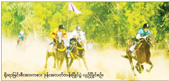
ရိုးရာမြင်းစီးအားကစား ခုန့်အလတ်တန်းပြိုင်ပွဲ ယှဉ်ပြိုင်စဉ်။

ရန်ကုန် ဖေဖော်ဝါရီ ၁၃ (၇၈) နှစ်မြောက် ပြည်ထောင်စုနေ့အထိမ်းအမှတ် တိုင်းဒေသကြီးနှင့် ပြည်နယ် ပြည်ထောင်စုတံခွန်စိုက် ဖလား မြန်မာ့ရိုးရာမြင်းစီးနှင့် နိုင်ငံတကာမြင်းစီး အားကစားပြိုင်ပွဲများကို ယမန်နေ့က ရန်ကုန်မြို့၊ ဒဂုံမြို့သစ် (မြောက်ပိုင်း) မြန်မာနိုင်ငံ မြင်းစီး အားကစားအဖွဲ့ချုပ်မြင်းစီးအားကစားကွင်း၌ ကျင်းပ သည်။