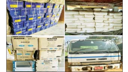
ပြည်တွင်းသတင်း စာ ၁၆

တရားမဝင်သစ်မျိုးစုံ၊ လုပ်ငန်းသုံးပစ္စည်းများ၊ လူသုံးကုန်ပစ္စည်းများ၊ စားသောက်ကုန်ပစ္စည်းများ၊ လိုင်စင်မဲ့မော်တော်ဆိုင်ကယ်များနှင့် မော်တော်ယာဉ်များ ဖမ်းဆီးရမိ