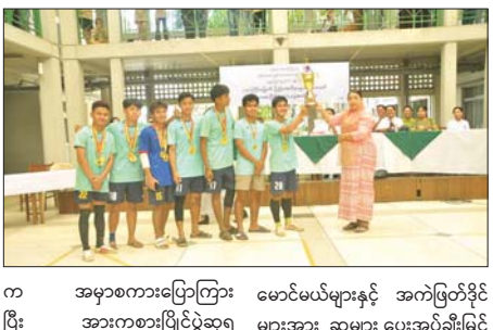
အခမ်းအနားတွင် သူနာပြုတက္ကသိုလ် (ရန်ကုန်) ပါမောက္ခချုပ် ဒေါက်တာ တင်တင်ကျော်က အမှာစကားပြောကြား မောင်မယ်များနှင့် အက်ဖြတ်ခိုင်များအား ဆုများ ပေးအပ်ချီးမြှင့်ခဲ့သည်။

ရန်ကုန် ဖေဖော်ဝါရီ ၁၃ (၇၈)နှစ်မြောက် ပြည်ထောင်စုနေ့အထိမ်းအမှတ် အားကစားပြိုင်ပွဲပိတ်ပွဲနှင့် ဆုချီးမြှင့်ပွဲအခမ်းအနားကို ယမန်နေ့က သူနာပြုတက္ကသိုလ် (ရန်ကုန်) ၌ ကျင်းပသည်။