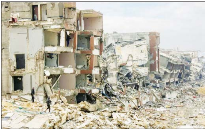
အင်န်အိတ်ချ်က

အစီရင်ခံစာတွင် ပါရှိသည်။ စာသင်ကျောင်း ၈၈ ရာခိုင်နှုန်းမှာလည်း ပျက်စီး သွားပြီဖြစ်သည်။ အစ္စရေး-ဟားမားစ် ပဋိပက္ခအတွင်း အပျက်အစီး တန်ဖိုးခန့် ၅၀ ကျော် ထွက်ရှိကြောင်း ကုလသမဂ္ဂက ခန့်မှန်းထားသည်။ ကြီးမားသည့် အပျက်အစီးများအောက်တွင် မပေါက်ကွဲသေးသည့် အန္တရာယ်ရှိသောပစ္စည်းများရှိသဖြင့် အဆိုပါ လက်နက်ပစ္စည်းများကို ဖယ်ရှားခြင်းလုပ်ငန်းမှာ ခက်ခဲပြီး ငွေကုန်ကြေးကုများကြောင်း ကုလသမဂ္ဂ က ပြောသည်။ ပြန်လည်တည်ဆောက်ရေးလုပ်ငန်းများအတွက် ပထမသုံးနှစ်အတွင်း လိုအပ်ချက်များမှာ အမေရိကန် ဒေါ်လာ ၂၀ ဒသမ ၆ ဘီလီယံလိုအပ်မည်ဟု ခန့်မှန်း ထားသည်။