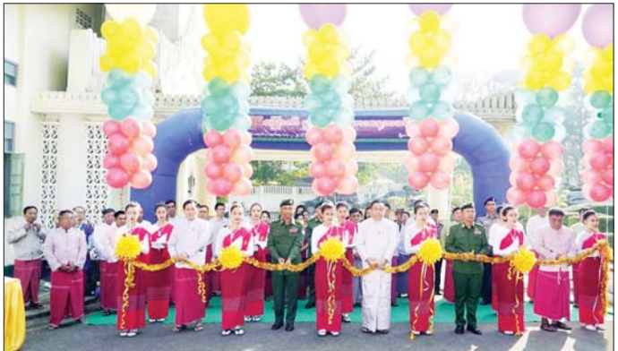
ထံမှ(၇၈)နှစ်မြောက် မွန်အမျိုးသားနေ့အခမ်းအနား ဖတ်ကြားပြီး မွန်စာပေနှင့် ယဉ်ကျေးမှုကော်မတီ သို့ ပေးပို့သည့်သဝဏ်လွှာအား တိုင်းဒေသကြီး ဥက္ကဋ္ဌ ဦးနိုင်မင်းနိုင်က ကျေးဇူးတင်စကား သယံဇာတရေးရာဝန်ကြီး ဦးခင်မောင်မြင့်က ပြောကြားသည်။ တိုင်းဒေသကြီး(ပြန်/ဆက်)

မွန်လူမျိုးအားလုံးမိမိတို့ရောက်ရှိနေထိုင်ကြသော နေရာဒေသအနှံ့အပြားတွင် အသီးသီးကျင်းပလျက် ရှိကြောင်း၊ မွန်လူမျိုးတို့၏ ဘာသာစကား၊ ယဉ်ကျေးမှု လေ့ထုံးတမ်း၊ သမိုင်းအစဉ်အလာများ မပျောက်ကွယ် မတိမ်ကောသွားစေရန် ထိန်းသိမ်းသွားရန်နှင့် ရေရှည်ဖွံ့ဖြိုးတိုးတက်လာအောင် ကြိုးပမ်းဆောင်ရွက်ရန်၊ မွန်လူမျိုးတို့၏ ဇာတိသွေး၊ ဇာတိမာန် အစဉ် နှီးကြားပြီး စည်းလုံးညီညွတ်မှုရှိစေရန်၊ တိုင်းရင်းသား ညီအစ်ကိုမောင်နှမများအားလုံးအတူတကွပေါင်းစည်းပြီး စစ်မှန်သော ဖက်ဒရယ်ပြည်ထောင်စုကို တည်ဆောက်သွားရန် စသည့်ကောင်းမြတ်သော ရည်ရွယ်ချက်များဖြင့် ကျင်းပလျက်ရှိကြောင်း ပြောကြားသည်။ ထို့နောက် တိုင်းရင်းသားလူမျိုးများရေးရာ ဝန်ကြီးဌာန ပြည်ထောင်စုဝန်ကြီး ဦးခွန်သန်ဇော်ထူး