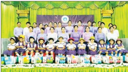
မူကြိုကျောင်းများမှ မူကြိုရင်သွေး ငယ်လေးများက အားလူးကောက် ပြိုင်ပွဲ၊ ဘောလုံးဖောက်ပြိုင်ပွဲ၊ မုန့်စားပြိုင်ပွဲ၊ A to F အင်္ဂလိပ် အက္ခရာပြိုင်ပွဲ၊ က မှ ဆ အထိ မြန်မာအက္ခရာ ရွတ်ဆိုပြိုင်ပွဲများ

ရန်ကုန် ဖေဖော်ဝါရီ ၁၃ ရန်ကုန်တိုင်းဒေသကြီး ဗိုလ် တထောင်ခရိုင် မိခင်နှင့်ကလေး စောင့်ရှောက်မှုကြိုရေးအဖွဲ့ က မူကြိုကလေးများ ကာယ၊ ဉာဏစွမ်းရည်ပြိုင်ပွဲကို ယနေ့ နံနက် ၉ နာရီက ပုဇွန်တောင်မြို့ နယ် အမှတ်(၁) အခြေခံပညာ အထက်တန်းကျောင်း၌ ကျင်းပ သည်။