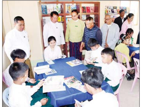
ရဲတင့်(ပြန်/ဆက်)