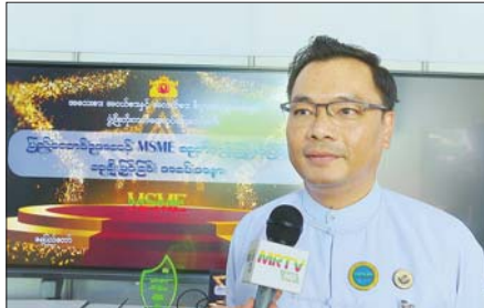
ခုတ်ယူဝန်ကြီး ဒေါက်တာအောင်ဇေယျ

ဖြေ။ ။ ဆုချီးမြှင့်ခြင်းအခမ်းအနားမှာ စင်ပေါ်က (အလျားပေ ၄၀၊ အနံ ပေ ၂၀ ရှိတဲ့) LED Board မှာပေါ်လာမယ့် နောက်ခံပြသမှုကို ပိုင်သွန် (Python) ပရိုဂရမ်ဘာသာစကားနဲ့ ရေးသားထားပါတယ်။ အချက်အလက်တွေသိမ်းဆည်းပြီး စီမံခန့်ခွဲမှု စနစ်အနေနဲ့ ယုံကြည်စိတ်ချရပြီး စွမ်းဆောင်ရည်ကောင်းတဲ့အတွက် လက်ရှိမှာ ရေပန်းစားနေတဲ့ MySQL (open-source relational database management system) ကို အသုံးပြုထားပြီးတော့ အက်ပလီကေးရှင်းကို ငွေပေးချေမှုလုပ်ငန်းစဉ် (Payment Flow)