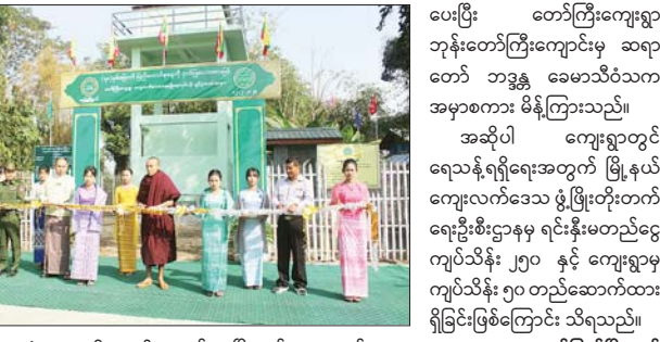
အဆိုပါ ကျေးရွာတွင် ရေသန့်ရရှိရေးအတွက် မြို့နယ်ကျေးလက်ဒေသ ဖွံ့ဖြိုးတိုးတက်ရေးဦးစီးဌာနမှ ရင်းနှီးမတည်ငွေကျပ်သိန်း ၂၅၀ နှင့် ကျေးရွာမှ ကျပ်သိန်း ၅၀ တည်ဆောက်ထား ရှိခြင်းဖြစ်ကြောင်း သိရသည်။

ဓနုဖြူ ဖေဖော်ဝါရီ ၁၃ ဧရာဝတီတိုင်းဒေသကြီး ဓနုဖြူမြို့နယ်တွင် (၇၈)နှစ်မြောက် ပြည်ထောင်စုနေ့အထိမ်းအမှတ် ကျေးလက်ဒေသ ရေရရှိရေး လုပ်ငန်းဖွင့်ပွဲကို ဖေဖော်ဝါရီ ၁၂ ရက်က ဧပြီကုန်းကျေးရွာအုပ်စု တော်ကြီးကျေးရွာ၌ ကျင်းပသည်။