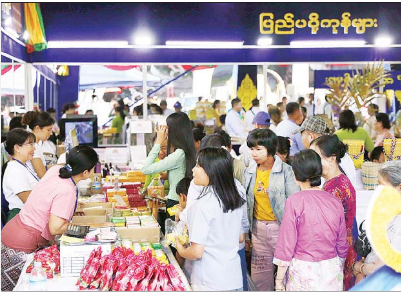
(၇၈)နှစ်မြောက် ပြည်ထောင်စုနေ့အထိမ်းအမှတ် ပြည်ထောင်စုအဆင့် MSME ထုတ်ကုန်ပြပွဲနှင့် ပြိုင်ပွဲစတုတ္ထနေ့တွင် ခင်းကျင်းပြသထားသည့် ပြခန်းများ၌ လာရောက်လေ့လာကြည့်ရှုသူများဖြင့် စည်ကားလျက်ရှိသည်ကို တွေ့ရစဉ်။

နေပြည်တော် ဖေဖော်ဝါရီ ၁၃ (၇၈)နှစ်မြောက်ပြည်ထောင်စုနေ့အထိမ်းအမှတ် ပြည်ထောင်စုအဆင့် MSME ထုတ်ကုန်ပြပွဲနှင့် ပြိုင်ပွဲ စတုတ္ထနေ့ကို ယနေ့နံနက်ပိုင်းမှစတင်၍ နေပြည်တော် ဥပျံတသန္တတော်တော်အနီးရှိ တပေါင်းကွင်း၌ ဆက်လက်ကျင်းပရာ ဝန်ကြီးဌာနများမှ ဝန်ထမ်းများနှင့် မိသားစုများ၊ MSME လုပ်ငန်းရှင်များ၊ ပြည်သူများစိတ်ပါဝင်စားစွာဖြင့် တစ်ခဲနက်လာရောက်လေ့လာကြည့်ရှုကြသဖြင့် အထူးစည်ကားများပြားခဲ့သည်။ ယနေ့သည် ပွဲတော်၏ စတုတ္ထနေ့သို့ ရောက်ရှိလာခဲ့သည့်အတွက် ပြခန်းအလိုက် ပြသထားသည့် ပြခန်းပြကွက်များအား လာရောက်လေ့လာကြည့်ရှုသည့် အနယ်နယ်အရပ်ရပ်မှ ပြည်သူများဖြင့် အထူး စည်ကားလျက်ရှိသည့်အပြင် MSME လုပ်ငန်းရှင်များ၊ နောက်ဆုံးပေါ်တီထွင်ဆန်းသစ်မှု နည်းပညာများနှင့် စက်မှု၊ လက်မှုကဏ္ဍကို စိတ်ဝင်စားကြသည့် လုပ်ငန်းရှင်များလည်း လာရောက်လေ့လာကြသည်။ အဆိုပါလုပ်ငန်းရှင်များအား ပြခန်းတာဝန်ရှိသူများက အရည်အသွေးမြင့်စက်ယန္တရားများ၏ ထူးခြားသာလွန်သော စွမ်းဆောင်ရည်များအကြောင်း၊ နိုင်ငံတကာအဆင့်မီ စက်ယန္တရားများ၊ ဝယ်ယူမှု၊ တပ်ဆင်မှုအကြောင်းအရာများနှင့် ဈေးကွက်စီးပွားရေး လိုအပ်ချက်များကို အနာဂတ်နည်းပညာများအသုံးပြု၍ ဖြည့်ဆည်းဆောင်ရွက်ပေးနိုင်မည့် ဗဟုသုတ အကြောင်းအရာများကို အသေးစိတ် ရှင်းလင်းပြသကြသည့်အပြင် ကျွမ်းကျင်ဝန်ထမ်းများကလည်း ခင်းကျင်းပြသထားသည့် စက်ယန္တရားများဖြင့် လက်တွေ့သရုပ်ပြသဆွေးနွေးပေးခဲ့ရာ မြန်မာနိုင်ငံအနာဂတ် စက်မှုနည်းပညာကဏ္ဍကို တစ်ခေတ်ဆန်းသစ်တော့မည့် မြင်ကွင်းတစ်ခုလည်း ဖြစ်သည်။ ထို့ပြင် ပွဲတော်သို့လာရောက်လေ့လာကြသည့် MSME လုပ်ငန်းရှင်များကိုလည်း ပြခန်းတာဝန်ရှိသူများက MSME လုပ်ငန်းများ ဖွံ့ဖြိုးတိုးတက်ရေးအတွက် သတင်းအချက်အလက်နှင့် နည်းပညာများ မျှဝေပေးခြင်း၊ ပြည်တွင်း/ပြည်ပဈေးကွက်များသို့ မိမိတို့လုပ်ကိုင်နေ