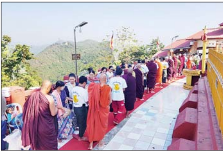
ဆက်လက်၍ စေတီတော်ရှင်ပြင်တော်၌ တံခွန်တိုင်သစ်အား ခရိုင်စီမံအုပ်ချုပ်ရေးအဖွဲ့ဥက္ကဋ္ဌ၊ သထုံတပ်နယ်မှူးနှင့် အလှူရှင်တို့က စိန်ဖူးတော်၊ ထီးတော်နှင့် ငှက်မြတ်နားတော်တို့ကို တင်လှူပူဇော်ကြပြီး သတ္တမမြောက်ကာရာမကျောင်းတိုက် ပဓာနနာယက ဆရာတော်ထံမှ ဧည့်ပရိသတ်တို့က အနုပဓာနတရားများ နှာကြားကာလှူဒါန်းမှုတို့ကို ရေစက်သွန်းချအမျှဝေခဲ့ကြသည်။

သထုံ ဖေဖော်ဝါရီ ၁၃ မွန်ပြည်နယ် သထုံမြို့၊ သီရိနိပါတ်တောင်ထိပ်ရှိ ဆံတော်ရှင်မြသပိတ်စေတီတော်မြတ်ကြီး၏ ဗုဒ္ဓပူဇော်သည့်အခါ အထိမ်းအမှတ်အဖြစ် (သတ္တမ)အကြိမ်မြောက် ကြာသင်္ဂါနန်းဆက်ကပ်ခြင်း၊ တံခွန်အသစ်ထီးတော်တင်လှူခြင်းနှင့် ဆွမ်းဆန်စိမ်းလောင်းလှူခြင်းအခမ်းအနားကို ယမန်နေ့က အဆိုပါစေတီတော်မြတ်ကြီး ရှင်ပြင်တော်၌ ကျင်းပသည်။