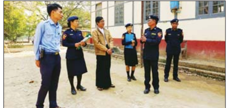
မင်းဘူး(စကျ)မြို့နယ်၌ မီးဘေးလုံခြုံရေးစစ်ဆေး

အုပ်ချုပ်ရေးမှူးများက ငွေကြေးကောက်ခံမှု၊ ရယူမှုများရှိနေသဖြင့် တိုင်ကြားမှုများ ဖြစ်ပေါ်လျက်ရှိပြီး စစ်မှုထမ်းဆောင်ရန် ဆောင်ရွက်သည့် လုပ်ငန်းစဉ်မှန်သမျှသည် ပြည်သူလူထုနှင့် ထိတွေ့ဆက်ဆံရသည့် လုပ်ငန်းစဉ်များဖြစ်၍ ငွေကြေးကောက်ခံမှု၊ ရယူမှုမရှိစေရေး ရပ်ကွက်/ကျေးရွာအဆင့်အထိ အလေးထားလိုက်ပါ ဆောင်ရွက်နိုင်စေရေးနှင့် အရွယ်ရောက်သူ နိုင်ငံသားအားလုံး နိုင်ငံချစ်စိတ်၊ မျိုးချစ်စိတ်ဖြင့် အမျိုးသား စစ်မှုထမ်းစနစ်တွင် ပါဝင်ထမ်းဆောင်ကြရန်နှင့် အားပေးထောက်ပံ့ ကူညီပံ့ပိုးပေးကြပါရန် ပြည်သူလူထုအား ချပြရင်းလင်းဆွေးနွေးခဲ့ကြောင်း သိရသည်။ ထွန်းထွန်းဝင်း(ပြန်/ဆက်)