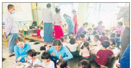
ပဲခူးတိုင်းဒေသကြီး ရေတာရှည်မြို့နယ် ပြည်သူ့ကျန်းမာရေးဦးစီးဌာနနှင့် အခြေခံပညာဦးစီးဌာနတို့ပူးပေါင်း၍ KG တန်းမှ ကလေးများအား ကျောင်းတွင်းနေ့လယ်စာ အာဟာရကျေးမွေးခြင်းကို ဖေဖော်ဝါရီ ၁၃ ရက်က အမှတ်(၃)ရပ်ကွက် မူလတန်းကျောင်း၌ ကျွေးမွေးစဉ်။ မြို့နယ်(ပြန်/ဆက်)

အသင်းက တတိယဆုများ ရရှိခဲ့ကြရာ ဆုရရှိသောအသင်းများအား ခရိုင်စီမံအုပ်ချုပ်ရေးအဖွဲ့ဥက္ကဋ္ဌနှင့် တာဝန်ရှိသူများက ဆုများပေးအပ်ချီးမြှင့်သည်။ အဆိုပါ ထမနံ့ထိုးပြိုင်ပွဲသို့ ခရိုင်စီမံအုပ်ချုပ်ရေးအဖွဲ့ဥက္ကဋ္ဌနှင့် အဖွဲ့ဝင်များ၊ မြို့နယ်စီမံအုပ်ချုပ်ရေးအဖွဲ့ဝင်များ၊ ခရိုင်/မြို့နယ်ဌာနဆိုင်ရာ တာဝန်ရှိသူများနှင့် ဝန်ထမ်းများ၊ ပြိုင်ပွဲဝင်အသင်းသားများ၊ ထမနံ့ထိုးပြိုင်ပွဲကို လာရောက် အားပေးသူများနှင့် ရပ်ကွက်နေပြည်သူများက အိုးစည်ဒိုးပတ်ဝိုင်းများဖြင့် တစ်ခဲနက် လာရောက် အားပေးခဲ့ကြကြောင်း သိရသည်။ ခရိုင်(ပြန်/ဆက်)