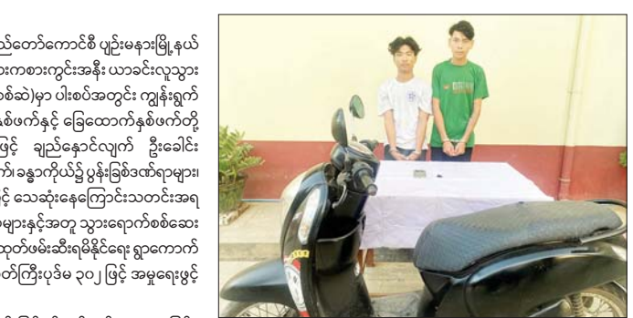
ဝဲမှယာ တရားခံ ကောင်းခန့်ဇော်(ခ)ဆင်ပေါက်၊ တရားခံ ဝေဠုကျော်အိတ် တစ်လုံး၊ ယာဉ်မောင်းလိုင်စင် တစ်ခု၊ စမတ်ကတ်နှင့်အတူ ပျောက်ဆုံးနေသူဖြစ်ကြောင်း သိရသည်။ ဆက်လက်၍ ပြစ်မှုကျူးလွန်သူတရားခံများအား ဖော်ထုတ်ဖမ်းဆီးရမိနိုင်ရေး ဆောင်ရွက်ခဲ့ရာ နယ်မြေအတွင်း မိမိအာမခံသတင်းပေးများ ထံမှရရှိသော အချက်အလက်များနှင့် အခင်းဖြစ်ရပ်အထောက်အထားများအရ ဇန်နဝါရီ ၂၁ ရက် ညပိုင်းတွင် တရားခံ ပျဉ်းမနားမြို့နယ် မြို့သစ်

နေပြည်တော် ဇန်နဝါရီ ၁၄ ၂၀၂၅ ခုနှစ် ဇန်နဝါရီ ၇ ရက်က နေပြည်တော်ကောင်စီ ပျဉ်းမနားမြို့နယ် သဲကျွန်းကျေးရွာရှိ PNPT ကလေးအားကစားကွင်းအနီး ယာခင်းလူသွားလမ်းပေါ်တွင် အမျိုးသားတစ်ဦး (စိစစ်ခံ) မှာ ပါဝင်အတွင်း ကျွန်းရွက်ခြောက်များဆိုင်ခန်းထားပြီး လက်နှစ်ဖက်နှင့် ခြေထောက်နှစ်ဖက်တို့အား အင်္ကျီ/ပလတ်စတစ်ကြိုးများဖြင့် ချည်နှောင်လျက် ဦးခေါင်းနောက်စေ့တွင် ပြတ်ရှဒဏ်ရာ တစ်ချက်၊ ခန္ဓာကိုယ်၌ ပုန်းခြစ်ဒဏ်ရာများ၊ ဝဲဘက်နား သွေးထွက်ဒဏ်ရာများဖြင့် သေဆုံးနေကြောင်းသတင်းအရ လုံခြုံရေးတပ်ဖွဲ့ဝင်များက သက်သေများနှင့်အတူ သွားရောက်စစ်ဆေးခဲ့ပြီး ပြစ်မှုကျူးလွန်သူများအား ဖော်ထုတ်ဖမ်းဆီးရမိနိုင်ရေး ရွာကောက်နယ်မြေရဲစခန်း(၁)၄/၂၀၂၅ ရာဇဝတ်ကြီးပုဒ်မ ၃၀၂ ဖြင့် အမှုရေးဖွင့်စုံစမ်းဆောင်ရွက်ခဲ့သည်။