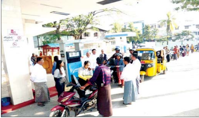
ပြည်တွင်းထုတ်ဓာတ်ဆီအား သုံးစွဲသူပြည်သူများ ဝယ်ယူနေမှုကို တွေ့ရစဉ်။

စွမ်းအင်ဝန်ကြီးဌာနသည် နိုင်ငံ၏ စွမ်းအင် ကဏ္ဍ ဖွံ့ဖြိုးတိုးတက်ရေးအတွက် ပြည်တွင်းရှိ ကုန်းတွင်းနှင့် ကမ်းလှန်လုပ်ကွက်များမှ ရေနံနှင့် သဘာဝဓာတ်ငွေ့များ တူးမြှင်ရှာဖွေခြင်း၊ ထွက်ရှိ လာသည့် ရေနံနှင့် သဘာဝဓာတ်ငွေ့တို့အား ကုန်ကြမ်းနှင့် လောင်စာအဖြစ် အသုံးပြု၍ နိုင်ငံ အတွက် လိုအပ်သည့် ရေနံထွက်ပစ္စည်းများနှင့် ယူရီးယားဓာတ်မြေဩဇာများ ထုတ်လုပ်ဖြန့်ဖြူး ခြင်း၊ လျှပ်စစ်ဓာတ်အားထုတ်လုပ်နိုင်ရေးနှင့် စက်ရုံ အလုပ်ရုံများ၏ ကုန်ထုတ်လုပ်မှုလုပ်ငန်းများ ဆောင်ရွက်နိုင်ရန်အတွက် လိုအပ်သည့် သဘာဝ ဓာတ်ငွေ့များဖြန့်ဖြူးပေးခြင်း၊ မော်တော်ယာဉ် များအတွက် မော်တော်ယာဉ်သုံး သဘာဝဓာတ်ငွေ့ များ ဖြန့်ဖြူးရောင်းချပေးခြင်းတို့ကို ဆောင်ရွက် ပေးလျက်ရှိပါသည်။