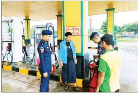
ရပ်ကွက် / ကျေးရွာများရှိ ဘုန်းတော်ကြီးကျောင်းများ၊ သာသနိကအဆောက်အအုံများ၊ စာသင်ကျောင်း၊ ဈေး၊ စက်သုံးဆီအရောင်းဆိုင်များ၊ စက်ရုံ၊ အလုပ်ရုံ များနှင့် လူနေအိမ်များတွင် မီးဘေးလုံခြုံစိတ်ချရမှု ရှိ/မရှိကြည့်ရှုစစ်ဆေးပေးခြင်းဖြစ်သည်။

ညောင်တုန်း ဇန်နဝါရီ ၁၄ ရော့တတီတိုင်းဒေသကြီး ညောင်တုန်းမြို့နယ်၌ မီးဘေးအန္တရာယ်ကာကွယ်ရေးအသိပညာပေး