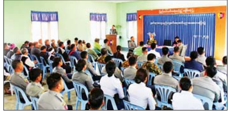
အသိပညာပေး ဟောပြောဆွေးနွေးကြသည်။

ကျိုင်းတုံ ဇန်နဝါရီ ၁၄ ရှမ်းပြည်နယ်(အရှေ့ပိုင်း) ကျိုင်းတုံမြို့၌ မှုခင်းလျော့နည်းကျဆင်းရေး အသိပညာပေး ဟောပြောပွဲကို ဇန်နဝါရီ ၁၃ ရက်က ကျိုင်းတုံခရိုင် ရဲတပ်ဖွဲ့မှူးရုံး၌ ကျင်းပသည်။