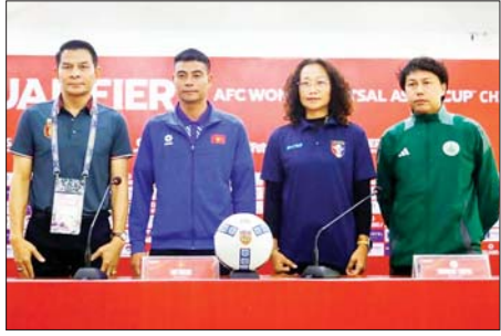
၂၀၂၅ အာရှဖလား အမျိုးသမီးဖူဆယ်ခြေစစ်ပွဲ အုပ်စု (D) ပွဲကြို သတင်းစာရှင်းလင်းပွဲတွင် မြန်မာ၊ ဗီယက်နမ်၊ တရုတ်(တိုင်ပေ)နှင့် မကာအိုအသင်းတို့မှ နည်းပြချုပ်များကို တွေ့ရစဉ်။