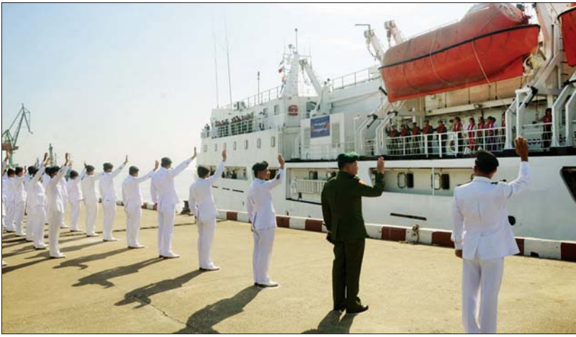
တပ်မတော်ပင်လယ်သွားဆေးရုံရေယာဉ်(သံလွင်) အမှတ်(၂) ရေတပ်ဆိပ်ခံတားမှထွက်ခွာရာ တပ်မတော်(ရေ)မှ အရာရှိကြီးများနှင့် အရာရှိ၊ စစ်သည်မိသားစုများ ပို့ဆောင်နှုတ်ဆက်စဉ်။

နေပြည်တော် ဇန်နဝါရီ ၁၄ ရောဂါတိုင်းဒေသကြီးအတွင်း ရောဂါတစ်ကြောင်းတစ်လျှောက်ရှိမြစ်ဝကျွန်းပေါ်နေကျေးရွာများမှ ဒေသခံပြည်သူများအား ကျန်းမာရေးစောင့်ရှောက်မှုလုပ်ငန်းများ ဆောင်ရွက်ပေးရန်အတွက် တပ်မတော် နယ်လှည့်အထူးကုဆေးအဖွဲ့မှ ပါရဂူများ၊ ဆေးမှူးများနှင့် သူနာပြုများ ပါဝင်သည့် တပ်မတော်မြစ်တွင်းသွားဆေးရုံရေယာဉ် (ရွှေပုဇွန်)နှင့် မြစ်ရေယာဉ် (စက)တို့သည် ယနေ့နံနက်ပိုင်းတွင် ရန်ကုန်မြို့ အမှတ် (၄)ရေတပ်ဇာတိတားမှလည်းကောင်း၊ ရန်ကုန်တိုင်းဒေသကြီး ကိုကိုးကျွန်းမြို့နယ်၊ တနင်္သာရီတိုင်းဒေသကြီးအတွင်းရှိ ကမ်းရိုးတန်းတစ်လျှောက်မှ မြို့နယ်၊ ကျေးရွာများနှင့် ရောဂါတိုင်းဒေသကြီး ဟိုင်းကြီးကျွန်းမြို့နယ်အတွင်းရှိ ပတ်ဝန်းကျင်ကျေးရွာများမှ ဒေသခံပြည်သူများအား ကျန်းမာရေးစောင့်ရှောက်မှုလုပ်ငန်းများ ဆောင်ရွက်ပေးရန်အတွက် တပ်မတော် နယ်လှည့်အထူးကုဆေးအဖွဲ့မှ ပါရဂူများ၊ ဆေးမှူးများနှင့် သူနာပြုများပါဝင်သည့် တပ်မတော်ပင်လယ်သွားဆေးရုံရေယာဉ် (သံလွင်)သည် ယနေ့ နေ့လယ်ပိုင်းတွင် ရန်ကုန်မြို့အမှတ်(၂)ရေတပ်ဆိပ်ခံတား (သန်လျင်)မှလည်းကောင်း အသီးသီး ထွက်ခွာကြရာ တပ်မတော်(ရေ)မှ အရာရှိကြီးများနှင့် အရာရှိ စစ်သည် မိသားစုများက ပို့ဆောင်နှုတ်ဆက်ကြသည်။ အဆိုပါ တပ်မတော်မြစ်တွင်းသွား