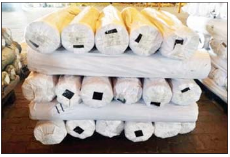
မြန်မာ့စက်မှုဆိပ်ကမ်း၌ ဖမ်းဆီးရမိမှု။

ဇန်နဝါရီ ၁၃ ရက်တွင် အကောက်ခွန်ဦးစီးဌာန၏ စီမံခန့်ခွဲမှုဖြင့် တာဝန်ကျပေးပေါင်းအဖွဲ့များက စစ်ဆေးမှုများ ဆောင်ရွက်ခဲ့ရာ မြန်မာ့စက်မှုဆိပ်ကမ်း၌ ကုန်သေတ္တာနှစ်လုံးအတွင်းမှ တရားဝင်စာရွက်စာတမ်းအထောက်အထား တင်ပြနိုင်ခြင်းမရှိသည့် လုပ်ငန်းသုံးပစ္စည်း ငါးမျိုး (ခန့်မှန်းတန်ဖိုးငွေကျပ် ၃၇၅၄၅၇၅) ကိုလည်းကောင်း၊ သီလဝါဆိပ်ကမ်း၌ ကုန်သေတ္တာ တစ်လုံးအတွင်းမှ တရားဝင်စာရွက်စာတမ်းအထောက်အထားတင်ပြနိုင်ခြင်းမရှိသည့် လုပ်ငန်းသုံးပစ္စည်း တစ်မျိုး (ခန့်မှန်းတန်ဖိုးငွေကျပ် ၁၆၅၇၄၆၈၀) ကို လည်းကောင်း၊ မရမ်းချောင်း အမြဲတမ်းစစ်ဆေးရေးစခန်း၌ ကျိုက်ထိုမြို့မှ ရန်ကုန်မြို့သို့ မောင်းနှင်လာသော မော်တော်ယာဉ်တစ်စီးပေါ်မှ တရားဝင်စာရွက်စာတမ်း အထောက်အထားတင်ပြနိုင်ခြင်းမရှိသည့် စားသောက်ကုန်ပစ္စည်း တစ်မျိုး (ခန့်မှန်းတန်ဖိုးငွေကျပ် ၆၃၈၄၀၀)နှင့် အဆိုပါပစ္စည်းများ တင်ဆောင်လာသည့် Yutong Bus တစ်စီး (ခန့်မှန်းတန်ဖိုးငွေကျပ် ၆၀၀၀၀၀၀) ကို လည်းကောင်း စုစုပေါင်းခန့်မှန်းတန်ဖိုးငွေကျပ် ၂၆၉၂၈၅၅၇၅ ကို ဖမ်းဆီးရမိခဲ့ပြီး အကောက်ခွန်လုပ်ထုံးလုပ်နည်းများနှင့်အညီ အရေးယူဆောင်ရွက်လျက်ရှိသည်။