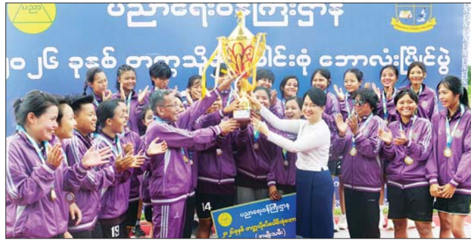
ပြိုင်ပွဲအပြီး ဆုချီးမြှင့်ပွဲကျင်းပရာ နေရာ အလိုက် အကောင်းဆုံးကစားသမားဆုရသူများ၊ ဂိုးသွင်းအများဆုံး ကစားသမားဆုရရှိသူ၊ ပွဲစဉ် တစ်လျှောက် အကောင်းဆုံးကစားသမားဆုရရှိသူ

နေပြည်တော် ဇူလိုင် ၃ ၂၀၂၆ ခုနှစ် ပညာရေးဝန်ကြီးဌာန အဆင့်မြင့်ပညာ ဦးစီးဌာန တက္ကသိုလ်ပေါင်းစုံ အမျိုးသမီးဘောလုံး ပြိုင်ပွဲ ဝိုင်းလှည့်ကို ယနေ့ညနေပိုင်းတွင် နေပြည်တော် ဝဏ္ဏသိဒ္ဓိဘောလုံးကွင်းရှိ လေ့ကျင့်ရေးကွင်း အမှတ် (၁)၂၅ ကျင်းပရာ ပညာရေးဝန်ကြီးဌာန ပြည်ထောင်စု ဝန်ကြီး ဒေါက်တာချောချောစိန်၊ ဒုတိယဝန်ကြီး ဒေါက်တာဇော်မြင့်နှင့် ဦးနေမျိုးလှိုင် တက်ရောက် ကြည့်ရှုအားပေးကြသည်။ ယနေ့ညနေပိုင်းတွင် တက္ကသိုလ်ပေါင်းစုံ အမျိုး သမီး ဘောလုံးပြိုင်ပွဲ ဝိုင်းလှည့်အဖြစ် နေပြည်တော် ဇုန်အသင်းနှင့် ပုသိမ်ဇုန်အသင်းတို့ အကြိတ် အနယ် ယှဉ်ပြိုင်ကစားကြရာ ပုသိမ်ဇုန်အသင်းက နေပြည်တော်ဇုန်အသင်းကို ၃စွဲဂိုး-၃စွဲဂိုးဖြင့် အနိုင် ရရှိခဲ့သည်။