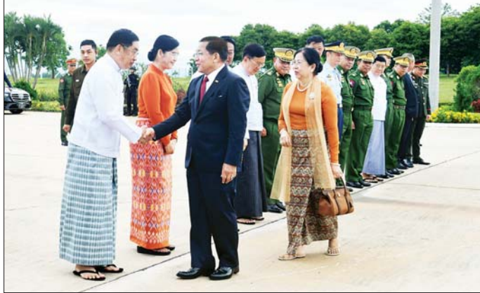
နိုင်ငံတော်သမ္မတ ဦးမင်းအောင်လှိုင်နှင့် ဇနီး ဒေါ်ကြူကြူလှတို့အား ဒုတိယသမ္မတ ဦးညိုစောနှင့် တာဝန် ရှိသူများ ပို့ဆောင်နှုတ်ဆက်ကြသည်။

ချစ်ကြည်ရေးနှိုးဆွမှုနှင့် ပူးပေါင်း ဆောင်ရွက်ရေးဆိုင်ရာ ကိစ္စရပ် များ တိုးမြှင့်နိုင်ရေးဆွေးနွေး ဆောင်ရွက်သွားမည့်အပြင် လာအို နိုင်ငံ၏ ရှေးဟောင်းယဉ်ကျေးမှု နယ်မြေများနှင့် အဆောက်အအုံ များ၊ အထက်ကရေနေရာများသို့ သွားရောက် လေ့လာခြင်းတို့ကို ဆောင်ရွက်သွားမည်ဖြစ်သည်။