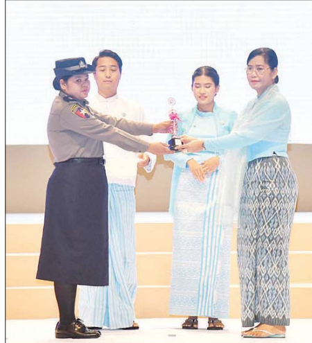
ဒုတိယသမ္မတ (၂) မြန်မာနိုင်ငံ အမျိုးသမီးရေးရာအဖွဲ့ချုပ် ဂုဏ်ထူးဆောင်နာယက ဒေါ်နန်းနီနီအေး ထူးချွန်အမျိုးသမီး ရဲမေဆုရ ရဲအုပ် မြင့်မြတ်သူအား ဂုဏ်ပြုဆုပေးအပ်ချီးမြှင့်စဉ်။