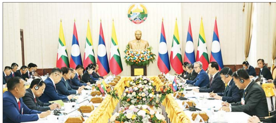
ပြည်ထောင်စုသမ္မတ မြန်မာနိုင်ငံတော် နိုင်ငံတော်သမ္မတ ဦးမင်းအောင်လှိုင်နှင့် လာအိုပြည်သူ့ဒီမိုကရက်တစ်သမ္မတနိုင်ငံ ဝန်ကြီးချုပ် ဆွန်ဆိုင် စိဖန်ဒွန်တို့ တွေ့ဆုံဆွေးနွေးစဉ်။

လိုက်ပါသွားကြသည့်ပြည်ထောင်စု ဝန်ကြီးများ၊ ရှမ်းပြည်နယ်ဝန်ကြီး ချုပ်၊ ကာကွယ်ရေးဦးစီးချုပ်ရုံးမှ အဆင့်မြင့် တပ်မတော်အရာရှိကြီး များ၊ ဒုတိယဝန်ကြီးများ၊ လာအို နိုင်ငံဆိုင်ရာ မြန်မာနိုင်ငံ သံအမတ်ကြီးနှင့် တာဝန်ရှိသူများ တက်ရောက်ကြပြီး လာအိုပြည်သူ့ ဒီမိုကရက်တစ်သမ္မတနိုင်ငံ ဝန်ကြီး ချုပ်နှင့်အတူ လာအိုပြည်သူ့ဒီမို ကရက်တစ် သမ္မတနိုင်ငံ အစိုးရ အဖွဲ့ဝင် ဝန်ကြီးများ၊ ဒုတိယ ဝန်ကြီးများနှင့် တာဝန်ရှိသူများ တက်ရောက်ကြသည်။