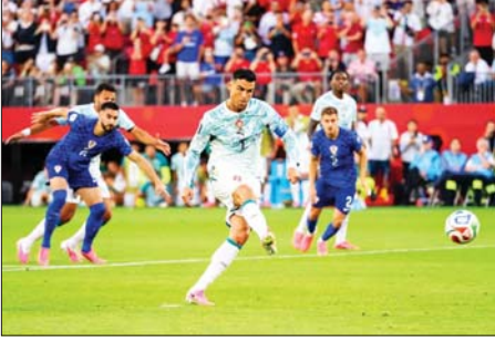
ပေါ်တူဂီအသင်း တိုက်စစ်ကစားသမား စီရော်နယ်ဒို ရိုးသွင်းယူနေစဉ်။

ဖီဖာကမ္ဘာ့ဖလားပြိုင်ပွဲ ၂၂ သင်း ဖြစ်သည့် နာမည်ကြီး ပေါ်တူဂီ အဆင့်မှ အကောင်းဆုံးပွဲစဉ်တစ်ပွဲ နှင့် ခရီးအေးရှားအသင်းပွဲစဉ်ကို