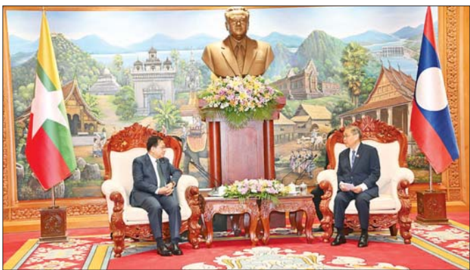
ပြည်ထောင်စုသမ္မတ မြန်မာနိုင်ငံတော် နိုင်ငံတော်သမ္မတ ဦးမင်းအောင်လှိုင်နှင့် လာအိုပြည်သူ့ဒီမိုကရက်တစ်သမ္မတနိုင်ငံ အမျိုးသားလွှတ်တော်ဥက္ကဋ္ဌ ဒေါက်တာ ဆေဆုံဖုန်း ဖုန်ဝိဟိန်တို့ တွေ့ဆုံဆွေးနွေးစဉ်။

လွတ်တော်မှ တာဝန်ရှိသူများ တက်ရောက်ကြသည်။ ထိုသို့တွေ့ဆုံရာတွင် နိုင်ငံ တော်သမ္မတ ဦးမင်းအောင်လှိုင် အနေဖြင့် လာအိုနိုင်ငံသို့ နိုင်ငံတော် အဆင့် ခရီးစဉ်လာရောက်ခြင်း သည် အာဆီယံအဖွဲ့ဝင်နိုင်ငံများ တွင် ပထမဆုံးဖြစ်ခဲ့ပါကြောင်း၊ မြန်မာနိုင်ငံအနေဖြင့် လွတ်လပ် ပြီး တရားမျှတသည့် ပါတီစုံဒီမို ကရေစီအထွေထွေရွေးကောက်ပွဲ ကို အောင်မြင်စွာကျင်းပပြုလုပ်ခဲ့ ပြီး ပြည်သူများက ရွေးကောက် တင်မြှောက်ထားသည့်လွှတ်တော် နှင့် အစိုးရက နိုင်ငံတော်တာဝန် များကို ထမ်းဆောင်လျက်ရှိမှု အခြေအနေများ၊ နိုင်ငံတော်ဖွံ့ဖြိုး တိုးတက်ရေးနှင့် တည်ငြိမ်အေးချမ်း ရေး ကဏ္ဍများတွင် အမျိုးသမီးများ ပါဝင်ဆောင်ရွက်နိုင်မှု အခန်း