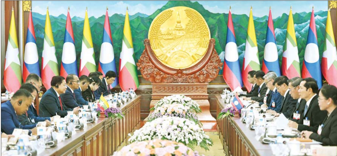
နိုင်ငံတော်သမ္မတ ဦးမင်းအောင်လှိုင်နှင့် လာအိုပြည်သူ့ဒီမိုကရက်တစ်သမ္မတနိုင်ငံ သမ္မတ မစ္စတာ ထောင်လွန်း ဆီဆုလစ်တို့ နှစ်နိုင်ငံကိုယ်စားလှယ်အဖွဲ့ဝင်များနှင့်အတူ တွေ့ဆုံဆွေးနွေးကြစဉ်။

ဆက်လက်ပြီး လာအိုပြည်သူ့ ဒီမိုကရက်တစ်သမ္မတနိုင်ငံသမ္မတက ဆွေးနွေးပြောကြားရာတွင် အဆွေတော် ဦးဆောင်သည့် အစိုးရအဖွဲ့အနေဖြင့် မြန်မာနိုင်ငံ၏ နိုင်ငံရေး ပြုပြင်ပြောင်းလဲမှုများကို တိုးတက်အောင် အမြန်ဆုံး ဆောင်ရွက်နိုင်ခဲ့သည့် အတွက် ဂုဏ်ယူပါကြောင်း၊ မိမိအနေဖြင့် နှစ်နိုင်ငံဆက်ဆံမှုများ တိုးတက်စေရေး အမြဲကြိုးပမ်းဆောင်ရွက် လျက်ရှိပါကြောင်း၊ မိမိတို့နှစ်နိုင်ငံ အနေဖြင့် နှစ်နိုင်ငံသမိုင်းကြောင်း များ တူညီမှုရှိပြီး အာဆီယံအဖွဲ့ဝင် နိုင်ငံများအဖြစ် တစ်ပြိုင်တည်း တွင် ဝင်ရောက်ခဲ့ခြင်းဖြစ်သဖြင့် ပိုမိုချစ်ကြည်ရင်းနှီးသည့် နိုင်ငံ များဖြစ်ကြကြောင်း၊ မြန်မာနိုင်ငံ သည် လာအိုနိုင်ငံ၏ အယုံကြည် ရဆုံးနှင့် အရင်းနှီးဆုံးမိတ်ဆွေ နိုင်ငံဖြစ်သည့်အတွက် မြန်မာ နိုင်ငံနှင့်ပတ်သက်၍ မိမိတို့နိုင်ငံ အနေဖြင့် အမြဲထောက်ခံအားပေး လျက်ရှိပါကြောင်း၊ မိမိတို့နှစ်နိုင်ငံ ၏ ချစ်ကြည်ရင်းနှီးမှုနှင့် ပူးပေါင်း ဆောင်ရွက်မှုရှိသည့် ဆက်ဆံရေး ကို အာဆီယံ မျက်နှာစာတွင် သာမက ကမ္ဘာ့နိုင်ငံများအလယ် တွင်ပါ ကောင်းမွန်သည့် ပြယုဂ် တစ်ခုအဖြစ် ရောက်ရှိအောင် မြှင့်တင် ဆောင်ရွက်သွားလို့ပါ ကြောင်း၊ အဆွေတော်အနေဖြင့် တရုတ်နိုင်ငံနှင့် အိန္ဒိယနိုင်ငံတို့သို့