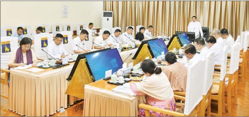
ဒုတိယသမ္မတ ဦးညိုစော မြန်မာအထူးစီးပွားရေးဇုန်ဆိုင်ရာဗဟိုအဖွဲ့ ညှိနှိုင်းအစည်းအဝေးတွင် အမှာစကားပြောကြားစဉ်။

❖ နိုင်ငံတော်သာယာဖို့ သဘာဝပတ်ဝန်းကျင် ထိန်းကြစို့။