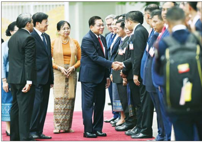
နိုင်ငံတော်သမ္မတ ဦးမင်းအောင်လှိုင် လက်မှတ်ရေးထိုးပွဲအပြီးတွင် တက်ရောက်လာကြသည့် လာအို ပြည်သူ့ဒီမိုကရက်တစ်တစ်သမ္မတနိုင်ငံဘက်မှ တာဝန်ရှိသူများအား ရင်းရင်းနှီးနှီး နှုတ်ဆက်စဉ်။