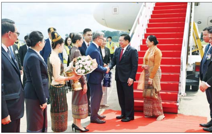
နိုင်ငံတော်သမ္မတ ဦးမင်းအောင်လှိုင်နှင့် ဇနီး ဒေါ်ကြူကြူလှတို့အား လာအိုနိုင်ငံ ဒုတိယဝန်ကြီးချုပ်နှင့် နိုင်ငံခြားရေးဝန်ကြီးနှင့်ဇနီးတို့က လိုက်လှုံနှေးထွေးစွာ ကြိုဆိုနှုတ်ဆက်ကြသည်။

ခရီးစဉ်အတွင်း နိုင်ငံတော် သမ္မတသည် လာအိုပြည်သူ့ ဒီမိုကရက်တစ်သမ္မတနိုင်ငံသမ္မတ နှင့် တွေ့ဆုံဆွေးနွေးခြင်း၊ လာအို အမျိုးသားလွှတ်တော် ဥက္ကဋ္ဌ၊ ဝန်ကြီးချုပ်တို့နှင့် တွေ့ဆုံခြင်းနှင့် ပြည်နယ်အုပ်ချုပ် ရေးမှူးများနှင့် တွေ့ဆုံခြင်းတို့ကို ဆောင်ရွက်၍ နှစ်နိုင်ငံအကြား