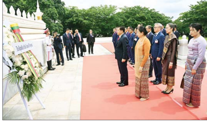
ပြည်ထောင်စုသမ္မတ မြန်မာနိုင်ငံတော် နိုင်ငံတော်သမ္မတ ဦးမင်းအောင်လှိုင်နှင့် ဇနီး ဒေါ်ကြူကြူလှ ဦးဆောင်သည့် မြန်မာအဆင့်မြင့် ကိုယ်စားလှယ်အဖွဲ့ အညွှတ်ရသုရကောင်းစစ်သည်ဗိမာန်၌ ဂုဏ်ပြုပန်းခွေချ၍ အလေးပြုစဉ်။

အလေးပြုသည်။ ယင်းနောက် နိုင်ငံတော် သမ္မတနှင့် ဇနီးတို့သည် လာအို နိုင်ငံမှ အဆင့်မြင့် အရာရှိကြီးများ အား ရင်းရင်းနှီးနှီး နှုတ်ဆက် ကာ ပြန်လည်ထွက်ခွာခဲ့ကြောင်း သတင်းရရှိသည်။ သတင်းစဉ်