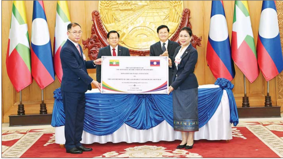
လာအိုပြည်သူ့ဒီမိုကရက်တစ်သမ္မတနိုင်ငံအတွက် ပြည်ထောင်စုသမ္မတမြန်မာနိုင်ငံမှ ပေးအပ်လှူဒါန်းသည့် မြန်မာနိုင်ငံထုတ် ဖြေဆိပ်ဖြေဆေး အလုံး ၆၄၀ အား နိုင်ငံတော်သမ္မတရုံး ပြည်ထောင်စုဝန်ကြီး ဦးခင်မောင်ရီက ပေးအပ်လှူဒါန်းရာ လာအိုပြည်သူ့ဒီမိုကရက်တစ်သမ္မတ နိုင်ငံအစိုးရအဖွဲ့မှ တာဝန်ရှိသူတစ်ဦးက လက်ခံရယူစဉ်။

ထို့နောက် ပြည်ထောင်စု သမ္မတမြန်မာနိုင်ငံတော် နိုင်ငံ တော်သမ္မတ ဦးမင်းအောင်လှိုင် နှင့် လာအိုပြည်သူ့ဒီမိုကရက်တစ် သမ္မတနိုင်ငံ သမ္မတ မစ္စတာ ထောင်လွန်း ဆီဆုလစ်တို့သည် နှစ်နိုင်ငံ ကိုယ်စားလှယ်အဖွဲ့ဝင် များနှင့်အတူ နှစ်နိုင်ငံ တွေ့ဆုံ ဆွေးနွေးပွဲ ကျင်းပပြုလုပ်ပြီး နှစ်နိုင်ငံအကြား နိုင်ငံခေါင်းဆောင် များ အဆက်ဆက်တွင် အစဉ် အလာရှိသည့် ချစ်ကြည်ရင်းနှီး မှုများရှိကြပြီး အပြန်အလှန် နားလည်ယုံကြည်မှုများ ရှိခဲ့သည့် မိတ်ဆွေနိုင်ငံများဖြစ်မှု အခြေအနေ များ၊ မြန်မာ-လာအို ချစ်ကြည် ရေးအသင်းနှင့် လာအို-မြန်မာ ချစ်ကြည်ရေးအသင်းတို့ကို ဖွဲ့စည်း ထူထောင်ထားပြီး နှစ်နိုင်ငံပူးပေါင်း ဆောင်ရွက်မှုများကို မြှင့်တင် ဆောင်ရွက်သွားမည့် အခြေအနေ များ၊ နှစ်နိုင်ငံလွတ်တော်နှစ်ရပ် အကြား ပူးပေါင်းဆောင်ရွက် မှုများ ဆက်လက်တိုးမြှင့်ဆောင် ရွက်သွားမည့် အခြေအနေများနှင့် ပတ်သက်၍ ရင်းနှီးပွင့်လင်းစွာ အမြင်ချင်းဖလှယ် ဆွေးနွေးခဲ့ ကြသည်။