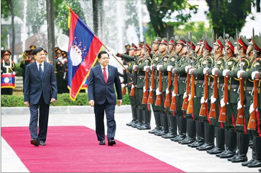
နိုင်ငံတော်သမ္မတ ဦးမင်းအောင်လှိုင်နှင့် လာအိုပြည်သူ့ဒီမိုကရက်တစ်သမ္မတနိုင်ငံသမ္မတ မစ္စတာ ထောင်လွန်း ဆီဆုလစ် တို့ ဂုဏ်ပြုတပ်ဖွဲ့အား စစ်ဆေးစဉ်။

နေပြည်တော် ဇူလိုင် ၃ လာအိုပြည်သူ့ဒီမိုကရက်တစ် သမ္မတနိုင်ငံသမ္မတ မစ္စတာ ထောင်လွန်း ဆီဆုလစ်၏ ဖိတ် ကြားချက်အရ လာအိုပြည်သူ့ဒီမို ကရက်တစ်သမ္မတနိုင်ငံ၌ နိုင်ငံ တော်အဆင့် ချစ်ကြည်ရေးခရီးစဉ် (State Visit) ရောက်ရှိနေသည့် ပြည်ထောင်စုသမ္မတ မြန်မာနိုင်ငံ တော် နိုင်ငံတော်သမ္မတ ဦးမင်း အောင်လှိုင်အား ယနေ့နံနက်ပိုင်း တွင် လာအိုပြည်သူ့ဒီမိုကရက်တစ် သမ္မတနိုင်ငံ သမ္မတ မစ္စတာ ထောင်လွန်း ဆီဆုလစ်က လာအို သမ္မတအိမ်တော်၌ ဂုဏ်ပြုတပ်ဖွဲ့ ဖြင့် ကြိုဆိုပြီး တွေ့ဆုံဆွေးနွေး သည်။