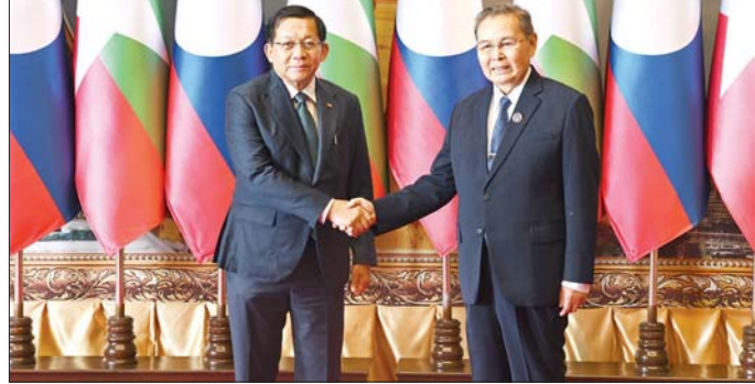
ပြည်ထောင်စုသမ္မတ မြန်မာနိုင်ငံတော် နိုင်ငံတော်သမ္မတ ဦးမင်းအောင်လှိုင်နှင့် လာအိုပြည်သူ့ဒီမိုကရက်တစ်သမ္မတနိုင်ငံ အမျိုးသားလွှတ်တော်ဥက္ကဋ္ဌ ဒေါက်တာဆေဆုံဖုန်း ဖုန်ဝိဟိန်တို့ ရင်းရင်းနှီးနှီးနှုတ်ဆက်စဉ်။

ကဏ္ဍကို မြှင့်တင်ဆောင်ရွက် လျက်ရှိမှု အခြေအနေများ၊ မြန်မာ နိုင်ငံတွင် အထွေထွေရွေးကောက်ပွဲ ကျင်းပပြုလုပ်၍ အစိုးရအဖွဲ့သစ် မှ နိုင်ငံတော်တာဝန်များကို နိုင်ငံတော်လျက်ရှိသကဲ့သို့ လာအို နိုင်ငံအနေဖြင့်လည်း မကြာမီ ကာလက ရွေးကောက်ပွဲကျင်းပ၍ အစိုးရအဖွဲ့သစ်မှ နိုင်ငံတော် တာဝန်များကို ထမ်းဆောင်လျက် ရှိခြင်းကြောင့် နှစ်နိုင်ငံအစိုးရအဖွဲ့ အချင်းချင်းနှင့် လွှတ်တော်နှစ်ရပ် အကြား ပူးပေါင်းဆောင်ရွက်မှု များ တိုးမြှင့်ဆောင်ရွက်သွားမည့် အခြေအနေများ၊ လွှတ်တော် အချင်းချင်း ပူးပေါင်းဆောင်ရွက်မှု များမှတစ်ဆင့် နှစ်နိုင်ငံဖွံ့ဖြိုးတိုးတက် ရေးကို များစွာအထောက်အကူ ပြုနိုင်သည့် အခြေအနေများ၊