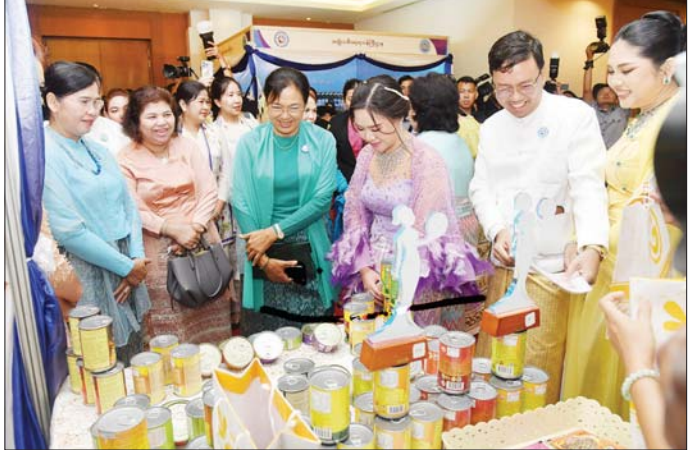
ဒုတိယသမ္မတ(၁)၏ ဇနီး မြန်မာနိုင်ငံ အမျိုးသမီးရေးရာအဖွဲ့ချုပ် ဂုဏ်ထူးဆောင်နာယက ဒေါ်စမ်းစမ်းအေးနှင့် ဒုတိယသမ္မတ (၂) မြန်မာနိုင်ငံ အမျိုးသမီးရေးရာအဖွဲ့ချုပ် ဂုဏ်ထူးဆောင်နာယက ဒေါ်နန်းနီနီအေးတို့ ၂၀၂၆ ခုနှစ် မြန်မာအမျိုးသမီးများနေ့ အထိမ်းအမှတ်အဖြစ် ဝင်းကျင်းပြသထားသည့် ထုတ်ကုန်ပစ္စည်းများကို ကြည့်ရှုအားပေးစဉ်။

ယင်းနောက် မြန်မာနိုင်ငံ အမျိုးသမီးရေးရာအဖွဲ့ချုပ် ဂုဏ်ထူးဆောင်နာယကများသည် အခမ်းအနားသို့ တက်ရောက်လာကြသူများနှင့်အတူ စုပေါင်းမှတ်တမ်းတင် ဓာတ်ပုံရိုက်ပြီး ၂၀၂၆ ခုနှစ် မြန်မာအမျိုးသမီးများနေ့ အထိမ်းအမှတ်အဖြစ် ဝင်းကျင်းပြသထားသည့် အမျိုးသမီးရေးရာဝန်ကြီးဌာန၊ အိမ်တွင်းမှုသက်မွေးလုပ်ငန်း ပညာသင်ကျော့၊ များနှင့် အမျိုးသမီးအသင်းအဖွဲ့အစည်းများမှ ထုတ်ကုန်ပစ္စည်းများကို လှည့်လည်ကြည့်ရှုအားပေးကြသည်။ သတင်းစဉ်