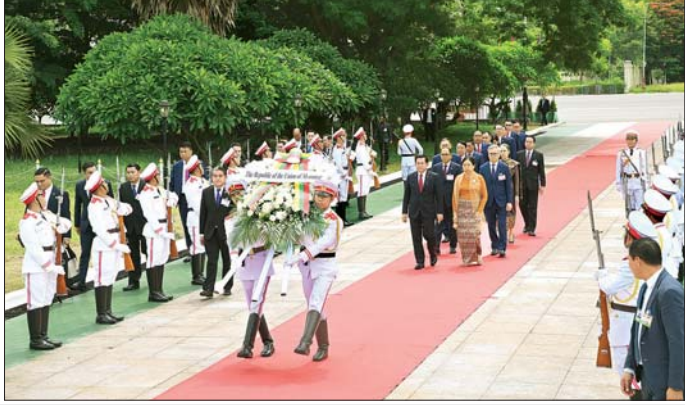
ပြည်ထောင်စုသမ္မတ မြန်မာနိုင်ငံတော် နိုင်ငံတော်သမ္မတ ဦးမင်းအောင်လှိုင်နှင့် ဇနီး ဒေါ်ကြူကြူလှ ဦးဆောင်သည့် မြန်မာအဆင့်မြင့် ကိုယ်စားလှယ်အဖွဲ့ အညွှတ်ရသုရကောင်းစစ်သည်ဗိမာန်၌ ဂုဏ်ပြုပန်းခွေချ၍ အလေးပြုစဉ်။