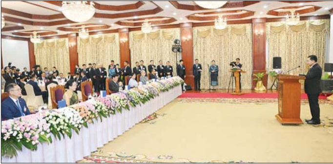
နိုင်ငံတော်သမ္မတ ဦးမင်းအောင်လှိုင် ဂုဏ်ပြုညစာစားပွဲ၌ နှုတ်ခွန်းဆက်စကားပြောကြားစဉ်။