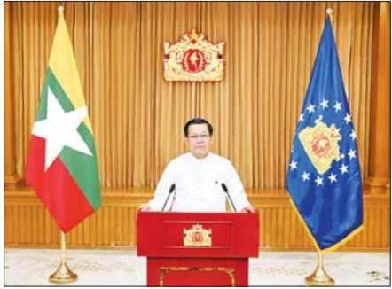
ပိုမိုမြှင့်တင်နိုင်ရေး ဆက်လက်ကြိုးပမ်းဆောင်ရွက်သွားရမှာ ဖြစ်ပါတယ်။

ကမ္ဘာတစ်ဝန်းရှိ လူတော်များမှာ အမျိုးသမီးကိုယ်စားလှယ်များရဲ့ ပါဝင်မှုနှုန်းအနေနဲ့ ၂၀၂၅ ခုနှစ်၊ ဇန်နဝါရီလ ၁ ရက်နေ့အထိ ၅၇ ဒသမ ၂ ရာခိုင်နှုန်းရှိလာပြီး ၂၀၁၅ ခုနှစ်နဲ့ နှိုင်းယှဉ်ရင် ၄ ဒသမ ၉ ရာခိုင်နှုန်း တိုးတက်လာတာ တွေ့ရှိရပါတယ်။ ကမ္ဘာလုံးဆိုင်ရာ အချက်အလက်တွေအရ ဆုံးဖြတ်ချက်ချမှတ်မှုဆောင်ဆဲမှာ အမျိုးသမီးများရဲ့ အဓိပ္ပာယ်ပြည့်ဝတဲ့ပါဝင်မှုနဲ့ ဦးဆောင်မှုအခန်းကဏ္ဍကို