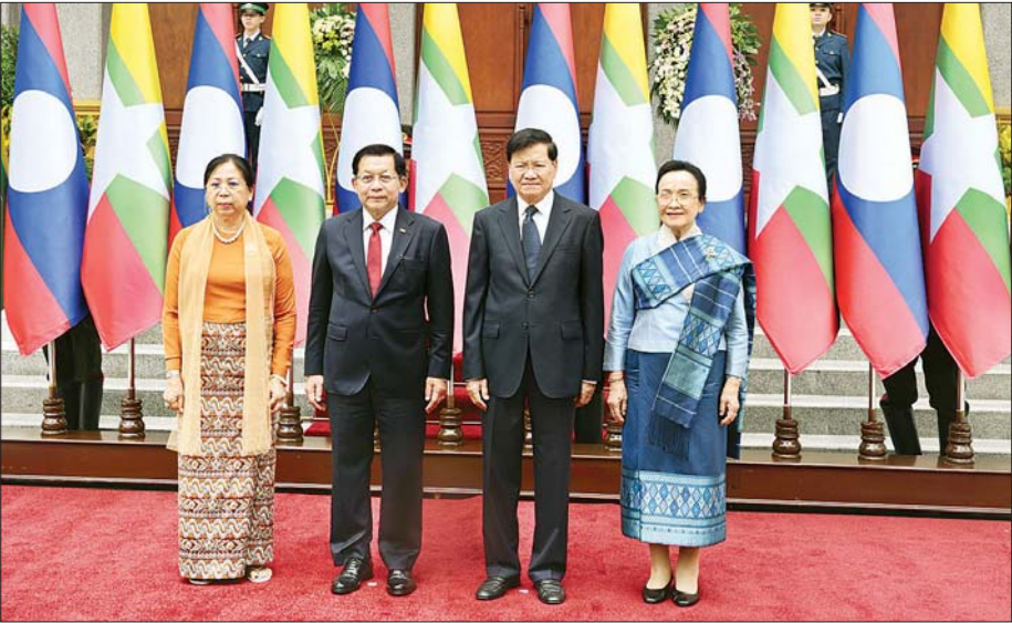
နိုင်ငံတော်သမ္မတ ဦးမင်းအောင်လှိုင်၊ ဇနီး ဒေါ်ကြူကြူလှနှင့် လာအိုပြည်သူ့ဒီမိုကရက်တစ်သမ္မတနိုင်ငံ သမ္မတ မစ္စတာ ထောင်လွန်း ဆီဆုလစ်နှင့် ဇနီး မစ္စမိ နားလီ ဆီစုလီ တို့ စုပေါင်းမှတ်တမ်းတင် ဓာတ်ပုံရိုက်စဉ်။

သမ္မတမြန်မာနိုင်ငံတော် နိုင်ငံ တော်သမ္မတ ဦးမင်းအောင်လှိုင် နှင့် လာအိုပြည်သူ့ဒီမိုကရက်တစ် သမ္မတနိုင်ငံ သမ္မတ မစ္စတာ ထောင်လွန်း ဆီဆုလစ်တို့သည် နှစ်နိုင်ငံ ကိုယ်စားလှယ်အဖွဲ့ဝင် များနှင့်အတူ တွေ့ဆုံဆွေးနွေး ကြသည်။