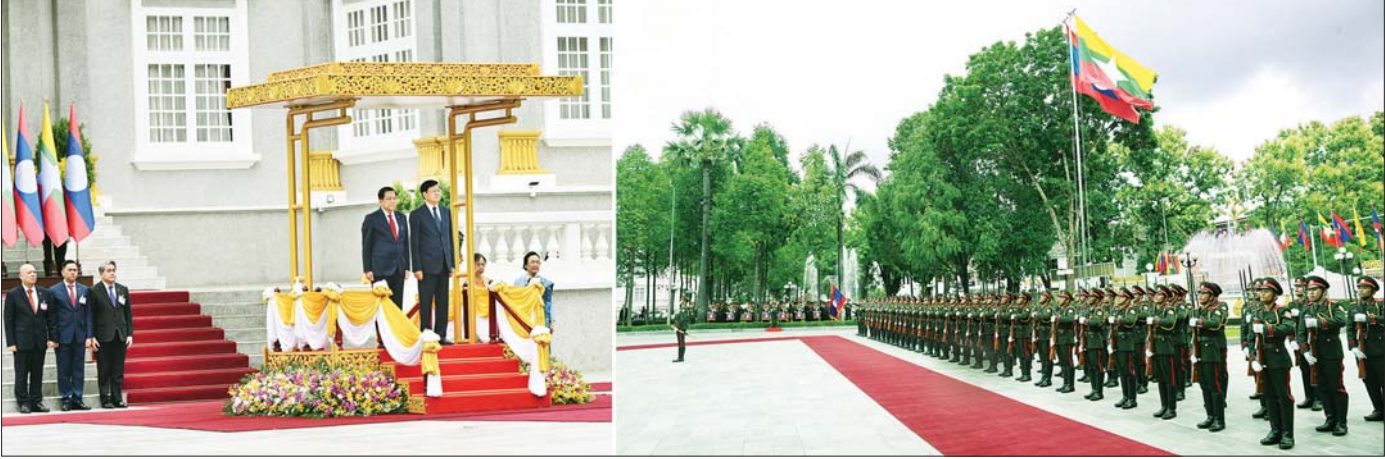
နိုင်ငံတော်သမ္မတ ဦးမင်းအောင်လှိုင်နှင့် လာအိုပြည်သူ့ဒီမိုကရက်တစ်သမ္မတနိုင်ငံသမ္မတ မစ္စတာ ထောင်လွန်း ဆီဆုလစ် တို့ ဂုဏ်ပြုတပ်ဖွဲ့၏ နှစ်နိုင်ငံ နိုင်ငံတော်သီချင်းများဖြင့် တီးမှုတ်ဂုဏ်ပြု အလေးပြုခြင်းကို ခံယူကြစဉ်။

□ ရှေ့ဖိုးမှ တစ်လျှောက်၌ လာအိုကင်းထောက် လူငယ် မောင်မယ်လေးများက နှစ်နိုင်ငံအလံများ ကိုင်ဆောင် ဝေ့ယမ်း၍ နိုင်ငံတော်သမ္မတနှင့် ဇနီးတို့အား ကြိုဆိုနှုတ်ဆက် ကြသည်။