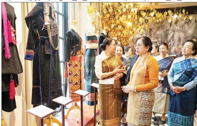
နိုင်ငံတော်သမ္မတ ဦးမင်းအောင်လှိုင်၏ ဇနီး ဒေါ်ကြူကြူလှ ဝိယင်ကျွန်းမြို့ရှိ လာအိုရိုးရာပိုးထည်ပြတိုက်၌ ကြည့်ရှုလေ့လာစဉ်။

လက်မှတ်ရေးထိုးပြီး ပြတိုက် တာဝန်ရှိသူနှင့် လက်ဆောင် ပစ္စည်းများ အပြန်အလှန်ပေးအပ် ကြသည်။