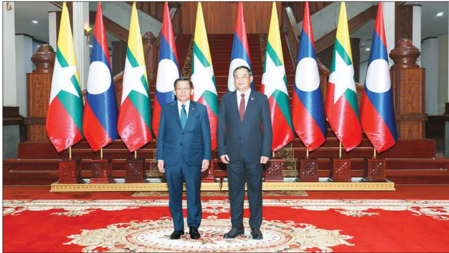
ပြည်ထောင်စုသမ္မတ မြန်မာနိုင်ငံတော် နိုင်ငံတော်သမ္မတ ဦးမင်းအောင်လှိုင်နှင့် လာအိုပြည်သူ့ဒီမိုကရက်တစ် သမ္မတနိုင်ငံ ဝန်ကြီးချုပ် ဆွန်ဆိုင် စိဖန်ဒွန်တို့ မှတ်တမ်းတင်ဓာတ်ပုံရိုက်စဉ်။

တင်ပြသည်။ ဆက်လက်၍ မြန်မာအထူး စီးပွားရေးဇုန်ဆိုင်ရာ ဗဟိုအဖွဲ့ဝင် များက ဇုန်တစ်ခုချင်းအလိုက် လုပ်ငန်းဆောင်ရွက်ပေးနေမှုအခြေ အနေများကို သက်ဆိုင်ရာ ကဏ္ဍ အလိုက် ဆွေးနွေးတင်ပြကြသည်။ ထို့နောက် မြန်မာအထူးစီးပွား ရေးဇုန်ဆိုင်ရာ ဗဟိုအဖွဲ့ဥက္ကဏ္ဍ ဒုတိယသမ္မတက ဆွေးနွေးတင်ပြ ချက်များအပေါ် ပြန်လည်သုံးသပ် ဆွေးနွေး၍ လိုအပ်သည်များကို ပေါင်းစပ်ညှိနှိုင်းဆောင်ရွက်ပေး ပြီး နိဂုံးချုပ်အမှာစာဖြင့်ကြား ကာ အစည်းအဝေးကို ရပ်သိမ်း လိုက်သည်။ သတင်းစဉ်