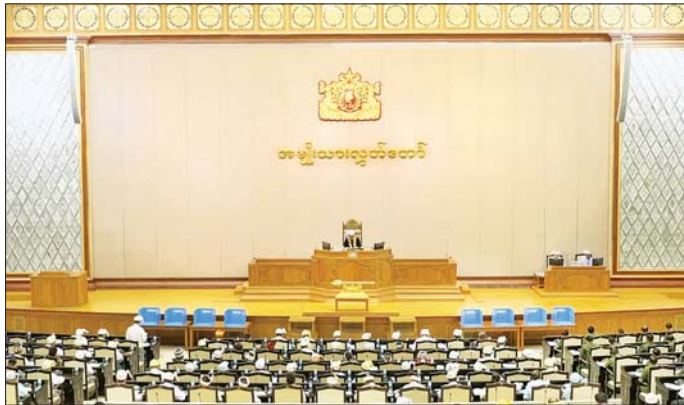
ပေးပါကြောင်း။

အစည်းအဝေးတွင် အမျိုးသားလွှတ်တော်ဥက္ကဋ္ဌ ဦးအောင်လင်းဒွေးက တတိယအကြိမ် အမျိုးသား လွှတ်တော် ဒုတိယပုံမှန်အစည်းအဝေး အဋ္ဌမနေ့သို့ တက်ရောက်ခွင့်ရှိသည့် အမျိုးသားလွှတ်တော် ကိုယ်စားလှယ်ဦးစွာစုစုပေါင်း ၂၀၉ ဦး ရှိသည့်အနက် ယနေ့အစည်းအဝေးသို့ ၂၀၃ ဦး တက်ရောက်သဖြင့် ထက်ဝက်ကျော်သည့်အတွက် အစည်းအဝေး အထ မြောက်ကြောင်းနှင့် စတင်ကျင်းပကြောင်းကြေညာ ကာ အစည်းအဝေး တက်ရောက်မှုအခြေအနေကို လွှတ်တော်၏ အတည်ပြုချက်ရယူ၍ မှတ်တမ်း တင်သည်။