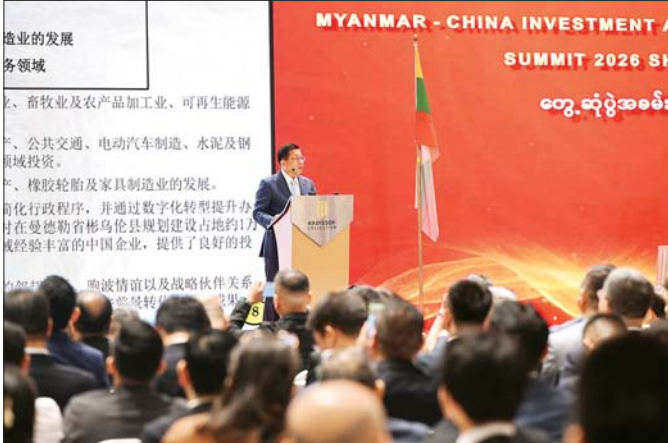
နိုင်ငံတော်သမ္မတ ဦးမင်းအောင်လှိုင် “Myanmar-China Investment and Trade Networking Summit” (MCITP - 2026) Shanghai ဖွင့်ပွဲအခမ်းအနားတွင် အမှာစကားပြောကြားစဉ်။

“Myanmar - China Investment and Trade Networking Summit” (MCITP - 2026) Shanghai တွင် မြန်မာ- တရုတ် ကုမ္ပဏီများမှ ပြခန်းပေါင်း ၃၅ ခန်းကို ကဏ္ဍစုံလင်စွာ ခင်းကျင်းပြသထားရာ နိုင်ငံတော်သမ္မတ ဦးမင်းအောင်လှိုင်က ပြခန်းများ ကို စိတ်ပါဝင်စားစွာ လိုက်လံကြည့်ရှုလေ့လာခဲ့ပြီး စီးပွားရေးလုပ်ငန်းရှင်များနှင့် တာဝန်ခံများ၏ ရှင်းလင်းတင်ပြမှုများအပေါ် သိရှိလိုသည်များ ပြန်လည်မေးမြန်းဆွေးနွေးသည်။ မြန်မာ-တရုတ် ရင်းနှီးမြှုပ်နှံမှုနှင့် ကုန်သွယ်မှုများ ပိုမိုတိုးတက် မြှင့်တင်ပေးရန် ရည်ရွယ်ကျင်းပသည့် အဆိုပါ ဆွေးနွေးပွဲသို့ မြန်မာ- တရုတ်စီးပွားရေးလုပ်ငန်း