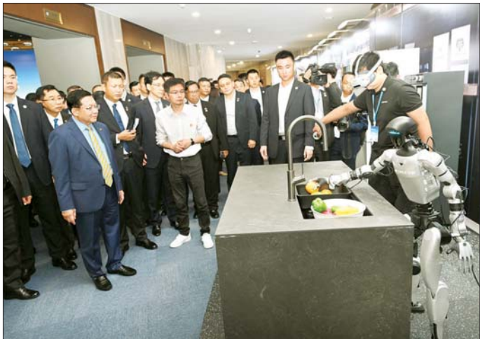
နိုင်ငံတော်သမ္မတ ဦးမင်းအောင်လှိုင် Unitree Robotics Co., Ltd. ၌ စက်ရုံမှ ထုတ်လုပ်ထားသည့် စက်ရုပ်များကို ကြည့်ရှုလေ့လာစဉ်။