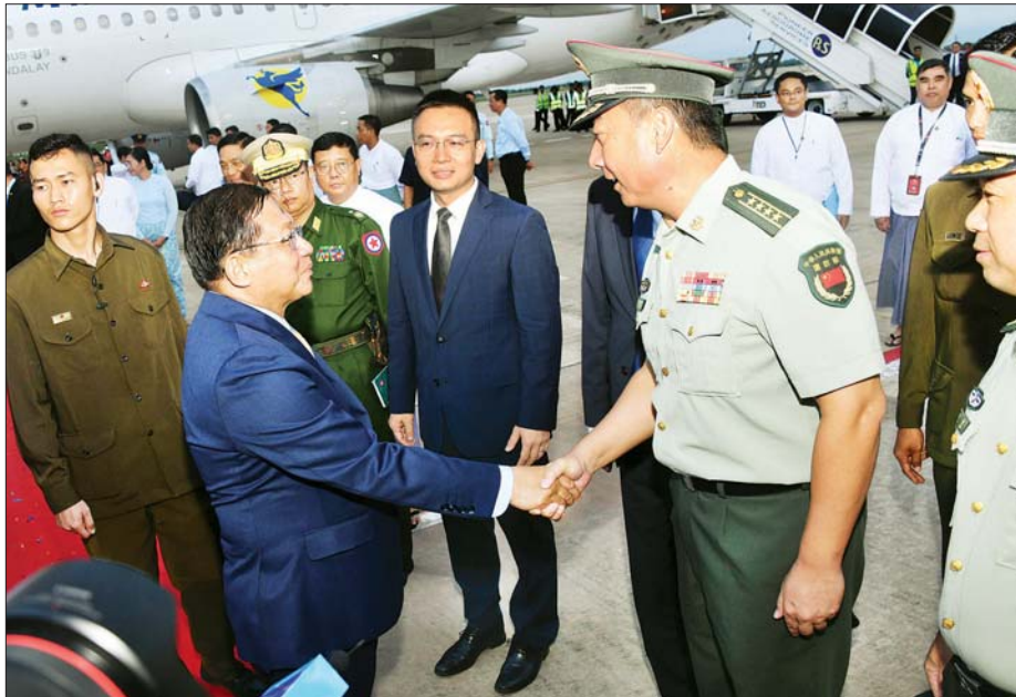
နိုင်ငံတော်သမ္မတ ဦးမင်းအောင်လှိုင် အား နေပြည်တော်လေဆိပ်၌ မြန်မာနိုင်ငံဆိုင်ရာ တရုတ်ပြည်သူ့သမ္မတနိုင်ငံသံရုံးနှင့် စစ်သံရုံးတို့မှ တာဝန်ရှိသူများက ကြိုဆိုနှုတ်ဆက်စဉ်။

❖ ရှေ့ဖို့မှ လေဆိပ်၌ ပို့ဆောင်နှုတ်ဆက်ကြ သည်။