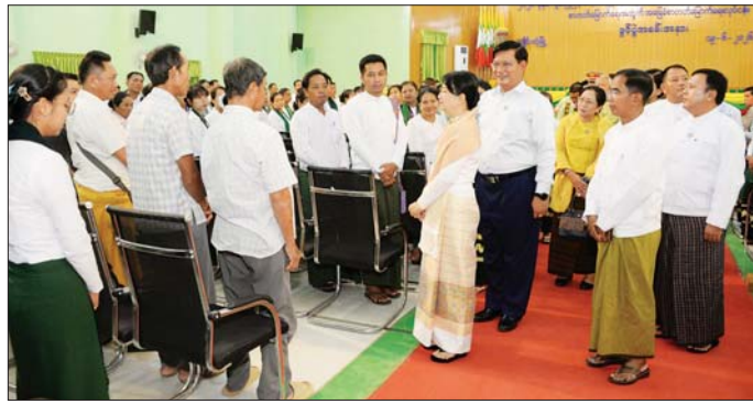
ကျောင်းမှ ကျောင်းသား ကျောင်း အနားကို ဖွင့်လှစ်ပေးကြသည်။ စာတတ်မြောက်ရေးလုပ်ငန်းကို သူများက စာတတ်မြောက်ရေး ထို့နောက် ပြည်ထောင်စု ပိုင်းကူပေး သိချင်ဖြင့် အခမ်း ဝန်ကြီးက ယခုဆောင်ရွက်မည့် ရှမ်းပြည်နယ် (အရှေ့ပိုင်း) ရှိ မြို့နယ် ရှစ်မြို့နယ်တွင် စာသင်

နေပြည်တော် ဇွန် ၁၉ ပညာရေးဝန်ကြီးဌာန ပြည်ထောင် စုဝန်ကြီး ဒေါက်တာချောချောစိန် သည် ယနေ့နံနက်ပိုင်းတွင် ကျိုင်းတုံတက္ကသိုလ်၌ ကျင်းပ သည့် ပညာရေးဝန်ကြီးဌာနနှင့် ရှမ်းပြည်နယ် အစိုးရအဖွဲ့တို့ ပူးပေါင်းကျင်းပသည့် ရှမ်းပြည် နယ် (အရှေ့ပိုင်း) ကျေးလက်ဒေသ နေ ပြည်သူများနှင့် တိုင်းရင်းသား ပြည်သူများ စာတတ်မြောက်ရေး အတွက် အခြေခံစာတတ်မြောက် ရေးအစီအစဉ်ဖွင့်ပွဲသို့ တက် ရောက်သည်။