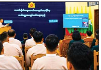
အဂတိလိုက်စားမှုတားဆီးကာကွယ်ရေးဆိုင်ရာ အသိပညာပေးဆွေးနွေး

ရန်ကုန် ဧရိယာအတွင်းရှိ လျှပ်စစ်ဓာတ်အားပေးစက်ရုံများ၊ မော်တော်ယာဉ်သုံး သဘာဝဓာတ်ငွေ့အရောင်းဆိုင်များ၊ အစိုးရနှင့်ပုဂ္ဂလိက စက်ရုံအလုပ်ရုံများသို့ သဘာဝဓာတ်ငွေ့များကို ပိုက်လိုင်းများဖြင့် ပေးပို့လျက်ရှိရာ ၂၀၂၆ ခုနှစ် ဇွန် ၁၇ ရက်တွင် ရန်ကုန်တိုင်းဒေသကြီး၊ မင်္ဂလာတောင်ညွန့် မော်တော်ယာဉ်သုံးသဘာဝဓာတ်ငွေ့ အရောင်းဆိုင် ဆိုင်အမှတ် (၀၂၀) သို့ ဆက်သွယ်ထားသော ၄ လက်မ သဘာဝဓာတ်ငွေ့ပိုက်လိုင်းသည် သာကေတမြို့နယ်၊ (၁) ရပ်ကွက်၊ ဧရာဝတီ လမ်းမကြီးအောက်တွင် ယိုစိမ့်မှုဖြစ်ပွားနေကြောင်း သတင်းပေးပို့ချက်များအရ မြန်မာ့ရေနံနှင့် သဘာဝဓာတ်ငွေ့လုပ်ငန်း၊ ပိုက်လိုင်းပြုပြင် ထိန်းသိမ်းရေးအဖွဲ့သည် ပြည်သူများ ဘေးအန္တရာယ်