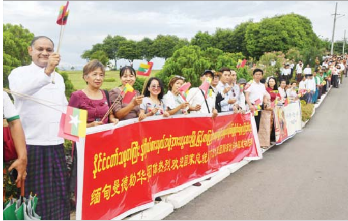
နိုင်ငံတော်သမ္မတ ဦးမင်းအောင်လှိုင် ဦးဆောင်သည့် မြန်မာအဆင့်မြင့်ကိုယ်စားလှယ်အဖွဲ့အား ဗီနိုင်းများ၊ နိုင်ငံတော်အလံငယ်များ ကိုင်ဆောင်ကာ ပြည်သူများက သောင်းသောင်းဖြဖြ ကြိုဆိုကြစဉ်။