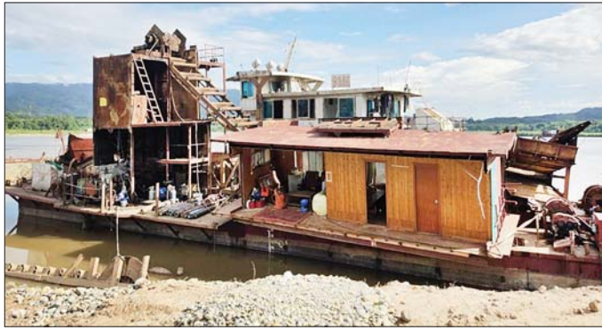
ဖမ်းဆီးရမိသည့် ရွှေမျောဖောင်များအား တွေ့ရစဉ်။

လာအိုနိုင်ငံသား တစ်ဦးတို့ကိုလည်းကောင်း၊ အဆိုပါ နေရာ၏ အနောက်တောင်ဘက် မီတာ ၆၀၀ ခန့် အကွာတွင် ရွှေမျောဖောင် တစ်စီးပေါ်မှ တရုတ်နိုင်ငံ သား ခြောက်ဦး၊ လာအိုနိုင်ငံသား တစ်ဦး စုစုပေါင်း တရုတ်နိုင်ငံသား ၁၇ ဦးနှင့် လာအိုနိုင်ငံသား နှစ်ဦး တို့ကို ဂတ်စ်အိုး နှစ်လုံး၊ လေအိုးအရည် ၃၃ လုံး၊ ဝိုင်နစ် နှစ်လုံး၊ ရွှေတူးရာတွင် အသုံးပြုသည့် ရော်ဘာ ပြား တစ်လိပ်၊ GUANXI YUCHAI ENGINE ခိုင်ခန့် တွဲလျက် စီးစက်တစ်လုံး၊ အလျား ပေ ၁၂၀၊ အနံ ၃၇ ဝေ၊ အခန်း ခြောက်ခန်းပါ ဆောက်လုပ်ဆဲရွှေမျော စင် တစ်ခု၊ STRAIONARY DIESEL ENGINE RATE POWER 250 တစ်လုံးတို့နှင့်အတူ ဖော်ထုတ်ဖမ်းဆီး ရမိခဲ့ကြောင်း သိရသည်။ အဆိုပါ သိမ်းဆည်းရမိ တရားမဝင် ရွှေတူးဖော် ခြင်းတွင် အသုံးပြုမည့်ပစ္စည်းများအား လုပ်ထုံး လုပ်နည်းနှင့်အညီ သက်ဆိုင်ရာဌာနများသို့ လွှဲပြောင်းအပ်နှံခြင်း၊ စနစ်တကျ မီးရှို့ဖျက်ဆီးခြင်း များ ဆက်လက်ဆောင်ရွက်သွားမည်ဖြစ်ကြောင်း