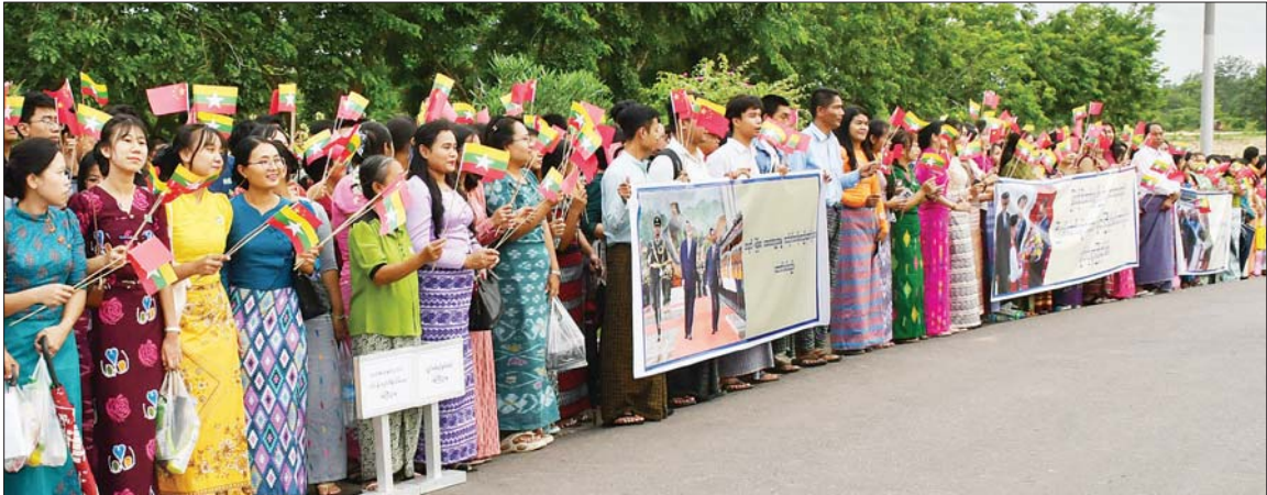
နိုင်ငံတော်သမ္မတ ဦးမင်းအောင်လှိုင် ဦးဆောင်သည့် မြန်မာအဆင့်မြင့်ကိုယ်စားလှယ်အဖွဲ့အား ကြိုဆိုကြသည့် ပြည်သူများအား တွေ့ရစဉ်။

စာမျက်နှာ ၃ မှ ဘင်ခရာ၊ ပန်းဖွားအကအဖွဲ့များ၊ တရုတ်အကအလှအဖွဲ့များ၊ တိုင်းရင်းသားရိုးရာ အကအလှအဖွဲ့များ၊ အနုပညာရှင်များ၊ ဒေသခံပြည်သူများ၊ ဌာနဆိုင်ရာ တာဝန်ရှိသူများက လေဆိပ်တွင် အသင့်စောင့်ကြို၍ လေဆိပ်လေယာဉ်အဆင်းမှ VIP ဆောင်အထိလည်းကောင်း၊ တပ်မတော်လေဆိပ်အင် လမ်းတစ်လျှောက်တွင်လည်းကောင်း “တရုတ်-မြန်မာ နှစ်နိုင်ငံအကြား ချစ်ကြည်ရင်းနှီးမှုအခွန်ရှည်ပါစေ၊ တရုတ်-မြန်မာ နှစ်နိုင်ငံအကြား ဘက်စုံမဟာဗျူဟာမြောက် ပူးပေါင်းဆောင်ရွက်ရေး ကဏ္ဍအလိုက် တိုးမြှင့် ဆောင်ရွက်နိုင်ပါစေ၊ တရုတ်-မြန်မာ ချစ်ကြည်ရေးကို ခိုင်မြဲစေသော သမ္မတကြီးနှင့် အဖွဲ့ဝင်များအား လိုက်လံစွာ ကြိုဆိုပါစေ။ မြန်မာနိုင်ငံဘက်စုံဖွံ့ဖြိုး တိုးတက်ရေးအတွက် ကြိုးပမ်းဆောင်ရွက်ခဲ့သော သမ္မတကြီး ဦးမင်းအောင်လှိုင်အား လိုက်လံစွာကြိုဆိုပါစေ။ တရုတ်-မြန်မာ အေးအတူပူအမျှ အသိုက်