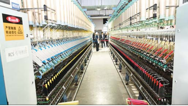
နိုင်ငံတော်သမ္မတ ဦးမင်းအောင်လှိုင် Zhejiang Qingshi New Material Technology Co.,Ltd. ၌ ဝါးချည်မျှင် ထုတ်လုပ်သည့်စက်ဖြင့် ဝါးချည်မျှင်များ ထုတ်လုပ်ထားရှိမှု ကြည့်ရှုလေ့လာစဉ်။