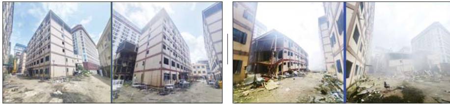
ကရင်ပြည်နယ် ရွှေကျိုက်လယ်မြေရှိ အွန်လိုင်းလိမ်လည်လောင်းကစားမူလုပ်ကိုင်ခဲ့သည့် တရားမဝင် ခုနစ်ထပ်လူနေအဆောက်အအုံအား ယမ်းဖြင့် မဖောက်ခွဲခွဲ (ဝဲပုံ) နှင့် ဖောက်ခွဲဖျက်ဆီးပြီး (ယာပုံ) ကို တွေ့ရစဉ်။

ထိုသို့ ဥပဒေဘောင်အတွင်း ပြန်လည်ဝင်ရောက်လာကြသူများအား ပြန်လည်ကြိုဆိုလက်ခံ၍ လိုအပ်သည့် ကူညီပံ့ပိုးမှုများ ဆောင်ရွက်ပေးကာ မိဘအုပ်ထိန်းသူများထံသို့ စနစ်တကျ ပြန်လည်လွှဲအပ်ပေးလျက်ရှိရာ ဥပဒေဘောင်အတွင်းသို့ ပြန်လည်ဝင်ရောက်ရန် ဆန္ဒရှိသူများ ကျန်ရှိနေသေးကြောင်း သိရှိရပြီး ဥပဒေဘောင်အတွင်း ပြန်လည်ဝင်ရောက်လိုသူများအနေဖြင့် နှိပ်စက်ခံရ ခိုင်း၊ ဖြိုနှိမ်အုပ်ချုပ်ရေးအဖွဲ့များ၊ တပ်စခန်းများနှင့် ရဲစခန်းများသို့ အမြန်ဆက်သွယ်သတင်းပေးလိုပါက ကြိုဆိုလက်ခံကာ လိုအပ်သည့် ကူညီထောက်ပံ့မှုများ ပေးအပ်သွားမည် ဖြစ်ကြောင်းနှင့် လက်နက်/ခဲယမ်းများအတွက် ဆုကြေးငွေများ ပေးအပ်သွားမည်ဖြစ်ကြောင်း သိရသည်။