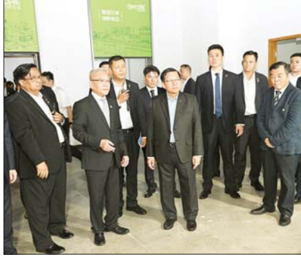
နိုင်ငံတော်သမ္မတ ဦးမင်းအောင်လှိုင် Zhejiang Qingshi New Material Technology Co.,Ltd. ၌ ဝါးချည်မျှင် ထုတ်လုပ်သည့်စက်ဖြင့် ဝါးချည်မျှင်များ ထုတ်လုပ်ထားရှိမှု ကြည့်ရှုလေ့လာစဉ်။

ယင်းနောက် Unitree Robotics Co., Ltd. မှ ထုတ်လုပ်ထားသည့် စွမ်းဆောင် ရည်မြင့် တိရစ္ဆာန်ပုံသဏ္ဍာန် စက်ရုပ် (quadruped robots)၊ လူသားပုံသဏ္ဍာန် စက်ရုပ် (humanoid robots) နှင့် အသိ ဉာဏ်တုနည်းပညာသုံး မော်ဒယ် (AI model) များ အသုံးပြု၍ လူသားတစ်ဦး အသွင်ကဲ့သို့ လှုပ်ရှားသွားလာခြင်း၊ စာမျက်နှာ ၆ သို့