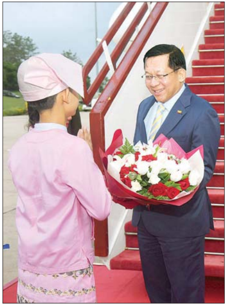
နိုင်ငံတော်သမ္မတ ဦးမင်းအောင်လှိုင် အား လေဆိပ်၌ ကလေးငယ် တစ်ဦးက ပန်းစည်းဖြင့် ကြိုဆိုစဉ်။