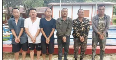
ဖမ်းဆီးရမိသည့် တရုတ်နိုင်ငံသား ခြောက်ဦးအား တွေ့ရစဉ်။