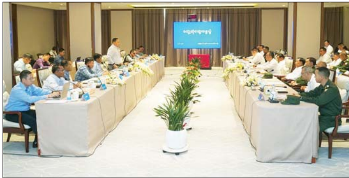
အမျိုးသားစည်းလုံးညီညွတ်ရေးနှင့် ငြိမ်းချမ်းရေးဖော်ဆောင်မှုညှိနှိုင်းရေးကော်မတီနှင့် အမျိုးသားဒီမိုကရက်တစ်မဟာမိတ်အဖွဲ့ (NDA) တို့ ငြိမ်းချမ်းရေး တွေ့ဆုံဆွေးနွေးစဉ်။

ထို့နောက် ဗဟိုအဖွဲ့အတွင်းရေးမှူးက ပုဂ္ဂလိကကျန်းမာရေးလုပ်ငန်းများ တိုးတက်ဖြစ်ထွန်းမှုအခြေအနေနှင့် ပုဂ္ဂလိကကျန်းမာရေးလုပ်ငန်းလိုင်စင်လျှောက်ထားလာသည့် ကိစ္စရပ်များကို တင်ပြရာ ဗဟိုအဖွဲ့ အဖွဲ့ဝင်များက ပိုင်းဝန်းဆွေးနွေးခဲ့ကြကြောင်း သိရသည်။ သတင်းစဉ်