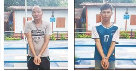
ဖမ်းဆီးရမိသည့် လာအိုနိုင်ငံသား နှစ်ဦးအား တွေ့ရစဉ်။

● ကျောဖုံးမှ မရှိသည့်အတွက် ရှုံးပွဲကြုံတွေ့ခဲ့ခြင်း ဖြစ်သည်။ နံနက် ၁ နာရီခွဲက ယှဉ်ပြိုင်ကစားခဲ့သည့် ဆွစ်ဇာလန်နှင့် ဘော့စနီးယားအသင်းပွဲစဉ်တွင် ဆွစ်ဇာလန်အသင်းက လေးဂိုး-တစ်ဂိုး ဖြင့် နိုင်ပွဲရရှိပြီး နောက်တစ်ဆင့်တက်ရေး အခွင့်အရေးကောင်း ပိုင်ဆိုင် ခဲ့သည်။ ဘော့စနီးယားအသင်းသည် ပွဲချိန်တစ်လျှောက် ဆွစ်ဇာလန် အသင်းဘက်သို့ တုံ့ပြန်တိုက်စစ်ဆင်ကစားမှု အနည်းငယ်သာ ပြုလုပ်