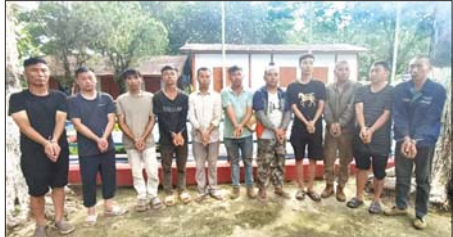
ဖမ်းဆီးရမိသည့် တရုတ်နိုင်ငံသား ၁၁ ဦးအား တွေ့ရစဉ်။

နှင့် တရားမဝင် ဝင်ရောက်နေထိုင်သည့် ပြည်ပနိုင်ငံ ဆက်လက်ဆောင်ရွက်သွားမည်ဖြစ်ကြောင်း သိရှိ သားများကိုလည်း ဥပဒေလုပ်ထုံးလုပ်နည်းများနှင့် အညီ ထိရောက်စွာ အရေးယူဆောင်ရွက်ခြင်းများ သတင်းစဉ်