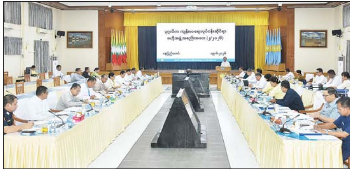
လုပ်ငန်းများကို စိစစ်၍ လုပ်ငန်းလိုင်စင်ထုတ်ပေးရန် စီစဉ်ဆောင်ရွက်နေမှု၊ လိုင်စင်စည်းကမ်းချက် ချိုးဖောက်သော လုပ်ငန်းများကို ဥပဒေ၊ နည်းဥပဒေများနှင့်အညီ အရေးယူဆောင်ရွက်နေမှု၊ ကျန်းမာရေး

နေပြည်တော် ဇွန် ၁၉ ပုဂ္ဂလိကကျန်းမာရေးလုပ်ငန်းဆိုင်ရာ ဗဟိုအဖွဲ့အစည်းအဝေး (၂/၂၀၂၆) ကို ယနေ့နံနက်ပိုင်းတွင် နေပြည်တော်ရှိ ကျန်းမာရေးဝန်ကြီးဌာန အစည်းအဝေးခန်းမ၌ ကျင်းပရာ ပုဂ္ဂလိကကျန်းမာရေးလုပ်ငန်းဆိုင်ရာဗဟိုအဖွဲ့ဥက္ကဋ္ဌ ကျန်းမာရေးဝန်ကြီးဌာန ပြည်ထောင်စုဝန်ကြီး ခေါက်တာသက်ခိုင်ဝင်းနှင့် ဗဟိုအဖွဲ့ အဖွဲ့ဝင်များ၊ အထူးဖိတ်ကြားထားသူများ တက်ရောက်ကြသည်။