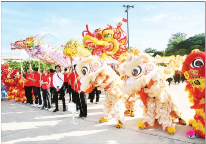
နိုင်ငံတော်သမ္မတ ဦးမင်းအောင်လှိုင် ဦးဆောင်သည့် မြန်မာအဆင့်မြင့်ကိုယ်စားလှယ်အဖွဲ့အား ကြိုဆို ကြသည့် တရုတ်အကအလှအဖွဲ့များကို တွေ့ရစဉ်။

ကြသည်။ ပူးပေါင်းဆောင်ရွက် ထိုပြင် နိုင်ငံတော်သမ္မတ ဦးမင်းအောင်လှိုင် ဦးဆောင်သည့် မြန်မာအဆင့်မြင့် ကိုယ်စားလှယ် အဖွဲ့အနေဖြင့် နိုင်ငံတော်အကျိုး စီးပွားကို တစ်စက်မတ်မတ် ဦးတည်ပြီး ခရီးစဉ်အတွင်း တရုတ်ပြည်သူ့သမ္မတ နိုင်ငံနှင့် ပြည်ထောင်စုသမ္မတမြန်မာနိုင်ငံ တို့အကြား ချစ်ကြည်ရင်းနှီးမှု နှင့် ပူးပေါင်းဆောင်ရွက်မှုများ တိုးမြှင့်နိုင်ခဲ့မှု၊ အာကာသနည်းပညာနှင့် အခြား ကဏ္ဍပေါင်းစုံတွင် ပူးပေါင်းဆောင် ရွက်မှုများမြှင့်တင်နိုင်ခဲ့ပြီး မြန်မာ နိုင်ငံပြည်သူများ၏ အကျိုးစီးပွား တိုးတက်ရေး ဦးတည်ကြိုးပမ်း အားထုတ် ဆောင်ရွက်နိုင်ခဲ့မှု အတွက် တရုတ်-မြန်မာ ချစ်ကြည် ရေးအသင်းမှ တာဝန်ရှိသူများနှင့် အသင်းအဖွဲ့များအလိုက်မှ တာဝန် ရှိသူများ၊ တိုင်းရင်းသား၊ တိုင်းရင်း သူ သားငယ်၊ သမီးငယ်လေးများ၊ စာမျက်နှာ ၄ သို့