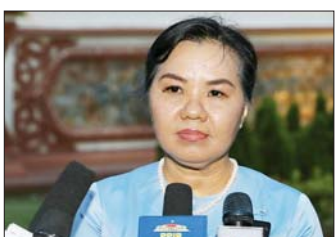
နိုင်ငံတော်သမ္မတရုံး၏ ပြောရေးဆိုခွင့်ရှိသူ ခေါက်တာခိုင်ခိုင်စိုး

ဆောင်ရွက်ဖို့ကိုလည်း အလေးထားပြီး ပြောခဲ့ပါတယ်ရင့်။ ဒါ့အပြင် မကြာသေးခင်က မြန်မာနိုင်ငံမှာ ဆောင်ရွက်ခဲ့တဲ့ အထွေထွေရွေးကောက်ပွဲကိုလည်း ကြိုဆိုတယ်။ လက်ရှိ ကျွန်မတို့ ရွေးကောက်ခံအစိုးရကိုလည်း အပြည့်အဝ ထောက်ခံအားပေးတယ်ဆိုတာကို ခိုင်ခိုင်မာမာပြောကြားခဲ့ပါတယ်။ ဒါ့အပြင် ကျွန်မတို့ အခုလက်ရှိ ရွေးကောက်ခံအစိုးရကနေပြီးတော့ ဆောင်ရွက်နေတဲ့ နိုင်ငံတော်ဖွံ့ဖြိုးတိုးတက်ရေး၊ တည်ငြိမ်အေးချမ်းရေး၊ ငြိမ်းချမ်းရေးကိစ္စတွေကိုလည်း ထောက်ခံပါတယ်။ ရှေ့ဆက်ပြီးလည်း ဆက်လက်ထောက်ခံသွားပါမယ်ဆိုပြီးတော့ အခိုင်အမာ ပြောဆိုခဲ့ပါတယ်။ နောက်တစ်ခုကတော့ နိုင်ငံတကာမျက်နှာစာမှာ၊ ကုလသမဂ္ဂမှာ၊ အာဆီယံအသိုက်အဝန်းမှာ မြန်မာနိုင်ငံအနေနဲ့ တန်းတူညီမျှ အပြည့်အဝပူးပေါင်းပါဝင်ဆောင်ရွက်နိုင်ရေးကိုလည်း ထောက်ခံသွားမယ်ဆိုပြီးတော့ ပြောကြားခဲ့ပါတယ်။ ဒါ့ကြောင့်မို့ ဒီခရီးစဉ်က မြန်မာနိုင်ငံအနေနဲ့ နိုင်ငံတကာမျက်နှာစာမှာ စာမျက်နှာသစ် ဖွင့်လှစ်နိုင်တော့မှာ ဖြစ်တာမို့လို့ ကျွန်မတို့နိုင်ငံအတွက် နိုင်ငံရေးအရ၊ သံတမန်ရေးအရ များစွာအကျိုးရှိတဲ့၊ အောင်မြင်တဲ့ ခရီးစဉ်တစ်ခုရည်ရွယ်ချက်တွေကို ပေါက်မြောက်အောင်မြင်တဲ့ ခရီးစဉ်တစ်ခုလို့ ဆိုနိုင်ပါတယ်ရင့်။ မေး။ ။ တရုတ်နိုင်ငံ ချစ်ကြည်ရေးခရီးစဉ်ကနေပြီးတော့ စီးပွားရေးအတွက် ဘယ်လိုမျိုး အကျိုးကျေးဇူးတွေ ရရှိလာပါသလဲ။ ဖြေ။ ။ ကျွန်မတို့ ဒီသမ္မတကြီးရဲ့ တရုတ်နိုင်ငံ ချစ်ကြည်ရေးခရီးစဉ်မှာ စီးပွားရေးအတွက်လည်း အကျိုးအမြတ်များစွာ ရရှိခဲ့ပါတယ်ရင့်။ ဒီခရီးစဉ်အတွင်းမှာပဲ ရန်ဟိုင်-မှာ Myanmar-China Trade and Investment Networking Summit ကို ကျင်းပခဲ့ပါတယ်။ ဒီ Summit မှာ တရုတ်နိုင်ငံက စီးပွားရေးလုပ်ငန်းရှင် ၅၀၀ ကျော် တက်ရောက်ခဲ့ပြီးတော့ မြန်မာနိုင်ငံက စီးပွားရေး လုပ်ငန်းရှင်