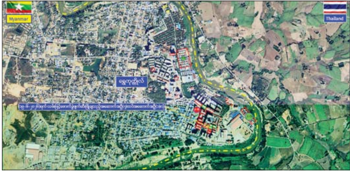
ကရင်ပြည်နယ် မြဝတီမြို့နယ် ရွှေကုက္ကိုလ်နယ်မြေရှိ အွန်လိုင်းလိမ်လည်လောင်းကစားမှုများလုပ်ကိုင် ခဲ့သည့် တရားမဝင်အဆောက်အအုံများအား ဖောက်ခွဲဖျက်ဆီးမှုပြုမြေပုံ။

နေပြည်တော် ဇွန် ၁၉ မြို့နယ် ရွှေကုက္ကိုလ်နယ်မြေနှင့် နှင့် လုပ်ငန်းလုပ်ဆောင်ရာတွင် အွန်လိုင်းလိမ်လည် လောင်း KK Park နယ်မြေများရှိ တရား အသုံးပြုခဲ့သည့် ပစ္စည်းများအား ကစားမှုများကို အခြေချလုပ်ကိုင်ခဲ့ မဝင် အဆောက်အအုံများအား စနစ်တကျ ဖျက်ဆီးခြင်းများကို ကြသည့် ကရင်ပြည်နယ် မြဝတီ အပြီးတိုင် ဖြိုချဖျက်ဆီးခြင်းများ စာမျက်နှာ ၁၆ ကော်လံ ၁-၂