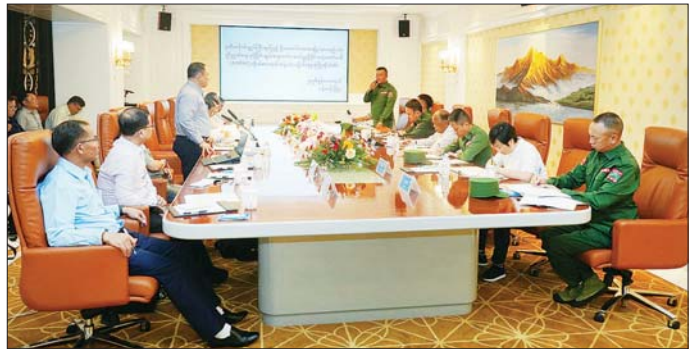
အမျိုးသားစည်းလုံးညီညွတ်ရေးနှင့်ငြိမ်းချမ်းရေးဖော်ဆောင်မှုညှိနှိုင်းရေးကော်မတီနှင့် “ဝ”ပြည်သွေးစည်းညီညွတ်ရေးပါတီ (UWSP)တို့ ငြိမ်းချမ်းရေး တွေ့ဆုံဆွေးနွေးစဉ်။