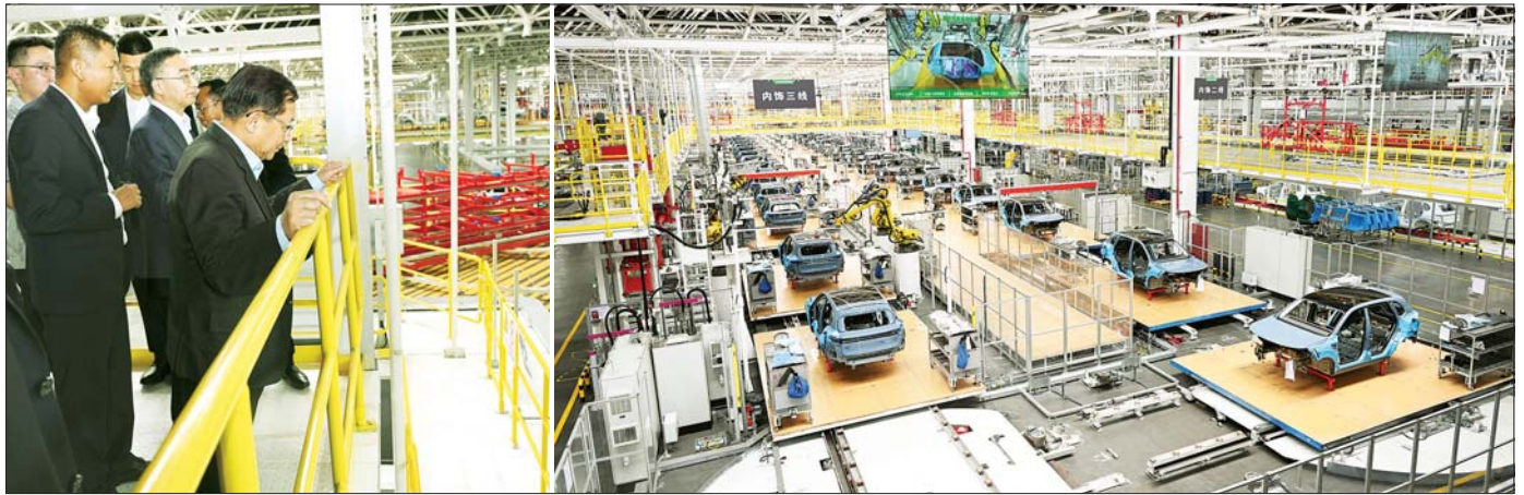
နိုင်ငံတော်သမ္မတ ဦးမင်းအောင်လှိုင် Zhejiang Leapmotor Technology Co., Ltd. ၌ မော်တော်ယာဉ်တပ်ဆင်ထုတ်လုပ်ပုံ လုပ်ငန်းအဆင့်ဆင့်ကို ကြည့်ရှုလေ့လာစဉ်။