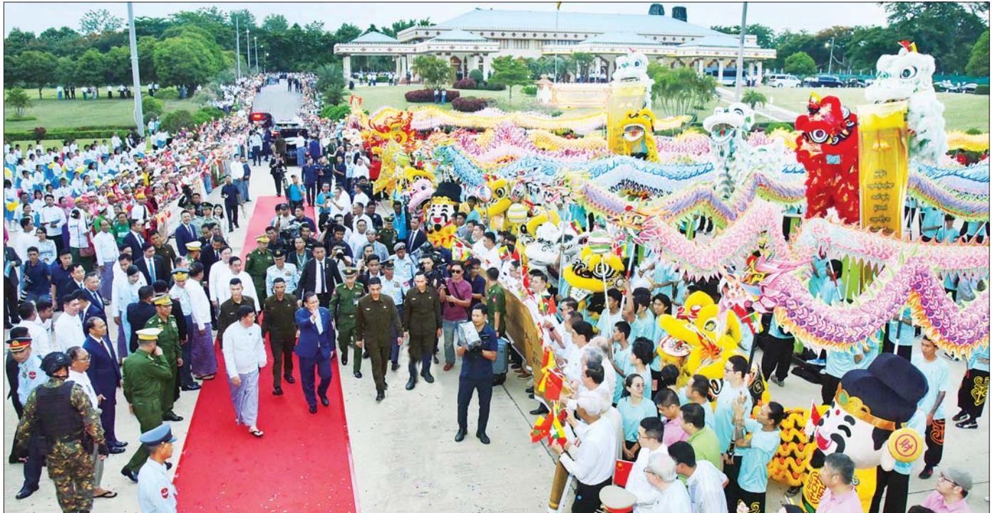
တရုတ်ပြည်သူ့သမ္မတနိုင်ငံနှင့် မြန်မာနိုင်ငံတို့အကြား ချစ်ကြည်ရင်းနှီးမှုနှင့် ပူးပေါင်းဆောင်ရွက်မှုများ ပိုမိုတိုးတက်ခိုင်မာအောင် ဆောင်ရွက်နိုင်ခဲ့သည့် နိုင်ငံတော်သမ္မတ ဦးမင်းအောင်လှိုင် ဦးဆောင်သည့် မြန်မာအဆင့်မြင့်ကိုယ်စားလှယ်အဖွဲ့အား နေပြည်တော်လေဆိပ်၌ ပြည်သူများက သောင်းသောင်းဖြူဖြူဆိုဂုဏ်ပြုနှုတ်ဆက်စဉ်။