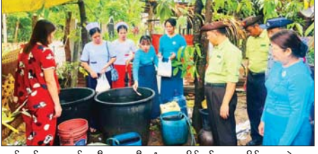
အုပ်ချုပ်ရေးကော်မတီဥက္ကဋ္ဌ ဦးကစောလှိုင်နှင့် ဌာနဆိုင်ရာအဖွဲ့များ ပူးပေါင်းဆောင်ရွက်သည်။

ကျိုက်ထို ဇွန် ၈ မွန်ပြည်နယ် ကျိုက်ထိုမြို့နယ်၌ သွေးလွန်တုပ်ကွေးရောဂါ မဖြစ်ပွား စေရေး ဌာနဆိုင်ရာရုံးများ၊ စာသင်ကျောင်းများ၊ လူနေအိမ်များရှိ ရေတွင်း၊ ရေကန်များသို့သွားရောက်၍ အဘိတ်ဆေးများခတ်ကာ ဖုံး၊ သွန်း၊ လဲ၊ စစ် စနစ်ကို ကျင့်သုံးတတ်စေရန် အသိပညာပေးခြင်းကို ယနေ့နံနက်ပိုင်းတွင် လိုက်လံဆောင်ရွက်ရာ ခရိုင်စီမံခန့်ခွဲရေးနှင့်