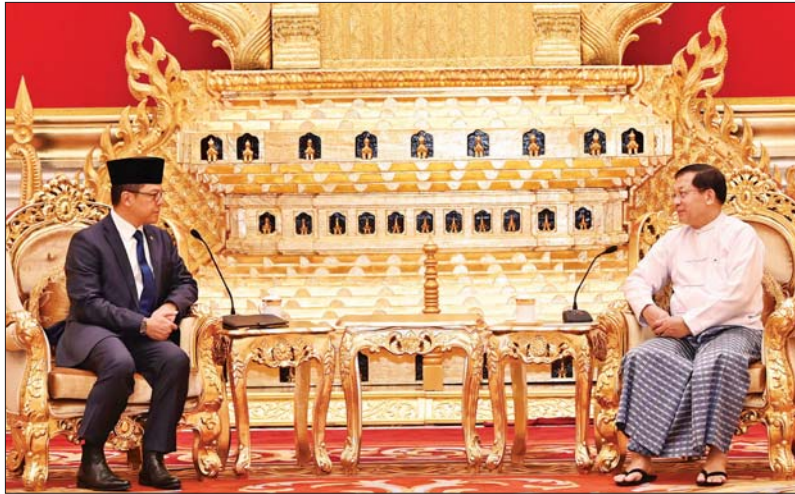
ပြည်ထောင်စုသမ္မတမြန်မာနိုင်ငံတော် နိုင်ငံတော်သမ္မတ ဦးမင်းအောင်လှိုင်ထံ အင်ဒိုနီးရှားနိုင်ငံခြားရေးဝန်ကြီး H.E. Mr. Sugiono လာရောက်ဂါရဝပြုတွေ့ဆုံစဉ်။