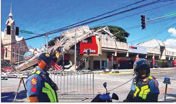
ဖိလစ်ပိုင်နိုင်ငံတောင်ပိုင်း ဆာရန်ဂါနီပြည်နယ်တွင် အင်အားပြင်းထန်သော ငလျင်လှုပ်ခတ်မှုဖြစ်ပွား ပြီးနောက် ထိခိုက်ပျက်စီးမှုများကို တွေ့ရစဉ်။

PHIVOLCS က ထုတ်ပြန်သည်။ ထို့ကြောင့် ငလျင် လှုပ်ခတ်မှုဖြစ်စဉ်နောက်ဆက်တွဲ ထုတ်ပြန်ထား သော ဆူနာမီသတိပေးချက်ကို ရုပ်သိမ်းရန် ဆုံးဖြတ် ခဲ့ခြင်း ဖြစ်သည်။ အဆိုပါ ငလျင်ကြောင့် လူရစ်ဦး သေဆုံးခဲ့ ကြောင်း အမျိုးသားသဘာဝဘေးအန္တရာယ် လျော့ချ ရေးနှင့် စီမံခန့်ခွဲရေးကောင်စီက ပြောကြားပြီး သေဆုံးသူများကို အတည်ပြုနိုင်ရန် စီစစ်လျက်ရှိ ကြောင်းနှင့် ဒေသဒီဃီယာများ၏ ဖော်ပြချက်အရ လူ ၂၀၀ ကျော် ထိခိုက်ဒဏ်ရာရရှိခဲ့ကြောင်း သိရသည်။ ပြင်းအား ၇ ဒသမ ၈ အဆင့်ရှိ အဆိုပါ ငလျင် သည် မင်ဒါနာအိုကျွန်း ဆာရန်ဂါနီပြည်နယ် မာအာဆင်မြို့၏ အနောက်တောင်ဘက် ၂၇ ကီလို မီတာအကွာ မြေအောက်အနက် ၃၃ ကီလိုမီတာကို ဗဟိုပြု၍ ဇွန် ၈ ရက် ဒေသစံတော်ချိန် နံနက် ၇ နာရီ ၃၇ မိနစ်တွင် လှုပ်ခတ်ခဲ့ခြင်း ဖြစ်သည်။