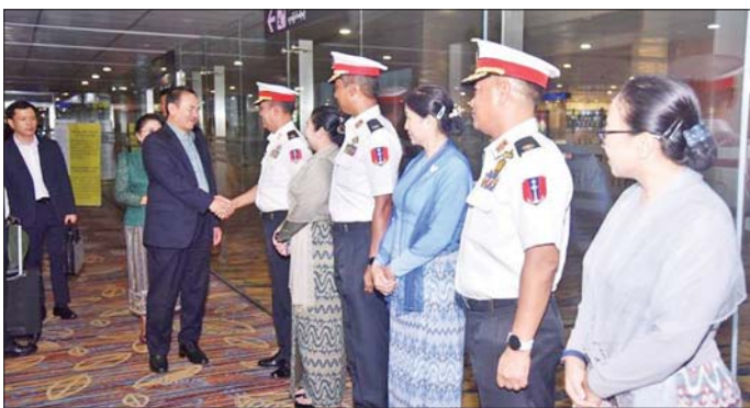
အဆိုပါချစ်ကြည်ရေးကိုယ်စားလှယ်အဖွဲ့သည် ဇွန် ၁၂ ရက်ထိ ၅ ရက်ကြာနေထိုင်၍ မြန်မာနိုင်ငံရှိ အထင်ကရနေရာများသို့ လေ့လာလည်ပတ်ခြင်းနှင့် နှစ်နိုင်ငံရေးတပ်ဆိုင်ရာ ချစ်ကြည်ရေးခရီးစဉ်များ ဆက်လက်ဆောင်ရွက်သွားမည် ဖြစ်ကြောင်း သတင်းရရှိသည်။ သတင်းစဉ်

နေပြည်တော် ဇွန် ၈ ပြည်ထောင်စုသမ္မတမြန်မာနိုင်ငံတော်သို့ ချစ်ကြည်ရေးခရီးလည်ပတ်ရန်အတွက် လာအိုပြည်သူ့တပ်မတော်၏ စစ်ဦးစီးဌာန၊ ဒုတိယအကြီးအကဲဖြစ်သူ Major General Vanthong BOUTTAVONG ဦးဆောင်သော ချစ်ကြည်ရေးကိုယ်စားလှယ်အဖွဲ့သည် ယနေ့ ညနေပိုင်းတွင် ရန်ကုန်မြို့သို့ လေကြောင်းခရီးဖြင့် ရောက်ရှိလာရာ တပ်မတော်(ရေး)မှ အရာရှိကြီးများ၊ မြန်မာနိုင်ငံဆိုင်ရာ လာအိုစစ်သံမှူးနှင့် တာဝန်ရှိသူများက ရန်ကုန်အပြည်ပြည်ဆိုင်ရာလေဆိပ်၌ ကြိုဆိုနှုတ်ဆက်ကြသည်။