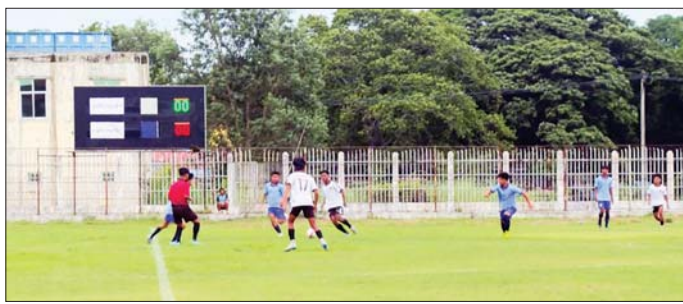
အိမ်ပြင်ပ၌ထွန်းသော မီးများကို နေ့အလင်းရောင်ရှိချိန်တွင် ပိတ်ထားခြင်းဖြင့် လျှပ်စစ်ကို ချွေတာပါ။

ပုသိမ် ဇွန် ၈ ၂၀၂၅ - ၂၀၂၆ ပညာသင်နှစ်၊ တက္ကသိုလ်များ(ပုသိမ်ဇုန်) အမျိုးသား၊ အမျိုးသမီး ဘောလုံးပြိုင်ပွဲနှင့် ဘော်လီဘောပြိုင်ပွဲဖွင့်ပွဲကို ယမန်နေ့ ညနေပိုင်းက ပုသိမ် တက္ကသိုလ် အားကစားကွင်း၌ ကျင်းပရာ တိုင်းဒေသကြီးဝန်ကြီးချုပ် ဦးအေးကျော်နှင့်ဇနီး၊ တိုင်းဒေသကြီးလွှတ်တော်ဥက္ကဋ္ဌ ဦးသိန်းထွန်း၊ တိုင်းဒေသကြီးဝန်ကြီးများနှင့် ဇနီးများ၊ ပုသိမ်တက္ကသိုလ်မှ ဆရာ ဆရာမများ၊ ကျောင်းသားကျောင်းသူများ၊ ပြိုင်ပွဲဝင် အားကစားသမားများ တက်ရောက်ကြသည်။