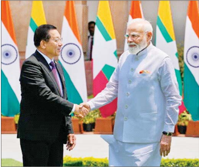
ပြည်ထောင်စုသမ္မတမြန်မာနိုင်ငံတော် နိုင်ငံတော်သမ္မတ ဦးမင်းအောင်လှိုင်နှင့် အိန္ဒိယနိုင်ငံဝန်ကြီးချုပ် H.E. Shri Narendra Modi တို့ ရင်းနှီးနှီးနှီး နှုတ်ဆက်စဉ်။ (၁-၆-၂၀၂၆)

“ပြည်ပတွင် တာဝန်ထမ်းဆောင်နေကြသူများ အနေဖြင့် မိမိတို့နိုင်ငံ၏ အကျိုးစီးပွားအတွက် စည်းလုံးညီညွတ်စွာ ဆောင်ရွက်ကြရန် လိုအပ်ပါ သည်။ မိမိတို့၏ အားလပ်ချိန်များကို အကျိုးရှိစွာ