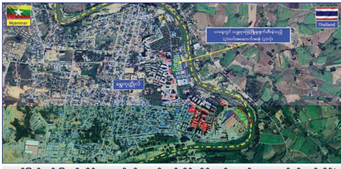
ကရင်ပြည်နယ် မြဝတီခရိုင် ရွှေကုက္ကိုလ်ဒေသရှိ အွန်လိုင်းလိမ်လည်လောင်းကစားလုပ်ငန်းလုပ်ကိုင်ခဲ့ သည့် တရားမဝင်အဆောက်အအုံများအား ဖောက်ခွဲဖျက်ဆီးမှုနေရာပြမြေပုံ။ အတွင်း လုံးဝအခြေမပြုနိုင်ရေးအတွက် ပြည်တွင်း ပေါင်းစပ်ညှိနှိုင်း၍ တက်ကြွစွာ ဆောင်ရွက်လျက်ရှိ အင်အားစုများအပြင် အိမ်နီးချင်းနိုင်ငံများနှင့်လည်း ကြောင်း သတင်းပေးရရှိသည်။ သတင်းစဉ်

နှင့် ဖောက်ခွဲဖျက်ဆီးမည့် အဆောက်အအုံ အလုံး ၂၀ ဟူ၍ အဆောက်အအုံ အမျိုးအစားအလိုက် ခွဲခြား သတ်မှတ်ပြီး စနစ်တကျ ဖြိုချဖျက်ဆီးလျက်ရှိ ကြောင်း သိရသည်။ ယနေ့တွင် ယာဉ်၊ ယန္တရားဖြင့် ဖြိုချဖျက်ဆီးရန် သတ်မှတ်ထားသည့် အဆောက်အအုံ ၅၇ လုံးအနက် သုံးထပ်လူနေအဆောက်အအုံ သုံးလုံးကို ယာဉ်၊ ယန္တရားများအသုံးပြု၍ စနစ်တကျ ထပ်မံဖြိုချ ဖျက်ဆီးခဲ့ရာ ယနေ့အထိ စုစုပေါင်း အဆောက်အအုံ ၄၅ လုံးအား စနစ်တကျ ဖြိုချဖျက်ဆီးပြီးဖြစ်ကြောင်း နှင့် ဖျက်ဆီးရန်ကျန်ရှိသည့် တရားမဝင် အဆောက် အအုံ ၂၂ လုံးကိုလည်း ဆက်လက်၍ စနစ်တကျ ဖျက်ဆီးသွားမည်ဖြစ်ကြောင်း သိရသည်။