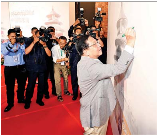
နိုင်ငံတော်သမ္မတ ဦးမင်းအောင်လှိုင်နှင့် ဇနီး ဒေါ်ကြူကြူလှ ၂၀၂၆ ခုနှစ် တရုတ်ရုပ်ရှင်ပြပွဲ သီတင်းပတ်ဖွင့်ပွဲအထိမ်းအမှတ် အမှတ်တရ လက်မှတ်ရေးထိုးကြစဉ်။

ထို့အပြင် တရုတ်ပြည်သူ့သမ္မတနိုင်ငံအနေဖြင့် မြန်မာနိုင်ငံအတွက် အဓိကကျသည့် ပညာရေး၊ ကျန်းမာရေး၊ လူမှုရေး၊ ကျေးလက်ဒေသဖွံ့ဖြိုး