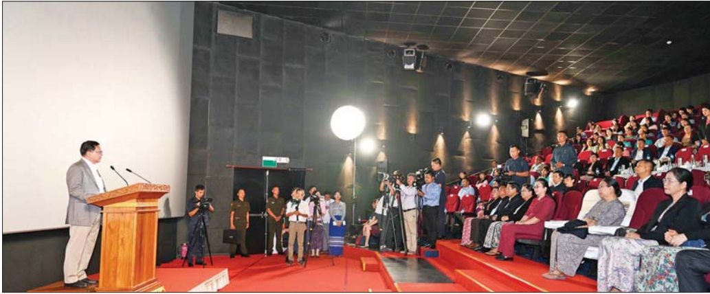
ပြည်ထောင်စုသမ္မတမြန်မာနိုင်ငံတော် နိုင်ငံတော်သမ္မတ ဦးမင်းအောင်လှိုင် တရုတ်-မြန်မာ နှစ်နိုင်ငံအကြား သံတမန်ဆက်ဆံရေး ထူထောင်ခြင်း (၇၆) နှစ်မြောက် အထိမ်းအမှတ် “၂၀၂၆ ခုနှစ် တရုတ်ရုပ်ရှင်ပြပွဲရက်သတ္တပတ် အစီအစဉ်” ဖွင့်ပွဲအခမ်းအနား၌ အမှာစကားပြောကြားစဉ်။

“နောက်တစ်ခုက ခုနကပြောခဲ့တဲ့ ဆွေမျိုး ပေါက်ဖော်ဆက်ဆံရေး အခြေအနေအပေါ်မှာလည်း အများကြီး အထောက်အကူပြုတယ်။ ကမ္ဘာပေါင်းစုံ ပူးပေါင်းဆောင်ရွက်မှုတွေ ရှိပါတယ်။ နောက်ထပ် လည်း ကူးသန်းရောင်းဝယ်မှုဆိုင်ရာ၊ ရင်းနှီးမြှုပ်နှံမှု ဆိုင်ရာ ရှိစွဲရတဲ့ သိပ္ပံနဲ့ နည်းပညာနယ်ပယ်တွေ၊ ကမ္ဘာလှည့်ခရီးသွားလုပ်ငန်းတွေ၊ ကဏ္ဍတွေ