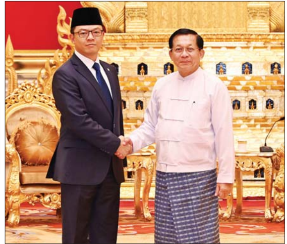
ပြည်ထောင်စုသမ္မတမြန်မာနိုင်ငံတော် နိုင်ငံတော်သမ္မတ ဦးမင်းအောင်လှိုင် အင်ဒိုနီးရှားနိုင်ငံခြားရေးဝန်ကြီး H.E. Mr. Sugiono အား ရင်းရင်းနှီးနှီး နှုတ်ဆက်စဉ်။