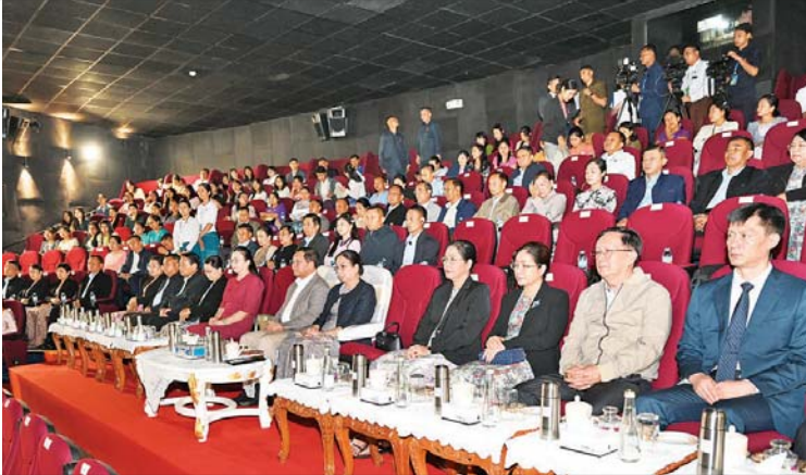
ပြည်ထောင်စုသမ္မတမြန်မာနိုင်ငံတော် နိုင်ငံတော်သမ္မတ ဦးမင်းအောင်လှိုင်နှင့် ဇနီး ဒေါ်ကြူကြူလှ တို့ ၂၀၂၆ ခုနှစ် တရုတ်ရုပ်ရှင်ပြပွဲ ရက်သတ္တပတ်အစီအစဉ်ဆိုင်ရာ ဗီဒီယိုအား ကြည့်ရှုအားပေးစဉ်။