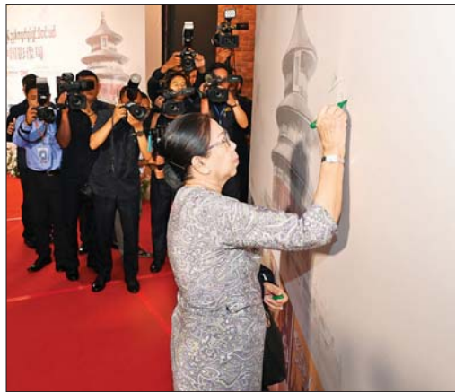
နိုင်ငံတော်သမ္မတ ဦးမင်းအောင်လှိုင်နှင့် ဇနီး ဒေါ်ကြူကြူလှ ၂၀၂၆ ခုနှစ် တရုတ်ရုပ်ရှင်ပြပွဲ သီတင်းပတ်ဖွင့်ပွဲအထိမ်းအမှတ် အမှတ်တရ လက်မှတ်ရေးထိုးကြစဉ်။

တိုးတက်ရေး အစရှိသည့် လူမှုဘဝဖွံ့ဖြိုးတိုးတက်မှု အခန်းကဏ္ဍများတွင် အကူအညီများကို စဉ်ဆက်မပြတ် ပေးအပ်လျက်ရှိကြောင်း၊ အိမ်နီးချင်းကောင်း၊ မိတ်ဆွေကောင်းပီသသည့် တရုတ်နိုင်ငံအစိုးရနှင့် ပြည်သူများက ဆွေမျိုးပေါက်ဖော်ပီသသည့် ရိုင်းပင်းကူညီပေးမှုများအတွက် မြန်မာနိုင်ငံသားများကိုယ်စား များစွာကျေးဇူးတင်ရှိပါကြောင်းကို ပြောကြားလိုကြောင်း။