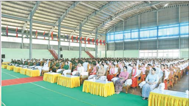
တပ်မတော်ကာကွယ်ရေးဦးစီးချုပ် ဗိုလ်ချုပ်ကြီး ရဲဝင်းဦး တောင်ကြီးတပ်နယ်မှ အရာရှိ၊ စစ်သည်၊ မိသားစုများအား တွေ့ဆုံအမှာစကားပြောကြားစဉ်။

အောင်နေထိုင်ခြင်း၊ စစ်သည်တော်ကျင့်ဝတ်(၆၀)ပါး နှင့်အညီ ပြုမူပြောဆိုခြင်းနှင့် တပ်ကိုတပ်နှင့် တူအောင် စနစ်တကျထိန်းကျောင်းဆောင်ရွက် ခြင်းဖြင့် ပြည်သူလူထု၏ ယုံကြည်အားကိုးမှုကို ရရှိ မည်ဖြစ်ကြောင်း၊ တရားသေစစ်ကို အောင်နိုင်ခြင်း သည် ပြည်သူ၏ အားကိုးယုံကြည်မှုကိုရရှိမည်ဖြစ် ပြီး တပ်မတော်သည် နိုင်ငံ၏ Last Defence ဖြစ်၍ ခိုင်ခိုင်မာမာတည်ဆောက်နေရန်လိုကြောင်း။