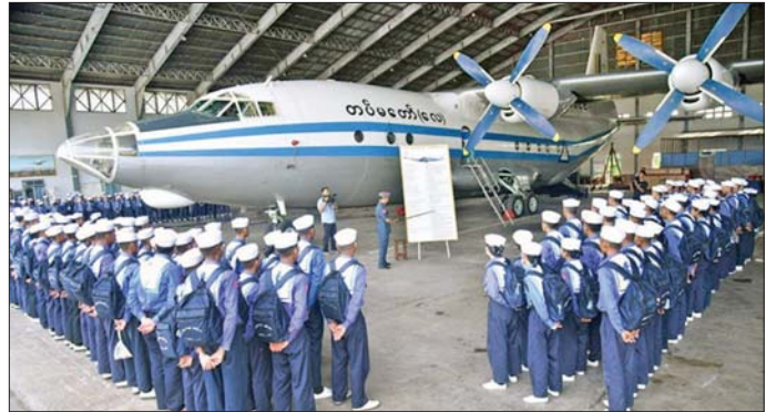
ရေကြောင်းလူငယ် အခြေခံနှင့်တန်းမြင့်သင်တန်းများမှ သင်တန်းသား သင်တန်းသူ မင်္ဂလာဒုံလေတပ်စခန်းသို့ သွားရောက်လေ့လာနေမှုကို တွေ့ရစဉ်။

နေပြည်တော် မေ ၁၉ ရန်ကုန်မြို့သို့ရောက်ရှိနေသည့် ရေကြောင်းလူငယ် အခြေခံနှင့် တန်းမြင့်သင်တန်း အမှတ်စဉ်(၁/၂၀၂၆) စခန်းပေါင်းစုံမှ သင်တန်းသား သင်တန်းသူများသည် သင်တန်းနည်းပြများ၊ အုပ်ချုပ်သူများ၊ တာဝန်ရှိသူများနှင့်အတူ ယနေ့နံနက်ပိုင်းတွင် မင်္ဂလာဒုံမြို့နယ်ရှိ လေတပ်စခန်းဌာနချုပ်သို့ လေ့လာရေးခရီးသွားရောက်ကြသည်။ ဦးစွာ လေကြောင်းနှင့်အာကာသသိပ္ပံပညာရပ်များ၊ လေယာဉ်ပျံသန်းမှုနှင့်သက်ဆိုင်သော အထွေထွေဗဟုသုတများ၊ တပ်မတော်(လေ)တွင်အသုံးပြုလျက်ရှိသော လေယာဉ်/ရဟတ်ယာဉ်များအကြောင်းကို တပ်မတော်(လေ)မှ တာဝန်ရှိသူများက ရှင်းလင်းပြသကြသည်။ ထို့နောက် ရေကြောင်းလူငယ် သင်တန်းသား သင်တန်းသူများသည် မင်္ဂလာဒုံမြို့နယ် လေတပ်စခန်းဌာနချုပ်ရှိ တပ်မတော်လေယာဉ်များ၏ စွမ်းပကားနှင့် အခြားသိသင့်သိထိုက်သည့်များကို စိတ်ပါဝင်စားစွာလေ့လာခဲ့ကြရာ တာဝန်ရှိသူများက လိုက်လံရှင်းလင်းပြသကြသည်။ မွန်းလွဲပိုင်းတွင် ရေကြောင်းလူငယ်အခြေခံနှင့် တန်းမြင့်သင်တန်း စခန်းပေါင်းစုံမှ သင်တန်းသား သင်တန်းသူများသည် လှိုင်မြို့နယ်ရှိ နျူကလီးယားနည်းပညာ သတင်းအချက်အလက်စင်တာသို့