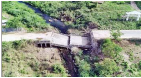
အကြမ်းဖက်သောင်းကျန်းသူပုဂ္ဂိုလ်များ အဖွဲ့များ ယာယီစိုးမိုးထားစဉ် အမှတ်(၉)တံတားအား ခိုင်းထောင်ဖောက်ခွဲဖျက်ဆီးခဲ့မှုကြောင့် တံတား ပျက်စီးမှုအား တွေ့ရစဉ်။