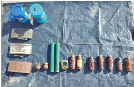
အဆင့်ဆင့်ပြန်လည်တိုက်ခိုက်ထိန်းချုပ်ခဲ့ရာ အကြမ်းဖက်သောင်းကျန်းသူများ နှင့် တိုက်ပွဲကြီး/တိုက်ပွဲငယ် ထိတွေ့မှုစုစုပေါင်း ၂၀၇ ကြိမ် ဖြစ်ပွားခဲ့