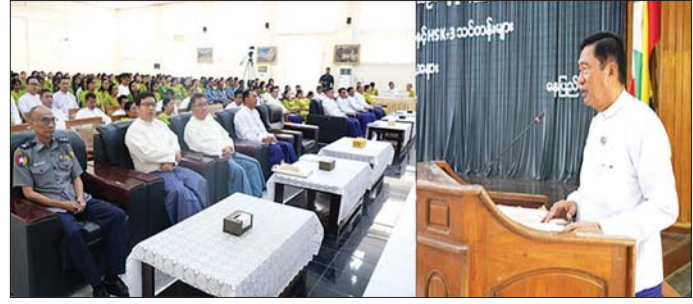
(Tourist Police) များပါ တက်ရောက်ကြခြင်းကြောင့် သင်တန်းဖွင့်လှစ်ရခြင်းသည် ပိုမိုအနှစ်သာရရှိပြီး ကောင်းမွန်လေးနက်သည့် အသွင်သဏ္ဍာန်ကို ဆောင်ကြဉ်းပေးလျက်ရှိပါကြောင်း ပြောကြားသည်။ သိရသည်။ သတင်းစဉ်

နေပြည်တော် မေ ၁၉ ဟိုတယ်၊ခရီးသွားလာရေးနှင့်ယဉ်ကျေးမှုဝန်ကြီးဌာန ၏ ကြီးကြပ်စီမံမှုဖြင့် ဖွင့်လှစ်သော တရုတ်ဘာသာ စကားပြော HSK-1 နှင့် HSK - 3 သင်တန်းများ ဖွင့်ပွဲ ကို ယနေ့နံနက် ၉:၀၀ တွင် အဆိုပါဝန်ကြီးဌာန၌ ကျင်းပရာ ပြည်ထောင်စုဝန်ကြီး ဦးမောင်မြင့်က အမှာစကားပြောကြားရာ၌ တရုတ်ဘာသာစကား သင်တန်းဖွင့်လှစ်ခြင်းမှာ ယခုအကြိမ်နှင့်ဆိုင်လျှင် (၃) ကြိမ်မြောက် ဖွင့်လှစ်ခြင်းဖြစ်ကာ အွန်လိုင်းနှင့် In Person စနစ်နှစ်မျိုးဖြင့် ထိရောက်စွာ သင်ကြား ပို့ချပေးသွားမည်ဖြစ်ပါကြောင်း၊ ယခင်အကြိမ်များ ထက် ထူးခြားချက်အနေဖြင့် ယခုသင်တန်းတွင် ကမ္ဘာ့လှည့်ခရီးသွားလုပ်ငန်း လုံခြုံရေးရတပ်ဖွဲ့ဝင်