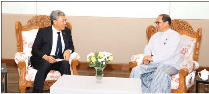
အပြည်ပြည်ဆိုင်ရာလေဆိပ်တွင် ကြိုဆိုခဲ့သည်။ နိုင်ငံသို့ ပြန်လည်ထွက်ခွာသွားကြောင်း သိရသည်။ ကိုယ်စားလှယ်အဖွဲ့သည် ညနေပိုင်းတွင် မလေးရှား