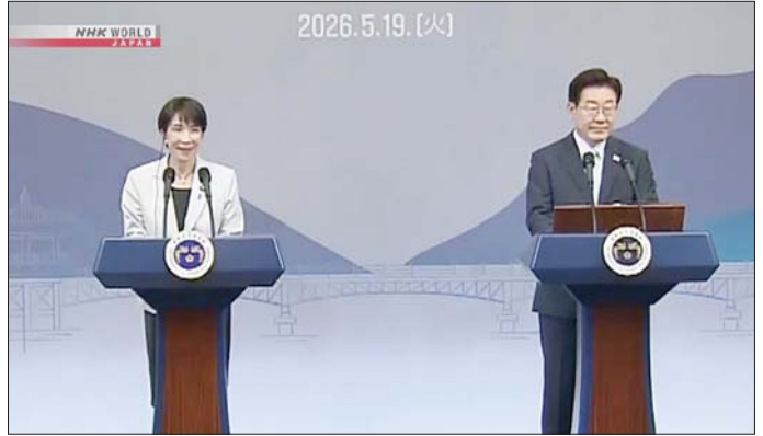
ဂျပန်ဝန်ကြီးချုပ် တာကာအဲချီဆာနာအဲနှင့် တောင်ကိုရီးယားသမ္မတ လီဂျေမြောင်။