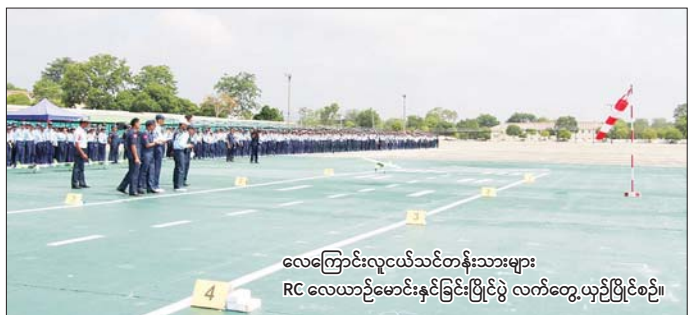
လေကြောင်းလူငယ်သင်တန်းသားများ RC လေယာဉ်မောင်းနှင်ခြင်းပြိုင်ပွဲ လက်တွေ့ယှဉ်ပြိုင်စဉ်။

နေပြည်တော် မေ ၁၉ သင်တန်းအမှတ်စဉ် (၁၀) နှင့် သင်တန်းအမှတ်စဉ်(၉)သင်တန်း အခြေခံ လေကြောင်းလူငယ် တန်းမြင့် လေကြောင်းလူငယ် သားများသည် ယနေ့တွင် နေပြည်