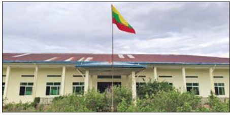
တပ်မတော်စစ်ကြောင်းများက အကြမ်းဖက်သောင်းကျန်းသူပုဂ္ဂိုလ်များအား အဖွဲ့များ ယာယီစိုးမိုးထားသည့် မောတောင်မြို့ အထွေထွေအုပ်ချုပ်ရေး ဦးစီးဌာနရုံးအား ပြန်လည်သိမ်းပိုက်ရရှိစဉ်။