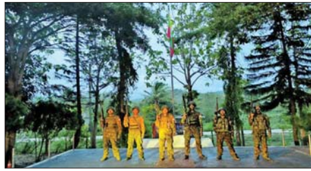
တပ်မတော်စစ်ကြောင်းများက အကြမ်းဖက်သောင်းကျန်းသူ ပုဂ္ဂိုလ်များ အဖွဲ့များ ယာယီစိုးမိုးထားသည့် မောတောင်မြို့အား ပြန်လည် သိမ်းပိုက်ရရှိစဉ်။