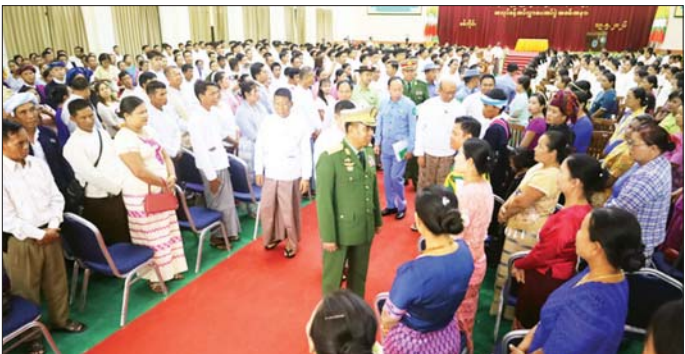
ကျရာဒေသများ၏ ဖွံ့ဖြိုးတိုးတက်ရေးလုပ်ငန်းများ ကို ဒေသခံတိုင်းရင်းသားများနှင့်အတူ ပူးပေါင်းပါဝင် ဆောင်ရွက်ကြရန်နှင့် မူလလုပ်ငန်းတာဝန်များအပြင် ဒေသခံတိုင်းရင်းသားလူမျိုးများ၏ စာပေ၊ ရိုးရာ၊ ဓလေ့ထုံးစံအမွေအနှစ်များကို လေးစားလိုက်နာ ကာ ချစ်မြတ်နိုးစွာ ပိုင်းဝန်းထိန်းသိမ်းကာကွယ်

စစ်ကိုင်း မေ ၁၉ ပြည်ထောင်စုတိုင်းရင်းသားလူငယ်များ စွမ်းရည် ဖွံ့ဖြိုးရေးဒီဂရီကောလိပ်(စစ်ကိုင်း) ၂၀၂၅-၂၀၂၆ ပညာသင်နှစ် ဝိဇ္ဇာဘွဲ့၊ သိပ္ပံဘွဲ့အမှတ်စဉ်(၁၉) သင်တန်းဆင်းပွဲနှင့် အလုပ်ခန့်အပ်လွှာပေးအပ်ပွဲ အခမ်းအနားကို ယနေ့နံနက်ပိုင်းက အဆိုပါကောလိပ် ဘွဲ့နှင်းသဘင်ခန်းမ၌ ကျင်းပသည်။ အခမ်းအနားသို့ နယ်စပ်ရေးရာဝန်ကြီးဌာန ပြည်ထောင်စုဝန်ကြီး ဒုတိယဗိုလ်ချုပ်ကြီး ဖုန်းမြတ်၊ စစ်ကိုင်းတိုင်းဒေသကြီးဝန်ကြီးချုပ်၊ တိုင်းဒေသကြီး ဝန်ကြီးများ၊ ပြည်ထောင်စုတိုင်းရင်းသား လူငယ် များ စွမ်းရည်ဖွံ့ဖြိုးရေးဒီဂရီကောလိပ် (စစ်ကိုင်း) ကျောင်းအုပ်ကြီး၊ ဆရာ ဆရာမများ၊ ကျောင်းသား ကျောင်းသူများနှင့် မိသားစုဝင်များ တက်ရောက် ကြသည်။ ဦးစွာ ပြည်ထောင်စုဝန်ကြီးက မိမိတို့တာဝန်