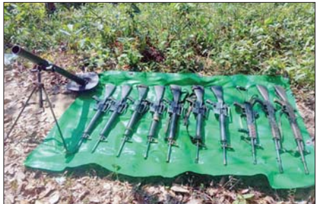
အကြမ်းဖက်သောင်းကျန်းသူ ပုဂ္ဂိုလ်များအဖွဲ့များထံမှ သိမ်းပိုက်ရရှိသည့် လက်နက်၊ ခဲယမ်းနှင့် ဆက်စပ်ပစ္စည်းများ။