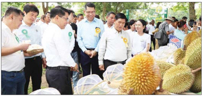
အရည်အသွေး အနံ့အရသာနှင့် အထွက်နှုန်းကောင်း အကဲဖြတ်အမှတ်ပေးကြကြောင်း သိရသည်။ သော ဈေးကွက်ဝင် ဒူးရင်းမျိုးများကို ရွေးချယ် သတင်းစဉ်

ဖော်ထုတ်ရန်နှင့် ပြည်ပသို့ တိုးမြှင့်တင်ပို့နိုင်ရန် ရည်ရွယ်ချက်ဖြင့်ဖြစ်ကြောင်း၊ ထိုပြင် မြန်မာနိုင်ငံ ဒူးရင်းအသင်း ခိုင်ခိုင်မာမာ ရပ်တည်ဆောင်ရွက်နိုင် ရေးအတွက် တိုင်းဒေသကြီး၊ ပြည်နယ်များရှိ စိုက်ပျိုး ထုတ်လုပ်သူများ၊ ပုဂ္ဂလိကအသင်းအဖွဲ့များ၊ သုတေ သနပညာရှင်များ၊ တန်ဖိုးဖြင့်ထုတ်ကုန် ထုတ်လုပ် သောလုပ်ငန်းရှင်များ ပူးပေါင်းပါဝင်သည့် ကွန်ရက် တစ်ခုဖော်ဆောင်ရန် ရည်ရွယ်ကြောင်း ပြောကြား သည်။ ယင်းနောက် ပြည်ထောင်စုဝန်ကြီးနှင့်အဖွဲ့သည် ဒူးရင်းသီးနှံပြခန်းများကို ကြည့်ရှုအားပေးပြီး