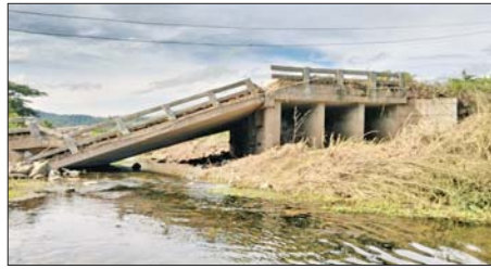
တပ်မတော်စစ်ကြောင်းများက အကြမ်းဖက်သောင်းကျန်းသူ ပုဂ္ဂိုလ်များ အဖွဲ့များ ယာယီစိုးမိုးထားသည့် မောတောင်မြို့အား ပြန်လည် သိမ်းပိုက်ရရှိစဉ်။