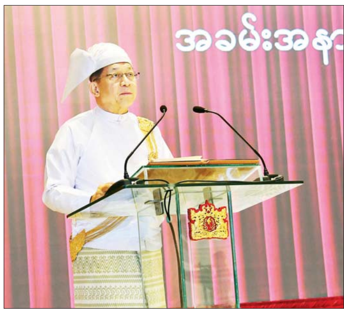
ပြည်ထောင်စုသမ္မတမြန်မာနိုင်ငံတော်နိုင်ငံတော်သမ္မတ ဦးမင်းအောင်လှိုင်က နိုင်ငံတော်အဆင့်ပုဂ္ဂိုလ်များ၊ ပြည်ထောင်စုအစိုးရအဖွဲ့ဝင်များ၊ တိုင်းဒေသကြီးအစိုးရ၊ ပြည်နယ်အစိုးရအဖွဲ့များမှ ဝန်ကြီးချုပ်များ၊ ဒုတိယဝန်ကြီးများအား မိန့်ခွန်းပြောကြားစဉ်။

လိုပါတယ်။ ကျွန်တော့်အနေနဲ့ တစ်နိုင်ငံလုံးအပစ်အခတ် ရပ်စဲရေး (NCA) လမ်းကြောင်းကို မဖြတ်မနေ ဆက်လက်အကောင်အထည်ဖော်သွားမှာ ဖြစ်ပါ တယ်။ ကြုံတွေ့နေရတဲ့ သဘောထားကိုလွှဲမှုတွေ၊ ဆန္ဒနဲ့လိုလားချက်တွေ၊ ဖြစ်သင့်ဖြစ်ထိုက်တာတွေ ကို လက်နက်ကိုင်နည်းလမ်းနဲ့ ဖြေရှင်းနေကြတာ ဟာ လုံးဝမှားယွင်းနေတယ်ဆိုတာ သိရှိလက်ခံကြဖို့ နဲ့ နိုင်ငံနဲ့ပြည်သူရဲ့ အကျိုးကိုကြည့်ပြီး နိုင်ငံရဲ့ အနာဂတ်အတွက် ဒီအမှားကို အချိန်မီ ပြုပြင်ကြဖို့ လိုအပ်ပါတယ်။ ဖြစ်ချင်တာတွေ တောင်းဆိုမှုမယ့် အစား ဖြစ်သင့်တာပဲ တောင်းဆိုပြီး ဖြစ်နိုင်တာတွေ ဆောင်ရွက်သွားဖို့လိုပါတယ်။ ကျွန်တော်တို့တစ်တွေ စည်းစည်းလုံးလုံး ညီညီညွတ်ညွတ်နဲ့ ပြန်လည် တည်ဆောက်သွားကြမယ်ဆိုရင် သိပ်မကြာတဲ့ အချိန်မှာ တည်ငြိမ်အေးချမ်းမှုနဲ့အတူ ကျွန်တော်တို့ မျှော်မှန်းတဲ့ နိုင်ငံသစ်ကိုရောက်မှာ အသေအချာပဲ ဖြစ်ပါတယ်။ အလားတူပါပဲ။ တိုင်းရင်းသားလက်နက်ကိုင် အဖွဲ့များနဲ့ ဆူပူအကြမ်းဖက်မှုကျူးလွန်နေကြသူ များအနေနဲ့လည်း အမှန်နဲ့အမှား၊ အကောင်းနဲ့ အဆိုး၊ အကျိုးနဲ့အပြစ်ကို သေသေချာချာ စဉ်းစား သုံးသပ်ပြီး နိုင်ငံနဲ့ပြည်သူ့အကျိုးအတွက် ပူးပေါင်း ဆောင်ရွက်ပေးကြဖို့ တိုက်တွန်းလိုပါတယ်။ အားလုံး ဆွေးနွေးညှိနှိုင်းအဖြေရှာပြီး စုစည်းညီညွတ်မှု အင်သစ်အားသစ်တွေနဲ့ နိုင်ငံသစ်ကို တက်ညီ လက်ညီ တည်ဆောက်ကြပါစို့လို့ ဖိတ်ခေါ်လိုပါ တယ်။ တစ်ဖက်ကလည်း နိုင်ငံရဲ့စီးပွားရေး၊ ပညာရေး၊ ကျန်းမာရေး၊ လူမှုရေး စတဲ့ကဏ္ဍအသီးသီးကို ဖြင့်မား