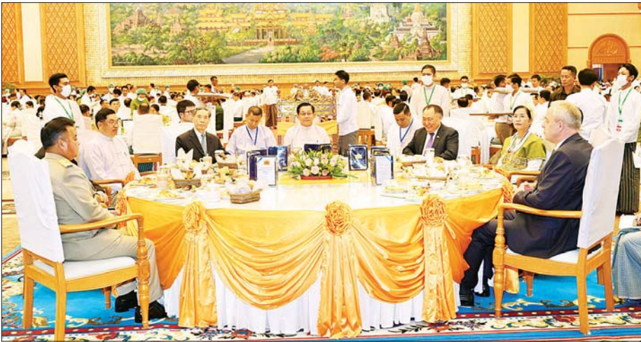
နိုင်ငံတော်သမ္မတ ဦးမင်းအောင်လှိုင် တတိယအကြိမ် လွှတ်တော်များ၏ ပထမပုံမှန်အစည်းအဝေးများ အောင်မြင်စွာပြီးမြောက်ခြင်း ဂုဏ်ပြုနေ့လယ်စာစားပွဲသို့ တက်ရောက်စဉ်။

ပြည်ထောင်စု လွှတ်တော်ဆိုသည်မှာ ပြည်သူ့လွှတ်တော်နှင့် အမျိုးသားလွှတ်တော်တို့ ပူးတွဲဆောင်ရွက်ကြသည့် လွှတ်တော်ဖြစ်သည်နှင့်အညီ နိုင်ငံတော်၏ အမျိုးသားအကျိုးစီးပွား၊ နိုင်ငံတော်နှင့် နိုင်ငံသားများ၏ အကျိုးစီးပွားကို ဖော်ဆောင်နိုင်ရန် အတွက် လက်တွဲညီညီဆောင်ရွက်သွားကြရမည် ဖြစ်ပါကြောင်း၊ ဖွဲ့စည်းပုံအခြေခံဥပဒေ ပုဒ်မ ၁၁၊ ပုဒ်မ ၉၇ (က) တွင် နိုင်ငံတော်၏ ခက်မခဲပြုဖြစ်သည့် ဥပဒေပြုရေးအာဏာ၊ အုပ်ချုပ်ရေးအာဏာနှင့် တရားစီရင်ရေးအာဏာများကို တတ်နိုင်သမျှ ပိုင်းခြားသုံးစွဲခြင်းနှင့် အချင်းချင်း အပြန်အလှန် ထိန်းကျောင်းခြင်းတို့ ပြုသည့် ဆိုသည့် ပြဋ္ဌာန်းချက်အရ အချင်းချင်း အပြန်အလှန်ထိန်းကျောင်းသည့် ဆိုရာတွင်လည်း ကဏ္ဍရပ်တစ်ခုကို အခြားကဏ္ဍရပ်တစ်ခုက ထိပါးရန်မဟုတ်ဘဲ ဥပဒေနှင့်အညီ လျော်ကန်သင့်မြတ်မှုရှိရေး အပြုသဘောအမြင်များနှင့် ဆောင်ရွက်သွားကြရန်သာ ဖြစ်ပါကြောင်း။