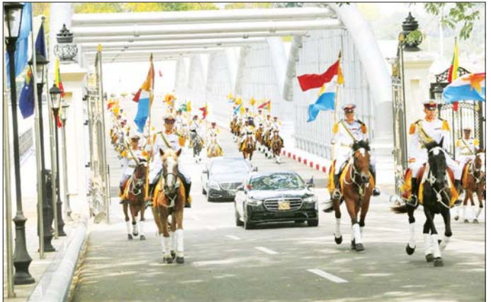
နိုင်ငံတော်သမ္မတ ဦးမင်းအောင်လှိုင် လိုက်ပါလာသည့် အထူးယာဉ်တန်း ဂုဏ်ပြုခြင်းစီးတပ်ပွဲ၏ ဦးဆောင်ကြိုဆိုမှုဖြင့် နိုင်ငံတော်သမ္မတ၏ ဧည့်ဆောင်ခွင့်ရရှိ ဂုဏ်ပြုဆောင်ခန်းမကြီးသို့ ရောက်ရှိလာစဉ်။