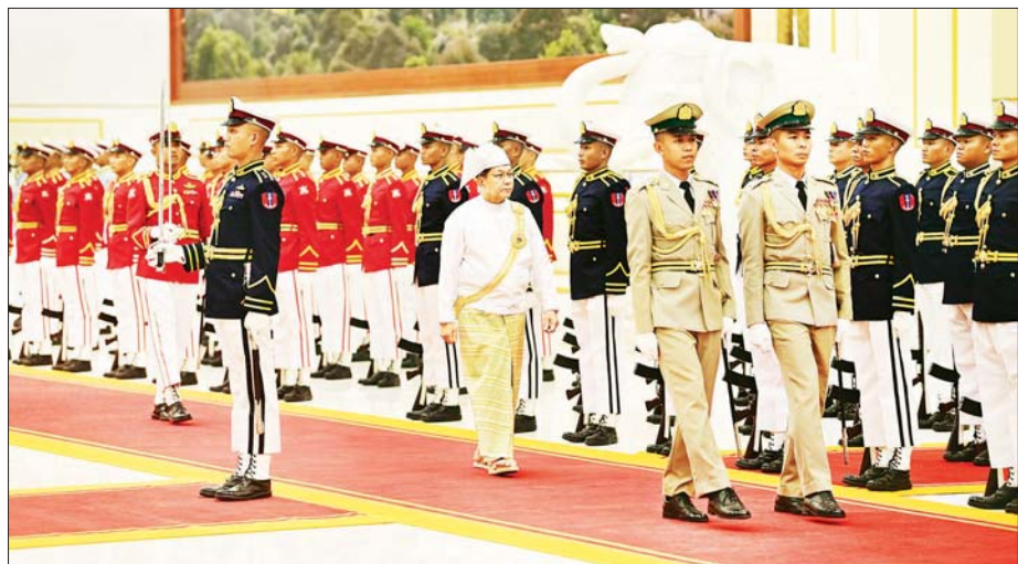
ပြည်ထောင်စုသမ္မတမြန်မာနိုင်ငံတော် နိုင်ငံတော်သမ္မတ ဦးမင်းအောင်လှိုင် ဂုဏ်ပြုတပ်ဖွဲ့အား စစ်ဆေးစဉ်။

ဒေါ်နန်းနီနီအေး၊ ပြည်ထောင်စုလွှတ်တော်နာယက၊ အမျိုးသားဒွေး၊ ပြည်သူ့လွှတ်တော်ဥက္ကဋ္ဌ ဦးခင်ရီ၊ တပ်မတော်ကာကွယ်ရေးဦးစီးချုပ် ဗိုလ်ချုပ်ကြီး ရဲဝင်းဦး၊ ဒုတိယတပ်မတော်ကာကွယ်ရေးဦးစီးချုပ် ကာကွယ်ရေးဦးစီးချုပ် (ကြည်း) ဗိုလ်ချုပ်ကြီး ကျော်စွာလင်း၊ ပြည်ထောင်စုအဆင့်အဖွဲ့အစည်းများမှ အကြီးအကဲများ၊ လွှတ်တော် ဒုတိယဥက္ကဋ္ဌများ၊ ပြည်ထောင်စု ဝန်ကြီးများနှင့် အဆင့်တူပုဂ္ဂိုလ်များ၊ ကာကွယ်ရေးဦးစီးချုပ်ရုံးမှ အဆင့်မြင့်တပ်မတော် အရာရှိကြီးများ၊ ဒုတိယဝန်ကြီးများနှင့် အဆင့်တူပုဂ္ဂိုလ်များ တက်ရောက်ကြပြီး တိုင်းဒေသကြီး၊ ပြည်နယ်ဝန်ကြီးချုပ်များနှင့် အစိုးရအဖွဲ့ဝင်များက Video Conferencing ဖြင့် တက်ရောက်ကြသည်။ အခမ်းအနားတွင် ကတိသစ္စာ