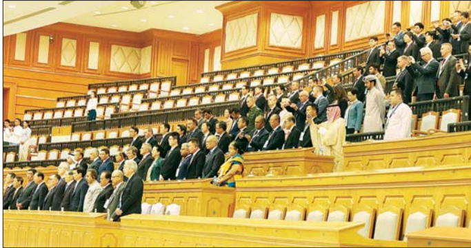
ပြည်ထောင်စုလွှတ်တော် အစည်းအဝေးသို့ အထူးစည်ညည်တော်များအဖြစ် တပ်မတော်ကာကွယ်ရေးဦးစီးချုပ် ဗိုလ်ချုပ်ကြီး ရဲဝင်းဦး၊ ဒုတိယတပ်မတော်ကာကွယ်ရေးဦးစီးချုပ်၊ ကာကွယ်ရေးဦးစီးချုပ် (ကြည်း) ဗိုလ်ချုပ်ကြီး ကျော်စွာလင်းနှင့် တာဝန်ရှိသူများ၊ နိုင်ငံတကာမှ သံတမန်ကြီးများနှင့် သံတမန်များ တက်ရောက်လေ့လာကြစဉ်။