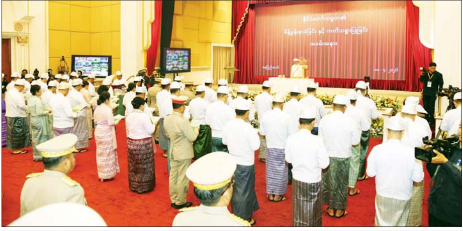
ပြည်ထောင်စုရာထူးဝန်အဖွဲ့ဥက္ကဋ္ဌ၊ နေပြည်တော်ကောင်စီဥက္ကဋ္ဌ၊ ဒုတိယဝန်ကြီးများ၊ ဒုတိယစာရင်းစစ်ချုပ်၊ ပြည်ထောင်စုရာထူးဝန်အဖွဲ့ အဖွဲ့ဝင်များနှင့် နေပြည်တော်ကောင်စီအဖွဲ့ဝင်များအဖြစ် ခန့်အပ်တာဝန်ပေးရန် ရွေးချယ်ထားသော ပုဂ္ဂိုလ်များ နိုင်ငံတော်သမ္မတ၏ ရှေ့မှောက်၌ ကတိသစ္စာပြုကြစဉ်။