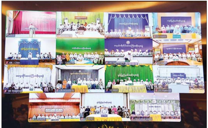
တိုင်းဒေသကြီး၊ ပြည်နယ်ဝန်ကြီးချုပ်များနှင့် အစိုးရအဖွဲ့ဝင်များက Video Conferencing ဖြင့် တက်ရောက်ကြစဉ်။

ထို့နောက် နိုင်ငံတော်သမ္မတ ဦးမင်းအောင်လှိုင်သည် နိုင်ငံတော်သမ္မတ၏ ဧည့်ဆောင်တော်မှ နိုင်ငံတော် သမ္မတရုံးတော်သွားရောက်ရာ လမ်းကြောင်းတစ်လျှောက်၌ နိုင်ငံတော်သမ္မတရုံး ဝန်ထမ်းများက လိုက်လံ နွေးထွေးစွာဖြင့် ခရီးဦးကြိုဆိုနှုတ်ဆက်ခဲ့ကြောင်း သတင်းရရှိသည်။ သတင်းစဉ်