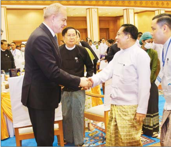
နိုင်ငံတော်သမ္မတ ဦးမင်းအောင်လှိုင် တတိယအကြိမ် လွှတ်တော်များ၏ ပထမပုံမှန်အစည်းအဝေးများ အောင်မြင်စွာပြီးမြောက်ခြင်း ဂုဏ်ပြုနေ့လယ်စာစားပွဲတွင် တက်ရောက်လာကြသည့် နိုင်ငံတကာမှ သံတမန်များအား ရင်းရင်းနှီးနှီးနှုတ်ဆက်စဉ်။

ဖွဲ့စည်းပုံအခြေခံဥပဒေပုဒ်မ ၁၂ အရ ပြည်ထောင်စုလွှတ်တော်တွင် ဥပဒေပြုရေး အာဏာရှိပြီး ပုဒ်မ ၉၆ အ ဇယား (၁) တွင် ပါရှိသည့် ကိစ္စရပ်များကို ဥပဒေပြု ဝန်ကြီးဌာနကြောင့် ဇယား (၁) တွင် ပါရှိသည့် ကိစ္စရပ်များကို ထုတ်ဝေ လေ့လာ ထားကြရန် လိုအပ်ပါကြောင်း၊ ထို့ကြောင့် ဥပဒေကြမ်းရေးဆွဲရေး ဆိုင်ရာ သဘောလက္ခဏာများ၊ ဥပဒေရေးထုံးများကိုလည်း လေ့လာထားကြရန် လိုအပ်ပါကြောင်း၊ ယခုကျင်းပပြီးစီးခဲ့သည့် လွှတ်တော် အစည်းအဝေးများတွင် ဥပဒေပြုရေး၊ အုပ်ချုပ်ရေး၊ တရားစီရင်ရေးဆိုင်ရာ ကိစ္စရပ်များနှင့် စပ်လျဉ်းပြီး ပြည်ထောင်စုလွှတ်တော်မှ နိုင်ငံတော်သမ္မတနှင့် ဒုတိယသမ္မတများ ရွေးချယ် တင်မြှောက်ပေးခြင်း၊ အစိုးရအဖွဲ့ ဖွဲ့စည်းနိုင်ရေး ဆောင်ရွက်ပေးခြင်း၊ လွှတ်တော်ကော်မတီများ ဖွဲ့စည်းခြင်း၊ တရားရေးရာ အဖွဲ့အစည်းများ ပေါ်ပေါက်လာရေး ဆောင်ရွက်ပေးခြင်း စသည့်