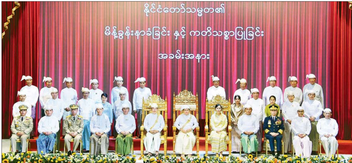
ပြည်ထောင်စုသမ္မတမြန်မာနိုင်ငံတော် နိုင်ငံတော်သမ္မတ ဦးမင်းအောင်လှိုင်၊ ဒုတိယသမ္မတများဖြစ်ကြသည့် ဦးညိုစောနှင့် ဒေါ်နန်းနီနီအေးတို့ ပြည်ထောင်စုဝန်ကြီးများပါဝင်သော ပြည်ထောင်စုအစိုးရအဖွဲ့နှင့်အတူ စုပေါင်းမှတ်တမ်းတင်ဓာတ်ပုံရိုက်စဉ်။

အောင်မြင်စွာ ပြီးမြောက်ကြောင်း ကြေညာပြီး အခမ်းအနားကို ရုပ်သိမ်းလိုက်သည်။