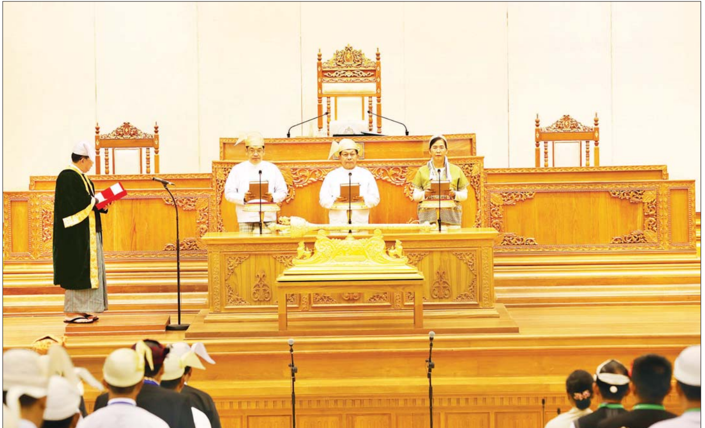
နိုင်ငံတော်သမ္မတအဖြစ် ရွေးချယ်တင်မြှောက်ခံရသူ ဦးမင်းအောင်လှိုင်၊ ဒုတိယသမ္မတအဖြစ် ရွေးချယ်တင်မြှောက်ခံရသူများဖြစ်သည့် ဦးညိုစောနှင့် ဒေါ်နန်းနီနီအေးတို့က ပြည်ထောင်စုလွှတ်တော် နာယက၏ရှေ့မှောက်၌ ကတိသစ္စာပြုကြစဉ်။