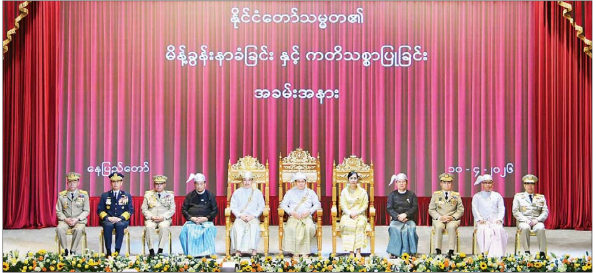
ပြည်ထောင်စုသမ္မတမြန်မာနိုင်ငံတော် နိုင်ငံတော်သမ္မတ ဦးမင်းအောင်လှိုင်၊ ဒုတိယသမ္မတများဖြစ်ကြသည့် ဦးညိုစောနှင့် ဒေါ်နန်းနီနီအေးတို့ အမျိုးသားကာကွယ်ရေးနှင့် လုံခြုံရေးကောင်စီအဖွဲ့ဝင်များနှင့်အတူ စုပေါင်းမှတ်တမ်းတင်ဓာတ်ပုံရိုက်စဉ်။

ထို့နောက် အခမ်းအနားမှူးက ကတိသစ္စာပြုခြင်း အခမ်းအနား