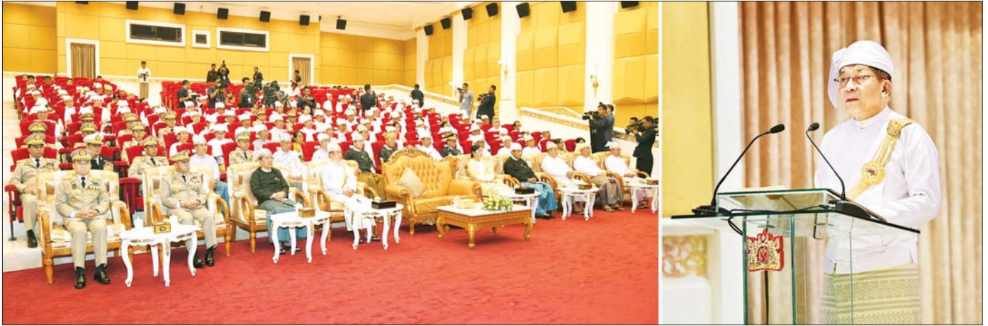
နိုင်ငံတော်သမ္မတ၏ မိန့်ခွန်းနာခံခြင်းနှင့် ကတိသစ္စာပြုခြင်းအခမ်းအနားတွင် ပြည်ထောင်စုသမ္မတမြန်မာနိုင်ငံတော် နိုင်ငံတော်သမ္မတ ဦးမင်းအောင်လှိုင် မိန့်ခွန်းပြောကြားစဉ်။