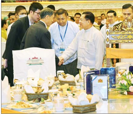
နိုင်ငံတော်သမ္မတ ဦးမင်းအောင်လှိုင် တတိယအကြိမ် လွှတ်တော်များ၏ ပထမပုံမှန်အစည်းအဝေးများ အောင်မြင်စွာပြီးမြောက်ခြင်း ဂုဏ်ပြုနေ့လယ်စာစားပွဲတွင် တက်ရောက်လာကြသည့် နိုင်ငံတကာမှ သံတမန်များအား ရင်းရင်းနှီးနှီးနှုတ်ဆက်စဉ်။

တို့ကို ဆောင်ရွက်ပေးနိုင်ခဲ့သည့် အတွက်လည်း လွှတ်တော်ကိုယ်စားလှယ်များ ကိုယ်စားများစွာ ဂုဏ်ယူဝမ်းမြောက်မိပါကြောင်း။