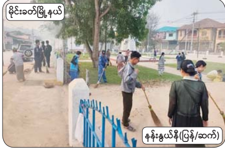
မိုင်းခတ်မြို့နယ်