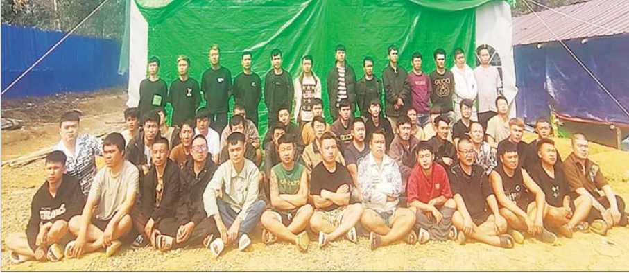
တန့်ယန်းမြို့နယ်အတွင်း အွန်လိုင်းလိမ်လည်လောင်းကစားမှုကျူးလွန်သည့် တရုတ်နိုင်ငံသား အမျိုးသား ၅၀ ဖမ်းဆီးရမိစဉ်။

ညှိနှိုင်း၍ အဆိုပါ ဒုစရိုက်မှုနှိမ်နင်းရေးလုပ်ငန်း များကို တက်ကြွစွာ ဆောင်ရွက်လျက်ရှိသည်။ ထိုသို့ဆောင်ရွက်လျက်ရှိရာ အွန်လိုင်း လိမ်လည်လောင်းကစားမှုများကို လက်ခံနိုင် ခြင်းမရှိသည့် စာမျက်နှာ ၉ ကော်လံ ၁ ❑