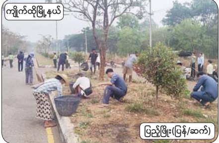
ကျိုက်ထိုမြို့နယ်