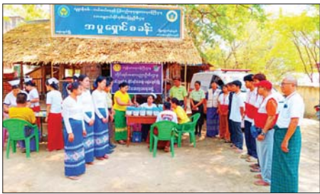
ဦးစီးဌာနက မြို့မမြောက်ရပ်ကွက် သာသနာ့မဏ္ဍိုင် ဘုန်းတော်ကြီးကျောင်းဝင်းတွင် အပူရောင်စခန်း ဖွင့်လှစ် ဆောင်ရွက်ထားရှိမှုကို

ရေနံချောင်း ဧပြီ ၄ မကွေးတိုင်းဒေသကြီးသည် ယခု ရက်ပိုင်းအတွင်း ကမ္ဘာ့အပူဆုံး ဒေသစာရင်းတွင် ပါဝင်နေသည့် အတွက် မကွေးတိုင်းဒေသကြီး ရေနံချောင်းမြို့နယ်၌ မိမိတို့ နေအိမ်များတွင် နေထိုင်ရန် ခက်ခဲပြီး အပူဒဏ်ကိုထိခံရရောင် ရန် လိုအပ်သူများနှင့် သက်ကြီး ဘိုးဘွားများ အပူရောင်စခန်းဖွင့်လှစ် ရန်အတွက် မြို့နယ်စီမံခန့်ခွဲရေး နှင့် အုပ်ချုပ်ရေးကော်မတီ၏ ဦးဆောင်ကြီးကြပ်မှုဖြင့် မြို့နယ် ဘေးအန္တရာယ်ဆိုင်ရာ စီမံခန့်ခွဲမှု