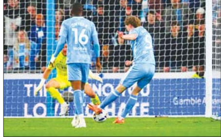
ကွင်းလယ်ကစားသမား ရှိခိုက် ကိုပင်ထရီအသင်းအတွက် ဒုတိယဂိုး သွင်းယူစဉ်။