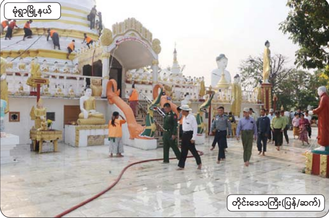
မုံရွာမြို့နယ်

နိုင်ငံတစ်ဝန်း မြို့နယ်များ၌ သန့်ရှင်းသာယာလှပစေရေး စီမံခန့်ခွဲမှုဦးစီးဌာန၏ အစီအစဉ်အရ စုပေါင်းသန့်ရှင်းရေးပြုလုပ်ခြင်းကို ယနေ့ နံနက်ပိုင်းက ခရိုင်နှင့် မြို့နယ်အဆင့် ဌာနဆိုင်ရာ တာဝန်ရှိသူများ၊ နယ်မြေခံ တပ်ရင်းတပ်ဖွဲ့ဝင်များ၊ ရဲတပ်ဖွဲ့ဝင်များ၊ မီးသတ်တပ်ဖွဲ့ဝင်များ၊ ကြက်ခြေနီအသင်းအဖွဲ့များ၊ မိခင်နှင့်ကလေးစောင့်ရှောက်ရေးအသင်း၊ အမျိုးသမီးရေးရာအဖွဲ့ဝင်များနှင့် ဒေသခံပြည်သူများ စုပေါင်း၍ ဘုရားစေတီ ပုထိုးများ၊ လမ်းဘေးဝဲယာများ၌ အမှိုက်သရိုက်များ လှည်းကျင်းခြင်း၊ ပေါင်းမြက်များရှင်းလင်းခြင်း၊ သစ်ပင်ချုံ့နှယ်များ ခုတ်ထွင်ရှင်းလင်းခြင်းနှင့် မြို့နယ်စည်ပင်သာယာရေးအဖွဲ့က အမှိုက်သိမ်းယာဉ်ဖြင့် စနစ်တကျ စွန့်ပစ်ခြင်းများ ဆောင်ရွက်ခဲ့ကြသည်။