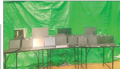
တန့်ယန်းမြို့နယ်အတွင်း အွန်လိုင်းလိမ်လည်လောင်းကစားမှု ကျူးလွန်ရာတွင် အသုံးပြုသည့် All in one ကွန်ပျူတာနှစ်လုံး၊ Desktop တစ်စုံ၊ Laptop ၂၀ လုံး သိမ်းဆည်းရမိစဉ်။