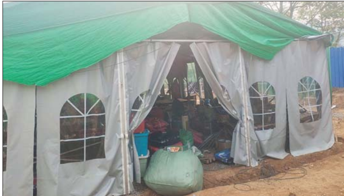
တန့်ယန်းမြို့နယ်အတွင်း အွန်လိုင်းလိမ်လည်လောင်းကစားမှုကျူးလွန်ရာတွင် အသုံးပြုသည့် အလုပ်ရုံကို တွေ့ရစဉ်။