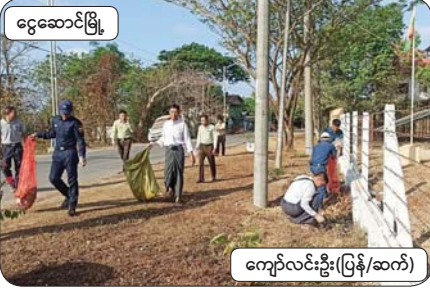
ငွေဆောင်းမြို့