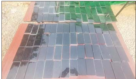
တန့်ယန်းမြို့နယ်အတွင်း အွန်လိုင်းလိမ်လည်လောင်းကစားမှု ကျူးလွန်ရာတွင်အသုံးပြုသည့် ဖုန်းမျိုးစုံ ၁၀၈ လုံး သိမ်းဆည်း ရမိစဉ်။