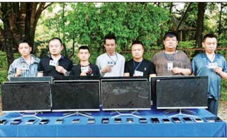
မူဆယ်မြို့၊ စွမ်းစော်ရပ်ကွက် အတွင်း အွန်လိုင်းလိမ်လည် လောင်းကစားမှု ကျူးလွန်သူ များအား ဆက်စပ်ပစ္စည်းများ နှင့်အတူ ဖမ်းဆီးရမိစဉ်။