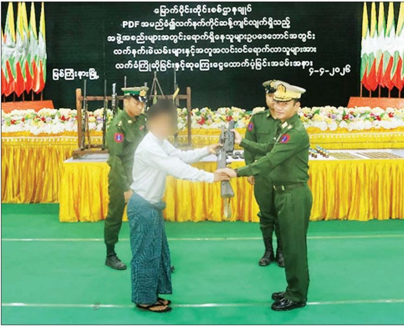
မြောက်ပိုင်းတိုင်းစစ်ဌာနချုပ် PDF အမည်ခံခွဲစိတ်ကုန်ကိုင်ဆောင်မှုကို လက်ခံယုံကြည်သည့် အဖွဲ့အစည်းများအတွင်းမှ လက်နက်ခဲယမ်းများနှင့်အတူ ဥပဒေဘောင်အတွင်း သို့ လက်နက်ခဲယမ်းများနှင့်အတူ ဥပဒေဘောင်အတွင်းသို့ ဝင်ရောက် လက်ခံကြိုဆိုခြင်းနှင့်ဆောင်ရွက်ပုံဖြစ်ပြီး အခမ်းအနား ၄-၄-၂၀၂၆ ဖြစ်ကြောင်းဖြစ်သည်။

နေပြည်တော် ဧပြီ ၄ နိုင်ငံတော်အစိုးရသည် PDF အပါအဝင် အဖွဲ့အစည်းအမျိုးမျိုး အမည်ခံ၍ လက်နက်ကိုင် ဆောင်မှုလျက်ရှိသည့် အဖွဲ့ အစည်းများအတွင်း ရောက်ရှိ နေသူများအား ဥပဒေဘောင် အတွင်းသို့ ပြန်လည်ဝင်ရောက်ရန် ဖိတ်ခေါ်၍ ဥပဒေဘောင်အတွင်း သို့ ပြန်လည်ဝင်ရောက်လာကြ သူများကိုလည်း လိုအပ်သည့် ကူညီပံ့ပိုးမှုများ ဆောင်ရွက်ပေး လျက်ရှိရာ နိုင်ငံတော်နှင့် တပ်မတော်၏ ငြိမ်းချမ်းရေး လုပ်ငန်းစဉ်များကို နားလည် သဘောပေါက်လာသည့် KIA ၊ KPDF နှင့် PDF အမည်ခံအဖွဲ့မှ အဖွဲ့ဝင် အမျိုးသားရှစ်ဦးတို့သည် လက်နက်ခဲယမ်းများနှင့် အတူ ဥပဒေဘောင်အတွင်းသို့ ထပ်မံ ဝင်ရောက်လာကြသည်။ စာမျက်နှာ ၁၁ ကော်လံ ၁ ❖