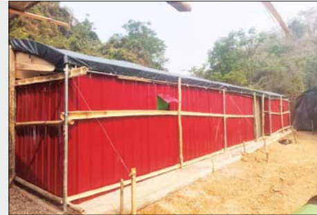
တန့်ယန်းမြို့နယ် အတွင်း အွန်လိုင်း လိမ်လည် လောင်းကစားမှု ကျူးလွန်ရာ တွင် အသုံးပြုသည့် လူနေ အိမ်ဆောင်ကို တွေ့ရစဉ်။