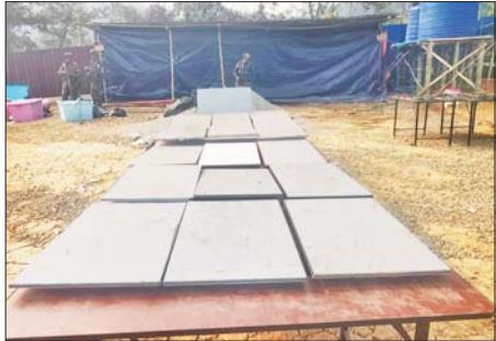
တန့်ယန်းမြို့နယ် အတွင်း အွန်လိုင်း လိမ်လည်လောင်း ကစားမှု ကျူးလွန်ရာတွင် အသုံးပြုသည့် starlink ၁၆ ခုကို သိမ်းဆည်းရမိစဉ်။