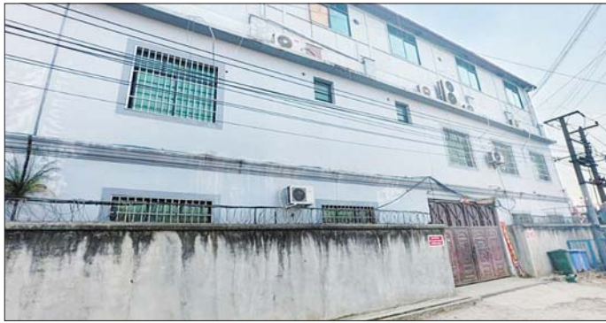
မူဆယ်မြို့၊ စွမ်းစော်ရပ်ကွက်အတွင်း အွန်လိုင်းလိမ်လည်လောင်းကစားမှုကျူးလွန်သူများအား ဆက်စပ် ပစ္စည်းများနှင့်အတူ ဖမ်းဆီးရမိသည့် နေအိမ်ကို တွေ့ရစဉ်။

အဆိုပါ အွန်လိုင်းလိမ်လည် လောင်းကစားမှုများ လုပ်ကိုင် လျက်ရှိသည့် ဖမ်းဆီးရမိသူများ အား လိုအပ်သည့်စစ်ဆေးမှုများ ဆောင်ရွက်ပြီးစီးပါက တည်ဆဲ ဥပဒေများနှင့်အညီ ထိရောက် ပြင်းထန်စွာ အရေးယူဆောင်ရွက် သွားမည်ဖြစ်ပြီး သိမ်းဆည်းရမိ ဆက်စပ်ပစ္စည်းများအား လုပ်ထုံး လုပ်နည်းများနှင့်အညီ ဆက်လက် ဆောင်ရွက်သွားမည် ဖြစ်ကြောင်း သိရှိရသည်။ နိုင်ငံတော်အနေဖြင့် အွန်လိုင်း လိမ်လည် လောင်းကစားမှု ကျူးလွန်ခြင်းများ ပပျောက်စေ ရေးနှင့် မြန်မာနိုင်ငံအတွင်း အခြေချလုပ်ကိုင်နိုင်မှု မရှိစေရေး အတွက် အိမ်နီးချင်းနိုင်ငံများ၊ ဒေသတွင်းနိုင်ငံများ၊ နိုင်ငံတကာ အဖွဲ့အစည်းများနှင့် ပူးပေါင်း၍ အွန်လိုင်း လိမ်လည်လောင်းက စားမှုတိုက်ဖျက်ရေး လုပ်ငန်းစဉ် များကို တက်ကြွစွာ ဆက်လက် ဆောင်ရွက်လျက် ရှိကြောင်း သတင်းရရှိသည်။ သတင်းစဉ်