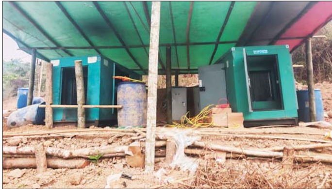
တန့်ယန်းမြို့နယ်အတွင်း အွန်လိုင်းလိမ်လည်လောင်းကစားမှုကျူးလွန်ရာတွင် အသုံးပြုသည့် မီးစက် နှစ်လုံး တွေ့မြင်ရစဉ်။