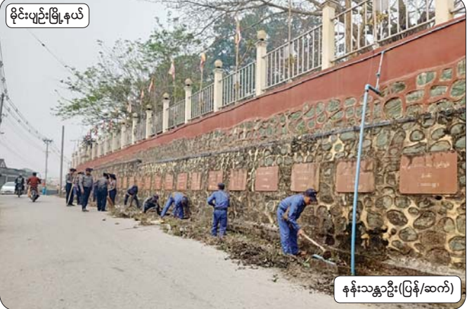
မိုင်းပျဉ်းမြို့နယ်