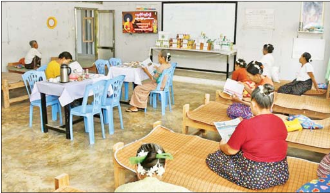
ကိုယ့်ပိုင်အထက်တန်းကျောင်းတွင် အပူရှောင်စခန်း အား စတင်ဖွင့်လှစ်နိုင်ခဲ့ပါသည်။

မြန်မာနိုင်ငံ အလယ်ပိုင်းရှိ မကွေး၊ မန္တလေး၊ စစ်ကိုင်း၊ ပဲခူးဒေသများသည် နှစ်စဉ် အပူချိန် မြင့်မားသည့် ဒေသများဖြစ်ပါသည်။ ထို့ကြောင့် နွေဦးရာသီစတင်ဝင်ရောက်သည့်နှင့် ကျန်းမာရေး ဝန်ကြီးဌာန ထုတ်ပြန်သည့် အပူဒဏ်အန္တရာယ် ကာကွယ်ရေး အသိပညာပေးနည်းစံစာရွက်စာတမ်းကို နေ့စဉ်ထုတ်ဝေတောင်းစား မြန်မာ့ရုပ်မြင်သံကြားနှင့် လူမှုကွန်ရက်များတွင် မြင်တွေ့ရသလို လူမှုဝန်ထမ်း၊ ကယ်ဆယ်ရေးနှင့် ပြန်လည်နေရာချထားရေး ဝန်ကြီးဌာနကလည်း နှစ်စဉ် အပူချိန်မြင့်မားသည့် မြို့နယ်များတွင် အပူရှောင်စခန်းများ ဖွင့်လှစ်ရန် စီမံဆောင်ရွက်ထားပါသည်။ ယခုနှစ်တွင်လည်း မကွေးတိုင်းဒေသကြီးရှိ မကွေး၊ ချောက်၊ ရေနံချောင်းနှင့် နတ်မောက်မြို့နယ်တို့တွင် မတ် ၁၆ ရက်မှစပြီး အပူရှောင်နိုင်မည့် နေရာများသတ်မှတ် ထားကာ ဒေသပြည်သူများ လာရောက်နားခိုနိုင် ရန် စီစဉ်ပေးထားကြောင်း တွေ့ရှိရပါသည်။