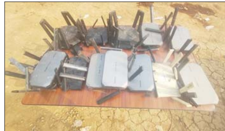
တန့်ယန်းမြို့နယ်အတွင်း အွန်လိုင်းလိမ်လည်လောင်းကစားမှု ကျူးလွန်ရာတွင်အသုံးပြုသည့် Wireless Router ၁၃ လုံး သိမ်းဆည်း ရမိစဉ်။