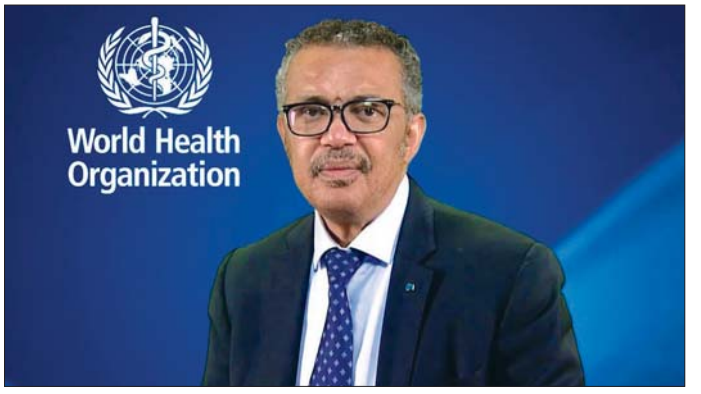
ကြောင့် မတ် ၃၁ ရက်အထိ နေရပ်စွန့်ခွာသူပေါင်း ကြောင်းနှင့် ၃၀၀၀ ထိခိုက်ဒဏ်ရာရရှိကြောင်း လေးသန်းကျော်ရှိကြောင်း၊ ၃၃၀၀ ကျော် သေဆုံး WHO ၏ ထုတ်ပြန်ချက်အရ သိရသည်။ ဆင်ယွာ

စတင်လိုက်ပြုကြောင်း သိရပြီး နောက်ဆက်တွဲ ပြောကြားသည်။ ယခုနှစ် မတ်လမှ ဩဂုတ်လအထိ အကျုံးဝင်မည့် အဆိုပါ ရန်ပုံငွေတောင်းခံမှုအစီအစဉ်သည် မရှိမဖြစ် လိုအပ်သော ကျန်းမာရေးစနစ်များနှင့် ထိခိုက်ဒဏ်ရာရရှိသူများအား ဆေးဝါးကုသမှုပေးမည့် ဝန်ဆောင်မှုများကို ထိန်းထားနိုင်ရန်၊ ရောဂါစောင့်ကြပ်ကြည့်ရှုမှုများနှင့် ဆေးလျင်စွာ ကြိုတင်သတ်ပေးစနစ်များ အားကောင်းလာစေရန် အစုလိုက်အပြုံလိုက် ထိခိုက်ဒဏ်ရာရရှိသူများအား စီမံခန့်ခွဲနိုင်သည့် စွမ်းဆောင်ရည်ကို မြှင့်တင်ရန်အပြင် ဓာတုဗေဒ၊ ဇီဝဗေဒ၊ ရေဒီယိုသတ္တိကြွနှင့် နျူကလီးယားဆိုင်ရာ အရေးပေါ်အခြေအနေများအတွက် အမျိုးသားအဆင့် အသင့်အနေအထားရှိမှုတို့ကို မြှင့်တင်ရန် စသည့် နေရာများတွင် သုံးစွဲသွားရန် ရည်ရွယ်ထားသည်။ အရှေ့အလယ်ပိုင်းဒေသ ပဋိပက္ခဖြစ်ပွားမှုများ