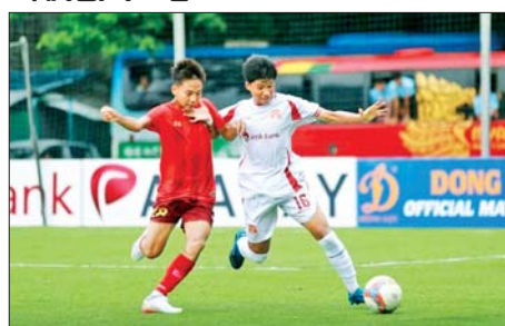
Galaxy အသင်းနှင့် ဧရာဝတီယူနိုက်တက်အသင်းတို့ ယှဉ်ပြိုင်နေစဉ်။