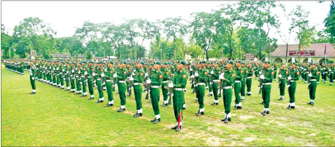
ပြည်သူ့စစ်မှုထမ်းသင်တန်းအမှတ်စဉ်(၂၃) သင်တန်းဆင်းပွဲ ကျင်းပစဉ်။

နေပြည်တော် မေ ၂၉ နိုင်ငံသား တိုင်းသည် ပြည်ထောင်စု မပြိုကွဲရေး၊ တိုင်းရင်းသားစည်းလုံးညီညွတ်မှု မပြိုကွဲရေးနှင့် အချုပ်အခြာ အာဏာ တည်တံ့ခိုင်မြဲရေး ဟူသည့် ဒီတာဝန်အရေးသုံးပါးကို စောင့်ထိန်းရန် တာဝန်ရှိသည့် အပြင် “နိုင်ငံတစ်နိုင်ငံ၏ လွတ်လပ်ရေး၊ အချုပ်အခြာ အာဏာနှင့် နယ်မြေတည်တံ့ ခိုင်မြဲရေးအတွက် နိုင်ငံသားတိုင်း တွင် တာဝန်ရှိသည်” ဟူသည့် ပြည်ထောင်စုသမ္မတ မြန်မာ နိုင်ငံတော် ဖွဲ့စည်းပုံအခြေခံဥပဒေ (၂၀၀၈ ခုနှစ်)ပါ ပြဋ္ဌာန်းချက်များ ကို လက်တွေ့အကောင်အထည် ဖော်ခဲ့သည့် ပြည်သူ့စစ်မှုထမ်း သင်တန်းအမှတ်စဉ်(၂၃) သင်တန်းဆင်းပွဲများကို စာမျက်နှာ ၁၂ ကော်လံ ၁ သို့