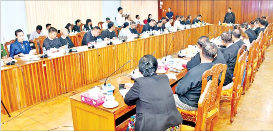
ပြည်သူ့လွှတ်တော်ဥက္ကဋ္ဌ ဦးခင်ရီ ရန်ကုန်တိုင်းဒေသကြီးလွှတ်တော်ဥက္ကဋ္ဌ၊ ဒုတိယဥက္ကဋ္ဌ၊ ဥပဒေကြမ်းကော်မတီနှင့် ဥပဒေရေးရာနှင့် အထူးကိစ္စရပ်များ လေ့လာသုံးသပ်ရေးအဖွဲ့ဝင်တို့နှင့် တွေ့ဆုံပွဲအခမ်းအနားတွင် အမှာစကားပြောကြားစဉ်။

ရန်ကုန် မေ ၂၉ ပြည်သူ့လွှတ်တော် ဥက္ကဋ္ဌ ဦးခင်ရီသည်ရန်ကုန်တိုင်းဒေသကြီး လွှတ်တော်ဥက္ကဋ္ဌ ဦးဌေးအောင်၊ ဒုတိယဥက္ကဋ္ဌ ဦးကျော်ကျော်စိုး၊ ဥပဒေကြမ်းကော်မတီ၊ ဥပဒေရေးရာနှင့် အထူးကိစ္စရပ်များ လေ့လာသုံးသပ်ရေး အဖွဲ့ဝင်များ၊ ဥပဒေပညာရှင်(အငြိမ်းစား)များ အား ယနေ့မွန်းလွဲပိုင်းတွင် ရန်ကုန် တိုင်းဒေသကြီး လွှတ်တော်ရုံး ပုလဲခန်းမ၌ တွေ့ဆုံသည်။ ဦးစွာ ရန်ကုန်တိုင်းဒေသကြီး လွှတ်တော်ဥက္ကဋ္ဌ ဦးဌေးအောင်က ဥပဒေရေးရာနှင့် အထူးကိစ္စရပ်များ လေ့လာသုံးသပ်ရေးအဖွဲ့ ဖွဲ့စည်း ထားရှိမှုနှင့်စပ်လျဉ်း၍ ရှင်းလင်း တင်ပြပြီး အဖွဲ့ဝင်များက တစ်ဦးချင်း မိတ်ဆက်စကားပြောကြား သည်။