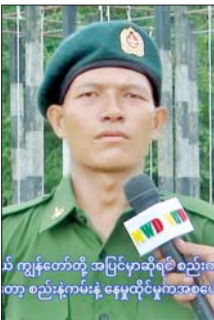
ကျွန်တော်တို့ အပြင်မှာဆိုရင် စည်းစနစ် တော့ စည်းနဲ့ကမ်းနဲ့ နေထိုင်မှုကအစပေး ပေးအပ်ချီးမြှင့်ကြသည်။

ကစပြီး စည်းစနစ်ကျဖို့လိုတယ်။ အချိန်ကန့်သတ်ချက် ရှိတယ်။ တပ်မတော်မှာ One For All ဆိုတဲ့ စကားလုံးရှိပါတယ်။ တစ်ယောက် မကောင်းဘူးဆိုရင် အကျန်လုံး မကောင်းပါတဲ့။ တစ်ယောက်ချင်း စီကကောင်းမှ တပ်မတော်က ကောင်းမှာပါ။ ဒါကြောင့် ဒီအတွေ့ အကြုံလေးတွေ ကျွန်တော်ရရှိ ခဲ့ပါတယ်။