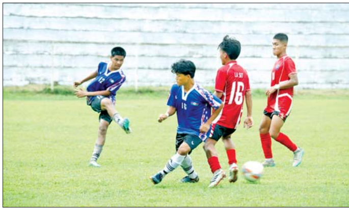
၂၀၂၆ ခုနှစ် တိုင်းဒေသကြီးနှင့်ပြည်နယ် အသက်(၁၈)နှစ်အောက် အမျိုးသားဘောလုံးပြိုင်ပွဲ ကွာတားဖိုင်နယ်ပွဲစဉ်များ ကျင်းပစဉ်။