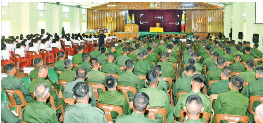
ဒုတိယတပ်မတော်ကာကွယ်ရေးဦးစီးချုပ် ကာကွယ်ရေးဦးစီးချုပ်(ကြည်း) ဗိုလ်ချုပ်ကြီး ကျော်စွာလင်း ဗထူးတပ်နယ်ရှိ အရာရှိ၊ စစ်သည်၊ မိသားစုများအား တွေ့ဆုံအမှာစကားပြောကြားစဉ်။

နေပြည်တော် မေ ၂၉ ဒုတိယတပ်မတော်ကာကွယ်ရေးဦးစီးချုပ် ကာကွယ်ရေးဦးစီးချုပ်(ကြည်း) ဗိုလ်ချုပ်ကြီး ကျော်စွာလင်းသည် ဇနီး ဒေါ်နန်းကူးကု၊ ကာကွယ်ရေးဦးစီးချုပ်ရုံးမှ အဆင့်မြင့်တပ်မတော် အရာရှိကြီးများနှင့်ဇနီးများ၊ အရှေ့ပိုင်းတိုင်းစစ်ဌာနချုပ် တိုင်းမှူးနှင့် တာဝန်ရှိသူများလိုက်ပါ၍ ယနေ့ မွန်းလွဲပိုင်းတွင် အောင်ဆန်းခန်းမ၌ ဗထူးတပ်နယ်ရှိ အရာရှိ၊ စစ်သည်၊ မိသားစုများအား သွားရောက်တွေ့ဆုံ အမှာစကားပြောကြားသည်။