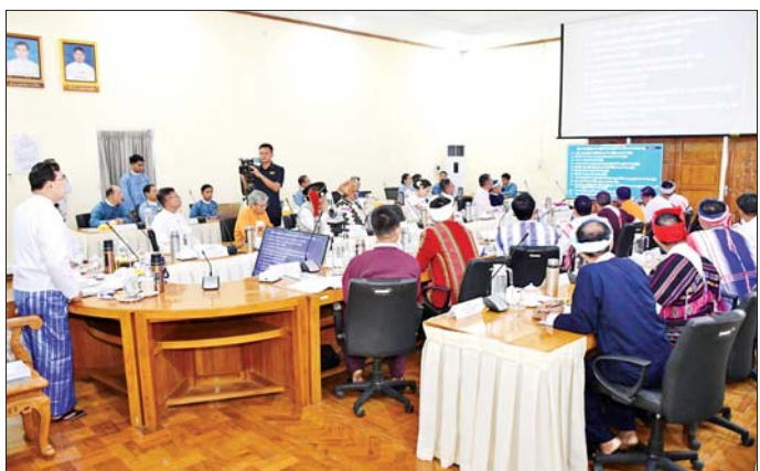
(Teaching Assistant-TA၊ ဌာန၏ ဆက်လက်ဆောင်ရွက် က ညှိနှိုင်းပေါင်းစပ်ဆောင်ရွက် Language Teacher - LT) များ မည့်လုပ်ငန်းစဉ်များကို ဆွေးနွေး ပေးခဲ့ကြောင်း သိရသည်။ ခန့်ထားခြင်းကိစ္စရပ်များ၊ ဝန်ကြီး တင်ပြကြရာ ပြည်ထောင်စုဝန်ကြီး သတင်းစဉ်

ဝါးတန်ဖွံ့ဖြိုးရေးနှင့် တိုင်းရင်းသား လူမျိုးရေးရာ ဝန်ကြီးများ၏ လူမှုစီးပွားဘဝဖွံ့ဖြိုး တိုးတက်ရေးကို ရှေးရှု၍ တိုင်းရင်း သားလူမျိုးရေးရာ ဝန်ကြီးများ အနေဖြင့် လိုအပ်ချက်များ ပံ့ပိုး ဆောင်ရွက်ပေးစေလိုသည့် ကိစ္စ ရပ်များကို ပွင့်ပွင့်လင်းလင်း ဆွေးနွေးပေးကြစေလိုကြောင်း ပြောကြားသည်။ ထို့နောက် ဒုတိယဝန်ကြီး ဦးစိုင်းထွန်းညို၊ တိုင်းဒေသကြီးနှင့် ပြည်နယ် တိုင်းရင်းသားလူမျိုး ရေးရာဝန်ကြီး ၂၉ ဦးနှင့် ချင်း ပြည်နယ်မှ လူမှုရေးရာဝန်ကြီး တို့က တိုင်းဒေသကြီးနှင့် ပြည်နယ်