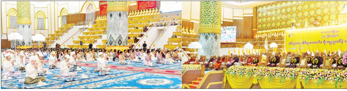
ဒုတိယသမ္မတ ဦးညိုစောနှင့်ဇနီး ဒေါ်စမ်းစမ်းအေးအမှူးပြုသော ဧည့်ပရိသတ်များက တိပိဋကဓရ တိပိဋကကောဝိဒ ရွေးချယ်ရေးစာမေးပွဲ ဩဝါဒါစရိယအဖွဲ့ဥက္ကဋ္ဌ ဧရာဝတီတိုင်းဒေသကြီး ဟင်္သာတမြို့ မိုးကောင်းကျောင်းတိုက် ပဓာနနာယက အဘိဓဇမဟာရဋ္ဌဂုရု အဘိဓဇအဂ္ဂမဟာသဒ္ဓမ္မဇောတိက ဘဒ္ဒန္တသုဓမ္မစာရာဘိဝံသ မဟာထေရ် မြတ်ကြီးထံမှ ငါးပါးသီလ ခံယူဆောင်တည်ကြစဉ်။

အခမ်းအနားသို့ နိုင်ငံတော် သံသမဟာနာယကအဖွဲ့ ဥက္ကဋ္ဌ ဆရာတော် သန့်လျင်မြို့ မင်းကျောင်း ပထမပြန်စာသင် တိုက် ပဓာနနာယက အဘိဓဇ မဟာရဋ္ဌဂုရု အဂ္ဂမဟာပဏ္ဍိတ အဂ္ဂမဟာသဒ္ဓမ္မ ဇောတိကဓဇ ဒေါက်တာ ဘဒ္ဒန္တစန္ဒိမာဘိဝံသ အမှူးပြုသောဆရာတော်ကြီးများ၊ တိပိဋကဓရ တိပိဋကကောဝိဒ ရွေးချယ်ရေးအဖွဲ့၊ ဩဝါဒါစရိယ ဆရာတော်ကြီးများ၊ တိပိဋကဓရ တိပိဋကကောဝိဒဆရာတော်များ၊ တိပိဋကဓရ တိပိဋကကောဝိဒ စာမျက်နှာ ၃ ကော်လံ ၁ သို့