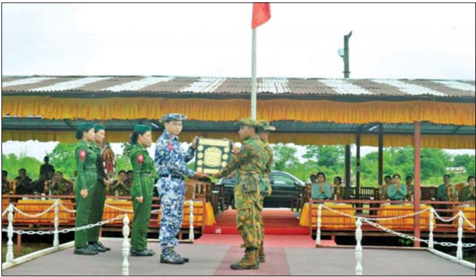
တာဝန်ရှိသူတစ်ဦးက တံခွန်စိုက် သူများအား ဆုများပေးအပ်သည်။ ခိုင်းဆုရရှိသွားသော အုတ်တွင်း အဆိုပါ သေနတ်ပစ်ပြိုင်ပွဲကို တပ်နယ်အသင်းနှင့် တစ်ဦးချင်း တိုင်းစစ်ဌာနချုပ် ကွပ်ကဲမှုအောက် တပ်ရင်း/ တပ်ဦးများမှ ပြိုင်ပွဲဝင် သတင်းစဉ်

နေပြည်တော် မေ ၂၉ တောင်ပိုင်း တိုင်းစစ်ဌာနချုပ် ၏ ၂၀၂၆ ခုနှစ် တိုင်းမှူးခိုင်း သေနတ်ပစ်ပြိုင်ပွဲ ဆုပေးပွဲကို ယနေ့နံနက်ပိုင်းတွင် အုတ်တွင်း မြို့ နယ်မြေခံသင်တန်းကျောင်း စက်ပစ်ကွင်း၌ ပြုလုပ်ရာ နယ်မြေခံသင်တန်းမှ တာဝန်ရှိသူ များ၊ အရာရှိ၊ စစ်သည်၊ မိသားစု ဝင်များ၊ ခိုင်အဖွဲ့ဝင်များနှင့် ပြိုင်ပွဲဝင်အသင်းများ တက်ရောက် ကြသည်။ ဦးစွာ တက်ရောက်လာကြသူ များက ဗိုလ်လှပွဲစဉ် ယှဉ်ပြိုင် ပစ်ခတ်နေမှုများကို ကြည့်ရှု အားပေးကြသည်။ ထို့နောက် ဆုပေးပွဲကို ပြုလုပ်ရာ တိုင်းမှူး ကိုယ်စား နယ်မြေခံသင်တန်းမှ