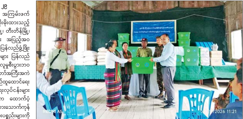
ခဲရဲသည် ဆေးရုံများ၊ စာသင်ကျောင်းများ၊ အစိုးရရုံးဌာနများနှင့် တာဝန်ဆောင်ရာအဆောက်အအုံများ၊ လမ်းတံတားများအား အမြန်ဆုံးပြန်လည်ပြုပြင် တည်ဆောက်ခြင်းလုပ်ငန်းများနှင့် ပြန်လည်ထူထောင်ရေးလုပ်ငန်းများ ဆောင်ရွက်ရာတွင် လိုအပ်သည့် ဘိလပ်ခြေ၊ သွပ်၊ သွပ်ရိုက်သံ အစရှိသည့် ဆောက်လုပ်ရေးလုပ်ငန်းသုံးပစ္စည်းများနှင့် ဒေသပြည်သူများအတွက် လူသုံးကုန်ပစ္စည်းများ၊ မီးဖိုချောင်သုံးပစ္စည်းများနှင့် ကျန်းမာရေးသုံးပစ္စည်းများ တင်ဆောင်လာသည့် မော်တော်ယာဉ်

နေပြည်တော် မေ ၂၉ တပ်မတော်အနေဖြင့် အကြမ်းဖက်သောင်းကျန်းသူများ ယာယီစိုးမိုးထားသည့် ချင်းပြည်နယ်အတွင်းရှိ ဖလမ်းမြို့၊ တီးတိန်မြို့၊ တွန်းဇံမြို့နှင့် ဒေသတစ်ဝိုက်တို့အား အပြည့်အဝပြန်လည်ထိန်းချုပ်နိုင်ခဲ့ပြီး ဒေသပြန်လည်ဖွံ့ဖြိုးတိုးတက်ရေးနှင့် အုပ်ချုပ်မှုယန္တရားများ ပြန်လည်လည်ပတ်၍ ဒေသပြည်သူများ၏ လူမှုစီးပွားဘဝများ တိုးတက်စေရေးအတွက် နိုင်ငံတော်အကြီးအကဲ၏ လမ်းညွှန်ချက်နှင့်အညီ ပြန်လည်ထူထောင်ရေးနှင့် ပြန်လည်တည်ဆောက်ရေးလုပ်ငန်းများ ဆောင်ရွက်ရန် နိုင်ငံတော်အစိုးရက ထောက်ပံ့ပေးအပ်သည့် လူသုံးကုန်ပစ္စည်းများ၊ စားသောက်ကုန်များနှင့် ဆောက်လုပ်ရေးလုပ်ငန်းသုံးပစ္စည်းများကို အဆိုပါ မြို့များအရောက် ပို့ဆောင်ပေးလျက်ရှိသည်။