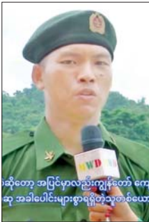
သို့တော့ အပြင်မှာလည်းကျွန်းတော် ကျေ ဆု အပါပေါင်းများစွာရရှိတဲ့သူတစ်ယောက်။

များကို အမြဲတမ်းစစ်မှုထမ်းများ နှင့်အတူ ထမ်းဆောင်နေကြပြီ ဖြစ်သည်။ ထိုသို့ ပြည်သူ့စစ်မှုထမ်း သင်တန်း အမှတ်စဉ်(၂၃)တွင် တက်ရောက်ခဲ့ကြသည့် အတွေ့ အကြုံများ၊ သင်တန်းမှရရှိခဲ့သည့် အလေ့အကျင့် ကောင်းများ၊ ယုံကြည်ချက်၊ ခံယူချက်များနှင့် သင်တန်းဆင်းပြီးနောက် မိမိတို့ တာဝန်ကျရာတပ်ရင်း၊ တပ်ဖွဲ့ များ၌ ဆက်လက်တာဝန်ထမ်း ဆောင်သွားမည့် အခြေအနေများ နှင့်ပတ်သက်၍ သင်တန်းဆင်း နိုင်ငံသားကောင်းစံသည်များ၏ စကားသံများကိုလည်း ယခုကဲ့သို့ ကြားသိရပါသည်-