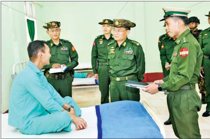
ဒုတိယတပ်မတော်ကာကွယ်ရေးဦးစီးချုပ် ကာကွယ်ရေးဦးစီးချုပ်(ကြည်း) ဗိုလ်ချုပ်ကြီးကျော်စွာလင်း ဗထူးတပ်မြို့ နယ်မြေခံဆေးရုံတွင် တက်ရောက်ကုသမှုခံယူနေသူများအား ရင်းရင်းနှီးနှီး မေးမြန်းအားပေး စကားပြောကြားစဉ်။

နေပြည်တော် မေ ၂၉ ဒုတိယ တပ်မတော်ကာကွယ်ရေးဦးစီးချုပ် ကာကွယ်ရေးဦးစီးချုပ်(ကြည်း) ဗိုလ်ချုပ်ကြီးကျော်စွာလင်းသည် ကာကွယ်ရေးဦးစီးချုပ်ရုံးမှ အဆင့်မြင့်တပ်မတော်အရာရှိကြီးများ၊ အရှေ့ပိုင်းတိုင်းစစ်ဌာနချုပ်တိုင်းမှူးနှင့် တာဝန်ရှိသူများလိုက်ပါ၍ ယနေ့တွင် ဗထူးတပ်မြို့ရှိ သင်တန်းကျောင်းများ၊ နယ်မြေခံတပ်ရင်း/တပ်ဖွဲ့များနှင့် တပ်မတော်ဆေးရုံတို့အား လိုက်လံကြည့်ရှုစစ်ဆေးသည်။