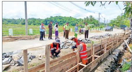
ဦးမင်းကိုနှင့် အဖွဲ့ဝင်များက အောင်မင်္ဂလာ ရပ်ကွက် ရွှေသာလျောင်း ဘုရားလမ်း၌ ကြည့်ရှုစစ်ဆေးသည်။

ဘုတ်ပြင်း မေ ၂၉ တနင်္သာရီတိုင်း ဒေသကြီး ဘုတ်ပြင်းမြို့နယ်တွင် မြို့နယ်စည်ပင်သာယာရေး အဖွဲ့က အကောင်အထည်ဖော် ဆောင်ရွက်နေသည့် အောင်မင်္ဂလာရပ်ကွက် ရွှေသာလျောင်း ဘုရားလမ်း၌ ကျောက်စီရေမြောင်း ပလက်ဖောင်း ပြုလုပ်ခြင်းကို ယနေ့နံနက်ပိုင်းတွင် ဘုတ်ပြင်းခရိုင် စီမံခန့်ခွဲရေးနှင့် အုပ်ချုပ်ရေးကော်မတီ ဥက္ကဋ္ဌ