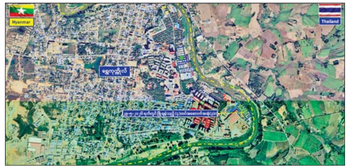
ယနေ့တွင် ယာဉ်ယန္တရားဖြင့် ဖြိုချဖျက်ဆီးရန် သတ်မှတ်ထားသည့် အဆောက်အအုံ ၅၇ လုံး

ဖြင့် ဖြိုချဖျက်ဆီးမည့် အဆောက်အအုံ ၅၇ လုံးနှင့် ဖောက်ခွဲဖျက်ဆီးမည့် အဆောက်အအုံ ၂၀ တို့ကို အဆောက်အအုံ အမျိုးအစားအလိုက် ခွဲခြားသတ်မှတ်၍ စနစ်တကျ ဖြိုချဖျက်ဆီးခြင်း ဖြစ်ကြောင်း သိရသည်။