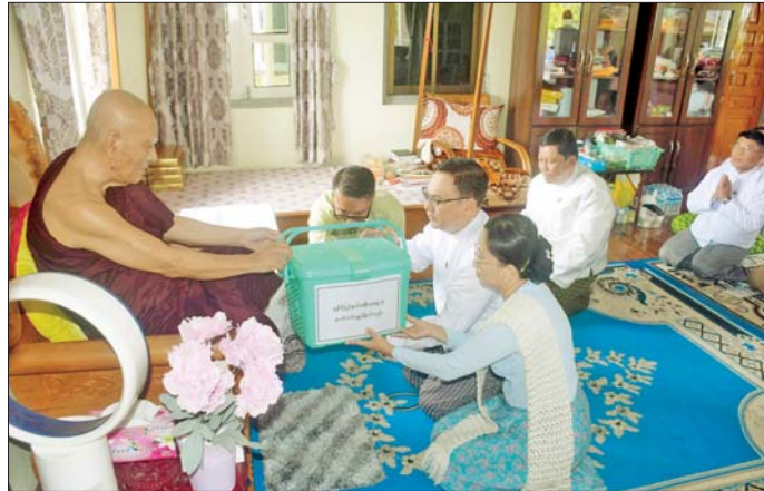
သင်္ကြန်အကျနေ့မှ သင်္ကြန်အတက်နေ့အထိ နေ့စဉ် သင်္ကြောင်း သိရသည်။ ဆွမ်းနှင့် လှူဖွယ်ဝတ္ထုများကို ဆက်ကပ်လှူဒါန်း

ဆက်လက်ပြီး ပြည်နယ်ဝန်ကြီးချုပ်နှင့်ဇနီး၊ ပြည်နယ်လွှတ်တော်ဥက္ကဋ္ဌတို့သည် ဦးရေကျော်သူကျောင်းတိုက်၊ မေ့ရိပ်သာကျောင်းတိုက်နှင့် စစ်တွေမြို့ပေါ်ရှိ ဘုန်းတော်ကြီးကျောင်းများသို့ သွားရောက်၍ ဆရာတော်ကြီးများအား ဆွမ်းနှင့် လှူဖွယ်ဝတ္ထုပစ္စည်းများ ဆက်ကပ်လှူဒါန်းကြသည်။ ပြည်နယ်ဝန်ကြီးချုပ်နှင့်ဇနီး၊ ပြည်နယ်လွှတ်တော်ဥက္ကဋ္ဌ၊ ပြည်နယ်အစိုးရအဖွဲ့ဝင်များသည် စစ်တွေမြို့ပေါ်ရှိ ဘုန်းတော်ကြီးကျောင်းများသို့