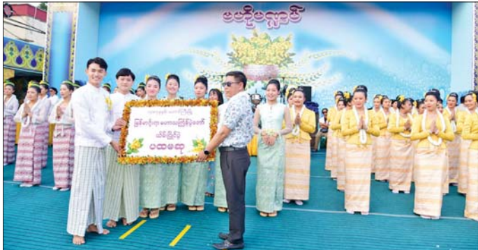
ထို့နောက် မြန်မာ့ရိုးရာ မဟာအတာသင်္ကြန် ပွဲတော် ပိတ်ပွဲတွင် ရှမ်းပြည်နယ်ဝန်ကြီးချုပ်က အမှာ စကားပြောကြားပြီး ဖျော်ဖြေရေးအဖွဲ့များက မန်းတောင်ရိပ်ခိုတေးသီချင်းနှင့် ပိတောက်လက် ဆောင်တေးသီချင်းတို့ဖြင့် ကပြဖျော်ဖြေပိတ်သိမ်းခဲ့ ကြောင်းသိရသည်။ မောင်မောင်သန်း(တောင်ကြီး)

ရရှိသော ၃၃ ဖွဲ့အား ရှမ်းပြည်နယ်ရဲတပ်ဖွဲ့၊ ရဲမှူးချုပ်၊ အစိုးရအဖွဲ့အတွင်းရေးမှူး၊ ပြည်နယ် စာရင်းစစ်ချုပ်၊ ပြည်နယ် တိုင်းရင်းသားလူမျိုးရေး ရာဝန်ကြီးများ၊ ပြည်နယ်ဥပဒေချုပ်၊ ပြည်နယ် ဝန်ကြီးများက ဆုများချီးမြှင့်ပေးကြသည်။ ဆုချီးမြှင့် ထို့နောက် ပြည်နယ်လုံခြုံရေးနှင့်နယ်စပ်ရေးရာ ဝန်ကြီး၊ ပြည်နယ်တရားလွှတ်တော် တရားသူကြီးချုပ်၊ ပြည်နယ်လွှတ်တော်ဥက္ကဋ္ဌနှင့် အရှေ့ပိုင်းစစ်ဌာနချုပ် တိုင်းမှူးတို့က ဆုရရှိသောယိမ်းအဖွဲ့ များအား ဆုများ ချီးမြှင့်ပေးပြီး ပထမဆုရရှိသော တောင်ကြီး ပညာရေးဦးစိဂရီကလပ်ယိမ်းအဖွဲ့အား ပြည်နယ် ဝန်ကြီးချုပ် ဦးစိုင်းထိန်စိုးက ဆုချီးမြှင့်ပေး သည်။