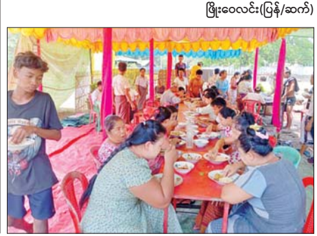
မြို့ဝေးလင်း(ပြန်/ဆက်)

ကြိုခင်း မြို့ ၁၇ ဧရာဝတီတိုင်းဒေသကြီး ကြိုခင်းမြို့၌ ယနေ့တွင် မြို့လုံးကျွတ် စတုဒိသာ ကျေးမွေးလှူဒါန်းကြသူများနှင့် အနယ်နယ်အရပ်ရပ်မှ ရေပက်ခဲလာရောက်သူများဖြင့် အထူးစည်ကားလျက်ရှိသည်။ ကြိုခင်းမြို့၌ နှစ်ဆန်းတစ်ရက်နေ့တွင် ဘုရား၊ စေတီ၊ ဘုန်းတော်ကြီး ကျောင်းများနှင့် နေအိမ်များတွင် စတုဒိသာကျေးဖြင့် အနယ်နယ် အရပ်ရပ်မှ လာရောက်ရေကစားကြသူများကို လှူဒါန်းပေးလျက်ရှိကြ သည်။ ဗဟိုမဏ္ဍပ်တွင်လည်း တေးသံရင်များက ဖျော်ဖြေပေးလျက်ရှိရာ ရေပက်ခဲလာရောက်သူများဖြင့် စည်ကားလျက်ရှိပြီး ရပ်ကွက်တိုင်းရှိ ရေကစားမဏ္ဍပ်များတွင် ရေပက်ခဲထွက်သူများဖြင့် အေးချမ်းပျော်ရွှင်စွာ ဆင်နွှဲလျက်ရှိကြသည်။ ကြိုခင်းမြို့၌ သင်္ကြန်အကြိုနေ့မှ နှစ်ဆန်း ၁ ရက်နေ့အထိ နှစ်စဉ် အစဉ်အလာမပျက် ရေကစားသူများ၊ စတုဒိသာအမျိုးမျိုး လှူဒါန်းကြသူ များဖြင့် စည်ကားလျက်ရှိပြီး နံနက်ပိုင်းနှင့် ညနေပိုင်းတို့တွင် ဘုရား၊ စေတီ၊ ဘုန်းတော်ကြီးကျောင်းများတွင် ဘုရားရေသဗ္ဗာယ်ခြင်းတို့ဖြင့် ကုသိုလ်ကောင်းမှုများ ပြုလုပ်လျက်ရှိကြောင်း သိရသည်။