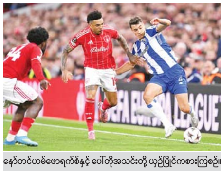
နော်တင်ဟမ်ဖော့ရက်စ်နှင့် ပေါ်တိုအသင်းတို့ ယှဉ်ပြိုင်ကစားကြစဉ်။

ယူရိုပါလိဂ်ပြိုင်ပွဲ ကွာတားဖိုင်နယ်အဆင့်ပွဲစဉ်တွေကို ဧပြီ ၁၇ ရက် နံနက်ပိုင်းက ယှဉ်ပြိုင်ကစားခဲ့ရာ အက်စ်တွန်ပီလာအသင်းနဲ့ နော်တင်ဟမ်ဖော့ရက်စ်အသင်းတို့ဟာ ပြိုင်ဘက်အသင်းအသီးသီးကို အနိုင်ရပြီး ဆီမီးဖိုင်နယ်အဆင့်တက်လှမ်းခွင့်ရရှိခဲ့ပါတယ်။ အက်စ်တွန်ပီလာအသင်းဟာ ယူရိုပါလိဂ်ကွာတားဖိုင်နယ် ဒုတိယ အကျော့ပွဲစဉ်မှာ ဘိုလ်တော့ဂ်နာအသင်းကို လေးဂိုးပြတ်ဖြင့် အနိုင်ရရှိခဲ့ တာကြောင့် နှစ်ကျော့ပေါင်းရလဒ် ၃ နှစ်ရိုး-တစ်ဂိုးဖြင့် အနိုင်ရပြီး ဆီမီး ဖိုင်နယ်တက်လှမ်းခွင့်ရရှိခဲ့တာ ဖြစ်ပါတယ်။ စာမျက်နှာ ၃၀ ကော်လံ ၁ သို့ ။