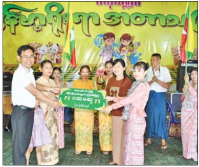
* အက်စ်တူဒီဇီလာမှ

နော်တင်ဟမ်ဖော့ရက်စ်အသင်းကတော့ ပေါ်တိုအသင်းကို ယူရိုပါလိဂ် ကွာတားဖိုင်နယ်အဆင့် ပထမအကျောပွဲစဉ်မှာ တစ်ဖက်တစ်ရိုးစီသရေ ဒုတိယအကျောပွဲစဉ်မှာ တစ်ရိုး-ရိုးအနိုင်ရရှိခဲ့လို့ နှစ်ကျောပေါင်းရလဒ် နှစ်ရိုး-တစ်ရိုးဖြင့် အနိုင်ရရှိကာ ဆီမီးဖိုင်နယ်အဆင့်ကို တက်လှမ်းခွင့်ရရှိခဲ့တာ ဖြစ်ပါတယ်။