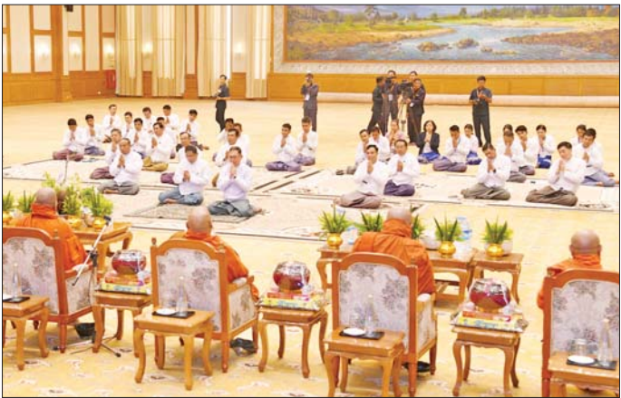
ခန်းမအတွင်းရှိ ဗုဒ္ဓဂုဏ်ပွားတော်မြတ်အား မြသပိတ်များ ကပ်လှူပူဇော်သည်။ ထို့နောက် ဥပုသ်တသန္တိစေတီတော်ဂေါပကအဖွဲ့