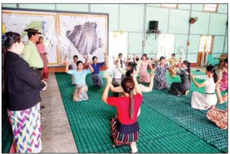
သိုက်မြိုက်စွာ ကျင်းပသွားမည့် ပြင်ဆင်မှုများကို ယနေ့ပေါ့တော်သီချင်းများ၊ ခေတ်ပေါ်တေးသီချင်းများဖြင့် ဖျော်ဖြေတင်ဆက်၍ ရေကစားခြင်းဖြင့် သင်္ကြန်ပွဲကို အေးချမ်းပျော်ရွှင်စွာ ဆင်နွှဲကြမည့်အပြင် ဝတ်စုံနှင့် အန္တရာယ်ကင်းပရိတ်တရားပေး စွက်ပတ်ပူဇော်ပွဲတို့ကိုလည်း ကျင်းပသွားမည် ဖြစ်ကြောင်း သိရသည်။

မကွေးတိုင်းဒေသကြီး မင်းဘူးမြို့၌ ၁၃၈၇ ခုနှစ် မြန်မာ့ရိုးရာ ယဉ်ကျေးမှု မဟာသင်္ကြန်ပွဲတော်တွင် လမ်းလျှောက်သင်္ကြန်နှင့် ယိမ်းအဖွဲ့များ၊ တစ်ပင်တိုင်အကများဖြင့် စည်ကားသိုက်မြိုက်စွာ ဖျော်ဖြေ တင်ဆက်မည်ဖြစ်ရာ ယိမ်းအဖွဲ့များ၏ အကလေ့ကျင့်မှုများကို ခရိုင်စီမံခန့်ခွဲရေးနှင့် အုပ်ချုပ်ရေးကော်မတီဥက္ကဋ္ဌ ဦးအေးလွင်နှင့် တာဝန်ရှိသူများက ယနေ့နံနက်ပိုင်းတွင် သွားရောက်ကြည့်ရှုအားပေးခဲ့သည်။