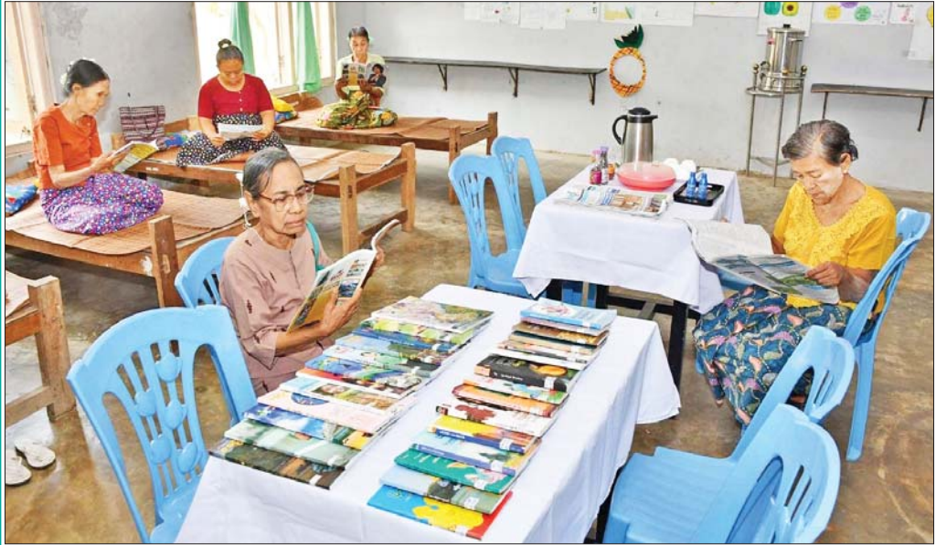
အပူရှောင်စခန်းသို့ လာရောက်အပူရှောင်နားခိုကြသူများအား တွေ့ရစဉ်။

သတိပြုကာကွယ် ပြင်းထန်သော အပူရှိန်သည် ရုပ်ပိုင်းဆိုင်ရာကို သာမက စိတ်ပိုင်းဆိုင်ရာကိုပါ ထိခိုက်စေပြီး အပူ ဒဏ်ကြောင့် ရုတ်တရက်သေဆုံးသည့်အထိ အန္တရာယ်ရှိနိုင်ပါသည်။ ထို့ကြောင့် သက်ကြီး အဘိုး/ အဘွားများအပါအဝင် ပြည်သူများအနေဖြင့် အပူဒဏ်ရှောင်ရှားနိုင်ရေးအတွက် မိမိတို့နေအိမ်များ တွင် နေထိုင်ရန် သင့်တော်မှုမရှိပါက အပူရှောင်စခန်း များတွင် နားခိုနေထိုင်ပြီး အပူဒဏ်ကို ရှောင်ရှားကြ ပါရန်နှင့် ကျန်းမာရေးဝန်ကြီးဌာနက နေ့စဉ် နှိုးဆော် ထုတ်ပြန်ပေးနေမည့် အပူဒဏ်ကာကွယ်နိုင်ရေး လိုက်နာဆောင်ရွက်ရမည့်အချက်များကို သတိပြု လိုက်နာကြပါရန် တိုက်တွန်းရေးသား တင်ပြလိုက် ရပါသည်။