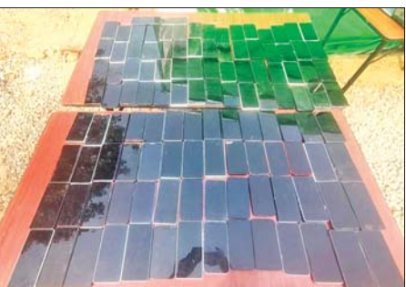
ဖုန်းမျိုးစုံ ၁၁၈ လုံးကို တွေ့ရစဉ်။