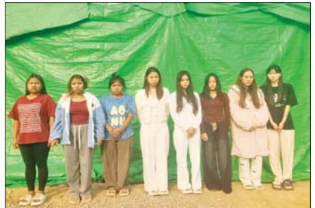
မြန်မာနိုင်ငံသား အမျိုးသမီးများကို တွေ့ရစဉ်။