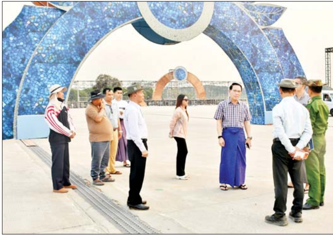
ပြည်သူ့လွှတ်တော် ဒုတိယဥက္ကဋ္ဌ ဦးမောင်မောင်အုန်း နေပြည်တော်ရင်ပြင်၌ လမ်းလျှောက်သင်္ကြန်ကျင်းပနိုင်ရေး ကြိုတင်ပြင်ဆင်မှုများ ကြည့်ရှုစစ်ဆေးစဉ်။

ယခုနှစ် ကျင်းပမည့် မဟာသင်္ကြန်ပွဲတော်သည် သာမန်ပျော်ပွဲရွှင်ပွဲတစ်ခုထက်ပို၍ နိုင်ငံတော်အစိုးရ၊ လွှတ်တော်ကိုယ်စားလှယ်များ၊ ဝန်ထမ်းများ၊ ပြည်သူများအားလုံးပူးပေါင်းပြီး စိတ်သစ်၊ လူသစ်၊ နိုင်ငံရေးအခင်းအကျင်းသစ်များဖြင့် အတူတကွပျော်ရွှင်စွာ ဆင်နွှဲနိုင်ရန်၊ အနှစ်သာရရှိသည့် မြန်မာ့ရိုးရာပွဲတော်တစ်ခုဖြစ်စေရန် ရည်ရွယ်ချက်ဖြင့် ပြည်သူ့လွှတ်တော် ဒုတိယဥက္ကဋ္ဌဦးမောင်မောင်အုန်းသည် တာဝန်ရှိသူများနှင့်အတူ ယနေ့တွင် နေပြည်တော်ရင်ပြင်၌ လမ်းလျှောက်သင်္ကြန်ကျင်းပနိုင်ရေး ကြိုတင်ပြင်ဆင်မှုများကို သွားရောက်ကြည့်ရှုစစ်ဆေးသည်။