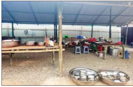
မီးဖိုဆောင်ကို တွေ့ရစဉ်။