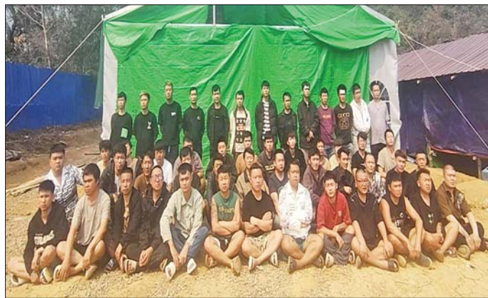
တရုတ်နိုင်ငံသားများအား တွေ့ရစဉ်။

လုပ်ကိုင်သူများ ဝင်ရောက် အခြေပြုနေထိုင်ခြင်း မရှိစေရန် အတွက် ယနေ့နံနက်ပိုင်းတွင် ရှမ်းပြည်နယ် (မြောက်ပိုင်း) တန့်ယန်းမြို့နယ်အတွင်း လိုအပ် သည့် စုံစမ်းစစ်ဆေးခြင်းနှင့် ရှာဖွေ ဖော်ထုတ်ခြင်းများကို လုပ်ဆောင်စဉ် အဆိုပါမြို့၏ အရှေ့မြောက်ဘက်မီတာ ၂၅၀၀ ခန့်အကွာ ကောင်းဆန်းကျေးရွာ အနီး၌ အွန်လိုင်းလိမ်လည် လောင်းကစား လုပ်ကိုင်သူများ နေထိုင် အသုံးပြုလျက်ရှိသည့် အိမ်ဆောင် သုံးလုံး၊ အလုပ်ရုံ နှစ်လုံး၊ စားသောက်ခန်း တစ်လုံး၊ မီးဖိုဆောင် နှစ်လုံးနှင့် ဆောက်လုပ် ဆဲ အဆောက်အအုံ ၁၅ လုံးတို့ကို ရှာဖွေဖော်ထုတ် တွေ့ရှိခဲ့ပြီး ၎င်းအဆောက်အအုံများအတွင်းမှ အွန်လိုင်းလိမ်လည်လောင်းကစား မှုများ လုပ်ကိုင်လျက်ရှိသည့် တရုတ်နိုင်ငံသား အမျိုးသား ၁၀၀၊ အမျိုးသမီး တစ်ဦး၊ မြန်မာနိုင်ငံသား အမျိုးသား ၁၂ ဦး၊ အမျိုးသမီး