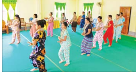
ဖျော်ဖြေရေးအစီအစဉ်တို့ဖြင့် စည်ကားသိုက်မြိုက်စွာ ကျင်းပမည်ဖြစ်ကြောင်း သိရသည်။ ခရိုင်(ပြန်/ဆက်)

သထုံ ဧပြီ ၄ မွန်ပြည်နယ် သထုံမြို့တွင် ၂၀၂၆ ခုနှစ် မြန်မာ့ရိုးရာ မဟာသင်္ကြန်ပွဲတော်အား စည်ကားသိုက်မြိုက်စွာ ကျင်းပနိုင်ရေးအတွက် ခရိုင်အဆင့် ဗဟိုရေကစားမဏ္ဍပ်ကြီးအား ဆောက်လုပ်နေပြီး ရိုးရာ သင်္ကြန် ယိမ်းအဖွဲ့ဝင်များက ယှဉ်ပြိုင်ကြမည့် ယိမ်းအဖွဲ့များ ကြိုတင်ပြင်ဆင်လေ့ကျင့်ခြင်းတို့ကို ဆောင်ရွက်လျက်ရှိကြောင်း သိရသည်။ သထုံမြို့၏ဗဟိုရေကစားမဏ္ဍပ်ကို သထုံမြို့လယ်ရွှေစာရုံစေတီတော် မြတ်ကြီး အနောက်ဘက်မုခ်အရှေ့ရှိ ရန်ကုန်-မော်လမြိုင် ကားလမ်းခံဘေး အဝေးပြေးယာဉ်ရပ်နားကွင်းအတွင်း၌ တည်ဆောက်နေပြီး ပြိုင်ပွဲဝင် ယိမ်းအဖွဲ့ခြောက်ဖွဲ့တို့က ယှဉ်ပြိုင်ကြမည့်ဖြစ်ကာ နေ့စဉ်အဖွဲ့အစည်း အသီးသီးနှင့် ရပ်ကွက်တို့မှ ယိမ်းအဖွဲ့များ၊ အနုပညာရှင်များ၏