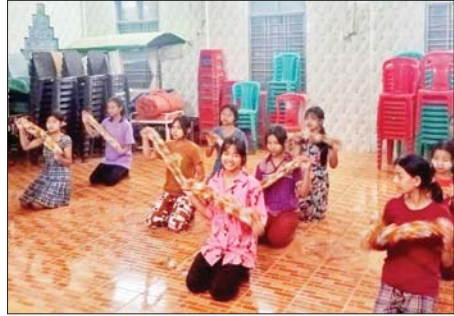
လှပျိုဖြူများက မြန်မာ့ရိုးရာသင်္ကြန်ပွဲတွင် ညီညာစွာဖျော်ဖြေနိုင်ရေး ယိမ်းအကများ လေ့ကျင့်ဆောင်ရွက်လျက်ရှိကြောင်း သိရသည်။ မြို့နယ်(ပြန်/ဆက်)

ဝေါ ဧပြီ ၄ ပဲခူးတိုင်းဒေသကြီး ဝေါမြို့နယ်တွင် ၂၀၂၆ ခုနှစ် မြန်မာ့ရိုးရာ မဟာသင်္ကြန်ပွဲတော်ကို ဧပြီ ၁၃ ရက်မှ ၁၆ ရက်အထိ လမ်းလျှောက်သင်္ကြန်ပွဲတော်အား စည်ကားသိုက်မြိုက်စွာ ကျင်းပသွားမည်။ လေ့ကျင့်ဆောင်ရွက် မြန်မာ့ရိုးရာယဉ်ကျေးမှုမဟာသင်္ကြန်ပွဲတော်ဖျော်ဖြေရေးမဏ္ဍပ်ကို အထွေထွေအုပ်ချုပ်ရေးဦးစီးဌာနရုံးရှေ့၌ ပေ ၂၀၀ ပတ်လည် မဏ္ဍပ်အား ဆောက်လုပ်သွားမည်ဖြစ်ပြီး ဖျော်ဖြေရေးမဏ္ဍပ်ကို ရန်ကုန်-မော်လမြိုင် ကားလမ်းမကြီးအတိုင်း လမ်းလျှောက်သင်္ကြန်ပွဲတော်ကို စည်ကားသိုက်မြိုက်စွာ ယိမ်းအဖွဲ့ရှစ်ဖွဲ့က ခေတ်ပေါ်တေးဂီတများဖြင့် အလှည့်ကျဖျော်ဖြေတင်ဆက်သွားမည်ဖြစ်ပြီး ဖျော်ဖြေရေး ယိမ်းအဖွဲ့ရှစ်ဖွဲ့ရှိ