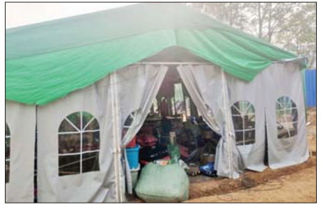
အလုပ်ရုံကို တွေ့ရစဉ်။