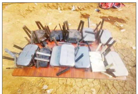
Wireless Router ၁၃ လုံးကို တွေ့ရစဉ်။