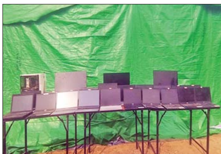
All in one နှစ်လုံး၊ Desktop တစ်စုံနှင့် Laptop ၂၀ လုံးကို တွေ့ရစဉ်။