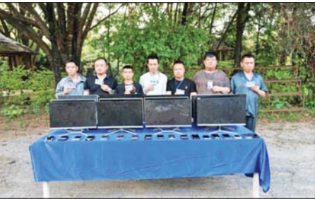
တန့်ယန်းမြို့နယ်အတွင်း အွန်လိုင်းလိမ်လည်လောင်းကစားမှု ကျူးလွန်သူများကို တွေ့ရစဉ်။