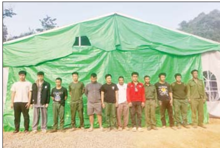
မြန်မာနိုင်ငံသား အမျိုးသားများကို တွေ့ရစဉ်။

လျက်ရှိသည့် ဖမ်းဆီးရမိသူများ အား လိုအပ်သည့်စစ်ဆေးမှုများ ဆောင်ရွက်ပြီးစီးပါက တည်ဆဲ ဥပဒေများနှင့်အညီ ထိရောက် ပြင်းထန်စွာ အရေးယူဆောင်ရွက် သွားမည်ဖြစ်ပြီး သိမ်းဆည်းရမိ ဆက်စပ်ပစ္စည်းများအား လုပ်ထုံး လုပ်နည်းများနှင့်အညီ ဆက်လက် ဆောင်ရွက်သွားမည် ဖြစ်ကြောင်း သိရသည်။ နိုင်ငံတော်အနေဖြင့် အွန်လိုင်း လိမ်လည် လောင်းကစားမှု ကျူးလွန်ခြင်း ပပျောက်စေ ရေးနှင့် မြန်မာနိုင်ငံအတွင်း အခြေချလုပ်ကိုင်နိုင်မှု မရှိစေရေး အတွက် အိမ်နီးချင်းနိုင်ငံများ၊ ဒေသတွင်းနိုင်ငံများ၊ နိုင်ငံတကာ အဖွဲ့အစည်းများနှင့် ပူးပေါင်း၍ အွန်လိုင်းလိမ်လည်လောင်းကစား မှု တိုက်ဖျက်ရေးလုပ်ငန်းစဉ် များကို တက်ကြွစွာ ဆက်လက် ဆောင်ရွက်လျက်ရှိကြောင်း သိရ သည်။ သတင်းစဉ်