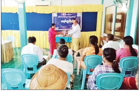
ပြည်သူ့ဆက်ဆံရေး ဦးစီးဌာန လူထုအခြေပြုလုပ်ငန်းဌာနရှိ အစည်းအဝေးခန်းမ၌ ကျင်းပသည်။

ရန်ကုန် ဧပြီ ၄ ရန်ကုန်တိုင်းဒေသကြီး အစိုးရအဖွဲ့ကပွဲစဉ်ထားသောတိုင်းဒေသကြီး စာကြည့်တိုက်များ ကြီးကြပ်ရေးကော်မတီက စာကြည့်တိုက်ဖွံ့ဖြိုးတိုးတက်ရေးနှင့် စာပေတိုက်ရန်မြှင့်တင်ရေးအတွက် ရန်ကုန်တိုင်းဒေသကြီးအတွင်းရှိ မြို့နယ်များမှ ရပ်ကွက်၊ ကျေးရွာ စာကြည့်တိုက်များသို့ ကျပ်သိန်း ၈၀၀ ဖိုးခန့်ရှိ သုတ၊ ရသ စာအုပ်များကို ပေးအပ်လျက်ရှိရာ အင်းစိန်မြို့နယ် စာအုပ်ပေးအပ်ပွဲကို ယမန်နေ့ မွန်းလွဲ ၁ နာရီက ခရိုင်ပြန်ကြားရေးနှင့်