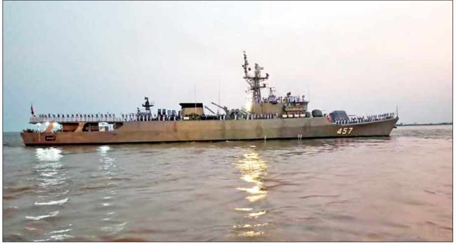
ထိုင်းဘုရင့်ရေတပ်မှ ချစ်ကြည်ရေးခရီးအလည်အပတ်ရောက်ရှိနေသည့် စစ်ရေယာဉ် HTMS Kraburi(FFG-457) ပြန်လည်ထွက်ခွာစဉ်။