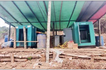
မီးစက်နှစ်လုံးကို တွေ့ရစဉ်။