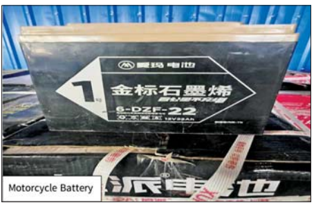
ကချင်ပြည်နယ်၌ သိမ်းဆည်းရမိမှု။

နိုင်ခြင်းမရှိသည့် လုပ်ငန်းသုံး ပစ္စည်း နှစ်မျိုး (စုစုပေါင်း ခန့်မှန်း တန်ဖိုးငွေကျပ် ၃၂၈၀၀၀၀) ကို သိမ်းဆည်းရမိခဲ့ပြီး အကောက်ခွန် ဥပဒေနှင့်အညီ အရေးယူ ဆောင်ရွက်လျက်ရှိသည်။ ယင်းအပြင် စစ်ကိုင်းတိုင်း ဒေသကြီး တရားမဝင်ကုန်သွယ်မှု တိုက်ဖျက်ရေး အထူးအဖွဲ့၏ စီမံခန့်ခွဲမှုဖြင့် တာဝန်ကျပူးပေါင်း အဖွဲ့က စစ်ဆေးမှုများ ဆောင်ရွက်ခဲ့ရာ ဒီဇင်ဘာ ၂၅ ရက် တွင် စစ်ကိုင်းမြို့နယ် ရတနာပုံ တံတား ပူးပေါင်းစစ်ဆေးရေးဂိတ် ၌ ယာဉ်တစ်စီးပေါ်မှ တရားမဝင် စာရွက်စာတမ်းအထောက်အထား တင်ပြနိုင်ခြင်းမရှိသည့် စားသောက် ကုန်ပစ္စည်း တစ်မျိုး (ခန့်မှန်း တန်ဖိုးငွေကျပ် ၂၄၀၀၀၀) နှင့် လိုင်စင်မဲ့ယာဉ် နှစ်စီး (ခန့်မှန်း တန်ဖိုးငွေကျပ် ၃၈၀၀၀၀) ကို ပို့ကုန်သွင်းကုန်ဥပဒေအရ လည်းကောင်း၊ စစ်ကိုင်းမြို့ မြို့အဝင် စစ်ဆေးရေးဂိတ်၌ တရားမဝင် ရွှေသတ္တုတူးဖော်ရာတွင် အသုံးပြု သည့် မှုအိုး ၁၉ လုံးနှင့် ဆက်စပ် ပစ္စည်း တစ်မျိုး (ခန့်မှန်းတန်ဖိုး ငွေကျပ် ၂၈၃၀၀၀၀) ကို မြန်မာ့ သတ္တုတူးဖော်ရေးအရ လည်း ကောင်း၊ ရွှေပို့မြို့နယ် အမှတ် (၁၄) ရပ်ကွက် အနော်ရထာလမ်း၌ ယာဉ် တစ်စီးပေါ်မှ တရားမဝင် စာရွက်စာတမ်းအထောက်အထား တင်ပြနိုင်ခြင်းမရှိသည့် စားသောက် ကုန်ပစ္စည်း တစ်မျိုး (ခန့်မှန်း တန်ဖိုးငွေကျပ် ၂၂၀၀၀၀၀) ကို ပို့ကုန်သွင်းကုန် ဥပဒေအရ လည်းကောင်း (စုစုပေါင်း ခန့်မှန်း တန်ဖိုးငွေကျပ် ၉၀၇၀၀၀၀) ကို သိမ်းဆည်းအရေးယူ ဆောင်ရွက်