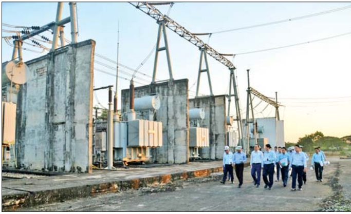
ဆောင်ရွက်ပြီးစီးမှု အခြေအနေ၊ ၃၃၀ကေစီလမ်းဆုံ မီးရထားသံလမ်းအနီးရှိ ၆၆ ကေစီ လျှော့ကား-ရှာမသံမဏိဓာတ်အားလိုင်းတိုင်များ ပြောင်းရွှေ့တည်ဆောက်နေမှု၊ လှိုင်သာယာ (အနောက်ပိုင်း) မြို့နယ် အနော်ရထာလမ်းမှ ရန်ကုန်အနောက်ပိုင်း နည်းပညာ တက္ကသိုလ်လမ်းအပိုင်း အထိ ၃၃၀ကေစီလမ်း တစ်လျှောက် ဆက်သွယ်ရေး ဖိုက်ဘာကေဘယ် လိုင်းများ ပြောင်းရွှေ့ခြင်းလုပ်ငန်း ဆောင်ရွက်ပြီးစီးနေမှု အနော်ရထာ

နေပြည်တော် ဒီဇင်ဘာ ၂၅ လျှပ်စစ်စွမ်းအားဝန်ကြီးဌာန ပြည်ထောင်စုဝန်ကြီး ဦးဉာဏ်ထွန်းသည် ရန်ကုန်လျှပ်စစ်ဓာတ်အားပေးရေး ကော်ပိုရေးရှင်းဥက္ကဋ္ဌ ဌာနဆိုင်ရာ တာဝန်ရှိသူများနှင့်အတူ ယနေ့နံနက် ရန်ကုန်တိုင်းဒေသကြီး ရွှေပြည်သာမြို့နယ်ရှိ အမှတ်(၄) လမ်းမကို (၈)လမ်းသွား လမ်းမကြီးအဖြစ် အဆင့်မြှင့်တင်တိုးချဲ့ခြင်း လုပ်ငန်းများ ဆောင်ရွက်ရာတွင် လမ်းနယ်နှင့် မလွတ်ကင်းသော ဓာတ်အားလိုင်းများ လမ်းမကြီးနှင့် လွတ်ကင်းရာသို့ ပြောင်းရွှေ့တည်ဆောက်ခြင်း ဆောင်ရွက်ပြီးစီးနေမှုကို သွားရောက် ကြည့်ရှုစစ်ဆေးသည်။ ကြည့်ရှုစစ်ဆေး ဦးစွာ ပြည်ထောင်စုဝန်ကြီးနှင့်အဖွဲ့သည် ရွှေပြည်သာမြို့နယ်သို့ ရောက်ရှိရာ အမှတ်(၄) လမ်းမကို (၈)လမ်းသွား လမ်းမကြီးအဖြစ် အဆင့်မြှင့်တင် တိုးချဲ့ခြင်း လုပ်ငန်းများ ဆောင်ရွက်ရာတွင် လမ်းနယ်နှင့် မလွတ်ကင်းသော ၃၃ ကေစီ၊ ၅၀ ကေစီနှင့် ၄၀၀ ပီဇာ ဓာတ်အားလိုင်းများကို လမ်းမကြီးနှင့် လွတ်ကင်းရာသို့ ပြောင်းရွှေ့ တည်ဆောက်ခြင်း လုပ်ငန်းများ