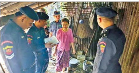
နေရောင်အောက်က သက်ရှိတွေကို စောင့်ရှောက်ဖို့ အိုဇုန်းလွှာကို ထိန်းသိမ်းဖို့