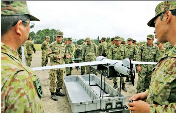
လျာထားမည်ဖြစ်သည်။ ကာကွယ်ရေးအသုံးစရိတ်အတွက် ရန်ပုံငွေရရှိရန် ဝင်ငွေခွန်တိုးမြှင့်ရန် လိုအပ်ကြောင်း သုံးသပ်လျက်ရှိသည်။ လစ်ဘရယ်ဒီမိုကရက်တစ်ပါတီနှင့် ဂျပန် ဆန်းသစ်တီထွင်ရေးပါတီတို့က ကာကွယ်ရေးအသုံးစရိတ်အတွက် ဆွေးနွေးလျက်ရှိသည်။ ကိုးကား - အင်န်အိတ်ချ်ကောဘာသာပြန် - အောင်ကျော်ကျော်

ပြည်တွင်းထုတ် အမျိုးအစား(၁၂) မြေပြင်မှ သင်္ဘောဖျက်ခိုးပျံများကို အဆင့်မြှင့်တင်ရန် အမေရိကန်ဒေါ်လာ ၁ ဒသမ ၁၄ ဘီလီယံခန့် လျာထားမည်ဖြစ်သည်။ ထို့ပြင် အသံထက်မြန်သော လက်နက်များဝယ်ယူရေးအတွက် အမေရိကန်ဒေါ်လာ ၁၉၃ ဒသမ ၇၂ သန်းခန့် ခွဲဝေသုံးစွဲမည်ဖြစ်သည်။ တိုက်လေယာဉ်များ ဖွံ့ဖြိုးတိုးတက်ရေးအတွက် ဒေါ်လာ ၁ ဒသမ ၀၃ ဘီလီယံကို သုံးစွဲမည်ဖြစ်သည်။ ဘတ်ဂျက်တောင်းခံမှုတွင်မောင်းသွဲ့ယာဉ်များ ဖြန့်ကြက်ထားရှိမည့် "SHIELD"ဟု ခေါ်သော ကမ်းရိုးတန်းကာကွယ်ရေးစနစ်အတွက် အသုံးစရိတ်လည်း ပါဝင်သည်။ နိုင်ငံ၏လေပိုင်နက် ချိုးဖောက်မှုများကို တုံ့ပြန်နိုင်ရန်အတွက် ဒရန်းပျံသန်းစမ်းသပ်မှုများ ပြုလုပ်ရန် နောက်ထပ် ဒေါ်လာ ၆ ဒသမ ၄၆ သန်းကို