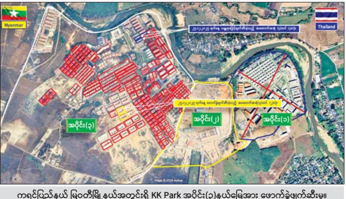
ကရင်ပြည်နယ် မြဝတီမြို့နယ်အတွင်းရှိ KK Park အပိုင်း(၃)နယ်မြေအခြား ဖောက်ခွဲဖျက်ဆီးမှု။