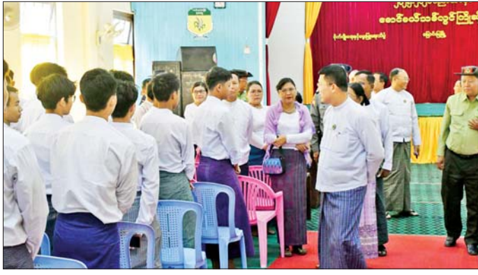
စိုက်ပျိုးရေးကျောင်းသား ကျောင်းသူ ၁၄၀၊ မွေးမြူ ဦး တက်ရောက်ပညာသင်ကြားလျက်ရှိကြောင်း သိရ ရေးကျောင်းသား ကျောင်းသူ နှစ်ဦး စုစုပေါင်း ၁၄၂ သည်။ ဇေယျာ(မြောင်းမြ)

ဖြာဝေ” တေးသီချင်းဖြင့် အခမ်းအနားကို ဖွင့်လှစ်ပေးကြပြီး တိုင်းဒေသကြီးဝန်ကြီးချုပ်က မောင်မယ်သစ်လွင်များအား ကြိုဆိုနှုတ်ခွန်းဆက်စကားပြောကြားကာ ကျောင်းအတွက် ချီးမြှင့်ငွေများကို လည်းကောင်း၊ ပထမနှစ်နှင့် ဒုတိယနှစ်ကို ထူးချွန်စွာ အောင်မြင်ခဲ့သည့် ကျောင်းသား ကျောင်းသူများအား ဂုဏ်ပြုဆုများကိုလည်းကောင်း ပေးအပ်သည်။ ကြိုဆိုပွဲအပြီးတွင် တိုင်းဒေသကြီးဝန်ကြီးချုပ်နှင့်အဖွဲ့သည် ကျောင်းသား ကျောင်းသူများနှင့်အတူ နေ့လယ်စာကို အတူတကွသုံးဆောင်ကြသည်။ မြောင်းမြ စိုက်ပျိုးရေးနှင့် မွေးမြူရေးသိပ္ပံ ကျောင်း၌ ၂၀၂၅-၂၀၂၆ ပညာသင်နှစ် ပထမနှစ်တွင်