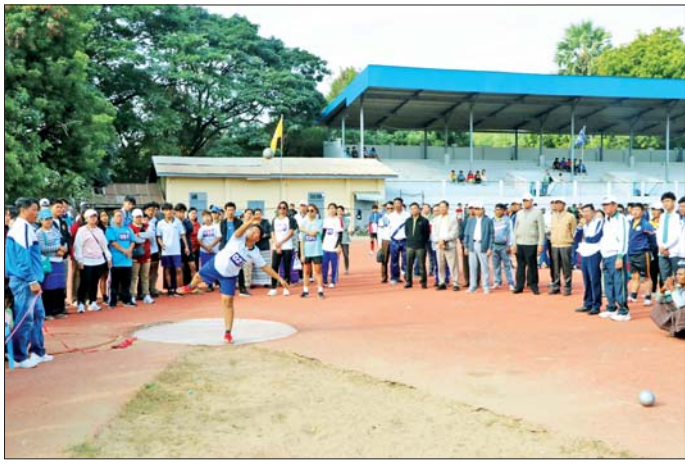
ရန် မဲရုံအမှတ်(၁)နှင့် မဲရုံအမှတ်(၂)ပြင်ဆင်ဆောင် ရွက်ထားရှိမှုကို လှည့်လည်ကြည့်ရှုပြီး မဲရုံများ၊ ခုတီယမဲရုံများ၊ အဖွဲ့ဝင်များအား ရင်းရင်းနှီးနှီး တွေ့ဆုံကာ လိုအပ်သည်များကို ပေါင်းစပ် ဖြည့်ဆည်းဆောင်ရွက်ပေးခဲ့ကြောင်း သိရသည်။ တိုင်းဒေသကြီး(ပြန်/ဆက်)

အမျိုးသမီး အလျားခုန် ဗိုလ်လုပွဲပြိုင်ပွဲများ ယှဉ်ပြိုင်နေမှု၊ အမျိုးသား အမျိုးသမီး သံလုံးပစ် ဗိုလ်လုပွဲပြိုင်ပွဲများ ယှဉ်ပြိုင်နေမှု၊ ထုပ်ဆီးတိုး ဗိုလ်လုပွဲပြိုင်ပွဲ ယှဉ်ပြိုင်နေမှုကို တက္ကသိုလ်၊ ဒီဂရီ ကောလိပ်များမှ ကျောင်းသား ကျောင်းသူများနှင့် အတူ ကြည့်ရှုအားပေးကြသည်။ ထို့နောက် တိုင်းဒေသကြီးဝန်ကြီးချုပ်နှင့် တာဝန်ရှိသူများသည် ဒီဇင်ဘာ ၂၈ ရက်တွင် ကျင်းပ မည့် ၂၀၂၅ ခုနှစ် ပါတီစုံဒီမိုကရေစီအထွေထွေ ရွေးကောက်ပွဲ အောင်မြင်စွာကျင်းပနိုင်ရေးအတွက် မုံရွာမြို့ ဆူးလေကုန်းရပ်ကွက်ရှိ အမှတ်(၃)အခြေခံ ပညာအထက်တန်းကျောင်းဝင်းအတွင်း မဲရုံအမှတ် (၁) ပြင်ဆင်ဆောင်ရွက်ထားရှိမှုနှင့် အမှတ် (၇) အခြေခံပညာ အထက်တန်းဝင်းအတွင်းရှိ အောင် မင်္ဂလာရပ်ကွက် မဲဆန္ဒရှင်ပြည်သူများ ဆန္ဒမဲပေးနိုင်