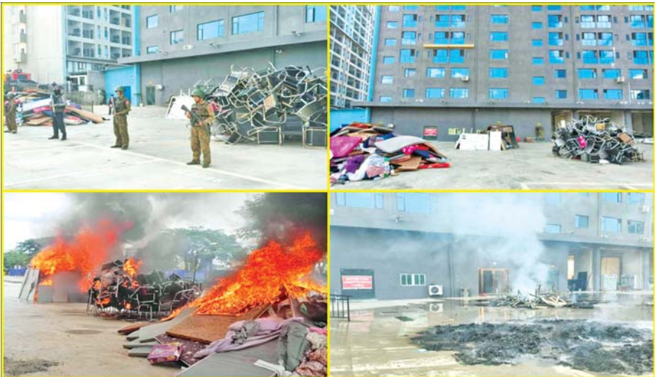
ရွှေကုက္ကိုလ်နယ်မြေအတွင်း အွန်လိုင်းလိမ်လည်လောင်းကစားမှုကျူးလွန်သူများ အသုံးပြုခဲ့သည့် အသုံးအဆောင်ပစ္စည်းများကို မီးရှို့ဖျက်ဆီးမှု မှတ်တမ်းဓာတ်ပုံ။

နေပြည်တော် ဒီဇင်ဘာ ၂၅ မြန်မာနိုင်ငံအစိုးရအနေဖြင့် အွန်လိုင်းလိမ်လည်လောင်းကစားမှုများ အများဆုံးအခြေချလုပ်ကိုင်လျက်ရှိကြသည့် ရွှေကုက္ကိုလ်နယ်မြေနှင့် KK Park နယ်မြေများရှိ တရားမဝင် အဆောက်အအုံများအတွင်း ဝင်ရောက်ရှင်းလင်းခြင်း၊ အွန်လိုင်းလိမ်လည်လောင်းကစားမှု လုပ်ငန်းစဉ်များတွင် အသုံးပြုခဲ့သည့် သိမ်းဆည်းရမိပစ္စည်းများနှင့် တရားမဝင် အဆောက်အအုံများအား စနစ်တကျဖြိုချဖျက်ဆီးခြင်းများကို လုံခြုံရေးတပ်ဖွဲ့ဝင်များ၊ အုပ်ချုပ်ရေးအဖွဲ့အစည်းများနှင့် ဒေသတွင်းတာဝန်ရှိသူများအပါအဝင် အဖွဲ့စုံပါဝင်သည့် ပူးပေါင်းအဖွဲ့ဖြင့် ဆောင်ရွက်လျက်ရှိသည်။