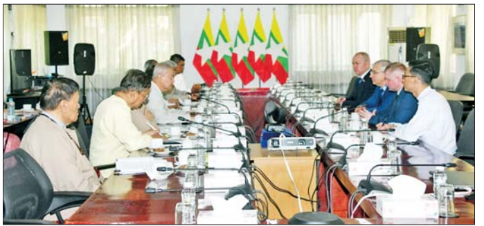
ဗဟိုရွေးကောက်ပွဲကော်မရှင် ဒုတိယဥက္ကဋ္ဌဦးဆောင်သည့် ရွေးကောက်ပွဲစောင့်ကြည့်လေ့လာရေးအဖွဲ့သည် ရွှေတိဂုံဓေတီတော်မြတ်ကြီးအား သွားရောက် ဖူးမြော်ကြည့်ပြီး သာသနိကအဆောက်အအုံများကို ကြည့်ရှုလေ့လာခဲ့ကြကြောင်း သိရသည်။ သတင်းစဉ်

ပေါ်ပေါက်လာမည့်လွှတ်တော်နှင့် ဘယ်လားရစ် လွှတ်တော်တို့အကြား ပူးပေါင်းဆောင်ရွက်သွားမည့် ကိစ္စများ၊ နှစ်နိုင်ငံပူးပေါင်းဆောင်ရွက်မှုဆိုင်ရာ ကိစ္စရပ်များကို အမြင်ချင်းဖလှယ်ဆွေးနွေးကြသည်။ ဘယ်လားရစ်ရွေးကောက်ပွဲ လေ့လာစောင့်ကြည့်ရေးအဖွဲ့၏ လာရောက်တွေ့ဆုံမှုသည် MISIS နှင့် ဘယ်လားရစ်သမ္မတနိုင်ငံမှ သက်ဆိုင်ရာအဖွဲ့အစည်းများအကြား အပြန်အလှန်နားလည်မှုကို ပိုမိုခိုင်မာစေပြီး အပြုသဘောဆောင်သည့် ထိတွေ့ဆက်ဆံမှု တစ်ရပ်ဖြစ်သည်။ မွန်းလွဲပိုင်းတွင် ဘယ်လားရစ်သမ္မတနိုင်ငံ