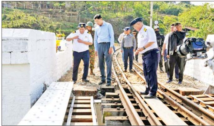
တံတား၏ထောက်တိုင်အောက်ခြေများ ကြိုခိုင်ရေး ဆောင်ရွက်ထားမှု ပြင်ဦးလွင်-ဂုတ်ထိပ်-ကျောက်မဲ-သီပေါလမ်းပိုင်းအား တောချုံရုတ်ခြင်း၊ လမ်းပိုင်း ပြုပြင်ခြင်း ဆောင်ရွက်ပြီးစီးမှုနှင့် တံတားဆေးသုတ်

နေပြည်တော် ဒီဇင်ဘာ ၂၅ ပို့ဆောင်ရေးနှင့် ဆက်သွယ်ရေးဝန်ကြီးဌာန ပြည်ထောင်စုဝန်ကြီး ဦးမြထွန်းဦးသည် မြန်မာ့မီးရထား ဦးဆောင်ညွှန်ကြားရေးမှူးချုပ်၊ တာဝန်ရှိသူများနှင့်အတူ ယနေ့နံနက်ပိုင်းတွင် RBE ရထားဖြင့် ပြင်ဦးလွင်-ဂုတ်ထိပ်ကြားရှိ ရထားလမ်းပိုင်းနှင့် ရှေးဟောင်းသမိုင်းဝင် ဂုတ်ထိပ်တံတားကို သွားရောက်ကြည့်ရှုစစ်ဆေးသည်။ ဦးစွာ ပြည်ထောင်စုဝန်ကြီးနှင့်အဖွဲ့သည် RBE ရထားဖြင့် ပြင်ဦးလွင်-ဂုတ်ထိပ်ရထားလမ်းပိုင်း အခြေအနေကို ကြည့်ရှုစစ်ဆေးပြီး လမ်းပိုင်းအတွင်းရှိ ရထားလမ်းနှင့်တံတားများ ကြိုခိုင်မှုရှိစေရေး၊ ဘူတာများသန့်ရှင်းသန့်ယာလုပ်စေရေးနှင့် လိုအပ်သည်များကို ဆွေးနွေးမှာကြားသည်။ ထို့နောက် ဂုတ်ထိပ်တံတားထိပ်သို့ရောက်ရှိရာ မြန်မာ့မီးရထား ဦးဆောင်ညွှန်ကြားရေးမှူးချုပ်က ရှေးဟောင်းသမိုင်းဝင်အမွေအနှစ်ဖြစ်သည့် ဂုတ်ထိပ်