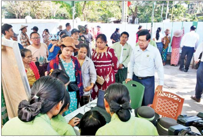
ပွဲစွာ တိုင်းဒေသကြီးဝန်ကြီးချုပ်က အမှတ်စကားပြောကြားပြီး တိုင်းဒေသကြီးဝန်ကြီးချုပ်နှင့် အကြမ်းဖက်နှိမ်နင်းရေးအဖွဲ့ဝင်များအား ယူနီဖောင်း၊ ဆန့်ဆီနှင့် စားသောက်ကုန်များကို ပေးအပ်ကြကာ အားပေးစကားပြောကြား၍ ရင်းရင်းနှီးနှီး နှုတ်ဆက်ခဲ့ကြောင်း သိရသည်။

လိုအပ်သည်များ မှာကြားကာ ပေါင်းစပ်ညှိနှိုင်းဆောင်ရွက်ပေးသည်။ ထို့နောက် ၂၀၂၅ ခုနှစ် ဒီဇင်ဘာလတွင် ပါတီစုံဒီမိုကရေစီအထွေထွေရွေးကောက်ပွဲ ကျင်းပနိုင်ရေးအတွက် မှော်ဘီမြို့နယ် ညောင်ကုန်းကျေးရွာအုပ်စု အုပ်ချုပ်ရေးမှူးရုံးတွင် တတိယအကြိမ် မဲဆန္ဒရှင်စာရင်းများ ကပ်ထားကြေညာထားရှိမှုကိုလည်းကောင်း၊ တိုက်ကြီးမြို့နယ် အခြေခံပညာအထက်တန်းကျောင်း(တာရွာ)တွင် မဲဆန္ဒရှင်ပြည်သူများ ရွေးကောက်ပွဲမဲပေးခြင်းဆိုင်ရာ အသိပညာပေး ဆောင်ရွက်နေမှုနှင့် မဲရုံခင်းကျင်းပြင်ဆင်ထားရှိမှုများကိုလည်းကောင်း၊ တိုက်ကြီးမြို့နယ် ဗောဓိကုန်းရပ်ကွက် အုပ်ချုပ်ရေးမှူးရုံးတွင် တတိယအကြိမ် မဲဆန္ဒရှင်စာရင်းများ ကပ်ထားကြေညာထားရှိမှုနှင့် ကြိုတင်မဲပေးနေမှု တို့ကိုလည်းကောင်း ကြည့်ရှုစစ်ဆေးပြီး လိုအပ်သည်များ မှာကြားသည်။ အဆိုပါ တတိယအကြိမ် မဲဆန္ဒရှင်စာရင်းများကို ရန်ကုန်တိုင်းဒေသကြီးအတွင်း မြို့နယ်များ၌ ကပ်ထားကြေညာမည်ဖြစ်ရာ မဲဆန္ဒရှင်စာရင်းများ