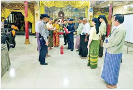
ခေတ္တနာခိုနေရာစီစဉ်ဆောင်ရွက်ပေးရန် ကိစ္စရပ်များအတွက်

ရန်ကုန် ဒီဇင်ဘာ ၂၅ ရန်ကုန်တိုင်းဒေသကြီး မင်္ဂလာတောင်ညွန့် မြို့နယ်အတွင်းရှိ မဲရုံများတွင် မဲဆန္ဒရှင်ပြည်သူများ ဘေးကင်းလုံခြုံစွာ ဆန္ဒမဲပေးနိုင်ရေးအတွက် တာဝန်ရှိသူများက ဒီဇင်ဘာ ၂၄ ရက် နံနက်ပိုင်းတွင် ကြည့်ရှုစစ်ဆေးခဲ့သည်။