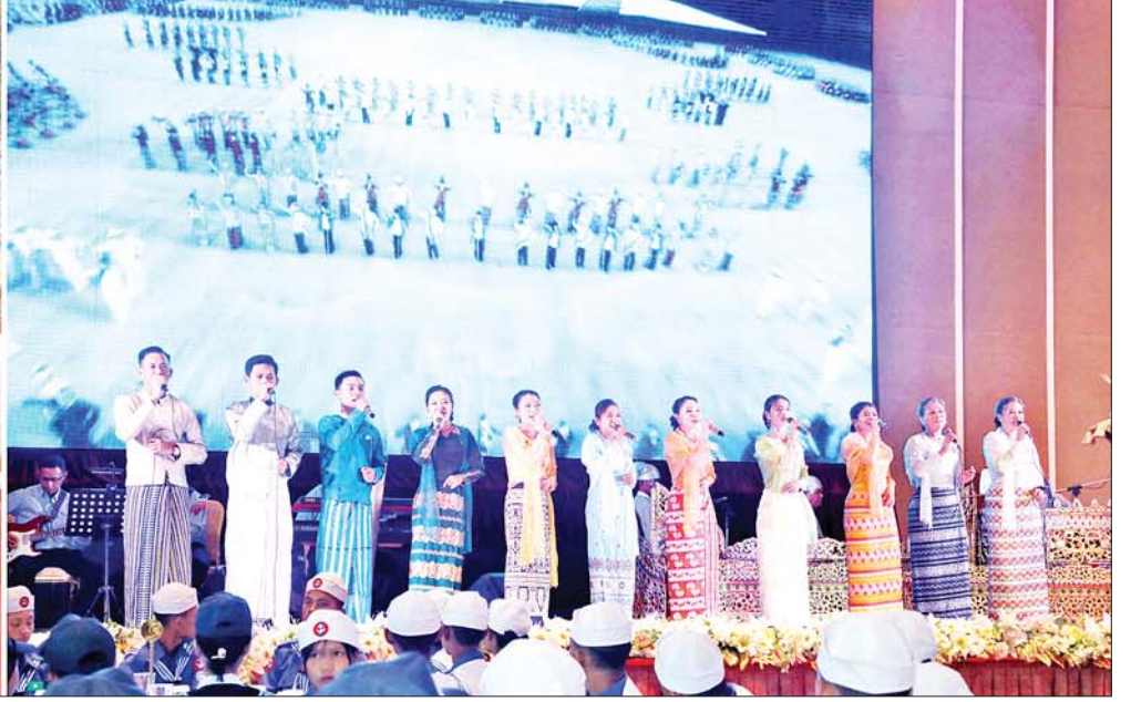
နိုင်ငံတော်စီမံအုပ်ချုပ်ရေးကောင်စီဥက္ကဋ္ဌ တပ်မတော်ကာကွယ်ရေးဦးစီးချုပ် ဗိုလ်ချုပ်မှူးကြီးမင်းအောင်လှိုင် ရေကြောင်းနှင့်လေကြောင်း လူငယ်မောင်မယ်များကို လက်ဖက်ရည်ပိုင်းဖြင့် တည်ခင်းဧည့်ခံခဲ့ပြီး မြဝတီတေးဂီတအဖွဲ့က တေးသီချင်းများဖြင့် ဂုဏ်ပြုဖျော်ဖြေမှုကို ကြည့်ရှုအားပေးစဉ်။

* စာမျက်နှာ ၃ မှ ဖြစ်ပေါ်စေခြင်းကြောင့် ယခုကဲ့သို့ သင်တန်းများတွင် ထည့်သွင်း သင်ကြားပေးရခြင်း ဖြစ်ကြောင်း၊ ထို့အပြင် “နိုင်ငံတော်ရဲ့ လွတ်လပ် ရေး ကြိုးပမ်းမှုနှင့် တပ်မတော် သမိုင်း” ကိုပါ ပို့ချပေးခဲ့ခြင်း ကြောင့် သမိုင်းကြောင်းအမှန်များ ကိုသိရှိပြီး တိုင်းချစ်ပြည်ချစ်စိတ် များ ထက်သန်ကာ တိုင်းပြည်၏ ဂုဏ်ကို မြှင့်တင်ပေးလိုသည့်သူ၊ အမျိုးဂုဏ်ဇာတိဂုဏ်ကိုစောင့်ထိန်း လိုသူများဖြစ်အောင် ဆောင်ရွက် သွားကြရမည်ဖြစ်ကြောင်း၊ ပညာ ပြည့်ဝနည်းလမ်းလှသည့် လူငယ်များ ၏အားကသာလျှင် နိုင်ငံတော်ကို ကောင်းကျိုးအမြတ်ဖြာ ဖြစ်ထွန်း စေမည်ဖြစ်ကြောင်း။