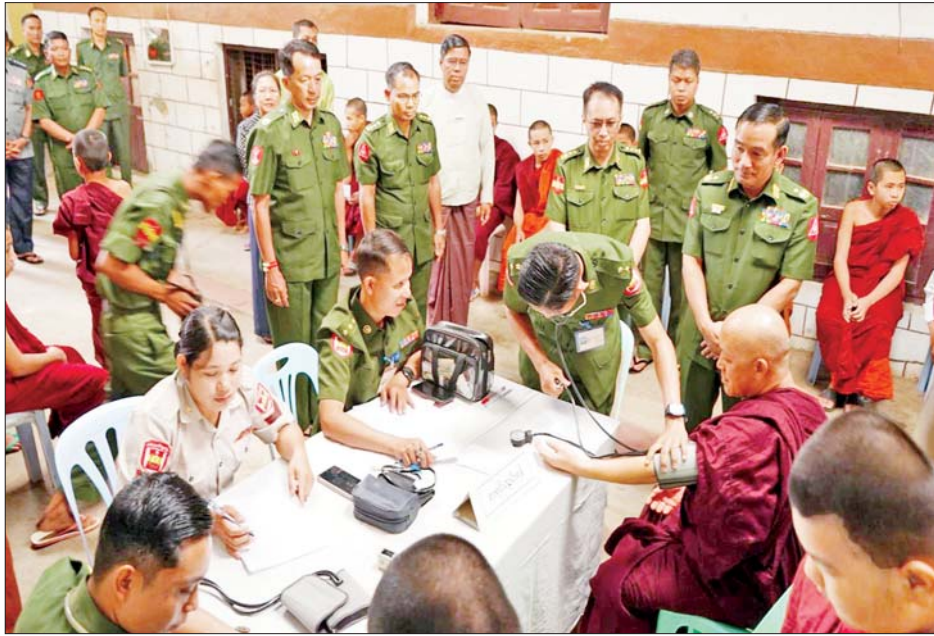
သွားရောက်ကြည့်ရှုအားပေးပြီး ဓမ္မောဒယ စာသင်တိုက်ဦးစီးပဓာန နာယကဆရာတော်အား ဖူးမြော်ကြည့်ကာ လှူဖွယ်ပစ္စည်းများ ဆက်ကပ်လှူဒါန်းခဲ့ကြောင်း သိရသည်။ သတင်းစဉ်

နေပြည်တော် မေ ၂၁ ရှမ်းပြည်နယ်(အရှေ့ပိုင်း) ကျိုင်းတုံမြို့ အမှတ်(၃) ရပ်ကွက် ဓမ္မောဒယစာသင်တိုက်ရှိ သံဃာတော်များနှင့် အဆိုပါရပ်ကွက်ရှိ ဒေသခံပြည်သူများအား ယနေ့ နံနက်ပိုင်းတွင် ကြိုဒေသတိုင်းစစ်ဌာနချုပ် နယ်လှည့်ဆေးကုသရေးအဖွဲ့က အဆိုပါ စာသင်တိုက်၌ ကျန်းမာရေးစောင့်ရှောက်မှုလုပ်ငန်းများ ဆောင်ရွက်ပေးသည်။