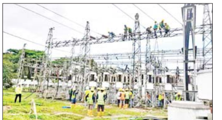
ဆောင်းပါး စာမျက်နှာ » ၁၁

ပိုင်းမော်မြို့တွင် လုံခြုံရေးတပ်ဖွဲ့ဝင်များက ပစ်ခတ်သည့် လက်နက်ကြီးကျည်ကျရောက် ပေါက်ကွဲမှုကြောင့် ပြည်သူ့ခြောက်ဦး သေဆုံးခဲ့ပြီး ၁၁ ဦး ထိခိုက်ဒဏ်ရာများရရှိခဲ့သည်ဟု မဟုတ်မမှန်စွာစွဲရေးသားပြီး ဝါဒဖြန့်ဝေလျက်ရှိ စာမျက်နှာ » ၁၅