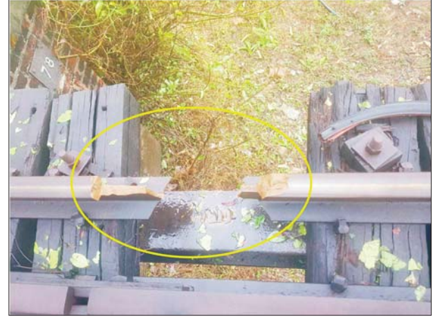
ပဲခူး-မော်လမြိုင်ရထားလမ်းပိုင်းအတွင်း သထုံမြို့နယ် သိမ်ဆိပ်နှင့် ဒုံဝန်းဘူတာအကြား တံတားအမှတ်(၇၈) မိုင်းဖောက်ခွဲဖျက်ဆီးခံရမှုကို တွေ့ရစဉ်။

● ပဲခူး-မော်လမြိုင်မှ ပလတ်စတစ်အိတ်အမည်းရောင်ဖြင့် ထုပ်ထားပြီး ဝိုင်းယာကြိုးသွယ်တန်း ထားသည့် ရှေ့ထွက်ကြိုးကြပ်မိုင်းတစ်လုံးအား တွေ့ရှိရ၍ သက်မဲ့ပြုလုပ် ဖယ်ရှားရှင်းလင်းနိုင်ခဲ့ကာ တံတားပေါ်တွင် လေးနေရာ၌ မိုင်းပေါက်ကွဲမှု ဖြစ်ပွားထားကြောင်းနှင့် တစ်နေရာစီတွင် သံလမ်းဘယ်/ညာတစ်ပေ ခန့်စီ ပြတ်တောက်ပျက်စီးနေကြောင်း သိရှိရသဖြင့် ယနေ့နံနက် ၆ နာရီ ခွဲတွင် သိမ်ဆိပ်-ဒုံဝန်း ရထားလမ်းပိုင်းအား ခေတ္တပိတ်၍ လမ်းပိုင်း အချိန်မီပြန်လည်ဖွင့်လှစ်နိုင်ရေး မြန်မာ့မီးရထား တာဝန်ရှိသူများက ပြုပြင်ဆောင်ရွက်ခဲ့ရာ ယနေ့နံနက် ၁၀ နာရီ ၁၄ မိနစ်တွင် လမ်းပိုင်း အား ပြန်လည်ဖွင့်လှစ်နိုင်ခဲ့သည်။ အဆိုပါ မိုင်းဖြစ်စဉ်ကြောင့် ယနေ့နံနက် ၆ နာရီခွဲတွင် ရန်ကုန် ဘူတာကြီးမှ စတင်ထွက်ခွာမည့် အမှတ်(၈၁)အဆန် ရန်ကုန်-မော်လမြိုင် လူစီးရထားအား နံနက် ၈ နာရီမှ စတင်စေလွှတ်နိုင်ခဲ့သဖြင့် ပုံမှန် ထွက်ခွာချိန်ထက် တစ်နာရီခွဲကြာခဲ့ပြီး အမှတ်(၈၂)အစုန် မော်လမြိုင်- ရန်ကုန်လူစီးရထားသည် မော်လမြိုင်ဘူတာမှ အချိန်မှန် နံနက် ၈ နာရီ ခွဲတွင် ထွက်ခွာနိုင်ခဲ့သည်။ သထုံဘူတာမှ ယနေ့နံနက် ၆ နာရီတွင် ထွက်ခွာရန် အသင့်ရှိနေသော အမှတ်(၆၈၆) အစုန်ကုန်ရထားအား ခေတ္တစောင့်ဆိုင်းစေခဲ့ရာက လမ်းပိုင်းပြန်လည်ဖွင့်လှစ်သည့်အချိန်မှ သာ စေလွှတ်နိုင်ခဲ့သည်။ အကြမ်းဖက်သောင်းကျန်းသူအဖွဲ့များအနေဖြင့် ၂၀၂၁ ခုနှစ်