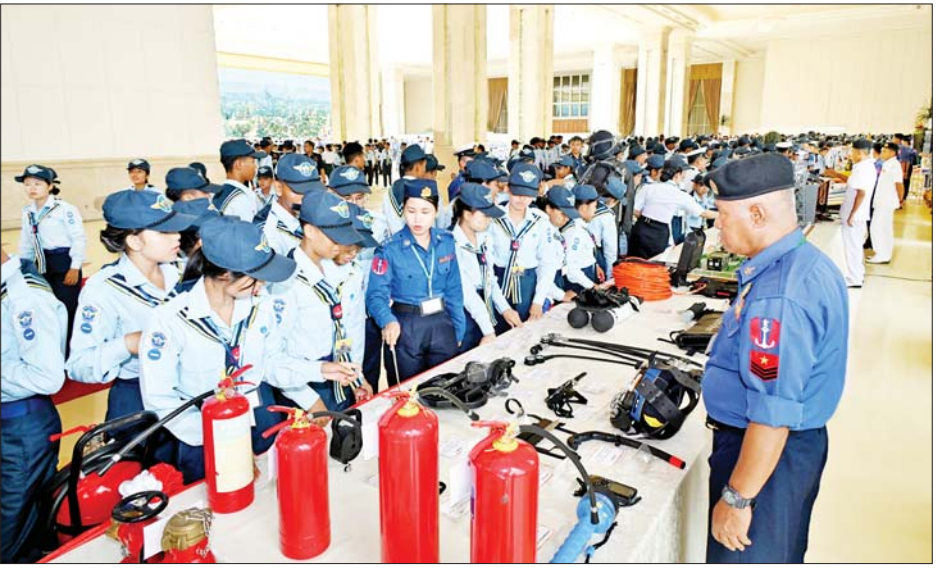
ရေကြောင်းနှင့်လေကြောင်း လူငယ်မောင်မယ်များ ဇေယျာသီရိဗိမာန်အတွင်း ခင်းကျင်းပြသထား သည့် ပစ္စည်းများကို လှည့်လည်ကြည့်ရှုစဉ်။

ဂုဏ်ပြုဖျော်ဖြေ ဆက်လက်၍ နိုင်ငံတော်စီမံ အုပ်ချုပ်ရေးကောင်စီ ဥက္ကဋ္ဌ တပ်မတော်ကာကွယ်ရေး ဦးစီး ချုပ်နှင့် အဖွဲ့ဝင်များသည် ရေ ကြောင်းနှင့်လေကြောင်း လူငယ် မောင်မယ်များကို လက်ဖက်ရည် ပိုင်းဖြင့် တည်ခင်းဧည့်ခံခဲ့ပြီး မြဝတီတေးဂီတအဖွဲ့က တေး သီချင်းများဖြင့် ဂုဏ်ပြုဖျော်ဖြေကြ သည်။ ယင်းနောက် နိုင်ငံတော်စီမံ အုပ်ချုပ်ရေးကောင်စီ ဥက္ကဋ္ဌ တပ်မတော်ကာကွယ်ရေး ဦးစီး ချုပ်နှင့် အဖွဲ့ဝင်များသည် အခြေခံ နှင့်တန်းမြင့် ရေကြောင်းလူငယ် သင်တန်းအမှတ်စဉ် (၁/၂၀၂၄) နှင့် အခြေခံနှင့်တန်းမြင့် လေကြောင်း လူငယ် သင်တန်းအမှတ်စဉ် (၁/ ၂၀၂၄) မှ သင်တန်းသား သင်တန်း သူများနှင့် အုပ်ချုပ်သူနည်းပြများ အား ရင်းရင်းနှီးနှီးလိုက်လံ နှုတ်ဆက်ကြသည်။ ရေကြောင်းနှင့် လေကြောင်း လူငယ် မောင်မယ်များသည် ဂုဏ်ပြုတွေ့ဆုံပွဲ အခမ်းအနားသို့ မတက်ရောက်မီ ဇေယျာသီရိ ဗိမာန်အတွင်း ခင်းကျင်းပြသထား သော မြန်မာ့တပ်မတော်မှ ထုတ်လုပ်သည့် လက်နက်များ၊ တပ်မတော်(ကြည်း၊ ရေ၊ လေ)တွင် ဝတ်ဆင်အသုံးပြုနေသည့် ဝတ်စုံ အမျိုးမျိုး၊ မြန်မာ့တပ်မတော်မှ ထုတ်လုပ်သည့် ဆက်သွယ်ရေး စက်ပစ္စည်းများ၊ တပ်မတော်(ရေ) မှ ထုတ်လုပ်သည့် ရေယာဉ်များ၏ ပုံစံငယ်များ၊ ရေတပ်ဆိုင်ရာ အသုံး အဆောင်ပစ္စည်းများ၊ တပ်မတော် (လေ)တွင် အသုံးပြုနေသည့် လေယာဉ်နှင့် ရဟတ်ယာဉ်များ၏ ပုံစံငယ်များ၊ လေသူရဲများ၏ ဝတ်စုံများနှင့် အသုံးအဆောင် ပစ္စည်းများ၊ Simulator ဖြင့် လေယာဉ်ပျံသန်းမှု သရုပ်ပြကွက် များကို စိတ်ပါဝင်စားစွာ လှည့်လည် ကြည့်ရှုလေ့လာကြရာ တာဝန်ရှိ သူများက သိရှိလိုသည်များကို ရှင်းလင်းပြသခဲ့ကြောင်း သိရ သည်။ သတင်းစဉ်