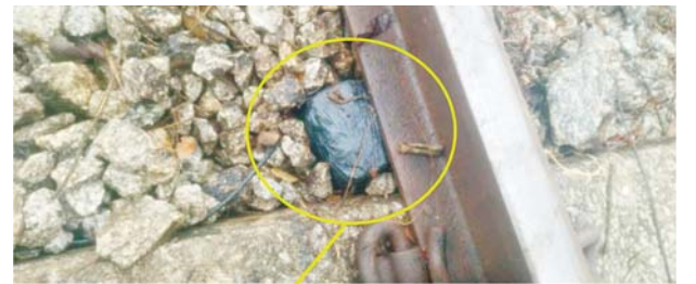
မိုင်းထောင်ထားမှု

ဖေဖော်ဝါရီ ၁ ရက်မှစ၍ ယခုအချိန်အထိ မြန်မာ့မီးရထားလမ်းကွန်ရက် တစ်ခုလုံးတွင် ရထားလမ်းနှင့် ရထားဘူတာနယ်မြေအတွင်း မိုးထောင် မိုင်းခွဲ/ဖျက်ဆီးခြင်း ၂၀၅ ကြိမ်၊ ရထားတံတား/သံလမ်းများအား မိုင်းခွဲ ဖျက်ဆီးခြင်း ၁၆၃ ကြိမ်၊ ဘူတာအဆောက်အအုံနှင့် ဝန်ထမ်းနေအိမ်များ အား မီးရှို့ဖျက်ဆီးခြင်း ၄၂ ကြိမ် ကျူးလွန်ခဲ့ကြသည်။ နိုင်ငံတော်အစိုးရအနေဖြင့် အများပြည်သူခရီးသွားလာမှုနှင့် ကုန်စည်ပို့ဆောင်မှု အဆင်ပြေချောမွေ့မြန်ဆန်စေရေးအတွက် ရထား လမ်းနှင့်အခြေခံအဆောက်အအုံများ ပိုမိုတိုးတက်ကောင်းမွန်လာစေရေး၊ ရထားပို့ဆောင်ရေးစနစ် အဆင့်မြှင့်တင်ရေးစီမံကိန်းလုပ်ငန်းများကို ရည်မှန်းချက်ထားရှိ၍ အစဉ်တစိုက်အလေးထား စီမံဆောင်ရွက်ပေး လျက်ရှိသော်လည်း အကြမ်းဖက်သောင်းကျန်းသူများအနေဖြင့် နိုင်ငံတော်ပိုင် ရထားစက်ခေါင်းနှင့် တွဲဖက်၊ ရထားလမ်းနှင့် တံတားများ၊ ခရီးသည်များနှင့်ကုန်စည်များ ထိခိုက်ပျက်စီးဆုံးရှုံးစေရေး၊ ရထားစီး ခရီးသွားပြည်သူများအနေဖြင့် ရထားဖြင့်ခရီးသွားလာရာတွင် ကိုယ်စိတ် နှလုံးချမ်းမြေ့ပြီး အသက်အန္တရာယ်ကင်းရှင်းစွာဖြင့် လုံခြုံစိတ်ချစွာသွားလာ နိုင်မှုမရှိစေရေးအတွက် ရည်ရွယ်ပြီး ယခုကဲ့သို့ ယုတ်မာပက်စက်စွာဖြင့် အကြိမ်ကြိမ်ကျူးလွန်ဖျက်ဆီးနေကြခြင်းအပေါ် ဒေသခံများနှင့် ပြည်သူ တစ်ရပ်လုံးက ပြင်းထန်စွာ ဆန့်ကျင်ကန့်ကွက်ရှုတ်ချလျက်ရှိကြောင်း သိရသည်။