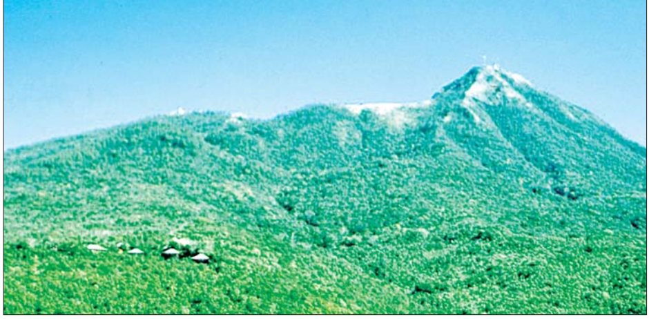
မြန်မာ့ပထမဆုံး အမျိုးသားဘူမိဥယျာဉ်ဖြစ်လာသည့် ပုပ္ပားတောင်မကြီးအား အဝေးမှ မြင်တွေ့ရပုံ။