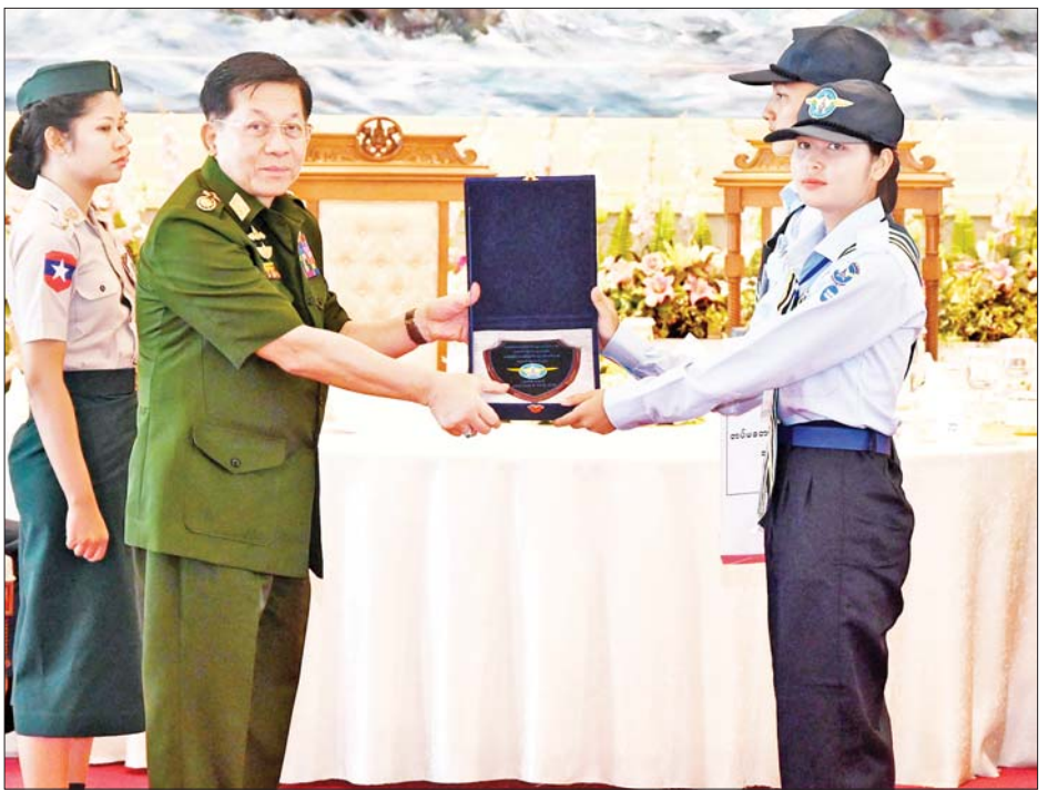
နိုင်ငံတော်စီမံအုပ်ချုပ်ရေးကောင်စီဥက္ကဋ္ဌ တပ်မတော်ကာကွယ်ရေးဦးစီးချုပ် ဗိုလ်ချုပ်မှူးကြီး မင်းအောင်လှိုင် ရေကြောင်းလူငယ်များအတွက် အမှတ်တရလက်ဆောင်ပစ္စည်းများ ပေးအပ်စဉ်။