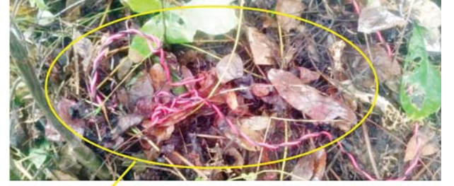
မိုင်းအားဝိုင်းယာကြိုးဖြင့် သွယ်တန်းထားမှု

ပဲခူး-မော်လမြိုင်ရထားလမ်းပိုင်းအတွင်း သထုံမြို့နယ် သိမ်ဆိပ် နှင့် ဒုံဝန်းဘူတာအကြား တံတားအမှတ်(၇၈) အနီး မိုင်းထောင်ထားမှု ကို တွေ့ရစဉ်။