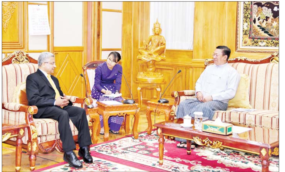
ကောင်စီရုံးနှင့် အိန္ဒိယနိုင်ငံသံရုံးတို့မှ တာဝန်ရှိသူများ အဆိုပါ တွေ့ဆုံပွဲသို့ နိုင်ငံတော်စီမံအုပ်ချုပ်ရေး တက်ရောက်ခဲ့ကြသည်။ သတင်းစဉ်

သည်။ ထိုသို့တွေ့ဆုံစဉ် နှစ်နိုင်ငံချစ်ကြည်ရေးနှင့် ပူးပေါင်းဆောင်ရွက်ရေးဆိုင်ရာ ကိစ္စရပ်များ၊ နှစ်နိုင်ငံ အကြား ဆောင်ရွက်လျက်ရှိသည့် ဖွံ့ဖြိုးတိုးတက်ရေး ဆိုင်ရာ စီမံကိန်းများတိုးမြှင့်ဆောင်ရွက်သွားရေး၊ လုံခြုံရေးဆိုင်ရာကိစ္စရပ်များ၊ နှစ်နိုင်ငံ နယ်စပ်ဒေသ များ တည်ငြိမ်အေးချမ်းရေးအတွက် ပူးပေါင်း ဆောင်ရွက်သွားရေးကိစ္စရပ်များနှင့် စပ်လျဉ်း၍ နှစ်ဖက်အပြန်အလှန် ရင်းနှီးပွင့်လင်းစွာ ဆွေးနွေးခဲ့