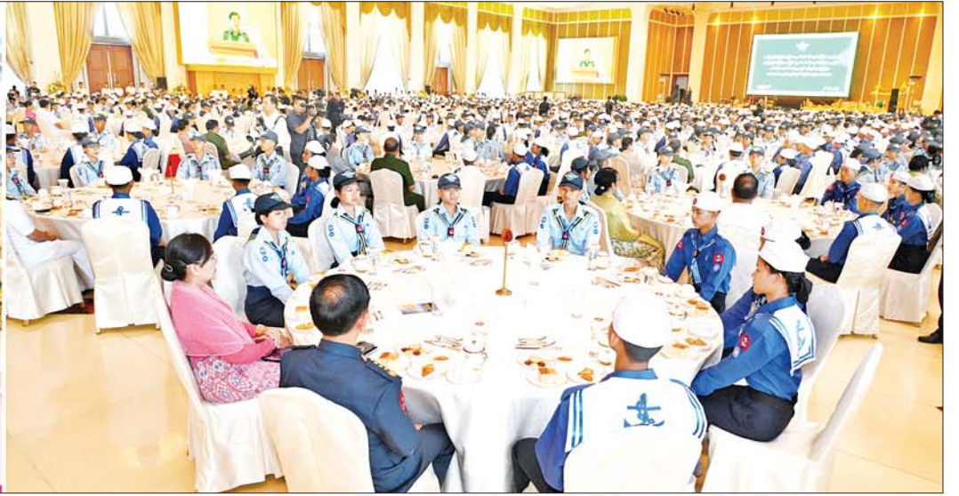
နိုင်ငံတော်စီမံအုပ်ချုပ်ရေးကောင်စီဥက္ကဋ္ဌ တပ်မတော်ကာကွယ်ရေးဦးစီးချုပ် ဗိုလ်ချုပ်မှူးကြီးမင်းအောင်လှိုင် အခြေခံနှင့်တန်းမြင့် ရေကြောင်းလူငယ်သင်တန်းအမှတ်စဉ် (၁/၂၀၂၄) နှင့် အခြေခံနှင့်တန်းမြင့် လေကြောင်းလူငယ်သင်တန်း အမှတ်စဉ် (၁/၂၀၂၄)မှ သင်တန်းသား၊ သင်တန်းသူများနှင့် အုပ်ချုပ်သူနည်းပြများအား တွေ့ဆုံအမှာစကားပြောကြားစဉ်။