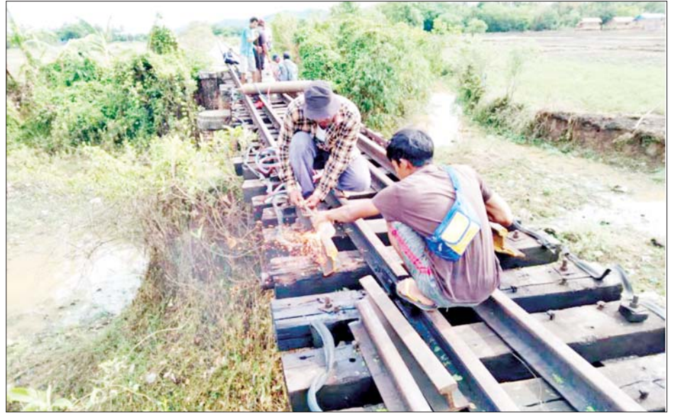
ပဲခူး-မော်လမြိုင်ရထားလမ်းပိုင်းအတွင်း သထုံမြို့နယ် သိမ်ဆိပ်နှင့် ဒုံဝန်းဘူတာ အကြား တံတားအမှတ်(၇၈) မိုင်းဖောက်ခွဲဖျက်ဆီးခံရမှု(၀ပုံ)နှင့် ပြန်လည်ပြုပြင်နေမှု(ယာပုံ)တို့ကို တွေ့ရစဉ်။