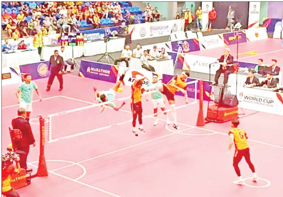
သုံးယောက်တွဲပြိုင်ပွဲ ဆီမီးဖိုင်နယ်အဖြစ် မြန်မာအသင်းနှင့် မလေးရှားအသင်းတို့ ယှဉ်ပြိုင်ကစားစဉ်။

ရန်ကုန် မေ ၂၁ ISTAF World Cup 2024 ပိုက်ကျော်ခြင်းပြိုင်ပွဲ ကွာတားဖိုင်နယ်နှင့် ဆီမီးဖိုင်နယ်ပွဲစဉ်များကို မေ ၂၁ ရက်က မလေးရှားနိုင်ငံ၌ ဆက်လက်ကျင်းပရာ မြန်မာပိုက်ကျော်ခြင်းအသင်းသည် နှစ်ယောက်တွဲနှင့် သုံးယောက်တွဲပြိုင်ပွဲ နှစ်ခုစလုံးတွင် ဗိုလ်လုပွဲနှင့် လွှဲချော်ကာ ပူးတွဲတတိယနေရာဖြင့် ကျေနပ်ခဲ့ရသည်။ သုံးယောက်တွဲပြိုင်ပွဲ ကွာတားဖိုင်နယ်တွင် မြန်မာအသင်းသည် အင်ဒိုနီးရှားအသင်းနှင့် တွေ့ဆုံခဲ့ပြီး နှစ်ပွဲပြတ်အနိုင်ရသဖြင့် ဆီမီးဖိုင်နယ်တက်ရောက်ခဲ့သည်။ ဆီမီးဖိုင်နယ်တွင်လည်း အိမ်ရှင်မလေးရှားအသင်းနှင့် တွေ့ဆုံခဲ့ပြီး နှစ်ပွဲပြတ်အရေးနိမ့်ခဲ့သဖြင့် ဗိုလ်လုပွဲနှင့်လွှဲချော်ကာ ပူးတွဲတတိယနေရာဖြင့် ကျေနပ်ခဲ့ရသည်။ မြန်မာအသင်းသည် ပထမပွဲငယ်တွင် ၁၅-၃ မှတ်၊ ဒုတိယပွဲငယ်တွင် ၁၅-၁၁ မှတ်ဖြင့် ရှုံးနိမ့်ခဲ့ခြင်းဖြစ်သည်။ အိမ်ရှင်မလေးရှားအသင်းသည် အိမ်ရှင်အခွင့်အရေး အပြည့်အဝအသုံးချကာ မရသင့်သည့် အမှတ်အချို့ ရယူသွားခဲ့သည်။ စာမျက်နှာ ၁၇ ကော်လံ ၅ သို့ ❖