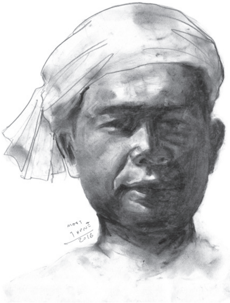
မိုင်းပွန်တော်ဘား စင်စံထွန်း (၁၉၀၇ - ၁၉၄၇)