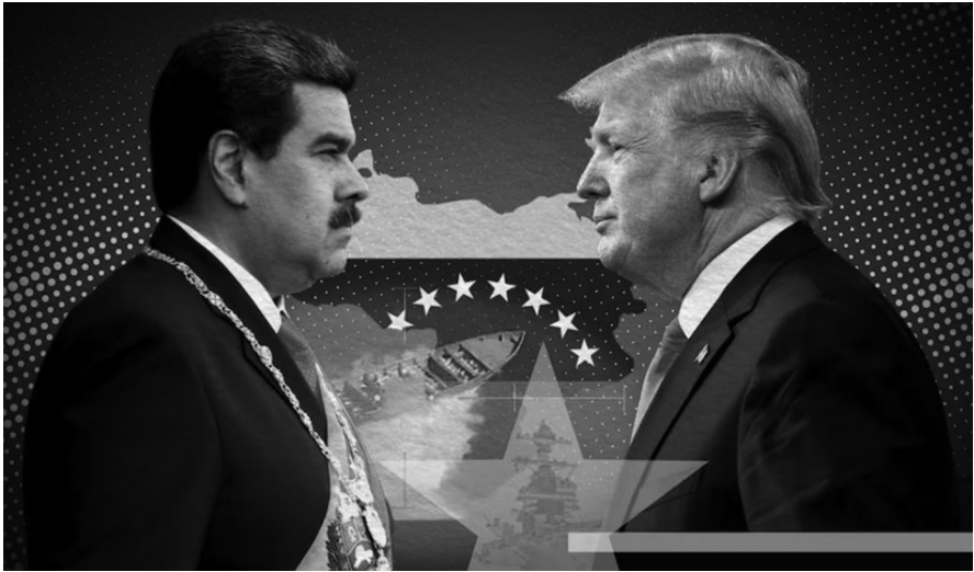
ခေတ်ပုံ-အင်တာနက်

ခေတ်ပုံလက်နက်က စတင်လိုက်တဲ့ အင်ပါယာတွေကနေ ဒီကနေ့လက်နက်ဆန်းတွေ သုံးနေတဲ့ အင်ပါယာတွေအထိဆိုရင် ထင်ရှားတဲ့အင်ပါယာတချို့ ရှိခဲ့တာကိုတွေ့ရတယ်။