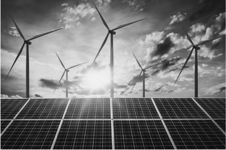
ဓာတ်ပုံ-အင်တာနက်