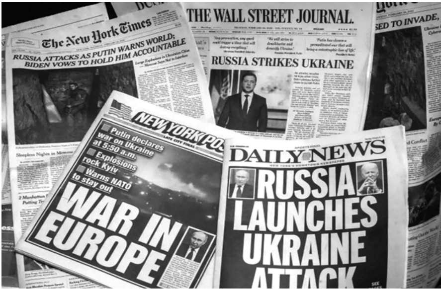
ဝှံးဝှံး-အင်တာနက်