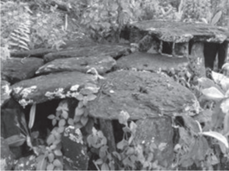
အရိုးအိုးများထားရှိသော ကျောက်ပျဉ်များ

မသင်္ဂြိုဟ်စိဉ်) ဆောင်ရွက်ကြရသည်။ ဤသည်ကား ရုပ်အလောင်းကိုထိကိုင်၍ ကျိန်စာဆိုခြင်း၊ ကတိပြုခြင်းများပင်ဖြစ်သည်။ ထိုသို့ဆောင်ရွက်ခြင်းသည် အလွန်အာနိသင်ကြီးမား၍ ထိရောက်ပြင်းထန်ကာ မှန်သူကို ကောင်းကျိုးသက်ရောက်စေသည်ဟု ချီးချင်းခလေ့အရ ယူဆကြပါသည်။