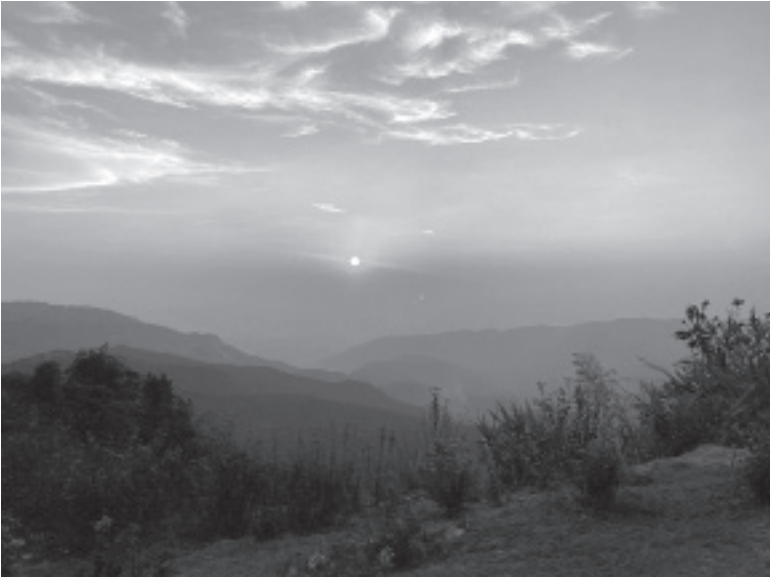
စပယ်ရှယ်တောင်ရဲ့ နေဝင်ဆည်းဆာအလှ

အင်ကြင်းပန်းပင်ကြီးက လှပလွန်းလို့ အပင်ကြီး နောက်ခံထားပြီး ဓာတ်ပုံရိုက်ကြပါ သေးတယ်။ ကျိုင်းတုံမြို့ပေါ်က လမ်းတွေက သွားလာနေတဲ့ မော်တော်ယာဉ်များအတွက် လုံလောက်တဲ့ အကျယ်အဝန်းမရှိတဲ့အတွက် ယာဉ်မတော်မဆဖြစ်မှုဖြစ်တတ်ကြောင်း သတိပေးရေးထားတာ တွေ့ရပါတယ်။ ကျိုင်းတုံကို မရောက်ဖြစ်တာ ၁၀နစ်ကျော်ပြီဖြစ်လို့ မြို့နဲ့ပတ်သက်တဲ့ အမှတ်တရတွေက များများစားစားမရှိသလောက်ပါပဲ။ မြို့မဈေး၊ မဟာမြတ်မုနိဘုရား၊ ရပ်တော်မူဘုရားကြီး၊ နောင်တုံကန် ဒီလောက်ပဲ စိတ်ထဲမှတ်မှတ် ထင်ထင်ကျန်နေပါတော့တယ်။