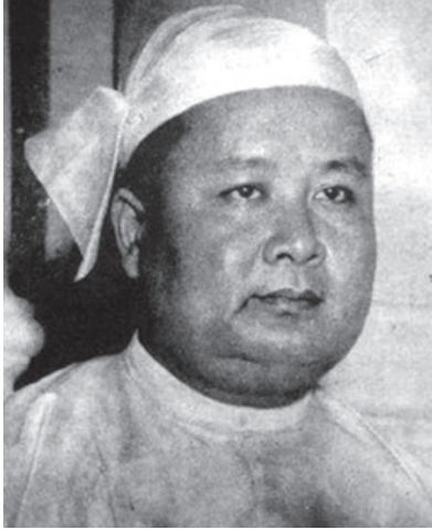
မန်းဝင်းမောင်

မန်းဝင်းမောင်သည် အမျိုးသားလွတ်မြောက်ရေးကြိုးပမ်းမှုတွင် ကရင်-ဗမာချစ်ကြည်ရေးခေါင်းဆောင်၊ ကရင်လူငယ် ခေတ်ပညာတတ်တစ်ဦးဖြစ်သည်။ သူသည် လွတ်လပ်ရေးခေတ်ဦး ပါလီမန်ဒီမိုကရေစီခေတ်တွင် အစိုးရအဖွဲ့ဝင်ဝန်ကြီးနှင့် နိုင်ငံတော်သမ္မတအဖြစ်လည်း တာဝန်ထမ်းဆောင်ခဲ့သည်။