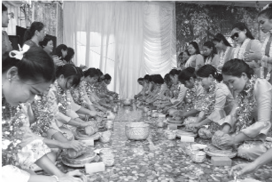
နံ့သာသွေးပွဲ

ရခိုင်ရိုးရာဓလေ့တွင် သင်္ကြန်အကြိုနေ့မတိုင်မီတစ်ရက် (ဧပြီ ၁၂ ရက်) ညဦးကပင် ရပ်ရွာအလိုက်စုဝေးကြ၍ အမျိုးသမီးကြီးငယ်ရွယ်လတ်မရွေး နံ့သာဖြူနီများ ယူဆောင် လာကာ နံ့သာသွေးရန် ကျောက်ပျဉ်များကိုယ်စီဖြင့် စုပေါင်းနံ့သာသွေးကြသည်မှာ အခြား တိုင်းရင်းသားလူမျိုးများနှင့်မတူ တစ်မူထူးခြားသောဓလေ့ ဖြစ်သည်။ ယင်းနေ့ ကျင်းပသော ပွဲကို ရခိုင်အခေါ် “နံ့သာသွီးပွဲ” ဟုခေါ်ဆိုကြသည်။ ထိုသို့ နံ့သာစုပေါင်းသွေးနေစဉ် ရပ်ရွာ ကာလသားများက တီးမှုတ် ကခုန်သီဆို၍ နံ့သာသွေးသူများ စိတ်အားတက်စေရန် ဆောင်ရွက် ပေးလေ့ရှိသကဲ့သို့ နံ့သာသွေးပွဲတွင် မပါဝင်သော အိမ်များမှလည်း စားသောက်စရာမုန့်ပဲ သရစာများ ပြုလုပ်ဧည့်ခံ ကျွေးမွေးလေ့ရှိကြသည်။