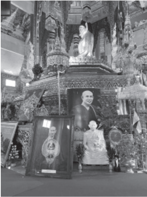
နီးဘုရား

ခဲ့ပါတယ်။ဆရာတော်ကြီးသုံးနှစ်သုံးလသုံးရက်တရားအားထုတ်အပြီးပြန်ထွက်လာတဲ့အချိန်လူအများက ဆရာတော်ကြီးကို ဖူးတွေ့ဖို့ စောင့်ဆိုင်းနေတဲ့နေရာ၊ ဆရာတော်ကြီး တရားဟောတဲ့နေရာ စသည်ဖြင့် ဖြတ်သွားတဲ့နေရာတိုင်းရဲ့ အထင်ကရ အထိမ်းအမှတ်တွေကို ပြောပြလာခဲ့ပါတယ်။ တောင်ပေါ်မှာစေတီလေးနဲ့ ရှေးဟောင်းပျဉ်ထောင်ကျောင်းလေးကို ဝင်ရောက်ဖူးမြော်ပြီး အလှူငွေထည့်ဝင်လို့ နောက်တစ်နေရာကို ဆက်လက်ထွက်ခွာခဲ့ကြပါတယ်။