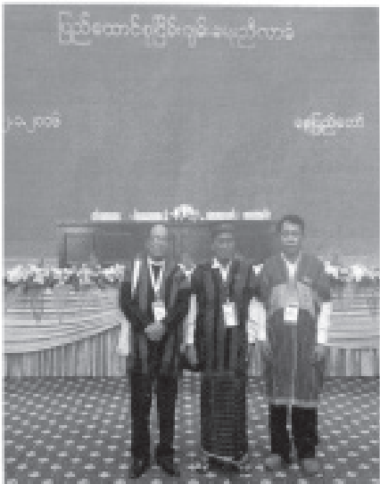
ပြည်ထောင်စုငြိမ်းချမ်းရေးညီလာခံနှင့် ၂၁ ရာစုပင်လုံညီလာခံသို့ တက်ရောက်ခဲ့သော အရှိချင်းကိုယ်စားလှယ်များ