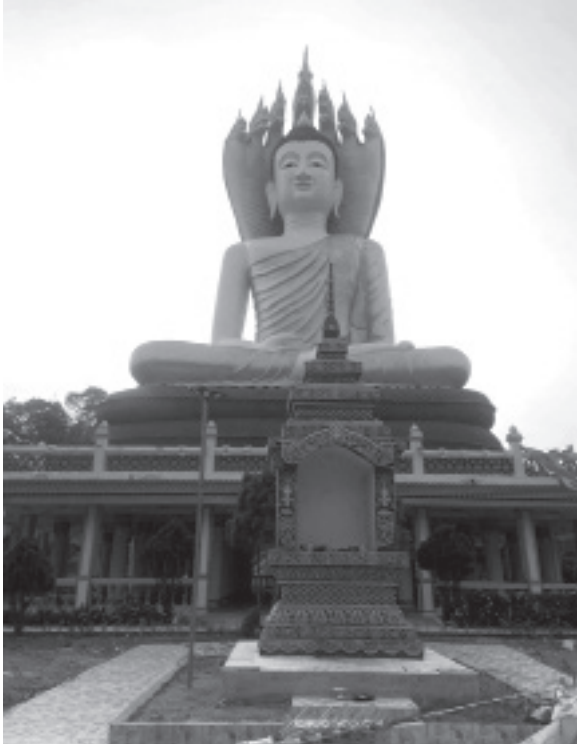
နဂါးရံဘုရား

ခြင်္သေ့ရုပ်တုများကို ကျောင်းဆောင်အဝင်ဝမှာ ထုလုပ်ထားပါတယ်။ ကျောင်းဆောင်အတွင်း မှာတော့ ဘူးသီးပုံထုလုပ်ထားပြီး ဆရာတော်ပျံလွန်တော်မူရင် ထည့်သွင်းဖို့ မှာကြား ထားတယ်လို့ တစ်ဆင့်စကားနဲ့ ကြားသိရပါတယ်။ ကျောင်းဆောင်အရှေ့ဘက်မှာ တရား ဟောမည့်နေရာတစ်ခုကို သဘာဝအတိုင်း သစ်ပင်အောက်မှာ ဖန်တီးထားရှိလို့ ကျောင်း ဆောင်ရယ်၊ မဲခေါင်မြစ်ရယ်၊ တောင်တန်းတွေနဲ့ တင့်တယ်လိုက်ဖက်လို့နေပါတယ်။ ဆရာတော်ကြီးကျောင်းက အပြန်လမ်းမှာတော့ ဆရာတော်ကြီးကို ကိုယ်တိုင်ကိုယ်ကျ တွေ့ပြီး မဖူးမြော်လိုက်ရပေမယ့် ဆရာတော်ကြီးရဲ့အရိပ်အာဝါသနဲ့ ဘုရား၊ စေတီ၊ ကျောင်း၊ ကန်တို့ကို ဖူးတွေ့လည်ပတ်ခဲ့ရလို့ စိတ်ကြည်နူးချမ်းသာမှုကို ဖြစ်စေခဲ့ရပါတယ်။