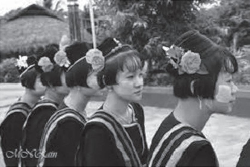
ကနန်းတိုင်းရင်းသူ သမီးပျိုများ

ကနန်းရှင်ပြုပွဲများတွင် လူပျိုအပျိုအဖွဲ့၏အခန်းကဏ္ဍသည် အထူးအရေးပါသည်။ အလှူရက်မတိုင်မီ ၁၅ ရက်ခန့်ကပင် အလှူရှင်တစ်ဦးစီ၏အိမ်တွင် အပျိုနှစ်ဦးကျစီ ထားကြရသည်။ အလှူရှင်အိမ်တွင် အပျိုမရှိခဲ့ပါလျှင် အခြားကျေးရွာများရှိ အလှူရှင်၏ဆွေမျိုးများ သို့မဟုတ် ရင်းနှီးသူများထံမှ အပျိုများကိုခေါ်ယူထားရသည်။ လူပျိုအပျိုအဖွဲ့သည် အလှူတွင် သုံးစွဲရန်အတွက် ထင်းများကို သုံး၊ လေးရက်ကြာမျှ ရှာဖွေကြရသည်။ စုပေါင်းဆောင်ရွက်မှုတွင် လူပျိုအပျို အဖွဲ့ဝင်များသည် လူပျိုခေါင်း၏ မောင်းတီးခေါ်ဆောင်ရာသို့ စနစ်တကျ တန်းစီ၍လိုက်ကြရသည်။ ထိုအချိန်တွင် တန်းစီလိုက်ပါခွင့်ရှိသည်။ အိမ်ထောင်ကျပြီးသူများသည် လူပျိုအပျိုအဖွဲ့တွင် လိုက်ပါခွင့်မရှိပါ။ အကယ်၍ ယင်းအဖွဲ့ဝင် အိမ်ထောင်ကျပြီးသူ တစ်ဦးဦးသည် မှားယွင်းလိုက်ပါလာခဲ့လျှင် မိုးရွာတတ်သည်။ လုပ်ငန်းခွင်အနှောင့်အယှက် တစ်ခုခု ဖြစ်ပေါ်နိုင်သည်ဟု ယူဆကြပါသည်။