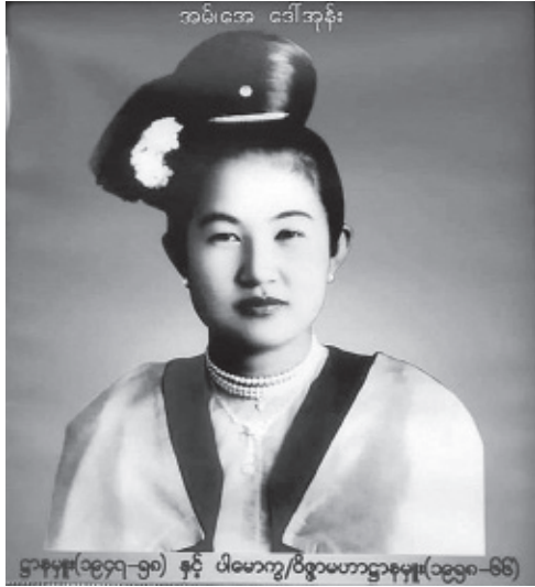
အမ်အေဒေါ်အုန်း