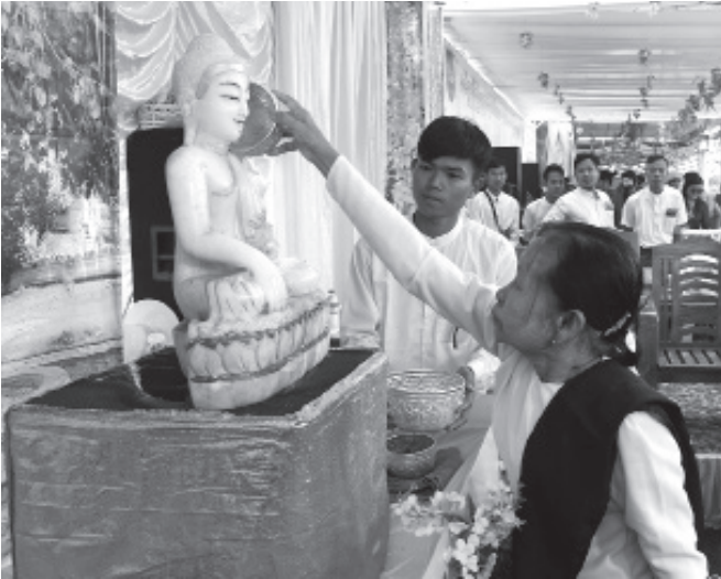
ဘုရားရေသပ္ပာယ်ပွဲ

ရခိုင်အခေါ် “ဘုရားရီချိုးပွဲ” ကား ဘုရားရေသပ္ပာယ်ပွဲပင် ဖြစ်သည်။ သင်္ကြန်အကြိုနေ့ (ဧပြီ ၁၃ ရက်) နံနက်ပိုင်းတွင် ယမန်နေ့ညက သွေး၍ စုဆောင်းထားသော နံ့သာရည်များကို