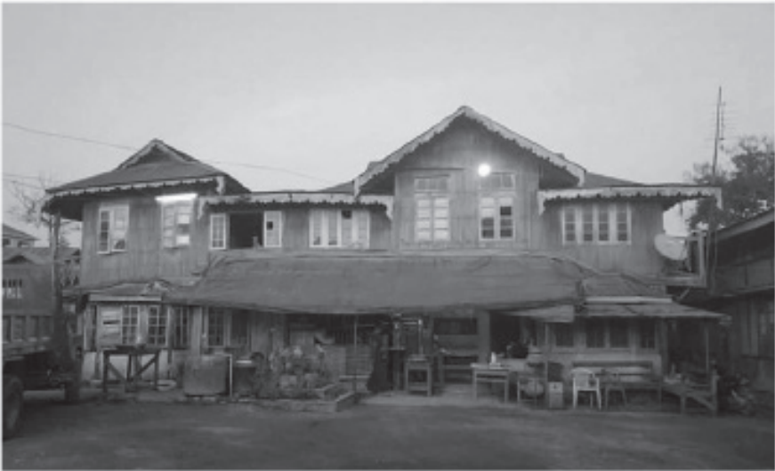
ယနေ့ မြင်တွေ့နေရဆဲဖြစ်သော အောင်ပန်းမြို့ပေါ်ရှိ စော်ဘွား၏ဟော် (ယခု မြို့နယ်သမဝါယမပိုင် အဆောက်အဦ)

၁၉၃၉ ခုနှစ်တွင် ရှမ်းမြေလတ်ပိုင်း ခေတ်စော်ဘွားများ၏ ကိုယ်စားလှယ်အဖြစ် “ရှမ်းပြည်နယ် ပဒေသရာဇ်ကောင်စီ” တွင် ကောင်စီအမတ် ရွေးချယ်ခံခဲ့ရသည်။ ၁၉၄၂ ခုနှစ် ဂျပန်လက်ထက်နှင့် ၁၉၄၅ ခုနှစ် မဟာမိတ်လက်ထက်တွင် ရှမ်းမြေလတ် ခေတ်စော်ဘွားများ၏ စည်းလုံးညီညွတ်မှုကိုလည်း ဖော်ဆောင်ပေးခဲ့သည်။ ၁၉၄၆ ခုနှစ် မတ်လ ၂၀ ရက် ပင်လုံမြို့တွင် ကိုးရက်တိတိ ကျင်းပသော ပထမပင်လုံညီလာခံတွင် အခမ်းအနားမှူးအဖြစ်