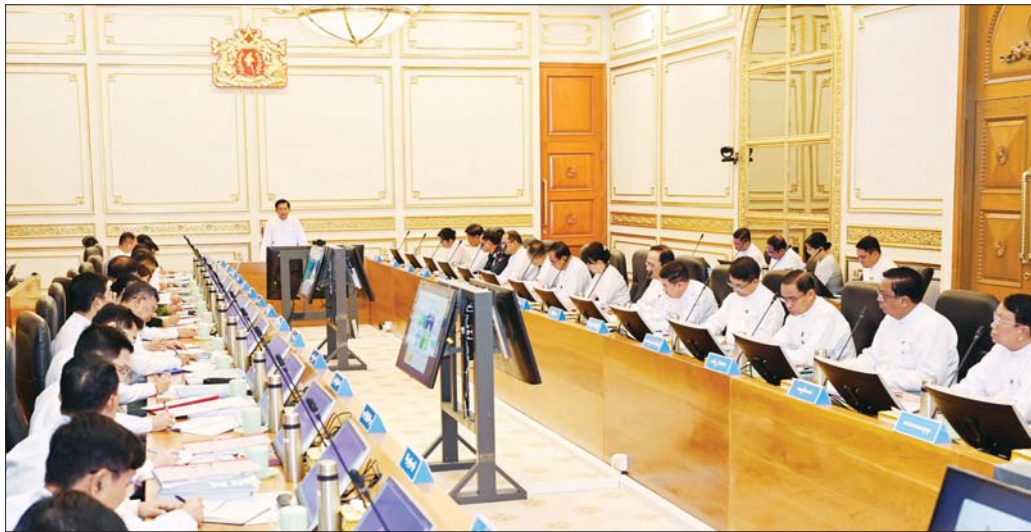
ပြည်ထောင်စုသမ္မတမြန်မာနိုင်ငံတော် နိုင်ငံတော်သမ္မတ ဦးမင်းအောင်လှိုင် ပြည်ထောင်စုအစိုးရအဖွဲ့အစည်းအဝေးတွင် အမှာစကားပြောကြားစဉ်။

မိမိတို့အနေဖြင့် ရွေးကောက်ခံအစိုးရဖြစ်ပြီး ပြည်သူများက ရွေးချယ်ထားသည့် ပြည်သူ့အစိုးရဖြစ်ကာ ပြည်သူများ၏ကိုယ်စား နိုင်ငံအကျိုးကိုထမ်းဆောင်ကြရမည့်၊ ပြည်သူတို့၏ အကျိုးကိုဖော်ဆောင်ကြရမည့်အစိုးရဖြစ်သဖြင့် လုပ်ငန်းများဆောင်ရွက်ရာတွင် အချင်းချင်းပေါင်းစပ်ညှိနှိုင်းမှုကောင်းစွာဖြင့် တာဝန်ထမ်းဆောင်သွားကြရန်လို