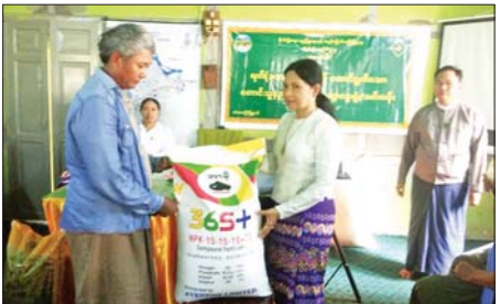
တံတားဦးမြို့နယ် စိုက်ပျိုးရေးဦးစီးဌာနမှ တောင်သူနည်းပညာပေးဆွေးနွေး

နိုင်ငံသား စုစုပေါင်း ၁၄၇၀၃ ဦး ထိန်းသိမ်းနိုင်ကြောင်းနှင့် ယင်းနိုင်ငံသားအားလုံးကို စစ်ဆေးပြီးစီးခဲ့ပြီး ၎င်းတို့အနက်မှ ၁၃၅၄၀ ကို ထိုင်းနိုင်ငံမှတစ်ဆင့် သက်ဆိုင်ရာနိုင်ငံများသို့ ဥပဒေလုပ်ထုပ်လုပ်နည်းများနှင့် အညီ စနစ်တကျ ပြည်နှင့်လွှဲပြောင်းပေးခဲ့သည်။ လွှဲပြောင်းပေးအပ်ရန်ကျန်ရှိသည့် ပြည်ပနိုင်ငံသား ၁၀၆၃ ဦးတွင် မြန်မာနိုင်ငံ လူဝင်မှုကြီးကြပ်ရေး (လတ်တလော)ပြဋ္ဌာန်းချက်များ အက်ဥပဒေပုဒ်မ ၃(၁)/၁၃(၁) နှင့် မူးယစ်ဆေးဝါးနှင့် စိတ်ကို ပြောင်းလဲစေသော ဆေးဝါးများ ဆိုင်ရာဥပဒေအရ အပြစ်ပေးအရေးယူခဲ့သည့် ပြည်ပနိုင်ငံသား ၆၆၂ ဦးရှိသည့်အတွက် ကျန်ရှိသည့် ပြည်ပနိုင်ငံသား ၅၀၁ ဦးတို့အား သက်ဆိုင်ရာ နိုင်ငံများသို့ လွှဲပြောင်းပေးရန် အသင့်ဖြစ်နေပြီဖြစ်ကြောင်းနှင့် ၎င်းတို့ကို