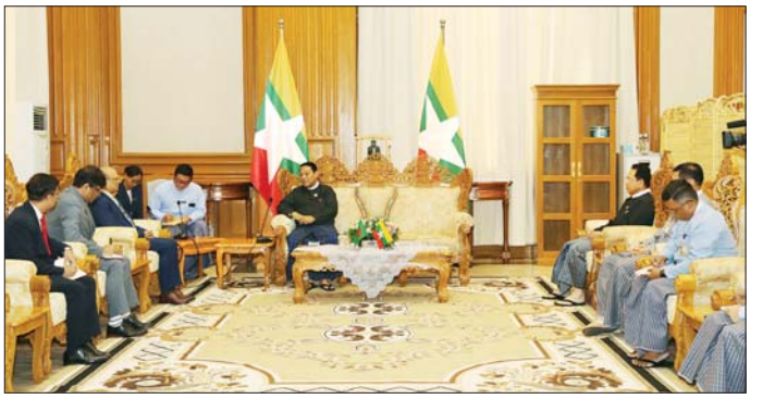
ပြည်သူ့လွှတ်တော်ဒုတိယဥက္ကဋ္ဌ ဦးမောင်မောင်အုန်း၊ နိုင်ငံဆိုင်ရာ ဘင်္ဂလားဒေ့ရှ်သံရုံးမှ တာဝန်ရှိသူများ ပြည်သူ့လွှတ်တော်ရုံးမှ တာဝန်ရှိသူများနှင့် မြန်မာ တက်ရောက်ကြသည်။ သတင်းစဉ်

တွေ့ဆုံပွဲသို့ ပြည်သူ့လွှတ်တော်ဥက္ကဋ္ဌနှင့်အတူ