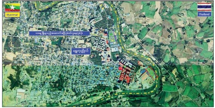
ကရင်ပြည်နယ် မြဝတီမြို့နယ် ရွှေကုက္ကိုလ်ဒေသရှိ အွန်လိုင်းလိမ်လည်လောင်းကစားမှုများ လုပ်ကိုင်ခဲ့သည့် တရားမဝင်အဆောက်အအုံများအား ဖောက်ခွဲဖျက်ဆီးမှုနေရာပြမြေပုံ။

○ ကျော့ဖုံးမှ ရွှေကုက္ကိုလ်နယ်မြေအတွင်း၌ အွန်လိုင်းလိမ်လည်လောင်းကစားလုပ်ငန်းများ ကျူးလွန်ရာတွင် အသုံးပြုခဲ့သည့် အဆောက်အအုံ ၇၇ လုံးအနက် ယာဉ် ယန္တရားများဖြင့် ဖြိုဖျက်ဖျက်ဆီးမည့် အဆောက်အအုံ ၅၇ လုံးနှင့် ဖောက်ခွဲ၍ ဖျက်ဆီးမည့်အဆောက်အအုံအလုံး ၂၀ ပူ၍ အဆောက်အအုံအမျိုးအစားအလိုက် ခွဲခြားသတ်မှတ်ပြီး စနစ်တကျ ဖြိုဖျက်ဆီးလျက် ရှိကြောင်း သိရသည်။ ယနေ့တွင် ယာဉ် ယန္တရားဖြင့် ဖြိုဖျက်ဆီးရန် သတ်မှတ်ထားသည့် အဆောက်အအုံ ၅၇ လုံးအနက် သုံးထပ်လှနေအဆောက်အအုံသုံးလုံးကို ယာဉ် ယန္တရားများအသုံးပြု၍ စနစ်တကျ ထပ်မံဖြိုဖျက်ဆီးခဲ့ရာ ယနေ့အထိ စုစုပေါင်း အဆောက်အအုံ ၄၈ လုံး