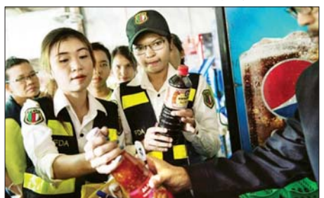
စာမျက်နှာ ၉ ကော်လံ ၁ င

ရန်ကုန် ၇ ဇွန် ၉ အစားအသောက်လုပ်ငန်းများအား ဘေးအန္တရာယ်ဖြစ်နိုင်ခြေအရ နမူနာကောက်ယူစစ်ဆေးခြင်းကို ဇွန်လလယ်တွင် စတင်ဆောင်ရွက်မည်ဖြစ်ကြောင်း ကျန်းမာရေးဝန်ကြီးဌာန အစားအသောက်နှင့် ဆေးဝါး ကွပ်ကဲရေးဦးစီးဌာန (FDA) မှ ကြေညာထားသည်။