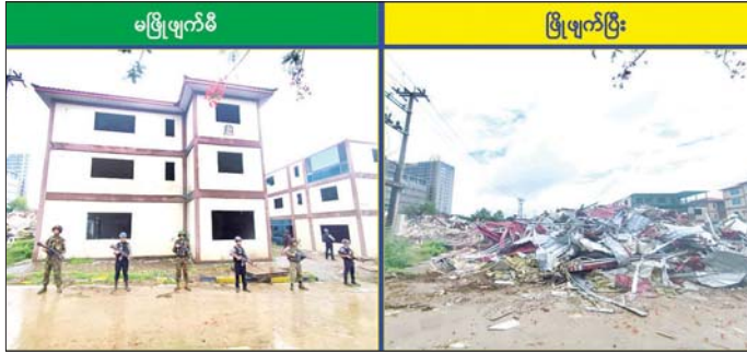
ရွှေကုက္ကိုလ်နယ်မြေအတွင်း အွန်လိုင်းလောင်းကစားလုပ်ငန်း လုပ်ကိုင်ခဲ့သော တရားမဝင်အဆောက်အအုံများအား မဖြိုဖျက်မီနှင့် ဖြိုဖျက်ပြီးစီးမှုကို တွေ့ရစဉ်။

○ ကျော့ဖုံးမှ ရွှေကုက္ကိုလ်နယ်မြေအတွင်း၌ အွန်လိုင်းလိမ်လည်လောင်းကစားလုပ်ငန်းများ ကျူးလွန်ရာတွင် အသုံးပြုခဲ့သည့် အဆောက်အအုံ ၇၇ လုံးအနက် ယာဉ် ယန္တရားများဖြင့် ဖြိုဖျက်ဖျက်ဆီးမည့် အဆောက်အအုံ ၅၇ လုံးနှင့် ဖောက်ခွဲ၍ ဖျက်ဆီးမည့်အဆောက်အအုံအလုံး ၂၀ ပူ၍ အဆောက်အအုံအမျိုးအစားအလိုက် ခွဲခြားသတ်မှတ်ပြီး စနစ်တကျ ဖြိုဖျက်ဆီးလျက် ရှိကြောင်း သိရသည်။ ယနေ့တွင် ယာဉ် ယန္တရားဖြင့် ဖြိုဖျက်ဆီးရန် သတ်မှတ်ထားသည့် အဆောက်အအုံ ၅၇ လုံးအနက် သုံးထပ်လှနေအဆောက်အအုံသုံးလုံးကို ယာဉ် ယန္တရားများအသုံးပြု၍ စနစ်တကျ ထပ်မံဖြိုဖျက်ဆီးခဲ့ရာ ယနေ့အထိ စုစုပေါင်း အဆောက်အအုံ ၄၈ လုံး