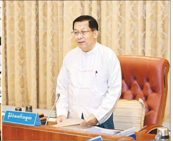
အမျိုးသားအဆင့်ရေအရင်းအမြစ်ကော်မတီဥက္ကဋ္ဌ၊ နိုင်ငံတော်သမ္မတ ဦးမင်းအောင်လှိုင် အမျိုးသားအဆင့်ရေအရင်းအမြစ်ကော်မတီအစည်းအဝေးတွင် အမှာစကားပြောကြားစဉ်။