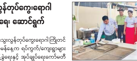
ခြင်များ ခွဲအောင်းနိုင်သည့်နေရာများကို အဘိတ်ဆေးခတ်ခြင်းများ ဆောင်ရွက်ခဲ့သည်။