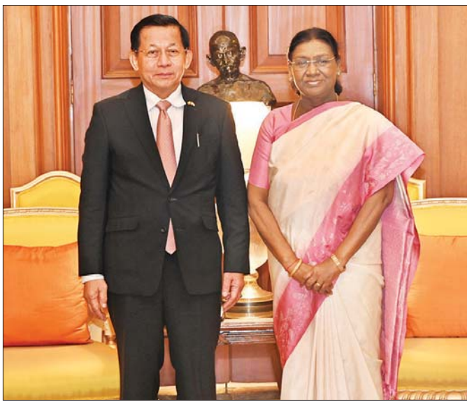
ပြည်ထောင်စုသမ္မတမြန်မာနိုင်ငံတော် နိုင်ငံတော်သမ္မတ ဦးမင်းအောင်လှိုင်နှင့် အိန္ဒိယသမ္မတနိုင်ငံသမ္မတ H.E. Smt. Droupadi Murmu တို့ ဖွတ်တမ်းတင်ခတ်ပုံရိုက်ကြစဉ်။ (၁-၆-၂၀၂၆)

ဆွေးနွေးပွဲအတွင်း နှစ်နိုင်ငံအကြား ကုန်သွယ် ငွေပေးချေမှုများ ပိုမိုမြန်ဆန်ချောမွေ့စေရေး၊ ဘဏ်လုပ်ငန်းနှင့် ဒီဂျစ်တယ်ငွေပေးချေမှုစနစ်ဆိုင်ရာ အတွေ့အကြုံများ အပြန်အလှန်မျှဝေရေးတို့ကို ဆွေးနွေးခဲ့ကြပါသည်။ အထူးသဖြင့် ကုန်သည်များနှင့် လုပ်ငန်းရှင်များအတွက် များစွာအကျိုးပြုမှုများ ရှိပြီး-ကျပ် တိုက်ရိုက်ငွေပေးချေမှုစနစ် SRVA (Special Rupee Vostro Account) စနစ်တို့အပြင် နယ်စပ်ကုန်သွယ်ရေးသာမက ပုံမှန်ကုန်သွယ်ရေး