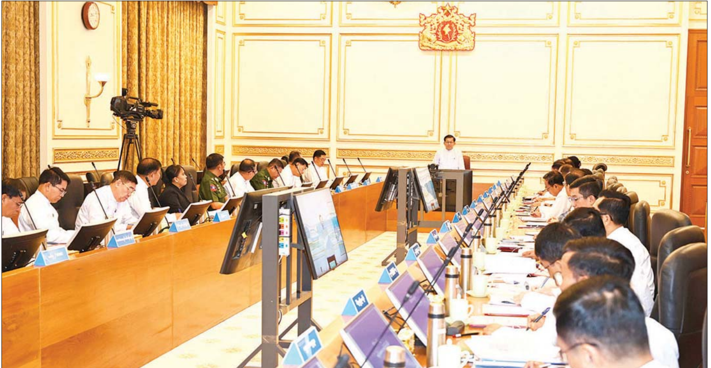
ပြည်ထောင်စုသမ္မတမြန်မာနိုင်ငံတော် နိုင်ငံတော်သမ္မတ ဦးမင်းအောင်လှိုင် ပြည်ထောင်စုအစိုးရအဖွဲ့အစည်းအဝေးတွင် အမှာစကားပြောကြားစဉ်။

ပြည်ထောင်စုသမ္မတမြန်မာနိုင်ငံတော် နိုင်ငံတော်သမ္မတ ဦးမင်းအောင်လှိုင် ပြည်ထောင်စုအစိုးရအဖွဲ့အစည်းအဝေးသို့ တက်ရောက်အမှာစကားပြောကြား