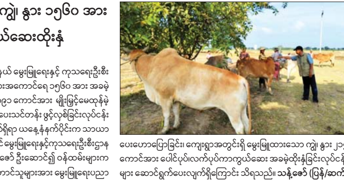
ပေးဟောပြောခြင်း၊ ကျေးရွာအတွင်းရှိ မွေးမြူထားသော ကျွဲ၊ နွား ၂၀၇ ကောင်အား ပေါင်ပုပ်၊ လက်ပုပ်ကာကွယ်ဆေး အခမဲ့ထိုးနှံခြင်းလုပ်ငန်း များ ဆောင်ရွက်ပေးလျက်ရှိကြောင်း သိရသည်။