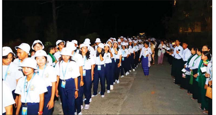
ပထမနှစ်နှင့် ဒုတိယနှစ် လူရည်ချွန်မောင်မယ်များ ချောင်းသာလူရည်ချွန်စခန်းသို့ ရောက်ရှိရာ ဆရာ ဆရာမများနှင့် ကျောင်းသား ကျောင်းသူများက ကြိုဆိုစဉ်။