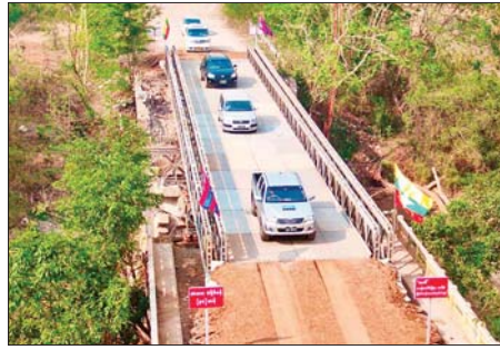
အကြမ်းဖက်သောင်းကျန်းသူများ ဖောက်ခွဲဖျက်ဆီးခဲ့သည့် နောင်လုံတံတား ပြန်လည်ပြုပြင်ပြီးစီးမှုကို တွေ့ရစဉ်။