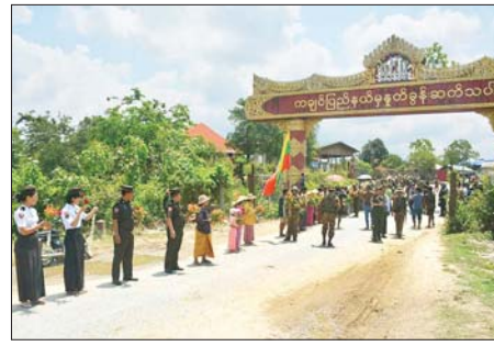
အောင်ပွဲရတပ်မတော်သားများအား ဒေသပြည်သူများက သောင်းသောင်းဖြင့် ကြိုဆိုနေမှုကို တွေ့ရစဉ်။