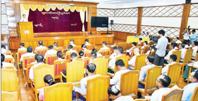
ဦးစွာ နိုင်ငံရေးအခင်း ပြသသည်။ အကျင်းအသံနှင့် ထွန်းလင်း ထို့နောက် ပြည်သူ့လွှတ်တော် တောက်ပလာမည့် မြန်မာ့ ဒုတိယဥက္ကဋ္ဌ ဦးမောင်မောင်အုန်း အနာဂတ် Video Clip ကို ဖွင့်လှစ်

ပြည်သူ့လွှတ်တော် ဒုတိယဥက္ကဋ္ဌ ဦးမောင်မောင်အုန်းသည် မန္တလေးတိုင်းဒေသကြီး လွှတ်တော်ဥက္ကဋ္ဌ၊ ဒုတိယဥက္ကဋ္ဌ၊ ပြည်သူ့လွှတ်တော်၊ အမျိုးသားလွှတ်တော်၊ တိုင်းဒေသကြီး လွှတ်တော်ကိုယ်စားလှယ်များအား ယနေ့ ဖွန်းလွှဲ ၁ နာရီတွင် မန္တလေးမြို့ အောင်မြေသာစံမြို့နယ်ရှိ တိုင်းဒေသကြီး လွှတ်တော်ရုံး သဘင်ဆောင်၌ တွေ့ဆုံသည်။ (ယာဝုံ) အခမ်းအနားသို့ မန္တလေးတိုင်းဒေသကြီး ဝန်ကြီးချုပ် ဦးမျိုးအောင်၊ မန္တလေးတိုင်းဒေသကြီး တိုင်းဒေသကြီး ဝန်ကြီးများ၊ တာဝန်ရှိသူများ တက်ရောက်ကြသည်။