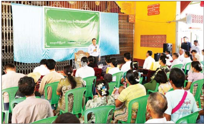
ပြည်သူ့လွှတ်တော်ဥက္ကဋ္ဌ ဦးခင်ရီ ဇေယျာသီရိမြို့နယ် မအူတောကျေးရွာအုပ်စု စိမ်းစားပင်ကျေးရွာမှ မဲဆန္ဒရှင်ပြည်သူများအား တွေ့ဆုံအမှာစကားပြောကြားစဉ်။

ထိုပြင် လွှတ်တော်၏ဆောင်ပုဒ်နှင့်အညီ “ပြည်သူ့အသံ လွှတ်တော်အသံ၊ ပြည်သူ့ဆန္ဒ လွှတ်တော်ဆန္ဒ၊ ပြည်သူတို့၏ မျှော်လင့်ချက် လွှတ်တော်က ဖော်ဆောင်ရွက်” ဆိုသည့်အတိုင်း မဲဆန္ဒရှင်ပြည်သူများ၏ ဆန္ဒများနှင့် လိုလားချက်များကို နိုင်ငံတော်အစိုးရအနေဖြင့် အကောင်အထည်ဖော်ဆောင်ရွက်ပေးနိုင်ရေးအတွက် ပြည်သူများ၏အသံကို နိုင်ငံတော်အစိုးရထံ ပေးပို့သွားမည်ဖြစ်ပါကြောင်း၊ နိုင်ငံတော်အစိုးရအနေဖြင့်လည်း ရက် (၁၀၀) စီမံချက်ဖြင့် ဖွံ့ဖြိုးရေးကိစ္စရပ်များကို ပြည်သူ့လူထုအတွက် ချမှတ်ဆောင်ရွက်လျက်ရှိပါကြောင်း၊ ယခု ဒေသခံပြည်သူများနှင့်တွေ့ဆုံစဉ်တွင်လည်း ဒေသဖွံ့ဖြိုးရေးဆိုင်ရာလိုအပ်ချက်များရှိပါက လွှတ်တော်မှတစ်ဆင့် နိုင်ငံတော်အစိုးရထံ ညှိနှိုင်းပေးပေါင်းဆောင်ရွက်ပေးသွားမည်ဖြစ်ကြောင်း ပြောကြားသည်။ ထို့နောက် တွေ့ဆုံပွဲတက်ရောက်လာကြသည့် ဒေသခံမဲဆန္ဒရှင်ပြည်သူများက လျင်မြန်စွာ ပုဂံစီးခဲသည့် စေတီ၊ ပုထိုးများ ပြန်လည်ပြင်ဆင်ပေးနိုင်ရေး၊ ကျေးရွာတွင်းနှင့် ကျေးရွာချင်းဆက်ကွန်ကရစ်လမ်းများခင်းပေးနိုင်ရေး၊ လျှပ်စစ်စီးရရှိရေး၊ စိုက်ပျိုးရေး