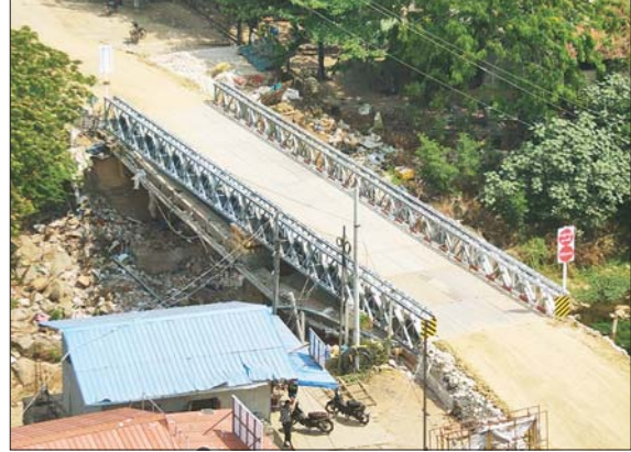
အကြမ်းဖက်သောင်းကျန်းသူများ ဖောက်ခွဲဖျက်ဆီးခဲ့သည့် ဧရိယာတွင် တား ပြန်လည် ပြုပြင်ပြီးစီးမှုကို တွေ့ရစဉ်။