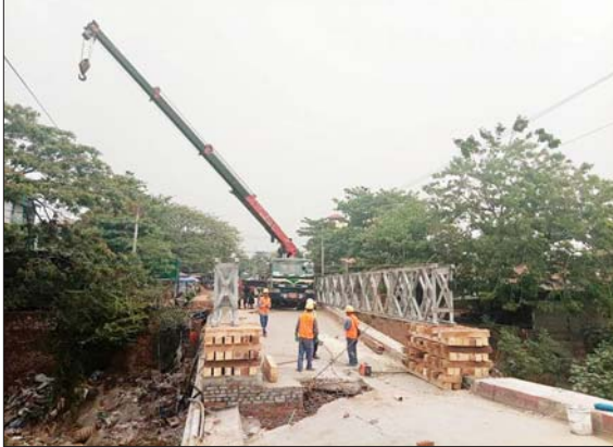
အကြမ်းဖက်သောင်းကျန်းသူများ ဖောက်ခွဲဖျက်ဆီးခဲ့သည့် ဧရိယာတွင် တား ပြန်လည် ပြုပြင်နေမှုကို တွေ့ရစဉ်။

အဆိုပါ မန္တလေးမှ မြစ်ကြီးနား သို့ ဆက်သွယ်ထားသည့် ဆက် သွယ်ရေး လမ်းကြောင်းသည် မြန်မာနိုင်ငံ၏ မြောက်ဘက်ဒေသ ဖွံ့ဖြိုးတိုးတက်ရေးအတွက် အခြေခံ ကျသော အခြေခံအဆောက်အအုံ တစ်ခုဖြစ်ပြီး အဆိုပါလမ်းကြောင်း အားအသုံးပြု၍ ခရီးသွားပြည်သူ များနှင့် ဒေသခံပြည်သူများ၏ သွားလာရေးအတွက် ကုန်စည် စီးဆင်းမှုများကို လွယ်ကူမြန်ဆန် စေကာ စီးပွားရေးအခွင့်အလမ်း များကို တိုးတက်စေသည့်အပြင် ကုန်စည် ဖို့ဆောင်ရာတွင်လည်း ပိုမိုမြန်ဆန် တိုးတက်လာသည့် အတွက် သယ်ယူပို့ဆောင်စရိတ် စာမျက်နှာ ၁၂ ကော်လံ ၁ ❖