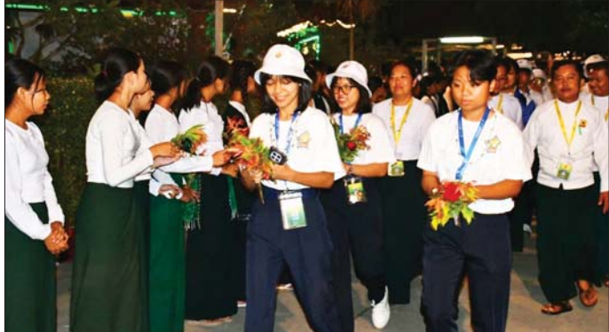
Grade 11 လူရည်ချွန်ကျောင်းသားမောင်မယ်များ ငွေဆောင်လူရည်ချွန်စခန်းသို့ ရောက်ရှိရာ ဆရာ ဆရာမများနှင့် ကျောင်းသား ကျောင်းသူများက ကြိုဆိုစဉ်။

မွန်းလွဲပိုင်းတွင် လူရည်ချွန်ကျောင်းသား ကျောင်းသူများသည် ဧပေယျာသီရိမြို့နယ် ခရောင် လမ်းခွဲရှိ ပုံနှိပ်ရေးနှင့် ထုတ်ဝေရေးဦးစီးဌာန နေပြည် တော် ပုံနှိပ်စက်ရုံနှင့် သတင်းနှင့်စာနယ်ဇင်းလုပ်ငန်း သတင်းစာတိုက်များကို ကြည့်ရှုလေ့လာကြသည်။ အလားတူ ပြင်ဦးလွင်လူရည်ချွန်စခန်းကို အခြေ ပြု၍ ဒေသန္တရပဟုသတများ လေ့လာကြမည့် နဝမတန်း လူရည်ချွန်ကျောင်းသား ကျောင်းသူ ၉၆ ဦးနှင့် အုပ်ချုပ်သူ ဆရာ ၁၈ ဦးသည် နေပြည် တော် စုရပ်စခန်းမှ ပြင်ဦးလွင်သို့ ထွက်ခွာကြပြီး မွန်းလွဲပိုင်းတွင် ပြင်ဦးလွင်မြို့ လူရည်ချွန်အပန်းဖြေ စခန်းသို့ ရောက်ရှိကြရာ ဌာနဆိုင်ရာ တာဝန်ရှိသူများ၊