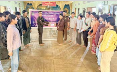
လင်းအေးနှင့် ဝန်ထမ်းများက ကုလားကွဲအုပ်စုရှိ အသက် ၁၀နှစ် နှင့်အထက် မှတ်ပုံတင်အသစ် ပြုလုပ်ပေးခြင်း၊ အသက် ၁၈နှစ်

နောင်ချို မေ ၆ ရှမ်းပြည်နယ် (မြောက်ပိုင်း) နောင်ချိုမြို့နယ်၌ အစိုးရသစ်၏ ရက်(၁၀၀) စီမံချက်အရ အသက် ၁၀နှစ်နှင့် ၁၈နှစ် ပြည့်ပြီးသူများ အား နိုင်ငံသားစိစစ်ရေးကတ် များကို ယနေ့နံနက်ပိုင်းက နောင်ချိုမြို့နယ်ဦးစီးမှူးရုံးစိုက်ရာ ဈေးရပ်ကွက် မြို့လယ်ဓမ္မာရုံ၌ ဆောင်ရွက်ပေးရာ မြို့နယ် လူဝင်မှုကြီးကြပ်ရေးနှင့် ပြည်သူ့ အင်အားဦးစီးဌာန ဦးစီးမှူး ဦးနေ