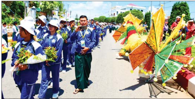
Grade 10 လူရည်ချွန် ကျောင်းသားမောင်မယ်များ အင်းလေးခေါင်တိုင်လူရည်ချွန်စခန်းသို့ ရောက်ရှိရာ ခရီးအစဉ်တွင် အဖွဲ့အစည်းများဖြင့် လှည့်လည်နေကြခြင်းဖြစ်သည်။

နေပြည်တော် မေ ၆ နေပြည်တော် လူရည်ချွန်အပန်းဖြေစခန်းတွင် ရောက်ရှိနေသည့် ၂၀၂၅-၂၀၂၆ ပညာသင်နှစ် ခွဲဒသမ တန်း လူရည်ချွန်ကျောင်းသား ကျောင်းသူ ၉၉ ဦး သည် အုပ်ချုပ်သူ ဆရာ ဆရာမများနှင့်အတူ ယနေ့ နံနက်ပိုင်းတွင် နေပြည်တော် တပ်ကုန်းမြို့ရှိ မြန်မာ့ အသံနှင့်ရုပ်မြင်သံကြားသို့ ရောက်ရှိပြီး ရုပ်မြင် သံကြား ထုတ်လွှင့်မှု လုပ်ငန်းများ၊ အသံလွှင့်လုပ်ငန်း များနှင့် စိန်ရတပြတိုက်တို့ကို ကြည့်ရှုလေ့လာကြ သည်။