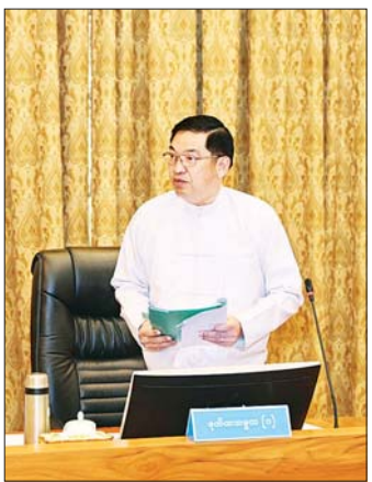
ဒုတိယသမ္မတ ဦးညိုစော ရင်းလင်းတင်ပြစဉ်။

အသားငါးများ ကုန်ဈေးနှုန်းကြီးမြင့်ခြင်းနှင့် ပတ်သက်၍လည်း ဒေသတွင်းစားသုံးမှု ဖူလုံမှုမှ တစ်ဆင့် နိုင်ငံတစ်ဝန်းလုံးဖူလုံရေးကို ဖော်ဆောင် ပေးနိုင်မည်ဆိုပါက အသား၊ ငါးများ၏ ကုန်ဈေးနှုန်း များသည်လည်း ကျဆင်းလာနိုင်မည်ဖြစ်ကြောင်း၊ ဒေသတွင်းမှထွက်ရှိသည့် စိုက်ပျိုးရေးထွက်ကုန်များ ဖြစ်သည့် ပြောင်း၊ ဆန်ကဲ့၊ ဖွဲ တို့ကို အခြေခံသည့် တိရစ္ဆာန်အစာများကို ပိုမိုတိုးမြှင့်ထုတ်လုပ်၍ မွေးမြူ ရေးလုပ်ငန်းများကို စနစ်တကျဆောင်ရွက်သွားမည် ဆိုပါက ဒေသတွင်းစားသုံးမှုကို ဖူလုံစေမည်ဖြစ်ပြီး ကုန်ဈေးနှုန်းကြီးမြင့်ခြင်းများကိုလည်း လျော့ချနိုင် စေမည်ဖြစ်ကြောင်း။ ပြည်တွင်း၊ ပြည်ပ ခရီးသွားလုပ်ငန်းနှင့် MSME လုပ်ငန်းများကို အထူးအလေးထား အားပေးမြှင့်တင်၍ စီးပွားရေးတိုးတက်အောင်ဆောင်ရွက် စီးပွားရေးနှင့် ပတ်သက်၍ ပြည်တွင်း၊ ပြည်ပ ခရီးသွားလုပ်ငန်းများ တိုးတက်လာစေရေး သက်ဆိုင် ရာ ဝန်ကြီးဌာနများအချင်းချင်း ပေါင်းစပ်ညှိနှိုင်း ဆောင်ရွက်သွားရန်လိုသကဲ့သို့ ဒေသအလိုက် တာဝန်ရှိသူများ၊ ဒေသပြည်သူများမှလည်း ဝိုင်းဝန်း ပူးပေါင်းဆောင်ရွက်သွားကြရမည် ဖြစ်ကြောင်း၊ ဒေသတွင်း သာယာလှပမှုနှင့် နှစ်လို့ဖွယ်ရှိသည့် ဝန်ဆောင်မှုများကို ဖော်ဆောင်ပေးနိုင်မည်ဆိုပါက ခရီးသွားဝင်ရောက်မှုများလည်း တိုးတက်လာစေမည် ဖြစ်ကာ ဒေသ၏ လူမှုစီးပွားဘဝများသည်လည်း တိုးတက်လာနိုင်မည်ဖြစ်ကြောင်း။ ခရီးသွား