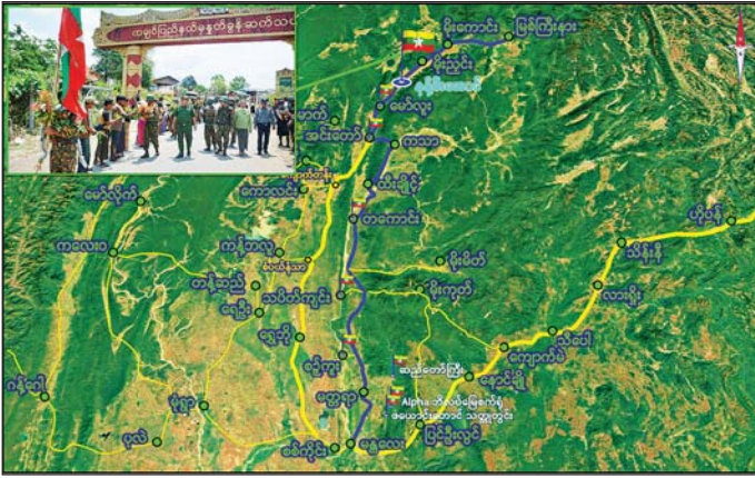
တပ်မတော်စစ်ကြောင်းများက မန္တလေး - မတ္တရာ - တကောင်း - ထီးချိုင့် - ကသာ - အင်းတော် - မော်လမြိုင် - မိုးညှင်း - မိုးကောင်း - မြစ်ကြီးနား ဆက်သွယ်ရေးလမ်းကြောင်းအား ပြန်လည်ဖွင့်လှစ်ပေးနိုင်ခဲ့မှု။

တပ်မတော်စစ်ကြောင်းများအနေဖြင့် အဆိုပါဆက်သွယ်ရေးလမ်းကြောင်းအား ပြန်လည်ဖွင့်လှစ်နိုင်ရေးအတွက် လိုအပ်သည့် အုပ်ချုပ်ထောက်ပံ့မှုများ ဆောင်ရွက်ပြီး စနစ်တကျ စုဖွဲ့ပြင်ဆင်၍ စစ်နည်းဗျူဟာမြောက်ဟန်ချက်ညီညီဖြင့် အကြမ်းဖက်သောင်းကျန်းသူများ ယာယီစိုးမိုး