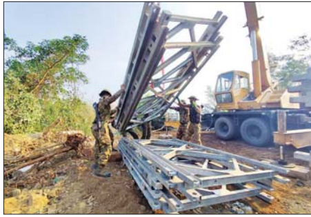
အကြမ်းဖက်သောင်းကျန်းသူများ ဖောက်ခွဲဖျက်ဆီးခဲ့သည့် နောင်လုံတံတား ပြန်လည်ပြုပြင်နေမှုကို တွေ့ရစဉ်။