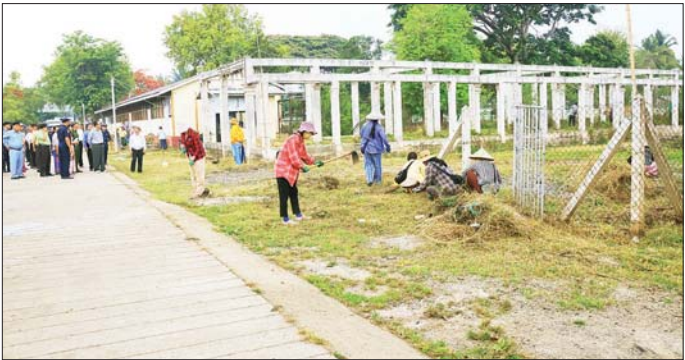
လိုက်လံကြည့်ရှုအားပေးသည်။ ထိုသို့ကြည့်ရှုစဉ် ပြည်နယ်ဝန်ကြီးချုပ်က ကျောင်းသားကျောင်းသူများအတွက် သိပ္ပံလက်တွေ့စမ်းသပ်ခန်းများ၌ သင်ထောက်ကူပစ္စည်းများ ပြည့်ဆည်းဆောင်ရွက်ပေးရန်၊ ကျောင်းစာကြည့်တိုက်တွင် စာအုပ်စာစောင်များ စနစ်တကျစာရင်း ရေးသွင်းထားရှိရန်နှင့် စာအုပ်စာစောင်တိုးပွားရေးဆောင်ရွက်ထားရှိရန်၊ ကျောင်းနှင့် ကျောင်းပတ်ဝန်းကျင် သန့်ရှင်းသာယာလှပစေရေး ပန်းအလှပင်များ စနစ်တကျစိုက်ပျိုးရန်၊ ပင်မစာသင်ဆောင်များ၊ စာသင်ခန်းများနှင့် စာသင်ခန်းများ သန့်ရှင်းသပ်ရပ်စွာ ထားရှိရန်မှာကြားပြီး လိုအပ်သည်များကို တာဝန်ရှိသူများနှင့် ပေါင်းစပ်ညှိနှိုင်း ဆောင်ရွက်ပေးသည်။ ထို့နောက် ပြည်နယ်ဝန်ကြီးချုပ်နှင့် တာဝန်ရှိသူများသည် ဒေါန်းကူးရပ်ကွက်သို့ရောက်ရှိပြီး နှစ်စဉ် ရေကြီးရေလျှံမှုကြုံတွေ့ရသည့် မြေအနိမ့်ပိုင်းနေရာများ၌ ယခုနှစ်မိုးရာသီတွင် ရေကြီးရေလျှံမှု မဖြစ်ပေါ်စေရေးဆောင်ရွက်မည့် အခြေအနေများကိုကြည့်ရှုစစ်ဆေးပြီး ရပ်ကွက်နေပြည်သူများအနေဖြင့် ဌာနဆိုင်ရာတာဝန်ရှိသူများနှင့်အတူ ပူးပေါင်းပါဝင် ဆောင်ရွက်ရန်၊ ရေနေထိုင်ခြင်းများ ရေစီးရေလာကောင်းမွန်ရေး စဉ်ဆက်မပြတ်ဆောင်ရွက်ထားရှိရန် မှာကြားခဲ့ကြောင်း သိရသည်။ သုတ(ပြန်/ဆက်)

လှိုင်ကော် မေ ၂ ကယားပြည်နယ် လှိုင်ကော်မြို့၌ အခြေခံပညာကျောင်းများ ကျောင်းဖွင့်ကာလရောက်ရှိမည့်ဖြစ်သည့်အတွက် ကျောင်းနှင့် ကျောင်းပတ်ဝန်းကျင် သန့်ရှင်းရေးဆောင်ရွက်လျက်ရှိရာ ယနေ့နံနက်ပိုင်းက ပြည်နယ်ဝန်ကြီးချုပ် ဦးအံ့မော်သည် အခြေခံပညာကျောင်းများ သန့်ရှင်းသာယာရေးဆောင်ရွက်နေမှုများနှင့် ရပ်ကွက်အတွင်း ရေကြီးရေလျှံမှု မဖြစ်ပေါ်စေရေး ဆောင်ရွက်မည့်အခြေအနေများကို ကြည့်ရှုစစ်ဆေးသည်။ ဦးစွာ ပြည်နယ်ဝန်ကြီးချုပ်နှင့် တာဝန်ရှိသူများသည် အမှတ်(၇)အခြေခံပညာ အထက်တန်းကျောင်းနှင့် အမှတ်(၂)အခြေခံပညာ အထက်တန်းကျောင်းများသို့ သွားရောက်၍ မြန်မာနိုင်ငံရဲတပ်ဖွဲ့၊ မီးသတ်တပ်ဖွဲ့ဝင်များ၊ ဌာနဆိုင်ရာဝန်ထမ်းများနှင့် ရပ်ကွက်နေပြည်သူများက ကျောင်းဖွင့်ရာသီအစီ ကျောင်းဝင်းအတွင်း သန့်ရှင်းရေးဆောင်ရွက်နေမှုများကို