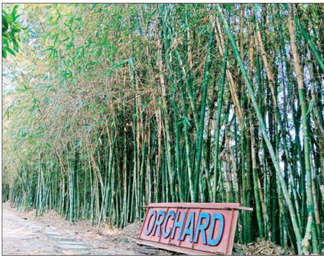
မအူပင်မြို့နယ် မလတ်တိုကျေးရွာတွင် စိုက်ပျိုးထားသည့် ဝါးပင်များကို တွေ့ရစဉ်။ ဓာတ်ပုံ-နဒီမင်း

ဆိုင်ရှေ့မှာ မနက်စာစားသူတွေရဲ့ မော်တော်ဆိုင်ကယ်နဲ့ကားတွေ ရပ်ထားပါတယ်။ ဆိုင်ထဲမှာ လူအများရဲ့ စကားပြောသံတွေ၊ မုန့်မှာနေတဲ့ စားပွဲထိုးတွေရဲ့ အသံ၊ စွန်းသံ၊ ပန်းကန်သံတွေနဲ့ အတူ လက်ဖက်ရည်နဲ့ တွဲဖက်စားသောက်ရတဲ့ ပလာတာ၊ စမုဆာ၊ အိကြာကွေးကြော်တဲ့ ညှော်နံ့တွေက လှိုင်နေပါတယ်။ မနက်ခင်းစောစော အဆာပြေစာအတွက် လက်ဖက်ရည်၊ ဗဟိုတွေ အပြင် ရှမ်းခေါက်ဆွဲ၊ မုန့်ဟင်းခါးနဲ့ ထမင်း ဆီဆမ်းသာရပြီး အရသာကလည်း သာမန်၊ ဒါပေမယ့် ဆိုင်က လူအမြဲပြည့်နေတတ်ပါတယ်။ မုန့်တွေစားချင်ရင် စောစောသွားမှ အဆင်ပြေပြီး နည်းနည်းနောက်ကျသွားရင် လက်ဖက်ရည်သာ ရပါတော့တယ်။