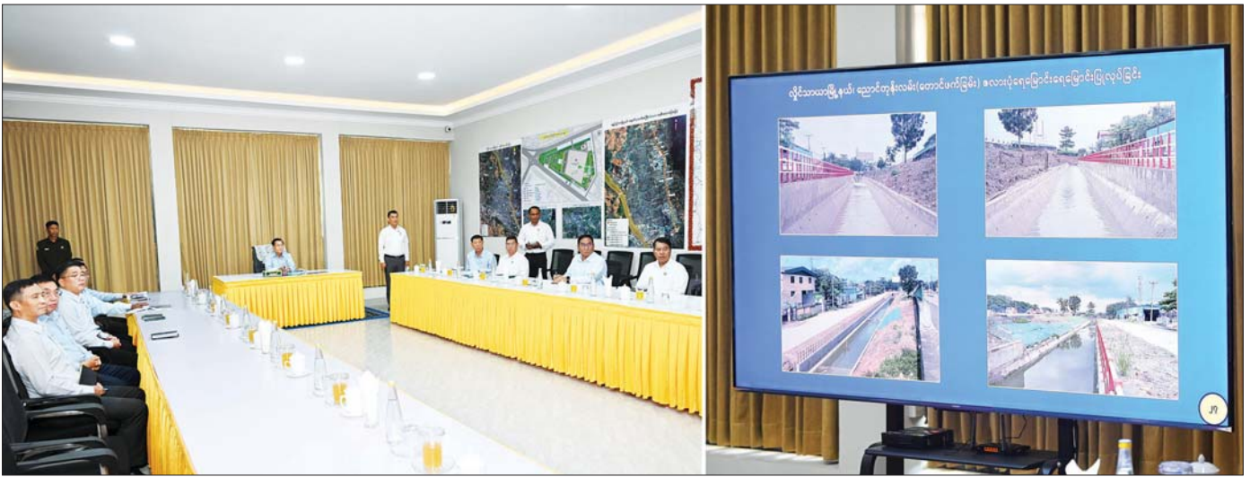
ပြည်ထောင်စုသမ္မတ မြန်မာနိုင်ငံတော် နိုင်ငံတော်သမ္မတ ဦးမင်းအောင်လှိုင် အား လှိုင်သာယာမြို့နယ် ဘုရင့်နောင်ပန်းခြံ ရှင်းလင်းဆောင်ခန်းမ၌ ရန်ကုန်တိုင်းဒေသကြီးဝန်ကြီးချုပ်က ရန်ကုန်မြို့အတွင်း မြို့ပြဖွံ့ဖြိုးတိုးတက်ရေးလုပ်ငန်းဆောင်ရွက်ထားမှုအခြေအနေများ ရှင်းလင်းတင်ပြစဉ်။

□ ရွှေဖိုးမှ ဦးစွာ နိုင်ငံတော်သမ္မတနှင့် အဖွဲ့ဝင်များသည် လှိုင်သာယာ မြို့နယ် ဘုရင့်နောင်ပန်းခြံသို့ ရောက်ရှိကြပြီး ရှင်းလင်းဆောင်ခန်းမတွင် ရန်ကုန်တိုင်းဒေသကြီး ဝန်ကြီးချုပ်က ၂၀၂၅ခုနှစ် နိုဝင်ဘာလအတွင်း နိုင်ငံတော်အကြီးအကဲ လှိုင်သာယာမြို့နယ်သို့ ရောက်ရှိ စစ်ဆေးစဉ် လမ်းညွှန်ချက်များ အပေါ် လိုက်နာဆောင်ရွက်ပြီးစီးမှုအခြေအနေများ၊ လှိုင်သာယာ (အနောက်ပိုင်း)မြို့နယ် အနော်ရထာစက်မှုဇုန်အတွင်း ဧရာဝတီလမ်းတစ်လျှောက် ဆက်သွယ်ရေးကြိုးများ စနစ်တကျဖြစ်စေရေး ဆောင်ရွက်ထားရှိမှု၊ ရန်ကုန်-ပုသိမ် လမ်းမကြီးပုံယာတစ်လျှောက် ရေစီးရေလှောင်ကောင်းမွန်စေရေး ကွင်းဆင်းစစ်ဆေးတိုင်းတာမှုများပြုလုပ်ပြီး စလားပုံ ရေမြောင်းများ ဖောက်လုပ်လျက်ရှိမှု အခြေအနေများ၊ လှိုင်သာယာ မြို့နယ် ရွှေပြည်သာတံတားလမ်းရေစီးရေလှောင်ကောင်းမွန်စေရေး ဆောင်ရွက်ထားရှိမှုနှင့် လိုင်မြစ်ထွက်ပေါက် ရေတံခါးများ ဆောက်လုပ်ထားရှိမှု၊ လှိုင်သာယာ (အရှေ့ပိုင်း)မြို့နယ် ပညာတော်ရန်လမ်းတစ်လျှောက် ရေစီးရေလှောင်ကောင်းမွန်စေရေး ဆောင်ရွက်ထားရှိမှု၊ လမ်းမကြီးများ တိုးချဲ့ရာတွင် ရွှေပြောင်ရန် လိုအပ်သည့် လျှပ်စစ်စီးတိုင်များနှင့် ဆက်သွယ်ရေးတိုင်များအား ရွှေပြောင်ဆောင်ရွက်ပြီးစီးမှု အခြေအနေများ၊ ရန်ကုန်တိုင်းဒေသကြီးအတွင်းရှိ လမ်းဘေးပုံယာများ တစ်လျှောက် သန့်ရှင်းသန့်ရှင်းလှုပ်ပေးလုပ်ငန်းများ ဆောင်ရွက်