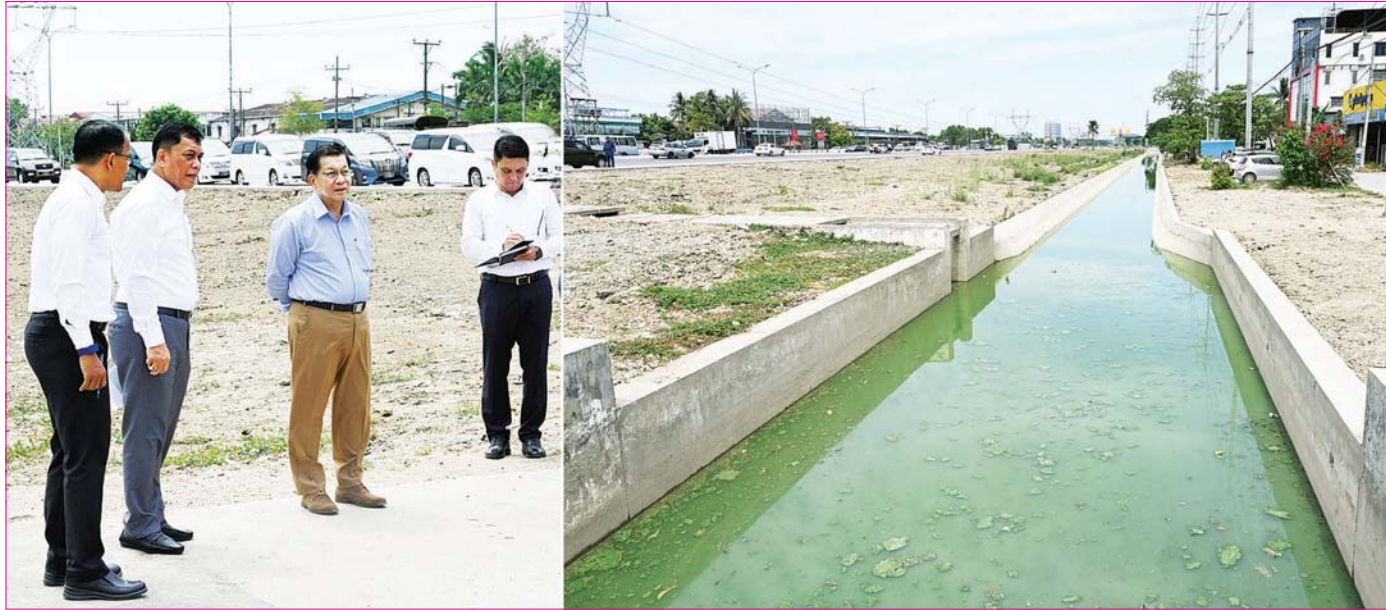
ပြည်ထောင်စုသမ္မတ မြန်မာနိုင်ငံတော် နိုင်ငံတော်သမ္မတ ဦးမင်းအောင်လှိုင် လှိုင်သာယာမြို့နယ်အတွင်း သန့်ရှင်းသာယာလှပရေးနှင့်ရေစီးရေလာကောင်းမွန်စေရေး ဆောင်ရွက်ထားမှုများအား ကြည့်ရှု စစ်ဆေးစဉ်။

နေပြည်တော် မေ ၂ ပြည်ထောင်စုသမ္မတ မြန်မာနိုင်ငံတော် နိုင်ငံတော်သမ္မတ ဦးမင်းအောင်လှိုင်သည် တပ်မတော် ကာကွယ်ရေးဦးစီးချုပ် ဗိုလ်ချုပ်ကြီး ရဝင်းဦး၊ ပြည်ထောင်စုဝန်ကြီးများဖြစ်ကြသည့် ဦးမြထွန်းဦး၊ ဦးထိန်လင်းနှင့် ဦးမျိုးသန့်၊ ရန်ကုန်တိုင်းဒေသကြီး ဝန်ကြီးချုပ် ဦးအောင်နိုင်သူ၊ ကာကွယ်ရေးဦးစီးချုပ်ရုံးမှ အဆင့်မြင့်တပ်မတော်အရာရှိကြီးများ၊ ရန်ကုန်တိုင်းစစ်ဌာနချုပ်တိုင်းမှူး၊ ရန်ကုန်မြို့တော်ဝန် ဦးမျိုးမြင့်အောင်နှင့် တာဝန်ရှိသူများလိုက်ပါ၍ ယနေ့နံနက်ပိုင်းတွင် လှိုင်သာယာမြို့နယ် အပါအဝင် ရန်ကုန်မြို့အတွင်း မြို့ပြဖွံ့ဖြိုးတိုးတက်ရေးလုပ်ငန်းများနှင့် မြို့သန့်ရှင်းသာယာလှပရေးလုပ်ငန်းများ ဆောင်ရွက်ထားရှိမှုအား လှည့်လည်ကြည့်ရှုစစ်ဆေးသည်။