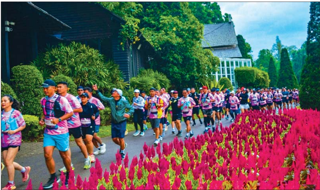
စာမျက်နှာ ၁၇ ကော်လံ ၃ ❖

ပြင်ဦးလွင် ၃၆ ကီလိုမီတာ အမျိုးသားပြိုင်ပွဲဝင် ၂၅၈ ဦးနှင့် အမျိုးသမီးပြိုင်ပွဲဝင် ၆၇ ဦး၊ ၁၆ ကီလိုမီတာအမျိုးသားပြိုင်ပွဲဝင် ၄၁၁ ဦးနှင့် အမျိုးသမီးပြိုင်ပွဲဝင် ၂၄၀၊ နိုင်ငံခြားသား ပြိုင်ပွဲဝင် ၁၁ ဦး စုစုပေါင်း ၉၅၇ ဦးတို့ဝင်ရောက်ယှဉ်ပြိုင်ကြပြီး ၃၆ ကီလိုမီတာပြိုင်ပွဲတွင် ဆုရပြိုင်ပွဲဝင် များအား ပထမဆု ၁၀ သိန်း၊ ဒုတိယဆု ၅ သိန်းနှင့် တတိယဆု ၃ သိန်းအားလည်းကောင်း၊ ၁၆ ကီလိုမီတာပြိုင်ပွဲတွင် ဆုရပြိုင်ပွဲဝင်များအား ပထမဆု ၃ သိန်း၊ ဒုတိယဆု ၁ သိန်းနှင့် တတိယဆု ၅ သိန်းအား တာဝန်ရှိသူများက အသီးသီးပေးအပ်ချီးမြှင့်သည်။