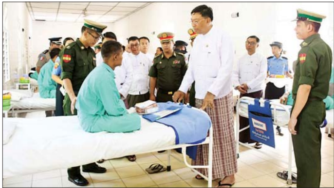
လိုက်လံကြည့်ရှုအားပေးပြီး အားဖြည့်ဆေးဝါးများ ထိုနေ့က အကြမ်းဖက်သောင်းကျန်းသူများ နှင့် အာဟာရဖြည့်အစားအစာများကို ပေးအပ်သည်။ နှင့် PDF အမည်ခံအကြမ်းဖက်သမားများ၏

ထားဝယ် မေ ၂ တနင်္သာရီတိုင်းဒေသကြီးဝန်ကြီးချုပ် ဦးစောနိုင်ဦးသည် တိုင်းဒေသကြီးဝန်ကြီးများ၊ တာဝန်ရှိသူများနှင့်အတူ ယနေ့နံနက်ပိုင်းတွင် စုပေါင်းသွေးလှူဒါန်းနေမှုနှင့် ဆေးဝါးကုသနေမှုကို လိုက်လံကြည့်ရှုအားပေးပြီး ဘုန်းတော်ကြီးကျောင်းများ၌ လိုအပ်လျက်ရှိသော လှူဖွယ်ပစ္စည်းများကို ပေးအပ်လှူဒါန်းသည်။