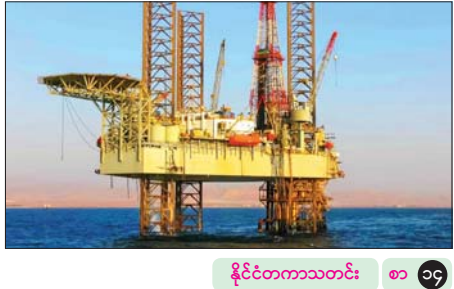
နိုင်ငံတကာသတင်း ၈၁ ၁၄

ပြည်တွင်းသတင်း ၈၁ ၉ ၂၀၂၆ ခုနှစ် မေလ ၁ ရက်နေ့တွင် ရန်ကုန်မြို့၏ ဝန်းကျင်လေထုအရည်အသွေး လေ့လာဆန်းစစ်ခြင်းနှင့်ပတ်သက်၍ သတင်းထုတ်ပြန်ချက် ပြည်တွင်းသတင်း ၈၁ ၂၆