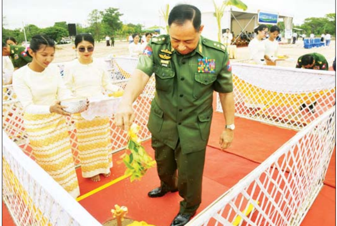
အဆောက်အအုံသစ်အား အမျိုးသားစည်းလုံးညီညွတ်ရေးနှင့် ငြိမ်းချမ်းရေးဖော်ဆောင်မှုဦးစီးဌာန၏ ပြည်ထောင်စုတာဝန်ခံအဖွဲ့မှ ဦးစီးစီစဉ်၍ ကျင်းပသည့် ဆောက်လုပ်ခြင်းဖြစ်ပြီး မြေဧက ၈ ဒသမ ၅ ဧက အကျယ်အဝန်းရှိကြောင်း၊ အဆောက်အအုံ၏ ပထမထပ်တွင် စုစုပေါင်း အခန်း ၄၁ ခန်းနှင့် မြေညီ

အဆိုပါ အမျိုးသားစည်းလုံးညီညွတ်ရေးနှင့် ငြိမ်းချမ်းရေးဖော်ဆောင်မှုပဟိဋ္ဌာန နှစ်ထပ်