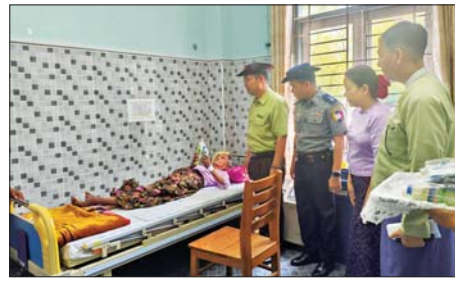
ကော်မတီဥက္ကဋ္ဌနှင့် အဖွဲ့ဝင်များ၊ မြင်းမူမြို့နယ် စီမံခန့်ခွဲရေးနှင့်အုပ်ချုပ်ရေးကော်မတီဥက္ကဋ္ဌနှင့် အဖွဲ့ဝင်များသွားရောက်၍ အပူရောင်စခန်းရှိ သက်ကြီးဘိုးဘွားများအား သောက်ရေသန့်နှင့် မုန့်များ ပေးအပ်ခဲ့ကြောင်း သိရသည်။

မုံရွာ မေ ၂၆ စစ်ကိုင်းတိုင်းဒေသကြီးအတွင်း အပူရှိန်မြင့်တက်မှုကြောင့် အပူရောင်စခန်းများကို မြို့နယ်များအလိုက် ဖွင့်လှစ်ထားရှိလျက်ရှိရာ မြင်းမူမြို့ အနောက်ပိုင်းရပ်ကွက် အောင်ဇေယျရပ်ရှိ ပြည်သူ့ဆေးရုံဝင်းအတွင်းရှိ ကုမ္ပဏီဇေယျာ နှစ်ထပ်သံဃာဆေးရုံတွင် ဖွင့်လှစ်ထားသည့် အပူရောင်စခန်းသို့ အသက် ၆၅ နှစ်နှင့်အထက် သက်ကြီးရွယ်အိုများသည် မေ ၂၇ ရက်တွင် အမျိုးသားနှစ်ဦး၊ အမျိုးသမီးတစ်ဦး၊ မေ ၂၇ ရက်တွင် အမျိုးသား တစ်ဦး၊ အမျိုးသမီးတစ်ဦး၊ မေ ၂၇ ရက်တွင် အမျိုးသား သုံးဦး၊ အမျိုးသမီး တစ်ဦးသည် နံနက် ၈ နာရီမှ ညနေ ၅ နာရီအထိ လာရောက်တည်းခိုပြီး ၎င်းတို့အား မြို့နယ်ကျန်းမာရေးအဖွဲ့မှ ကျန်းမာရေးစောင့်ရှောက်မှုပေးခြင်း၊ မြို့နယ်စီမံခန့်ခွဲရေးနှင့် အုပ်ချုပ်ရေးကော်မတီမှ အဟာရမုန့်၊ Royal Di ဓာတ်ဆား၊ အချိုရည်၊ သောက်ရေသန့်များနှင့် မုန့်များ ပေးအပ်ခဲ့သည်။