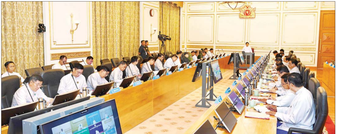
နိုင်ငံတော်သမ္မတ ဦးမင်းအောင်လှိုင် ပြည်ထောင်စုသမ္မတမြန်မာနိုင်ငံတော် ပြည်ထောင်စုအစိုးရအဖွဲ့အစည်းအဝေးတွင် အမှာစကားပြောကြားစဉ်။