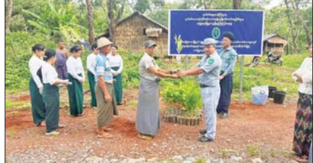
မွန်ပြည်နယ် သံဖြူဇရပ်မြို့နယ်ရှိ ကြံခိုင်ရေး-ဒုဂ်နီလမ်းနှင့် ကျိုက္ခမီကဒတ်တောင်လမ်း ထန်းတောနေရာတို့၌ မေ ၂၆ ရက်က နယ်စပ်ဒေသနှင့် တိုင်းရင်းသားလူမျိုးများ ဖွံ့ဖြိုးတိုးတက်ရေးဦးစီးဌာန မြို့နယ်ဖွံ့ဖြိုးရေးအဖွဲ့မှ စုပေါင်းသစ်ပင်စိုက်ပျိုးပွဲ ပြုလုပ်ရာ တာဝန်ရှိသူများက မဟော်ဂန်နှင့် မန်ကျန်ရားပျိုးပင် ၅၀၀ ကို ဒေသများအား ပေးအပ်စဉ်။

အတွက် ရေချိုရရှိနိုင်ရန် ဆောင်ရွက်ပေးမည့် အခြေအနေများ၊ ဒေါင့်ကြီးအရှေ့ကျွန်းပတ်တာနှင့် ကပ်လျက်တည်ရှိသော ကြက်ဖမ္မေ ဇောင်းကျွန်းပတ်တာမှ ရေချိုများကို ပန်တကာမြောင်း၊ 5-3-1 မြောင်းနှင့် ရိုးကောက်ရေတံခါးတို့မှ တစ်ဆင့် သွယ်ယူမည့်လုပ်ငန်းအခြေအနေများနှင့် ပတ်သက်၍ ရှင်းလင်းဆွေးနွေးခဲ့သည်။