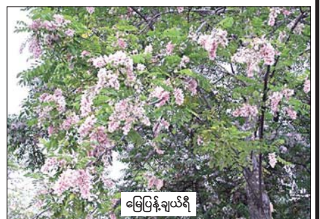
မြေပြန့်ချယ်ရီ

“ သစ်စိမ်းမြေဩဇာများ ထည့်သွင်းခြင်းဖြင့် အာဟာရများ ရေနှင့်အတူ ဆုံးရှုံးမှုများကို ကာကွယ်နိုင်ပြီး နိုက်ထရိုဂျင်အား တဖြည်းဖြည်းထုတ်လွှတ်ပေးသဖြင့် သီးနှံပင်၏ လိုအပ်ချက်နှင့် ကိုက်ညီစေသည်။ အမြစ်နက်နက်ဆင်းနိုင်သဖြင့် မြေအောက်လွှာတွင်ရှိသော အာဟာရများကို စုပ်ယူပြီး အပေါ်ယံလွှာသို့ ရောက်ရှိစေသည်။ သီးနှံပင်အတွက် ထည့်သွင်းပေးလိုက်သော အာဟာရများကို စုပ်ယူထားသဖြင့် ရေနှင့် စီးဆင်းပျောက်ဆုံးခြင်းမှ ကာကွယ်နိုင် သစ်စိမ်းမြေဩဇာအပင်များကို စိုက်ပျိုးအသုံးပြုခြင်းသည် စိုက်ပျိုးမြေများ၏ အရည်အသွေးကို ရေရှည်ထိန်းသိမ်း၍ ထုတ်လုပ်နိုင်စွမ်းအား တည်တံ့စေမည် ”