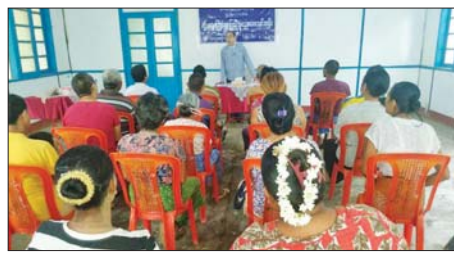
ပြည်မြို့နယ်၌ ပျားမွေးမြူရေးပြည်သူပညာပေးသင်တန်းဖွင့်

ပြည် မေ ၂၆ ပဲခူးတိုင်းဒေသကြီး ပြည်မြို့နယ်ပျားမွေးမြူရေးနှင့်ကုသရေးဦးစီးဌာန မြို့နယ်တာဝန်ရှိသို့ ယမန်နေ့နံနက်ပိုင်းက ပျားမွေးမြူရေး ပြည်သူပညာပေးသင်တန်းဖွင့်လှစ်သည်။