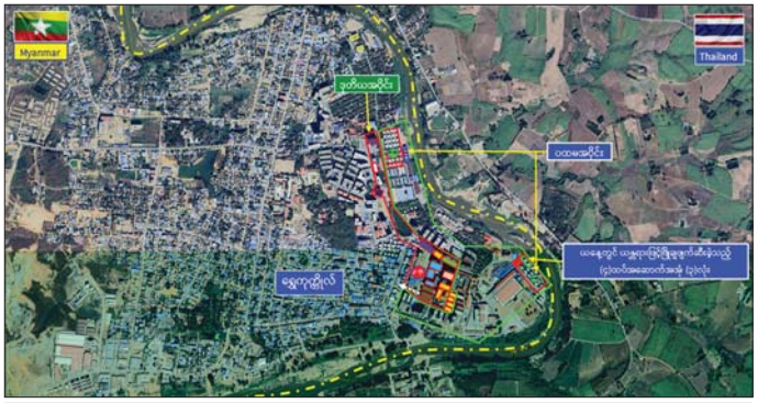
ရွှေကျက်လီဒေသရှိ တရားမဝင်အဆောက်အအုံများအား ဖောက်ခွဲဖျက်ဆီးမှုပြမြေပုံ။

ကော့စိုးမှ ထိုသို့ဆောင်ရွက်လျက်ရှိရာ ရွှေကျက်လီနယ်မြေ အတွင်း၌ အွန်လိုင်းလိမ်လည် လောင်းကစားလုပ်ငန်း လုပ်ကိုင်ရာတွင် အသုံးပြုသည့် အဆောက်အအုံ ၇၇ လုံးအနက် လေးထပ် လူနေအဆောက်အအုံ