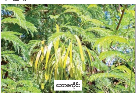
ဘောစကိုင်း

ဘောစကိုင်းပင်သည် မြေဆီလွှာထက်သန်မှုကို ဖြစ်စေသည်။ တောင်စောင်းဒေသများတွင် မြေဆီလွှာရေတိုက်စားခံရမှု သက်သာစေရန် သော်လည်းကောင်း၊ အပူပိုင်းဒေသများတွင် လေတိုက်စားခြင်းမှ ကာကွယ်ရန်သော်လည်းကောင်း စိုက်ပျိုးနိုင်ပါသည်။ မြောက်ပိုင်းခြင်းကို ခံနိုင်ရည်ရှိသည်။ အမြစ်ရှည်လျားစွာဆင်းနိုင်သဖြင့် မြေအောက်လွှာတွင်ရှိသော အစာနှင့်ရေကို စုပ်ယူနိုင်စွမ်းရှိသည်။ ရေဝပ်ခြင်းကို ခံနိုင်ရည်မရှိပါ။