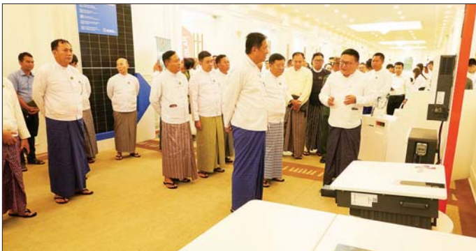
ဦးစွာ ပြည်ထောင်စုဝန်ကြီးက Solar စနစ်ကို အသုံးပြုခြင်းအားဖြင့် ဟိုတယ်နှင့် တည်းခိုရိပ်သာလုပ်ငန်းများသည် မိမိတို့၏ စွမ်းအင်အသုံးစရိတ်

နေပြည်တော် မေ ၂၆ ပြည်ထောင်စုနယ်မြေ နေပြည်တော်အတွင်းရှိ ဟိုတယ်နှင့် တည်းခိုရိပ်သာလုပ်ငန်းများ Solar စွမ်းအင် တပ်ဆင် အသုံးပြုနိုင်ရေး အသိပညာပေးဆွေးနွေးပွဲနှင့် အရောင်းပြပွဲ အခမ်းအနားကို ယနေ့နံနက်ပိုင်းတွင် နေပြည်တော်ရှိ Hotel Max ၌ ကျင်းပသည်။ အခမ်းအနားသို့ ဟိုတယ်၊ ခရီးသွားလာရေးနှင့် ယဉ်ကျေးမှုဝန်ကြီးဌာန ပြည်ထောင်စုဝန်ကြီးဦးမောင်မြင့်၊ နေပြည်တော်စီမံခန့်ခွဲရေးဦးစီးဌာနမှ ဦးအေးထွန်းနှင့် ဦးမြိုးဇော်စိုး၊ နေပြည်တော်ကောင်စီဝင်များ၊ ဟိုတယ်ဆိုင်ရာ လုပ်ငန်းရှင်များအသင်း (နေပြည်တော်စုန်) မှ ဥက္ကဋ္ဌနှင့် တာဝန်ရှိသူများ၊ Solar ကုမ္ပဏီများနှင့် တက်ရောက်မှု ကိုယ်စားလှယ်များနှင့် ဟိုတယ်နှင့် တည်းခိုရိပ်သာလုပ်ငန်းရှင်များ တက်ရောက်ကြသည်။