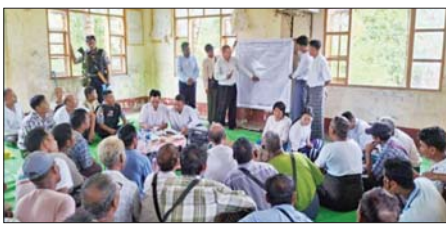
ထိုသို့ ဆွေးနွေးပွဲတွင် ဘိုကလေးမြို့နယ် ဆည်မြောင်းနှင့် ရေအသုံးချမှုစီမံခန့်ခွဲရေးဦးစီးဌာနက ဒေါင့်ကြီးအရှေ့ကျွန်းပတ်တာ ဧရိယာအတွင်း လာမည့်နှစ်စပါးစိုက်ပျိုးရာသီတွင် နွေသီးထပ် ဧက ၁၄၀၀ မှ ဧက ၂၀၀၀ အထိ စတင်စိုက်ပျိုးနိုင်ရေး သပြေထွန်း

ဘိုကလေး မေ ၂၆ ဘိုကလေးမြို့နယ်ရှိ ဒေါင့်ကြီးအရှေ့ကျွန်းပတ်တာ အတွင်း လာမည့်နှစ် နွေစပါး စိုက်ပျိုးရာသီတွင် နွေသီးထပ် စတင်စိုက်ပျိုးနိုင်ရေးအတွက် ဒေသပြည်သူများ တွေ့ဆုံဆွေးနွေးပွဲကို မေလတတိယပတ်က ရေကျော်တိုင်းကျေးရွာဘုန်းတော်ကြီးကျောင်းနှင့် ကန်ကြီးကျေးရွာ အခြေခံပညာ အလယ်တန်းကျောင်း၌ ပြုလုပ်သည်။