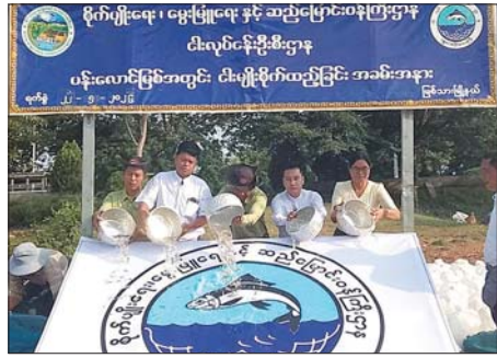
မြစ်သားမြို့နယ်၌ ပန်းလောင်မြစ်အတွင်း ငါးမျိုးစိုက်ထည့်

အမှတ်(၁၂) အခြေခံပညာ အထက်တန်းကျောင်းရှိ ပညာရတနာခန်းမ၌ ကျင်းပရာ နေပြည်တော်ကောင်စီဝင် ဦးထွန်းထွန်းနှင့် တာဝန်ရှိသူများ၊ မြို့နယ် ပညာရေးမှူးနှင့် ကျောင်းအုပ်ဆရာကြီး ဆရာမကြီးများ၊ ကျောင်းသားမိဘများနှင့် ကျောင်းသား ကျောင်းသူများ တက်ရောက်ကြသည်။