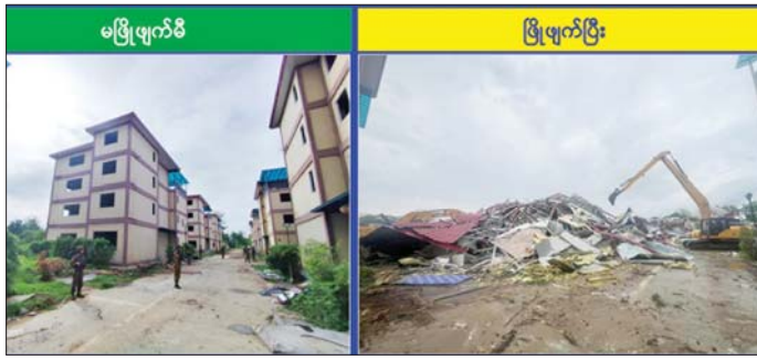
ကရင်ပြည်နယ် မြဝတီခရိုင် ရွှေကျက်လီဒေသ တရားမဝင်အဆောက်အအုံများ လုပ်ကိုင်ခဲ့သော လေးထပ်အဆောက်အအုံအား မဖြိုဖျက်မီနှင့် မဖြိုဖျက်ပြီးစီးမှုကို တွေ့ရစဉ်။

နိုင်ငံတော်အနေဖြင့် Online Scam Center လုပ်ငန်းများတွင် ပါဝင်ပတ်သက်နေသူများနှင့် နောက်ကွယ်မှကြိုးကိုင်သော နိုင်ငံခြား သားများကို ဖော်ထုတ်ဖမ်းဆီးပြီး ထိထိရောက်ရောက် ပြင်းပြင်းထန်ထန် အရေးယူနိုင်ရေး အိမ်နီးချင်းနှင့် ဒေသတွင်းနိုင်ငံများ၊ နိုင်ငံတကာအဖွဲ့ အစည်းများနှင့် တက်ကြွစွာ ပူးပေါင်းဆောင်ရွက်လျက်ရှိသည့်အပြင် အကြောင်းအမျိုးမျိုးကြောင့် ဒုက္ခရောက်နေကြသော နိုင်ငံခြားသားများ နှင့် လူကုန်ကူးခံရသည့် နိုင်ငံခြားသားများကို သက်ဆိုင်ရာနိုင်ငံများသို့ အမြန်ဆုံး ပြည်ပနိုင်ငံသားပေးနိုင်ရေး ထိရောက်စွာညှိနှိုင်းဆောင် ရွက်လျက်ရှိကြောင်း သတင်းရရှိသည်။ သတင်းစဉ်