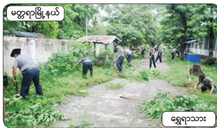
မတ္တရာမြို့နယ်