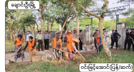
ချောင်းဦးမြို့