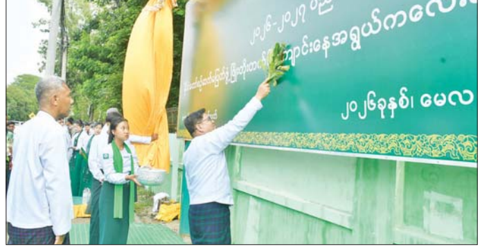
ပညာ မြင့်မှ လူမျိုး တင့်မည်

ထို့နောက် တိုင်းဒေသကြီးအစိုးရအဖွဲ့ရုံး အစည်းအဝေးခန်းမ၌ကျင်းပသည့် သဘာဝကာကွယ်ရေး လုပ်ငန်းညှိနှိုင်းအစည်းအဝေးသို့ တက်ရောက်အမှာစကားပြောကြားပြီး အစည်းအဝေး တက်ရောက်လာသူများ၏ ဆွေးနွေးတင်ပြမှုများအပေါ် ဖြည့်ဆည်းပေါင်းစပ် ဆောင်ရွက်ပေးခဲ့ကြောင်း သိရသည်။ တိုင်းဒေသကြီး(ပြန်/ဆက်)