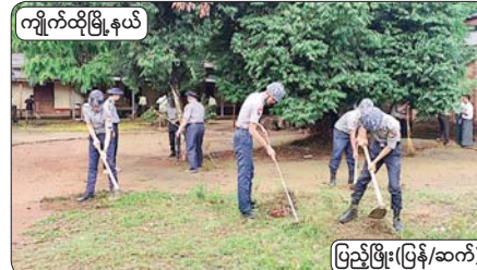
ကျိုက်ထိုမြို့နယ်