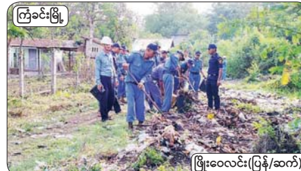
ကြံခင်းမြို့