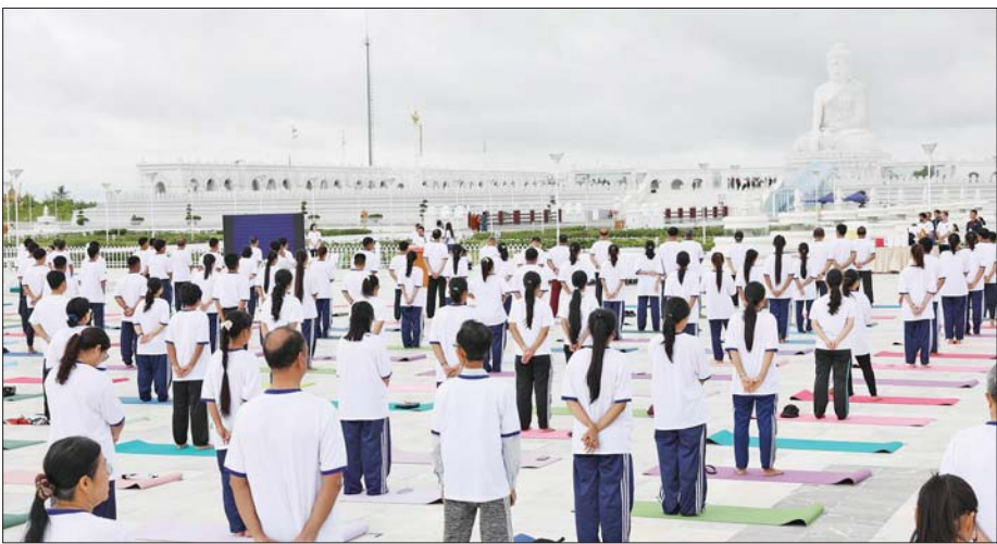
ဒုတိယသမ္မတ ဦးညိုစော (၁၂) ကြိမ်မြောက် အပြည်ပြည်ဆိုင်ရာယောဂနေ့အထိမ်းအမှတ် ယောဂသရုပ်ပြ စုပေါင်းလေ့ကျင့်ခြင်း အခမ်းအနားတွင် အမှာစကားပြောကြားစဉ်။

ထို့နောက် ဒုတိယသမ္မတ ဦးညိုစောက မြန်မာ-အိန္ဒိယ နှစ်နိုင်ငံအကြား ချစ်ခင်ရင်းနှီးသောဆက်ဆံရေးကို အခြေပြု၍ ပြည်ထောင်စုသမ္မတမြန်မာနိုင်ငံတော် နိုင်ငံတော်အကြီးအကဲ၏ ခွင့်ပြုမှုနှင့် အိန္ဒိယသံရုံး၏ စီစဉ်ဆောင်ရွက်မှုဖြင့် မြန်မာနိုင်ငံ၌ ၂၀၂၄ ခုနှစ်နှင့် ၂၀၂၅ ခုနှစ်တို့တွင် အပြည်ပြည်ဆိုင်ရာယောဂနေ့ အခမ်းအနားများကို စာမျက်နှာ ၅ ကော်လံ ၁ ❖