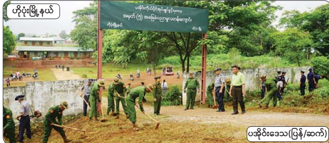
ဟိုပုံးမြို့နယ်