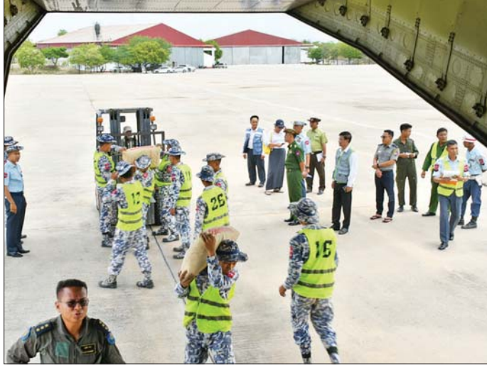
ချင်းသောင်းကျန်းသူများကြောင့် ထိခိုက်ပျက်စီးခဲ့သော ဖလမ်းမြို့၊ တီးတိန်မြို့နှင့် တွန်းဇံမြို့တို့၌ ပြန်လည်ထူထောင်ရေးဆောင်ရွက်ရာတွင် လိုအပ်သောတည်ဆောက်ရေးနှင့်ထောက်ပံ့ရေးပစ္စည်းများ တပ်မတော်လေယာဉ်များဖြင့် ပို့ဆောင်နေမှုကို တွေ့ရစဉ်။

သွပ်ရိုက်သံ ၁၂၀ ပိဿာကျော်နှင့် ကယ်ဆယ်ထောက်ပံ့ပစ္စည်း ၃ တန်းကျော်တို့ကို ပေးပို့ခဲ့ပြီး သက်ဆိုင်ရာမြို့နယ်များသို့ ဆက်လက်ဖြန့်ခွဲထောက်ပံ့သွားမည်ဖြစ်ကြောင်း၊ ဒေသ၏ လိုအပ်ချက်များအပေါ် မူတည်ပြီး ပြည်ဆည်းပေးနိုင်ရေး စဉ်ဆက်မပြတ် ဆောင်ရွက်သွားမည် ဖြစ်ကြောင်း သိရသည်။ ဇနည်ကိုကို(ပြန်/ဆက်)