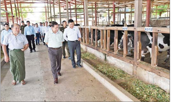
နိုင်ငံတော်သမ္မတ ဦးမင်းအောင်လှိုင် အမှတ်(၁) ကကြီးမွေးမြူရေးဇုန်ရှိ ဖန်ဟုနို့စားခွားမွေးမြူရေးခြံ၌ နို့စားခွားနှင့် ခွားသားပေါက်များ မွေးမြူထားရှိမှု ကြည့်ရှုစစ်ဆေးစဉ်။

ရေ၊ အသားထုတ်လုပ်မှုစနစ်တကျဖြစ်စေရေး စီမံဆောင်ရွက်သွားရန်နှင့် အသားထုတ်လုပ်မှုအပြင် ဆိတ်သားရေကိုလည်း ဈေးကွက်သို့ ပြန်ဖြူးသွားနိုင်ကြောင်း၊ မိမိတို့အား ခွင့်ပြုပေးထားသည့် မြေဧရိယာအတွင်း ဆိတ်အစာ နေဗီယာမြက်များ အပြင် ဆီးပင်များကိုလည်းထည့်သွင်းစိုက်ပျိုး၍ ဆီးသီးခြောက်ဖတ်များကို ကျွေးမွေးနိုင်မည်ဖြစ်ကြောင်း၊ ဆိတ်အစာမြက် စိုက်ပျိုးရာ၌ စဉ်ဆက်မပြတ်သည့် စိုက်ပျိုးထုတ်လုပ်မှုစနစ်ဖြစ်စေရေးအတွက်လည်း စနစ်တကျတွက်ချက်စိုက်ပျိုးသွားရန်လိုကြောင်းနှင့် အခြားလိုအပ်သည်များကို လမ်းညွှန်မှာကြားသည်။ ထို့နောက် ရွှေမြို့မွေးမြူရေးဇုန်အတွင်းရှိ နယ်မြေခံတပ်ရင်း၊ ဝက်မွေးမြူရေးခြံသို့ ရောက်ရှိ