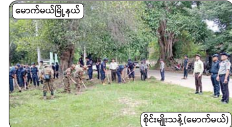
မောက်မယ်မြို့နယ်