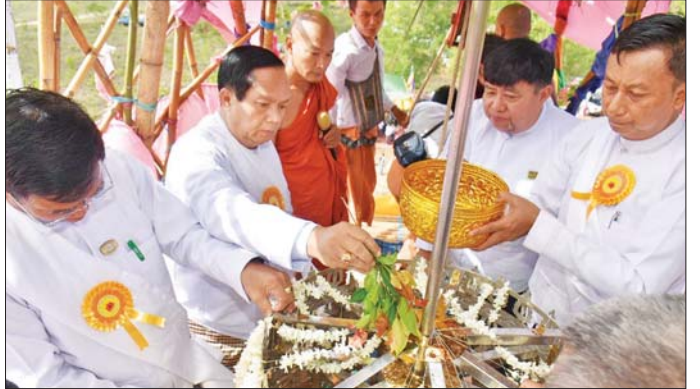
ပက်ဖျန်းပေးသည်။ ထို့နောက် နိုင်ငံတော်သံဃမဟာနာယက အဖွဲ့ဝင်အလယ်တော်ရဆရာတော်ဘဒ္ဒန္တပညာသီဟထံမှ ငါးပါးသီလခံယူဆောင်တည်ကြပြီး လှူဖွယ်ဝတ္ထုပစ္စည်းများ ဆက်ကပ်လှူဒါန်းကာ အနုမောဒနာ တရားများနာကြား၍ လှူဒါန်းမှုအစုစုအတွက် ရေစက်သွန်းချအမျှပေးပေးပြီး ဆရာတော်သံဃာတော်အရှင်သူမြတ်များအား နေ့ဆွမ်းဆက်ကပ်လှူဒါန်းခဲ့ကြောင်း သိရသည်။ တိုင်းဒေသကြီး(ပြန်/ဆက်)

အမွေးနံ့သာရည်ပက်ဖျန်းစဉ်တွင် ထီးတော်ဘုံအဆင့်ဆင့်နှင့် ဆတ်သွားဖူး၊ ငှက်မြတ်နားတော်၊ စိန်ဖူးတော်အား ပန်းရထားဖြင့်ပင့်ဆောင်ဆက်ကပ်လှူဒါန်း၍ ထီးတော်တင်ကြပြီး ကျောက်စာတိုင် ဖွင့်လှစ်ခြင်း အခမ်းအနားကို ဆက်လက်ပြုလုပ်ရာ တိုင်းဒေသကြီးဝန်ကြီးချုပ်က ကမ္ဘာ့ဗုဒ္ဓဘာသာတော်တော်ကျော်စာတိုင်အား စက်ခလုတ်နှိပ်ဖွင့်လှစ်ပေးကာ အမွေးနံ့သာရည်များ