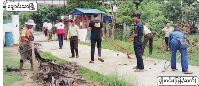
ချောင်းသာမြို့