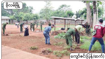
ခိုလမ်းမြို့