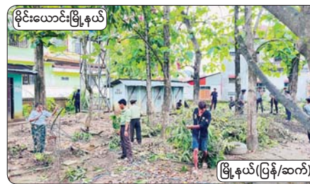
မိုင်းယောင်းမြို့နယ်