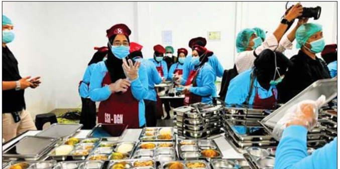
ခြင်းနှင့် ဖြန့်ဝေဆောင်ရွက်ခြင်းတို့တွင် လုပ်သား ကြောင်း သိရသည်။ ပေါင်း ၁ ဒသမ ၂၈ သန်းဖြင့် လုပ်ကိုင်ဆောင်ရွက်ရ ဆင်ဟွာ

အကျိုးခံစားခွင့်ရှိသူများအနက် ကျောင်းသား ကျောင်းသူများ အများဆုံးဖြစ်ပြီး စုစုပေါင်း ၄၈ ဒသမ ၃၅ သန်းရှိကြောင်း၊ ယင်းပမာဏမှာ အင်ဒိုနီးရှားတစ်နိုင်ငံလုံးရှိ ကျောင်းသား ကျောင်း သူစုစုပေါင်း၏ ၇၆ ဒသမ ၁ ရာခိုင်နှုန်းအထိရှိကြောင်း အဆိုပါ အေဂျင်စီက ပြောသည်။ ၂၀၂၅ ခုနှစ် ဇန်နဝါရီ ၆ ရက်တွင်စတင်ခဲ့သော အဆိုပါအစီအစဉ် သည် အင်ဒိုနီးရှားနိုင်ငံတစ်ဝန်းရှိ လုပ်ငန်းလည်ပတ် သော အာဟာရဆိုင်ရာ ဝန်ဆောင်မှုဌာနပေါင်း ၂၉၀၀၀ ခန့်မှတစ်ဆင့် ထမင်းအနပ်ပေါင်း ၈ ဒသမ ၃ ဘီလီယံအထိ ဖြန့်ဝေပေးခဲ့ပြီးဖြစ်ကြောင်း သိရသည်။ အချက်အလက်များအရ ယင်းအစီအစဉ်သည် စာသင်ကျောင်းပေါင်း ၃၇၀၀၀၀ ကျော်အထိ အကျိုး ခံစားခွင့်ရှိကြောင်း၊ အစားအစာပြင်ဆင်ချက်ပြုတ်