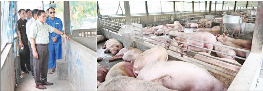
နိုင်ငံတော်သမ္မတ ဦးမင်းအောင်လှိုင် ရွှေမြို့မွေးမြူရေးဇုန်ရှိ နယ်မြေခံတပ်ရင်း ဝက်မွေးမြူရေးခြံ၌ အသားတိုးဝက်များမွေးမြူထားမှုကို ကြည့်ရှုစစ်ဆေးစဉ်။

ထို့နောက် ဦးတင်မြိုင်၏ အသားတိုးဝက်ခြံသို့ ရောက်ရှိပြီး လုပ်ငန်းအကောင်အထည်ဖော်ဆောင်ရွက်နေမှုအခြေအနေများကို လိုက်လံကြည့်ရှုစစ်ဆေးရာ တာဝန်ရှိသူတစ်ဦးက လိုက်လံရှင်းလင်းတင်ပြပြီး နိုင်ငံတော်သမ္မတက သိရှိလိုသည်များနှင့် လိုအပ်သည်များ ပြန်လည်အကြံပြုမှာကြားသည်။ ထို့နောက် ရှင်းလင်းဆောင်ခန်းမတွင် နေပြည်တော်ကောင်စီဥက္ကဋ္ဌ ဦးကျော်စွာနှင့် နေပြည်တော်ကောင်စီနယ်မြေအတွင်း၌ ကြီးမွေးမြူရေးဇုန်၊ ရွှေမြို့မွေးမြူရေးဇုန်၊ ပြောင်ခေါင်းကြီး မွေးမြူရေးဇုန်တို့အား အကောင်အထည်ဖော်ဆောင်ရွက်လျက်ရှိမှု၊ ဇုန်အလိုက်မွေးမြူရေးလုပ်ငန်းများဆောင်ရွက်လျက်ရှိမှု၊ သတ်မှတ်ကောင်ရေပြည့်မီအောင် မွေးမြူနိုင်ရေး၊ ကူးတော်ရောဂါဖြစ်ပွားမှုမရှိစေရေး ကြီးကြပ်ဆောင်ရွက်လျက်ရှိမှု၊ မေထုန့်မဲ့နည်းဖြင့် မျိုးမြှင့်ဆောင်ရွက်ပေးလျက်ရှိမှုနှင့် ဆက်လက်ဆောင်ရွက်သွားမည့်အခြေအနေများနှင့်ပတ်သက်၍ ရှင်းလင်း