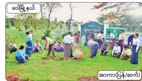
ဝေါမြို့နယ်