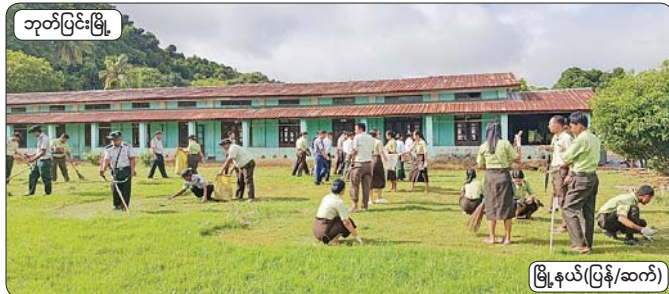
ဘုတ်ပြင်းမြို့