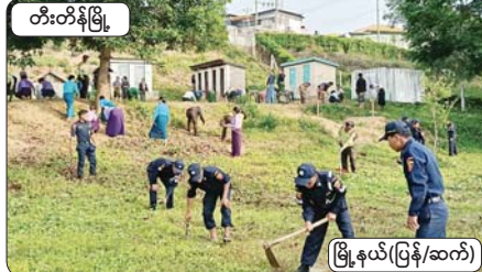
တီးတိန်မြို့

နေပြည်တော် မေ ၂၄ နိုင်ငံတစ်ဝန်းရှိ ကျောင်းများ ပြန်လည်ဖွင့်လှစ်ချိန်တွင် ကျောင်းသား ကျောင်းသူများ စိတ်အေးချမ်းသာစွာ ပညာသင်ကြားနိုင်ရေးနှင့် ကျောင်းပတ်ဝန်းကျင်သန့်ရှင်းသာယာလှပစေရေးအတွက် မေ ၂၃ ရက် နံနက်ပိုင်းက ခရိုင်/မြို့နယ်စီအုပ်ချုပ်ရေးအဖွဲ့၊ ဥက္ကဋ္ဌနှင့် အဖွဲ့ဝင်များ၊ မြို့နယ်အဆင့်ဌာနဆိုင်ရာ တာဝန်ရှိသူများနှင့် ဝန်ထမ်းများ၊ တစ်မတော်သားများ၊ မြန်မာနိုင်ငံရဲတပ်ဖွဲ့၊ မြို့နယ်မီးသတ်တပ်ဖွဲ့၊ မြို့နယ်မိခင်ကလေးစောင့်ရှောက်ရေးအသင်းနှင့် မြို့နယ်အမျိုးသမီးရေးရာအဖွဲ့ဝင်များ ပူးပေါင်း၍ သစ်ပင်၊ သစ်ကိုင်များ ခုတ်ထွင်ရှင်းလင်းခြင်း၊ ချုံပင်၊ နွယ်ပင်နှင့် မြက်ပင်များ ရှင်းလင်းခြင်း၊ တံမြက်စည်းလှည်းခြင်း၊ အမှိုက်သိုက်များရှင်းလင်းပေးခြင်းနှင့် မြို့နယ်စည်ပင်သာယာရေးအဖွဲ့မှ အမှိုက်သယ်ယာဉ်ဖြင့် အမှိုက်များ သယ်ယူစွန့်ပစ်ပေးခြင်းတို့ကို စုပေါင်းဆောင်ရွက်ခဲ့သည်။