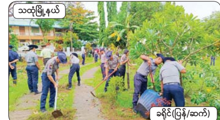
သထုံမြို့နယ်