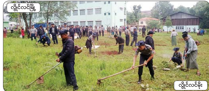
လှိုင်လင်မြို့