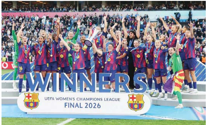
ချန်ပီယံလိဂ်ဖလား ဆွတ်ခူးရရှိပြီးနောက် ဘာစီလိုနာအမျိုးသမီးအသင်း အောင်ပွဲခံစဉ်။

ကျဆင်းလာကာ သွင်းဂိုးများ ဆက်တိုက်ခွင့်ပြုပေး ခဲ့ပြီး ဂိုးပြတ်ရှုံးပွဲကြုံတွေ့ခဲ့ခြင်း ဖြစ်သည်။ ဘာစီ လိုနာအသင်းသည် ပြီးခဲ့သည့်ရာသီတွင် ချန်ပီယံ လိဂ်ပြိုင်ပွဲ နောက်ဆုံးဖိုလ်လွပွဲသို့ တက်လှမ်းနိုင် ခဲ့သော်လည်း အာဆင်နယ်အသင်းကို အံ့အား သင့်ဖွယ် ရှုံးနိမ့်ခဲ့သောကြောင့် ဖလားဆွတ်ခူးခွင့် လွဲချော်ခဲ့ရသည်။ လိုင်ယွန်အသင်းသည် ၂၀၁၆ ခုနှစ်နှင့် ၂၀၂၀ ပြည့်နှစ်အတွင်း ချန်ပီယံလိဂ်ဖလားကို ၄ကြိမ် ဆွတ်ခူးရရှိထားသည်။