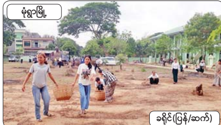
ခုံရွာမြို့