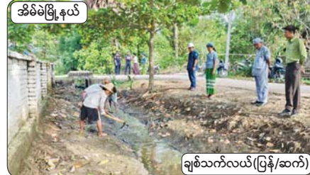
ဆိမ်မိမြို့နယ်