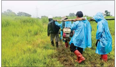
လျှပ်စစ်နှင့် စွမ်းအင်ဝန်ကြီးဌာန ဝန်ထမ်းများက ရာသီအချိန်မရွေး လျှပ်စစ်ဓာတ်အားစနစ် ပြင်ဆင်နေမှုများကို တွေ့ရစဉ်။