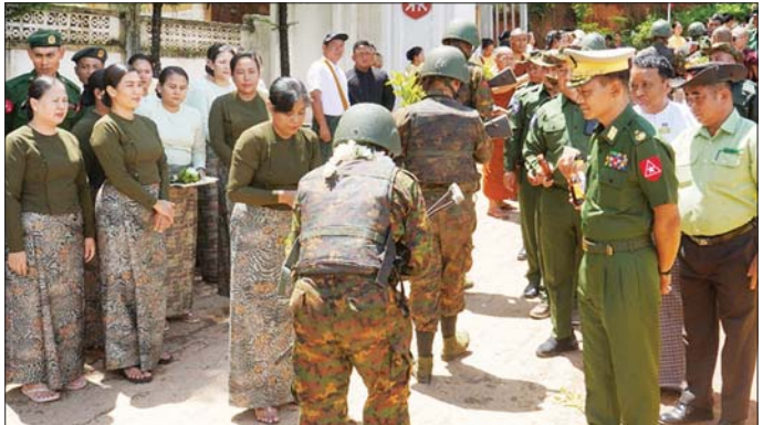
အောင်ပွဲရေတန်းပြန် တပ်မတော်သားများနှင့်အတူ သတင်းရရှိသည်။ အထူးနေ့လယ်စာကို သုံးဆောင်ခဲ့ကြကြောင်း သတင်းစဉ်

တိုင်းဒေသကြီးနှင့် ပြည်နယ်အသီးသီးရှိ တိုင်းရင်းသားပြည်သူများ စိတ်အေးချမ်းသာစွာ နေထိုင်လုပ်ကိုင်စားသောက်နိုင်ရေးနှင့် အသက်အိုးအိမ်စည်းစိမ်ဥစ္စာ လုံခြုံမှုရှိစေရေး၊ နိုင်ငံတော်တည်ငြိမ်ရေး၊ နယ်မြေအေးချမ်းရေးအတွက် ရှေ့တန်းစစ်မျက်နှာများတွင် စစ်ဆင်ရေးတာဝန်များကို နေ့မအားညမနား စွမ်းစွမ်းတစ် တာဝန် ထမ်းဆောင်ခဲ့သော ရှေ့တန်းပြန်တပ်မတော်သားများအား တိုင်းမှူးနှင့် တက်ရောက်လာကြသူများက အောင်သပြေခက်များဖြင့်လည်းကောင်း၊ တိုင်းရင်းသားရိုးရာ အတီး၊ အမှုတ်၊ အက၊ အခုန်များဖြင့်လည်းကောင်း ဝမ်းမြောက်စွာ သောင်းသောင်းဖြဖြ ကြိုဆို ဂုဏ်ပြုခဲ့ကြပြီး တိုင်းမှူးက အောင်ပွဲရေတန်းပြန် တပ်မတော်သားများအား ဂုဏ်ပြုအမှာစကား ပြောကြားကာ ဂုဏ်ပြုချီးမြှင့်ပေး အပ်သည်။ ထို့နောက် တိုင်းမှူးနှင့်တာဝန်ရှိသူများက