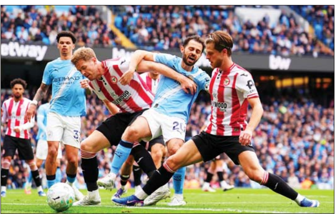
မန်စီးတီးအသင်းကွင်းလယ်ကစားသမား ဘာနာဒိုဆေးဗားလ်၏ ထိုးဖောက်တိုက်စစ်ဆင်မှုကို တရန့်ဖို့ဒီအသင်းကစားသမားများ ဟန့်တားရန် ကြိုးပမ်းစဉ်။

ယနေ့ပွဲတွင် ဂျီဂျူအာဗန်အနေဖြင့် ပြိုင်ဘက်ဖြစ်သူ တက်ဆူရိုတိုင်ရာ၏ ချုပ်ကွက်များကို ရုန်းထွက်နိုင်ခဲ့ပြီး ၎င်း၏အားပြင်းတိုက်သော လက်သီးချက်များဖြင့် ပြိုင်ဘက်ကို ဖိအားပေးထိုးသတ်ကာ ထိုက်ထိုက်တန်တန် အနိုင်ရရှိခဲ့ခြင်းဖြစ်ပြီး အသက်(၂၄)နှစ်အရွယ် ဂျီဂျူအာဗန်သည် ပဉ္စမအချိန်တွင် ပြိုင်ဘက်အား အလဲထိုးအနိုင်ယူခဲ့ကာ ချန်ပီယံခါးပတ်ကို ပထမဆုံးအကြိမ် ကာကွယ်နိုင်ခဲ့ခြင်းဖြစ်သည်။ ယူအက်ဖ်စီတွင် ဒုတိယအသက်အငယ်ဆုံး ချန်ပီယံဂျီဂျူအာဗန်အနေဖြင့် လက်ရှိတွင် ယှဉ်ပြိုင်နိုင်ခဲ့မှုအားဖြင့် ၁၁ ပွဲထိုးသတ်ထားပြီး ၁၀ ပွဲနိုင်၊ တစ်ပွဲရှုံးမှတ်တမ်းကို ပိုင်ဆိုင်ထားသူလည်းဖြစ်ကြောင်း သတင်းရရှိရသည်။