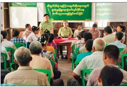
လိုသည့်ဆေးမြန်းမှုများကို ဒုတိယ မြေကြားခွဲကြောင်း သိရသည်။ ဦးစီးမှူးက ပြန်လည်ရှင်းလင်း မြို့နယ်(ပြန်/ဆက်)

ဥက္ကဋ္ဌ ဦးမင်းနိုင်ထွန်းက ဆီထွက်သီးနှံနေကြာနှင့် ပျားမွေးမြူရေး တွဲဖက်လုပ်ကိုင်ရန်နှင့် သီးနှံအထွက်တိုးရေး အချက်များကို ရှင်းလင်းပြောကြားသည်။ ထို့နောက် မြို့နယ်စိုက်ပျိုးရေးဦးစီးဌာနနှင့် မွေးမြူရေးနှင့် ကုသရေးဦးစီးဌာနမှ တာဝန်ရှိသူများက ဝတ်မှုန်ကူးခြင်းဆိုင်ရာ အသိပညာများ ပျားမွေးမြူခြင်းဆိုင်ရာ အသိပညာများကို ရှင်းလင်းပြောကြားကာ တက်ရောက်လာကြသည့် တောင်သူများ၏ သိရှိ