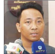
ကိုစိုးဝေလွင်