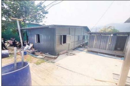
တာချီလိတ်မြို့၊ ပန်ကူကျေးရွာအနီး အွန်လိုင်းလိမ်လည်လောင်းကစားမှုကျူးလွန်ရာတွင် အသုံးပြုသည့် ဆက်စပ်ပစ္စည်းများအား တွေ့ရစဉ်။

မြန်မာနိုင်ငံအစိုးရအနေဖြင့် အွန်လိုင်း လိမ်လည်မှုများနှင့် အွန်လိုင်းလောင်းကစားမှု တိုက်ဖျက်ရေး လုပ်ငန်းစဉ်များကို တက်ကြွစွာ ပူးပေါင်းဆောင်ရွက် လျက်ရှိသည့်အပြင် အကြောင်းအမျိုးမျိုးကြောင့် မြန်မာနိုင်ငံအတွင်းသို့ ရောက်ရှိနေပြီး အွန်လိုင်းလိမ်လည်လောင်းကစားမှုတွင် တစ်နည်းနည်းဖြင့် ပါဝင်ပတ်သက်နေသည့် ပြည်ပနိုင်ငံသားများကိုလည်း တရားဥပဒေနှင့်အညီ စစ်ဆေးကာ လူသားချင်းစာနာထောက်ထားမှုနှင့် နိုင်ငံအချင်းချင်း ချစ်ကြည်ရင်းနှီးမှုတို့ကို ရှေးရှု၍ သက်ဆိုင်ရာနိုင်ငံများသို့ ပြန်လည်လွှဲပြောင်းပေး