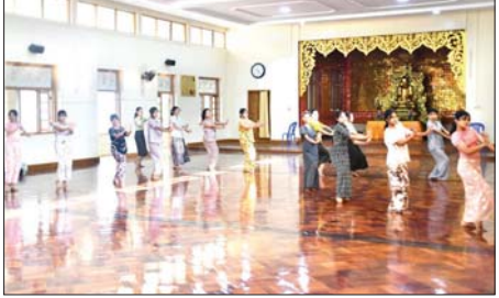
မြို့ပွဲအတွက် အကလေ့ကျင့်နေမှုများကို သွားရောက်ကြည့်ရှုများ၊ ဗဟိုမဏ္ဍပ်ဆောက်လုပ်နေမှုများ၊ အကပြိုင်ပွဲများ၊ သက်ကြီး