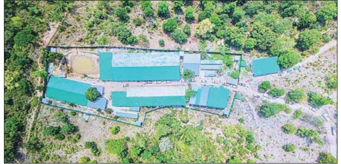
တာချီလိတ်မြို့၊ ပန်ကူကျေးရွာအနီး အွန်လိုင်းလိမ်လည်လောင်းကစားမှုကျူးလွန်ရာတွင် အသုံးပြုသည့် အဆောက်အအုံများအား တွေ့ရစဉ်။

ကျောပိုးမှ အန် ပေ ဂီဝ ရှိ အွန်လိုင်းလိမ်လည်လောင်းကစားမှုများ လုပ်ဆောင်သည့် အဆောင် တစ်လုံး၊ အလျားပေ ၂၀၀၊ အနံပေ ၆၀ ရှိ ချက်ပြုတ်/စားဆောင်အပူ လူနေအိပ်ဆောင် တစ်လုံးနှင့် လုပ်ငန်းလုပ်ဆောင်သည့် အဆောင် တစ်လုံး၊ အလျားပေ ၃၅၊ အနံပေ ၆၀ ရှိ စတုရန်းပုံ အဆောင် တစ်လုံး၊ အလျားပေ ၄၀၊ အနံပေ ၄၀ ပတ်လည် အိပ်ဆောင် နှစ်လုံး၊ အလျားပေ ၁၅၊ အနံပေ ၁၂ ပေရှိ ဂိတ် ဝင်/ထွက်ဆောင် တစ်လုံးနှင့် အလျားပေ ၆၀၊ အနံပေ ၄၀ ဝင်/ထွက်ဆောင် အဆောက်အအုံ တစ်လုံး စုစုပေါင်း အဆောက်