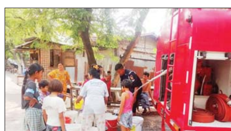
တစ်စီးနှင့် အောင်ပင်လယ် အရန် မီးသတ်စခန်းမှ မီးသတ်ယာဉ် တစ်စီး စုစုပေါင်းရေဂါလန် ၈၀၀၀ ခန့် အခမဲ့သွားရောက်လှူဒါန်းခဲ့ကြောင်း သိရသည်။ မြို့နယ်(ပြန်/ဆက်)

မန္တလေး ဧပြီ ၇ အပူချိန်မြင့်မားသည့် ကာလ သောက်သုံးရေ လွယ်ကူစေရေးအတွက် မန္တလေးတိုင်းဒေသကြီး ချမ်းမြသာစည်မြို့နယ် မီးသတ်စခန်းမှ တပ်ဖွဲ့ဝင်များသည် ၅၃ လမ်း၊ ၁၀၆x၀၇ လမ်းကြားအောင်ပင်လယ်ရပ်ကွက်အတွင်းရှိ နေအိမ်များသို့ သောက်သုံးရေများ လှူဒါန်းခြင်းကို ယနေ့ မွန်းတည့် ၁၂ နာရီက ဆောင်ရွက်ကြသည်။