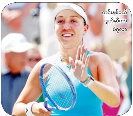
တင်းနစ်မယ် ဂျက်ဆီကာ ပဲဂူလာ

အမေရိကန် ထိပ်တန်းတင်းနစ်မယ် ဂျက်ဆီကာ ပဲဂူလာ သည် Charleston Open အမျိုးသမီးတစ်ဦးချင်းပြိုင်ပွဲ နောက်ဆုံးဗိုလ်လုပွဲတွင် ယူလီယာစတရာရီဒတ်ဆီဗာကို ၆-၂၊ ၆-၂ ရလဒ်ဖြင့် နိုင်ပွဲရရှိပြီးနောက် ကစားသမား ၁၀ ဆုဖလား ၁၁ လုံးအထိ ဆွတ်ခူးရရှိလာပြီဖြစ်သည်။ ပဲဂူလာသည် ယမန်နှစ် Charleston Open အမျိုးသမီးတစ်ဦးချင်းပြိုင်ပွဲ နောက်ဆုံးဗိုလ်လုပွဲတွင်လည်း တစ်နိုင်ငံတည်းသူ ဆိုဖီယာကီနင်ကို ၆-၃၊ ၇-၅ ရလဒ်ဖြင့် နိုင်ပွဲရရှိကာ ဖလားဆွတ်ခူးထားသည်။ ထို့ကြောင့် လက်ရှိချန်ပီယံ ပဲဂူလာသည် ပြိုင်ပွဲတစ်လျှောက်တွင် ပူတင်ဆီဗာ၊ အဲလစ်ဆာဘက်တာ၊ ရှနီကီဒါ၊ ဂျီဗစ်တို့ကို အဆင့်ဆင့်ကျော်ဖြတ်ကာ ဗိုလ်လုပွဲသို့ တက်လှမ်းလာသူ ဖြစ်သည်။ စာမျက်နှာ ၁၃ ကော်လံ ၅ ဇ