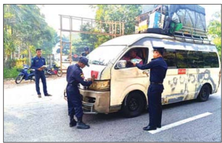
မီးဘေးလုံခြုံရေးပညာပေး လက်ကမ်းစာစောင်များ အသိပညာပေးဆောင်ရွက်လျက်ရှိကြောင်းသိရသည်။ ခမောက်ကြီး(ပြန်/ဆက်)

ခမောက်ကြီး မြို့ ၇ တနင်္သာရီတိုင်းဒေသကြီး ခမောက်ကြီးမြို့၌ မီးသတ်ဦးစီးဌာနက ပြည်သူများ မီးဘေးအန္တရာယ်မှ ကင်းဝေးနိုင်စေရေးနှင့် မီးလောင်ကျွမ်းမှု မဖြစ်ပေါ်စေရေးအတွက်ရည်ရွယ်၍ ယမန်နေ့က ခမောက်ကြီးမြို့၌ အသိပညာပေးလက်ကမ်းစာစောင် ဖြန့်ဝေသည်။ အဆိုပါအသိပညာပေးဆောင်ရွက်ရာတွင် အထွေထွေအုပ်ချုပ်ရေးဦးစီးဌာန၊ မီးသတ်ဦးစီးဌာန၊ ရဲတပ်ဖွဲ့ ဝင်များနှင့် ပြန်ကြားရေးနှင့် ပြည်သူ့ဆက်ဆံရေးဦးစီးဌာနတို့ ပူးပေါင်း၍ မြို့ပေါ်ရပ်ကွက်များရှိ မော်တော်ဆိုင်ကယ်၊ မော်တော်ကား၊ စီးနင်းမောင်းနှင်သူများ၊ ခရီးသွားလာနေသူများ၊ ဒေသခံပြည်သူများအား မီးသတ်ဦးစီးဌာနမှ ထုတ်ဝေထားသည့်