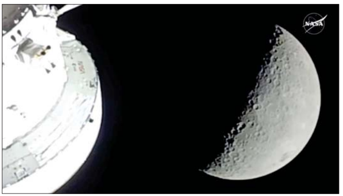
ဌာန၌ လက်ခုပ်ပြုဘာသာများ ဆူညံသွားခဲ့ကြောင်း သိရသည်။ မာရီ နာဆာ ဆောင်ရွက်သည့် ပုံသန်းမှူးရုံးစဉ်ဖြစ်ပြီး ၂၀၂၆ ခုနှစ်တွင် အာကာသယာဉ်မှူးများ လပေါ်သို့ ခြေချဆင်းသက်နိုင် မည်ဟု မျှော်မှန်းထားသည်။ အင်န်အီတီချီကေ

ဝါရှင်တန်၊ ဧပြီ ၇ - အမေရိကန်ဒီမိုကရေစီသမ္မတ အာကာသ ယာဉ်မှူးများသည် ကမ္ဘာမြေမှ အဝေးဆုံးအကွာအဝေးသို့ ရောက်ရှိသည့် ပထမဆုံး လူသားများအဖြစ် မှတ်တမ်းသစ် တင်နိုင်ခဲ့သည်။ ၎င်းတို့၏ အာကာသယာဉ်သည် လစာ အမှောင်ဘက်ခြမ်း (ကျောက်) ကို ဖြတ်သန်းခဲ့သည်။ (ကျောက်) ကို ဖြတ်သန်းသွားပြီးနောက် ထိုကဲ့သို့ မှတ်တမ်း တင်နိုင်ခဲ့ခြင်းဖြစ်သည်။ အာကာသယာဉ်မှူး လေးဦးကို တင်ဆောင်သွားသော Orion အာကာသယာဉ်မှာ မစ်ရှင်၏ ငါးရက်မြောက်နေ့တွင် လစာ ဆိုင်အေး သက်ရောက်သည့် နယ်ပယ်သို့ ဝင်ရောက်ခဲ့ပြီး နောက်တစ်ရက်တွင် Orion အာကာသယာဉ်မှာ လစာ နောက်ကျောဘက်ကို အပေါ်စီးမှ မာတီပုံများ၊ မီဒီယိုများ ရိုက်ယူခဲ့ကြကြောင်း သိရသည်။ အာကာသယာဉ်သည် လစာ တစ်ဖက်ခြမ်း ကျောက်ကို ဖြတ်သန်းနေသည့် အချိန်တွင် ကမ္ဘာမြေနှင့် ဆက်သွယ်ရေးခေတ္တ ပြတ်တောက်သွားဖွယ် ရှိသည့် ဟု ကြိုတင်ခန့်မှန်းထားခဲ့ပြီး ဆက်သွယ်မှုပြန်လည်ရရှိချိန်တွင် နာဆာ၏ မစ်ရှင်ထိန်းချုပ်ရေး