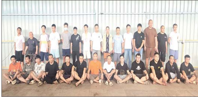
တာချီလိတ်မြို့၊ ပန်ကူကျေးရွာအနီး အွန်လိုင်းလိမ်လည်လောင်းကစားမှုလုပ်ငန်းများ လုပ်ကိုင်နေသည့် ပြည်ပနိုင်ငံသားများအား တွေ့ရစဉ်။