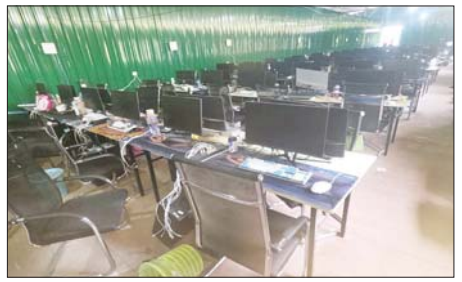
တာချီလိတ်မြို့၊ ပန်ကူကျေးရွာအနီး အွန်လိုင်းလိမ်လည်လောင်းကစားမှုကျူးလွန်ရာတွင် အသုံးပြုသည့် ဆက်စပ်ပစ္စည်းများအား တွေ့ရစဉ်။

ခြင်းများ၊ အဓိကပြစ်မှုကျူးလွန်ခြင်းများနှင့် တရားဥပဒေနှင့်အညီ ခဲ့သူများကိုလည်း ဖမ်းဆီး ထိရောက်စွာ အရေးယူခြင်းများ ထိန်းသိမ်းပြီး သက်ဆိုင်ရာစွဲစိမ်းဆောင်ရွက်လျက် ရှိကြောင်း အဖွဲ့ထံ တရားဝင်လွှဲပြောင်းပေး သတင်းရရှိသည်။ သတင်းစဉ်