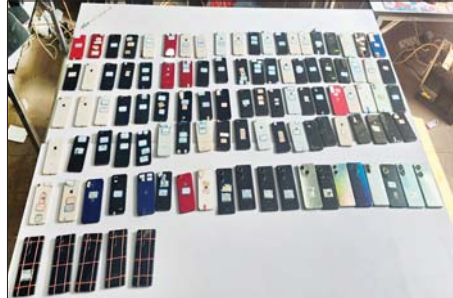
တာချီလိတ်မြို့၊ ပန်ကူကျေးရွာအနီး အွန်လိုင်းလိမ်လည်လောင်းကစားမှုကျူးလွန်ရာတွင် အသုံးပြုသည့် ဆက်စပ်ပစ္စည်းများအား တွေ့ရစဉ်။