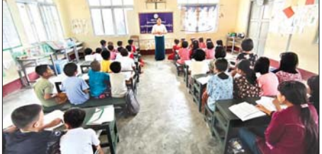
က လူငယ်များနှင့် စာပေအကျိုးတရားဆိုးကာကွယ်ရေးနှင့် လူငယ်ကျေးဇူး၊ မူးယစ်ဆေးဝါးအန္တရာယ်များ လိုက်နာရမည့် ကျင့်ဝတ်လပြည့်လင်း(ပြန်/ဆက်)

ပန်းတောင်း မြို့နယ်တွင် လူငယ်ရေးရာအသိပညာပေးဟောပြောပွဲလုပ်ငန်းများကို ယမန်နေ့ နံနက်ပိုင်းက အမက(လွန်) နတ်မောက်ကျောင်းရှိ မဓမ္မစကားသင်တန်းကျောင်း၌ ပြုလုပ်သည်။