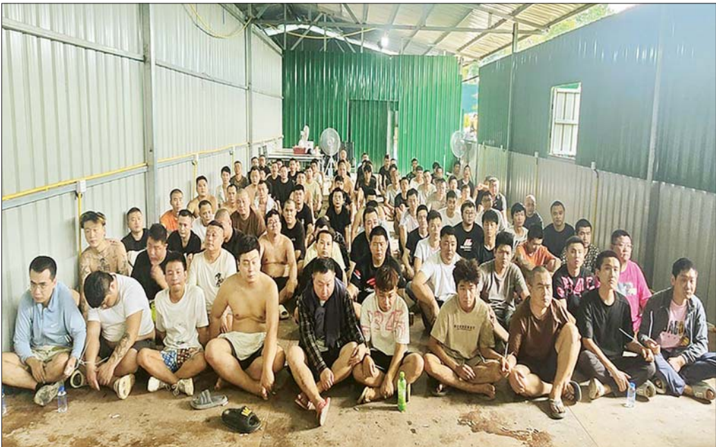
တာချီလိတ်မြို့ ပန်ကုကျေးရွာအနီး အွန်လိုင်းလိမ်လည်လောင်းကစားမှုလုပ်ငန်းများ လုပ်ကိုင်နေသည့် ပြည်ပနိုင်ငံသားများကို တွေ့ရစဉ်။

နေပြည်တော် ဧပြီ ၇ - နိုင်ငံတော်အစိုးရအနေဖြင့် နိုင်ငံတကာနှင့် တစ်ကမ္ဘာလုံးကို အန္တရာယ်ပေးနေသည့် အွန်လိုင်းလိမ်လည်လောင်းကစားမှုတို့ကိုဖျက်ရေးလုပ်ငန်းစဉ်များကို အမျိုးသားရေးတာဝန်တစ်ရပ်အဖြစ် ခံယူကာ မြန်မာနိုင်ငံအတွင်း လုံးဝအခြေမပြုနိုင်ရေးအတွက် ပြည်တွင်းအင်အားစုများအပြင် အိမ်နီးချင်းနိုင်ငံ အစိုးရများနှင့်လည်း ပေါင်းစပ်ညှိနှိုင်း၍ တက်ကြွစွာဆောင်ရွက်လျက်ရှိရာ ယနေ့ မွန်းလွဲပိုင်းတွင် ရှမ်းပြည်နယ် (အရှေ့ပိုင်း) တာချီလိတ်မြို့နယ်အတွင်း၌ အွန်လိုင်းလိမ်လည်လောင်းကစားမှုများ လုပ်ကိုင်နေသည့် ပြည်ပနိုင်ငံသား ၁၂၆ ဦးကို လုပ်ငန်းလုပ်ကိုင်ရာတွင် အသုံးပြုသည့် ပစ္စည်းများနှင့်အတူ ဖမ်းဆီးရမိခဲ့ကြောင်း သိရှိရသည်။ ရှမ်းပြည်နယ် (အရှေ့ပိုင်း) တာချီလိတ်မြို့နယ်အတွင်း၌ အွန်လိုင်းလိမ်လည်လောင်းကစားမှုလုပ်ငန်းများ လုပ်ဆောင်နေကြောင်း သတင်းအရ လုံခြုံရေး တပ်ဖွဲ့ဝင်များပါဝင်သော ပူးပေါင်းအဖွဲ့က သွားရောက်စစ်ဆေးရာ ယနေ့ မွန်းလွဲ ၁ နာရီ မိနစ် ၃၀ ခန့်တွင် တာချီလိတ်မြို့၏ အနောက်မြောက်ဘက် မီတာ ၃၀၀၀ ခန့်အကွာ၊ ပန်ကုကျေးရွာ၏ အနောက်တောင်ဘက် မီတာ ၃၀၀၀ ခန့်အကွာ နေရာသို့အရောက်၌ သွပ်မိုး၊ သွပ်ကာ၊ သုံးထပ်သားပြားခင်း အဆောင်များဖြစ်သည့် အလျားပေ ၁၂၀၊ စာမျက်နှာ ၁၅ ကော်လံ ၁ ဇ