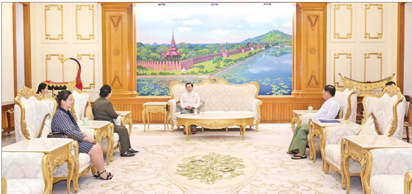
ပြည်ထောင်စုသမ္မတ မြန်မာနိုင်ငံတော် ရွေးကောက်တင်မြောက်ခြင်းခံရသော သမ္မတ၊ နိုင်ငံတော်လုံခြုံရေးနှင့် အေးချမ်းသာယာရေးကော်မရှင်ဥက္ကဋ္ဌ ဗိုလ်ချုပ်မှူးကြီး မင်းအောင်လှိုင်နှင့် မြန်မာနိုင်ငံဆိုင်ရာ တရုတ်ပြည်သူ့သမ္မတနိုင်ငံ သံအမတ်ကြီး H.E. Ms. Ma Jia တို့ တွေ့ဆုံဆွေးနွေးစဉ်။