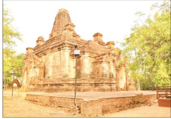
ဘက်တွင် ဆူးလေကုန်းဘုရားစု၊ အလို တစ်စပ်တည်း ဖူးမြော်လေ့လာနိုင် တော်ပြည့်ဘုရားတို့ကိုလည်း တစ်ဆက် ကြောင်း သိရသည်။ ဒီပါလင်း

များကို မင်စာနှင့်တကွ ရေးထိုးထားသည်ကို လေ့လာနိုင်သည်။ ပုဂံရှေးဟောင်းယဉ်ကျေးမှုနယ်မြေတွင် ဘုရား၊ စေတီ၊ သာသနိကအဆောက်အအုံ ၃၃၇၇ ဆူ ကျန်ရှိနေသေးကြောင်း၊ ညောင်ဦးမြို့နယ်၌ ဝက်ကြီးဂူပြောက်ကြီး၊ ဂူပြောက်လေး၊ ပုဂံမြို့သစ်၊ မြင်းကပါဂူပြောက်ကြီး၊ ဂူပြောက်လေးဘုရားတို့သည် နံရံဆေးရေးပန်းချီ လက်ရာကောင်းမွန်ကြကြောင်း၊ ဝက်ကြီးအင်းဂူပြောက်ကြီးဘုရား အနောက်ဘက်တွင် ရှင်ဘိုမယ်အုတ်ကျောင်း၊ ဝက်ကြီးအင်းဂူပြောက်လေးဘုရား၊ အနောက်တောင်