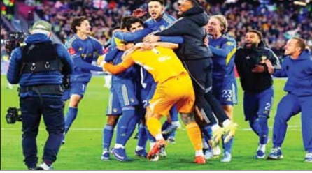
နစ်ပေါင်း ၃၉ နှစ်အတွင်း အက်ဖ်အေဖလားပြိုင်ပွဲ ဆီမီးဖိုင်နယ်သို့ ပထမဆုံးအကြိမ် တက်လှမ်းနိုင်ခဲ့သည့် လိဒ်။

အက်ဖ်အေဖလားပြိုင်ပွဲ ကွာတားဖိုင်နယ်ပွဲစဉ်များ ယှဉ်ပြိုင်ကစား ပြီးနောက် ဆီမီးဖိုင်နယ်ပွဲစဉ်များကို မဲခွဲထုတ်ပြန်လိုက်ပြီဖြစ်ရာ နစ်ပေါင်း ၃၉ နှစ်အတွင်း ဆီမီးဖိုင်နယ်သို့ ပထမဆုံးအကြိမ် တက်လှမ်း နိုင်ခဲ့သည့် လိဒ်အသင်းက အသင်းကြီး ချယ်ဆီးအသင်းနှင့် တွေ့ဆုံ နေသည်။