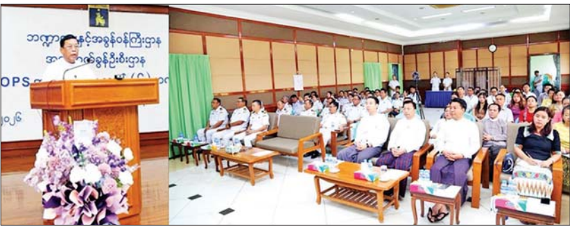
ခဲမှုနှင့်စပ်လျဉ်း၍ ဆွေးနွေးတင်ပြပြီး မှတ်တမ်းအား ပြသ၍ ပုဂ္ဂလိကဘဏ် ခြောက်ဘဏ်ဖြင့် MACCS Online Payment System အား အကောင်အထည်ဖော် ဆောင်ရွက်ခဲ့မှု

ရန်ကုန် ဧပြီ ၆ “MACCS Online Payment System အား ပုဂ္ဂလိကဘဏ် ခြောက်ဘဏ်ဖြင့် အသုံးပြုကြောင်း ကြေညာခြင်း” အခမ်းအနားကို ယနေ့နံနက်ပိုင်းတွင် ရန်ကုန်တိုင်းဒေသကြီး အကောက်ခွန်ဦးစီးဌာန (ရုံးချုပ်)ရှိ ဝေယျာသီဟအစည်းအဝေးခန်းမ၌ ကျင်းပသည်။ အခမ်းအနားသို့ ဘဏ္ဍာရေးနှင့် အခွန်ဝန်ကြီးဌာန၊ အကောက်ခွန်ဦးစီးဌာန ညွှန်ကြားရေးမှူးချုပ်နှင့် ညွှန်ကြားရေးမှူးများ၊ မြန်မာနိုင်ငံတော်ဗဟိုဘဏ်၊ မြန်မာ့စီးပွားရေးဘဏ်၊ မြန်မာနိုင်ငံကုန်သည်များနှင့် စက်မှုလက်မှုလုပ်ငန်းရှင်များ အသင်းချုပ်၊ မြန်မာနိုင်ငံ အပြည်ပြည်ဆိုင်ရာ ကုန်စည်ပို့ဆောင်ရေးဝန်ဆောင်မှုလုပ်ငန်းရှင်များအသင်း၊ မြန်မာနိုင်ငံ အကောက်ခွန် ဝန်ဆောင်မှုလုပ်ငန်းရှင်များအသင်း၊ မြန်မာနိုင်ငံဘဏ်များအသင်း၊ ဧရာဝတီဘဏ်လီမိတက်၊ ကမ္ဘောဇဘဏ်လီမိတက်၊ သမဝါယမဘဏ်လီမိတက်၊ ဧရာဝတီတောင်သူလယ်သမားများ ဖွံ့ဖြိုးရေးဘဏ်လီမိတက်၊ ယူအေဘီဘဏ်လီမိတက်နှင့် ရိုးမဘဏ်လီမိတက်တို့မှ တာဝန်ရှိသူများ တက်ရောက်ကြသည်။ ညွှန်ကြားရေးမှူးချုပ်က အမှာစကားပြောကြားသည်။ ယင်းနေ့က ပုဂ္ဂလိကဘဏ် ခြောက်ဘဏ်ကိုယ်စား ဧရာဝတီဘဏ်လီမိတက်မှစနစ်ဆောင်ရွက်ခဲ့မှုနှင့်စပ်လျဉ်း၍ ဆွေးနွေးတင်ပြပြီး မှတ်တမ်းအား ပြသ၍ ပုဂ္ဂလိကဘဏ် ခြောက်ဘဏ်ဖြင့် MACCS Online Payment System အား အကောင်အထည်ဖော် ဆောင်ရွက်ခဲ့မှု