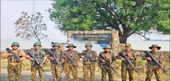
သဖန်းဆိပ်ရေအားလျှပ်စစ်ဓာတ်အားပေးစက်ရုံနှင့် ဝန်းကျင်ဒေသတစ်ဝိုက်အား ပြန်လည်တိုက်ခိုက် သိမ်းပိုက်စဉ်။