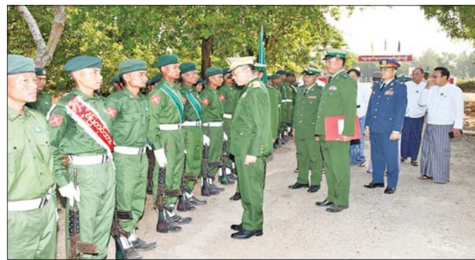
အနောက်တောင်တိုင်းစစ်ဌာနချုပ်အတွင်းရှိ နယ်မြေခွဲသင်တန်းကျောင်းတွင် ဖွင့်လှစ်ခဲ့သည့် ပြည်သူ့ စစ်မှုထမ်း သင်တန်းအမှတ်စဉ်(၂၁)သင်တန်းဆင်းစစ်သည်များအား အနောက်တောင်တိုင်း စစ်ဌာနချုပ် တိုင်းမှူး ဗိုလ်ချုပ်စိုးကျော်ထက်က ရင်းရင်းနှီးနှီးနှုတ်ဆက်နေမှုကို တွေ့ရစဉ်။

၏ အခွင့်အရေးကို ကာကွယ် စောင့်ရှောက်ပေးလျက်ရှိပြီး နိုင်ငံ သားများအနေဖြင့်လည်း နိုင်ငံ တာဝန်များကို ထမ်းဆောင်ကြ ရမည်ဖြစ်သည်။ ယင်းတာဝန် များကို ကျေပွန်စွာထမ်းဆောင်ရန် ဆန္ဒရှိကြသည့် နိုင်ငံသားကောင်း များသည် ပြည်သူ့စစ်မှုထမ်း သင်တန်းများ တက်ရောက်ကာ နိုင်ငံတော်ကာကွယ်ရေးနှင့်လုံခြုံ ရေးတာဝန်များကို ထမ်းဆောင်နေ ကြပြီဖြစ်သည်။ ပြည်သူ့စစ်မှုထမ်း သင်တန်း အမှတ်စဉ်(၂၁)တွင် တက်ရောက် ခဲ့ရသည့် အတွေ့အကြုံများ၊ သင်တန်းမှရရှိခဲ့သည့် အလေ့ အကျင့်ကောင်းများ၊ ယုံကြည်ချက်၊ ခံယူချက်များနှင့် သင်တန်းဆင်း ပြီးနောက် မိမိတို့တာဝန်ကျရာ တပ်ရင်း၊ တပ်ဖွဲ့များ၌ ဆက်လက် တာဝန် ထမ်းဆောင်သွားမည့် အခြေအနေများနှင့် ပတ်သက်၍ သင်တန်းဆင်း နိုင်ငံသားကောင်း စစ်သည်များ၏ စကားသံများကို လည်း ယခုကဲ့သို့ ကြားသိရပါ သည်- အင်တာဗျူး(၁) ကျွန်တော်ကတော့ အခက် အခဲတွေတော့ အများကြီးရှိတာ