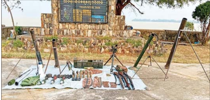
PDF အမည်ခံ အကြမ်းဖက်သောင်းကျန်းသူများထံမှ သိမ်းဆည်းရရှိသည့် လက်နက်၊ ခဲယမ်းနှင့် ဆက်စပ်ပစ္စည်းများ။

ကျောဖုံးမှ လမ်းဘေးများ၊ ဆည်မြောင်းတာဝန်များကို မိုင်းထောင်ဖောက်ခွဲပျက်ဆီးခြင်း၊ ဒေသခံပြည်သူ လူထု၏ နေအိမ်များအား မီးရှို့ဖျက်ဆီးခြင်းများ ကို ဆင်ခြင်တုံတရားကင်းမဲ့စွာ လုပ်ဆောင်လျက် ရှိသည်။ ထိုသို့လုပ်ဆောင်လျက်ရှိရာ PDF အမည်ခံ အကြမ်းဖက်သောင်းကျန်းသူများအနေဖြင့် စစ်ကိုင်း တိုင်းဒေသကြီး၊ ကျွန်းလှမြို့နယ်အတွင်းရှိ သဖန်းဆိပ် ရေလျှောင်တံခံနှင့် ပတ်ဝန်းကျင်ကျေးရွာများ အား ယာယီစိုးမိုးထားပြီး အဖျက်အမှောင်လုပ်ငန်း များကို နည်းလမ်းမျိုးစုံဖြင့် လုပ်ဆောင်လျက် ရှိသည်။