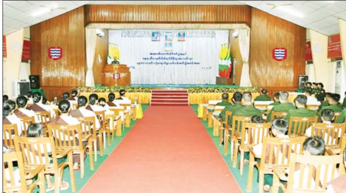
တိုင်းစစ်ဌာနချုပ်ရှိ သံလွင်ခန်းမ၌ လည်းကောင်း၊ အနောက်တောင်တိုင်းစစ်ဌာနချုပ်ရှိ ရေဝတီခန်းမ၌ လည်းကောင်း၊ အနောက်ပိုင်းတိုင်းစစ်ဌာနချုပ်ရှိ စစ်တွေတပ်ခန်းမ၌လည်းကောင်း ပြုလုပ်ကြရာ

နေပြည်တော် ဧပြီ ၃ တိုင်းစစ်ဌာနချုပ်အသီးသီးရှိ တပ်မတော်သားမိသားစု ဝင်သားသမီးများ နေရာသီ ကျောင်းပိတ်ရက်များတွင် အားလပ်ချိန်ကို အကျိုးရှိစွာ အသုံးပြုရန်အတွက် အခြေခံကွန်ပျူတာသင်တန်း၊ အင်္ဂလိပ်စကားပြောသင်တန်းနှင့် ယဉ်ကျေးလိမ္မာသင်တန်းများ ပြုလုပ်ပေးခဲ့ကြောင်း တိုင်းစစ်ဌာနချုပ်မှ သိရသည်။ အင်္ဂလိပ်စကားပြော သင်တန်းနှင့် အခြေခံကွန်ပျူတာသင်တန်း သင်တန်း ဆင်းပွဲများကို ယနေ့တွင် မြောက်ပိုင်းတိုင်းစစ်ဌာနချုပ်ရှိ ဗဟိုဌာနချုပ် ဗဟိုဌာနချုပ် ဝန်ထမ်းများနှင့် အခြေခံကွန်ပျူတာသင်တန်း သင်တန်း ဆင်းပွဲများ ပြုလုပ်ခဲ့ကြောင်း သိရသည်။