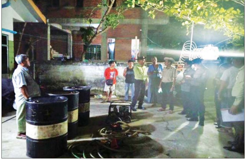
Call Center သို့တိုင်ကြားလာမှုအရ တရားမဝင်စက်သုံးဆိပ် သို့လှောင်ရောင်းချနေမှုကို ဖမ်းဆီးရမိစဉ်။

နေပြည်တော် ဧပြီ ၃ ၂၀၂၆ ခုနှစ် မတ် ၂၈ ရက် ညနေပိုင်းတွင် ရန်ကုန်တိုင်းဒေသကြီး ဒဂုံမြို့သစ် (အရှေ့ပိုင်း)မြို့နယ် အမှတ်(၈)ရပ်ကွက်ရှိ ရွှေစင်ဝင်းရွှေဆိုင်တွင် ဆိုင်ရှင်ဖြစ်သူသည် ဆိုင်ဝန်ထမ်းဖြစ်သူနှင့်အတူ ဆိုင်ရှိ ရွှေဆိုင်ကြိုး ၁၈၄ ကိုးပါ ရွှေထည်ပစ္စည်းမျိုးစုံ အလေးချိန် ၁ ပိဿာ ၅၀ ကျပ်သားခန့်၊ တန်ဖိုးငွေကျပ်သိန်း ၈၅၀၀ ခန့်အား ခရီးဆောင်အိတ်ဖြင့် သိမ်းဆည်းပြီး ဆိုင်ပိတ်ကာ နေအိမ်သို့ပြန်ရန် မော်တော်ယာဉ်အား စောင့်ဆိုင်းနေစဉ် အမျိုးသားနှစ်ဦးရောက်ရှိလာပြီး သေနတ်ပစ်ဖောက်ခြင်းခြောက်ကာ ကားဘီးဖြတ်သည့် ဝှင်းဝှင်ဖြင့် ရိုက်နှက်ပြီး ရွှေထည်ပစ္စည်းများထည့်ထားသော အိတ်ကို လုယက်ယူဆောင်၍ အသင့်စောင့်နေသည့် အမျိုးသားတစ်ဦး မောင်းနှင်သည့် ဆိုင်ကယ်ဖြင့် ထွက်ပြေးသွားခဲ့ကြောင်း သတင်းပေးပို့တိုင်ကြားလာသဖြင့် ဒဂုံမြို့သစ် (အရှေ့ပိုင်း)မြို့မရဲစခန်း၌ (၁)ရက်/၂၀၂၆၊ စာမျက်နှာ ၁၃ ကော်လံ ၁ ❖