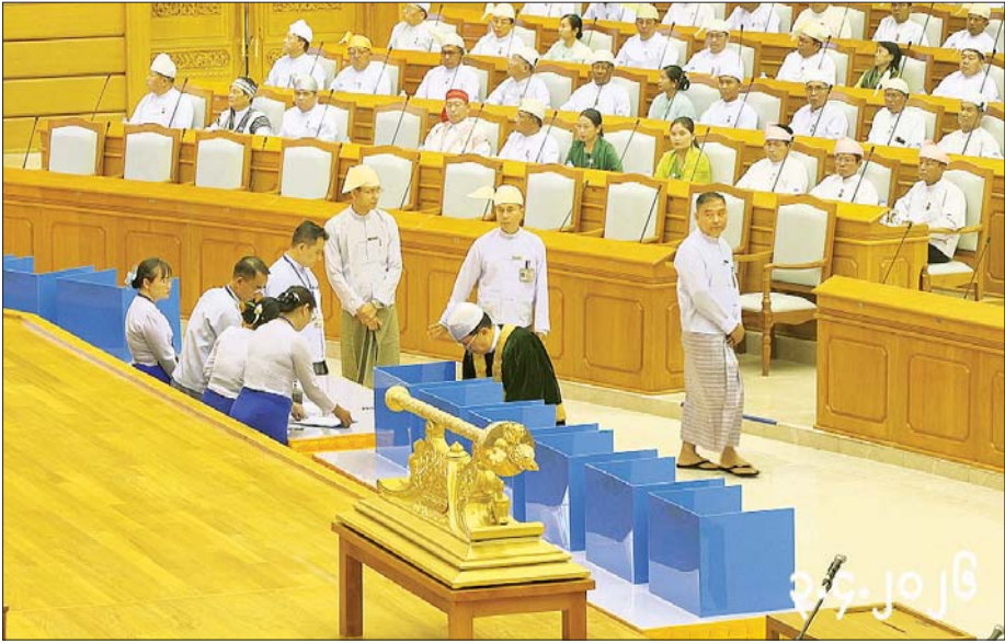
ပြည်ထောင်စုလွှတ်တော်နာယက ဦးအောင်လင်းဒွေး နိုင်ငံတော်သမ္မတ ရွေးချယ်တင်မြောက်နိုင်ရန် ပြည်ထောင်စုလွှတ်တော်ရုံး ဝန်ထမ်းများထံမှ ဆန္ဒမဲလက်မှတ်များ လက်မှတ်ရေးထိုးထုတ်ယူ၍ သတ်မှတ်ထားသည့်နေရာတွင် လျှို့ဝှက်ဆန္ဒပြုကာ ဆန္ဒမဲပုံးများအတွင်းသို့ ဆန္ဒမဲလက်မှတ် ထည့်စဉ်။

ဆက်လက်၍ ပြည်ထောင်စုလွှတ်တော်နာယကက နိုင်ငံတော်ဖွဲ့စည်းပုံအခြေခံ ဥပဒေအရ ပြည်ထောင်စု လွှတ်တော်ကိုယ်စားလှယ်များအားလုံး ပါဝင်သည့် နိုင်ငံတော်သမ္မတ ရွေးချယ်တင်မြောက်ရေးအဖွဲ့က နိုင်ငံတော်သမ္မတလောင်းများ ဖြစ်ကြသည့် ဒုတိယသမ္မတ သုံးဦးအနက်မှ ဒုတိယသမ္မတ တစ်ဦးကို နိုင်ငံတော်သမ္မတအဖြစ် ဆန္ဒမဲလက်မှတ်ပုံစံ (၀၁)ဖြင့် လျှို့ဝှက်ဆန္ဒမဲပေး၍ ရွေးချယ်တင်မြောက်ကြရမည်ဖြစ်ကြောင်း၊ နိုင်ငံတော်သမ္မတနှင့် ဒုတိယသမ္မတများ ရွေးချယ်တင်မြောက်ခြင်းဆိုင်ရာ နည်းဥပဒေအရ နိုင်ငံတော်သမ္မတရွေးချယ်တင်မြောက်ရန် ဆန္ဒမဲပေးခြင်းကို မိမိအပါအဝင် နိုင်ငံတော်သမ္မတ ရွေးချယ်တင်မြောက်ရေးအဖွဲ့ဝင်များ ဖြစ်