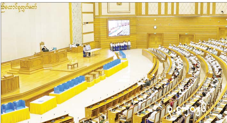
တတိယအကြိမ် ပြည်ထောင်စုလွှတ်တော် နိုင်ငံတော်သမ္မတ ရွေးချယ်တင်မြှောက်ပွဲ ကျင်းပစဉ်။

နေပြည်တော် ဧပြီ ၃ တတိယအကြိမ် ပြည်ထောင်စုလွှတ်တော် နိုင်ငံတော်သမ္မတ ရွေးချယ်တင်မြှောက်ပွဲကို ယနေ့ နံနက် ၁၀ နာရီတွင် နေပြည်တော်ရှိ လွှတ်တော်အဆောက်အအုံ ပြည်ထောင်စုလွှတ်တော် အစည်းအဝေးခန်းမ၌ ကျင်းပသည်။ အစည်းအဝေးတွင် ပြည်ထောင်စုလွှတ်တော် နာယက ဦးအောင်လင်းဌေးက ပြည်ထောင်စုလွှတ်တော်ကိုယ်စားလှယ် အားလုံးပါဝင်သော နိုင်ငံတော်သမ္မတ ရွေးချယ်တင်မြှောက်ပွဲ အစည်းအဝေးသို့ တက်ရောက်ခွင့်ရှိသည့် လွှတ်တော် ကိုယ်စားလှယ် စုစုပေါင်း ၅၈၆ ဦးရှိသည့်အနက် ယနေ့အစည်းအဝေးသို့ ၅၈၄ ဦး စာမျက်နှာ ၃ ကော်လံ ၁ ၀