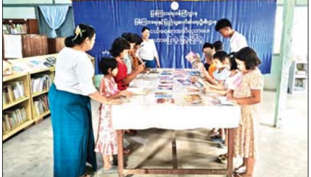
စာကြည့်တိုက်နှင့် ရင်းနှီးကျမ်းဝင် မှုရှိစေရန် အားလပ်ချိန်ကို စာပေဖတ်ရှုခြင်းဖြင့် အကျိုးရှိစွာအသုံးချ တတ်စေရန်နှင့် အသိပညာဗဟုသုတများ တိုးပွားလာစေရန် ရည်ရွယ်၍ ပြပွဲကို ကျင်းပရခြင်း

ပန်းတောင်း ဧပြီ ၃ ပဲခူးတိုင်းဒေသကြီး ပန်းတောင်းမြို့နယ်၌ စာအုပ်စာစောင်ပြပွဲနှင့် အသိပညာပေး နံရံကပ်စာစောင်ပြပွဲကို ယနေ့နံနက်ပိုင်းက ပြန်ကြားရေးနှင့် ပြည်သူ့ဆက်ဆံရေးဦးစီးဌာန လူထုအခြေပြုဗဟိုဌာနခန်းမ၌ ကျင်းပသည်။