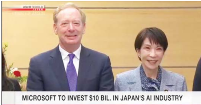
မိုက်ခရိုဆော့ဖ်ကုမ္ပဏီသည် NTT Data Japan အခြားလူ့စွမ်းအားအရင်းအမြစ်များကို ၂၀၃၀ ပြည့် နှင့် အီလက်ထရောနစ်ကုမ္ပဏီ NEC တို့နှင့်ပူးပေါင်း နှစ်တွင် မွေးထုတ်သွားရန် ရည်ရွယ်ထားသည်။ တာ ဂျပန်နိုင်ငံ၌ အင်ဂျင်နီယာတစ်သန်းနှင့် အင်န်အိတ်ချီကေ

မည်ဖြစ်ကာ လူ့စွမ်းအားအရင်းအမြစ်ကိုလည်း မြှင့်တင်ပေးမည်ဖြစ်သည့်အတွက် ရင်းနှီးမြှုပ်နှံမည့် အစီအစဉ်ကိုကြိုဆိုကြောင်း ဂျပန်ဝန်ကြီးချုပ်က ပြောသည်။ အမေရိကန်ဒေါ်လာ ၁၀ ဘီလီယံသည် အေအိုင် ဖွံ့ဖြိုးတိုးတက်ရေးအတွက် လိုအပ်သည့် ဒေတာ စင်တာများအတွက် လိုလောက်မှုရှိပြီး ပညာရှင်များ ကို မွေးထုတ်ရန်လည်း လိုလောက်မှုရှိသည်။ ဂျပန် နိုင်ငံ၌ အချက်အလက်များကို ထိန်းသိမ်းစဉ် တိုးတက်သည့်အေအိုင်နည်းပညာ ပတ်ဝန်းကျင် ကို စတင်ရန် နည်းပညာကုမ္ပဏီကြီးက စီစဉ်ထား သည်။ ဂျပန် တယ်လီကွန်းကုမ္ပဏီများဖြစ်သည့် SoftBank နှင့် ဒေတာစင်တာ အော်ပရေတာဖြစ်သည့် Sakura Internet တို့သည်လည်း ပူးတွဲပူးပေါင်း ပါဝင်သွားမည်ဖြစ်သည်။