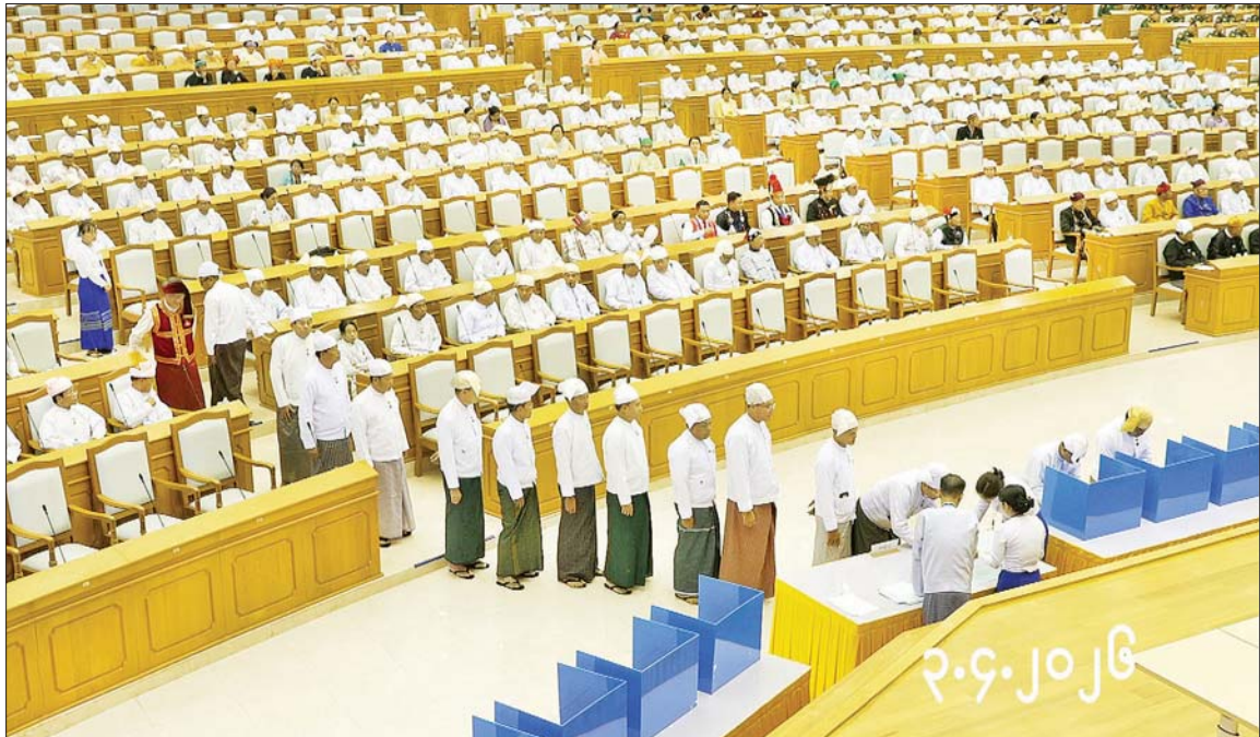
နိုင်ငံတော်သမ္မတ ရွေးချယ်တင်မြောက်နိုင်ရန် နိုင်ငံတော်သမ္မတ ရွေးချယ်တင်မြောက်ရေးအဖွဲ့ဝင်များ ပြည်ထောင်စုလွှတ်တော်ရုံး ဝန်ထမ်းများထံမှ ဆန္ဒမဲလက်မှတ်များကို တစ်ဦးချင်းလက်မှတ်ရေးထိုးထုတ်ယူကြပြီး သတ်မှတ်ထားသည့်နေရာတွင် လျှို့ဝှက်ဆန္ဒပြုကာ ဆန္ဒမဲပုံးများအတွင်းသို့ ဆန္ဒမဲလက်မှတ်များ ထည့်ကြစဉ်။

ယင်းနောက် ပြည်ထောင်စုလွှတ်တော်နာယကက သမ္မတရွေးချယ်တင်မြောက်ရေး အဖွဲ့အစည်းအဝေး ပြီးဆုံးကြောင်းနှင့် ပြည်ထောင်စုလွှတ်တော်တတိယနေ့ အစည်းအဝေးကို ၂၀၂၆ ခုနှစ် ဧပြီ ၆ ရက် (တနင်္လာနေ့) နံနက် ၁၀ နာရီတွင် ကျင်းပမည်ဖြစ်ကြောင်းကြေညာပြီး အစည်းအဝေးကို ရုပ်သိမ်းလိုက်ကြောင်း သတင်းရရှိသည်။ သတင်းစဉ်