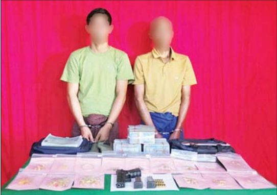
ဖြစ်မှုကျူးလွန်သူများကို သက်သေခံပစ္စည်းများနှင့်အတူ တွေ့ရစဉ်။