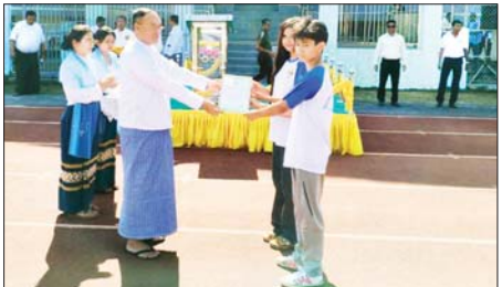
အားကစားသမားများက အားကစားသစ္စာခံဥာဏ် (၄)ချက်အား ရွတ်ဆိုကြပြီး ပြိုင်ပွဲကို စတင်ကျင်းပရာ ပုသိမ်ခရိုင်အသင်းနှင့် မြောင်းမြခရိုင်အသင်းတို့ အကြိတ်အနယ်ယှဉ်ပြိုင်ကစားကြသည်။ ထို့နောက် တိုင်းဒေသကြီး

ပုသိမ် ဧပြီ ၃ ဧရာဝတီတိုင်းဒေသကြီး ဝန်ကြီးချုပ်ဖလား ခရိုင်ပေါင်းစုံ အသက် ၁၈ နှစ်အောက် အမျိုးသားဘောလုံးပြိုင်ပွဲ၊ ကြက်တောင်ပြိုင်ပွဲနှင့် မြို့နယ်ပေါင်းစုံစစ်တူရင်ပြိုင်ပွဲ ဖွင့်ပွဲအခမ်းအနားကို ယနေ့ညနေက ပုသိမ်မြို့ ကိုးသိန်းအားကစားကွင်း၌ ကျင်းပသည်။