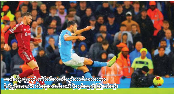
ယခင်တွေ့ဆုံမှုတွင် မန်စီးတီးအသင်းကွင်းလယ်ကစားသမား နီကိုဂရိုနီအေလတ်ဖီ လီဗာပူးအသင်းအထံ ရုံးသွင်းယူရန် ကြိုးပမ်းစဉ်။

ဧပြီ ၄ ရက်နှင့် ၅ ရက်တွင် နာမည်ကြီး မန်စီးတီး၊ အာဆင်နယ်၊ ချယ်ဆီးအသင်းတို့ ပါဝင်သည့် အက်ဖ်အေဖလားပြိုင်ပွဲ ကွာတားဖိုင်နယ်ပွဲစဉ်များ ယှဉ်ပြိုင်ကစားသွားမည်ဖြစ်သည်။ မန်စီးတီးနှင့် လီဗာပူးအသင်းပွဲစဉ်ကို ဧပြီ ၄ ရက် ညနေ ၆ နာရီ ၁၅ မိနစ်တွင် အီတလီကွင်း၌ အကြိတ်အနယ် ယှဉ်ပြိုင်ကစားသွားမည်ဖြစ်သည်။ ပွဲလေဒ်အမြေကို အချိန်မရွေး ပြောင်းလဲနိုင်စွမ်းရှိသည့် စာမျက်နှာ ၁၃ ကော်လံ ၄ ❖