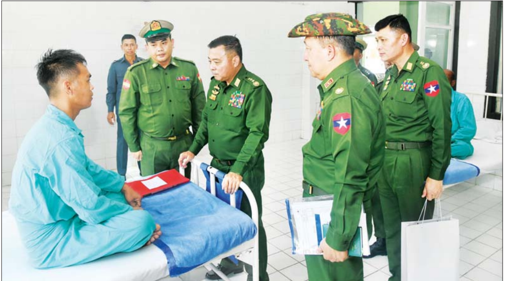
အားပေးစကားပြောကြား

ထို့နောက် တပ်မတော်ကာကွယ်ရေးဦးစီးချုပ်နှင့်အဖွဲ့ဝင်များသည် ဆေးရုံအတွင်း လှည့်လည် ကြည့်ရှုစစ်ဆေးကြပြီးလိုအပ်သည်များ လမ်းညွှန် မှာကြားခဲ့ကြောင်း သတင်းရရှိသည်။ သတင်းစဉ်