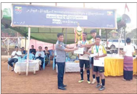
ကျင်းပရာ ၉၀ FC အသင်းက ဒုတိယဆုရရှိပြီး တစ်ဦးချင်း ငွေဆွဲပေးဆုနှင့် ငွေသားဆု ရှမ်းချယ်ရီ FC အသင်းက ပထမဆုရရှိပြီး တစ်ဦးချင်းရွှေဆွဲပေးဆု၊ နောက်တန်း၊ အရှေ့တန်း၊ အလယ်

မိုင်းရှူး ဧပြီ ၂၄ ရှမ်းပြည်နယ်(တောင်ပိုင်း) မိုင်းရှူးမြို့နယ်၌ ၂၀၂၆ ခုနှစ် ဘောလုံးအဖွဲ့ချုပ်ဥက္ကဋ္ဌလေး ဘောလုံးပြိုင်ပွဲ ဝိုင်းလှည့်နှင့် ဆုချီးမြှင့်ပွဲကို ယမန်နေ့က မြို့မအားကစားကွင်း၌ ကျင်းပသည်။ အဆိုပါ ဝိုင်းလှည့်တွင် ရှမ်းချယ်ရီ FC အသင်းနှင့် ၉၀ FC အသင်းတို့ ယှဉ်ပြိုင်ကစားကြရာ ရှမ်းချယ်ရီ FC အသင်းက ၉၀ FC အသင်းကို ၃-၀ နှစ်ဂိုး-တစ်ဂိုးဖြင့် အနိုင်ရရှိခဲ့သည်။ ထို့နောက် ဆုချီးမြှင့်ပွဲကို