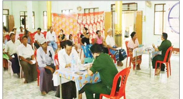
ရွက်ပေးသည်။ ယင်းသို့ ဆောင်ရွက်ပေးနေမှုများကို သန့်လျင်တပ်နယ်မှ တာဝန်ရှိသူများက သွားရောက် ကြည့်ရှုအားပေးပြီး လိုအပ်သည်များ ပေါင်းစပ်ညှိနှိုင်း ဆောင်ရွက်ပေးခဲ့ကြောင်း သတင်းရရှိသည်။ သတင်းစဉ်

ရှိရာ ယနေ့တွင် အရှေ့မြောက်တိုင်းစစ်ဌာနချုပ်၊ နယ်လှည့်ဆေးကုသရေးအဖွဲ့က တန့်ယန်းမြို့နယ် တန့်ဟန်းကျေးရွာရှိ အခြေခံပညာ မူလတန်းကျောင်း၌ အခြေပြု၍ ကျေးရွာရှိ သံဃာတော်အပါး ၇၀ နှင့် ဒေသခံပြည်သူ ၇၂ ဦးတို့ကို အရေပြားရောဂါ၊ သွေးတိုးရောဂါ၊ အစာအိမ်ရောဂါ၊ အထွေထွေရောဂါတို့နှင့် လိုအပ်သည့် ကျန်းမာရေး စစ်ဆေးကုသပေးခြင်းများ ဆောင်ရွက်ပေးသည်။ ယင်းသို့ ဆောင်ရွက်နေမှုများကို တိုင်းမှူး ဗိုလ်ချုပ် အေးမင်းဦးနှင့် တာဝန်ရှိသူများက သွားရောက်ကြည့်ရှုအားပေးပြီး လိုအပ်သည်များ ပေါင်းစပ်ညှိနှိုင်း ဆောင်ရွက်ပေးသည်။ အလားတူ ရန်ကုန်တိုင်းစစ်ဌာနချုပ် နယ်လှည့်ဆေးကုသရေးအဖွဲ့က ရန်ကုန်တိုင်းဒေသကြီး သုံးခွမြို့နယ် ရဲနွဲ့ကျေးရွာရှိ ဒဂုံတက်ရောက်တိုက်၌ အခြေပြု၍ အဆိုပါကျေးရွာနှင့် ပတ်ဝန်းကျင်ကျေးရွာများရှိ ဒေသခံပြည်သူ ၁၁၉ ဦးတို့ကို အရိုးအကြောရောဂါ၊ ခွဲစိတ်ကုသမှုဆိုင်ရာ ရောဂါ၊ ကလေးရောဂါ၊ မျက်စိရောဂါ၊ နား/နှာခေါင်း/လည်ချောင်း ရောဂါ၊ သွားနှင့် ခံတွင်းရောဂါ၊ သားဖွားမီးယပ်ရောဂါ၊ အထွေထွေရောဂါတို့နှင့် ပတ်သက်၍ ကျန်းမာရေး စစ်ဆေးကုသပေးခြင်းများ ဆောင်ရွက်ပေးသည်။