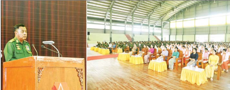
တပ်မတော်ကာကွယ်ရေးဦးစီးချုပ် ဗိုလ်ချုပ်ကြီး ရဲဝင်းဦး ရှမ်းပြည်နယ်(အရှေ့ပိုင်း) မိုင်းဖြတ်၊ မိုင်းယောင်း၊ တာလေး၊ တာချီလိတ်တပ်နယ်များမှ အရာရှိ၊ စစ်သည်၊ မိသားစုများအား တွေ့ဆုံအမှာစကားပြောကြားစဉ်။

နေပြည်တော် ဧပြီ ၂၄ တပ်မတော်ကာကွယ်ရေး ဦးစီးချုပ် ဗိုလ်ချုပ်ကြီး ရဲဝင်းဦးသည် ယနေ့နံနက်ပိုင်းတွင် မိုင်းဖြတ်၊ မိုင်းယောင်း၊ တာလေး၊ တာချီလိတ် တပ်နယ်များမှ အရာရှိ၊ စစ်သည်၊ မိသားစုများအား မိုင်းဖြတ်မြို့ရှိ နယ်မြေခံတပ်နယ်ခန်းမ၌ သွားရောက်တွေ့ဆုံ၍ အမှာစကား ပြောကြားသည်။