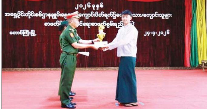
အရှေ့ပိုင်းတိုင်းစစ်ဌာနချုပ်၊ ကျောင်းပိတ်ရက်၌ ကျောင်းသားကျောင်းသူများ စာဖတ်ရိုက်နှိပ်ဖြန့်ဖြူးခြင်းဖြင့် တင်ရေး စာဖတ်စွမ်းရည်ပြိုင်ပွဲ

နေပြည်တော် ဧပြီ ၂၄ နေရာသီကျောင်းပိတ်ရက်အတွင်း ကျောင်းသား ကျောင်းသူများ စာဖတ်ရိုက်နှိပ်ဖြန့်ဖြူးခြင်းဖြင့် တင်ရေး စာဖတ်စွမ်းရည်ပြိုင်ပွဲကို ယနေ့နံနက်ပိုင်းတွင် အရှေ့ပိုင်းတိုင်းစစ်ဌာနချုပ် သံလွင်ခန်းမ၌ပြုလုပ်ရာ တိုင်းမှူးဗိုလ်မှူးချုပ် ကျော်နိုင်ဦးနှင့် အရာရှိကြီးများ၊ နယ်မြေခံတပ်ရင်း/တပ်ဖွဲ့မှူးများ၊ အရာရှိစစ်သည်၊ မိသားစုများ၊ ဗိုလ်အဖွဲ့ဝင်များ၊ ပြိုင်ပွဲဝင် ကျောင်းသားများက ဆုများနှင့် ဖိတ်ကြားထားသည့် သူများ တက်ရောက်ကြသည်။ ဦးစွာ တိုင်းမှူးက အမှာစကားပြောကြားသည်။ ထို့နောက် တိုင်းမှူးနှင့် တက်ရောက်လာကြသူများက ကျောင်းသား ကျောင်းသူများ စာဖတ်ရိုက်နှိပ်ဖြန့်ဖြူးခြင်းဖြင့် တင်ရေး စာဖတ်စွမ်းရည်ပြိုင်ပွဲ ယှဉ်ပြိုင် နေမှုများကို ကြည့်ရှုအားပေးကြသည်။ ယင်းနောက် ဆုရရှိသည့် ကျောင်းသား ကျောင်းသူ ၁၂ ဦး၊ စုစုပေါင်း ၂၀ ပါဝင် ခိုင်အဖွဲ့ဝင်များအား တာဝန်ရှိသူများက ဆုများ ပေးအပ်ချီးမြှင့်ကြသည်။ သတင်းစဉ်