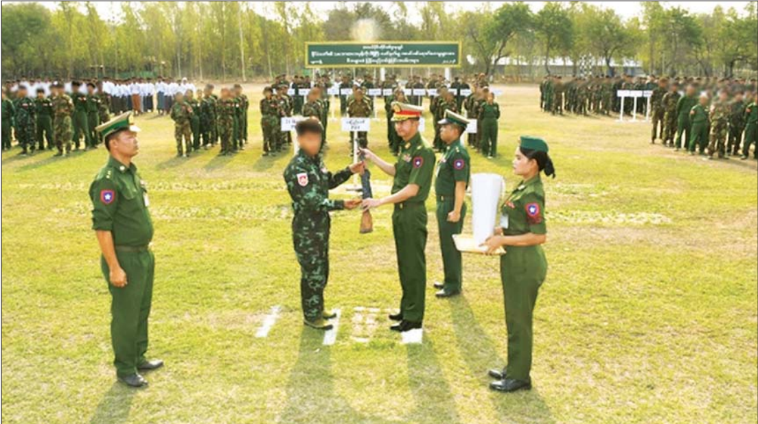
နိုင်ငံတော်နှင့် တပ်မတော်၏ ငြိမ်းချမ်းရေးလုပ်ငန်းစဉ်များကို လက်ခံယုံကြည်လာသည့် KIA ၊ AA ၊ PLA အကြမ်းဖက်အဖွဲ့များမှ အဖွဲ့ဝင်အချို့အပါအဝင် PDF အမည်ခံ အကြမ်းဖက်အဖွဲ့အစည်းအသီးသီးမှ အဖွဲ့ဝင် အမျိုးသား ၄၇၀ နှင့် အမျိုးသမီး ၄၇ ဦးတို့ လက်နက်၊ ခဲယမ်းများနှင့်အတူ ဥပဒေဘောင်အတွင်းသို့ ဝင်ရောက်စဉ်။

ထိုသို့ ဆောင်ရွက်ပေးမှုများကြောင့် PDF အမည်ခံအဖွဲ့ဝင်များသည် ဥပဒေဘောင်အတွင်းသို့ တစ်ဖွဲ့ပြီးတစ်ဖွဲ့ ပြန်လည် ဝင်ရောက်လျက်ရှိသည်။ ထို့အတူ တပ်မတော်စစ်ကြောင်းများက တိုင်းဒေသကြီး/ပြည်နယ်များရှိ လက်နက်ကိုင် အကြမ်းဖက်အဖွဲ့အစည်းများနှင့် PDF အမည်ခံပူးပေါင်းအဖွဲ့များ ယာယီ စိုးမိုးထားသည့် နေရာများအား တစ်ခုပြီးတစ်ခု ပြန်လည်သိမ်းပိုက်ထိန်းချုပ်နိုင်ခဲ့ခြင်းကြောင့် ပြည်သူများအနေဖြင့် နယ်မြေတည်ငြိမ် အေးချမ်းရေးအတွက် သက်စွန့်ဆံ့ဖျားတာဝန်ထမ်းဆောင်နေကြသည့် တပ်မတော်သားများကို ဝမ်းသာအားရ ကြိုဆိုထောက်ခံလျက်ရှိကြပြီး စိတ်အေးထက်သန်စွာ အားပေးထောက်ခံမှု၊ ယုံကြည်အားကိုးမှု၊ တပ်မတော်နှင့်အတူ ပူးပေါင်းပါဝင်ဆောင်ရွက်လာခဲ့မှုများကြောင့် အကြမ်းဖက်အဖွဲ့ဝင်များအနေဖြင့် စိတ်ဓာတ်ကျဆင်းကာ ဆက်လက်ခုခံလိုခြင်း မရှိတော့သည့်အတွက် လက်နက်ကိုင်လမ်းစဉ်ကို စွန့်လွှတ်၍ အမြင်မှန်ရရှိကာ အေးချမ်းစွာ နေထိုင်လိုကြသည့် PDF အမည်ခံစာမျက်နှာ ၁၂ ကော်လံ ၁၂