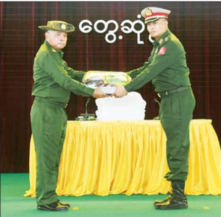
တပ်မတော်ကာကွယ်ရေးဦးစီးချုပ် ဗိုလ်ချုပ်ကြီး ရဲဝင်းဦး တပ်နယ်များမှ အရာရှိ၊ စစ်သည်၊ မိသားစုများအတွက် စားသောက်ဖွယ်ရာပစ္စည်းများနှင့် ချီးမြှင့်ငွေများကို တပ်နယ်မှူးထံ ပေးအပ်စဉ်။

ထို့နောက် တပ်မတော် ကာကွယ်ရေးဦးစီးချုပ်က တပ်နယ်များမှ အရာရှိ၊ စစ်သည်၊ မိသားစုများအတွက် စားသောက်ဖွယ်ရာပစ္စည်းများနှင့် ချီးမြှင့်ငွေများကို ပေးအပ်ရာ တပ်နယ်မှူးက လည်းကောင်း၊ တပ်မတော် ကာကွယ်ရေးဦးစီးချုပ်၏ ဇနီးက တပ်နယ်မှူးရှိ မိခင်နှင့်ကလေးစောင့်ရှောက်ရေးအသင်းအတွက် ချီးမြှင့်ငွေများကို ပေးအပ်ရာ တပ်နယ်မှူး၏ ဇနီးကလည်း ကောင်း လက်ခံယူကြသည်။