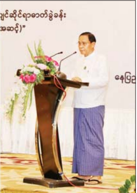
ပတ်ဝန်းကျင်ဆိုင်ရာဓာတ်ခွဲခန်း အဆင့်)”

အခမ်းအနားသို့ သယံဇာတနှင့် သဘာဝပတ်ဝန်းကျင် ထိန်းသိမ်း ရေးဝန်ကြီးဌာန ပြည်ထောင်စု ဝန်ကြီး ဦးဆန်းဦး၊ ဒုတိယဝန်ကြီး ဒေါက်တာ သောင်းနိုင်ဦးနှင့် ဦးခင်လတ်ကြီး၊ အမြဲတမ်းအတွင်း ဝန်၊ မြန်မာနိုင်ငံဆိုင်ရာ တရုတ် ပြည်သူ့သမ္မတနိုင်ငံ သံရုံးမှ တာဝန်ရှိသူများ၊ နိုင်ငံခြားရေး ဝန်ကြီးဌာနမှ မဲခေါင် - လန်ချန်း ပူးပေါင်း ဆောင်ရွက်ရေးအဖွဲ့ ဥက္ကဋ္ဌနှင့် တာဝန်ရှိသူများ တက်