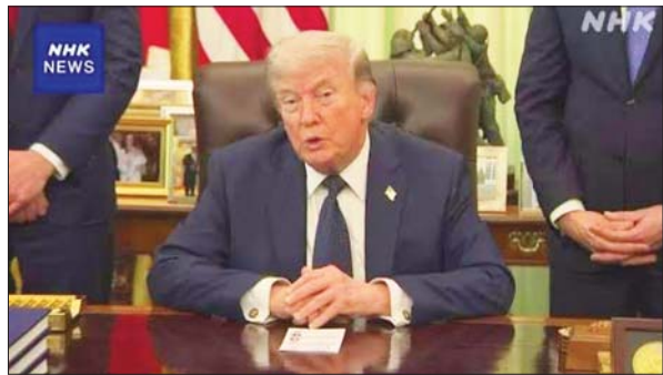
မည်ဟု ရည်မှန်းထားကြောင်းလည်း ၎င်းက တိုင် အဆိုသတ်ရေးအတွက် အမေရိကန်က ဆက်လက်စေ့စပ် ညှိနှိုင်းပေးလျက်ရှိကြောင်း သိရသည်။ မူလအပစ်အခတ်ရပ်စဲရေးသဘောတူညီချက်မှာ ၁၀ ရက်ဖြစ်သည်။ တိုက်ပွဲများ အပြီး အင်န်အိတ်ချ်က

နယူးယောက် ဧပြီ ၂၄ အစ္စရေးနှင့် လက်ဘနွန်တို့သည် လွန်ခဲ့သည့် တစ်ပတ်က စတင်အသက်ဝင်ခဲ့သည့် အပစ်အခတ်ရပ်စဲရေးကာလကို သက်တမ်းတိုးရန် သဘောတူညီခဲ့ကြောင်း အမေရိကန်သမ္မတ ဒေါ်နယ်ထရမ်က ဧပြီ ၂၄ ရက်တွင် ပြောကြားသည်။