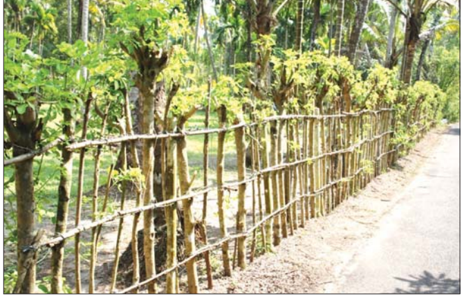
မြေနိမ့်ချယ်ရီပင်အား ခြစည်းရိုးတိုင်အဖြစ် အသုံးပြုခြင်း။