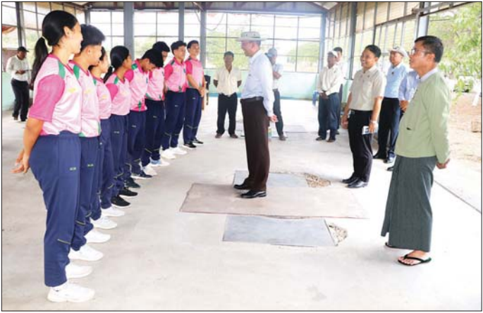
က အားကစားနှင့်ကာယပညာသိပ္ပံ(မုံရွာ)ကျောင်းဝင်း ရှိ၊ ကရာတေးအားကစားလေ့ကျင့်ရေးရုံ၊ GYM အတွင်းရှိ ပိုက်ကျော်ခြင်းအားကစား လေ့ကျင့်ရေး အားကစားလေ့ကျင့်ရေးရုံ၊ အလေးမအားကစား ခွဲကြောင်း သိရသည်။ တိုင်းဒေသကြီး (ပြန်/ဆက်)

မုံရွာ ဧပြီ ၂၂ စစ်ကိုင်းတိုင်းဒေသကြီးဝန်ကြီးချုပ် ဦးကိုလေးသည် တိုင်းဒေသကြီး ဝန်ကြီးများ၊ တိုင်းဒေသကြီး/ခရိုင်/မြို့နယ်အဆင့် ဌာနဆိုင်ရာများနှင့်အတူ ယနေ့ မွန်းလွဲပိုင်းတွင် မုံရွာမြို့ ပြည်သူ့အားကစားကွင်းသို့ သွားရောက်ကြည့်ရှုစစ်ဆေးသည်။ ဦးစွာ တိုင်းဒေသကြီးအားကစားနှင့်ကာယပညာ ဦးစီးဌာန ဦးစီးမှူးက ပြည်သူ့အားကစားကွင်း အတွင်းရှိ အားကစားရုံအဆောက်အအုံများနှင့် ရုံးအဆောက်အအုံများ ထိန်းသိမ်းဆောင်ရွက်ထားရှိမှုများကို ရှင်းလင်းတင်ပြရာ တိုင်းဒေသကြီးဝန်ကြီးချုပ်က လိုအပ်သည်များကို တာဝန်ရှိသူများနှင့် ပြည်ဆည်းပေါင်းစပ်ဆောင်ရွက်ပေးပြီး ပြည်သူ့အားကစားကွင်းနှင့် ပွဲကြည့်စင်အဆောက်အအုံများကို လိုက်လံကြည့်ရှုကြသည်။ ထို့နောက်တိုင်းဒေသကြီးဝန်ကြီးချုပ်နှင့် တာဝန်ရှိသူများသည် အားကစားနှင့် ကာယပညာသိပ္ပံ(မုံရွာ) သို့ရောက်ရှိရာ ကျောင်းအုပ်ကြီးနှင့် တာဝန်ရှိသူများ