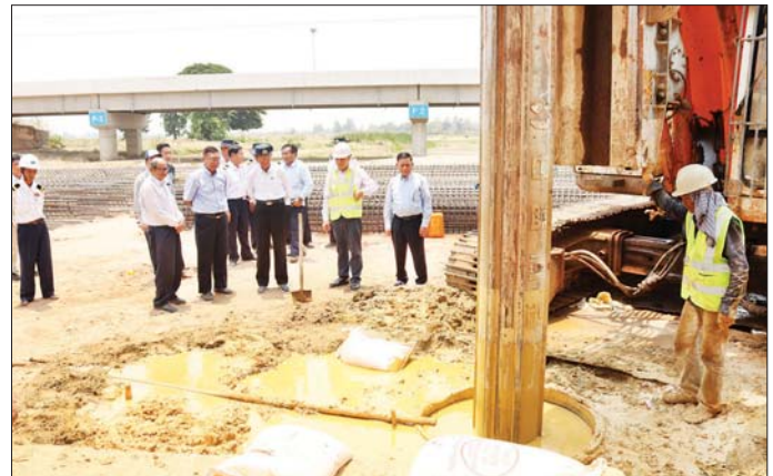
ဘိုးပိုင်တူးမြောင်း လုပ်ငန်းဆောင်ရွက်နေမှုကို ကြည့်ရှုစစ်ဆေးသည်။ ယင်းနောက် ဒုတိယဝန်ကြီးနှင့် အဖွဲ့သည် ဆတ်သွားဘူတာသို့ရောက်ရှိပြီး ဘူတာယာခံဝင်း

ထို့နောက် ပြည်-ပုဂံ ရထားလမ်းပိုင်း၊ ဆတ်သွား- ပရပ်ကြယ်ဘူတာကြားရှိ တံတားအမှတ် (၃၄၃) ရန်ပယ်ချောင်းကူး ရထားလမ်းတံတားသို့ ရောက်ရှိပြီး တံတားရေလယ်တိုင် အမှတ်(၂)နှင့် အမှတ်(၃)တို့ နိမ့်ကျမှုဖြစ်ပွားခဲ့သည့် တံတားပြန်လည် တည်ဆောက်နေမှု အခြေအနေများကို တာဝန်ရှိသူများက ရှင်းလင်းတင်ပြရာ ဒုတိယဝန်ကြီးက လုပ်ငန်းခွင်အန္တရာယ်ကင်းရှင်းရေး၊ သတ်မှတ်စံချိန်စံညွှန်းနှင့်အညီ သတ်မှတ်ကာလအတွင်း ပြီးစီးရေး အမြန်ဆုံး အကောင်အထည်ဖော် ဆောင်ရွက်သွားရန်၊ တံတားပေါ်ရှိ သံလမ်းနှင့် ကွန်ကရစ် ဇလီဖားတုံးများအား ဖြုတ်သိမ်းထားရန် မှာကြားပြီး လုပ်ငန်းခွင်အတွင်း တံတားတိုင်