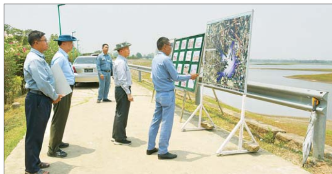
ရေသန့်စင်စက်ရုံမှ တစ်ရက်လျှင် ရေကလန် ၁ ဒသမ ၂၅ သန်း သန့်စင်ပေးနိုင်သည့် အနွေးနွန်း ရေသန့်စင်ကန် သုံးခုဖြင့် စုစုပေါင်း ၃ ဒသမ ၇၇ သန်း စစ်ထုတ်နေမှု၊ စစ်ထုတ်

နေပြည်တော် ဧပြီ ၂၂ - နေပြည်တော်စည်ပင်သာယာရေးကော်မတီ ဒုတိယဥက္ကဋ္ဌ၊ ဒုတိယမြို့တော်ဝန် ဦးဝင်းမိုးခိုင်သည် ကော်မတီဝင် ဦးကျော်ကျော်အောင်၊ သက်ဆိုင်ရာတာဝန်ရှိသူများနှင့်အတူ ယနေ့နံနက်ပိုင်းက ဒက္ခိဏသီရိမြို့နယ်ရှိ ရန်အောင်မြင်ဆည်နှင့် ဇမ္ဗူသီရိမြို့နယ် ဓနသိဒ္ဓိရေပေးဝေရေးစက်ရုံတို့သို့ သွားရောက်ကြည့်ရှုစစ်ဆေးသည်။