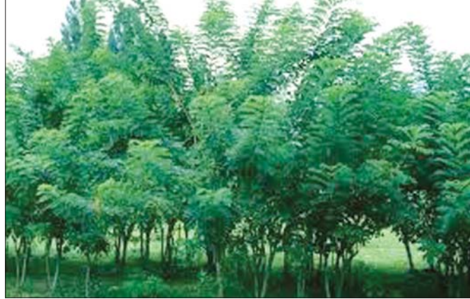
မြေနိမ့်ချယ်ရီပင်။