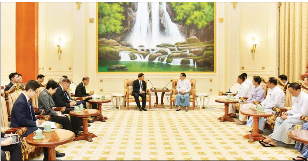
ပြည်ထောင်စုသမ္မတမြန်မာနိုင်ငံတော် ဒုတိယသမ္မတ ဦးညိုစော ထိုင်းနိုင်ငံ ဒုတိယဝန်ကြီးချုပ်နှင့် နိုင်ငံခြားရေးဝန်ကြီး H.E.Mr. Sihasak Phuangketkaew ဦးဆောင်သည့် ကိုယ်စားလှယ်အဖွဲ့ကို လက်ခံတွေ့ဆုံစဉ်။

တွေ့ဆုံစဉ် နှစ်နိုင်ငံ ရှိရင်းစွဲသံတမန်ဆက်ဆံရေးနှင့် ချစ်ကြည်ရင်းနှီးမှု ပိုမိုတိုးတက်ခိုင်မာလာစေရေး၊ စီးပွားရေးကဏ္ဍ၊ နယ်စပ်ဒေသကုန်သွယ်ရေး တိုးမြှင့်နိုင်ရေးကဏ္ဍ၊ စွမ်းအင်ကဏ္ဍအပါအဝင် ကဏ္ဍစုံ ပူးပေါင်းဆောင်ရွက်မှု မြှင့်တင်ဆောင်ရွက်ရေး၊ ရင်းနှီးမြှုပ်နှံမှုများ တိုးမြှင့်ဆောင်ရွက်နိုင်ရေး၊ နှစ်နိုင်ငံဘက်စား ပူးပေါင်းဆောင်ရွက်မှု တိုးမြှင့်နိုင်ရေး၊ နယ်စပ်ဒေသ တည်ငြိမ်အေးချမ်းရေး၊ တရားမဝင် နယ်စပ်ကုန်သွယ်ရေးနှင့် အွန်လိုင်းလောင်းကစားနှင့် ငွေကြေးလိမ်လည်မှု တိုက်ဖျက်ရေး လုပ်ငန်းများတွင် ပိုမိုတိုးမြှင့်ပူးပေါင်း ဆောင်ရွက်သွားမည့် ကိစ္စရပ်များနှင့် စပ်လျဉ်း၍ ရင်းနှီးပွင့်လင်းစွာ ဆွေးနွေးကြသည်။ တွေ့ဆုံပွဲသို့ ဒုတိယသမ္မတ ဦးညိုစောနှင့်အတူ ပြည်ထောင်စုဝန်ကြီး ဦးထွန်းအံ၊ မြန်မာနိုင်ငံတော် ဗဟိုဘဏ်ဥက္ကဋ္ဌ ဒေါက်တာခင်နိုင်ဦး၊ ဒုတိယဝန်ကြီးများနှင့် တာဝန်ရှိသူများ တက်ရောက်ကြပြီး ထိုင်းနိုင်ငံ ဒုတိယဝန်ကြီးချုပ်နှင့် နိုင်ငံခြားရေးဝန်ကြီးနှင့်အတူ နိုင်ငံခြားရေးဝန်ကြီး၏ အကြံပေးပုဂ္ဂိုလ်နှင့် တာဝန်ရှိသူများ တက်ရောက်ကြသည်။ သတင်းစဉ်