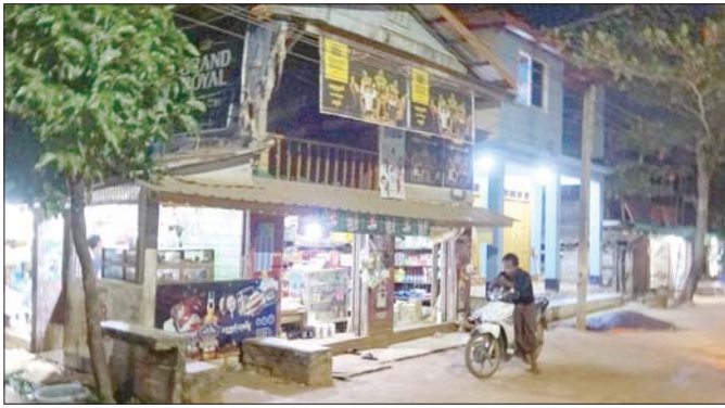
အောင်ဘာကျေးရွာအတွင်း ညမြင်ကွင်း။

စာရေးသူတို့အဖွဲ့အောင်မြန်စွာအသိပညာပေးက ခွာတော့ ည ၇ နာရီဝန်းကျင်ရှိပြီဖြစ်သည်။ ပင်လယ် ပြင်တစ်ခုလုံး မှောင်အတိ။ စာရေးသူတို့ ညအိပ် ရပ်နားမည့် အောင်ဘာကျေးရွာရှိရာ တစ်ဖက်ကမ်း ကို မျှော်ကြည့်မိတော့ မီးရောင်တစ်လက်လက်ဖြင့် အမှောင်ယံကြား ဝင့်ဝင့်ကြားကြားရှိနေသော ရွာကလေးကို လှမ်းမြင်ရသည်။ ခွာခွာည့်ဆိပ်ကမ်း ကို လည်ပြန်ကြည့်မိပြန်တော့ မှောင်ပိတ်ပိတ် ပင်လယ်ကမ်းနဖူးရှိ အောင်မြန်စွာရွာလေးသည် လည်း မီးရောင်တစ်ဖက်ဖက်ဖြင့် လင်းလက်လျက်။ ဟိုဘက်ကမ်း၊ သည်ဘက်ကမ်း... ကမ်းနဖူးပေါ်ရှိ ရွာလေးနှစ်ရွာကို ညအမှောင်ထဲ လင်းထိန် တောက်ပနေတာ မြင်ရသည်ကပင် စာရေးသူအဖွဲ့မှာ ကြည်နူးစရာ။ ကြည်နူးရသည့် အကြောင်းရင်း ကလည်း ရှိသည်ဆိုရမည်။