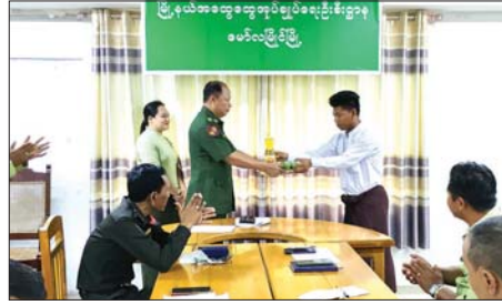
မြို့နယ်အစိုးရအဖွဲ့ဝင်များက ပြည်သူ့စစ်မှုထမ်းသင်တန်းအမှတ်စဉ် (၁) တက်ရောက်ပြီး ပြန်လည်ရောက်ရှိလာသူ နိုင်ငံသားကောင်းများအား ဂုဏ်ပြုပေးနေကြသည်။

အမှတ်စဉ် (၁) မှ တာဝန်ထမ်းဆောင်ပြီး မိမိနေရပ်သို့ ပြန်လည်ရောက်ရှိလာသူများအား မြို့နယ်ပြည်သူ့စစ်မှုထမ်းဆိုင်ခေါ်ရေးအဖွဲ့ဥက္ကဋ္ဌနှင့် အဖွဲ့ဝင်များက တစ်ဦးလျှင် ကြက်ဥ ၃၀ လုံး၊ ၅၀ ကျပ်သား စားအုန်းဆီတစ်ဘူးနှင့် သက်ဆိုင်ရာ ရပ်ကွက်/ကျေးရွာ အထက်ပုံငွေကျပ် ၂၅ သိန်း လေးအပ်ပြီး အလုပ်အကိုင်ရလို့ ကြောင်း တင်ပြသူ ငါးဦးအား အလုပ်ရရှိရေး ညှိနှိုင်းဆောင်ရွက်ပေးခဲ့ကြောင်း သိရသည်။