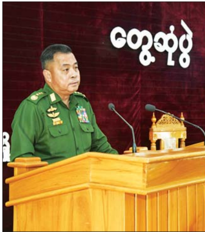
တပ်မတော်ကာကွယ်ရေးဦးစီးချုပ် ဗိုလ်ချုပ်ကြီး ရဲဝင်းဦး မကွေးတပ်နယ်ရှိ အရာရှိ၊ စစ်သည်၊ မိသားစုများအား နယ်မြေခံတပ် သီဟသူရကျင်စံခန်းမ၌ တွေ့ဆုံအမှာစကားပြောကြားစဉ်။

တပ်မတော်တွင် အုပ်ချုပ်ရေးစွမ်းရည်သည် အလွန်အရေးကြီးသည့် အခန်းကဏ္ဍတွင်ရှိပြီး အုပ်ချုပ်မှုမကောင်းလျှင် စစ်ရေးစွမ်းရည်နှင့် စည်းရုံး ရေးစွမ်းရည်ပါ မကောင်းနိုင်သဖြင့် စွမ်းရည်သုံးရပ် တွင် အုပ်ချုပ်မှုစွမ်းရည်သည် အလွန်အရေးကြီး ကြောင်း၊ အုပ်ချုပ်ရေးစွမ်းရည်တွင် စာရေး၊ နေရေး၊ သွားလာရေးထိုင်ရေး၊ စစ်စည်းကမ်းထိန်းသိမ်းရေး အပါအဝင် ကျယ်ကျယ်ပြန့်ပြန့် စည်းစာဆောင်ရွက် သွားရန်လိုအပ်ပြီး တာဝန်ရှိသူများအနေဖြင့်လည်း ထိန်းသိမ်းဆောင်ရွက်သွားရန်လိုကြောင်း၊ အုပ်ချုပ်မှု ပိုင်းဆိုင်ရာ အားနည်းချက်များကြောင့် တပ်တွင်း စည်းလုံးညီညွတ်မှု အားနည်းချက်ကို ဖြစ်ပေါ်နိုင်