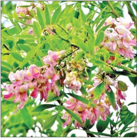
မြေနိမ့်ချယ်ရီပန်းပွင့်များ။