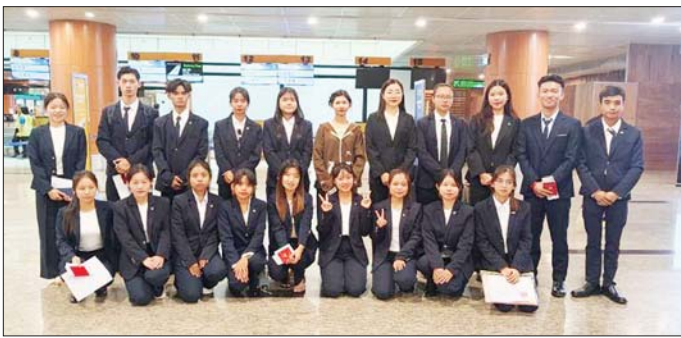
လုပ်ငန်းများ (MSMEs) အတွက် အဓိကကျသော အထည်အလိပ်နှင့် ဒီဇိုင်းကဏ္ဍ၌ ခေတ်မီနည်းပညာ ရှင်များ ပေါ်ထွက်လာစေရန်နှင့် ကုန်ကြမ်းတင်ပို့မှု ထက် နိုင်ငံတကာအဆင့်မီ တန်ဖိုးမြှင့်ကုန်ချော များကို ကိုယ်တိုင်ဒီဇိုင်းရေးဆွဲ ထုတ်လုပ်နိုင်သည့် လူ့စွမ်းအားအရင်းအမြစ်များ ပျိုးထောင်ပေးနိုင်ရန် ရည်ရွယ်ခြင်းဖြစ်ကြောင်း၊ ထို့ပြင် တရုတ်နိုင်ငံ၏ ခေတ်မီနည်းပညာများကို သင်ယူခွင့်ရရှိခြင်းကြောင့်

မြစ်ကြီးနား ဧပြီ ၂၂ ပညာရေးဝန်ကြီးဌာန ပြည်ထောင်စုဝန်ကြီး၏ ကြီးကြပ်မှုဖြင့် မြစ်ကြီးနားတက္ကသိုလ်က နိုင်ငံ တကာနှင့် ပူးပေါင်းဆောင်ရွက်မှုများကို တိုးမြှင့် ဆောင်ရွက်လျက်ရှိရာ မြစ်ကြီးနားတက္ကသိုလ်မှ ကျောင်းသား ကျောင်းသူ ၁၉ ဦးသည် တရုတ်ပြည်သူ့ သမ္မတနိုင်ငံ နန်နင်းမြို့ရှိ Guangxi Economic and Trade Vocational Institute (GXETVI) ၌ "Fashion and Apparel Design" ဘာသာရပ်ဖြင့် သုံးနှစ်တာ ဒီပလိုမာသင်တန်း (Diploma in Fashion and Apparel Design) ကို အပြည့်ပညာသင်ဆု (Full Scholarship)ဖြင့် တက်ရောက်ရန်အတွက် ယနေ့တွင် ရန်ကုန်အပြည်ပြည်ဆိုင်ရာလေဆိပ်မှ ထွက်ခွာသွားသည်။