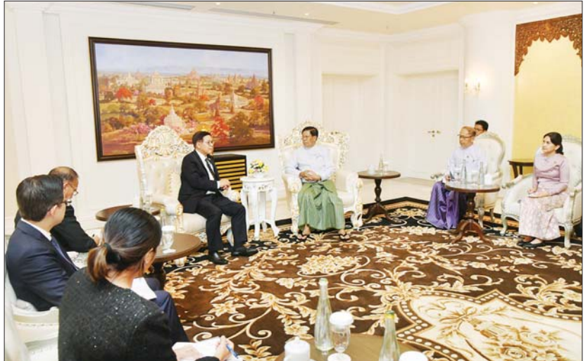
ပြည်ထောင်စုအတိုင်ပင်ခံကောင်စီ၊ ကောင်စီဝင် ဦးသန်းဆွေ ထိုင်းနိုင်ငံ ဒုတိယဝန်ကြီးချုပ်နှင့် နိုင်ငံခြားရေးဝန်ကြီး H.E. Mr. Sihasak Phuangketkaew အား လက်ခံတွေ့ဆုံစဉ်။

(ပုံ) မင်းအောင်လှိုင် နိုင်ငံတော်သမ္မတ ပြည်ထောင်စုသမ္မတမြန်မာနိုင်ငံတော်