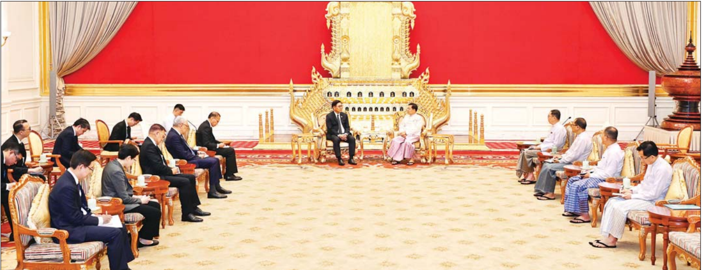
ပြည်ထောင်စုသမ္မတမြန်မာနိုင်ငံတော် နိုင်ငံတော်သမ္မတ ဦးမင်းအောင်လှိုင် ထံ ထိုင်းနိုင်ငံ ဒုတိယဝန်ကြီးချုပ်နှင့် နိုင်ငံခြားရေးဝန်ကြီး H.E. Mr. Sihasak Phuangketkaew ဦးဆောင်သော ကိုယ်စားလှယ်အဖွဲ့ လာရောက်ပါရပ်ပြု တွေ့ဆုံစဉ်။

“ မြန်မာ-ထိုင်းနှစ်နိုင်ငံသည် အိမ်နီးချင်းကောင်းနိုင်ငံများဖြစ်သည်နှင့်အညီ သံတမန် ဆက်ဆံမှုများ ရှည်ကြာကောင်းမွန်လျက်ရှိမှုအခြေအနေများနှင့် ချစ်ကြည်ရင်းနှီးမှုနှင့် ပူးပေါင်းဆောင်ရွက်မှုများ ပိုမိုတိုးမြှင့်ဆောင်ရွက်သွားမည့်အခြေအနေများ၊ နယ်စပ် ဒေသတည်ငြိမ်အေးချမ်းရေး၊ မူးယစ်ဆေးဝါးတားဆီးနှိမ်နင်းရေးနှင့် အွန်လိုင်းလိမ်လည် လောင်းကစားမှုများပပျောက်ရေး၊ နယ်စပ်ဖြတ်ကျော် မီးခိုးမြူငွေများ လျော့ချနိုင်ရေး တို့အတွက် ပူးပေါင်းဆောင်ရွက်သွားမည့်အခြေအနေများ၊ နယ်စပ်ဒေသကုန်သွယ် မှုများ မြှင့်တင်နိုင်ရေးအတွက် ကုန်သွယ်မှုလမ်းကြောင်းများ ပြန်လည်ဖွင့်လှစ် ဆောင်ရွက်လျက်ရှိမှုအခြေအနေများနှင့်ပတ်သက်၍ ရင်းရင်းနှီးနှီး ဆွေးနွေး ”