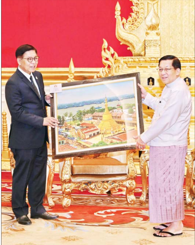
ပြည်ထောင်စုသမ္မတမြန်မာနိုင်ငံတော် နိုင်ငံတော်သမ္မတ ဦးမင်းအောင်လှိုင် နှင့် ထိုင်းနိုင်ငံ ဒုတိယ ဝန်ကြီးချုပ်နှင့် နိုင်ငံခြားရေးဝန်ကြီး H.E. Mr. Sihasak Phuangketkaew တို့ အမှတ်တရ လက်ဆောင် ပစ္စည်းများ အပြန်အလှန်ပေးအပ်စဉ်။

အတွက် ငြိမ်းချမ်းရေးဆွေးနွေးပွဲများ ပြုလုပ်နိုင်ရန် ဖိတ်ခေါ်ထားရုံမူ အခြေအနေများ၊ မြန်မာနိုင်ငံအနေ ဖြင့် အာဆီယံဘုံသဘောတူညီချက်(၅) ရပ်ပါ အချက် များတွင်ပါဝင်သည့် လူသားချင်းစာနာထောက်ထားမှု ဆိုင်ရာကိစ္စရပ်များ၊ ပြည်တွင်းငြိမ်းချမ်းရေး ကြိုးပမ်း ဆောင်ရွက်မှုများနှင့် အခြားအချက်များကို အကောင်း ဆုံး ပူးပေါင်းဆောင်ရွက်လျက်ရှိမှု အခြေအနေများ၊ မြန်မာနိုင်ငံ၏ ငြိမ်းချမ်းရေး လုပ်ငန်းစဉ်များတွင် ထိုင်းနိုင်ငံမှ ပါဝင်ကူညီ ဆောင်ရွက်ပေးသွားမည့် အခြေအနေများ၊ နှစ်နိုင်ငံအကြား စိုက်ပျိုးရေး၊ မွေးမြူရေး၊ ရင်းနှီးမြှုပ်နှံမှု၊ လျှပ်စစ်နှင့်စွမ်းအင်ကဏ္ဍ နှင့် ကုန်ထုတ်လုပ်မှုလုပ်ငန်းများနှင့် ဘက်ပေါင်းစုံ ပူးပေါင်းဆောင်ရွက်မှုများ ဆက်လက်တိုးမြှင့် ဆောင်ရွက်သွားမည့် အခြေအနေများနှင့်ပတ်သက်၍ ရင်းရင်းနှီးနှီး ဆွေးနွေးခဲ့ကြသည်။ ယင်းနောက် နိုင်ငံတော်သမ္မတနှင့် ထိုင်းနိုင်ငံ ဒုတိယဝန်ကြီးချုပ်နှင့် နိုင်ငံခြားရေးဝန်ကြီးတို့သည် အမှတ်တရလက်ဆောင်ပစ္စည်းများ အပြန်အလှန် ပေးအပ်ပြီး တက်ရောက်လာကြသူများနှင့်အတူ စုပေါင်းမှတ်တမ်းတင် ဓာတ်ပုံရိုက်ခဲ့ကြကြောင်း သတင်းရရှိသည်။ သတင်းစဉ်