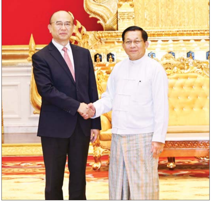
ပြည်ထောင်စုသမ္မတမြန်မာနိုင်ငံတော် နိုင်ငံတော်သမ္မတ ဦးမင်းအောင်လှိုင်နှင့် တရုတ်ပြည်သူ့သမ္မတ နိုင်ငံ ဟေလုံကျန်းပြည်နယ် ပြည်သူ့ကွန်ဂရက်အမြဲတမ်းကော်မတီဥက္ကဋ္ဌနှင့် တရုတ်ကွန်မြူနစ်ပါတီ၏ ဟေလုံကျန်းပြည်နယ်ဆိုင်ရာ ကော်မတီအတွင်းရေးမှူး H.E. Mr. Xu Qin တို့ ရင်းရင်းနှီးနှီးနှုတ်ဆက်စဉ်။

“နှစ်နိုင်ငံနှင့် နှစ်နိုင်ငံခေါင်းဆောင်များအကြား ချစ်ကြည်ရင်းနှီးမှုနှင့် ပူးပေါင်း ဆောင်ရွက်မှုများ ရှည်ကြာကောင်းမွန်ခဲ့ပြီး ဆွေးနွေးပေါက်ဖော်ချစ်ကြည်ရေး ရှိသည့် အခြေအနေများ၊ နှစ်နိုင်ငံအကြား ငြိမ်းချမ်းစွာ အတူယှဉ်တွဲနေထိုင်ရေး မူကြီး ၅ ရပ်နှင့်အညီ အေးအတူပူအမျှ အသိုက်အဝန်းတည်ဆောက်လျက်ရှိမှု အခြေအနေများ၊ မြန်မာနိုင်ငံနှင့် ဟေလုံကျန်းပြည်နယ်တို့အကြား ပူးပေါင်း ဆောင်ရွက်မှုများမြှင့်တင်ပြီး နှစ်နိုင်ငံဆက်ဆံရေးကို ပိုမိုမြှင့်တင်ဆောင်ရွက် နိုင်မှု အခြေအနေများ၊ နှစ်နိုင်ငံအဆင့်မြင့်ခေါင်းဆောင်များ ချစ်ကြည်ရေး ခရီးစဉ်များ အပြန်အလှန်လည်ပတ်ခဲ့မှုအခြေအနေများ၊ မြန်မာနိုင်ငံနှင့်တရုတ် ပြည်သူ့သမ္မတနိုင်ငံ ဟေလုံကျန်းပြည်နယ်တို့အကြား ကဏ္ဍပေါင်းစုံ၌ ပူးပေါင်း ဆောင်ရွက်မှုများ ပိုမိုမြှင့်တင်ဆောင်ရွက်သွားမည့်အခြေအနေများ ဆွေးနွေး”