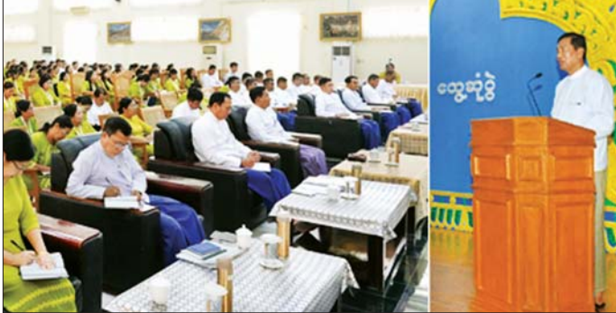
ဝန်ကြီးက နိုင်ငံတော်အစိုးရအနေ ဖြင့် တည်ငြိမ်အေးချမ်းရေး၊ ပညာ ရေး၊ ကျန်းမာရေး၊ ပို့ဆောင်ရေး၊ စိုက်ပျိုးမွေးမြူရေးနှင့် ပြည်သူ လူထု၏ လူမှုစီးပွားဘဝဖွံ့ဖြိုး တိုးတက်ရေးအတွက် ရက်ပေါင်း

နေပြည်တော် ဧပြီ ၂၁ ပြည်ထောင်စုသမ္မတ မြန်မာ နိုင်ငံတော် နိုင်ငံတော်သမ္မတ၏ လမ်းညွှန်ချက်များအား ထပ်ဆင့် ရှင်းလင်းခြင်းနှင့် ဟိုတယ်၊ ခရီး သွားလာရေးနှင့် ယဉ်ကျေးမှု ဝန်ကြီးဌာနမှ ဝန်ထမ်းများနှင့် တွေ့ဆုံပွဲကို ယနေ့တွင် ရုံးအမှတ် (၃၅)နှင့် ရုံးအမှတ်(၃၃)တို့၌ ကျင်းပသည်။ (ယာဝု) တွေ့ဆုံပွဲ၌ ပြည်ထောင်စု ဝန်ကြီး ဦးမောင်မြင့်၊ ဒုတိယ ဝန်ကြီး ဦးအေးထွန်းနှင့် ဦးဖြိုး ဇော်စိုး၊ အမြဲတမ်းအတွင်းဝန်၊ ညွှန်ကြားရေးမှူးချုပ်များ၊ အရာ ထမ်း၊ အမှုထမ်းများ တက်ရောက်