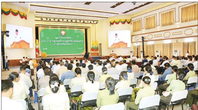
၍ ကဏ္ဍအလိုက်ဆောင်ရွက်မည့် အခြေအနေများကို က နိဂုံးချုပ်အမှာစကား ပြောကြားခဲ့ကြောင်း ရှင်းလင်းပြောကြားပြီး တိုင်းဒေသကြီးဝန်ကြီးချုပ် သိရသည်။ သတင်းစဉ်

စည်းကမ်းများနှင့်အညီ ပွင့်လင်းမြင်သာစွာဆောင်ရွက်ကြရမည်ဖြစ်ကြောင်း အမှာစကားပြောကြားသည်။ ထို့နောက် တိုင်းဒေသကြီး စီမံကိန်း၊ စီးပွားရေးနှင့် ဘဏ္ဍာရေးဝန်ကြီးက ၂၀၂၆-၂၀၂၇ ဘဏ္ဍာရေးနှစ် ဒေသန္တရစီမံကိန်းတွင်ပါဝင်သည့် လုပ်ငန်းများနှင့် ပတ်သက်၍ ရှင်းလင်းပြောကြားပြီး တိုင်းဒေသကြီး စီမံကိန်းရေးဆွဲရေးဦးစီးဌာန ညွှန်ကြားရေးမှူးက ဒေသန္တရစီမံကိန်းရည်မှန်းချက်များနှင့်ပတ်သက်၍ ရှင်းလင်းတင်ပြသည်။ ယင်းနောက် တိုင်းဒေသကြီးဝန်ကြီးချုပ်က ၂၀၂၆-၂၀၂၇ ဘဏ္ဍာရေးနှစ် ဒေသန္တရစီမံကိန်းရည်မှန်းချက်တာဝန်များကို တိုင်းဒေသကြီးဝန်ကြီးများနှင့် ခရိုင်စီမံကိန်းရေးဆွဲ အကောင်အထည်ဖော်ရေးကော်မတီဥက္ကဋ္ဌများထံ ပေးအပ်သည်။ ဆက်လက်၍ တိုင်းဒေသကြီးဝန်ကြီးများက ဒေသဖွံ့ဖြိုးတိုးတက်ရေးလုပ်ငန်းများနှင့် ပတ်သက်