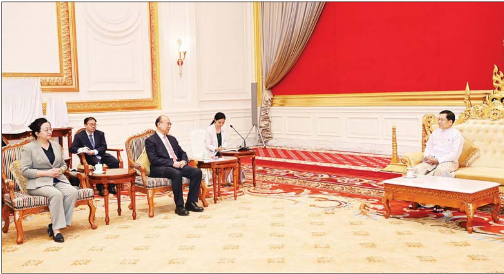
ပြည်ထောင်စုသမ္မတမြန်မာနိုင်ငံတော် နိုင်ငံတော်သမ္မတ ဦးမင်းအောင်လှိုင်ထံ တရုတ်ပြည်သူ့သမ္မတနိုင်ငံ ဟေလုံကျန်းပြည်နယ် ပြည်သူ့ကွန်ဂရက်အမြဲတမ်း ကော်မတီဥက္ကဋ္ဌနှင့် တရုတ်ကွန်မြူနစ်ပါတီ၏ ဟေလုံကျန်းပြည်နယ်ဆိုင်ရာ ကော်မတီအတွင်းရေးမှူး H.E. Mr. Xu Qin ဦးဆောင်သော ကိုယ်စားလှယ်အဖွဲ့ ဂါရဝပြုတွေ့ဆုံစဉ်။

နေပြည်တော် ဧပြီ ၂၁ ပြည်ထောင်စုသမ္မတမြန်မာနိုင်ငံတော် နိုင်ငံတော် သမ္မတ ဦးမင်းအောင်လှိုင်ထံ တရုတ်ပြည်သူ့သမ္မတ နိုင်ငံ ဟေလုံကျန်းပြည်နယ် ပြည်သူ့ကွန်ဂရက် အမြဲတမ်းကော်မတီဥက္ကဋ္ဌနှင့် တရုတ်ကွန်မြူနစ်ပါတီ၏ ဟေလုံကျန်းပြည်နယ်ဆိုင်ရာ ကော်မတီ အတွင်းရေးမှူး H.E. Mr. Xu Qin ဦးဆောင်သော ကိုယ်စားလှယ်အဖွဲ့က ယနေ့နံနက်ပိုင်းတွင် နေပြည်တော်ရှိ နိုင်ငံတော်သမ္မတ၏ ဧည့်ဆောင် တော်၌ လာရောက်ဂါရဝပြုတွေ့ဆုံသည်။