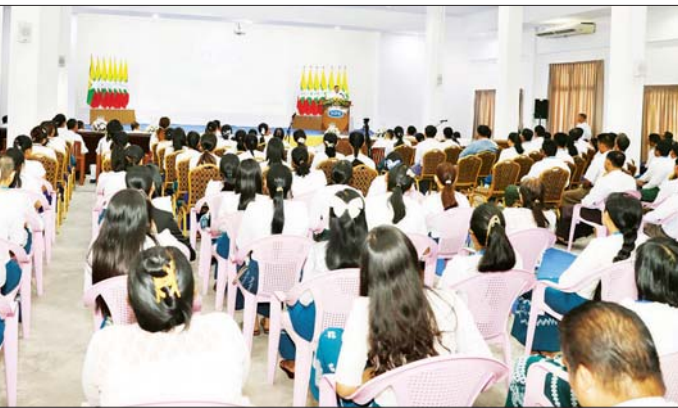
ရောက်ရှိပြီး နိုင်ငံတော်အဆင့်ပုံနှိပ်စာအုပ်များ၊ ဆက်လက်၍ စာပြင်ဌာန၊ CTP ဌာန၊ ပလိတ်ကူး အစိုးရဌာနများမှအပံ့အသွား ပုံနှိပ်စာအုပ်များ၊ ခန်း၊ ပုံနှိပ်စက်ခန်းများအတွင်း လုပ်ငန်းဆောင်ရွက် ကျောင်းသားပုံနှိပ်စာအုပ်များ ခင်းကျင်းပြသထားမှုကို နေမှုများကို ကြည့်ရှုစစ်ဆေးပြီး ဝန်ထမ်းအိမ်ရာများ ကြည့်ရှုစစ်ဆေးသည်။ ကို လှည့်လည်ကြည့်ရှုစစ်ဆေးခဲ့သည်။ သတင်းစဉ်

လက်တွဲဆောင်ရွက်ကြရန်၊ ကျောင်းသားလူငယ်များ အပါအဝင် ကျေးလက်နေလူငယ်လူရွယ်များ စာဖတ် ချင်လာအောင်၊ စာဖတ်ရှိန်ဖြင့်မားလာအောင် ကြိုးပမ်းဆောင်ရွက်သွားရန်၊ တစ်ဦးနှင့်တစ်ဦး ချစ်ချစ်ခင်ခင်ဖြင့် ရိုင်းပင်းကူညီ ဆောင်ရွက်သွား ရန်၊ စက်ယန္တရားများ၊ ပစ္စည်းကိရိယာများကိုလည်း မပျက်မစီးအောင် မိမိတို့အတွက် အကြံပေးမှုတည်ပြီး ကြိုတင်မြော်တွေးကာကွယ်သွားကြရန်နှင့် နေရာသီ ရောက်ရှိပြီဖြစ်၍ မီးဘေးအန္တရာယ် ကြိုတင်သတိပြု ဆောင်ရွက်သွားကြရန် မှာကြားသည်။ တွေ့ဆုံပွဲတွင် ဒုတိယဝန်ကြီး ဦးရဲတင့်က ပုံနှိပ် ရေးနှင့် ထုတ်ဝေရေးဦးစီးဌာနနှင့် သတင်းနှင့် စာနယ် ဇင်းလုပ်ငန်းတို့၏ လုပ်ငန်းဆောင်ရွက်နေမှုများ နှင့် ပတ်သက်၍ ဖြည့်စွက်ရိုင်းလင်းဆေးနေ့သည်။ ထို့နောက် ပြည်ထောင်စုဝန်ကြီးနှင့် ဒုတိယ ဝန်ကြီးတို့သည် ကြေးမုံသတင်းစာတိုက်နှင့် မြန်မာ့ အလင်းသတင်းစာတိုက် စာတည်းခန်းများ၊ ပုံနှိပ် စက်ခန်းများကို ကြည့်ရှုစစ်ဆေးသည်။ ယင်းနောက် နေပြည်တော်ပုံနှိပ်စက်ရုံသို့