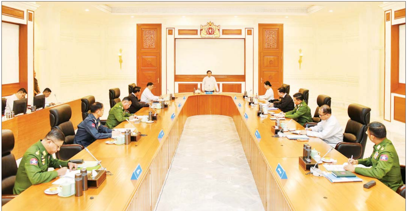
နိုင်ငံတော်သမ္မတ ဦးမင်းအောင်လှိုင် ပြည်ထောင်စုသမ္မတမြန်မာနိုင်ငံတော် အမျိုးသားကာကွယ်ရေးနှင့် လုံခြုံရေးကောင်စီအစည်းအဝေးတွင် အမှာစကားပြောကြားစဉ်။