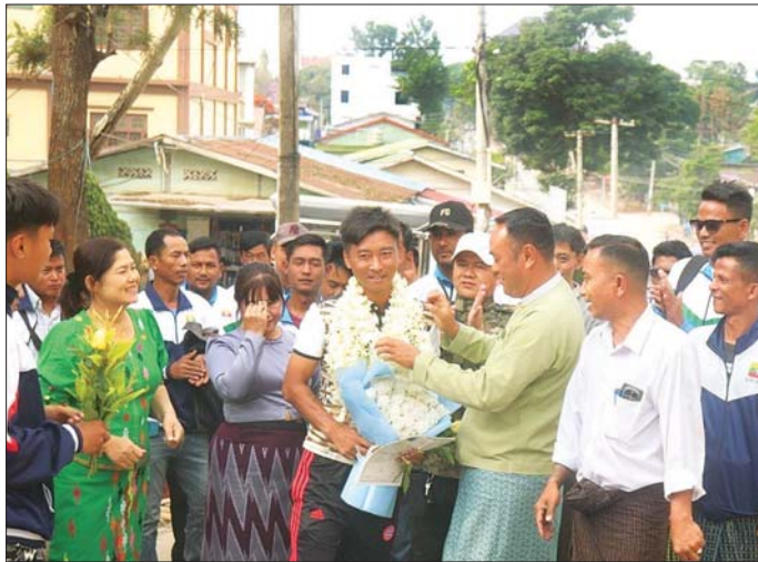
သတ်မှတ်စစ်မှုထမ်းကာလပြည့်မြောက်ခဲ့သည့် ပြည်သူ့စစ်မှုထမ်းသင်တန်းအမှတ်စဉ် (၁/၂၀၂၄) မှ ပြည်သူ့စစ်မှုထမ်းများ၏ အိမ်အပြန်ခရီးလမ်းများတွင် မိသားစုဝင်များနှင့် ဒေသခံပြည်သူများက သောင်းသောင်းဖြဖြ ဂုဏ်ပြုကြိုဆိုကြစဉ်။

ကျောဖုံးမှ ထိုသို့ တပ်ရင်း/တပ်ဖွဲ့များ၌ တာဝန်ထမ်းဆောင်ခဲ့ကြသည့် ပြည်သူ့စစ်မှုထမ်း သင်တန်းအမှတ်စဉ် (၁/၂၀၂၄) မှ ပြည်သူ့စစ်မှုထမ်းများကို သတ်မှတ်စစ်မှုထမ်းကာလ ပြည့်မြောက်ခဲ့သဖြင့် ပြည်သူ့စစ်မှုထမ်းဆောင်ပြီးကြောင်း လက်မှတ်၊ ပြည်သူ့စစ်မှုထမ်းတံဆိပ်နှင့် ဂုဏ်ပြုမှတ်တမ်းလွှာများကို တိုင်းစစ်ဌာနချုပ်အသီးသီး၌ အခမ်းအနားများဖြင့် ချီးမြှင့်အပ်နှင်းပေးအပ်ခဲ့ပြီး မိသားစုဝင်များထံသို့ လည်းကောင်း၊ ၎င်းတို့၏နေရပ်အသီးသီးသို့လည်းကောင်း ပြန်လည်အပ်နှင်းပေးလွှတ်ခဲ့ပြီး ဖြစ်သည်။ ထိုသို့ နိုင်ငံတော်အတွက် နိုင်ငံ့သားကောင်း၊ တပ်မတော်အတွက် စစ်သည်တော်ကောင်းတစ်ဦး ဝိသတ္တ တာဝန်များကို ကျေပွန်စွာထမ်းဆောင်လာခဲ့ကြသည့် ပြည်သူ့စစ်မှုထမ်းများ၏ အိမ်အပြန်ခရီး