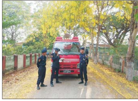
လှည့်လည်၍ မီးဘေးအန္တရာယ်ကာကွယ်ရေး ဆော်သွင်းလုပ်ငန်းများ ဆောင်ရွက်ခဲ့ကြောင်း သိရသည်။