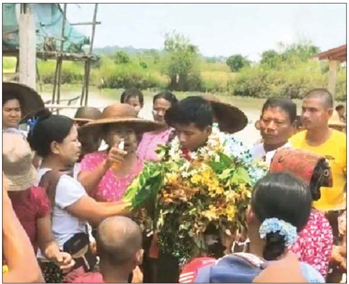
သတ်မှတ်စစ်မှုထမ်းကာလပြည့်မြောက်ခဲ့သည့် ပြည်သူ့စစ်မှုထမ်းသင်တန်းအမှတ်စဉ် (၁/၂၀၂၄) မှ ပြည်သူ့စစ်မှုထမ်းများ၏ အိမ်အပြန်ခရီးလမ်းများတွင် မိသားစုဝင်များနှင့် ဒေသခံပြည်သူများက သောင်းသောင်းဖြဖြ ဂုဏ်ပြုကြိုဆိုကြစဉ်။

လေးစားစွာ ကြိုဆိုခဲ့မှုအပေါ် ကြည်နူးဂုဏ်ယူရမှုတို့ကို ၎င်းတို့၏ အိမ်ပြန်ခရီးကြိုဆိုမှု မြင်ကွင်းများကို လူမှုကွန်ရက် စာမျက်နှာများတွင် တွေ့မြင်ရသည်။ အဆိုပါ နိုင်ငံ့သားကောင်းစစ်မှုထမ်းများသည် စစ်မှုထမ်းဆောင်နေစဉ်ကာလအတွင်း နိုင်ငံတော်နှင့် တပ်မတော်က ပေးအပ်လာသော ကာကွယ်ရေးတာဝန်၊ လုံခြုံရေးတာဝန်များနှင့် သဘာဝဘေးအန္တရာယ်များဖြစ်ပွားလာချိန်တွင် ကူညီကယ်ဆယ်ရေးတာဝန်များကို ကိုယ်ကျိုးမဖက်ဘဲ စွန့်လွှတ်အနစ်နာခံကာ အမြဲတမ်းစစ်မှုထမ်းများနှင့်အတူ တာဝန်ကို ကျေပွန်စွာ ထမ်းဆောင်ခဲ့ကြသူများ ဖြစ်သည်။ ထို့ကြောင့် နိုင်ငံတော်နှင့် တပ်မတော်အနေဖြင့်