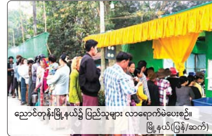
ညောင်တုန်းမြို့နယ်၌ ပြည်သူများ လာရောက်မဲပေးစဉ်။ မြို့နယ်(ပြန်/ဆက်)