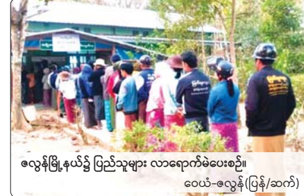
လွန်မြို့နယ်၌ ပြည်သူများ လာရောက်မဲပေးစဉ်။ ဝေယံ-လွန်(ပြန်/ဆက်)