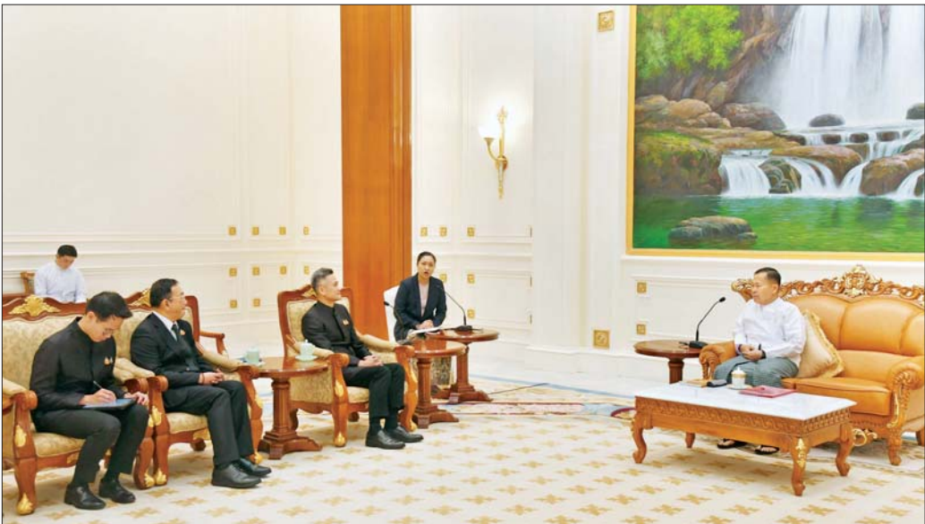
နိုင်ငံတော်လုံခြုံရေးနှင့် အေးချမ်းသာယာရေးကော်မရှင် ဒုတိယဥက္ကဋ္ဌ ဒုတိယဗိုလ်ချုပ်မှူးကြီး စိုးဝင်း ပြည်ထောင်စုသမ္မတမြန်မာနိုင်ငံဆိုင်ရာ ထိုင်းနိုင်ငံ သံအမတ်ကြီး H.E. Mr. Mongkol Visitstump အား လက်ခံတွေ့ဆုံစဉ်။

နေပြည်တော် ဇန်နဝါရီ ၂၆ နိုင်ငံတော်လုံခြုံရေးနှင့် အေးချမ်းသာယာရေးကော်မရှင် ဒုတိယဥက္ကဋ္ဌ ဒုတိယဗိုလ်ချုပ်မှူးကြီး စိုးဝင်းသည် တာဝန်ပြန်လှမ်းခြင်း ပြန်လည်ထွက်ခွာတော့မည့် ပြည်ထောင်စုသမ္မတ မြန်မာနိုင်ငံဆိုင်ရာ ထိုင်းနိုင်ငံ သံအမတ်ကြီး H.E. Mr. Mongkol Visitstump အား ယနေ့မွန်းလွဲပိုင်းတွင် အမျိုးသားကာကွယ်ရေးနှင့် လုံခြုံရေးကောင်စီရုံး သံတမန်ဆောင်ရွက်ခန်းမ၌ လက်ခံတွေ့ဆုံသည်။ တွေ့ဆုံစဉ် မြန်မာ - ထိုင်း နှစ်နိုင်ငံ အစိုးရနှင့် တပ်မတော်နှစ်ရပ်ကြား ချစ်ကြည်ရင်းနှီးမှုနှင့် ပူးပေါင်း ဆောင်ရွက်မှုဆိုင်ရာကိစ္စရပ်များ၊ နှစ်နိုင်ငံ နယ်စပ် ဒေသတစ်လျှောက် ဖြစ်ပွားလျက်ရှိသည့် အန္တရာယ်လိမ်လည်လောင်းကစားမှုများ၊ မူးယစ်ဆေးဝါးများ နှင့် တရားမဝင်ကုန်သွယ်မှုတိုက်ဖျက်ရေးလုပ်ငန်း များကို အမျိုးသားရေးတာဝန်တစ်ရပ်အနေဖြင့် ဆောင်ရွက်လျက်ရှိမှု၊ နှစ်နိုင်ငံ ကုန်သွယ်မှု၊ ကုန်စည် စီးဆင်းမှုများ ပြန်လည်ကောင်းမွန်ရေးအတွက် နယ်စပ်ကုန်သွယ်ရေးလမ်းကြောင်းများ အမြန်ဆုံး ပြန်လည်ဖွင့်လှစ်နိုင်ရေးနှင့် နယ်စပ်ဒေသတည်ငြိမ် အေးချမ်းရေးတို့ကို နှစ်နိုင်ငံအစိုးရနှင့် တပ်မတော် နှစ်ရပ်အကြား ပူးပေါင်းဆောင်ရွက်သွားမည့် စာမျက်နှာ ၃ ကော်လံ ၄ ။