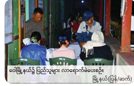
ဝေါမြို့နယ်၌ ပြည်သူများ လာရောက်မဲပေးစဉ်။ မြို့နယ်(ပြန်/ဆက်)