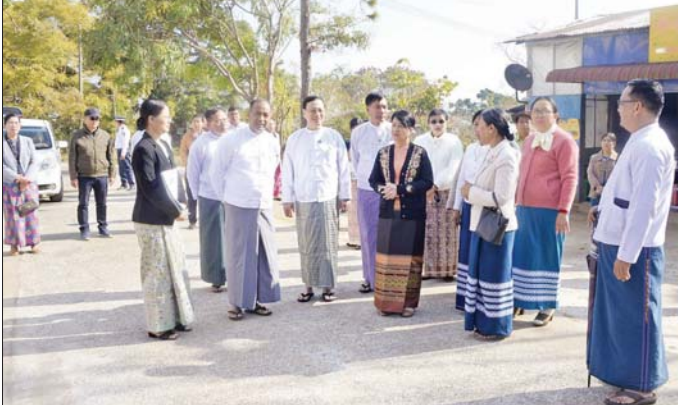
ယင်းနောက် ပြည်ထောင်စု ဝန်ကြီးသည် တောင်ကြီးပညာရေး ဒီဂရီကောလိပ်၌ ကျောင်းအုပ်ကြီး၊ ဆရာ ဆရာမများ၊ သင်တန်းသား သင်တန်းသူများနှင့် တွေ့ဆုံပြီး တောင်ကြီးပညာရေးဒီဂရီကောလိပ် ကို တက္ကသိုလ်အဖြစ် အဆင့် မြှင့်တင်မည်ဖြစ်ကြောင်း၊ ယင်းသို့ အဆင့်မြှင့်တင်ရာတွင် ပညာရေး ဒီဂရီကောလိပ် ငါးကျောင်းကို တက္ကသိုလ်အဆင့်မြှင့်တင်နိုင်ရန် အဆင်သင့် ပြင်ဆင်ထားရှိရမည် ဖြစ်ပြီး အဆောက်အအုံပိုင်းဖြစ် သည့် ရုပ်ပိုင်းဆိုင်ရာတည်ဆောက် ရေးကိစ္စများလည်း ပြင်ဆင်ထားရ မည်ဖြစ်သကဲ့သို့ သင်ကြားရေးကိစ္စ များတွင်လည်း ပြင်ဆင်ထားရှိရ မည်ဖြစ်ကြောင်း ဆရာ ဆရာမများ အနေဖြင့် မိမိတို့၏ သင်ရိုးညွှန်းတမ်း များကို ညှိနှိုင်းရေးဆွဲရမည်ဖြစ်ပြီး သင်ရိုးညွှန်းတမ်းများ ညှိနှိုင်း

ထိုနောက် ပြည်ထောင်စု ဝန်ကြီး၊ ပြည်နယ်ဝန်ကြီးချုပ်နှင့် အဖွဲ့ဝင်များသည် ပြန်လည်ပြင်ဆင် ရန်လိုအပ်သည့် ကွန်ပျူတာ တက္ကသိုလ် (တောင်ကြီး) ပင်မ ဆောင်နှင့် စာသင်ဆောင်များ ပြန်လည်ပြင်ဆင်နိုင်ရေး ဆွေးနွေး ကြပြီး ကွန်ပျူတာတက္ကသိုလ်ပင်မ ဆောင်၊ ဘောလုံးအားကစားကွင်း နှင့် ပြေးလမ်းများ တည်ဆောက် မည့်မြေနေရာနှင့် ကျောင်းသား ကျောင်းသူ အိပ်ဆောင်တိုးချဲ့ တည်ဆောက်မည့် မြေနေရာ၊ တောင်ကြီးတက္ကသိုလ် သုတေသန စင်တာ ဓာတုဗေဒနှင့် ဇီဝဓာတု ဗေဒ သုတေသနခန်း၊ ရူပဗေဒ သုတေသနခန်းများတွင် ကျောင်း သား ကျောင်းသူများ လက်တွေ့ သုတေသန ဆောင်ရွက်နေမှု၊ တက္ကသိုလ်အတွင်းရှိ အပန်းဖြေ ရိပ်သာနှင့် မိုးလုံလေလုံအားကစား ခန်းမတို့ကို လှည့်ကြည့်ရှုသည်။