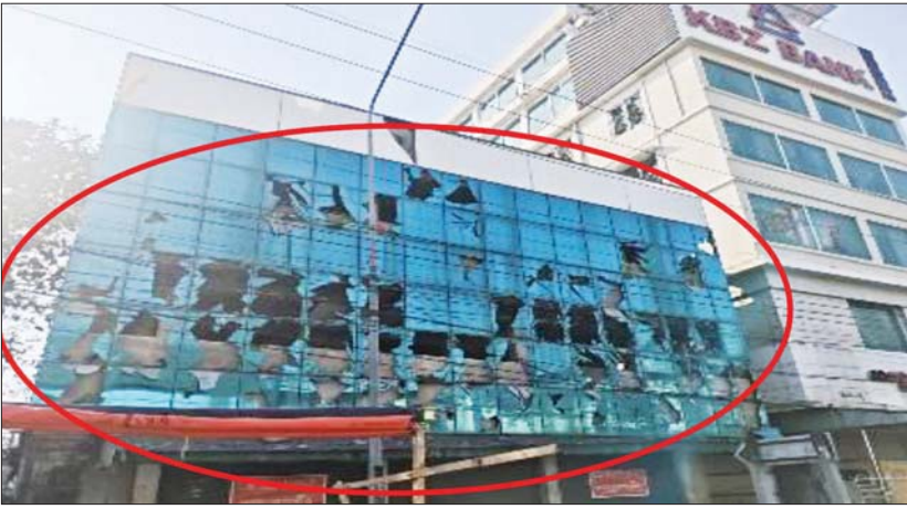
အကြမ်းဖက်အဖျက်သမား သောင်းကျန်းသူအုပ်စုက ကရင်ပြည်နယ် မြဝတီမြို့ အမှတ်(၃) ရပ်ကွက်ရှိ ကမ္ဘောဇဘဏ်အနီး၌ ဒေသန္တရလက်လုပ်ခိုင်းများဖြင့် ဖောက်ခွဲမှုအား တွေ့ရစဉ်။

နေပြည်တော် ဇန်နဝါရီ ၂၆ ဒီမိုကရေစီစနစ်တွင် ရွေးကောက်ပွဲသည် အရေးကြီးဆုံးဖြစ်ပြီး မိမိအဖွဲ့အစည်းများ အနေဖြင့် မိမိတို့၏ နိုင်ငံသားအခွင့်အရေးဖြစ်သည့် မဲပေးပိုင်ခွင့်ကို အသုံးပြုပြီး နိုင်ငံ၏အနာဂတ်လမ်းကြောင်းကို ရွေးချယ် ဆုံးဖြတ်ရမည်ဖြစ်သည်။ သို့ဖြစ်၍ ပြည်သူ တစ်ရပ်လုံးလိုလားတောင့်တသည့် စစ်မှန်၍ စည်းကမ်းပြည့်ဝသော ပါတီစုံဒီမိုကရေစီ စနစ်ကို အောင်မြင်စွာကျင်းပနိုင်ရေး အတွက် ပါတီစုံဒီမိုကရေစီအထွေထွေ ရွေးကောက်ပွဲကို နိုင်ငံတော်အစိုးရ၏ ဦးဆောင်မှု၊ ပြည်သူလူထု၏ လိုက်ပါ ဆောင်ရွက်မှုတို့ဖြင့် အပိုင်းလိုက် ကျင်းပ ဆောင်ရွက်ပေးခဲ့ရာ အကြမ်းဖက်အဖျက် သမားသောင်းကျန်းသူအုပ်စုများ၏ အဖျက် အမှောင့်လုပ်ရပ်များကြားမှ အောင်မြင်စွာ ကျင်းပပြုလုပ်ပြီးစီးခဲ့ပြီဖြစ်သည်။ စာမျက်နှာ ၁၅ ကော်လံ ၁ *