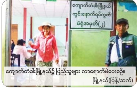
ကျောက်တံခါးမြို့နယ်၌ ပြည်သူများ လာရောက်မဲပေးစဉ်။ မြို့နယ်(ပြန်/ဆက်)