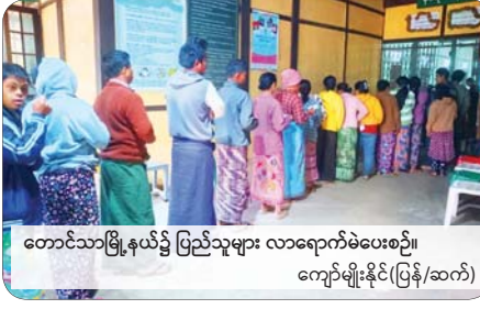
တောင်သာမြို့နယ်၌ ပြည်သူများ လာရောက်မဲပေးစဉ်။ ကျော်မျိုးနိုင်(ပြန်/ဆက်)