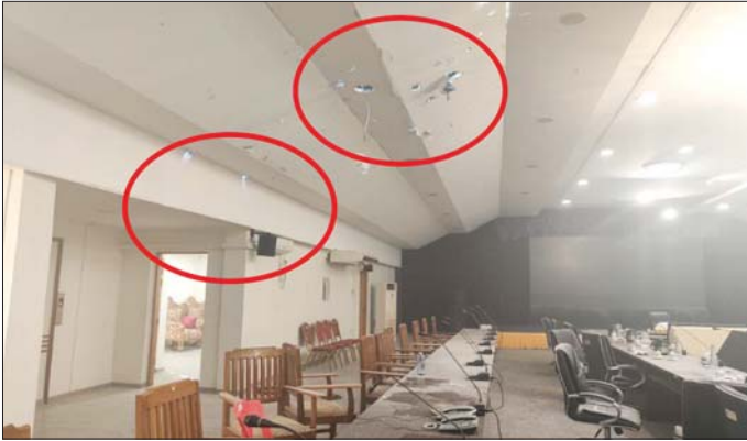
အကြမ်းဖက်အဖျက်သမား သောင်းကျန်းသူအုပ်စုက တနင်္သာရီတိုင်းဒေသကြီးအစိုးရအဖွဲ့ရုံးအား ရှေ့တိုက်ခုံးများဖြင့် ပစ်ခတ်မှုကြောင့် ဖျက်စီးမှုအား တွေ့ရစဉ်။