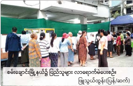
စမ်းချောင်းမြို့နယ်၌ ပြည်သူများ လာရောက်မဲပေးစဉ်။ ဖြူသွယ်ထွန်း(ပြန်/ဆက်)