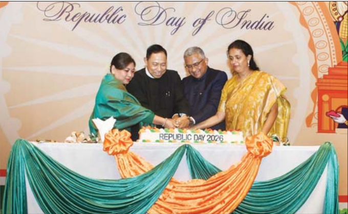
ပြည်ထောင်စုဝန်ကြီး ဒုတိယဗိုလ်ချုပ်ကြီး ရာပြည့်နှင့် ဇနီး၊ မြန်မာနိုင်ငံဆိုင်ရာ အိန္ဒိယနိုင်ငံသံအမတ်ကြီး H.E.Mr.Abhay Thakur နှင့် ဇနီးတို့က အိန္ဒိယနိုင်ငံ၏ (၇၇)နှစ်မြောက် အမျိုးသားနေ့အထိမ်းအမှတ်ကိတ်ကို လှီးဖြတ်ပေးစဉ်။

များအား ရင်းရင်းနှီးနှီး ကြိုဆိုနှုတ်ဆက်ကြသည်။ ထို့နောက် ပြည်ထောင်စုသမ္မတမြန်မာနိုင်ငံတော် နိုင်ငံတော်သီချင်းနှင့် အိန္ဒိယနိုင်ငံ နိုင်ငံတော်သီချင်းတို့ဖြင့် အခမ်းအနားကို ဖွင့်လှစ်သည်။ ယင်းနောက် မြန်မာနိုင်ငံဆိုင်ရာ အိန္ဒိယနိုင်ငံသံအမတ်ကြီးနှင့် ပြည်ထောင်စုဝန်ကြီး ဒုတိယဗိုလ်ချုပ်ကြီး ရာပြည့်တို့က နှုတ်ခွန်းဆက်စကား ပြောကြားသည်။ ဆက်လက်၍ ပြည်ထောင်စုဝန်ကြီး ဒုတိယဗိုလ်ချုပ်ကြီး ရာပြည့်နှင့် ဇနီး၊ မြန်မာနိုင်ငံဆိုင်ရာ အိန္ဒိယနိုင်ငံသံအမတ်ကြီးနှင့် ဇနီးတို့က အိန္ဒိယနိုင်ငံ၏ (၇၇)နှစ်မြောက် အမျိုးသားနေ့အထိမ်းအမှတ် ကိတ်ကို လှီးဖြတ်ပေးကြသည်။ ထို့နောက် ပြည်ထောင်စုဝန်ကြီးနှင့် ဇနီး၊ သံအမတ်ကြီးနှင့် ဇနီးတို့သည် ဧည့်ခံပွဲအခမ်းအနားသို့ တက်ရောက်လာကြသော ဧည့်သည်တော်များနှင့်အတူ စုပေါင်းမှတ်တမ်းတင်ဓာတ်ပုံရိုက်ပြီး သံအမတ်ကြီးက ညစာစားပွဲဖြင့် တည်ခင်းဧည့်ခံခဲ့သည်။ သတင်းစဉ်