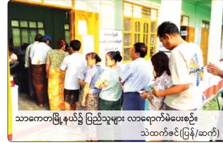
သာကောတမြို့နယ်၌ ပြည်သူများ လာရောက်မဲပေးစဉ်။ သဲထက်ဇင်(ပြန်/ဆက်)