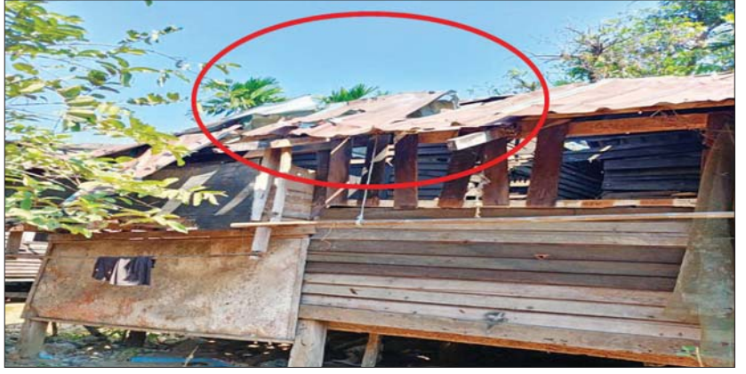
အကြမ်းဖက်အဖျက်သမားသောင်းကျန်းသူအုပ်စု ပစ်ခတ်ခဲ့သည့် Drop Bomb ကျရောက် ပေါက်ကွဲမှုကြောင့် တနင်္သာရီတိုင်းဒေသကြီး လောင်းလုံးမြို့ မြို့ရံစခန်းရှိ အိမ်ထောင်သည်လှိုင်းခန်းပျက်စီးမှုအား တွေ့ရစဉ်။

တနင်္သာရီတိုင်းဒေသကြီး အစိုးရအဖွဲ့ဖြင့် ပစ်ခတ်တိုက်ခိုက်ခြင်း၊ မြင်းခြံမြို့ရုံးအား Fixed Wing ဖြင့်ပစ်ခတ်ခြင်း၊ တရားရုံးအနီးနှင့် ခမောက်ကြီးမြို့ အောင်ချမ်းသာကျေးရွာအုပ်စု ယုစုဆီအနီးကျေးရွာ၊ မာရမ်းမြို့နယ် ဆန္ဒမဲပေးရန် မဲရုံသို့ သွားရောက်သည့် ဆီအုန်းခြံလုပ်သား ၁၇၀ အား တားဆီးခြင်း၊ စစ်ကိုင်းတိုင်းဒေသကြီး ရွှေဘိုမြို့ အမှတ်(၃)ရပ်ကွက်ရှိ မဲရုံအမှတ်(၂) အနီးသို့ Drop Bomb ချတိုက်ခိုက်ခြင်း၊ စစ်ကိုင်းမြို့ တိုင်းရင်းသားလူငယ်များ စွမ်းရည်ဖွံ့ဖြိုးရေး ဒီဂရီကောလိပ်သို့ လက်လုပ်ရှေ့တိုက်ခုံးဖြင့် ပစ်ခတ်တိုက်ခိုက်ခြင်း၊ တမူးမြို့ ဇော်ဘွား(၁)ရပ်ကွက်၊ အမှတ်(၂) အခြေခံပညာအထက်တန်းကျောင်းရှိ မဲရုံအမှတ်(၃) အနီးသို့ Drop Bomb ချတိုက်ခိုက်ခြင်း၊ ကသာမြို့ မြောက်ဘက်နှင့် တောင်ဘက်မှ လက်နက်ငယ်၊ လက်နက်ကြီးများဖြင့် နှောင့်ယှက်ပစ်ခတ်ခြင်း၊ မန္တလေးတိုင်းဒေသကြီး မတ္တရာမြို့နယ် နန်းတော်ကျွန်းကျေးရွာအတွင်းနှင့် အောင်မြေသာစံမြို့နယ်အတွင်းတို့သို့ ၁၀၇ မမ ရှေ့တိုက်ခုံးများ