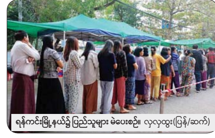
ရန်ကင်းမြို့နယ်၌ ပြည်သူများ မဲပေးစဉ်။ လှလှထွန်း(ပြန်/ဆက်)