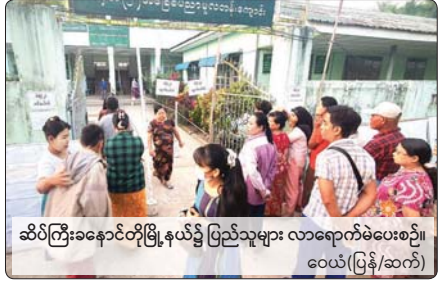
ဆိပ်ကြီးခနောင်တိုမြို့နယ်၌ ပြည်သူများ လာရောက်မဲပေးစဉ်။ ဝေယံ(ပြန်/ဆက်)

၂၀၂၅ ခုနှစ် ပါတီစုံဒီမိုကရေစီ အထွေထွေရွေးကောက်ပွဲ အပိုင်း (၃)ကို ဇန်နဝါရီ ၂၅ ရက် နံနက် ၆ နာရီမှ စတင်ကာ တစ်နိုင်ငံလုံးရှိ ရွေးကောက်ပွဲကျင်းပရန် သတ်မှတ်ထားသည့်နယ်မြေများ၌ ကျင်းပရ မဲဆန္ဒရှင်ပြည်သူများက ရွေးကောက်ပွဲကို ယုံကြည်ချက်အပြည့်ဖြင့် အေးချမ်းလွတ်လွတ်စွာ ဆန္ဒမဲပေးခဲ့ကြသည်။