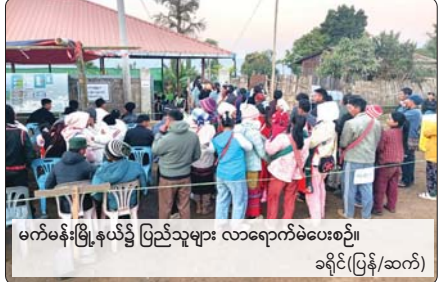
မက်မန်းမြို့နယ်၌ ပြည်သူများ လာရောက်မဲပေးစဉ်။ ခရိုင်(ပြန်/ဆက်)