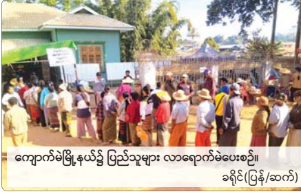
ကျောက်မဲမြို့နယ်၌ ပြည်သူများ လာရောက်မဲပေးစဉ်။ ခရိုင်(ပြန်/ဆက်)