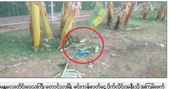
မန္တလေးတိုင်းဒေသကြီး တောင်ဘုမြို့ မင်းကန်ဓာတ်ငွေ့ဂိုက်လှိုင်းအနီးသို့ အကြမ်းဖက်အဖျက်သမားသောင်းကျန်းသူအုပ်စု ပစ်ခတ်ခဲ့သည့် Drop Bomb နှင့် လက်လုပ်စိန်ပြောင်းမိုင်းများ ကျရောက်ပေါက်ကွဲမှုအား တွေ့ရစဉ်။

ဖြင့် ပစ်ခတ်တိုက်ခိုက်ခြင်း၊ မြင်းခြံမြို့ရုံးအား Fixed Wing ဖြင့်ပစ်ခတ်ခြင်း၊ တရားရုံးအနီးနှင့် ခမောက်ကြီးမြို့ အောင်ချမ်းသာကျေးရွာအုပ်စု ယုစုဆီအနီးကျေးရွာ၊ မာရမ်းမြို့နယ် ဆန္ဒမဲပေးရန် မဲရုံသို့ သွားရောက်သည့် ဆီအုန်းခြံလုပ်သား ၁၇၀ အား တားဆီးခြင်း၊ စစ်ကိုင်းတိုင်းဒေသကြီး ရွှေဘိုမြို့ အမှတ်(၃)ရပ်ကွက်ရှိ မဲရုံအမှတ်(၂) အနီးသို့ Drop Bomb ချတိုက်ခိုက်ခြင်း၊ စစ်ကိုင်းမြို့ တိုင်းရင်းသားလူငယ်များ စွမ်းရည်ဖွံ့ဖြိုးရေး ဒီဂရီကောလိပ်သို့ လက်လုပ်ရှေ့တိုက်ခုံးဖြင့် ပစ်ခတ်တိုက်ခိုက်ခြင်း၊ တမူးမြို့ ဇော်ဘွား(၁)ရပ်ကွက်၊ အမှတ်(၂) အခြေခံပညာအထက်တန်းကျောင်းရှိ မဲရုံအမှတ်(၃) အနီးသို့ Drop Bomb ချတိုက်ခိုက်ခြင်း၊ ကသာမြို့ မြောက်ဘက်နှင့် တောင်ဘက်မှ လက်နက်ငယ်၊ လက်နက်ကြီးများဖြင့် နှောင့်ယှက်ပစ်ခတ်ခြင်း၊ မန္တလေးတိုင်းဒေသကြီး မတ္တရာမြို့နယ် နန်းတော်ကျွန်းကျေးရွာအတွင်းနှင့် အောင်မြေသာစံမြို့နယ်အတွင်းတို့သို့ ၁၀၇ မမ ရှေ့တိုက်ခုံးများ