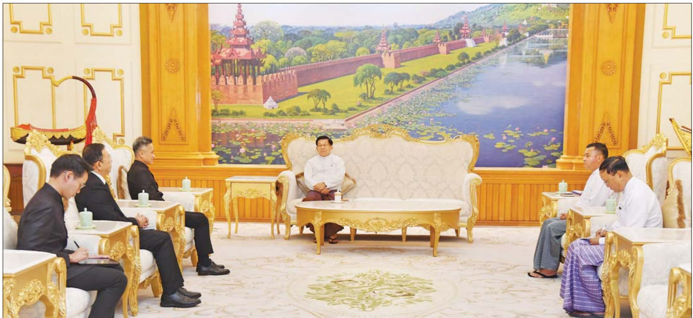
ပြည်ထောင်စုသမ္မတမြန်မာနိုင်ငံတော် ယာယီသမ္မတ နိုင်ငံတော်လုံခြုံရေးနှင့် အေးချမ်းသာယာရေးကော်မရှင်ဥက္ကဋ္ဌ ဗိုလ်ချုပ်မှူးကြီး မင်းအောင်လှိုင် မြန်မာနိုင်ငံဆိုင်ရာ ထိုင်းနိုင်ငံသံအမတ်ကြီး H.E. Mr. Mongkol Visitsump အား လက်ခံတွေ့ဆုံစဉ်။