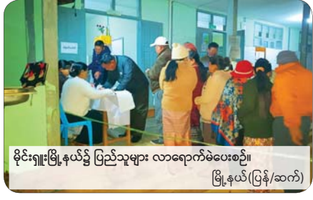
မိုင်းဂျားမြို့နယ်၌ ပြည်သူများ လာရောက်မဲပေးစဉ်။ မြို့နယ်(ပြန်/ဆက်)