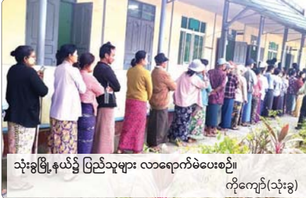
သုံးခွမြို့နယ်၌ ပြည်သူများ လာရောက်မဲပေးစဉ်။ ကိုကျော်(သုံးခွ)