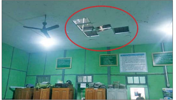
အကြမ်းဖက်အဖျက်သမား သောင်းကျန်းသူအုပ်စုက ပဲခူးတိုင်းဒေသကြီး ထန်းတပင်မြို့ အထွေထွေအုပ်ချုပ်ရေးမှူးရုံးသို့ Drone တစ်စီးဖြင့် Drop Bomb ချတိုက်ခိုက်စဉ် ဖျက်စီးမှုများအား တွေ့ရစဉ်။