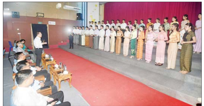
ရွေးချယ်ခံခဲ့ရသည့် ရွှေကြို အမျိုးသမီး ၁၈ ဦး၊ ရွှေကြိုမောင်မယ် ပြီး သရုပ်ဆောင်ပြသခဲ့ကြသည့် မောင်မယ် အမျိုးသား ၁၈ ဦး၊ ၃၆ ဦးက တစ်ဦးချင်း မိတ်ဆက် သတင်းစဉ်

ဘွဲ့နှင့် အလင်္ကာကျော်စွာဘွဲ့များ ကို ချီးမြှင့်ပေးလျက်ရှိပါကြောင်း၊ လာမည့်ကာလတွင် အနုပညာ လောက ပိုမိုရှင်သန်ပြီး မြန်မာ ရုပ်ရှင်အဆင့်အတန်း မြင့်မားကာ ဒေသတွင်း အာဆီယံတွင်သာမက ကမ္ဘာသို့ထိုးဖောက်ရန် ကြိုးစား ဆောင်ရွက်ကြစေလိုပါကြောင်း၊ မျိုးဆက်သစ် အနုပညာရှင်များ အနေဖြင့် အနုပညာကို တန်ဖိုး ထားသလို ပြည်သူများကိုလည်း တန်ဖိုးထားစေလိုပါကြောင်း ပြော ကြားသည်။