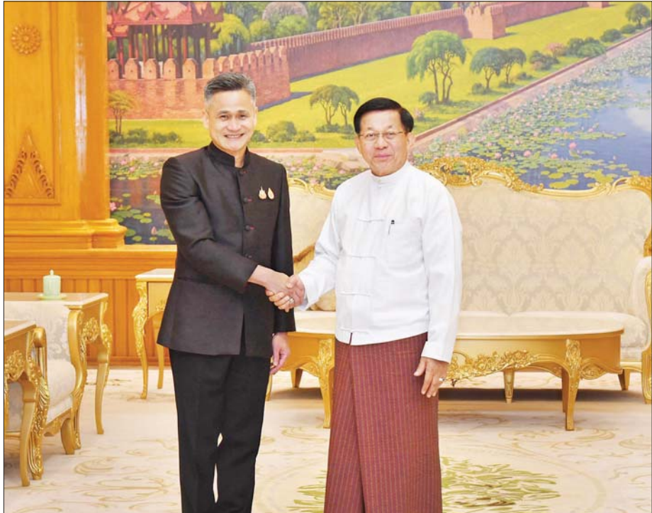
ပြည်ထောင်စုသမ္မတမြန်မာနိုင်ငံတော် ယာယီသမ္မတ နိုင်ငံတော်လုံခြုံရေးနှင့် အေးချမ်းသာယာရေးကော်မရှင်ဥက္ကဋ္ဌ ဗိုလ်ချုပ်မှူးကြီး မင်းအောင်လှိုင်နှင့် မြန်မာနိုင်ငံဆိုင်ရာ ထိုင်းနိုင်ငံသံအမတ်ကြီး H.E. Mr. Mongkol Visitstump တို့ ရင်းရင်းနှီးနှီးနှုတ်ဆက်စဉ်။

တွေ့ဆုံပွဲအပြီးတွင် နိုင်ငံတော်ယာယီသမ္မတ နိုင်ငံတော်လုံခြုံရေးနှင့် အေးချမ်းသာယာရေးကော်မရှင်ဥက္ကဋ္ဌနှင့် မြန်မာနိုင်ငံဆိုင်ရာ ထိုင်းနိုင်ငံသံအမတ်ကြီးတို့သည် အမှတ်တရလက်ဆောင်ပစ္စည်းများ အပြန်အလှန်ပေးအပ်ကြပြီး မှတ်တမ်းတင်စုပေါင်းဓာတ်ပုံရိုက်ခဲ့ကြကြောင်း သတင်းရရှိသည်။