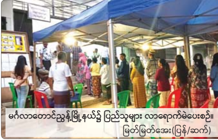
မင်္ဂလာတောင်ညွန့်မြို့နယ်၌ ပြည်သူများ လာရောက်မဲပေးစဉ်။ မြတ်မြတ်အေး(ပြန်/ဆက်)