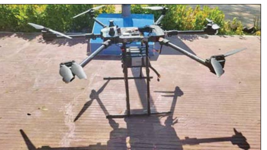
အကြမ်းဖက်အဖျက်သမား သောင်းကျန်းသူအုပ်စုက စစ်ကိုင်းတိုင်းဒေသကြီး မြင်းမူမြို့ အနီးဝန်းကျင်သို့ Drone တစ်စီးဖြင့် Drop Bomb ချတိုက်ခိုက်ရန် ချဉ်းကပ်လာစဉ် ဖျက်စီးခဲ့သည့် Drone အား တွေ့ရစဉ်။

ဆက်လက်၍လည်း အကြမ်းဖက်အဖျက်သမား သောင်းကျန်းသူအုပ်စုများသည် ပါတီစုံဒီမိုကရေစီ အထွေထွေ ရွေးကောက်ပွဲ အပိုင်း(၁) ကျင်းပခဲ့သည့် ၂၀၂၅ ခုနှစ် ဒီဇင်ဘာ ၂၈ ရက်တွင် ကချင်ပြည်နယ် မြစ်ကြီးနားမြို့ ရွှေညောင်ပင်ရပ်ကွက် အမှတ်(၁၁) အခြေခံပညာအထက်တန်းကျောင်းရှိ မဲရုံအမှတ်(၈၂)၅ လက်လုပ်အသံမိုင်း ဖောက်ခွဲခြင်း၊ ကယားပြည်နယ် လွိုင်ကော်မြို့ ရွှေတောင်ရပ်ကွက်နှင့် မင်္ဂလာရပ်ကွက်အတွင်းသို့ ၁၀၇ မမ လက်လုပ်မိုင်းများဖြင့် ပစ်ခတ်တိုက်ခိုက်ခြင်း၊ ကရင်ပြည်နယ် မြဝတီမြို့ အမှတ်(၃) ရပ်ကွက်ရှိ ကမ္ဘောဇဘဏ်အနီးနှင့် အမှတ်(၅) ရပ်ကွက်ရှိ မြန်မာ-ထိုင်း ချစ်ကြည်ရေးအမှတ်(၂)တံတားအနီးတို့၌ ဒေသန္တရလက်လုပ်မိုင်းများ ဖောက်ခွဲခြင်း၊