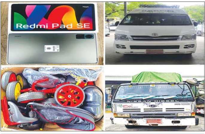
မန္တလေးတိုင်းဒေသကြီး၌ ဖမ်းဆီးရမိမှု။

တရားမဝင်ကုန်သွယ်မှုတိုက်ဖျက်ရေး အထူးအဖွဲ့၏ စီမံခန့်ခွဲမှုဖြင့် တာဝန်ကျပူးပေါင်းအဖွဲ့များက စစ်ဆေးမှုများဆောင်ရွက်ခဲ့ရာ စစ်ကိုင်းမြို့၊ ညောင်ပင် စင်ကျေးရွာ ကတလူပူးပေါင်းစစ်ဆေးရေးရုံးတိုက်၌ တရားမဝင်ရွှေသတ္တုတူးဖော်ရာတွင် အသုံးပြုသည့် ၁၁၀ လက်မ သံပိုက်လုံး ၁၀ လုံး၊ အပါအဝင် ဆက်စပ် ပစ္စည်းခုနစ်မျိုး၊ စုစုပေါင်း ခန့်မှန်းတန်ဖိုးငွေကျပ် ၁၃၆၀၀၀၀၀ ကို ဖမ်းဆီးရမိခဲ့ပြီး မြန်မာ့သတ္တုတွင်း ဥပဒေနှင့်အညီ အရေးယူဆောင်ရွက်လျက်ရှိ ပါသည်။