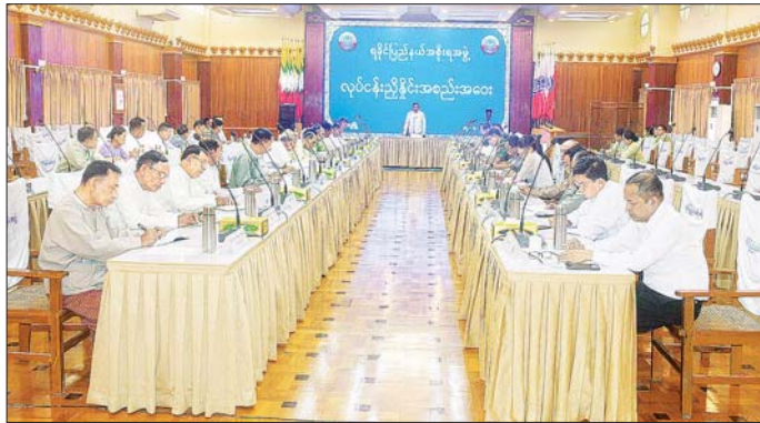
ကျောင်း ပြောကြားသည်။ ထို့နောက် ပြည်နယ်လုံခြုံရေးနှင့်နယ်စပ်ရေးရာ

စစ်တွေ ဩဂုတ် ၁၄ ရွေးကောက်ပွဲဆိုင်ရာ လုပ်ငန်းညှိနှိုင်းအစည်းအဝေးကို ယနေ့မုန်းလွဲပိုင်းက ရခိုင်ပြည်နယ် အစိုးရအဖွဲ့ရုံး အစည်းအဝေးခန်းမ၌ ကျင်းပရာ ရခိုင်ပြည်နယ် ဝန်ကြီးချုပ် ဦးထိန်လင်း၊ ပြည်နယ်ဝန်ကြီးများ၊ ပြည်နယ်ရွေးကောက်ပွဲကော်မရှင် အဖွဲ့ခွဲဥက္ကဋ္ဌနှင့် အဖွဲ့ဝင်များ၊ တာဝန်ရှိသူများ၊ ခရိုင်နှင့် မြို့နယ် ရွေးကောက်ပွဲကော်မရှင်အဖွဲ့ခွဲဥက္ကဋ္ဌနှင့် အဖွဲ့ဝင်များ တက်ရောက်ကြပြီး ကျောက်ဖြူခရိုင်၊ ကျောက်ဖြူ မြို့နယ်နှင့် မာန်အောင်မြို့နယ်တို့မှ ခရိုင်နှင့် မြို့နယ် ရွေးကောက်ပွဲကော်မရှင်အဖွဲ့ခွဲဥက္ကဋ္ဌများက စီဒီယို ကွန်ဖရင့်စနစ်ဖြင့် တက်ရောက်ကြသည်။ အစည်းအဝေးတွင် ပြည်နယ်ဝန်ကြီးချုပ်က ရွေးကောက်ပွဲ အောင်မြင်စွာဆောင်ရွက်နိုင်ရေး ပြည်ထောင်စုရွေးကောက်ပွဲကော်မရှင်ဥပဒေ၊ နိုင်ငံရေးပါတီများ မှတ်ပုံတင်ခြင်းဥပဒေ၊ နည်းဥပဒေ၊ သက်ဆိုင်ရာလွှတ်တော် ရွေးကောက်ပွဲဥပဒေနှင့် နည်းဥပဒေများနှင့်အညီ ဆောင်ရွက်ကြစေလို