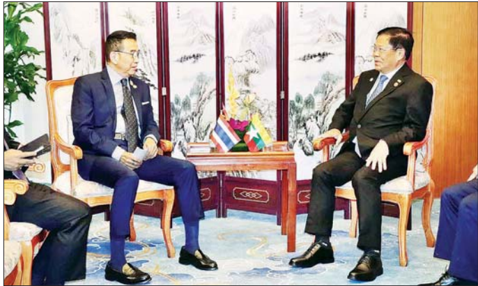
ပြည်ထောင်စုဝန်ကြီး ဦးသန်းဆွေနှင့် ထိုင်းနိုင်ငံ နိုင်ငံခြားရေးဝန်ကြီး မစ္စတာ မာရစ်ဆတ်ငယ်ဖုန်တို့ တွေ့ဆုံဆွေးနွေးစဉ်။

တွေ့ဆုံစဉ် နှစ်နိုင်ငံဖြစ်ပေါ် ရေးဆိုင်ရာ ကိစ္စရပ်များကို နိုင်ငံတွင် အထွေထွေရွေးကောက် တိုးတက်မှုများနှင့် နယ်စပ်ပူးပေါင်း ဆွေးနွေး၍ မြန်မာနိုင်ငံတွင် ပွဲ ကျင်းပမည့်ကိစ္စနှင့် နိုင်ငံ ဆောင်ရွက်ရေးဆိုင်ရာ ကိစ္စရပ် ပါတီစုံဒီမိုကရေစီ အထွေထွေ ရေး ဖြစ်ပေါ်တိုးတက်မှုများ များကို ဆွေးနွေးခဲ့ပြီး တရုတ် ရွေးကောက်ပွဲ ကျင်းပမည့်ကိစ္စကို ထောက်ခံအားပေးကြောင်း နိုင်ငံခြားရေးဝန်ကြီးနှင့် တွေ့ဆုံ ရှင်းလင်းပြောကြားခဲ့ရာ တရုတ် ပြန်လည်ပြောကြားခဲ့သည်။ စဉ် နှစ်နိုင်ငံပူးပေါင်းဆောင်ရွက် နိုင်ငံခြားရေးဝန်ကြီးက မြန်မာ သတင်းစဉ်