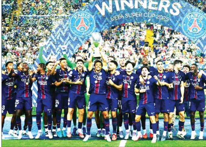
ယူအီးအက်စ်အေ စူပါဖလား ဆွတ်ခူးရရှိပြီးနောက် ပီအက်စ်ဂျီအသင်းသားများ အောင်ပွဲခံစဉ်။

ယူအီးအက်စ်အေ စူပါဖလား ဗိုလ်လုပွဲစဉ်အဖြစ် ဩဂုတ် ၁၄ ရက် နံနက် ၁ နာရီခွဲက ယှဉ်ပြိုင်ကစားခဲ့သည့် ပီအက်စ်ဂျီအသင်းနှင့် စပါးအသင်းပွဲစဉ်တွင် ပီအက်စ်ဂျီအသင်းက ပယ်နယ်တီအသင်းအဖြစ်တွင် လေးဂိုး-သုံးဂိုးဖြင့် နိုင်ပွဲရရှိကာ ဖလားဆွတ်ခူးနိုင်ခဲ့သည်။ အဆိုပါပွဲစဉ်မှာ နောက်ဆုံး မိနစ်အပိုင်းအခြားအထိ ပြိုင်ဆိုင်မှုပြင်းထန်ပြီး အကြိတ်အနယ်ရှိခဲ့သည်။ စပါးအသင်း နည်းပြသစ် သောမတ်စ်ဖရန့်၏ နည်းဗျူဟာ အလုပ်ဖြစ်ခဲ့ပြီး ပွဲအစပိုင်းက တည်ငံက ပီအက်စ်ဂျီကဲ့သို့ အသင်းကြီးကို ထိန်းချုပ်ကစားနိုင်ခဲ့သည်။ စပါးအသင်းသည် စာမျက်နှာ ၁၃ ကော်လံ ၅ *