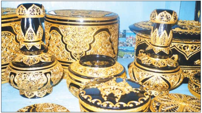
ရွှေယွန်းထည်များကို တွေ့ရစဉ်။