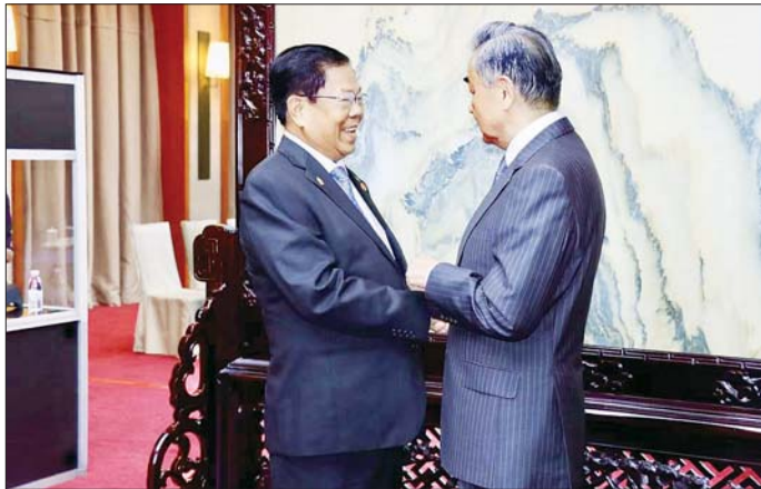
ပြည်ထောင်စုဝန်ကြီး ဦးသန်းဆွေအား တရုတ်ကွန်မြူနစ်ပါတီ ဗဟိုကော်မတီ နိုင်ငံရေးဗျူရိုအဖွဲ့ဝင်နှင့် နိုင်ငံခြားရေးဝန်ကြီး မစ္စတာဝမ်ယိက ရင်းရင်းနှီးနှီးဆက်ဆံစဉ်။

နေပြည်တော် ဩဂုတ် ၁၄ (၁၀) ကြိမ်မြောက် မဲခေါင်-လန်ချန်း ပူးပေါင်းဆောင်ရွက်မှု နိုင်ငံခြားရေးဝန်ကြီးများ အစည်းအဝေးနှင့် ဆက်စပ်အစည်းအဝေး တက်ရောက်ရန် တရုတ်ပြည်သူ့သမ္မတနိုင်ငံ အနီးနင်မြို့ရောက်ရှိ နေသည့် နိုင်ငံခြားရေးဝန်ကြီးဌာန ပြည်ထောင်စုဝန်ကြီး ဦးသန်းဆွေ သည် ထိုင်းနိုင်ငံ နိုင်ငံခြားရေး ဝန်ကြီး မစ္စတာမာရစ်ဆတ်ငယ်ဖုန် ဖုန်အား ဒေသစံတော်ချိန် ယနေ့ ညနေ ၃ နာရီတွင်လည်းကောင်း၊ တရုတ်ကွန်မြူနစ်ပါတီ ဗဟို ထိုင်းနိုင်ငံခြားရေးဝန်ကြီးနှင့်