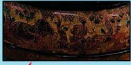
ဆင်ဖြူတော်လှူဇွန်း ဝေဿန္တရာဇာတ်တော်ကြီး ရုပ်နံ့ယွန်းဆွမ်းအုပ် (အချင်း ၁၈ လက်မ၊ အမြင့် ၃ ခေ)