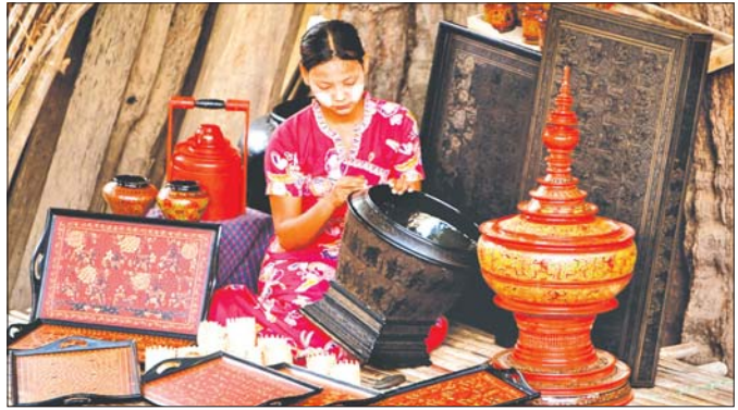
ပုဂံမြို့၌ ဆေးသွင်းယွန်းထည်ဟု ခေါ်ဆိုသော ယွန်းထည်များ ပြုလုပ်နေမှုကို တွေ့ရစဉ်။