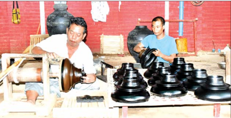
စစ်ကိုင်းတိုင်းဒေသကြီး ကျောက်ကာမြို့နယ်၌ ကျောက်ကာယွန်းထည်များ ပြုလုပ်နေစဉ်။

နိုင်ငံတော်လုံခြုံရေးနှင့် အေးချမ်းသာယာရေးကော်မရှင်ဥက္ကဋ္ဌ ပေးခဲ့သော လက်ဆောင်များတွင် ထူးခြားသည့် လက်ဆောင်များမှာ မြန်မာ့ယွန်းထည်များပင် ဖြစ်သည်။ ကမ္ဘာပေါ်တွင် ယွန်းထည်ပြုလုပ်သည့် နိုင်ငံများစွာ ရှိနေသော်လည်း မြန်မာ့ယွန်းထည်များသည် မြန်မာလူမျိုးတို့၏ ကိုယ်ပိုင်ဟန်အပြည့်အဝအသုံးပြုထားသော ထူးခြားသည့် ယွန်းထည်များဖြစ်သည်။ ယွန်းလုပ်ငန်းနှင့်ပတ်သက်ပါက မြန်မာနိုင်ငံသည် ကမ္ဘာပေါ်တွင် အစုံလင်ဆုံးနှင့် အထွန်းကားဆုံးနိုင်ငံဟု ဆိုရမည်ဖြစ်သည်။ မြန်မာတို့၏ ယဉ်ကျေးမှုပုံစံအား သမိုင်းပညာရှင်များ သုံးသပ်ကြသည်မှာ “Adept and Adopt” ဖြစ်သည်ဟု ဆိုကြသည်။ မိမိ၏ ကိုယ်ပိုင်ယဉ်ကျေးမှုအတွင်းသို့ အခြားယဉ်ကျေးမှု ဝင်ရောက်လာပါက တိုက်ရိုက် ကူးယူခြင်းထက် မြန်မာတို့နှင့် ကိုက်ညီမည့်ပုံစံသို့ ပြောင်းလဲကာ မိမိတို့၏ ကိုယ်ပိုင်ပုံစံအသစ်ဖြင့် ရောနှောစေပြီးမှ မွေးစားသည့်သဘောရှိခြင်းကြောင့် ထိုသို့ သတိမှတ်ခြင်း ဖြစ်သည်။ မြန်မာပညာရှင်များသည်လည်း ရှေးယခင်ကတည်းကပင် “အရိုးအား အရွက်မဖုံးရာ” ဟူသော ဆိုရိုးစကားဖြင့် မိမိတို့၏ ကိုယ်ပိုင်ယဉ်ကျေးမှုအား အခြားယဉ်ကျေးမှုမှ လွှမ်းမိုးခြင်းမပြုစေရန် သတိပေးစကား ထားရှိခဲ့ကြပါသည်။ နိုင်ငံတော်လုံခြုံရေးနှင့် အေးချမ်း