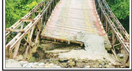
၅၀ ပါ ဓာတ်မြေဩဇာ တစ်အိတ်နှုန်းဖြင့် လယ်/ယာမြေ ၆၂၉ ဧက အတွက် တောင်သူ ၄၀၄ အား သက်သာသောဈေးနှုန်းများဖြင့် ဖြန့်ဖြူး ပေးခဲ့ကြောင်း သိရသည်။ မျိုးညွန့်ဇွဲ(မိုးနဲ)

ကလေး ဩဂုတ် ၁၄ စစ်ကိုင်းတိုင်းဒေသကြီး ကလေးမြို့နယ် မိုင်တိုင်အမှတ် (၈/၀) နှင့် (၈/၁)ကြားရှိ တံတားအမှတ်(၇/၈) အရှည်ပေ ၄၀၊ အနံ ၁၀ ပေ ရှိ ဘေလီတံတားသည် မိုးရွာသွန်းမှုကြောင့် ယနေ့နံနက်က တံတား ချဉ်းကပ်လမ်းမြေပြိုကျမှုဖြစ်ပွားခဲ့သည်။ အဆိုပါတံတားသည် ကလေးမြို့၏ အနောက်ဘက် ရစ်မိုင်ခန့် အကွာ ကလေး-ကျိုက်ကုန်း-ကလေးကားလမ်းပေါ်တွင် တည်ရှိပြီး ကလေးဘက်ခြမ်းရှိ တံတားချဉ်းကပ်လမ်းမှာ လေးပေခန့် မြေပြိုကျ ပျက်စီးကာ ဖြတ်သန်းသွားလာ၍မရသည့်အပြင် ခရီးသွား မော်တော်ယာဉ်များ ဖြတ်သန်းသွားလာနိုင်ရေးအတွက် တံတား အထူး အဖွဲ့ (၂)မှ ပြင်ဆင်ဆောင်ရွက်လျက်ရှိကြောင်း သတင်းရရှိ သည်။ ထွန်းမင်းအောင်(ကတော်မြေ)