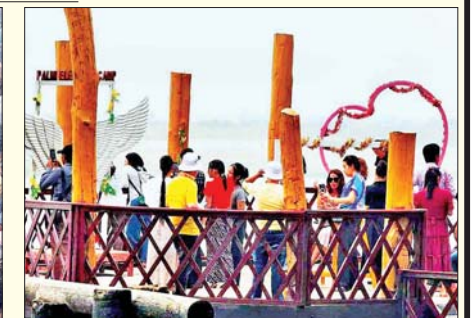
ညောင်ဦးမြို့နယ် ပလင်းကမ်းသာယာဆင်စခန်း၌ သင်္ကြန်ကာလ အပန်းဖြေကြသူများ။ ရဲဝင်းနိုင်(ညောင်ဦး)