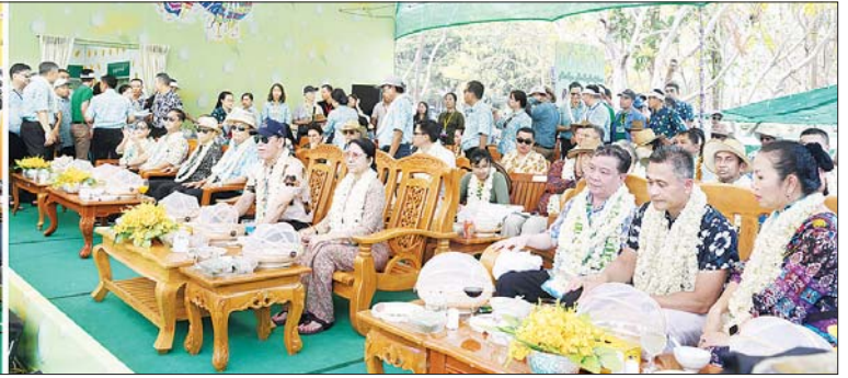
ပြည်ထောင်စုဝန်ကြီး ဦးမောင်မောင်အုန်းနှင့် နိုင်ငံခြားသံရုံးများမှ မြန်မာနိုင်ငံဆိုင်ရာ သံအမတ်ကြီးတို့ ကိုရီးယားနိုင်ငံမှ K-Pop အဆိုတော်များ၏ သီဆိုကပြပျော်ဖြေမှုကို ကြည့်ရှုအားပေးစဉ်။