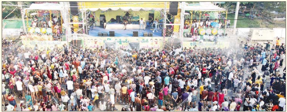
ရန်ကုန်တိုင်းဒေသကြီး ဒလမြို့နယ်ရှိ ဗဟိုမဏ္ဍပ်၌ ရေကစားသူများ၊ ရေကန်ခံထွက်ကြသူများဖြင့် အထူးစည်ကား။ မြင့်ဇော် (ပြန်/ဆက်)