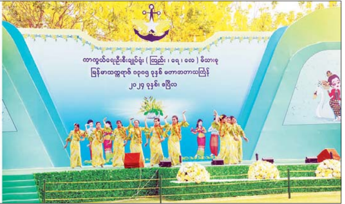
မဟာသင်္ကြန်အကြတ်နေ့တွင် ကာကွယ်ရေးဦးစီးချုပ်ရုံး(ကြည်း၊ ရေ၊ လေ)မိသားစုရေကစားမဏ္ဍပ်၌ မိသားစုသင်္ကြန်ယိမ်းအကအဖွဲ့များက သီဆိုကပြပျော်ဖြေစဉ်။