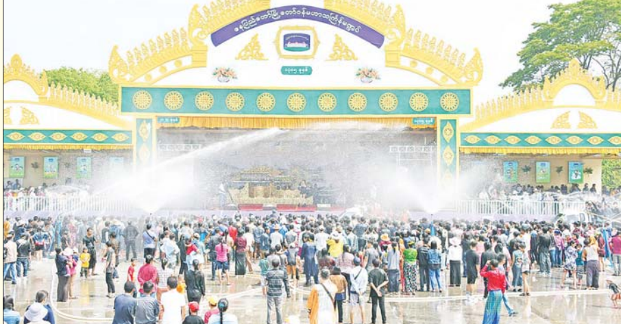
နေပြည်တော်မြို့တော်ဝန်မဟာသင်္ကြန်မဏ္ဍပ်၌ စည်ကားပျော်ရွှင်မှု။

မဟာသင်္ကြန်အကြတ်နေ့ (ဧပြီ ၁၅ ရက်)တွင် မြန်မာနိုင်ငံတစ်ဝန်းရှိ တိုင်းဒေသကြီး၊ ပြည်နယ်များ၏ မြို့များ၌ မဟာသင်္ကြန်ပွဲတော်ကို ရေကစားကြသူများ၊ ရေကန်ခံထွက်သူများ၊ ရေကစားမဏ္ဍပ်များ၌ ဖျော်ဖြေမှုများ၊ စတုဒိသာကျွေးမွေးလှူဒါန်းမှုများဖြင့် စည်ကားမှုမြင်ကွင်းများကို စုစည်းဖော်ပြလိုက်ပါသည်။ စာတည်းအဖွဲ့