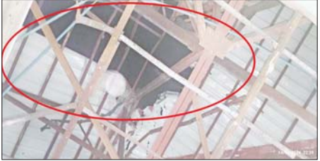
အကြမ်းဖက်သမားများ၏ ရှေ့တိုက်ခိုက်မှုဖြင့် ပစ်ခတ်ခဲ့မှုကြောင့် ပြည်သူ့ဆေးရုံ၌ ထိခိုက်ပျက်စီးမှုကို တွေ့ရစဉ်။