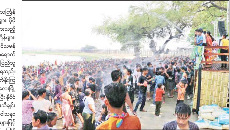
ဦးပိန်တံတားနှင့် တောင်သမန်မယ်ဇော်လွင်ပြင်အပန်းဖြေစခန်း၌ လာရောက်အပန်းဖြေအနားယူကြသည့် သင်္ကြန်ချစ်သူပြည်သူများအား တွေ့ရစဉ်။

မန္တလေး ဧပြီ ၁၅ ယနေ့ကျရောက်သည့် မြန်မာ့ရိုးရာမဟာသင်္ကြန် (အကြတ်နေ့)တွင် မန္တလေးမြို့ရှိ ပြည်သူများ ပိုမို ပျော်ရွှင်စွာဆင်နွှဲနိုင်ရန် ဆောင်ရွက်ပေးထားသည့် မြန်မာ့ရိုးရာ လမ်းလျှောက်အတောသင်္ကြန်များ၊ အမရပူရမြို့နယ်ရှိ ဦးပိန်တံတားနှင့် တောင်သမန် မယ်ဇော်လွင်ပြင် အပန်းဖြေစခန်းတို့၌ လာရောက် အပန်းဖြေအနားယူကြသည့် သင်္ကြန်ချစ်သူပြည်သူ များဖြင့် အထူးစည်ကားလျက်ရှိကြောင်း သိရသည်။ နံနက်ပိုင်းမှစတင်၍ သင်္ကြန်ကို ချစ်မြတ်နိုးကြ သည့် သင်္ကြန်ချစ်သူပြည်သူများသည် မန္တလေးမြို့ တော်မဟာသင်္ကြန်မဏ္ဍပ်သို့ လာရောက်ကြပြီး နိုင်ငံ ကျော်တေးသံရင်များ၏ အတောသင်္ကြန်တေးသီချင်း များဖြင့် သီဆိုဖျော်ဖြေမှုနှင့် ဝန်ကြီးဌာနနှင့် ဝါသနာ ရှင် ယိမ်းအကအဖွဲ့များ၏ ယိမ်းအကအလှူများဖြင့် ကပြဖျော်ဖြေမှုတို့ကို တပျော်တပါးအားပေး၍သင်္ကြန် ပွဲတော်ကို စိတ်အားတက်ကြစွာ ဆင်နွှဲကြသည်။ ထိုပြင် မြန်မာ့ရိုးရာအတောသင်္ကြန်ပွဲတော်ကာလ အတွင်း မန္တလေးမြို့ရှိ ပြည်သူများ ပိုမိုပျော်ရွှင်စွာ ဆင်နွှဲနိုင်ရေးအတွက်စီစဉ်ဆောင်ရွက်ပေးထားသည့် ကျုံးတောင်ဘက်ခြမ်းရှိ လမ်းလျှောက်သင်္ကြန်နှင့် ချမ်းမြသာစည်မြို့နယ်ရှိမင်္ဂလာမန္တလေး မြန်မာ့ရိုးရာ လမ်းလျှောက်အတောသင်္ကြန်တို့၌လည်း ခေတ် လေးခေတ်၏ ဝတ်စားဆင်ယင်ဖန်တီးမှုများ၊ နိုင်ငံ ကျော်အနုပညာရှင်များ၏ ဖျော်ဖြေမှုများ၊ ယိမ်းအက