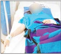
အေးချမ်းရေးအတွက် ပြည်သူတစ်ရပ်လုံး ပူးပေါင်းပါဝင်ကာ အကြမ်းဖက်သမားများအား အမြန်ဆုံးဖမ်းဆီးရမိရေး ၎င်းတို့ ပုန်ခိုရာနေရာများ၊ လှုပ်ရှားသွားလာ

အကြမ်းဖက်သမားများ၏ ရှေ့တိုက်ခိုက်မှုဖြင့် ပစ်ခတ်ခဲ့မှုကြောင့် ထိခိုက်ဒဏ်ရာများရရှိသည့် အသက် ၅ နှစ် နှင့် ၉ နှစ် အရွယ် ကလေးနှစ်ဦးအပါအဝင် အပြစ်မဲ့ပြည်သူများ။ ယခုကဲ့သို့ စစ်ရေးနှင့် မသက်ဆိုင်သော မြို့ရွာ၊ ရပ်ကွက်များအတွင်းသို့ ရှေ့တိုက်ခိုက်မှုများ ရည်ရွယ်ချက်ရှိရှိဖြင့် ပစ်ခတ်ခြင်းသည် ဂျီနီဗာကွန်ဗင်းရှင်းနှင့် အပြည်ပြည်ဆိုင်ရာ ဥပဒေတို့အရ စစ်ရာဇဝတ်မှု (War Crime)