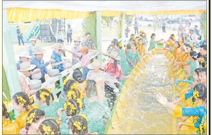
ရခိုင်ပြည်နယ်ဝန်ကြီးချုပ် ဦးထိန်လင်းနှင့်အဖွဲ့ ရခိုင်ရိုးရာရေလောင်းမဏ္ဍပ်တွင် ပျော်ပျော်ပါးပါး ရေကစားဆင်နွှဲစဉ်။ တင်ထွန်း (ပြန်/ဆက်)