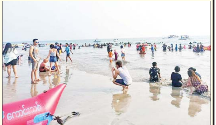
ဧရာဝတီတိုင်းဒေသကြီး ငွေဆောင်ကမ်းခြေ၌ သင်္ကြန်ကာလတွင် အပန်းဖြေအနားယူကြသော ခရီးသွားပြည်သူများဖြင့် စည်ကားစွာ တွေ့ရစဉ်။ မြို့နယ်(ပြန်/ဆက်)