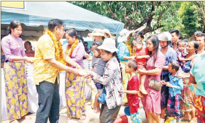
တနင်္သာရီတိုင်းဒေသကြီး ဝန်ကြီးချုပ် ဦးမြတ်ကို ရေကစားကြသူများအား စတုဒိသာစားသောက်ဖွယ်ရာ များ ဝေငှစဉ်။ တိုင်းဒေသကြီး(ပြန်/ဆက်)