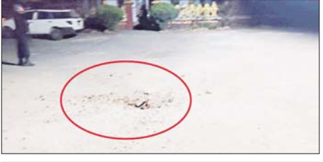
အကြမ်းဖက်သမားများ၏ ရှေ့တိုက်ခိုက်မှုဖြင့် ပစ်ခတ်ခဲ့မှုကြောင့် ဘုန်းတော်ကြီးကျောင်းသို့ ခိုးသီးကျရောက်ပေါက်ကွဲမှုကို တွေ့ရစဉ်။