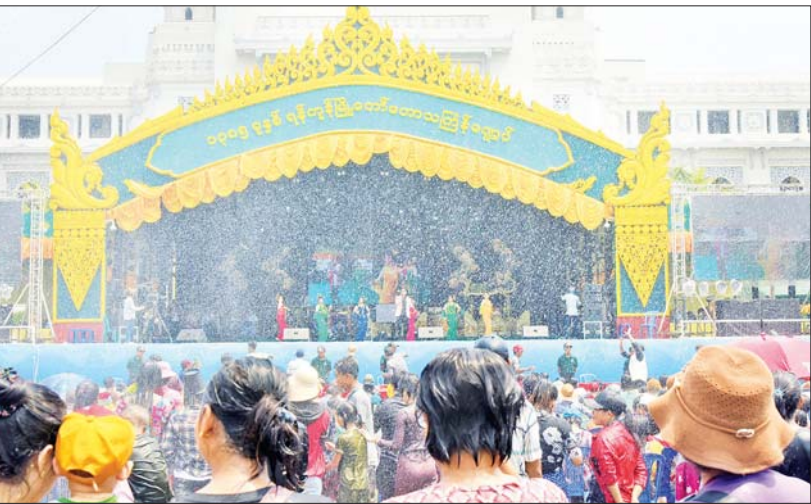
ရန်ကုန်မြို့တော်မဟာသင်္ကြန်မဏ္ဍပ်၌ အတူရေသဘင်ပွဲ ဆင်နွှဲကြသူများနှင့် စည်စည်ကားကားတွေ့ရစဉ်။

သည့် တေးသီချင်းများဖြင့် အဆက်မပြတ်ဖျော်ဖြေခဲ့ရာ ဆူးလေလမ်းမကြီးတစ်လျှောက် ရေပက်ခံကားများ၊ ရေကစားကြသည့်ပြည်သူများ၊ တေးဂီတကို ကြည့်ရှုအားပေးကြသည့် ပြည်သူများဖြင့် စည်ကားခဲ့ပြီး တန်ခူးနေ့အပူကို မေ့လျော့လျက် စိတ်လက်ပေါ့ပါးပျော်ရွှင်စွာဖြင့် အတူရေသဘင်ကို စည်ကားသိုက်မြိုက်စွာ ဆင်နွှဲခဲ့ကြသည်။ ညနေပိုင်းနှင့် ညပိုင်းတို့တွင် မြန်မာနိုင်ငံ ဂီတအစည်းအရုံး(ဗဟို)နှင့် မြန်မာနိုင်ငံသဘင်အစည်းအရုံး(ဗဟို)တို့မှ အနုပညာမောင်နှမများက အနုပညာစွမ်းအားပေးပေါင်းအားဖြင့် ဖျော်ဖြေခဲ့ကြပြီး ရေသဘင်ပွဲတော်ကို စိတ်လက်ပေါ့ပါးစွာ ဆင်နွှဲကြသည့် ပြည်သူများက ည ၁၀ နာရီအထိ နှစ်ထောင်းအားရစွာဖြင့် ကြည့်ရှုအားပေးခဲ့ကြကြောင်း သိရသည်။ သစ္စာ(mna)