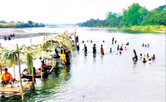
ပွင့်ဖြူမြို့(ပွင့်ဖြူမြို့)

တောင်များတွင် မြစ်ဖျားခံ၍ မင်းဘူးခရိုင်အတွင်းသို့ စေတုတ္ထရာမြို့နယ်၏ မြောက်ဘက်မှ စီးဝင်စီးဆင်းကာ ပွင့်ဖြူမြို့ကို ရစ်ခွေစီးဆင်းလျက်ရှိသည်။ သင်္ကြန်ကာလတွင် မုန်းချောင်းအတွင်းသို့ ဒေသခံပြည်သူများနှင့် ရပ်ဝေးရပ်နီးမှ ခရီးသွားပြည်သူများက အပူရောင် လာရောက်ရေကစားခြင်း၊ အပန်းဖြေအနားယူခြင်းများကြောင့် နှစ်စဉ် စည်ကားလှရှိကြောင်း သိရသည်။