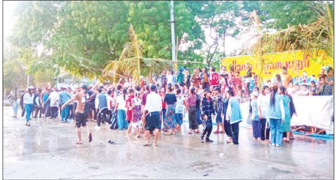
နေပြည်တော် စေယျာသီရိမြို့နယ် ခရေပင်လမ်းခွဲရှိ သတင်းနှင့်စာနယ်ဇင်းလုပ်ငန်း မိသားစုရေကစားမဏ္ဍိုင်တွင် မဟာသင်္ကြန်အကြတ်နေ့၌ ဝန်ထမ်းမိသားစုများနှင့် အနီးဝန်းကျင်ရှိ ကျေးရွာနေသူများအားချမ်းပျော်ရွှင်စွာ ရေကစားကြစဉ်။