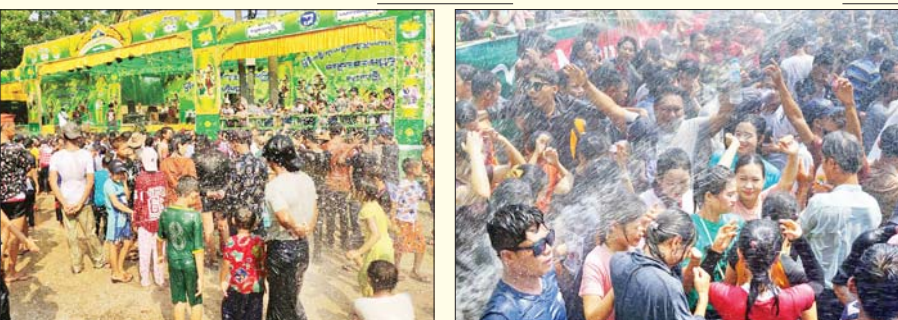
ဧရာဝတီတိုင်းဒေသကြီး ငပုတောမြို့နယ်အတာသင်္ကြန်ဗဟိုမဏ္ဍပ်။ မြို့နယ်(ပြန်/ဆက်)