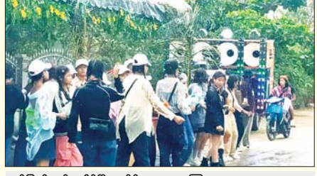
မွန်ပြည်နယ် ပေါင်မြို့နယ်၌ ရေကစားကြသူများ။ မွန်မလေး(ပြန်/ဆက်)