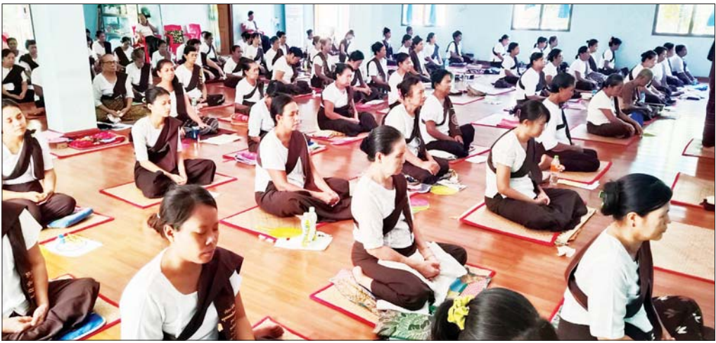
ကျိုက်ထိုမြို့ရှိ တရားရိပ်သာတစ်ခု၌ သင်္ကြန်အကျနေ့က ဝိပဿနာတရားရှုမှတ်နေကြသည့် ယောဂီများ။

စိတ်ထားအသစ်အသစ်တွေနဲ့အတူ အသက် အရွယ်အရ တရားသဘောလေးတွေ သိလာရတဲ့အခါ လူ့ဘဝဟာ ရဲ့ပဲလား။ သက်တမ်း တိုတိုနဲ့ ဒီဘဝမှာ လူ့ဘဝရနေခြင်းကပင် အတိတ် ဘဝ ဘဝတွေမှာ ကောင်းသောကုသိုလ်ကံတွေ ထူထောင်ခဲ့လို့ဆိုတာ အလေးအနက်ထားမိတဲ့အခါ နောင်ဘဝတွေမှာ အနည်းဆုံးတော့ လူပြန်ဖြစ်ဖို့၊ လူချမ်းသာ နတ်ချမ်းသာဘဝရဖို့ ဆုတောင်းမိပြန် တယ်။ ပိုပြီး မြင့်မြတ်တဲ့လုပ်ငန်းစဉ်တွေဖြစ်တဲ့ ပါရမီ ၁၀ ပါး အပြား ၃၀ ကို ဉာဏ်နဲ့ယှဉ်ပြီး ထူထောင်နိုင်ရင်တော့ နိဗ္ဗာန်ကို အထောက်အကူပြု နိုင်တာပေါ့။ လက်တွေ့မှာတော့ လူ့ဘဝရင်တောင် မှဘုရားသာသနာနဲ့ ကြိုကြိုကိစ္စိရော ခဲယဉ်းနေသေး တယ်။ သာသနာနဲ့ ကြိုရင်သော်မှ ဘုရားရဲ့ တရား တော်တွေနာရဖို့က အခြေအနေပေးမှ ရနိုင်တာ။ နာတိုင်းလည်းသိဦးမှ၊ သိတိုင်းလည်းကျင့်ဦးမှ...။ ဤလိုအကြောင်းတရားတွေက ရဲ့ပဲလှပါတယ်။ ရဲ့ပဲလှလည်း ထိုအကြောင်းတရားတွေက အကျိုး ကောင်းတွေဖြစ်ဖို့ ဘဝရဲ့ အာမခံချက်အကောင်းစား တွေဖြစ်ဖို့ လိုပါတယ်။ နှစ်သစ်မှာ စိတ်သစ်လူသစ် နဲ့ဆိုတာ တကယ်တော့ ကိုယ့်ကိုယ်ကိုယ် လူဖြစ်ရ ကျိုးနပ်ချင်တာပါ။ ပစ္စည်းဥစ္စာ၊ ဓန၊ ရာထူးဆိုတာ တွေထက် အကျင့်အကြံကောင်းတွေနဲ့ ကိလေသာ အညစ်အကြေး လျော့ပါးလာတဲ့ စိတ်ထား အသစ် အသစ်တွေနဲ့အတူ ပတ်ဝန်းကျင်ကို ပြိုစီးချမ်းစေမယ့် လူသစ်စိတ်သစ်ကို ဆိုလိုခြင်း ဖြစ်တယ်။