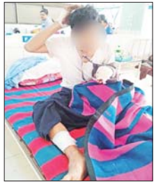
ကို ကျူးလွန်ခြင်းဖြစ်ပြီး အဆိုပါ အကြမ်းဖက်သမားများအား အမြန်ဆုံး ဖော်ထုတ်ဖမ်းဆီးနိုင်ရေး လုံခြုံရေးတပ်ဖွဲ့ဝင်များက လုံခြုံရေးလုပ်ငန်းများ တိုးမြှင့်ဆောင်ရွက်လျက် ရှိကြောင်းနှင့် အဆိုပါ အကြမ်းဖက်သမားတို့၏ လုပ်ရပ်ကြောင့် အပြစ်မဲ့ပြည်သူများ သေဆုံး၊ ထိခိုက်ခဲ့ရမှုအပေါ် ဝိုင်းဝန်းဆန့်ကျင်၍ လုံခြုံရေးတပ်ဖွဲ့ဝင်များနှင့် ပူးပေါင်းကာ မြို့ရွာများ အမြန်ဆုံး တည်ငြိမ်

အကြမ်းဖက်သမားများ၏ ရှေ့တိုက်ခိုက်မှုဖြင့် ပစ်ခတ်ခဲ့မှုကြောင့် ထိခိုက်ဒဏ်ရာများရရှိသည့် အသက် ၅ နှစ် နှင့် ၉ နှစ် အရွယ် ကလေးနှစ်ဦးအပါအဝင် အပြစ်မဲ့ပြည်သူများ။ ယခုကဲ့သို့ စစ်ရေးနှင့် မသက်ဆိုင်သော မြို့ရွာ၊ ရပ်ကွက်များအတွင်းသို့ ရှေ့တိုက်ခိုက်မှုများ ရည်ရွယ်ချက်ရှိရှိဖြင့် ပစ်ခတ်ခြင်းသည် ဂျီနီဗာကွန်ဗင်းရှင်းနှင့် အပြည်ပြည်ဆိုင်ရာ ဥပဒေတို့အရ စစ်ရာဇဝတ်မှု (War Crime)