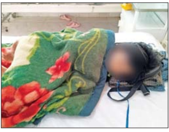
အကြမ်းဖက်သမားများ၏ ရှေ့တိုက်ခိုက်မှုဖြင့် ပစ်ခတ်ခဲ့မှုကြောင့် ထိခိုက်ဒဏ်ရာများရရှိသည့် အသက် ၅ နှစ် နှင့် ၉ နှစ် အရွယ် ကလေးနှစ်ဦးအပါအဝင် အပြစ်မဲ့ပြည်သူများ။

ရရှိခဲ့ပြီး စံပါယ်ရပ်ကွက်တွင် နေထိုင်သည့် ပြည်သူတစ်ဦး သေဆုံးခဲ့ကာ ပြည်သူ့ဆေးရုံတွင် တက်ရောက်ဆေးကုသမှု ခံယူနေသော အသက်ငါးနှစ်နှင့် ကိုးနှစ်အရွယ် ကလေးငယ်များအပါအဝင် လူနာနှင့် ဆေးရုံဝန်ထမ်း ၁၁ ဦးမှာ အပြင်းအထန် ထိခိုက်ဒဏ်ရာများ ရရှိခဲ့သဖြင့် စုစုပေါင်းသံဃာတော်နှစ်ပါးနှင့် ပြည်သူတစ်ဦး သေဆုံးခဲ့၍ ပြည်သူ ၁၂ ဦး ထိခိုက်ဒဏ်ရာများရရှိကာ အဆိုပါ ထိခိုက်ဒဏ်ရာ ရရှိသူများကို လိုအပ်သော ဆေးဝါးကုသမှုများ ဆောင်ရွက်ပေးလျက်ရှိကြောင်း သိရှိရသည်။ မြန်မာ့ရိုးရာ ယဉ်ကျေးမှု မဟာသင်္ကြန်ပွဲတော်ကို မြန်မာ့ဇလေထုံးတမ်း အစဉ်အလာများနှင့်အညီ ရိုးရာမပျက် ဆက်လက်ထိန်းသိမ်းရန် ပြည်သူများ ကိုယ်စိတ်နှစ်ပါး ရွှင်လန်းချမ်းမြေ့စွာ ရေသာသနာပွဲတော်တွင် ယဉ်ကျေးသိမ်မွေ့စွာ ပါဝင်ဆင်နွှဲနိုင်ရန်၊ ပြည်သူများသည် မိမိတို့ပင်ပန်းနွမ်းနယ်သမျှကို အတာရေပက်ဖျန်း လန်းဆန်းစေခြင်းဖြင့် နှစ်သစ်ကိုကြိုဆိုရန် မြန်မာ့ရိုးရာယဉ်ကျေးမှုဖြစ်သည့် အမျိုးသားရေ စရိုက်လက္ခဏာများကို ဆက်လက်ထိန်းသိမ်း စောင့်ရှောက်တတ်ကြစေရန်စသည့် ရည်ရွယ်ချက်များဖြင့် နိုင်ငံတစ်ဝန်းတွင် စည်ကားသိုက်မြိုက်စွာ ကျင်းပလျက်ရှိသည့် ယခုကဲ့သို့ ထူးခြား