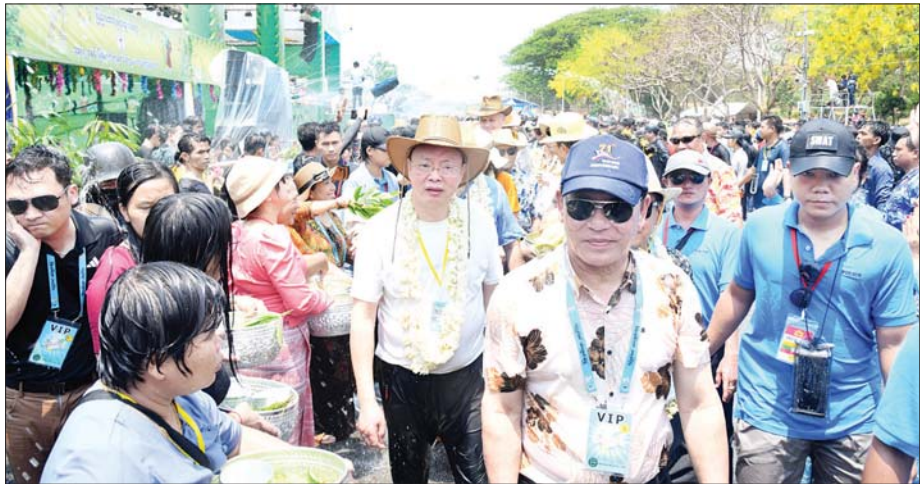
မဟာသင်္ကြန်အကြိမ်နေ့တွင် ပြည်ထောင်စုဝန်ကြီး ဦးမောင်မောင်အုန်းနှင့် နိုင်ငံခြားသံရုံးများမှ မြန်မာနိုင်ငံဆိုင်ရာ သံအမတ်ကြီးတို့ နေပြည်တော် လမ်းလျှောက်သင်္ကြန်ပွဲ ပျော်ရွှင်စွာ ပါဝင်ဆင်နွှဲကြစဉ်။

သပြေခက်ဖြင့် အတာရေပက်ဖျန်းပေးကြသည်။ ပျော်ရွှင်စွာကခုန်ဆင်နွှဲယင်းနောက် မြန်မာနိုင်ငံဆိုင်ရာ ထိုင်းသံအမတ်ကြီးက “သင်္ကြန်မိုး” တေးသီချင်းဖြင့် လည်းကောင်း၊ ရုရှားဖက်ဒရေရှင်းနိုင်ငံမှ Tavrída. art အနုပညာအဖွဲ့မှ အနုပညာရှင်များအဖွဲ့က တေးသီချင်းများဖြင့် လည်းကောင်း သီဆိုဖျော်ဖြေကြရာ တက်ရောက် လာကြသူများက မြူးကြည့်သည့် တေးသီချင်းသံစဉ်စည်းချက်များနှင့်အတူ ပျော်ရွှင်စွာ ကခုန်ဆင်နွှဲကြသည်။ စုပေါင်းပါဝင်ဆင်နွှဲထိုးနောက် ပြည်ထောင်စုဝန်ကြီး၊ နေပြည်တော်ကောင်စီဥက္ကဋ္ဌ ဒုတိယဝန်ကြီး၊ နိုင်ငံခြားသံရုံးအသီးသီးမှ သံအမတ်ကြီးများနှင့် တာဝန်ရှိသူများက ပျဉ်းမနား-တောင်ညိုလမ်းပေါ်ရှိ နေပြည်တော်မြို့တော်ဝန်မဏ္ဍပ်