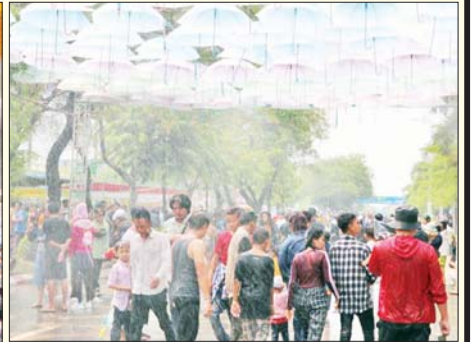
မန္တလေးတိုင်းဒေသကြီး ချမ်းမြသာစည်မြို့နယ်ရှိ မင်္ဂလာမန္တလေး ဖျော်ဖြေရေးမဏ္ဍပ်နှင့် လမ်းလျှောက်သင်္ကြန်တိုင်း၌ သင်္ကြန်ချစ်သူများ ပါဝင်ဆင်နွှဲနေသည်ကို စည်ကားစွာ တွေ့ရစဉ်။ မောင်အေးချမ်း