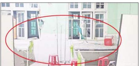
အကြမ်းဖက်သမားများ၏ ရှေ့တိုက်ခိုက်မှုဖြင့် ပစ်ခတ်ခဲ့မှုကြောင့် ပြည်သူ့ဆေးရုံ၌ ထိခိုက်ပျက်စီးမှုများအား တွေ့ရစဉ်။