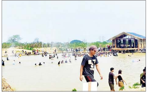
ဆီမီး၊ ရေချမ်းနှင့် အမွှေးနံ့သာများ ထွန်းညှိ ဝတ်ရွတ်ပူဇော်ကြခြင်းနှင့် ဥပုသ်သီလ ပူဇော်ခြင်း၊ ရွှေသင်္ကန်းများ ကပ်လှူခြင်း၊ အလှူငွေများ ပါဝင်လှူဒါန်းခြင်း၊ ဘုရားရေ သပ္ပာယ်ခြင်း၊ ဘုရားဝတ်ရွတ်အသင်းများက ဆောက်တည်ကြခြင်းတို့ဖြင့် စည်ကားလျက်ရှိ သည်ကို တွေ့ရသည်။

မိုးညှင်း ဧပြီ ၁၅ ကချင်ပြည်နယ် မိုးညှင်းမြို့ အထင်ကရနေရာ များ၌ ဧပြီ ၁၅ ရက် (သင်္ကြန်အကြတ်နေ့)တွင် လာရောက်ရေကစားကြသူများ၊ အပန်းဖြေ အနားယူကြသူများဖြင့် စည်ကားလျက်ရှိသည် ကို တွေ့ရသည်။ သင်္ကြန်ပွဲတော် အကြတ်နေ့တွင် မိုးညှင်း မြို့ပေါ်ရပ်ကွက်နှင့် ကျေးရွာများအတွင်းရှိ ဒေသခံပြည်သူများအနေဖြင့် မြို့ပေါ်နှင့် အခြားအထင်ကရနေရာများ ဖြစ်ကြသော မိုးညှင်းချောင်းသာ၊ ကာဂူ Guitar lake သဘာဝရေကူးကန်၌ Dj ဖြင့်ဖျော်ဖြေမှုများ စသည့် နေရာများ အပါအဝင် မြို့ပေါ်ရပ်ကွက် နှင့်ကျေးရွာများတွင်လည်း ရေပုကန်စားကြ သူများဖြင့် ပျော်ရွှင်စွာ ဆင်နွှဲလျက်ရှိကြောင်း သိရသည်။ ထို့ပြင် ဘုရားစေတီပုထိုးများနှင့် ဘုန်းတော်ကြီးကျောင်းများတွင်လည်း ပန်း၊