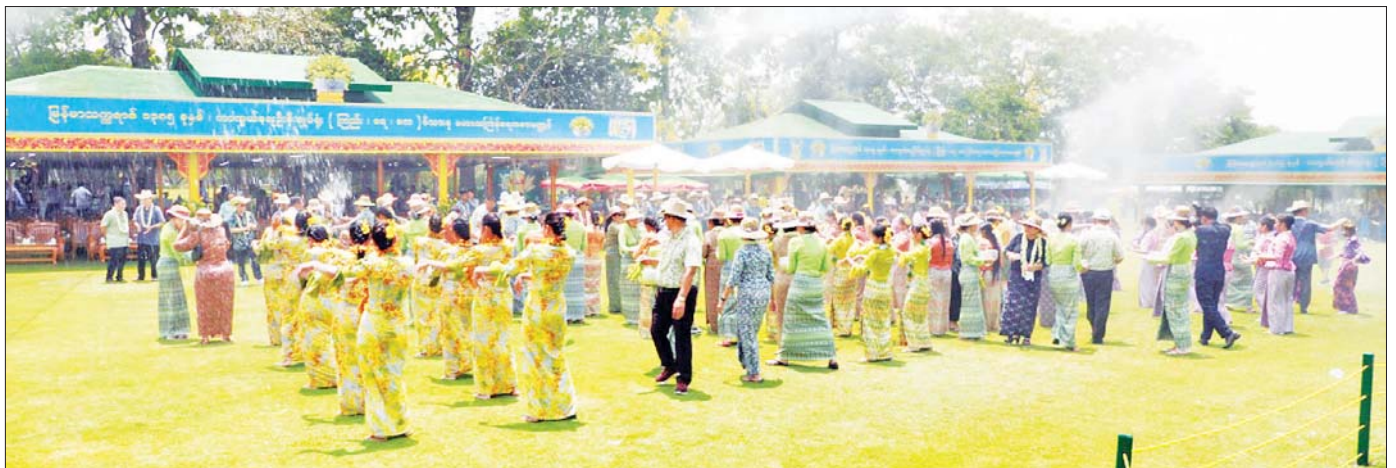
မဟာသင်္ကြန်အကြတ်နေ့တွင် ကာကွယ်ရေးဦးစီးချုပ်ရုံး(ကြည်း၊ ရေ၊ လေ)မိသားစုရေကစားမဏ္ဍပ်၌ အတာရေသဘင်ပွဲတော်ကို ပျော်ရွှင်စွာ ဆင်နွှဲကြစဉ်။

မဏ္ဍပ်များ၊ အလယ်ပိုင်းတိုင်းစစ်ဌာနချုပ်နှင့် မန္တလေးမြို့ရှိ ရေကစားမဏ္ဍပ်များ၊ တောင်ပိုင်းတိုင်းစစ်ဌာနချုပ်နှင့် တပ်နယ်အသီးသီးရှိ ရေကစားမဏ္ဍပ်များ၌ အတာရေသဘင်ပွဲ ဆင်နွှဲကြရာ သက်ဆိုင်ရာတိုင်းဒေသကြီးနှင့် ပြည်နယ်ဝန်ကြီးများ၊ တိုင်းစစ်ဌာနချုပ်အသီးသီးမှ တိုင်းမှူးများနှင့် အဖွဲ့ဝင်များက သွားရောက်၍ အတာသင်္ကြန်ယိမ်းအကအဖွဲ့များ၏ ယှဉ်ပြိုင်ပျော်ဖြေမှုများကို ကြည့်ရှုအားပေးပြီး ဂုဏ်ပြုဆုငွေများ ပေးအပ်ကြသည်။ ထို့ပြင် နေပြည်တော်လမ်းလျှောက်သင်္ကြန်နှင့် ရေပန်းဥယျာဉ်၊ လှေခွင်းတောင်အပန်းဖြေစခန်း၊ ရန်ကုန်လမ်းလျှောက်သင်္ကြန်၊ မန္တလေးလမ်းလျှောက် သင်္ကြန်တို့အပါအဝင် တိုင်းဒေသကြီးနှင့် ပြည်နယ်အသီးသီးရှိ အထင်ကရနေရာများ၌ လာရောက်အပန်းဖြေအနားယူနေသော ပြည်သူများဖြင့် စည်ကားလျက်ရှိပြီး စားသောက်ဆိုင်များ၊ ဒေသထွက်ကုန်ရောင်းချနေသော ဈေးဆိုင်များဖြင့်လှစ်ထားရှိကာ စည်ကားသိုက်မြိုက်လျက်ရှိသည်။ စတုဒိသာအကျွေးအမွေးများဖြင့် ဧည့်ခံယင်းအပြင် ရေသဘင်ပွဲဆင်နွှဲကြသူများအား စတုဒိသာအကျွေးအမွေးများဖြင့် ဧည့်ခံကျွေးမွေးခြင်း၊ ပျော်ရွှင်စွာရေပက်ကစားခြင်းတို့ဖြင့် အတာရေသဘင်ပွဲတော်ကို ဆင်နွှဲခဲ့ကြကြောင်း သတင်းရရှိသည်။ သတင်းစဉ်