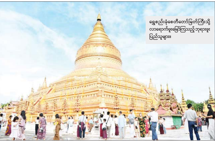
ရွှေစည်းခုံစေတီတော်မြတ်ကြီးသို့ လာရောက်ဖူးမြော်ကြသည့် ဘုရားဖူးပြည်သူများ။

ဒေသခံများကလည်း ကူညီဆောင်ရွက်ပေးလျက်ရှိကာ လုံခြုံရေးတပ်ဖွဲ့ဝင်များကလည်း မြန်မာပြည်အရပ်ရပ်မှ ခရီးသွားဘုရားဖူးများအတွက် လုံခြုံရေးတာဝန်များ ထမ်းဆောင်လျက်ရှိကြောင်း သိရသည်။ ပုဂံညောင်ဦး ရှေးဟောင်းယဉ်ကျေးမှုနယ်မြေသို့ လာရောက်သူများသည် လေကြောင်း ခရီးဖြင့်လည်းကောင်း၊ ကိုယ်ပိုင်ကားများ၊ ခရီးသွားလုပ်ငန်းကားများဖြင့်လည်းကောင်း လာရောက်ကြပြီး သင်္ကြန်ရက်များအတွင်း ဘုရားဖူးဧည့်သည် အဝင်များလျက်ရှိသဖြင့် လျှပ်စစ်စက်ဘီး၊ မြင်းလှည်း၊ တုတ်တုတ် (ခေါ်) မိန့်အိုးဝေများ၊ တိုးကားများမှာ အားလုံးလိုက်ပြီး ဝင်ငွေကောင်းနေကြကာ စားသောက်ဆိုင်များလည်း ဘုရားဖူးများခြင်းကြောင့် ရောင်းအားကောင်းနေကြကြောင်း သိရသည်။