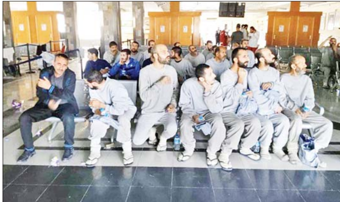
အစ္စရေးက ပြန်လွှတ်ပေးသည့် ပါလက်စတိုင်းများကို တွေ့ရစဉ်။

အစ္စရေးတပ်ဖွဲ့က ရက်ပေါင်း ၅၀ ကျော်ကြာ ဖမ်းဆီးထိန်းသိမ်းထားပြီးနောက် ၎င်းတို့၏ လူနာ တင်ယာဉ်မှ အမှုထမ်းများအနက် နှစ်ဦးကို ပြန်လွှတ်ပေးခဲ့ကြောင်း ပါလက်စတိုင်း လခြမ်းနီအသင်း