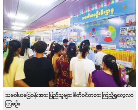
သမဝါယမပြခန်းအား ပြည်သူများ စိတ်ဝင်တစား ကြည့်ရှုလေ့လာကြစဉ်။

အများစုဖြစ်သည့် ပြည်နယ်၏ MSME များ ဖွံ့ဖြိုးရေးကို အလေးပေးကြိုးပမ်းဆောင်ရွက်လျက်ရှိသည်။ ထိုသို့ကြိုးပမ်းဆောင်ရွက်ရာတွင် နိုင်ငံတော်အဆင့် အထိမ်းအမှတ်ပြပွဲများ၊ ဈေးရောင်းပွဲတော်များအပါအဝင် နေ့ထူးနေ့မြတ်ကျင်းပပြုလုပ်သည့်ပွဲတော်များတွင် ပြည်နယ်၏ MSME လုပ်ငန်းများကို ပါဝင်ပြသခြင်း၊ ကူညီအားပေးခြင်းများ ဆောင်ရွက်လျက်ရှိသည့်အပြင် ပြည်နယ်အတွင်းမှ MSME ထုတ်ကုန်များ ထုတ်လုပ်မှု၊ ထုပ်ပိုးမှု၊ ဈေးကွက်ရရှိမှု စသည့်ကွင်းဆက်တစ်လျှောက်လုံး အချိုးညီညီ ဖွံ့ဖြိုးလာစေရန် ကြိုးပမ်းဆောင်ရွက်လျက်ရှိကြောင်း တင်ပြရေးသားလိုက်ရပါသည်။ ။