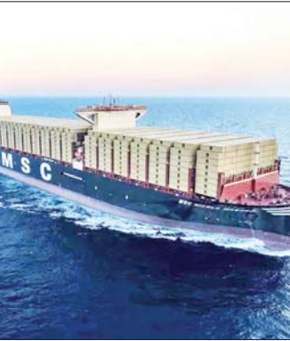
အိန္ဒိယနိုင်ငံခြားရေးဝန်ကြီး အက်စ်ဂျေရှန်ခါနှင့် ဖမ်းဆီးခံထားရသည့် ကုန်တင်သင်္ဘော။

ကိစ္စနှင့်ပတ်သက်၍ အီရန်ဘက်ကို အကူအညီတောင်းခံထားကြောင်း အိန္ဒိယအမှုထမ်းများ လွတ်ပေးရန်နှင့် ဒေသတွင်း လက်ရှိအခြေအနေနှင့်ပတ်သက်ပြီး ဆွေးနွေးခဲ့ကြောင်း ပြောကြားသည်။ ဆင်ယွာ