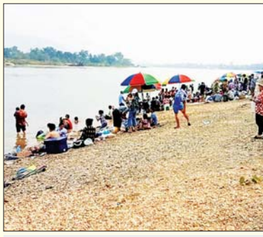
ရမ်းပြည်နယ်(အရှေ့ပိုင်း) တာချီလိတ်မြို့ရှိ ကမ်းခြေ၌ သင်္ကြန်ကာလ အပန်းဖြေသူများဖြင့် စည်ကား။ အေးအေးလတ်(ပြန်/ဆက်)