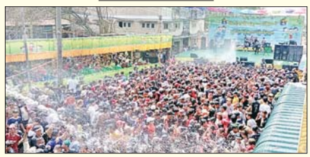
ဧရာဝတီတိုင်းဒေသကြီး လပွတ္တာမြို့နယ် သင်္ကြန်မဏ္ဍပ်များ၌ ပြည်သူများ အေးချမ်းပျော်ရွှင်စွာ ပါဝင်ဆင်နွှဲမှုကို စည်စည်ကားကား တွေ့ရစဉ်။ မုမု(ပြန်/ဆက်)