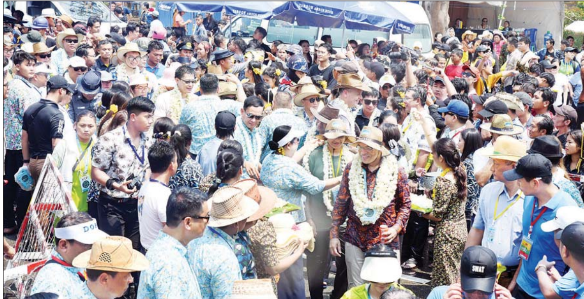
နိုင်ငံခြားသံရုံးများမှ မြန်မာနိုင်ငံဆိုင်ရာ သံအမတ်ကြီးတို့ နေပြည်တော် လမ်းလျှောက်သင်္ကြန်ပွဲ ပျော်ရွှင်စွာ ပါဝင်ဆင်နွှဲကြစဉ်။

အနီးမှ စည်ပင်ဆွတ်ပတ်သလမ်းဆုံ ရောက်ရှိကြရာ ဝန်ကြီးဌာန လာရောက် လည်ပတ်ကြသည့် ဧရိယာအထိကျင်းပသည့် နေပြည်အလိုက် ရေကစားမဏ္ဍပ်များမှ ပြည်သူများနှင့်အတူ ပျော်ရွှင်စွာ တာဝန်ရှိသူများက ကြိုဆိုကြပြီး စုပေါင်းပါဝင်ဆင်နွှဲကြသည်။