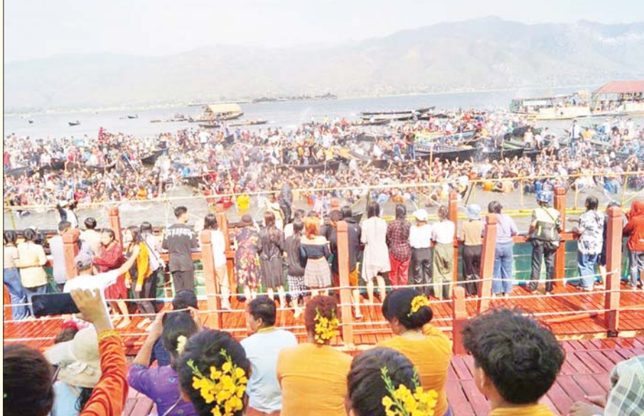
ရမ်းပြည်နယ်(တောင်ပိုင်း) ညောင်ရွှေမြို့နယ်၌ အင်းလေးရေပေါ်သင်္ကြန်ကို ပျော်ရွှင်စွာဆင်နွှဲကြသူများအား တွေ့ရစဉ်။ စိုင်းအယ်ဘဲ