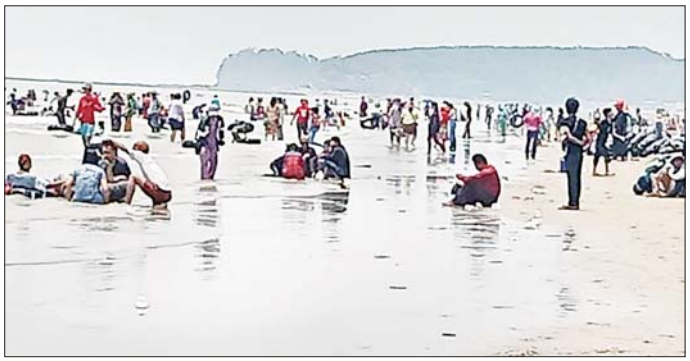
မွန်ပြည်နယ် သံဖြူဇရပ်မြို့နယ် စက်စကမ်းခြေတွင် မဟာသင်္ကြန်အကြတ်နေ့က အပန်းဖြေရေကစားသူများဖြင့် စည်ကားနေသည်ကို တွေ့ရစဉ်။ မြို့နယ်(ပြန်/ဆက်)