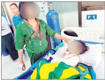
လေးနက်သော အခါသမယတွင် အကြမ်းဖက်သမားများအနေဖြင့် အရပ်ဆိုး အကျဉ်းတန်သော အကြမ်းဖက်လုပ်ရပ်ကို လုပ်ဆောင်လာခြင်းဖြစ်သည်။