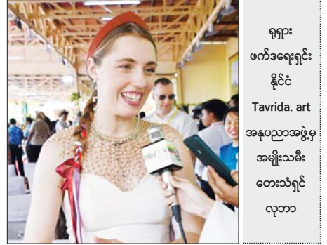
ရုရှားဖက်ဒရေးရှင်းနိုင်ငံ Tavrida.art အနုပညာအဖွဲ့မှ အမျိုးသမီးတေးသံရှင် လှဘာ