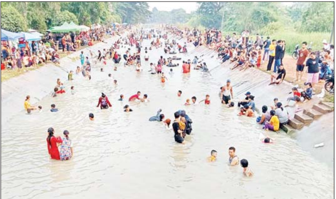
ရန်ကုန်တိုင်းဒေသကြီး လှည်းကျွန်းမြို့နယ်၌ မဟာသင်္ကြန်အကြတ်နေ့တွင် မြို့နယ်အတွင်းရှိ ရုပ်ကွက်/ကျေးရွာများရှိ ရေကစားမဏ္ဍပ်များ၌ ပြည်သူများ အေးချမ်းပျော်ရွှင်စွာ ရေကစားလျက်ရှိပြီး ကျွန်းကလေးကျေးရွာအုပ်စုရှိ ငမိုးရိပ်လက်ယာမြောင်း၌ ပြည်သူများ အေးချမ်းပျော်ရွှင်စွာ ရေကစားသူများ၊ အပန်းဖြေသူများဖြင့် စည်ကားနေသည်ကို တွေ့ရစဉ်။