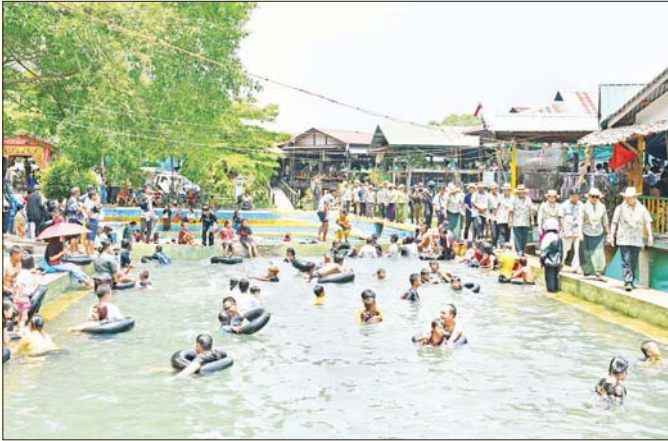
ကရင်ပြည်နယ်ဝန်ကြီးချုပ် ဦးစောမြင့်ဦးနှင့်အဖွဲ့ ဘားအံမြို့၌ ရေကစားအပန်းဖြေကြသူများကို ကြည့်ရှုအားပေးစဉ်။ စောမျိုးမင်းသိန်း(ပြန်/ဆက်)