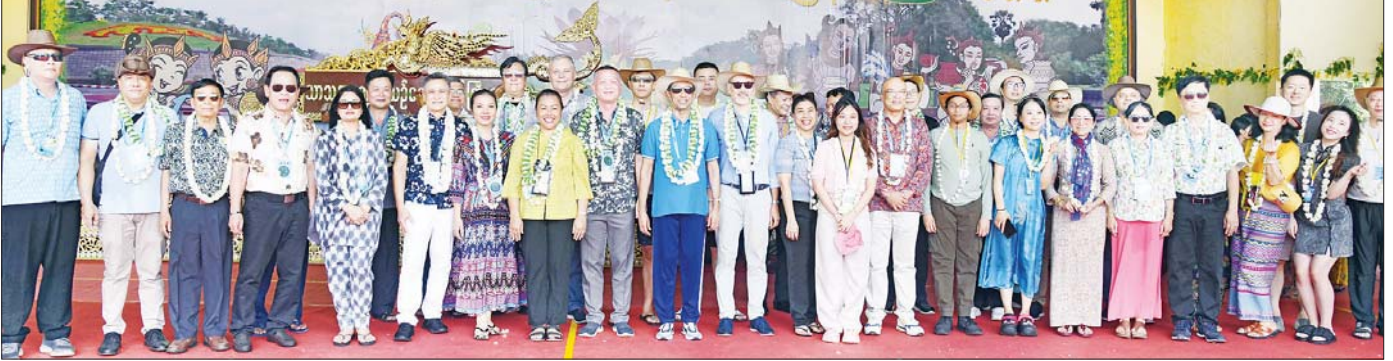
နေပြည်တော် မြို့တော်ဝန်မဟာသင်္ကြန်မဏ္ဍပ်၌ ပြည်ထောင်စုဝန်ကြီး ဦးမောင်မောင်အုန်းနှင့်အဖွဲ့ဝင်များ နိုင်ငံခြားသံရုံးများမှ မြန်မာနိုင်ငံဆိုင်ရာ သံအမတ်ကြီးတို့နှင့်အတူ စုပေါင်းမှတ်တမ်းတင် ဓာတ်ပုံရိုက်စဉ်။