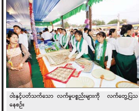
ဝါးနှင့်ပတ်သက်သော လက်မှုပစ္စည်းများကို လက်တွေ့ပြသနေစဉ်။