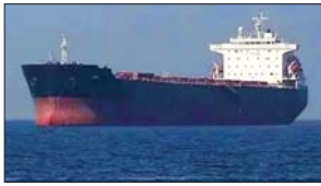
အတွင်းမှ ထွက်ခွာသွားသည့် သင်္ဘောအစင်းရေ ၆၉၀ စင်းအထိရှိပြီး ယင်းမှာ ပြီးခဲ့သည့်သီတင်းပတ် က ၂၄ စင်းသာရှိရာမှ သိသာစွာမြင့်တက် လာခြင်းဖြစ်ကြောင်း သိရသည်။ ဆင်ဟွာ

အီရန်နိုင်ငံတို့အကြား သဘောတူညီမှု ရရှိ ကြောင်း ထုတ်ပြန်ကြေညာလိုက်ပြီးနောက် ပိတ်မိနေသော သင်္ဘောအသွားအလာများ တဖြည်းဖြည်း ပြန်လည်ကောင်းမွန်လာပြီဖြစ် ကြောင်း သိရသည်။ ရေကြောင်းနှင့် သင်္ဘောလှိုင်းဆိုင်ရာ အချက်အလက်များကို စုဆောင်းတင်ပြသည့် ထိပ်တန်းသုတေသန အဖွဲ့အစည်း၏ အချက် အလက်များအရ ဇွန် ၂၀ ရက်တွင် အဆုံးသတ် သော သီတင်းတစ်ပတ်အတွင်း ပင်လယ်ဝေ့