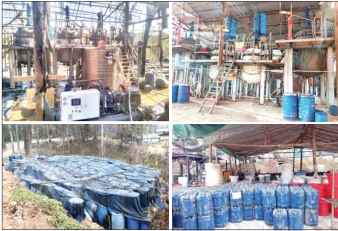
မူးယစ်ဆေးဝါးချက်လုပ်ရာတွင် အသုံးပြုသော ပစ္စည်းကိရိယာများနှင့် ဓာတုပစ္စည်းများ။

နှင့် မိုင်းရယ်မြို့နယ်ကြားရှိ မိုင်းဆေးတောင်ကြော တစ်လျှောက် တပ်မတော်နှင့် မြန်မာနိုင်ငံရဲတပ်ဖွဲ့တို့ ပူးပေါင်းပြီး သတင်းအရန်ယုံကြည်စိတ်ချရသည့် လုပ်ငန်းများကို ဆောင်ရွက်ခဲ့ရာ မူးယစ်ဆေးဝါးဆေးချက်စခန်း ၁၃ ခုကို ဖော်ထုတ်ဖမ်းဆီးကာ ဖျက်ဆီးနိုင်ခဲ့ပါသည်။ ထိုနေရာများမှ မူးယစ်ဆေးဝါးများ၊ ချက်လုပ်သည့် ပစ္စည်းကိရိယာများ၊ မူးယစ်ဆေးဝါးချက်လုပ်ရာတွင် အသုံးပြုနေသည့် ဓာတုပစ္စည်းအခြောက်အမြားကို ဖော်ထုတ်ဖမ်းဆီးနိုင်ခဲ့ပြီး ဖမ်းဆီးရမိဓာတုပစ္စည်းများကို မူးယစ်ဆေးဝါးအဖြစ် ချက်လုပ်ခဲ့ပါက မြန်မာ့ငွေကျပ် ဘီလီယံ ၈၀၀၀ ကျော်ခန့်ရှိနိုင်ပါသည်။ ထိုစခန်းအသီးသီးတွင် တွေ့ရှိရသော သက်သေအထောက်အထားများအရ မူးယစ်ဆေးဝါးချက်လုပ်မှုတွင် လက်နက်ကိုင်အဖွဲ့များ၏ ပါဝင်ပတ်သက်မှုများကို တွေ့ရှိရပါသည်။