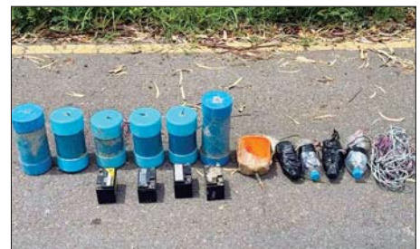
ကျော်ကျေးရွာအကြား၌ အကြမ်းဖက်သောင်းကျန်းသူများ ယုတ်မာရိုင်းစိုင်းစွာ ထောင်ထားသည့် မိုင်းများအား တပ်မတော်စစ်ကြောင်းများက ဖော်ထုတ်ရှင်းလင်းခဲ့မှုကို တွေ့ရစဉ်။