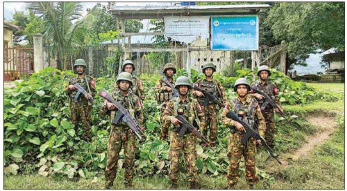
တပ်မတော်စစ်ကြောင်းများက ကလေး-ဝ-ယာကြီး-နံ့ရွာ လမ်းကြောင်းပေါ်ရှိ ကျော်ကျေးရွာမှ လုံခြုံရေးတပ်ဖွဲ့ဝင်များနှင့် ပူးပေါင်း၍ နယ်မြေလုံခြုံရေးလုပ်ငန်းများ ဆောင်ရွက်စဉ်။