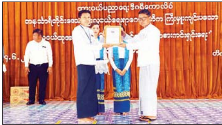
ထားဝယ်မြို့၌ လူငယ်ထုအတွင်း မူးယစ်ဆေးဝါးနှင့် လောင်းကစားကင်းရှင်းရေး လူငယ်စကားပိုင်းဆွေးနွေး

ထို့အတူ ရန်ကုန် - မော်လမြိုင်ရထားလမ်းပိုင်းတွင်ပြေးဆွဲလျက်ရှိသော အမှတ်(၈၁) အဆန်/ အမှတ်(၈၂)အစုန် လူစီးအမြန်ရထားနှင့် ယခုပြေးဆွဲမည့် အမှတ်(၈၃)အဆန်/အမှတ်(၈၄) အစုန် ခေတ်မီ DEMU လူစီးအမြန်ရထားများ၏ ရထားလက်မှတ်များကို Online Railways Ticketing and Payment System (ORTP) စနစ်ဖြင့် လက်မှတ်များဝယ်ယူနိုင်မည်ဖြစ်ပြီး ခရီးစဉ်အစအဆုံးအတွက် ခုနစ်ရက်နှင့် ကြားဘူတာများအတွက် ငါးရက်ကြိုတင်ဝယ်ယူနိုင်မည်ဖြစ်ကြောင်း သတင်းရရှိသည်။ သတင်းစဉ်