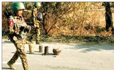
ကလေး-ဝ-ယာကြီး-နံ့ရွာ လမ်းကြောင်းပေါ်ရှိ လာပိုကျေးရွာနှင့် ကျော်ကျေးရွာအကြား၌ အကြမ်းဖက်သောင်းကျန်းသူများ ယုတ်မာရိုင်းစိုင်းစွာ ထောင်ထားသည့် မိုင်းများအား တပ်မတော်စစ်ကြောင်းများက ဖော်ထုတ်ရှင်းလင်းခဲ့မှုကို တွေ့ရစဉ်။

ကာ ယမန်နေ့ ဇွန် ၂၃ ရက်တွင် ကျော်ကျေးရွာသို့ ရောက်ရှိပြီး ကျေးရွာရှိ လခရတပ်ဖွဲ့များနှင့် ပူးပေါင်း၍ ကျေးရွာတစ်ဝိုက် လုံခြုံရေးလုပ်ငန်းများကို ဆက်လက်ဆောင်ရွက်လျက်ရှိသည်။ တပ်မတော်စစ်ကြောင်းများသည် အဆိုပါလမ်းတစ်လျှောက်၌ နယ်မြေရှင်းလင်းခြင်းများ ဆောင်ရွက်စဉ် အကြမ်းဖက်သောင်းကျန်းသူပူးပေါင်းအဖွဲ့များနှင့် ထိတွေ့တိုက်ပွဲများ ဖြစ်ပွားခဲ့ပြီး အကြမ်းဖက်သောင်းကျန်းသူ ဆက်စပ်ပစ္စည်းများနှင့် အခြေပြုစခန်းနေရာများအား သိမ်းပိုက်ရရှိခဲ့ပြီး အကြမ်းဖက်သောင်းကျန်းသူပူးပေါင်းအဖွဲ့များသည် ထိခိုက်သေဆုံးမှုများစွာဖြင့် ဖရိုဖရဲလတ်ခဲ့ထွက်ပြေးသွားကြောင်း သိရသည်။ ထို့ပြင် တပ်မတော်