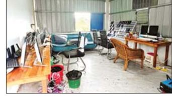
အွန်လိုင်းလိမ်လည်လောင်းကစားမှု ကျူးလွန်ရာတွင် အသုံးပြုသည့် လုပ်ငန်းလုပ်ကိုင်သည့် အခန်းနှင့် လုပ်ငန်းသုံးပစ္စည်းများအား တွေ့ရစဉ်။