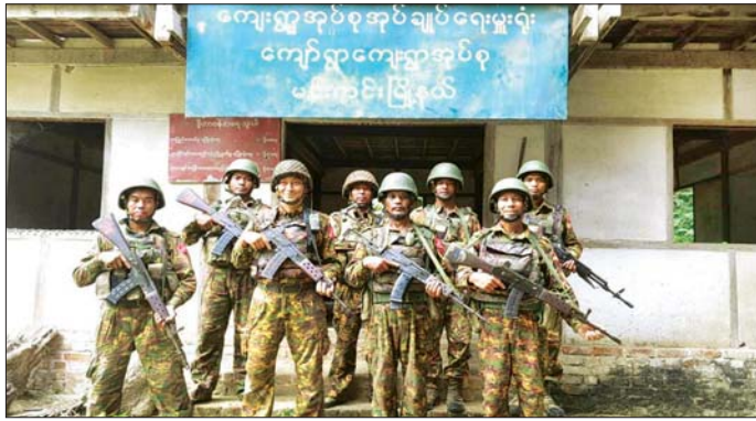
တပ်မတော်စစ်ကြောင်းများက ကလေး-ဝ-ယာကြီး-နံ့ရွာ လမ်းကြောင်းပေါ်ရှိ ကျော်ကျေးရွာ ကျေးရွာအုပ်ချုပ်ရေးမှူးရုံးနှင့် ပတ်ဝန်းကျင်တစ်ဝိုက်အား လုံခြုံရေးလုပ်ငန်းများ ဆောင်ရွက်စဉ်။