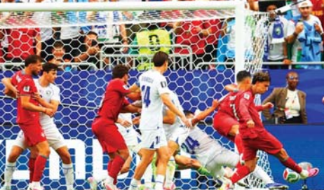
ဥရောက်ကစားတန်အသင်းဘက်သို့ ပေါ်တူဂီအသင်း တိုက်စစ်ကစားသမား စီရော်နယ်ဒို ဂိုးသွင်းယူရန် ကြိုးပမ်းစဉ်။

ဖီဖာကမ္ဘာ့ဖလားပြိုင်ပွဲ အုပ်စုပွဲစဉ်(၂)မှ ဇွန် ၂၄ ရက် နံနက် ၂ နာရီခွဲက တော့စတန်တွင် ယှဉ်ပြိုင်ကစားခဲ့သည့် နာမည်ကြီး အင်္ဂလန်နှင့် ဂါနာအသင်းပွဲစဉ်တွင် ဂါနာအသင်းက အင်္ဂလန်အသင်းကို ပွဲချိန်တစ်လျှောက် ခြေစွမ်းအားဖြင့် တစ်ဖက်သတ် ဖိအားပေးကစားနိုင်ခဲ့သော်လည်း အသင်းကစားသမားများ၏ အဆုံးသတ်ပိုင်း လိုအပ်ချက်ရှိမှုနှင့်အတူ ပြိုင်ဘက်အသင်း ခံစစ်နှင့် ဂိုးသမားတို့အကောင်းဆုံး ဟန်တားကာကွယ်နိုင်ခဲ့သည့်အတွက် သရေလဒ်ထွက်ပေါ်ခဲ့ခြင်းဖြစ်သည်။ စာမျက်နှာ ၁၃ ကော်လံ ၁ ❖