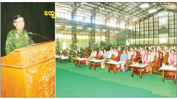
ဒုတိယတပ်မတော်ကာကွယ်ရေးဦးစီးချုပ် ကာကွယ်ရေးဦးစီးချုပ်(ကြည်း) ဗိုလ်ချုပ်ကြီး ကျော်စွာလင်း မြတ်တပ်နယ်ရှိ အရာရှိ၊ စစ်သည်၊ မိသားစုဝင်များအား တွေ့ဆုံအမှာစကားပြောကြားစဉ်။

နေပြည်တော် ဇွန် ၂၄ ဒုတိယတပ်မတော်ကာကွယ်ရေးဦးစီးချုပ် ကာကွယ်ရေးဦးစီးချုပ်(ကြည်း) ဗိုလ်ချုပ်ကြီး ကျော်စွာလင်းသည် ဇွန် ၂၄ ရက်နေ့တွင် ကာကွယ်ရေးဦးစီးချုပ်ရုံးမှ အဆင့်မြင့်တပ်မတော်အရာရှိကြီးများနှင့် စနီးများ၊ ကမ်းရိုးတန်းဒေသတိုင်းစစ်ဌာနချုပ် တိုင်းမှူး၊ ဗိုလ်ချုပ် ကျော်ကျော်ဟန်နှင့် တာဝန်ရှိသူများလိုက်ပါ၍ ယနေ့နံနက်ပိုင်းတွင် မြတ်တပ်နယ်နှင့် ကျွန်းစုမြို့ရှိ နယ်မြေခံတပ်မှ အရာရှိ၊ စစ်သည်၊ မိသားစုဝင်များအား သီးခြားစီသွားရောက်တွေ့ဆုံ၍ အမှာစကားပြောကြားသည်။